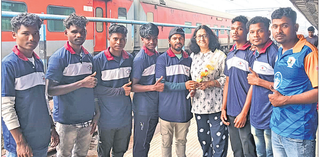
ଜାତୀୟ ଆଂଶିକ ଦୃଷ୍ଟିବାଧିତ ପୁଟବଲ ଚୁନାବଳ ପାଇଁ ଗାଳିୟର ଯାତ୍ରା ପୂର୍ବରୁ ଓଡ଼ିଶା ଦଳ।

ଭୁବନେଶ୍ୱର, ୨୨ମାର୍ଚ୍ଚ (ତପନ ସାହୁ) ଓଡ଼ିଶା ସମେତ ମଧ୍ୟପ୍ରଦେଶ, ଦିଲ୍ଲୀ, ଉତ୍ତରାଖଣ୍ଡ, କେରଳ, ସର୍ଗିପଦଙ୍ଗ, ହରିୟାଣା ଓ ତାମିଲନାଡୁ ଆଦି ଭାରତର ୮ଟି ରାଜ୍ୟ ଦଳ ଭାଗ ନେବେ।