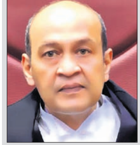
ଜଷ୍ଟିସ୍ ଯଶଓତ୍ତ ବର୍ମା