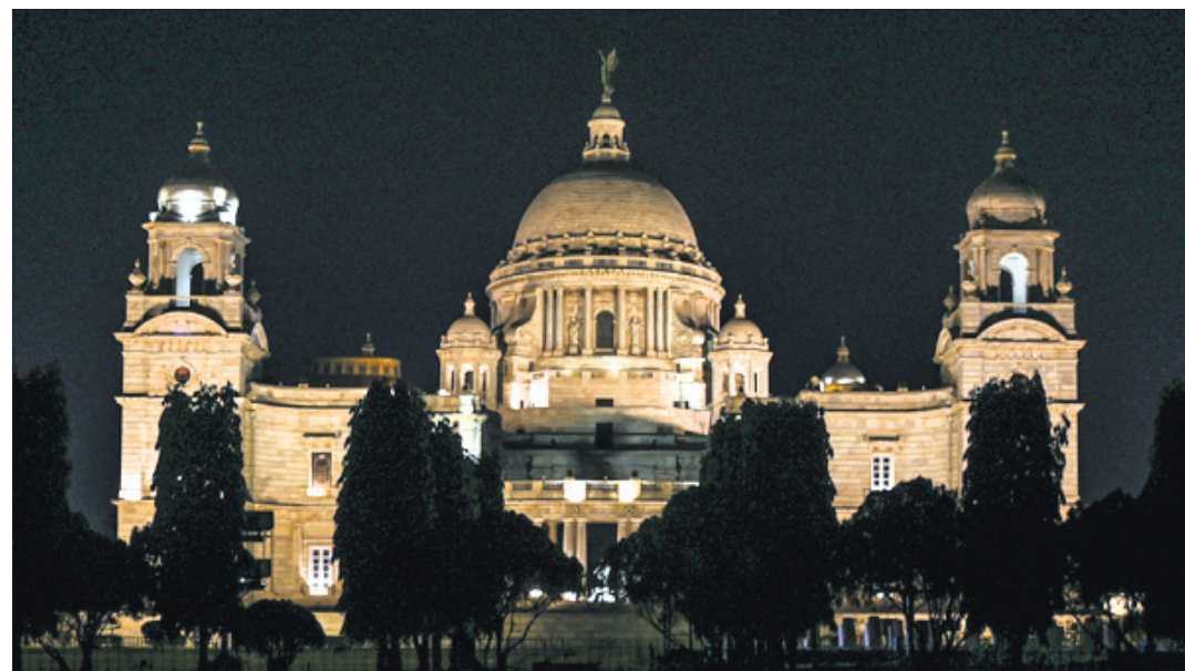
ଆର୍ଥ ଆଘାତ ପାଳନ ବେଳେ ଦିଲ୍ଲୀ ବିଦ୍ୟୁତ୍ ଆଲୋକରେ ଭିକ୍ଟୋରିଆ ମେମୋରିଆଲର ଦୃଶ୍ୟ।