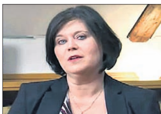
ଆଇସିଆଇଏମ୍ ମନ୍ତ୍ରୀ ଥୋର୍ଣ୍ଟୋର ଚେକ୍‌କାଉଁସ୍, ୨୨୩

ଗୁପ୍ତ ସଙ୍ଗୀତ ଥିବା ପ୍ରଘଟ କରୁ ଆଇସିଆଇଏମ୍ ମନ୍ତ୍ରୀଙ୍କ ଇସ୍ତଫା