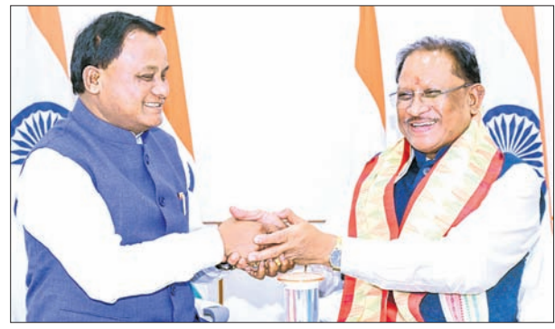
ଲୋକସେବା ଭବନରେ ଶନିବାର ଛତିଶଗଡ଼ ମୁଖ୍ୟମନ୍ତ୍ରୀ ବିଷ୍ଣୁଦେଓ ସାଲଙ୍କ ସହ ହାତ ମିଳାଇଛନ୍ତି ମୁଖ୍ୟମନ୍ତ୍ରୀ ମୋହନ ଚରଣ ମାଝୀ ।