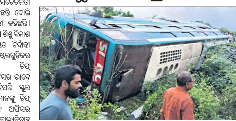
ବାଲୁଆ, ୨୨।୩। (ସଂଗ୍ରାମ ପାଠକରାୟ)

୧୬ ନମ୍ବର ଜାତୀୟ ରାଜପଥର ବାଲୁଆ ବାଲପାସ୍ ରାସ୍ତା ବ୍ରାହ୍ମଣକୁଳ ଛକଠାରେ ବାଲୁଆ ଓଲଟି ପଡ଼ିଥିଲା । ଖବରପାଇ ବାଲୁଆ ଥାନାର କାର୍ଯ୍ୟରେ ହାଲଡ଼େ ପାଟ୍ରୋଲିଂ ଗାଡ଼ି ଏବଂ ଅଗ୍ନିଶମ ବାହିନୀ ଯତ୍ନଶୀଳରେ ପହଞ୍ଚି ଦୁର୍ଘଟଣାଗ୍ରସ୍ତ ବସକୁ ଓଲଟିପଡ଼ିଛି । ଫଳରେ ବସରେ ଥିବା ୨୦ରୁ ଊର୍ଦ୍ଧ୍ୱ ଯାତ୍ରୀ ଆହତ ହୋଇଛନ୍ତି । ଚିକିତ୍ସା ପାଇଁ ସେମାନଙ୍କୁ ବାଲୁଆ ହୋଇଥିବା ବେଳେ ପ୍ରାଥମିକ ଚିକିତ୍ସା ପରେ ଅନ୍ୟ ଏକ ବସରେ ସମସ୍ତଙ୍କୁ ବ୍ରହ୍ମପୁର ପଠାଇ ଦିଆଯାଇଛି । ଦୁର୍ଘଟଣା ପରେ ପ୍ରାୟ ୨୫ଜଣ ଯାତ୍ରୀଙ୍କୁ ନେଇ ବ୍ରହ୍ମପୁର ଅଭିମୁଖେ ଯାଉଥିଲା । ଅପରାହ୍ନ ୪ଟାରେ ବାଲୁଆ ବାଲପାସ୍ ରାସ୍ତା