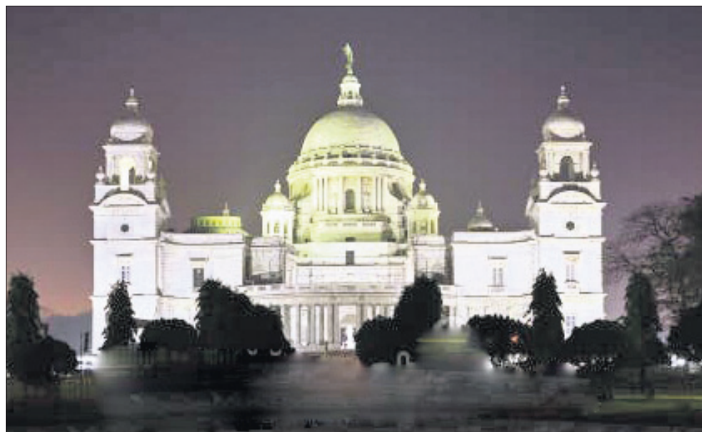
କୋଲକାତାସ୍ଥିତ ଐତିହାସିକ ଭିକ୍ଟୋରିଆ ମେମୋରିଆଲର ଶନିବାର ସନ୍ଧ୍ୟା ସମୟର ଦୃଶ୍ୟ।

ଆର୍ଥ ଆଘାତ ବେଳେ ଶନିବାର ରାତିରେ ଅଣଅତ୍ୟାବଶ୍ୟକ ବିଦ୍ୟୁତିକ ଉପକରଣକୁ ସ୍ତବ୍ଧ ଅଫ୍ କରି ଦିଲ୍ଲୀ ୨୭୯ ମେଗାଓୟର ବିଦ୍ୟୁତ୍ ବଞ୍ଚାଇଛି। ବିଶ୍ୱର ଅନ୍ୟାନ୍ୟ ସହର ସହ ଦିଲ୍ଲୀ ଆର୍ଥ ଆଘାତ ପାଳନ କରିଥିଲା। ରାତି ୮ଟା ୩୦ରୁ ୯ଟା ୩୦ ପର୍ଯ୍ୟନ୍ତ ଇଣ୍ଡିଆ ଗେଟ୍ ସମେତ ଦିଲ୍ଲୀର ବିଭିନ୍ନ ଅଞ୍ଚଳରେ ଆଲୋକ ଲିଭିଯାଇଥିଲା। ବିଏସ୍‌ଇଏସ୍ ଡିଭିଜନ୍ ୧୫୯ ମେଗାଓୟର ବିଦ୍ୟୁତ୍ ସଞ୍ଚୟ କରିଥିବାବେଳେ ଟାଟା ପାୱାର-ଡିଜିଟାଲ୍ ୭୪ ମେଗାଓୟର ସଞ୍ଚୟ କରିଛି। ଗତବର୍ଷ ଆର୍ଥ ଆଘାତରେ ଦିଲ୍ଲୀ ୨୦୬ ମେଗାଓୟର ବିଦ୍ୟୁତ୍ ସଞ୍ଚୟ କରିଥିଲା।