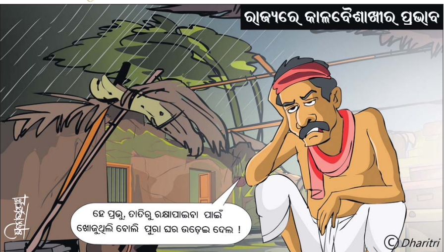
ରାଜ୍ୟରେ କାଳବୈଶାଖୀର ପ୍ରଭାବ

ହେ ପ୍ରଭୁ, ତାରିବୁ ରକ୍ଷାପାଇବା ପାଇଁ ଖୋଜୁଥିଲି ବୋଲି ପୁରା ଘର ଉଡ଼େଇ ଦେଲ !