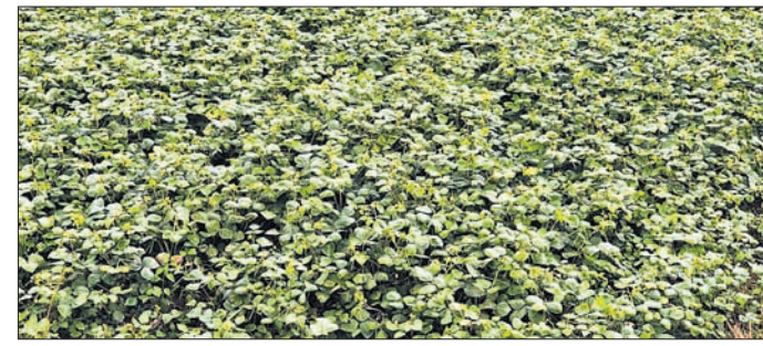
ଅପ୍ରଭୁ ଅଞ୍ଚଳରେ କ୍ଷତିଗ୍ରସ୍ତ ପୁର ଚାଷ ।

ଅପ୍ରଭୁ ଚଳାଣୀ/ପୁରୀ, ୨୨୩୩ (ପ୍ରତାପ କୁମାର ଦାଶିତ/ ବିକ୍ରିତ କୁମାର ତ୍ରିପାଠୀ/ ଅଜିତ କୁମାର ମହାନ୍ତି)