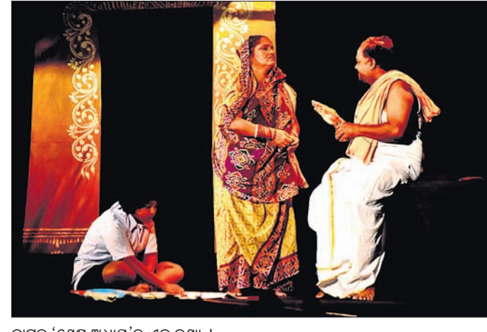
ନାଟକ 'ଶେଷ ଅଧ୍ୟାୟ'ର ଏକ ଦୃଶ୍ୟ ।

ଅତିଥିଭାବେ ଯୋଗ ଦେଇଥିଲେ। ସଭାକାର୍ଯ୍ୟରେ ନାଟ୍ୟକାର, ନିର୍ଦ୍ଦେଶକ ମଧୁସୂଦନ ପୂଜାପଣ୍ଡା ସ୍ମରଣ ଭାଷଣ ପ୍ରଦାନ କରିଥିବାବେଳେ ଅନୁଷ୍ଠାନର କଳାକାର ବିକାଶ ଦତ୍ତ ଧନ୍ୟବାଦ ଦେଇଥିଲେ। ଉତ୍ତର ତୃତୀୟ ସମ୍ପାଦନା ଯାକପୁର କଳାକାରଙ୍କ ଦ୍ୱାରା ମଞ୍ଚସ୍ଥ ହୋଇଥିଲା ନାଟକ 'ଶେଷ ଅଧ୍ୟାୟ'। ଗୁରୁ-ଶିଷ୍ୟର ସମ୍ପର୍କ