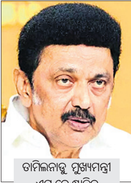
ତାମିଲନାଡୁ ମୁଖ୍ୟମନ୍ତ୍ରୀ ଏମ୍.କେ.ଷ୍ଟାଲିନ୍

କେନ୍ଦ୍ର ସରକାରଙ୍କ ଡିଲିମିଟେଶନ (ନିର୍ବାଚନମଣ୍ଡଳୀ ସୀମା ପୁନଃ ନିର୍ଦ୍ଧାରଣ) ପଦକ୍ଷେପ ବିରୋଧ କରି ତାମିଲନାଡୁ ମୁଖ୍ୟମନ୍ତ୍ରୀ ଏମ୍.କେ. ଷ୍ଟାଲିନଙ୍କ ଦ୍ୱାରା ଆହୂତ ଡିଏମ୍.କେ ନେତୃତ୍ୱାଧୀନ ମୁକ୍ତ କ୍ରିୟାମୁଖ୍ୟାନ କମିଟି (ଜେଏସି) ବୈଠକ ଶନିବାର ଚେନ୍ନାଇରେ ଅନୁଷ୍ଠିତ ହୋଇଯାଇଛି । ବୈଠକରେ ଉପମୁକ୍ତ ଡିଲିମିଟେଶନକୁ ପୁନଃଚିନ୍ତା କରିବା ଉପରେ କମିଟି ଗୋଟିଏ ଦେଇଛି । ୧୯୭୧ ଜନସଂଖ୍ୟା ଆଧାରରେ କରାଯାଇଥିବା ନିର୍ବାଚନମଣ୍ଡଳୀ ସୀମା ପୁନଃ ନିର୍ଦ୍ଧାରଣକୁ ଆଉ ୨୫ ବର୍ଷ ପୁଞ୍ଜାଳିବା ନିମନ୍ତେ କମିଟି କେନ୍ଦ୍ରକୁ ନିବେଦନ କରିଛି । ଏମ୍.ପି.ମାନଙ୍କ ଏକ ମିଳିତ ପ୍ରତିନିଧି ଦଳ ପାର୍ଲିମେଣ୍ଟ ଅଧିବେଶନ କାଳରେ ପ୍ରଧାନମନ୍ତ୍ରୀ ନରେନ୍ଦ୍ର ମୋଦିଙ୍କୁ ଭେଟି ଏଥିପାଇଁ ଦାବି କରିବାକୁ ନିଷ୍ପତ୍ତି ହୋଇଛି । ପଶ୍ଚିମବଙ୍ଗର ଶାସକ ଦଳ ବୃତ୍ତମୁକ୍ତ କଂଗ୍ରେସ (ଡିଏମ୍.ସି) ଉକ୍ତ ବୈଠକରେ ଯୋଗଦେଇ ନାହିଁ । ଜେଏସି ବୈଠକରେ ଗୁହାଟ ହୋଇଥିବା ସଂକଳ୍ପ ଅନୁଯାୟୀ, ଗଣତାନ୍ତ୍ରିକ ମୁକ୍ତାବେଧରେ