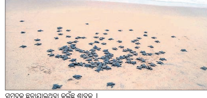
ସମୁଦ୍ରରେ ଛଡ଼ାଯାଇଥିବା କଇଁଛ ଶାବକ ।