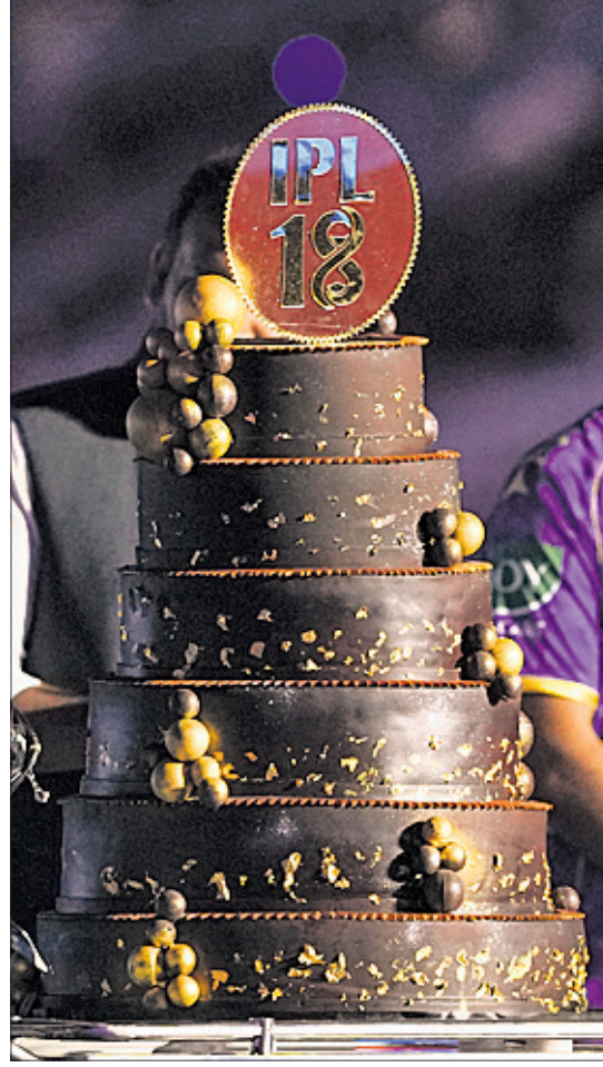
ବିରାଟ କୋହଲିଙ୍କୁ ସମ୍ମାନିତ କରୁଛନ୍ତି ବିସିସିଆଇ ସଭାପତି ରୋଜର ବିନି। ଉଦ୍‌ଘାଟନୀ ସମାରୋହରେ ଆଇପିଏଲ୍ କେକ୍।