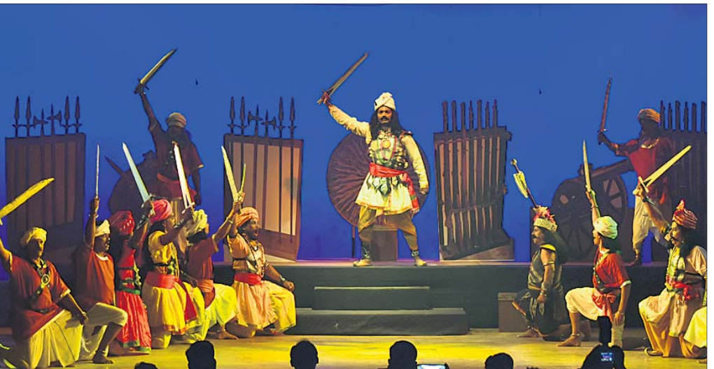
ଭୁବନେଶ୍ୱର ରବୀନ୍ଦ୍ର ମଣ୍ଡପରେ ଶନିବାର ଜାତୀୟ କଳିଙ୍ଗ ନାଟ୍ୟ ମହୋତ୍ସବର ଉଦ୍‌ଘାଟନା ସମ୍ବନ୍ଧରେ ପରିବେଷିତ ନାଟକ ‘ମହାସଂଗ୍ରାମର ମହାନାୟକ’ର ଏକ ଦୃଶ୍ୟ।

କୋର୍ଟରେ ହାଇକୋର୍ଟର ରାୟର ପ୍ରତିଲିପି ଆବେଦନକାରୀ ବିଭାଗୀୟ କର୍ତ୍ତୃପକ୍ଷଙ୍କ ନିକଟରେ ଦାଖଲ କରିଛନ୍ତି। ସଂଯୋଗକ୍ରମେ ଏହି ମାମଲାର ରାୟ ପ୍ରକାଶ ପାଇବା ପରେ ଓଡ଼ିଶା ସରକାର ତାଙ୍କ କ୍ୟାବିନେଟ ବୈଠକରେ ଅନୁକମ୍ପାମୂଳକ ନିୟୁକ୍ତି ସଂକ୍ରାନ୍ତରେ ଗୁରୁତ୍ୱପୂର୍ଣ୍ଣ ନିଷ୍ପତ୍ତି ନେଇଛନ୍ତି। ଓଡ଼ିଶା ସରକାର ନେଇଥିବା ନିଷ୍ପତ୍ତିରେ ଦର୍ଶାଇଛନ୍ତି ଯେ, ୨୦୨୦ର ସଂଶୋଧିତ ଅନୁକମ୍ପାମୂଳକ ନିୟୁକ୍ତି ଆଦିତ୍ୟ ପୂର୍ବରୁ ଯେତେବେଳେ ଅନୁକମ୍ପାମୂଳକ ନିୟୁକ୍ତି ଆବେଦନ ରହିଛି, ସେବେଳୁ ୧୯୯୦ର ମୂଳ ଓଡ଼ିଶା ହାଇକୋର୍ଟ ମନ୍ତାବଳୀର ଯେଠା, ବିଦ୍ୟୁତ୍‌ସାଗର ସାମନ୍ତରାୟ, ବିଶ୍ୱଜିତ ସ୍ୱାଇଁ, ଅନିଲ ପାଢ଼ୀ ଆଦି ମାମଲାକୁ ନିକଟ ଭାବେ ଦର୍ଶାଇଛନ୍ତି। ଆବେଦନକାରୀଙ୍କ ପକ୍ଷରୁ ପ୍ରସ୍ତୁତ କୁମାର ସିଂହ ସଂକ୍ରାନ୍ତରେ ବାରମ୍ବାର କର୍ତ୍ତୃପକ୍ଷ ମାମଲା ପରିଚାଳନା କରୁଥିଲେ।