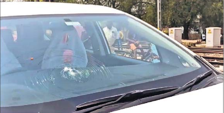
ଦେଲାମାଡ଼ରେ ରାଜସ୍ୱ ମନ୍ତ୍ରୀଙ୍କ ଏସ୍କର୍ଟ ଗାଡ଼ି କାଚ ଭାଙ୍ଗିଯାଇଛି।

କନ୍ଦୁଷ୍ଟେବଳ ଆହତ ସବୁ ଘର ନ ବୁଲିବାରୁ କ୍ଷତିଗ୍ରସ୍ତଙ୍କ ବିକ୍ଷୋଭ