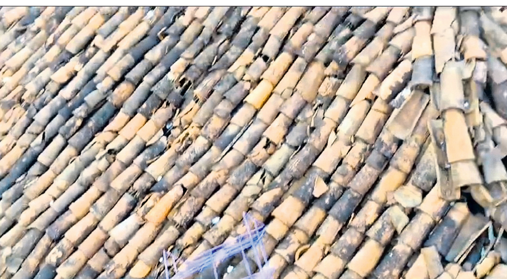
କୁଆପଥର ମାଡ଼ରେ ଜଣକ ଘରର ଖପର ଭାଙ୍ଗିଯାଇଛି ।

କାଳବୈଶାଖୀ ନୂଆପଡ଼ା, ୨୩୩୩ (ମକାରୁ ବେମାଲ) ନୂଆପଡ଼ା ଜିଲ୍ଲାରେ ଶନିବାର କାଳବୈଶାଖୀ ପ୍ରଭାତରେ ଝିପି ଝିପି ବର୍ଷା ସହ କୁଆପଥର ମାଡ଼ ହୋଇଛି । ଏଥିରେ ବହୁ ଖପର ଓ ଆକସେଷ୍ଟ ଘର ଭାଙ୍ଗିବା ସହ ବ୍ୟାପକ ଫସଲ ନଷ୍ଟ ହୋଇଛି । ସୁନାବେତା ଅଭୟାରଣ୍ୟ ଅଞ୍ଚଳରେ ବହୁ ମାତ୍ରାରେ କୁଆପଥର ମାଡ଼ ହୋଇଛି । ବହୁ ଲୋକଙ୍କ ଘରର ଆକସେଷ୍ଟ ଓ ଖପର ଭାଙ୍ଗିଯାଇଛି । ସେହିପରି ସୋଲାର ପ୍ଲଟ୍, ପ୍ଲାଷ୍ଟିକ ପାଇପ୍ ଭାଙ୍ଗିଯାଇଥିବା ବେଳେ କେତେକ ଗ୍ରାମରେ ଗଛ ଭାଙ୍ଗି ପଡିଛି । କୁଆପଥର ମାଡ଼ରେ ଆୟ କଷ୍ଟ, ଚାହାର, କୈଣ୍ଡ ଓ ମହୁଳା ଫଳି ଝଟି ନଷ୍ଟ ହୋଇଯାଇଛି । ଫଳରେ ଏହି ଲଘୁ ବନଜାତ ସଂଗ୍ରହକରି ପରିବାର ପ୍ରତିପୋଷଣ କରୁଥିବା ପରିବାର ତିନାରେ ପଡି ଯାଇଛନ୍ତି ।