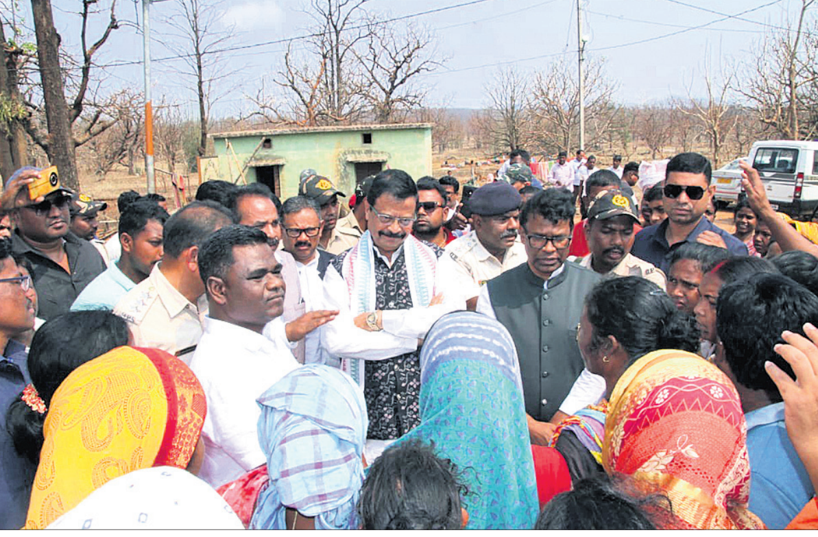
ମୟୂରଭଞ୍ଜ ବିଷୟାୟା କୁଳରେ ରବିବାର ରାଜସ୍ୱ ମନ୍ତ୍ରୀ ସୁରେଶ ପୂଜାରୀ ଓ ପରିବେଶ ମନ୍ତ୍ରୀ ଗଣେଶରାମ ସିଂହଙ୍କୁ ଆକାଶବିଶାଖା କ୍ଷତିଗ୍ରସ୍ତଙ୍କ ସହ ଆଲୋଚନା କରୁଛନ୍ତି ।