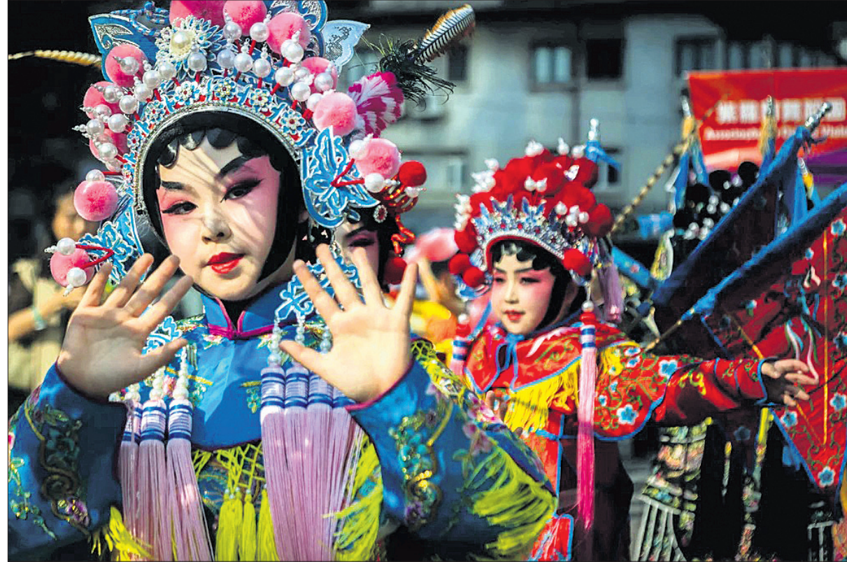
ଗାଇନାର ମକାଉ ଇଣ୍ଡରନିଆଗନାଲ ପରେଦ୍ୱରେ ଭାଗନେଇଥିବା କଳାକାରମାନେ ।