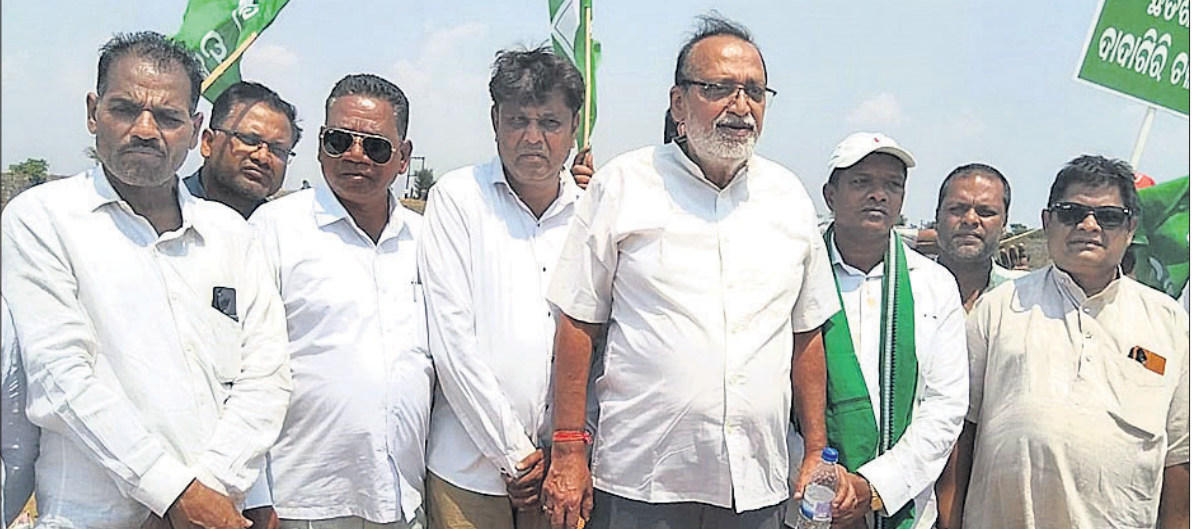
କୋରାପୁଟ ଜିଲ୍ଲା ବିଜେଡି ନେତାମାନେ ଯଉଁରା ନଦୀ ମୁହାଣରେ ପ୍ରତିବାଦ କରୁଛନ୍ତି।

କୋରାପୁଟ, ୨୩ମାର୍ଚ୍ଚ (କେ.ରାଜଶେଖର ରାଓ) କୋରାପୁଟ ଜିଲ୍ଲା କୋରାପୁଟ ଚାରିଲି ପଞ୍ଚାୟତ ଇସ୍ତଫାତା ଶାଖା ନଦୀ ଯଉଁରା ମୁହାଣରେ ଛତିଶଗଡ଼ ସରକାର ବାଲି ବସ୍ତା ପକାଇ ଜଳ ନେବାରୁ ରବିବାର ଜିଲ୍ଲା ବିଜେଡି ନେତାମାନେ ଏକତ୍ର ହୋଇ ଏହାର ପ୍ରତିବାଦ କରିଛନ୍ତି। ଭାଙ୍ଗପା ବିରୋଧରେ ରଣଭୁଜାର ଦେଇ ରାଜ୍ୟ ସରକାର ପାଣି ବିକ୍ରି କରୁଥିବା ଅଭିଯୋଗ କରିଛନ୍ତି। ଏହି ଅଞ୍ଚଳରେ ଚଳିତ ଖରିଫ ଋତୁ ସମ୍ପୂର୍ଣ୍ଣ