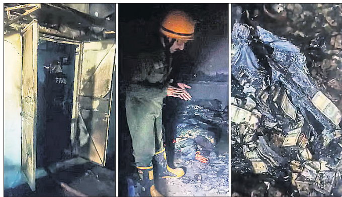
ସୁପ୍ରିମକୋର୍ଟ ଡ୍ରେସ୍‌ଆଇଲ୍‌ରେ ଯଶଓଜ୍ଜ୍ ବର୍ମାଙ୍କ ଷ୍ଟୋର ରୁମ୍‌ରେ ପୋଡ଼ା ଟଙ୍କାର ଭିଡ଼ିଓ।

ଦିଲ୍ଲୀ ହାଇକୋର୍ଟ ବିଚାରପତି ଯଶଓଜ୍ଜ୍ ବର୍ମାଙ୍କ ଘରେ ଅଗ୍ନିକାଣ୍ଡ ବେଳେ ବିପୁଳ ଆୟ ବହିଷ୍କୃତ ଟଙ୍କା ମିଳିବା ଅଭିଯୋଗ ଉପରେ ଦିଲ୍ଲୀ ହାଇକୋର୍ଟଙ୍କ ତଦନ୍ତ ରିପୋର୍ଟ ଓ ଭିଡ଼ିଓକୁ ସୁପ୍ରିମକୋର୍ଟ ଡ୍ରେସ୍‌ଆଇଲ୍‌ରେ ସର୍ବସାଧାରଣ ନିମନ୍ତେ ପ୍ରକାଶ କରାଯାଇଛି। ଷ୍ଟୋରରୁମ୍ ଭାବେ ବ୍ୟବହୃତ ହେଉଥିବା ବିଚାରପତି ବର୍ମାଙ୍କ ଏକ ଆଡ଼ହାଉସ୍‌ରୁ ୪୦୦ ୫ ବସ୍ତା ପୋଡ଼ା ନୋର୍ ମିଳିଥିବା ରିପୋର୍ଟରେ କୁହାଯାଇଛି। ବିଚାରପତିଙ୍କ ଘରୁ ଏତେ ପରିମାଣର ଟଙ୍କା ଉତ୍ତର ନେଇ ଗମ୍ଭୀର ଚିନ୍ତାବ୍ୟକ୍ତ କରାଯାଇଛି। ଏଥିସହିତ ବିଚାରପତିଙ୍କ ଘର ପରିସର ନିକଟରେ କେତେକ ପୋଡ଼ା ୫୦୦ ଟଙ୍କା ନୋର୍ ମିଳିଥିବା ଅନୁଲୀକନରେ ପ୍ରସାରିତ ଭିଡ଼ିଓକୁ ଦେଖିବାକୁ ମିଳିଛି। ଘର ନିକଟରେ ସଫା