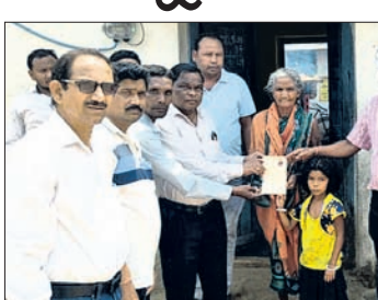
ଅଭିଭାବକଙ୍କୁ ନିମନ୍ତ୍ରଣ ପତ୍ର ପ୍ରଦାନ କରାଯାଇଛି ।