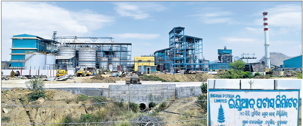
ଡକ୍ଟରାଟରେ ଅବସ୍ଥାପିତ ଆଇପିଏଲ୍ କମ୍ପାନୀ ।