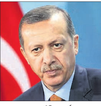
ରେସେପ୍ ଟେୟିପ୍ ଏଡ଼ୋଗାନ୍

ରୁଷିଆ ରାଷ୍ଟ୍ରପତି ଭୂତମିର ପୁଟିନ୍ ନିଜ ଏକଲତ୍ରବାଦୀ ଶାସନ ଆଗରେ ପ୍ରତିବନ୍ଧକ ସାଜୁଥିବା ରାଜନୈତିକ ପ୍ରତିସ୍ପନ୍ଧୀମାନଙ୍କୁ ରାଷ୍ଟ୍ରରୁ ହଟାଇଦେଇଥାନ୍ତି। ପୁଟିନ୍‌ଙ୍କ ଘୋର ସମାଲୋଚକ ଭାବେ ପରିଚିତ ବିରୋଧୀ ନେତା ଆଲେକ୍ସି ନଭାଲନିଙ୍କୁ ଦୀର୍ଘ ସମୟ ଧରି ଜେଲରେ ବନ୍ଦୀ ରଖାଯିବା, ୨୦୨୦ରେ ତାଙ୍କ ଖାଦ୍ୟରେ ବିଷ ଦିଆଯିବା ଏବଂ ୨୦୨୪ ଫେବୃଆରୀ ୧୨ରେ କାରାଗାର ଭିତରେ ହିଁ ତାଙ୍କ ସନ୍ଦେହଜନକ ମୃତ୍ୟୁ ଘଟିବା ଅନେକ ପ୍ରଶ୍ନ ଛିଡ଼ା କରାଇଥିଲା, ଯାହାର ଉତ୍ତର ଏ ଯାଏ ରୁଷିଆ କର୍ତ୍ତୃପକ୍ଷ ଦେଇନାହାନ୍ତି। ବର୍ତ୍ତମାନ ଦୁର୍ଗତିରେ ମଧ୍ୟ ଅନୁରୂପ ଘଟଣା ଦେଖିବାକୁ ମିଳିଲାଣି। ୨୦୨୨ ରାଷ୍ଟ୍ରପତି ନିର୍ବାଚନରେ ପ୍ରାର୍ଥୀ ହେବାକୁ ଥିବା ବିରୋଧୀ ନିପଦ୍ବିକାନ୍ ପିପୁଲ୍ସ ପାର୍ଟି (ସିଏସ୍‌ପି)ର ପ୍ରମୁଖ ନେତା ଏକ୍ସେମ୍ ଇମାମୋଗ୍ଲୁଙ୍କୁ ଦକ୍ଷିଣ ନାମାଙ୍କନର ଠିକ୍ ପୂର୍ବରୁ ଦୁର୍ଗତି ଓ ଆତଙ୍କବାଦ ଅଭିଯୋଗରେ ଗିରଫ କରାଯାଇଛି। ଏହାର ପ୍ରତିବାଦରେ ଦେଶବ୍ୟାପୀ ଆନ୍ଦୋଳନ ମୁଣ୍ଡ ଟେକିଛି। ଇସ୍ରାଏଲରୁ ମେୟର ଇମାମୋଗ୍ଲୁଙ୍କୁ ରାଜନୈତିକ କ୍ୟାରିୟରକୁ ଶେଷ କରିଦେବା ପାଇଁ ରାଷ୍ଟ୍ରପତି ରେସେପ୍ ଟେୟିପ୍ ଏଡ଼ୋଗାନ୍‌ଙ୍କ ସରକାର ପୁଟିନ୍‌ଙ୍କ ପଦାଙ୍କ ଅନୁସରଣ କରୁଥିବା ସମାଲୋଚକ କହିବା ଆରମ୍ଭ କଲେଣି।