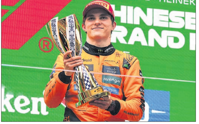
ଶାଂଘାଇ, ୨୩ମା (ଏପି)

ମ୍ୟାକଲରେନ ଡ୍ରାଇଭର ଓଷାର ପିଆଷ୍ଟି ଚାଇନିଜ୍ ପ୍ରଥମ ଚାଇନିଜ୍ ପୁର୍ସୁଆ ଓ ଗ୍ରାଁ ପ୍ରି ମୋଟର ରେସ୍ ଜିତିଛନ୍ତି । ରବିବାର ଅନୁଷ୍ଠିତ ଏହି ରେସ୍ରେ ତାଙ୍କ ଟିମ୍ମେଟ୍ ତଥା ସିଜନ ଆରସ୍ ଅଷ୍ଟ୍ରେଲିଆନ୍ ଗ୍ରାଁ ପ୍ରି