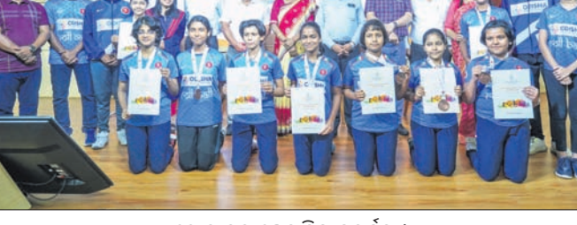
ରୋଲ୍ ବଲ୍ ଖେଳାଳିଙ୍କୁ ସମର୍ଥନ ।

ଭୁବନେଶ୍ୱର, ୨୩ମା (ବିଜୟ ରଣା) ଓଡ଼ିଶା ରୋଲ୍ ବଲ୍ ଖେଳାଳିଙ୍କ ଲାଗି ରବିବାର ଥିଲା ଆଉ ଏକ ଭଲ ଦିନ । ରାଜ୍ୟର ପ୍ରାୟ ୫୦୦ଟି ରୋଲ୍ ବଲ୍ ଖେଳାଳିଙ୍କୁ ଓଡ଼ିଶା ସରକାର ସ୍ୱୀକୃତି ପ୍ରଦାନ କରିବା ସହ ସେମାନଙ୍କ ଆର୍ଥିକ ପୁରସ୍କାର ପୁରସ୍କାର ଓ ସାର୍ବିସିକେଟ୍ ପ୍ରଦାନ କରାଯାଇଛି । ଓଡ଼ିଶା ସରକାରଙ୍କ କ୍ରୀଡ଼ା ଓ ଯୁବସେବା ବିଭାଗ ଶନିବାର ଓଡ଼ିଶାର ୧୦୦ଟି ରୋଲ୍ ବଲ୍ ଖେଳାଳି