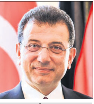
ରାଷ୍ଟ୍ରପତି ନିର୍ବାଚନ ଲଢ଼ିବାକୁ ନ ଦେବା ପାଇଁ ଇସ୍ରାଏଲରୁ ମେୟର ଏକ୍ସେମ୍ ଇମାମୋଗ୍ଲୁ ଗିରଫ କରାଯାଇଛି।

ଦୁର୍ଗତିରେ ଗତ ରାଷ୍ଟ୍ରପତି ନିର୍ବାଚନ ୨୦୨୩ ମେ ୧୪ରେ ଅନୁଷ୍ଠିତ ହୋଇଥିଲା। ପରବର୍ତ୍ତୀ ନିର୍ବାଚନ ୨୦୨୮ ମେ ୭ରେ ହେବାକୁ ଯାଉଛି। ବର୍ତ୍ତମାନ ରାଷ୍ଟ୍ରପତି ରେସେପ୍ ଟେୟିପ୍ ଏଡ଼ୋଗାନ୍‌ଙ୍କ ବିରୋଧରେ ଆଗାମୀ ନିର୍ବାଚନରେ ପ୍ରାର୍ଥୀ ହେବାକୁ ଥିବା ମୁଖ୍ୟ ପ୍ରତିସ୍ପନ୍ଧୀ ତଥା ଇସ୍ରାଏଲରୁ ମେୟର ଏକ୍ସେମ୍ ଇମାମୋଗ୍ଲୁ ୪ ଦିନ ତଳେ ଦୁର୍ଗତି ଓ ଆତଙ୍କବାଦ ସଙ୍ଗଠନଗୁଡ଼ିକ ସହ ସମ୍ପର୍କ ରଖିବା ଅଭିଯୋଗରେ ଗିରଫ କରାଯାଇଛି। ଏତିକି ବୁହୁଛି, ଇସ୍ରାଏଲରୁ ମୁନିସିପାଲିଟି ତାଙ୍କ ତତ୍ତ୍ୱାକୁ ମଧ୍ୟ ପ୍ରତ୍ୟାହାର କରିନେଇଛି। ବିଜନେସ୍ ଆର୍ଡ଼ିନିଂସ୍‌ଗ୍ରନ୍‌ରେ ସ୍ମାରକ ଓ ମାନବ ସମ୍ପଦ ପରିଚାଳନାରେ ସ୍ମାରକୋରର