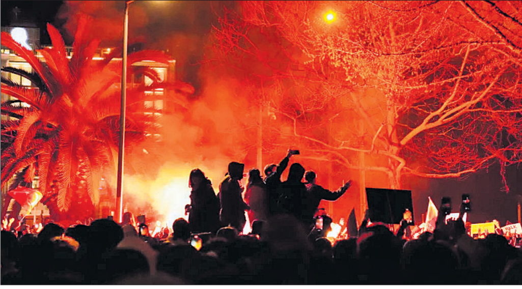
ଇସ୍ରାଏଲରୁ ମେୟର ଏକ୍ସେମ୍ ଇମାମୋଗ୍ଲୁଙ୍କ ଗିରଫଦାରି ପ୍ରତିବାଦରେ ବିଶାଳ ବିରୋଧ।

ଇମାମୋଗ୍ଲୁ ନିଜ ଶିକ୍ଷାଗତ ଯୋଗ୍ୟତା ହରାଇବା ପରେ ରାଷ୍ଟ୍ରପତି ନିର୍ବାଚନ ଲଢ଼ିପାରିବେ ନାହିଁ। ୫୩ ବର୍ଷୀୟ ଇମାମୋଗ୍ଲୁଙ୍କ ବିରୋଧରେ ସବୁମାମଲାର ଶୁଣାଣି କରାଯିବ ବୋଲି ସେଠାକାର ଏକ ଅଦାଲତ ରବିବାର ସ୍ପଷ୍ଟ କରିଛି। ଏହି କାର୍ଯ୍ୟାନୁଷ୍ଠାନ ରାଷ୍ଟ୍ରପତି ନିର୍ବାଚନରେ ଇମାମୋଗ୍ଲୁଙ୍କୁ ପ୍ରତିସ୍ପନ୍ଧିତା ଆଗରେ ପ୍ରତିବନ୍ଧକ ସୃଷ୍ଟିପାଇଁ ରାଜନୈତିକ ଉଦ୍ଦେଶ୍ୟ ରଖି କରାଯାଇଥିବା ସମାଲୋଚକମାନେ କହୁଛନ୍ତି। ତାଙ୍କ ଗିରଫଦାରି ପରେ ଦେଶବ୍ୟାପୀ ବିଶାଳ ବିରୋଧ ଚାଲିଛି। ବିଜନି ଗ୍ଲାନରେ ବିରୋଧକାରୀ ଓ ପୋଲିସ୍ ମଧ୍ୟରେ ସଂଘର୍ଷ ଘଟିଛି।