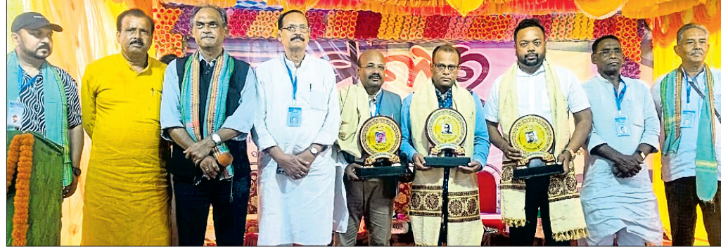
ମତ୍ତେଇ ମହୋତ୍ସବରେ ଅତିଥିଙ୍କ ସହ ସମ୍ବନ୍ଧିତ ବ୍ୟକ୍ତିଗଣେ।