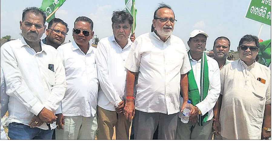
କୋରାପୁଟ ଜିଲ୍ଲା ବିଜେଡି ନେତାମାନେ ଯଉଁରା ନଦୀ ପୁରୁଣାରେ ପ୍ରତିବାଦ କରୁଛନ୍ତି।

କୋରାପୁଟ ଜିଲ୍ଲା କୋଟପାଡ଼ ଚାଷୀଙ୍କ ପଞ୍ଚାୟତ ଲକ୍ଷ୍ମୀବତୀ ଶାଖା ନଦୀ ଯଉଁରା ପୁରୁଣାରେ ଛତିଶଗଡ଼ ସରକାର ବାଲି ବସ୍ତା ପକାଇ ଜଳ ନେବାରୁ ରବିବାର ଜିଲ୍ଲା ବିଜେଡି ନେତାମାନେ ଏକତ୍ର ହୋଇ ଏହାର ପ୍ରତିବାଦ କରିଛନ୍ତି। ଭାଙ୍ଗପା ବିରୋଧରେ ରଖିଛନ୍ତି। ଦେଇ ରାଜ୍ୟ ସରକାର ପାଣି ବିକ୍ରି କରୁଥିବା ଅଭିଯୋଗ କରିଛନ୍ତି। ଏହି ଅଞ୍ଚଳରେ ଚଳିତ ଖରିଫ ଚାଷ ସମ୍ପୂର୍ଣ୍ଣ ନଷ୍ଟ ହେଉଛି। ନଦୀ ପୁରୁଣାରେ ରାଜ୍ୟ ସରକାର ଉଠା ଜଳସେଚନ ବିଭାଗ ଦ୍ୱାରା ବାଲି ବସ୍ତା ପକାଇ ଛତିଶଗଡ଼କୁ ପାଣି ନେବାକୁ ନିର୍ଦ୍ଦେଶ ଥିବା ଜଣାପଡିବା ପରେ ବିରୋଧୀ ବିଜେଡି ଏହାର ପ୍ରତିବାଦ କରିଛି। ନଦୀ