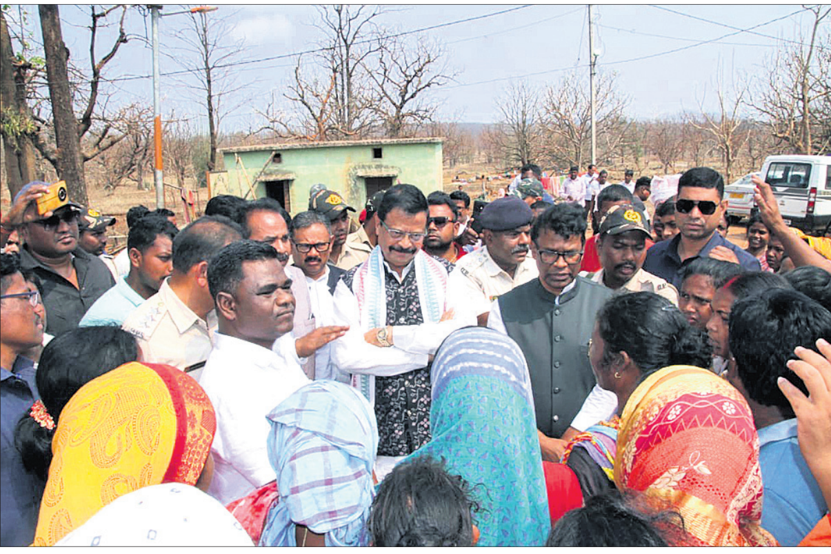
ମୟୂରଭଞ୍ଜ ବିଷୟାୟା କୁଳରେ ରବିବାର ରାଜ୍ୟ ମନ୍ତ୍ରୀ ସୁରେଶ ପୂଜାରୀ ଓ ପରିବେଶ ମନ୍ତ୍ରୀ ଗଣେଶରାମ ସିଂହଙ୍କୁ ଆକାଶବାଣୀ କ୍ଷତିଗ୍ରସ୍ତଙ୍କ ସହ ଆଲୋଚନା କରୁଛନ୍ତି।