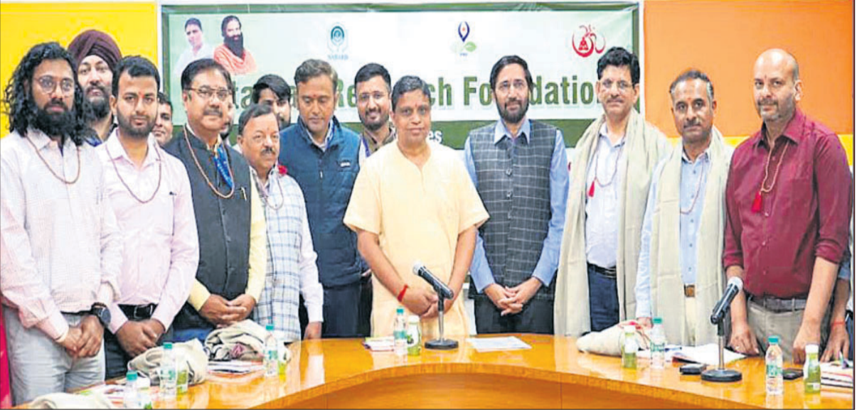
ଭୁବନେଶ୍ୱର, ୨୩ମାର୍ଚ୍ଚ (ଅନୁରାଧା ମହାରଣା)

ରାଷ୍ଟ୍ରୀୟ କୃଷି ଏବଂ ଗ୍ରାମୀଣ ବିକାଶ ବ୍ୟାଙ୍କ(ନାବାର୍ଡ଼)ର ପ୍ରତିନିଧିମାନେ ହରିଦ୍ୱାରସ୍ଥିତ ପତଞ୍ଜଳି ଗବେଷଣା ପ୍ରତିଷ୍ଠାନ ପରିଦର୍ଶନ କରିଛନ୍ତି। ପତଞ୍ଜଳି ରିସର୍ଚ୍ଚ ଫାଉଣ୍ଡେସନ ଦ୍ୱାରା ଆୟୋଜିତ ଏହି ଦିନିକିଆ କାର୍ଯ୍ୟକ୍ରମରେ ଗ୍ରାମୀଣ କ୍ଷେତ୍ରରେ ବିଭିନ୍ନ ବିକାଶମୂଳକ କାର୍ଯ୍ୟକ୍ରମରେ ନିବେଶ ତଥା କୃଷି କ୍ଷେତ୍ରକୁ