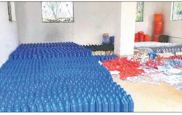
ଜବତ କରାଯାଇଥିବା ମୋଟର ଓଲ