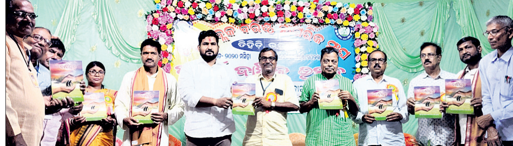
ଅତିଥିମାନେ ପୁଖ୍ୟପତ୍ର ଉନ୍ମୋଚନ କରୁଛନ୍ତି।