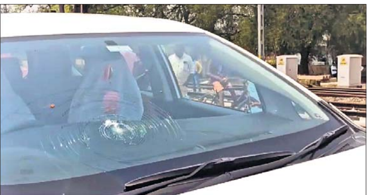
ଢେଲାମାଡ଼ରେ ରାଜସ୍ୱ ମନ୍ତ୍ରୀଙ୍କ ଏସ୍କର୍ଟ ଗାଡ଼ି କାଟି ଭାଙ୍ଗିଯାଇଛି।

ବାରିପଦା, ୨୩ମାର୍ଚ୍ଚ (ନୀଳାଦ୍ରି ବିହାରୀ ବସୁପାଟ)