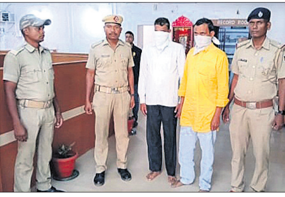
ଗିରଫ ୨ ଅଭିଯୁକ୍ତ

ରାଉରକେଲା ପୋଲିସ ଡିଭିଜନ୍ ଆନାଠାରୁ ୫୦୦ ଫିଟର ଦୂରରେ କଲୋନିରେ ଏକ ନକଲି ମୋଟର କାରଖାନା ଠାବ ହୋଇଛି। ଏହି ସୂଚନା ମିଳିବା ପରେ ବିଶ୍ୱା ଥାନାଧିକାରୀ କୋର୍ଟରୁ ପତ୍ରିକା ନେତୃତ୍ୱରେ ଏକ ଟିମ୍ ସେଠାରେ ଶନିବାର ଚଢ଼ାଉ କରିଥିଲେ। ଚଢ଼ାଉ ବେଳେ ୪ ହଜାର ଲିଟର ନକଲି ମୋଟର, ୫ ହଜାର ନାନାଦାନୀ ବ୍ରାଣ୍ଡର ଟ୍ରେଡ଼ିଂ, ଷ୍ଟିକର ଏବଂ ଠିକି ଆଦି ଜବତ କରାଯାଇଛି। ସେହିପରି ଉକ୍ତ ନକଲି ମୋଟର ପରିବହନ ପାଇଁ ବ୍ୟବହୃତ କାର୍ (ନଂ.ଓଡ଼ିଏ ୪୮୮-୫୭୯୫) ଓ ଫୁଟି (ନଂ.ଓଡ଼ିଏ ୪୮୮-୭୦୫୭) ଜବତ ହୋଇଛି। ଏହି ଘଟଣାରେ ପୋଲିସ ୨ ଜଣଙ୍କୁ ଗିରଫ କରିଛି। ଗିରଫ ଅଭିଯୁକ୍ତ ଦ୍ୱୟ ହେଲେ ବିଶ୍ୱା ଅଞ୍ଚଳର