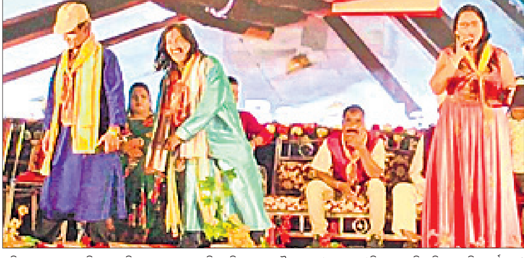
ହରିରାଜପୁର ମେଳଣ ପଡ଼ିଆରେ ପଶ୍ଚିମାଞ୍ଚଳ ଯୁବ ସଙ୍ଗଠନ ପିତାପଣିଆ ମଞ୍ଚର ରୌପ୍ୟ ଜୟନ୍ତୀ ଉଦ୍‌ଘାଟନା ଦିବସରେ ପରିବେଷିତ ସାଂସ୍କୃତିକ କାର୍ଯ୍ୟକ୍ରମ।