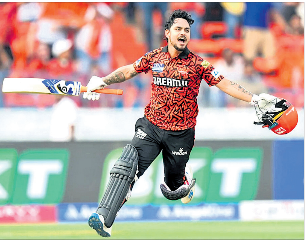
ଶତକ ହାସଲ ପରେ ଇଶାନ କିଶନ ।

ହାଇଦ୍ରାବାଦ, ୨୩୩ ସ୍ଥାନୀୟ ରାଜ୍ୟ ଗାନ୍ଧୀ ଅର୍ଦ୍ଧଶତାବ୍ଦୀ ଷ୍ଟାଡ଼ିୟମରେ ରବିବାର ଅପରାହ୍ନରେ ଚଳିଥିବା ଚଳଚ୍ଚିତ୍ର (ଆରଥାର) ବିପକ୍ଷରେ ଖେଳାଯାଇଥିବା ହାଇ ସ୍କୋରିଂ ଆଇପିଏଲ୍ ମ୍ୟାଚକୁ ସନରାଇଜର୍ସ ହାଇଦ୍ରାବାଦ (ଏସଆର୍ଏସ୍) ୪୪ ରନରେ ଜିତି ନେଇଛି । ଇଶାନ କିଶନଙ୍କ ଅପରାଜିତ ଶତକ ବଳରେ ହାଇଦ୍ରାବାଦ ଦ୍ୱାରା ପ୍ରଥମ ୨୮୭ ରନର ଚାର୍ଜେଟ ଆଗରେ ରାଜସ୍ଥାନ ୬ ଉଇକେଟ୍ ହରାଇ ୨୪୨ ରନ କରିବାକୁ ସମର୍ଥ ହୋଇଥିଲା । ବିଷ୍ଣୁକ ଶତକ ହାସଲ