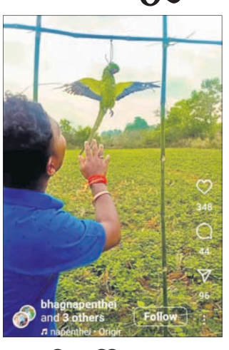
ସୋସିଆଲ ମିଡିଆରେ ଯୋଷ୍ଟି ହୋଇଥିବା ଭିଡିଓର ସ୍କ୍ରିନଶଟ୍।

■ ସୋସିଆଲ ମିଡିଆରେ ଭିଡିଓ ଯୋଷ୍ଟି ■ ପିପିସିଏଫ୍‌କୁ ଅଭିଯୋଗ କଲେ ପ୍ରାଣୀପ୍ରେମୀ