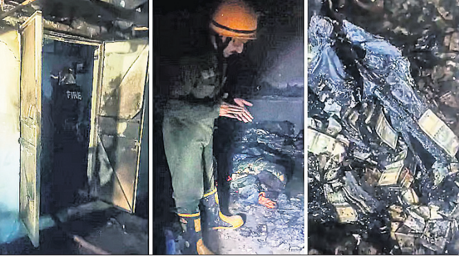
ସୁପ୍ରିମକୋର୍ଟ ଡେଇଁବାକୁ ନେଇ ତଦନ୍ତ କାରି ରହିଥିବା ପୋଲିସ୍ କହିଛି।