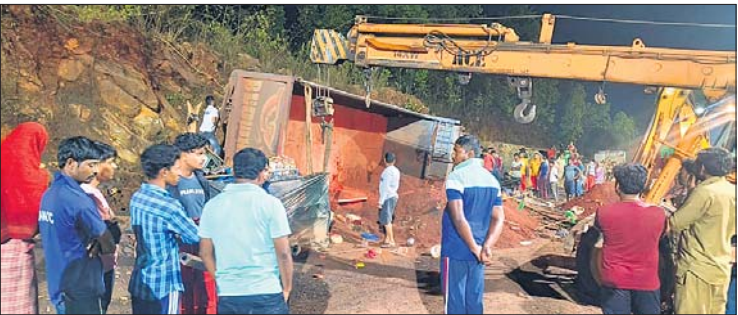
ସୁନ୍ଦରଗଡ଼, ଚେନ୍ଦିଆ, ୨୩ମାର୍ଚ୍ଚ (ଜୟ ନାରାୟଣ ମେଣ୍ଡଳ/ସମୀର କୁମାର ପାଢ଼ୀ)