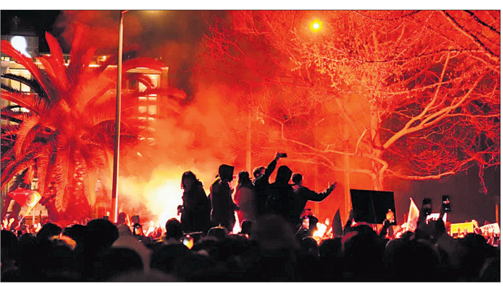
ଇସ୍ତାମ୍‌ବୁଲ୍ ମେୟର ଏକ୍ସରେମ୍ ଇମାମୋଗ୍ଲୁଙ୍କ ଗିରଫଦାରି ପ୍ରତିବାଦରେ ବିଶାଳ ବିଶୋଭ।

ରୁଷିଆ ରାଷ୍ଟ୍ରପତି ଭୁଟିନିର ପୁଚିନ୍କ ନିକ ଏକଜୁଟ୍‌ବାଦୀ ଶାସନ ଆଗରେ ପ୍ରତିବନ୍ଧକ ସାଜୁଥିବା ରାଜନୈତିକ ପ୍ରତିବନ୍ଧକୀମାନଙ୍କୁ ରାସ୍ତାକୁ ହଟାଇଦେଇଥିଲା। ପୁଚିନ୍କ ଘୋର ସମାଲୋଚକ ଭାବେ ପରିଚିତ ବିରୋଧୀ ନେତା ଆଲେକ୍ସି ନଭାଲିନିଙ୍କୁ ଦୀର୍ଘ ସମୟ ଧରି ଜେଲରେ ବନ୍ଦୀ ରଖାଯିବା, ୨୦୨୦ରେ ତାଙ୍କ ଖାଦ୍ୟରେ ବିଷ ଦିଆଯିବା ଏବଂ ୨୦୨୪ ଫେବୃଆରୀ ୧୬ରେ କାରାଗାର ଭିତରେ ହିଁ ତାଙ୍କ ସନ୍ଦେହଜନକ ମୃତ୍ୟୁ ଘଟିବା ଅନେକ ପ୍ରଶ୍ନ ଛିଡ଼ା କରାଇଥିଲା, ଯାହାର ଉତ୍ତର ଏ ଯାଏ ରୁଷିଆ କର୍ତ୍ତୃପକ୍ଷ ଦେଇନାହାନ୍ତି। ବର୍ତ୍ତମାନ ଦୁର୍ଗତିରେ ମଧ୍ୟ ଅନୁରୂପ ଘଟଣା ଦେଖିବାକୁ ମିଳିଲାଣି। ୨୦୨୮ ରାଷ୍ଟ୍ରପତି ନିର୍ବାଚନରେ ପ୍ରାର୍ଥୀ ହେବାକୁ ଥିବା ବିରୋଧୀ ରିପବ୍ଲିକାନ୍ ପିପୁଲ୍ ପାର୍ଟି (ସିଏସ୍‌ପି)ର ପ୍ରମୁଖ ନେତା ଏକ୍ସରେମ୍ ଇମାମୋଗ୍ଲୁଙ୍କୁ ଦକ୍ଷିଣ ନାମାଙ୍କନର ଠିକ୍ ପୂର୍ବରୁ ଦୁର୍ଗତି ଓ ଆଚରଣବାଦ ଅଭିଯୋଗରେ ଗିରଫ କରାଯାଇଛି। ଏହାର ପ୍ରତିବାଦରେ ଦେଶବ୍ୟାପୀ ଆନ୍ଦୋଳନ ମୁଣ୍ଡ ଟେକିଛି। ଇସ୍ତାମ୍‌ବୁଲ୍ ମେୟର ଇମାମୋଗ୍ଲୁଙ୍କ ରାଜନୈତିକ କ୍ୟାରିୟରକୁ ଶେଷ କରିଦେବା ପାଇଁ ରାଷ୍ଟ୍ରପତି ରେସେପ୍ ଟେୟିପ୍ ଏଡ଼ୋଗାନ୍ଙ୍କ ସରକାର ପୁଚିନ୍କ ପଦାଙ୍କ ଅନୁସରଣ କରୁଥିବା ସମାଲୋଚକ କହିବା ଆରମ୍ଭ କଲେଣି।