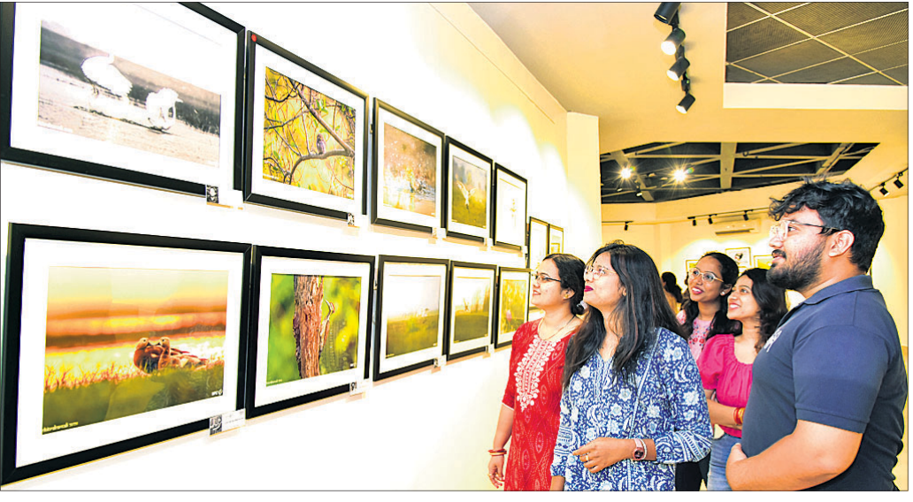
ଭୁବନେଶ୍ୱର ଲଳିତକଳା ଏକାଡେମୀରେ ଚାଲିଥିବା ଫଟୋଗ୍ରାଫି ଓ ଚିତ୍ରକଳା ପ୍ରଦର୍ଶନୀ 'ଚିତ୍ରବର୍ଣ୍ଣାଳି'ର ଶେଷ ଦିବସରେ କଳାପ୍ରେମୀଙ୍କ ଭିଡ଼।

୨୦୨୪ରେ ୧୩,୪୧୧ରେ ପହଞ୍ଚିଥିବା ସହରରେ କ୍ରାନ୍ତମୁଖେ ଥାନାପରିଚାଳନା କାର୍ଯ୍ୟକଳାପ) ମଧ୍ୟ ବଢ଼ିଛି। ସେହିପରି ଗାଡ଼ି ସଂଖ୍ୟା ବହୁଗୁଣ ହୋଇଛି। ୨୦୦୮ରେ ୩୯,୮୭୩ ଗାଡ଼ି ପଞ୍ଜୀକୃତ ଥିବାବେଳେ ୨୦୨୪ରେ ଏହି ସଂଖ୍ୟା ୯୧,୫୩୩ରେ ପହଞ୍ଚିଛି। କେବ୍ ସ୍ପ୍ରି, କେବ୍, ଖଲ ଆଦି ବର୍ଗରେ ସୁରକ୍ଷା ଦିଆଯାଉଥିବା ବ୍ୟକ୍ତିଙ୍କ ସଂଖ୍ୟା ବଢ଼ିଥିବାରୁ ସେମାନଙ୍କୁ ସୁରକ୍ଷା ଯୋଗାଇବା ପାଇଁ ପୋଲିସ ଉପରେ ଚାପ ପଡ଼ୁଛି। ଆଇନଶୁଳ୍କା ଓ ଭିଜିଆଇପି ଗସ୍ତକୁ ପରିଚାଳନା ପାଇଁ ସ୍ୱତନ୍ତ୍ର ୫ ପ୍ଲାଟ୍ଫର୍ମ ଆର୍ଡି ପୋଲିସ ରିଜର୍ଭ(ଏପିଆର୍) ରଖାଯିବ। ତେବେ ବର୍ତ୍ତମାନ ସାଲବର ଥାନା ଷ୍ଟେସ୍ ଯୁପିଡିରେ ରହିବାକୁ ଥିବାବେଳେ ଇଷ୍ଟ ଯୁପିଡିରେ ଆଉ ଏକ ନୂଆ ସାଲବର ଥାନା ପ୍ରତିଷ୍ଠା କରାଯିବ। ସେହିପରି ଷ୍ଟେସ୍ ଯୁପିଡିରେ ନୂଆ କରି କ୍ରାନ୍ତମୁଖେ ଏଗେନେସ୍ ଓ ମେନ୍ ଆଣ୍ଡ ଚିଲଡ୍ରେନ୍ ସ୍କୁଲିଂ ଖୋଲାଯିବାକୁ ପ୍ରସ୍ତାବ ଦିଆଯାଇଛି।