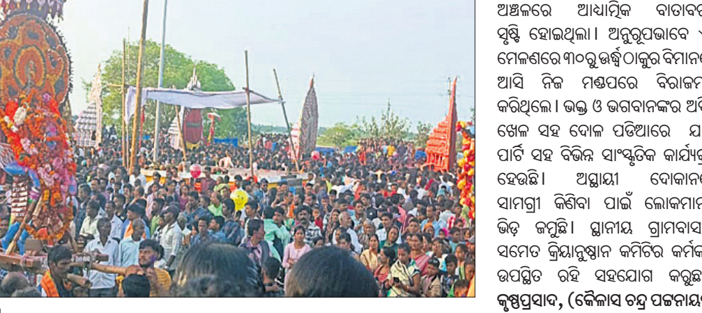
ମାଲୁଦ ପଞ୍ଚଦୋଳ ମେଳଣରେ ଶ୍ରଦ୍ଧାଳୁଙ୍କ ଭିଡ଼।

ବାଳକଙ୍କୁ ଦେବଙ୍କ ମଧ୍ୟରେ ହରିହର ଭେଟ ଉତ୍ସବ ଅନୁଷ୍ଠିତ ହୋଇଥିଲା। ଏହି ସମୟରେ ସମସ୍ତ ଦୋଳବିମାନକୁ ବୋଳବିମାନ ମଧ୍ୟରେ ଘେରିନାଚ କରାଯାଇ ପୁଣିପୁଣି ହୋଇଥିଲେ। ଏହି ଘେରିନାଚ ପରେ ଅଧରପଣା ସୋମନାଥଙ୍କୁ ସମର୍ପଣ କରାଯାଇ ରୁଆରୀ ଭୋଗ ଖାଇ ଠାକୁର ମନ୍ଦିର କରିଛନ୍ତି। ଶେଷରେ ସ୍ଥାନୀୟପତି ଶ୍ରୀ ଶ୍ରୀ ପଶ୍ଚିମାଞ୍ଚଳ ସୋମନାଥ ଦେବ, ଅରାଗଡ଼ର ଶ୍ରୀକୃଷ୍ଣେଶ୍ୱର ଦେବ, କୁମ୍ଭାଗାଡ଼ି ଶ୍ରୀଗଣେଶ୍ୱର ଦେବ, କନ୍ତିଆର ଶ୍ରୀବାଲୁକେଶ୍ୱର ଦେବ, ଭିସର ଶ୍ରୀନାଳକେଶ୍ୱର ଦେବ, ହରିରାଜପୁର