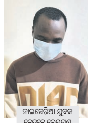
ନାଇଜେରିଆ ଯୁବକ ଜେଡ୍ରେକ୍ରେ ରେୟମାଣ୍ଡ

ସୋସିଆଲ ମିଡିଆରେ କଟକର ଜଣେ ମହିଳା ଡାକ୍ତରଙ୍କ ସହ ସମ୍ପର୍କ ସ୍ଥାପନ କରି ଘନିଷ୍ଠ ହୋଇଯାଇଥିଲେ ନାଇଜେରିୟା ଯୁବକ। ପରେ ଯୁବକ ଜଣକ ବିଶ୍ୱାସ କରୁଥିବା ଡାକ୍ତରୀ ଓ ଭିଡିଓ ସଂଗ୍ରହ କରି ଟଙ୍କା ଆଦାୟ କରିଥିଲେ। ହେଲେ ଅଧିକ ଟଙ୍କା ନ ମିଳିବାରୁ ଉକ୍ତ ଫଟୋ ଏବଂ ଭିଡିଓକୁ ଭାଇରାଲ କରିବାକୁ ପଛାଇ ନ ଥିଲେ। ଅନ୍ତର୍ଜାତୀୟ ମାଧ୍ୟମରେ ବ୍ଲୁଟ୍ରିପ୍ କରି ସେକ୍ସଟର୍ସନ(ଅଣ୍ଡାଳ ଦୁଷ୍ଟ ବେଶାଳ ଟଙ୍କା ଦାବି) କରୁଥିବା ନାଇଜେରିୟା ଯୁବକଙ୍କ ପାଖରେ ପଡ଼ିଥିବା ମହିଳା ଡାକ୍ତର ଶେଷରେ ନିଜ ସମ୍ପାନ ରକ୍ଷା ପାଇଁ ଆତ୍ମହତ୍ୟା ମଧ୍ୟ କରିଥିଲେ। ଏହି ଘଟଣାରେ କଟକ କମିଶନରେଟ ପୋଲିସ ସ୍ୱତନ୍ତ୍ର ଟିମ୍ ଗଠନ କରି ଅଭିଯୁକ୍ତ ନାଇଜେରିୟା ଯୁବକଙ୍କୁ ଦିଲ୍ଲୀରୁ ଗିରଫ କରିଛି। ଖୁବ୍ ଶୀଘ୍ର ତାଙ୍କୁ ରିମାଣ୍ଡରେ ଅଣାଯିବ ବୋଲି ପୋଲିସ କହିଛି। ଅନ୍ତର୍ଜାତୀୟ ମାଧ୍ୟମରେ ସାଜବର ଅପରାଧୀଙ୍କ ଅର୍ଥ ଲୁଚାଇ ବଦଳି ଉପାୟ ଏବେ ଯୁବକଙ୍କ ପାଇଁ ଚିନ୍ତା କାରଣ ପାଲଟିଛି।