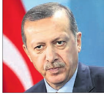
ରେସେପ୍ ଟେୟିପ୍ ଏଡ଼ୋଗାନ୍