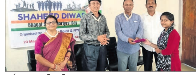
କାର୍ଯ୍ୟକ୍ରମରେ ଉପସ୍ଥିତ ଅତିଥିମାନେ।