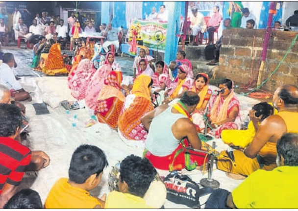
ପ୍ରତିଯୋଗିତାରେ ଅଂଶଗ୍ରହଣ କରିଥିବା ମାତୃମଣ୍ଡଳୀ।

ବୋଲଗଡ଼ ବ୍ଲକ୍ ଅନ୍ତର୍ଗତ ଅସରକା ଗ୍ରାମରେ ଚାଲିଥିବା ତ୍ରୟୋଦଶ ବାର୍ଷିକ ମା'କାଳିକା ଭାଗବତ ପ୍ରତିଯୋଗିତାର ଦ୍ୱିତୀୟ ଦିବସରେ ଚକ୍ରଧରପୁର ପ୍ରସାଦ ବିଜୟୀ ହୋଇ ପାଇନାଲରେ ପ୍ରବେଶ କରିଛି। ପ୍ରଥମ ଦିବସରେ ବେଶାଗାଡ଼ିଆ ଦଳକୁ ହରାଇ ଫତେଗଡ଼ ଭାଗବତ ମାତୃମଣ୍ଡଳୀ ପାଇନାଲରେ ପ୍ରବେଶ କରିଥିଲା। ଦ୍ୱିତୀୟ ଦିବସ ତଥା ଶନିବାର ସନ୍ଧ୍ୟାରେ ରାମଚନ୍ଦ୍ରପୁର ଭାଗବତ ମଣ୍ଡଳୀ ଏବଂ ଚକ୍ରଧରପୁର ଭାଗବତ ମାତୃମଣ୍ଡଳୀ ମଧ୍ୟରେ ପ୍ରତିଯୋଗିତା ହୋଇଥିଲା। ଚକ୍ରଧରପୁର ପ୍ରସାଦ ଭାଗବତ ମଣ୍ଡଳୀ ୪୪ ପଏଣ୍ଟ ଓ ରାମଚନ୍ଦ୍ରପୁର ୩୬ପଏଣ୍ଟ ପାଇଥିଲେ। କିଶୋର ବେହେରାଙ୍କ