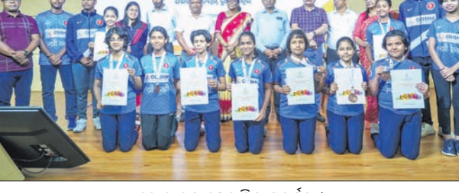
ରୋଲ୍ ବଲ୍ ଖେଳାଳିଙ୍କୁ ସମର୍ଥନ ।

ଭୁବନେଶ୍ୱର, ୨୩୩୩ (ବିଜୟ ରଣା) ଓଡ଼ିଶା ରୋଲ୍ ବଲ୍ ଖେଳାଳିଙ୍କୁ ଲାଗି ରବିବାର ଥିଲା ଆଉ ଏକ ଭଲ ଦିନ । ରାଜ୍ୟର ପ୍ରାୟ ୫୦୦ରୁ ଊର୍ଦ୍ଧ୍ୱ ରୋଲ୍ ବଲ୍ ଖେଳାଳିଙ୍କୁ ଓଡ଼ିଶା ସରକାର ସ୍ୱୀକୃତି ପ୍ରଦାନ କରିବା ସହ ସରକାରଙ୍କ ଆର୍ଥିକ ପୁରସ୍କାର ଓ ସାମ୍ବିଧାନିକ ପ୍ରଦାନ କରାଯାଇଛି । ଓଡ଼ିଶା ସରକାରଙ୍କ କ୍ରୀଡ଼ା ଓ ଯୁବସେବା ବିଭାଗ ଶନିବାର ଓଡ଼ିଶା ୧୦୦ରୁ ଊର୍ଦ୍ଧ୍ୱ ରୋଲ୍ ବଲ୍ ଖେଳାଳି