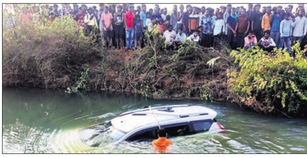
କେନାଲ ଭିତରକୁ ଖସିପଡ଼ିଥିବା କାର୍।

ଭବାନୀପାଟଣା, ୨୬/୩ (ଉତ୍ତମ କୁମାର ଦାଶ) କଳାହାଣ୍ଡି ଜିଲ୍ଲା କଳମପୁର ଥାନା ଅନ୍ତର୍ଗତ ଠେଲକୋମୁଣ୍ଡା ଇନ୍ଦ୍ରାବତୀ କେନାଲ ନିକଟରେ ବୁଧବାର ଏକ ଦୁର୍ଘଟଣା ଘଟଣା ସାମ୍ମୁଖ୍ୟ ଆଘାତ ହୋଇଥିଲା।