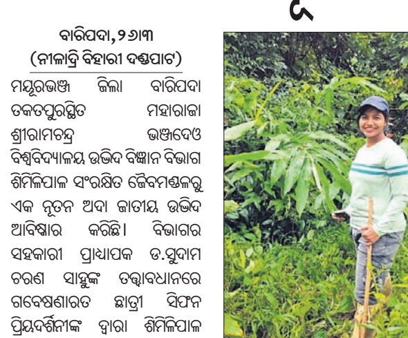
ଆବିଷ୍କାର ହୋଇଥିବା ଅଦା ଜାତୀୟ ଭବିଷ୍ୟତ।

କାର୍ଯ୍ୟକାରୀ, ୨୬/୩ (ନୀଳାଦ୍ରି ବିହାରୀ ଦାଶ) ମୟୂରଭଞ୍ଜ ଜିଲ୍ଲା ମୟୂରପଦା ଚକପୁରପୁର ଗ୍ରାମୀଣପଞ୍ଚାୟତର ଉପରେ ଶିମିଳିପାଳ ସଂରକ୍ଷିତ ଜୈବମଣ୍ଡଳର ଏକ ନୂତନ ଅଦା ଜାତୀୟ ଭବିଷ୍ୟତ ଆବିଷ୍କାର କରାଯାଇଛି।