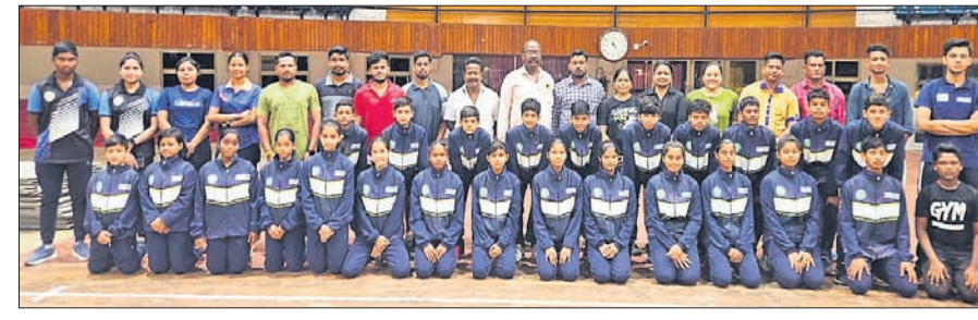
ଜାତୀୟ ସବ୍‌ଜୁନିୟର ଫେର୍‌ସିଂ ପାଇଁ ମନୋନୀତ ଓଡ଼ିଶା ଦଳ।

ରଖିଥିଲେ। ମୋଇନ ଅଲୀ ମାତ୍ର ୫ ରନରେ ରନଆଉଟ ହୋଇଥିଲେ ହେଁ ଟାକ୍‌ସ୍‌ ସହ ଓପନିଂ ଯୋଡ଼ିରୁ ଟିକେଟ୍ ୪୧ ରନ ସଂଗ୍ରହ କରିଥିଲେ। ଅଧିନାୟକ ଅଜିଙ୍କ୍ୟ ରାହାନେ ମଧ୍ୟ ଅଧିକ ସମୟ କ୍ରିକେଟ ଟିଷ୍ଟି ନ ପାରି ମାତ୍ର ୧୮ ରନରେ ପ୍ୟାଟିଲିୟନ ଫେରିଥିଲେ। ଏପରି ସ୍ଥିତିରେ କୋଲକାତାର ବ୍ୟାଟିଂ ମେଲୁଡ଼ି ସାଜିଥିଲେ ଟିକେଟ୍। ଟିକେଟ୍ ଓ ଇମ୍ପାକ୍ଟ ମେଲୁଡ଼ି ଅଜିଙ୍କ୍ୟ ରାହାନେ ଅସମର୍ଥ ଚୁଡ଼ାୟ ଉଇକେଟରେ ୪୪ ବଲ୍‌ରୁ ୮୩ ରନର ଭାଗାଦାରି ରହି ଆହୁରି ୧୫ଟି ବଲ୍‌ ବାକିଆଇ କୋଲକାତାକୁ ବିଜୟ ସ୍ୱାପ ଚଖାଇଥିଲେ। ୬୧ଟି ବଲ୍‌ର ସମ୍ପୂର୍ଣ୍ଣ ଟାଇମ୍‌ସ୍‌ ଟିକେଟ୍ ୮ ଚୌକା ଓ ୬ ଛକା ସହାୟତାରେ ୯୭ ରନରେ ଅପରାଧିତ ରହିଥିଲେ। ରାହାନେ ୧୭ ବଲ୍‌ରୁ ୨୨ ରନ କରିଥିଲେ। ଗୁଆହାଟୀ ବର୍ଷାପରା ଷ୍ଟାଡିୟମର ସ୍କୋ ପିଟ୍‌ରୁ ରାଜସ୍ଥାନ ବୋଲରମାନେ ଫାଇଦା ଉଠାଇ ପାରି ନ ଥିଲେ। କେବଳ ଓମିନିୟୁ ହସରଜୀ ଗୋଟିଏ ଉଇକେଟ ପାଇଥିଲେ। ସଂକ୍ଷିପ୍ତ ଷ୍ଟୋର ରାଜସ୍ଥାନ ରୟାଲ୍ ୨୦ ଓଭରରେ ୧୫୧/୯ (ଧ୍ରୁବ ଜୁରଲ-୩୩, ଯଶସ୍ୱୀ କନ୍ଧସାଲ-୨୯, ରିୟାଜ ପରାଗ-୨୫, ଦେବଦ ଆରୋରା-୨/୩୩, ମୋଇନ ଅଲୀ-୨/୨୩, ବରୁଣ ଚକ୍ରବର୍ତ୍ତୀ-୨/୧୭, ହର୍ଷିତ ରାଣା-୨/୩୭, ସ୍ନେହସର ଜନସନ-୧/୪୨)। କୋଲକାତା ନାଇଟ ରାଇଡର୍ସ ୧୭.୩ ଓଭରରେ ୧୫୩/୨ (କିଶନ ଟିକେଟ୍-୯୭*, ଅଜିଙ୍କ୍ୟ ରାହାନେ-୨୨*, ଓମିନିୟୁ ହସରଜୀ-୧/୩୪)।