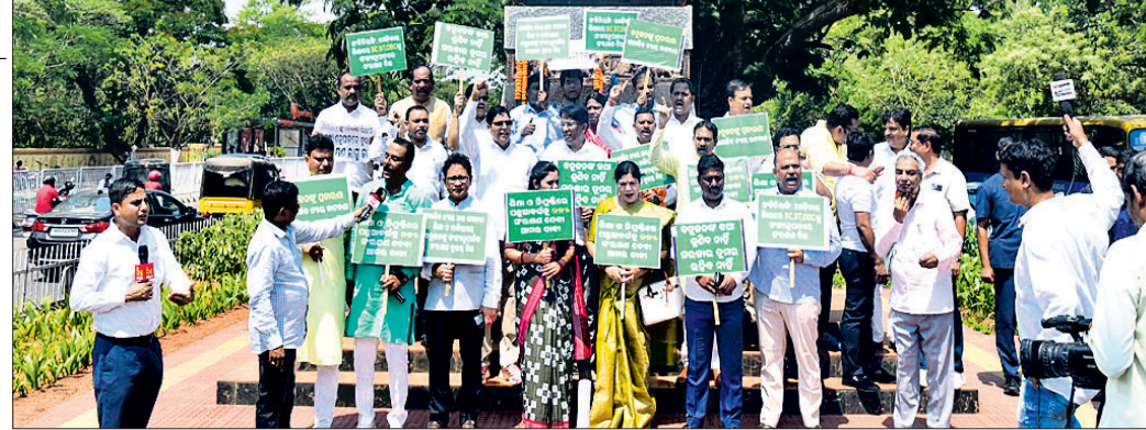
ଆୟତ୍ତକର ପ୍ରତିରୁଦ୍ଧ ନିକଟରେ ବିଜେଡି ବିଧାୟକମାନେ ବିରୋଧ ପ୍ରଦର୍ଶନ କରୁଛନ୍ତି।

ଭୁବନେଶ୍ୱର, ୨୬ମାର୍ଚ୍ଚ (ବିନିମାୟଣ କେନ୍ଦ୍ର) ବିରୋଧୀ ବିଜେଡି ଓ କଂଗ୍ରେସର ଉତ୍ତରାଧିକାରୀ ଗୁଧିର ବିକେତ ଓ କଂଗ୍ରେସର ୧୪ ସଦସ୍ୟଙ୍କ ନିଲମନକୁ ନେଇ କଂଗ୍ରେସ ଉତ୍ତରାଧିକାରୀ ଧରି ବିଧାନସଭା ଭିତରକୁ ପଶିବା ପାଇଁ ଫାଟକ ବାହାରେ ବଳପ୍ରୟୋଗ କରୁଥିବାବେଳେ ବିଜେଡି ସମସ୍ତ ପକ୍ଷୀଆଦର୍ଶକ ସଂରକ୍ଷଣ ଦାବିରେ ସମିଧାନପ୍ରଣେତା ବି.ଆର୍. ଆୟତ୍ତକରଙ୍କ ପ୍ରତିରୁଦ୍ଧରେ ପ୍ରତିବାଦ କରିବା ପାଇଁ ଫାଟକ ପେଲି ବାହାରକୁ ଯିବାକୁ ଉଦ୍ୟମ କରୁଥିଲା। ଏହି ସମୟରେ ବିରୋଧୀ ବିଜେଡି-କଂଗ୍ରେସର ଠେଲୁପେଲି ଏବଂ ପୋଲିସର ପ୍ରତିରକ୍ଷା