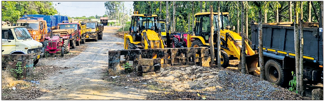
ଜବତ କେସିବି ଓ ଗାଡ଼ି।

■ ୩ ଜେସିବି, ୭ ଟ୍ରକ୍, ୯ ବାଲକ୍, ୬ ପାଖାରିଲର ଜବତ ■ ପୋଲିସ୍ ଉପରକୁ ପଥର ଫିଙ୍ଗିଲେ ଖଣିମାଫିଆ, ୨ ଅଟକ