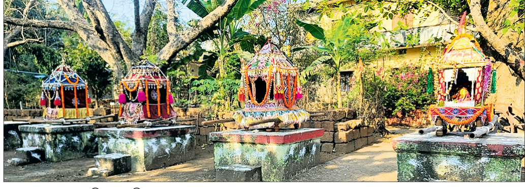
ମେଳଣ ମଣ୍ଡପରେ ସୁସଜ୍ଜିତ ଦୋଳବିମାନ।

ବାଘମାଟା, ୨୬ମାର୍ଚ୍ଚ(ନିହିର ରଞ୍ଜନ ମହାପାତ୍ର) ମନ୍ଦୁପାଠ ଓ ପୂଜାର୍ଚ୍ଚନା ପରେ ଆମନ୍ତ୍ରିତ ହୋଇ ପ୍ରଥମେ ଗାଦିଶ୍ୱର ଭାବେ ଶ୍ରୀ ଶ୍ରୀ ସ୍ୱପ୍ନେଶ୍ୱର ଦେବ ଉପବେଶନ କରିଥିଲେ। ପରେ ଅନ୍ୟ ଠାକୁର ନିମନ୍ତେ ପାଇ ନିଜ ନିଜ ସ୍ଥାନରେ ଉପବେଶନ କରିଥିଲେ। ସୋମବାର ବିଳମ୍ବିତ ରାତିରେ ସୁସଜ୍ଜିତ ବିମାନରେ ଶ୍ରୀ ଶ୍ରୀ ସ୍ୱପ୍ନେଶ୍ୱର ଦେବ, ଶ୍ରୀ ଶ୍ରୀ ରାଧାବିହାରୀ, ଶ୍ରୀ ଶ୍ରୀ ପତିତପାବନ, ମା' ଆନପତିଙ୍କୁ ଭଜନ, କାର୍ତନ, ବାଜାବାଣ ସହ ବିରାଟ ପଟୁଆରରେ ଗ୍ରାମ ପରିକ୍ରମା କରାଯାଇ ମଙ୍ଗଳବାର ଭୋଗ ସମୟରେ ବୋଳପଡ଼ିଆରେ ପହଞ୍ଚାଯାଇଥିଲା। ବେଦକ୍ଷ ବ୍ରାହ୍ମଣମାନଙ୍କ