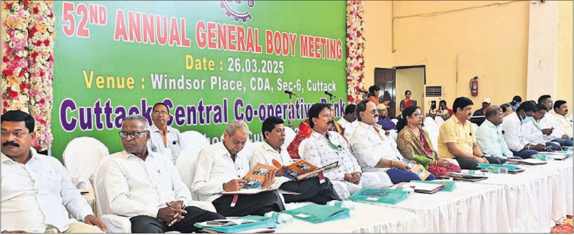
କଟକ ସିଟିପଲିକା ଡିଭିଜନର ମୁଖ୍ୟ ସଚିବ କଟକ କେନ୍ଦ୍ର ସମବାୟ ବ୍ୟାଙ୍କର ୫୨୦୧ମ ବାର୍ଷିକ ସାଧାରଣ ସଭାରେ ଯୋଗଦେଇଥିବା ଅତିଥିବୃନ୍ଦ ।