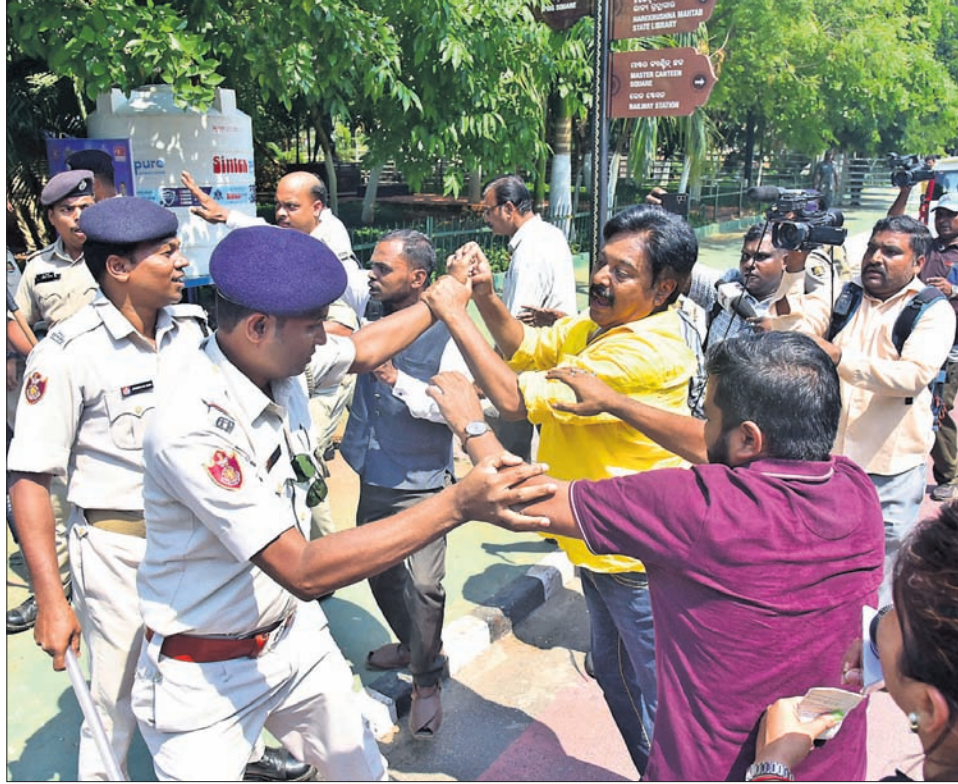
ରାଜ୍ୟରେ ମହିଳା ପୁରସ୍କା ପ୍ରସଙ୍ଗ ଉଠାଇଥିବା କଂଗ୍ରେସ ବିଧାନସଭାକୁ ବିଧାନସଭାରୁ ନିଲମ୍ବନ କରାଯାଇଥିବାବେଳେ ଦକ୍ଷିଣ ଦେଶୀୟରେ ରୁଧିର ଭୁବନେଶ୍ୱର ଗାନ୍ଧୀମାର୍ଗରେ ଘଣ୍ଟ ବଜାଇ ପ୍ରତିବାଦ କରୁଛନ୍ତି ଏବଂ ପୋଲିସ ସହ କଂଗ୍ରେସ କର୍ମୀଙ୍କ ଧମ୍ଯାଧମ୍ଯ।