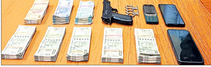
କଟକ ଟଙ୍କା, ମୋବାଇଲ, ଖେଳନା ବସ୍ତୁ ଓ ଗିରଫ ୩ ଅଭିଯୁକ୍ତ ।