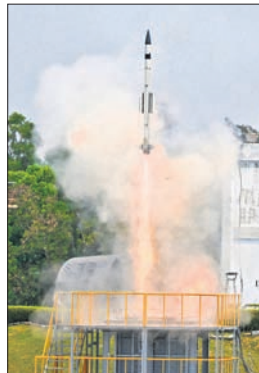
ଭିଏଲ୍-ଏସ୍ଆରଏସ୍ଏମ୍ କ୍ଷେପଣାସ୍ତ୍ର ପରୀକ୍ଷଣ।