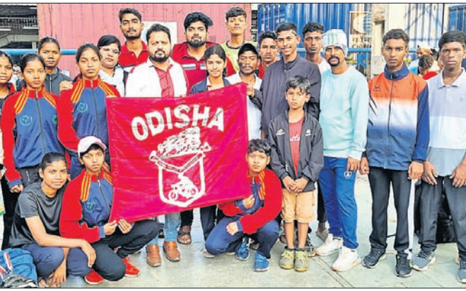
କର୍ମକର୍ତ୍ତାଙ୍କ ଗହଣରେ ଓଡ଼ିଶା ସାଇକ୍ଲ ଦଳ।

ଭୁବନେଶ୍ୱର, ୨୬ମାର୍ଚ୍ଚ (ତପନ ସ୍ୱାଇଁ) ହରିୟାଣାର ମୋଟି ହିଲ୍‌ରେ ୨୧ତମ ଜାତୀୟ ମାଉସ୍‌ସ୍କେନ୍ ବାଇକ୍ (ଏମ୍‌ଟି‌ସି) ଚାମ୍ପିୟନଶିପ୍ ଚଳିତ ମାସ ୨୮ରୁ ୩୧ ପର୍ଯ୍ୟନ୍ତ ଅନୁଷ୍ଠିତ ହେବ। ଏହି ପ୍ରତିଯୋଗିତାରେ ଅଂଶଗ୍ରହଣ ପାଇଁ ଓଡ଼ିଶାରୁ ଏକ ଦଳ ରୁଧିରା ହରିୟାଣା ଯାତ୍ରା କରିଛି। ଓଡ଼ିଶା ସାଇକ୍ଲ ଆସୋସିଏସନ୍ ପକ୍ଷରୁ ମାର୍ଚ୍ଚ ୨ରେ ଭୁବନେଶ୍ୱର ଚନ୍ଦ୍ରକାଠାରେ ଏକ ଚୟନ ପ୍ରକ୍ରିୟା ଅନୁଷ୍ଠିତ ହୋଇଥିଲା। ଏଥିରେ ୯୧ ସାଇକ୍ଲିଷ୍ଟ ଅଂଶଗ୍ରହଣ କରିଥିଲେ। ସେଥିରୁ ୧୮ ଜଣ ଶ୍ରେଷ୍ଠ ସାଇକ୍ଲିଷ୍ଟଙ୍କୁ ଚୟନ କରାଯାଇଥିଲା। ଓଡ଼ିଶା ଦଳରେ ୧୮ ସାଇକ୍ଲିଷ୍ଟ ଓ ୩ ଅତିଥିଆଳ ସାମିଲ ଅଛନ୍ତି। ଓଡ଼ିଶା ପୁରୁଷ ଦଳରେ ସ୍ଥାନ ପାଇଥିବା