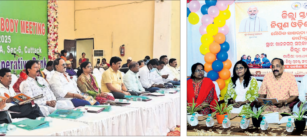
କଟକ ସିଟିପଲିକା ଡିଭିଜନର ମୁଖ୍ୟ ସଚିବ କଟକ କେନ୍ଦ୍ର ସମବାୟ ବ୍ୟାଙ୍କର ୫୨୦୧ମ ବାର୍ଷିକ ସାଧାରଣ ସଭାରେ ଯୋଗଦେଇଥିବା ଅତିଥିବୃନ୍ଦ ।

ଜେଡ୍‌ଏଆଇଏସ୍ କାମାନ କଷ୍ଟମର ସର୍ଭିସର କର୍ମଚାରୀ ଭାବେ ଅନମାନଙ୍କ ଆଗରେ ଦର୍ଶାଇଥିଲେ । ତେବେ କ୍ରାଇମ୍‌ସ୍‌ଟ୍ରାଷ୍ଟ୍ର ଚୁକ୍ତିକାରୀ ଯାଇ ସେମାନଙ୍କୁ ଗିରଫ କରିବା ପରେ ପୁରଟସ୍ଥିତ ୧୨୦୧ମ ଅତିରିକ୍ତ ସିନିୟର ସିଭିଲ୍ ଜଜ୍ ଆଣ୍ଡ୍ ଏସିଜେଏସ୍ ଅପାଲଟରେ ହାଜର କରାଇଥିଲା । ସେଠାରୁ ଟ୍ରାଫ୍ଟିଂ ରିମାଣ୍ଡରେ ଆଣି ଓଡ଼ିଶାରେ ପହଞ୍ଚିଛି । ଏନେଇ ଅଧିକ ତଦନ୍ତ କରାଯାଉଛି । କ୍ରାଇମ୍‌ସ୍‌ଟ୍ରାଷ୍ଟ୍ର ପକ୍ଷରୁ ଲୋକମାନଙ୍କୁ ସାମାଜିକ ଗଣମାଧ୍ୟମ ଓ ବିଜିଆ ଆପରେ ଅର୍ଥ ବିନିଯୋଗ କରି ଅଧିକ ପାଇବାର ଲୋଭକୁ ଦୂରରେ ରହିବା ପାଇଁ ପରାମର୍ଶ ଦିଆଯାଇଛି । କେହି ଏଭଳି ଠକେଇ ଶିକାର ହେଲେ ତୁରନ୍ତ ନିକଟସ୍ଥ ଆନରେ ଜଣାଇବାକୁ ସୂଚନା ଦିଆଯାଇଛି ।