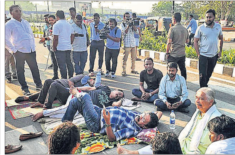
ବିଧାନସଭା ମୁଖ୍ୟ ପ୍ରବେଶ ଦ୍ୱାରରେ ରୁଧିର ବିକେତ ଓ କଂଗ୍ରେସ ବିଧାୟକମାନେ ବ୍ୟାରିକେଡକୁ ଠେଲୁଛନ୍ତି। ଭୁବନେଶ୍ୱର ଲୋୟର ପିଏମ୍‌ଜିଠାରେ କଂଗ୍ରେସ କର୍ମୀମାନେ ବ୍ୟାରିକେଡ୍ ତେଇଁ ଯାଉଥିବାବେଳେ ପୋଲିସ୍ ଅଟକାଇଛି। କଂଗ୍ରେସ ବିଧାୟକଙ୍କ ନିଲମନକୁ ବିରୋଧକରି କଂଗ୍ରେସ ଭବନ ସମ୍ମୁଖ ରାସ୍ତାରେ ଶୋଇଥିବା ଦଳୀୟ ବିଧାୟକ।