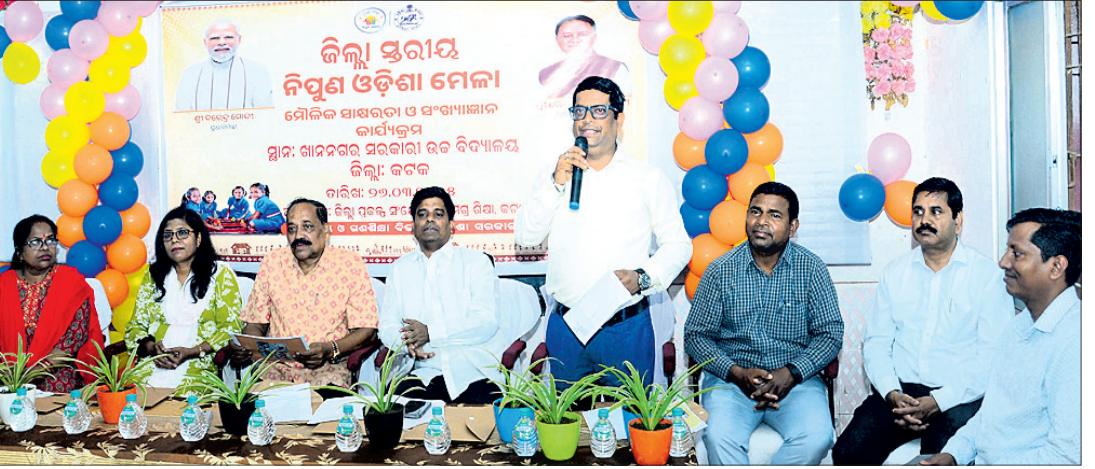
କଟକ ଖାନ୍‌ନଗର ସରକାରୀ ଉଚ୍ଚ ବିଦ୍ୟାଳୟରେ ରୁଧିରୀ ଅନୁଷ୍ଠିତ କଟକ ଜିଲ୍ଲାପ୍ରଧାନ ନିମ୍ବୁଣ ଓଡ଼ିଶା ମେଳା ମୌଳିକ ସାକ୍ଷରତା ଓ ବ୍ୟାଖ୍ୟାତ୍ମକ କାର୍ଯ୍ୟକ୍ରମରେ ଉପସ୍ଥିତ ଅତିଥିବୃନ୍ଦ ।