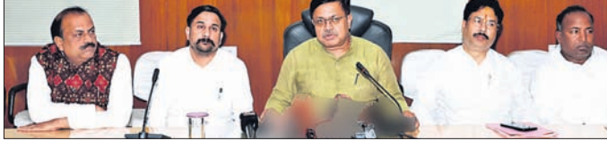
ବିଧାନସଭାର ୫୪ ନମ୍ବର ପ୍ରକୋଷ୍ଠରେ ଆୟୋଜିତ ଖବରଦାତା ସମ୍ମିଳନୀରେ ମନ୍ତ୍ରୀ ପୃଥ୍ୱୀରାଜ ହରିଚନ୍ଦନ, ବୃଷ୍ଟପୁର ମହାପାତ୍ର ଓ ଭାଙ୍ଗିବା ବିଧାୟକ।