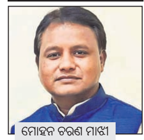
ମୋହନ ଚରଣ ମାଝୀ

ଗୃହ ବିଭାଗ ଆଲୋଚନା ଏକ ଗୁରୁତ୍ଵପୂର୍ଣ୍ଣ ବିଷୟ। ବିରୋଧୀଙ୍କୁ କହିବା ଲାଗି ଏହା ଏକ ବଡ଼ ପ୍ଲାନୁଟର୍ଯ୍ୟ, ଯାହାକୁ ସେମାନେ ଛାଡ଼ିଯାଇଛନ୍ତି। ଗୃହ ବିଭାଗର ଆଲୋଚନାବେଳେ ବିରୋଧୀ ସଦସ୍ୟ ଉପସ୍ଥିତ ଆସାନ୍ତି। ଯେଉଁମାନେ ରାଜ୍ୟର ଆଇନ ଶୁଖିଲା ଏବଂ ନାରୀ ନିର୍ଯାତନା ବିଷୟରେ ଚିତ୍କାର କରୁଛନ୍ତି ସେମାନେ ଥିଲେ ଆଲୋଚନାରେ ଭାଗ ନେଇଥାଆନ୍ତେ। ନାରୀ ନିର୍ଯାତନା ପ୍ରସଙ୍ଗକୁ ନେଇ ରାଜ୍ୟରେ ଏମିତି କ'ଣ ଘଟିଗଲା ଯେ ଗୃହ କର୍ମିତି ଗଠନ ହେବ ବୋଲି ମୁଖ୍ୟମନ୍ତ୍ରୀ ମୋହନ ଚରଣ ମାଝୀ କୁହୁଥିବା ପ୍ରଶ୍ଵଳ କରିଛନ୍ତି। ଗୃହ ବିଭାଗ ଖର୍ଚ୍ଚଦାବି ଆଲୋଚନା ପରେ ମୁଖ୍ୟମନ୍ତ୍ରୀ ଉତ୍ତର ରଖି କହିଛନ୍ତି, ଗୃହକୁ ଅଟକ କରିବା ଅଧିକାର କରାଗଲା। ସେମାନେ ଏଥିରେ ଆହତ ବୋଲି ଆମେ ଗଣମାଧ୍ୟମକୁ ଖବର ପାଇଲୁ। ଆପଣ ଏନେଇ କୌଣସି ବିବୃତି ରଖିନାହାନ୍ତି। ବିଜେଡି ସଦସ୍ୟମାନେ କଂଗ୍ରେସ-୨