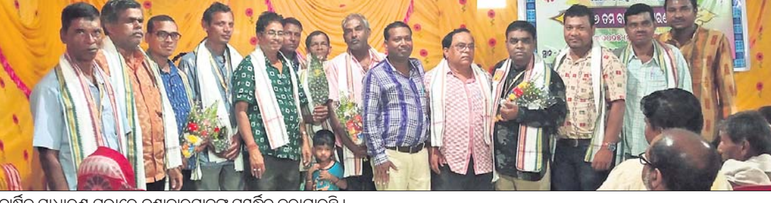
ବାର୍ଷିକ ସାଧାରଣ ସଭାରେ ବୁଢ଼ାକାରମାନଙ୍କୁ ସମ୍ବର୍ଦ୍ଧିତ କରାଯାଇଛି ।