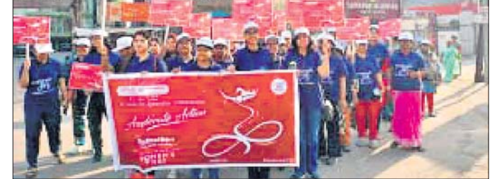
ଖାକାଧନର ବ୍ୟାଙ୍କ କର୍ମଚାରୀ ଓ ଅନ୍ୟମାନେ ସାମିଲ ହୋଇଛନ୍ତି ।