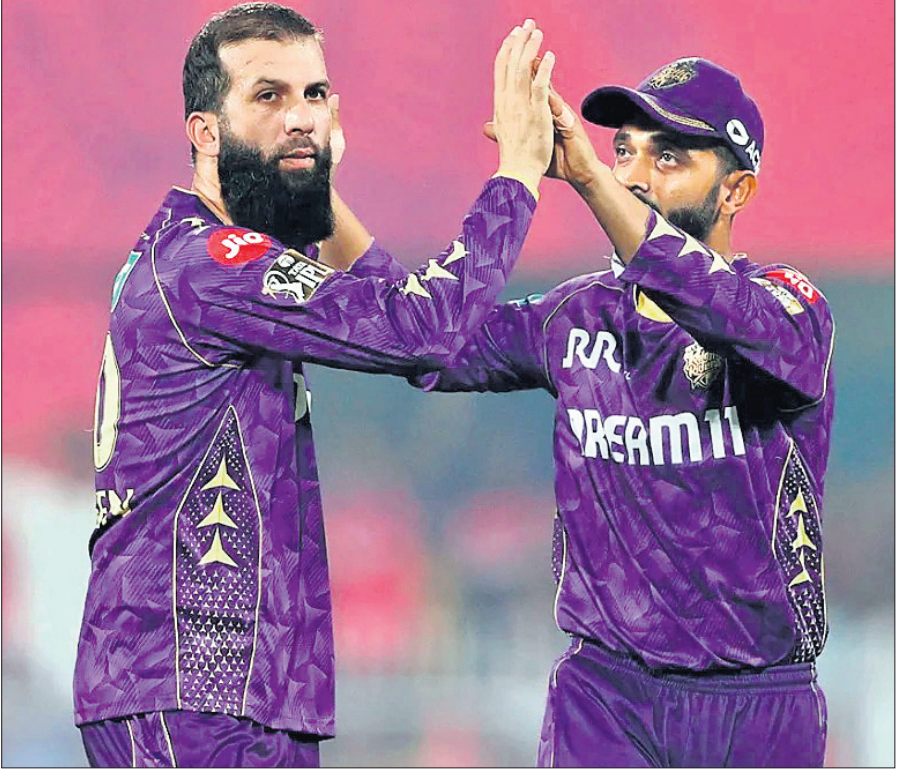
ଉଇକେଟ ନେବାପରେ ମୋଇନ ଅଲୀଙ୍କୁ ବଧେଇ ଜଣାଇଛନ୍ତି ଅଧିନାୟକ ଅଜିଙ୍କ୍ୟ ରାହାନେ।

ଗୁଆହାଟୀ, ୨୬/୩ ଆଇପିଏଲର ଛୁପବାର ଅନୁଷ୍ଠିତ ମ୍ୟାଚରେ କୋଲକାତା ନାଇଟ ରାଇଡର୍ସ ୮ ରନରେ ବିଜୟ ହାସଲ କରିଛନ୍ତି। ବୋଲରଙ୍କ ପ୍ରଭାବୀ ପ୍ରଦର୍ଶନ ପରେ ବିଜୟ ଟିକେଟ ଯୋଗ୍ୟ ପୁଣି ଇନ୍‌ଫିନିଟି କୋଲକାତା ବିଜୟ ହାସଲ କରିଛି। ରାଜସ୍ଥାନ ରୟାଲ୍ ୨୦ ଓଭରରେ ୯ ରନରେ ହରାଇ ୧୫୧ ରନ କରିଥିଲା। ୧୫୨ ରନ ବିଜୟ ଲକ୍ଷ୍ୟର ପିଛା କରି କୋଲକାତା ୧୭.୩ ଓଭରରେ ୨ ରନରେ ହରାଇ ୧୫୩ ରନ