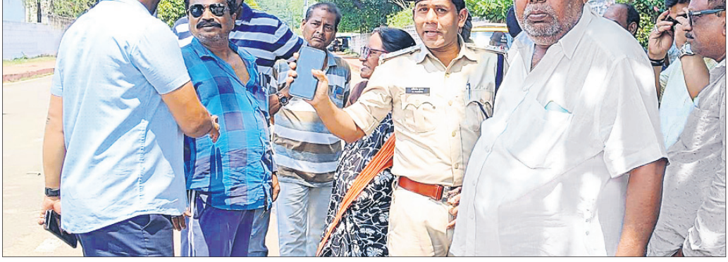
ଅଞ୍ଚଳବାସୀଙ୍କ ସହ ପୋଲିସ୍ ଆଲୋଚନା କରୁଛି।