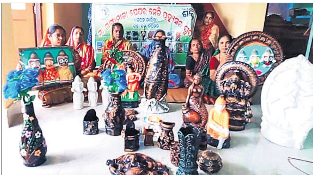
ମହିଳାମାନଙ୍କ ଦ୍ୱାରା ପ୍ରସ୍ତୁତ ସାମଗ୍ରୀ ।