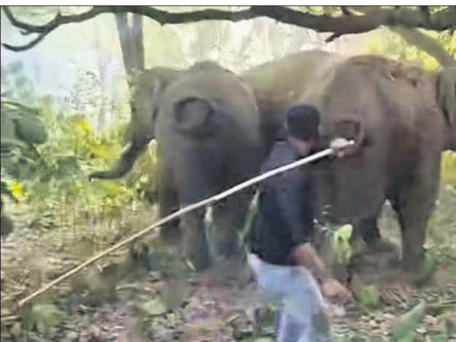
ଜଣେ ଯୁବକ ହାତୀପଲଙ୍କୁ ଠେଙ୍ଗାରେ ପିଟୁଛନ୍ତି ।

କେନ୍ଦୁଝର ଜିଲ୍ଲାରେ ହାତୀ ଉପଦ୍ରବ ଲାଗି ରହିଛି । ବନ ବିଭାଗ ହାତୀ ଘଉଡ଼ାଇବାକୁ ପ୍ରୟାସ କରୁଛି । ମାତ୍ର ଅନେକ ସମୟରେ ଲୋକେ ହାତୀ ଘଉଡ଼ାଇବାକୁ ବ୍ୟକ୍ତିଗତ ଭାବେ ନାନା ଉପାୟ ଅବଲମ୍ବନ କରୁଛନ୍ତି, ଯାହା ଫଳରେ ହାତୀ ବ୍ୟତିବ୍ୟସ୍ତ ହୋଇ ଅଧିକ ପ୍ରତିକ୍ରିୟାଶୀଳ ହୋଇ ଆକ୍ରମଣ କରୁଛି । ଏଭଳି ହାତୀପଲଙ୍କୁ ଜଣେ ଯୁବକ ଠେଙ୍ଗାରେ ପିଟୁଥିବା ଭିଡ଼ିଓ ଏବେ ଭାଇରାଲ ହେଉଛି । ଭିଡ଼ିଓ କେଉଁ ଅଞ୍ଚଳର ଜଣାପଡ଼ି ନ ଥିବା ବେଳେ ଯୁବକଙ୍କ ଏଭଳି ଆଚରଣକୁ ବନ୍ୟପ୍ରାଣୀ ବିଶେଷଜ୍ଞ ନାପସନ୍ଦ କରିବା ସହ କାର୍ଯ୍ୟାନୁଷ୍ଠାନ ଦାବି କରିଛନ୍ତି । ପ୍ରକାଶ ଯେ, ହାତୀଙ୍କ ଗତିପଥ ନିରୀକ୍ଷଣ କରିବାକୁ ବନ ବିଭାଗ ପକ୍ଷରୁ ବ୍ୟାପକ ପଦକ୍ଷେପ ନିଆଯାଉଛି । ଏନେଇ ସ୍ମୃତ୍ ନିୟୋଜିତ ହୋଇଥିବା ବେଳେ ଦୈନିକ ରିପୋର୍ଟ ପ୍ରଦାନ କରାଯାଉଛି । ମାତ୍ର ଲୋକେ ହାତୀକୁ ଘଉଡ଼ାଇବାକୁ ପଥ ନ ମାଡ଼ କରିବା ସହ ଠେଙ୍ଗାରେ ପିଟୁଛନ୍ତି । ହାତୀଙ୍କ ପାଖକୁ ନ ଯିବାକୁ ବନ ବିଭାଗ ସଚେତନ କରୁଛି । ଏହା ସତ୍ତ୍ୱେ ଅନେକ ସ୍ଥାନରେ ଲୋକେ ହାତୀ ପାଖକୁ ଯାଇ ବିରକ୍ତ କରୁଥିବା ଅଭିଯୋଗ ହେଉଛି । ଏଭଳି ହାତୀଙ୍କୁ ପିଟିବା ଓ ସେମାନଙ୍କୁ ଚିଡ଼ାଇବା ଭିଡ଼ିଓ ଭାଇରାଲ ହେଉଛି ।