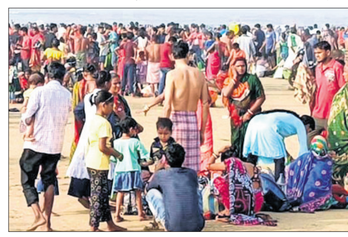
ଶ୍ରଦ୍ଧାଳୁମାନେ ପୂଜାର୍ଚ୍ଚନା କରୁଛନ୍ତି।