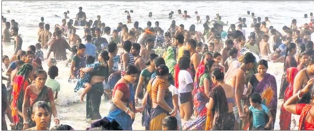
କଷାପକ ବାବୁଣୀ ମେଳାରେ ଶ୍ରଦ୍ଧାକୁମାନେ ବୁଡ଼ି ପକାଇଛନ୍ତି।

ବାଲେଶ୍ୱର(ବାଞ୍ଛାନିଧି ସେ)/ ଲଙ୍ଗଳେଶ୍ୱର (କମଳାକାନ୍ତ ଦାସ), ୨୭୩