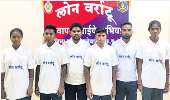
ଆତ୍ମହତ୍ୟା କରିଥିବା ମାଓବାଦୀ।

ଆତ୍ମହତ୍ୟା କରିଛନ୍ତି। ଝଟିଗଡ଼ରେ ଉନ୍ନତମୂଳକ କାର୍ଯ୍ୟ ଓ ଆତ୍ମହତ୍ୟା କରୁଥିବା ମାଓବାଦୀଙ୍କୁ ସରକାରଙ୍କ ତରଫରୁ ଯୋଗାଣଦେଉଥିବା ସୂଚନା ସୁଯୋଗରେ ଅନୁସନ୍ଧାନ ହୋଇ ଏମାନେ ସମାଜର ମୁଖ୍ୟସ୍ତୋତରେ ସାମିଲ ହେବା ପାଇଁ ନିଷ୍ପତ୍ତି ନେଇ ଆତ୍ମହତ୍ୟା କରିଥିବା କହିଛନ୍ତି। ପୋଲିସ୍ ତରଫରୁ ସମସ୍ତଙ୍କୁ ୨୫ ହଜାର ଟଙ୍କା ଲୋକାଏର ଚେକ୍ ପ୍ରଦାନ କରାଯିବ। ଏହି ସରକାରଙ୍କ ଉଦ୍ଦେଶ୍ୟ ନାହିଁ ଅନୁଯାୟୀ ସମସ୍ତଙ୍କୁ ସୁଯୋଗ ଯୋଗାଣ ଦିଆଯିବ ବୋଲି ପୋଲିସ୍ ସୂଚନା ଦେଇଛନ୍ତି।