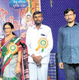
ମଞ୍ଚରେ ସମ୍ବର୍ଦ୍ଧିତ କରାଯାଉଛି ।