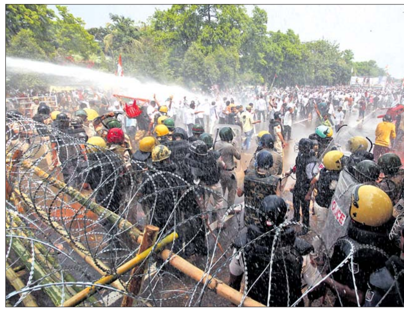
ଭୁବନେଶ୍ୱର ଗାନ୍ଧୀମାର୍ଗରେ ଗୁରୁବାର କଂଗ୍ରେସର ବିରୋଧ ବେଳେ ଚେୟାର, ପଥର ଫିଙ୍ଗାଯାଇଛି। ବିରୋଧକାରୀଙ୍କୁ ଅଟକାଇବା ପାଇଁ ପୋଲିସ ପକ୍ଷରୁ ପାଣିମାଡ଼।

ଭୁବନେଶ୍ୱର, ୨୭/୩ (ରବିବାରାହଣ୍ୟ କେନା/ସତ୍ୟଜିତ ରାଉତ)