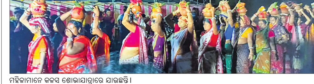
ମହିଳାମାନେ କଳ୍ପ ଶୋଭାଯାତ୍ରାରେ ଯାଉଛନ୍ତି।

ଅରବିନ୍ଦ ଦାସଙ୍କ ଦ୍ୱାରା ୫୧ ଘଟ ଉତ୍ତୋଳନ କରାଯାଇ ଗହଳାମୁଣ୍ଡା ପଡ଼ାସିଆ ଗ୍ରାମ ପରିକ୍ରମା ମାଧ୍ୟମରେ ସଂକୀର୍ତ୍ତନ ଭୋକ ମହୁଡ଼ା ବାଦ୍ୟ ସହ ଯଜ୍ଞ ମଣ୍ଡପକୁ ଅଣାଯାଇ ଗ୍ଲାନା କରାଯାଇଥିଲା। ରାଧାକୃଷ୍ଣଙ୍କ ମୂଳତ ଚଳିତ ପ୍ରତିମାକୁ ଯଜ୍ଞବେଦୀରେ ଗ୍ଲାନା କରାଯାଇ ପୂଜାର୍ଚ୍ଚନା କରାଯାଇଥିଲା। ଉକ୍ତ ନାମୟଙ୍କରେ ଆଖପାଖ ପ୍ରାୟ ୫୦ରୁ ଉର୍ଦ୍ଧ୍ୱ ଗ୍ରାମର ଜନସାଧାରଣ ସହଯୋଗ କରୁଛନ୍ତି।