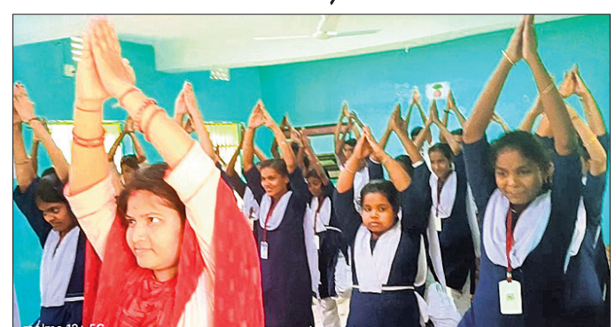
ଛାତ୍ରମାନେ ଯୋଗ କରୁଛନ୍ତି ।

ସ୍ୱୟଂସହାୟକ ଗୋଷ୍ଠୀର ମହିଳାମାନେ । ୨୦୨୨ରୁ ଗଠନ ହୋଇଥିବା ଏହି ଗୋଷ୍ଠୀର ୨୦ଜଣ ମହିଳା କାଗଜକୁ ବିଭିନ୍ନ ଠାକୁରଙ୍କ ସୁନ୍ଦର ପ୍ରତିମା, ଫୁଲଦାନୀ, କଳମ ଖୁଣ୍ଟ ଆଦି କଳାକୃତି ତିଆରି କରୁଛନ୍ତି। ତେବେ ଉତ୍ପାଦିତ ସାମଗ୍ରୀ ଠିକ୍ ଭାବେ ବିକ୍ରି ହୋଇପାରୁ ନାହିଁ। ଏଥିପ୍ରତି ସରକାର ଦୃଷ୍ଟି ଦେଇ ବିକ୍ରୟ ପାଇଁ ପ୍ରୟୋଗ ସୃଷ୍ଟି କଲେ ସେମାନେ ଅଧିକ ରୋଜଗାର କରିବା ସହ ବ୍ୟବସାୟକୁ ବଢ଼ାଇ ପାରନ୍ତେ ବୋଲି ଗୋଷ୍ଠୀର ସଭାପତିମାନେ କହିଛନ୍ତି।