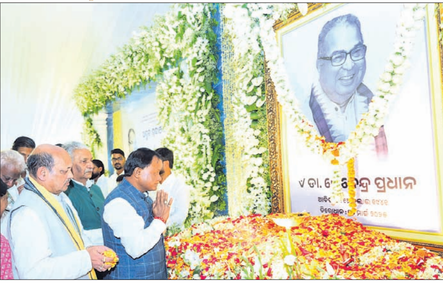
ପୂର୍ବତନ କେନ୍ଦ୍ରମନ୍ତ୍ରୀ ଡା. କେ.ବେନ୍ଦ୍ର ପ୍ରଧାନଙ୍କ ଏକାଦଶୀ ଅବସରରେ ଗୁରୁବାର ଅନୁଗୋଳ ଜିଲ୍ଲା ତାଳଚେର ପିଏମ୍‌ଆଇଟିଠାରେ ପୁଷ୍ୟମନ୍ତ୍ରୀ ମୋହନ ଚରଣ ମାଝୀ, ରାଜ୍ୟ ଭାଜପା ସଭାପତି ମନମୋହନ ସାମଲ ପ୍ରମୁଖ ଶ୍ରଦ୍ଧାଞ୍ଜଳି ଅର୍ପଣ କରୁଛନ୍ତି।

ଲକ୍ଷ୍ମୀ ପୁନର୍ବାସ କେନ୍ଦ୍ରରେ ୪ ଭିନ୍ନଭିନ୍ନ ପିଲାଙ୍କ ମୃତ୍ୟୁ, ୩୫ ଅସୁସ୍ଥ ଲକ୍ଷ୍ମୀ, ୨୭୩୩ ଉତ୍ତରପ୍ରଦେଶର ଲକ୍ଷ୍ମୀରେ ଥିବା ଏକ ସରକାରୀ ଭିନ୍ନଭିନ୍ନ ପୁନର୍ବାସ କେନ୍ଦ୍ରରେ ୪ ଜଣଙ୍କ ପିଲାଙ୍କ ମୃତ୍ୟୁ ଘଟିବା ସହ ୩୫ ଜଣ ଅସୁସ୍ଥ ହୋଇ ସହରର ବିଭିନ୍ନ ହସ୍ପିଟାଲରେ ଭର୍ତ୍ତି ହୋଇଛନ୍ତି। ସେମାନଙ୍କ ମଧ୍ୟରୁ ୨୦ ଜଣଙ୍କ ଅବସ୍ଥା ଗୁରୁତର ରହିଛି। ପିଲାମାନଙ୍କଠାରେ ତାଳଚିଆ ଭଳି ଲକ୍ଷଣ ଦେଖାଦେଇଥିବାରୁ ଜଳ ପ୍ରଦୂଷଣରୁ ଏଭଳି ସମସ୍ୟା ସୃଷ୍ଟି ହୋଇଥିବା ସନ୍ଦେହ କରାଯାଇଛି। ଭିନ୍ନଭିନ୍ନ ପାଇଁ ଉଦ୍ଦିଷ୍ଟ ଏହି ସେଲ୍‌ର ହୋମ୍‌ରେ ୧୪୬ ଜଣ ପିଲା ରହୁଥିଲେ।