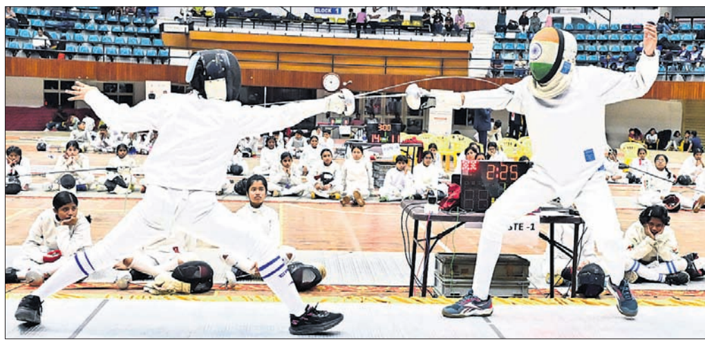
ଜାତୀୟ ସର୍ବଜୁନିୟର ଫେନ୍ସିଂ ପ୍ରତିଯୋଗିତାରେ ଭାଗ ନେଇଥିବା ଦୁଇ ପ୍ରତିଯୋଗୀ।