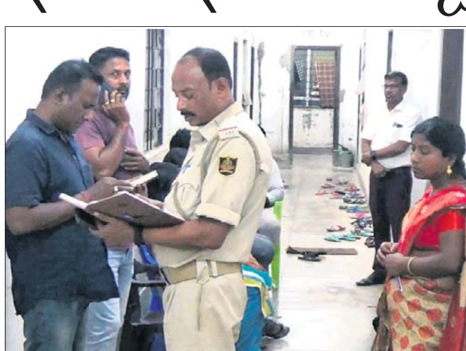
ହଷ୍ଟେଲ ପରିସରରେ ପୋଲିସ୍ ତଦନ୍ତ କରୁଛି ।