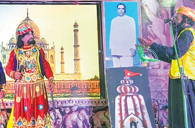
ମଞ୍ଚରେ ମୋଗଲ ଚାମସା ପରିବେଷଣ ।