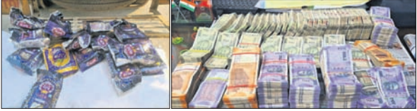
ଜବତ ଗୁରୁତ୍ୱା ଓ ଟଙ୍କା।

ଲୋକଙ୍କୁ ଧମକ ଦେଇଥିଲେ। ଯତ୍ୟାତ୍ୟା ସମ୍ପର୍କରେ ପଡ଼ିତାଳ ବାପାଙ୍କ ଅଭିଯୋଗକ୍ରମେ ଜରଡ଼ା ଥାନାରେ ନଂ.୨୨/୦୮ରେ ମାମଲା ରୁଜୁ ହୋଇଥିଲା।