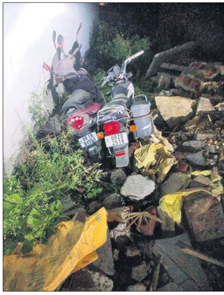
ଏହି ବାଇକ ନମ୍ବରରେ ଚାଲାଣ ଆସିଛି।