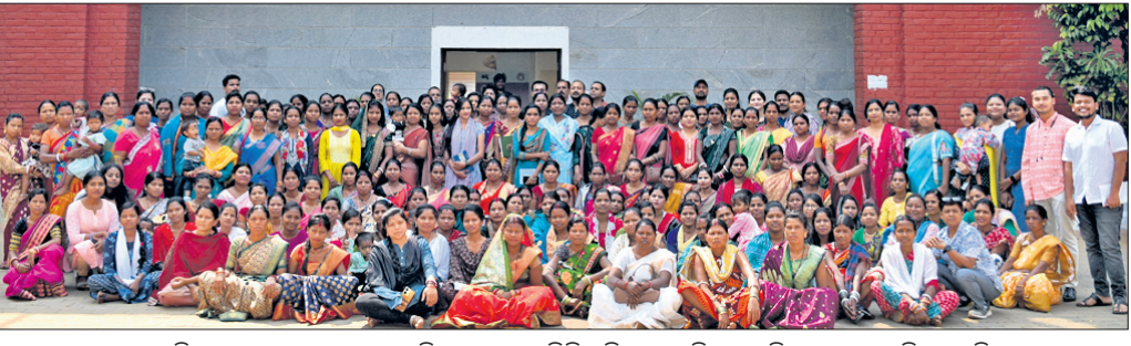
ଗ୍ରାନ୍ ଶକ୍ତିର ଶୁଭାରମ୍ଭ ଅବସରରେ ଅତିଥିକ ସମେତ ବିଭିନ୍ନ ଜିଲାରୁ ଆସିଥିବା ମହିଳାମାନେ ଉପସ୍ଥିତ ଅଛନ୍ତି । ଭୁବନେଶ୍ୱର, ୨୮ମାର୍ଚ୍ଚ

ସାଲାରୀସାଲାରୀ କ୍ୟାମ୍ପେନ୍ ମାଧ୍ୟମରେ ଆମେ ଏସ୍‌ଏମ୍‌ପିକୁ ନେଇ ସଚେତନତା ବୃଦ୍ଧିକରି ଏହି ବ୍ୟବଧାନକୁ ଦୂରକରିବାକୁ ଲକ୍ଷ୍ୟ ରଖୁଛୁ, ଯାହା ପୂର୍ବନିର୍ଦ୍ଧାରିତ ପ୍ରତିକ୍ଷେପରେ ସ୍ଥାୟୀ ନଗଦ ପ୍ରାପ୍ତ ବାଣ୍ଟିବା ନିବେଶକଙ୍କ ପାଇଁ ଏହାକୁ ଅଧିକ ପ୍ରାସଙ୍ଗିକ କରିବ । ଏହାକୁ ଏକ ଡାକ୍ତାଗତ, ବେତନ-ଭଳି ଆୟ ଭାବେ ନୂଆ ରୂପ ପ୍ରଦାନକରି ଆମେ ଏହାର ବୈତ୍ତ ଲାଭ ସମ୍ପର୍କରେ ସଚେତନତା ବଢ଼ାଇବାକୁ ଚାହୁଁଛୁ, ଯାହା ସମାପ୍ୟ ଅଭିକୃଷ୍ଣି ପାଇଁ ବଳକା ପାଣ୍ଡିର ନିବେଶ ବକାୟ ରଖିବା ସହ ତରଳତା ସୂଚିତ କରିବ । ଏହି କ୍ୟାମ୍ପେନ୍ ଅଂଶ ଭାବେ ବନ୍ଧନ ମ୍ୟୁଚୁଆଲ ଫଣ୍ଡ ଏକ ପିଲ୍ଲ ଉଦ୍ଦେଶ୍ୟ କରିଛି, ଯାହା ଏକ ସମ୍ପର୍କିତ ଅନୁକରଣ କରୁଛି ; ଯିଏକି ନିଜର ଅବସର ପରବର୍ତ୍ତୀ ଆର୍ଥିକ ଭବିଷ୍ୟତ ସୁରକ୍ଷିତ ଅଛି ବୋଲି ବିଶ୍ୱାସ କରୁଛନ୍ତି ଏବଂ ସହଯୋଗ ପାଇଁ ନିଜର ସୁସ୍ଥାପିତ ପିଲାମାନଙ୍କ ଉପରେ ନିର୍ଭର କରୁଛନ୍ତି । ହାସ୍ତ୍ୟାଗତ ଓ ପ୍ରାସଙ୍ଗିକତା ମାଧ୍ୟମରେ ଏହି ପିଲ୍ଲ ଦର୍ଶକମାନଙ୍କୁ କେବଳ ସମ୍ପର୍କିତ ସଂଗ୍ରହ କରିବାକୁ ଆମକୁ ବଢ଼ିବା ଏବଂ ସେମାନେ କିଭଳି ଏକ ସଂରଚିତ, ନିବେଶଭିତ୍ତିକ ଆୟ ମାଧ୍ୟମରେ ଆର୍ଥିକ ସ୍ୱାଧୀନତା ହାସଲ କରିପାରିବେ ସେ ସମ୍ପର୍କରେ ବିଚାର କରିବାକୁ ଅନୁପ୍ରାଣିତ କରୁଛି । ଖ୍ରୀ-ଏକ ଶୁଣ୍ଠିକିତ ମାଧ୍ୟମ ଭାବେ ବ୍ୟାପକ ଲୋକପ୍ରିୟତା ହାସଲ କରିଥିବାବେଳେ ସ୍ଥାୟୀ ଆର୍ଥିକ ସ୍ୱାଧୀନତା ପାଇଁ ଏସ୍‌ଏମ୍‌ପିକୁ ଏକ ରଣନୀତି ଭାବେ ଉପଯୋଗ କରାଯାଇନାହିଁ । ହାସ୍ତ୍ୟାଗ୍