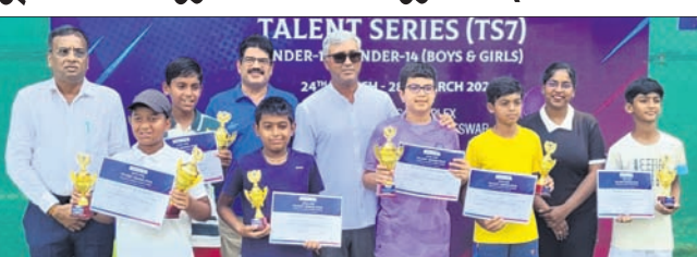
ଅତିଥିକ ଗହଣରେ ପ୍ରତି ସହ କୃତୀ ପ୍ରତିଯୋଗୀମାନେ।