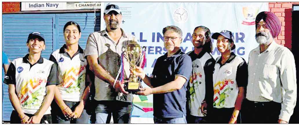
ଚୁପ୍ ସହ କିଟ୍ ମହିଳା ରୋଇଂ ଦଳ।

ବେଙ୍ଗାଳୁରୁ, ୨୮ମା (ପି.ଟି.): ଏକଦିନିଆଁ ପୁନାଲ ଛେଡ଼ାକୁ ନେଇ ବଳିୟାନ ପୂର୍ବତନ କପ୍ ବିକେଟା ବେଙ୍ଗାଳୁରୁ ଏଫସି ଶନିବାର ଇଣ୍ଡିଆନ୍ ସୁପର ଲିଗ୍ (ଆଇଏସ୍‌ଏଲ୍)ର ଏକ ଗୁରୁତ୍ୱପୂର୍ଣ୍ଣ ନକ୍ ଆଉଟ ମ୍ୟାଚରେ ଆୟୋଜକ ମୁଖ୍ୟ ବିଟି ଏଫସିକୁ ଭେଟିବ। ମ୍ୟାଚ ଛିଟି ସେମିଫାଇନାଲରେ ପ୍ରବେଶ କରିବା ଲାଗି ଦଳର ଲକ୍ଷ୍ୟ ରହିଛି। ଭେଟେରାନ ଫରମ୍‌ପ୍ରାଡ଼ି ଛେଡ଼ା ନିକଟରେ ଅବସରରୁ ଅବସରଗ୍ରସ୍ତ ପଦାର୍ଥଣ କରିଛନ୍ତି। ଚଳିତ ସିଜନରେ ସେ ଇତିମଧ୍ୟରେ ୪ ପେନାଲ୍‌ଟିକୁ ଗୋଲରେ ପରିଣତ କରିଛନ୍ତି। ଆଇଏସ୍‌ଏଲ୍ ଇତିମଧ୍ୟରେ ମୁଖ୍ୟ ବିଟି ଦଳ ବିପକ୍ଷରେ ସେ ପ୍ରଥମ ଖେଳାଳି ଭାବେ ୧୦ ଗୋଲ୍ ଷ୍ଟୋର କରିପାରିଛନ୍ତି। ଆଇଏସ୍‌ଏଲ୍ ପ୍ରେମରେ ଛେଡ଼ା ୧୦ ଗୋଲ୍ ଷ୍ଟୋର କରିଛନ୍ତି। ପ୍ରତିଯୋଗିତାରେ ଅନ୍ୟ ଯୋଡ଼ିକା ସି ଖେଳାଳିଙ୍କୁ ଚୁଲଟାରେ ଏହା ସର୍ବାଧିକ। ସେ ପୁଣି ଥରେ ଫରକ ଆଣିବା ଲକ୍ଷ୍ୟରେ ରହିବେ। ଗତ ୪ ପ୍ରେମରେ ଖେଳି ସେ ଟିନାରିରେ ଗୋଲ୍ ଷ୍ଟୋର କରିବାରେ ସଫଳ ରହିଛନ୍ତି। ଭାରତୀୟ କ୍ରିକେଟ୍ ମୁଖ୍ୟ ଦଳର ବ୍ୟାକଲାଉର୍ ପାଇଁ ବଡ଼ ବିପଜ୍ଜନକ ସାଧ୍ୟ ପାଇଁ ପାରନ୍ତି। ବେଙ୍ଗାଳୁରୁ ଦଳ ୨୪ଟି ମ୍ୟାଚ ଖେଳି ୧୧ ବିଜୟ ଓ ୫ ଡ୍ର ସହିତ ୩୮ ପଏଣ୍ଟ ସହ ପଏଣ୍ଟ ଟେବୁଲର ତୃତୀୟ ସ୍ଥାନରେ ରହିଛି। ଅନ୍ୟପକ୍ଷରେ ମୁଖ୍ୟ ବିଟି ଏଫସି ଲିଗ୍ ପାର୍ଯ୍ୟାୟରେ ଏହାର ଅନ୍ତିମ ମ୍ୟାଚରେ ବେଙ୍ଗାଳୁରୁ ଏଫସିକୁ ୨-୦ ଗୋଲରେ ପରାସ୍ତ କରି ୬ଷ୍ଠ ସ୍ଥାନ ସହ ପ୍ରେମରେ ପ୍ରବେଶ କରିଥିଲା। ଲିଗ୍ ପାର୍ଯ୍ୟାୟ ଶେଷରେ ଟେବୁଲର ତମ୍ ୨ ଦଳ ମୋହନ ବାଗାନ ପୁଅର ଜ୍ୟେଷ୍ଠ ଓ ଏଫସି ଗୋଆ ଆପେ ସେମିଫାଇନାଲରେ ପ୍ରବେଶ କରିଛନ୍ତି। ତୃତୀୟ ୬ଷ୍ଠ ସ୍ଥାନ ମଧ୍ୟରେ ରହିଥିବା ଦଳ ଏକ ସିଙ୍ଗଲ -ଲେଉ ନକ୍ ଆଉଟ ଖେଳିବେ।