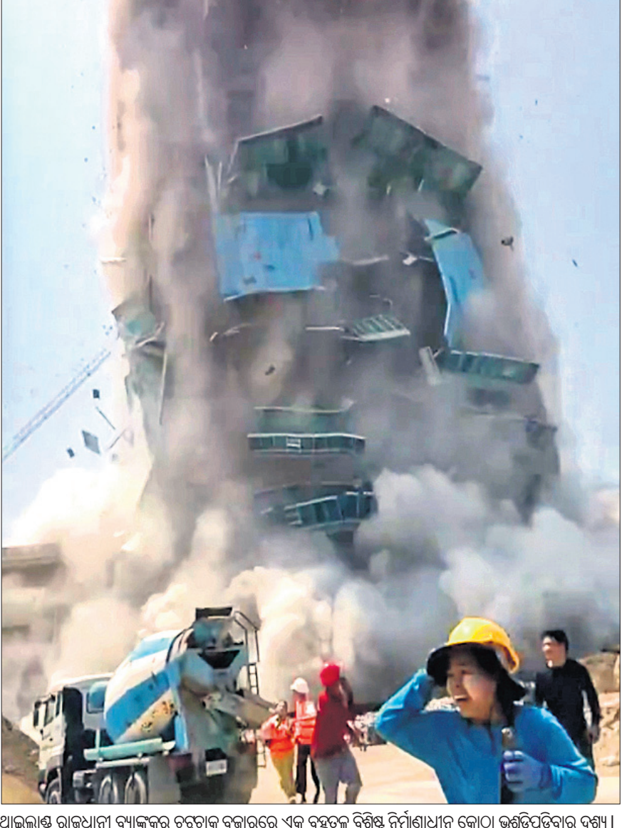
ଥାଇଲାଣ୍ଡ ରାଜଧାନୀ ବ୍ୟାଙ୍କର ଚତୁର୍ଥାଂଶ ବଜାରରେ ଏକ ବହୁତଳ ବିଶିଷ୍ଟ ନିର୍ମାଣାଧୀନ କୋଠା ଭୃତ୍ତିପଡ଼ିବାର ଦୃଶ୍ୟ।

ସୁନା ଦର ଶୁକ୍ରବାର ୧୦ ଗ୍ରାମ ପ୍ରତି ୧,୧୦୦ ଟଙ୍କା ବୃଦ୍ଧି ପାଇ ଲାଟାୟ ରାଜଧାନୀରେ ୯୨,୧୫୦ ଟଙ୍କାରେ ପହଞ୍ଚିଛି। ବିଦେଶୀ ବଜାରରେ ସୁନା ଦର ବଢ଼ିଥିବାରୁ ଘରୋଇ ବଜାରରେ ମହଙ୍ଗା ହୋଇଥିବା ଅଲ୍ ଇଣ୍ଡିଆ ସରକାରୀ ଆସୋସିଏଶନ କହିଛି।