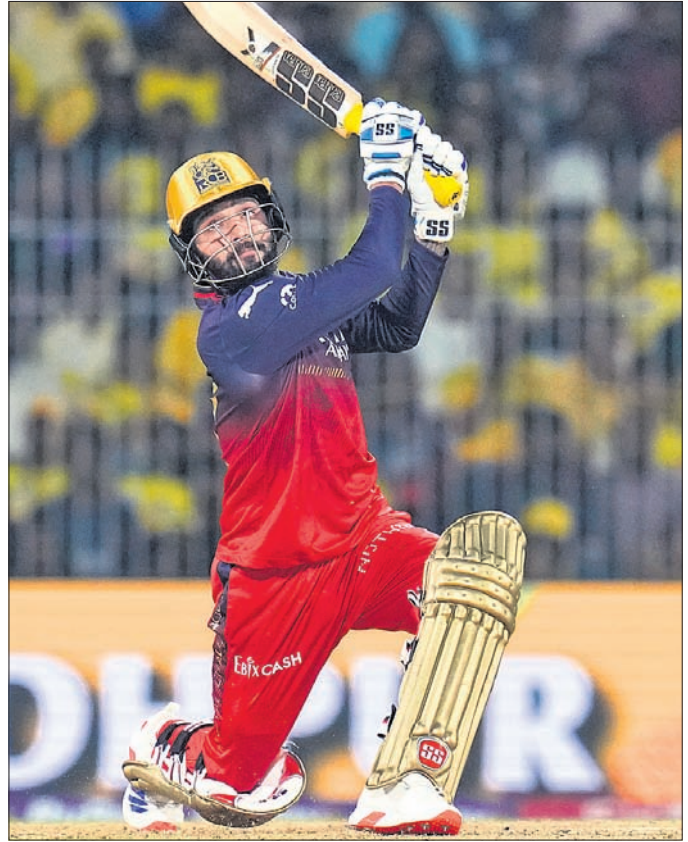
ଶର୍ବ ଖେଳିବା ଅବସରରେ ରଜତ ପଟ୍ଟିବାର।

ଚେନାଇ, ୨୮ମା ଏମଏ ବିଦାୟରେ ଷ୍ଟୁଡିୟମରେ ଶୁକ୍ରବାର ଖେଳାଯାଇଥିବା ଆଇପିଏଲ୍ ମ୍ୟାଚରେ ରୟାଲ ଚ୍ୟାଲେଞ୍ଜର୍ସ ବେଙ୍ଗାଲୁରୁ (ଆରସିବି) ୫୦ ରନରେ ଚେନାଇ ସୁପର କିଙ୍ଗ୍ସ (ସିଏସକେ)କୁ ପରାସ୍ତ କରିଛି। ଚଳିତ ସିଜନରେ ଏହା ଆରସିବିର ଲଗାତର ଦ୍ୱିତୀୟ ବିଜୟ। ଆରସିବି ପ୍ରଥମ ୧୯୭ ରନର ଚାର୍ଜେଟ ଆଗରେ ସିଏସକେ ୮ ଉଇକେଟ ହରାଇ ୧୪୬ ରନ କରିବାକୁ ସମର୍ଥ ହୋଇଥିଲା। ଚ୍ୟୁ ଛିଟ ସିଏସକେ ଅଧିନାୟକ