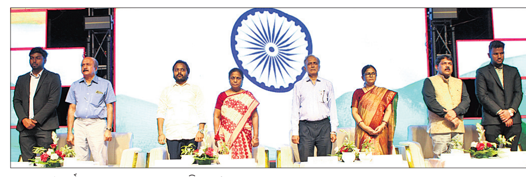
ଉଦ୍ଘାଟନା କାର୍ଯ୍ୟକ୍ରମରେ ଯୋଗଦେଇଥିବା ଅତିଥିମାନେ।