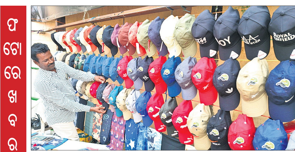
ବହୁଳି ତାଟି: କଟକ ମିଶନରୋଡ଼ ପାର୍ଶ୍ୱରେ ଜଣେ ବ୍ୟବସାୟୀ ବିକ୍ରୀ ପାଇଁ ଗୋପିପୁସ୍ତକ ସଜ୍ଜିତ କରି ରଖିଛନ୍ତି।