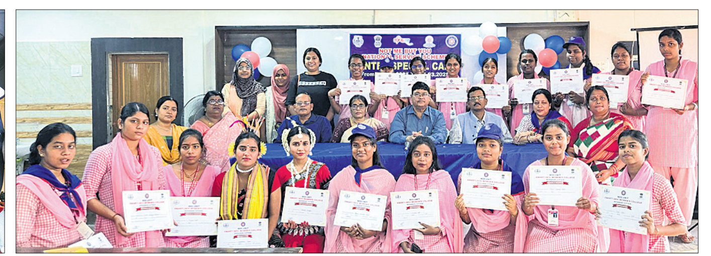
କଟକ ନୟାସଡ଼କସ୍ଥିତ ଇମର୍ସା ଦେବୀ ମହିଳା ମହାବିଦ୍ୟାଳୟରେ ଜାତୀୟ ସେବା ଯୋଜନାର ଶାତକାଳୀନ ଶିବିର ଉଦ୍ଘାଟନା ସମୟରେ ଉପସ୍ଥିତ ଅତିଥିଙ୍କୁ ଗହଣରେ ଛାତ୍ରମାନେ।