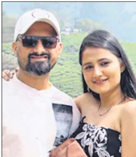
ସ୍ତ୍ରୀ ଗିରଫ କରିବା ପରେ ଗିରଫ ହେଇଥିଲା।

ବେଙ୍ଗାଳୁରୁ, ୨୮ମା ବେଙ୍ଗାଳୁରୁର ଟୋଷାକନାହଲି ଅଞ୍ଚଳରେ ଜଣେ ୩୬ ବର୍ଷୀୟ ଇଞ୍ଜିନିୟର ତାଙ୍କ ସ୍ତ୍ରୀଙ୍କୁ ହତ୍ୟା କରି ପ୍ରକାଶ କରିବା ପରେ ପୁଲିସ୍ ପକ୍ଷରୁ ଗିରଫ ହେଇଥିଲା।