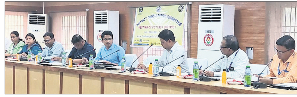
ବୈଠକରେ ଜିଲାପାଳ ଦବାରୁୟ ଭାଗବାହେବ ସିଦ୍ଧେଶ୍ୱର ସମେତ ଅନ୍ୟମାନେ।