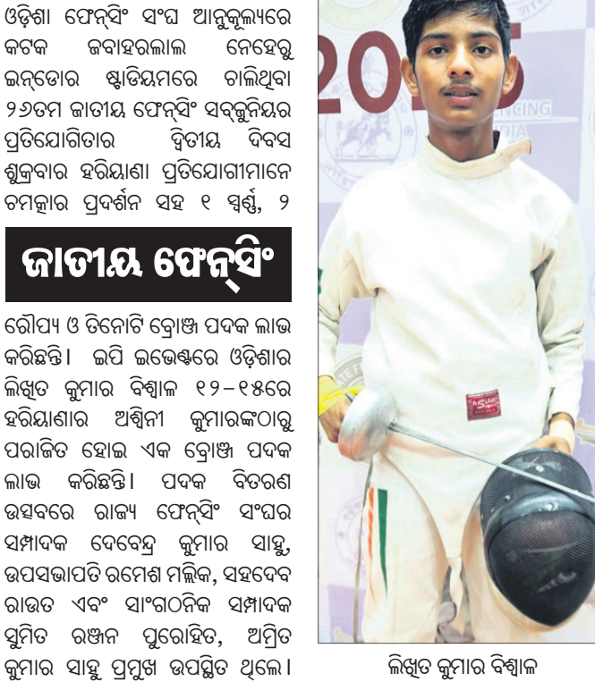
ଲିଖିତ କୁମାର ବିଶ୍ୱାଳ