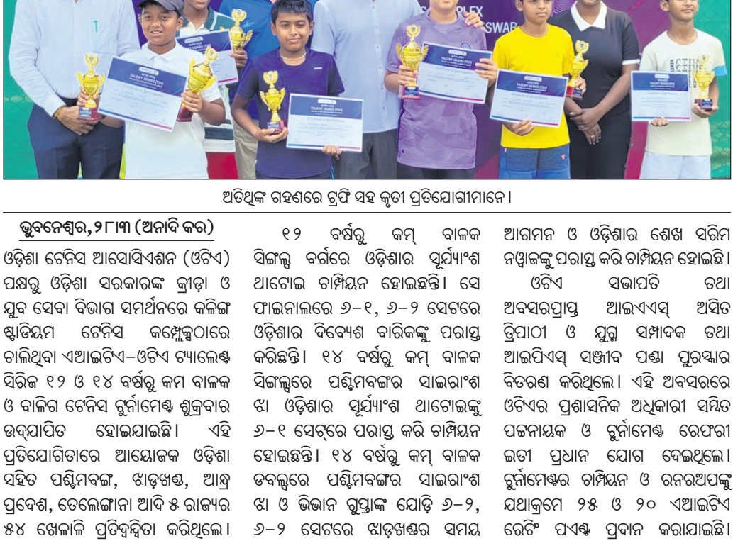
ଅତିଥି ଗଣଗରେ ଚୁଫି ସହ କୃପା ପ୍ରତିଯୋଗୀମାନେ ।