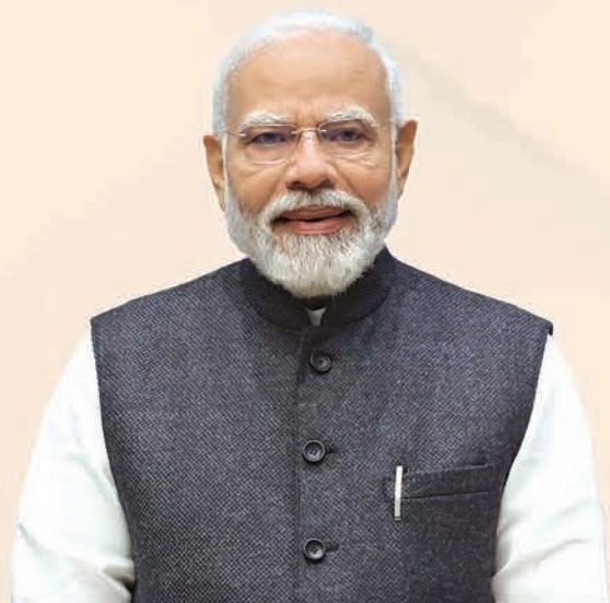
ଶ୍ରୀ ନରେନ୍ଦ୍ର ମୋଦୀ ପ୍ରଧାନମନ୍ତ୍ରୀ