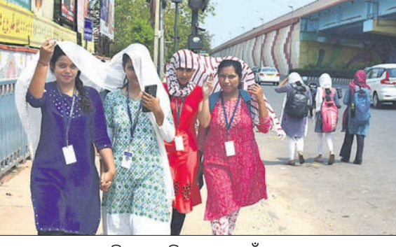
ଭୁବନେଶ୍ୱରରେ ଶନିବାର ଚାଟିରୁ ରକ୍ଷା ପାଇଁ ଯୁବତୀମାନେ ମୁଣ୍ଡରେ ଓଡ଼ଣି ଘୋଡ଼ାଇ ଯାଉଛନ୍ତି ।

ଭୁବନେଶ୍ୱର, ୨୯ମା (ଅନୁରାଧା ମହାରଣା) ରାଜ୍ୟରେ ଗ୍ରୀଷ୍ମ ପ୍ରବାହ ସହ ଗୁରୁତ୍ୱପୂର୍ଣ୍ଣ ଜନଜୀବନକୁ ଅସ୍ତ୍ରବ୍ୟସ୍ତ କରୁଛି । ଶନିବାର ସମ୍ବଲପୁରରେ ଦିନ ତାପମାତ୍ରା ସର୍ବାଧିକ ୪୨ ଡିଗ୍ରୀ ସେଲସିୟସ୍ ରେକର୍ଡ ହୋଇଛି । ସେହିପରି ହାରାକୁଦରେ ପାରଦ ୪୧.୬ ଡିଗ୍ରୀ ଛୁଇଁଥିବାବେଳେ ଝାରସୁଗୁଡ଼ାରେ ୪୧.୬, ରାଉରକେଲାରେ ୩୯.୫, ଭୁବନେଶ୍ୱରରେ ୩୮.୬,