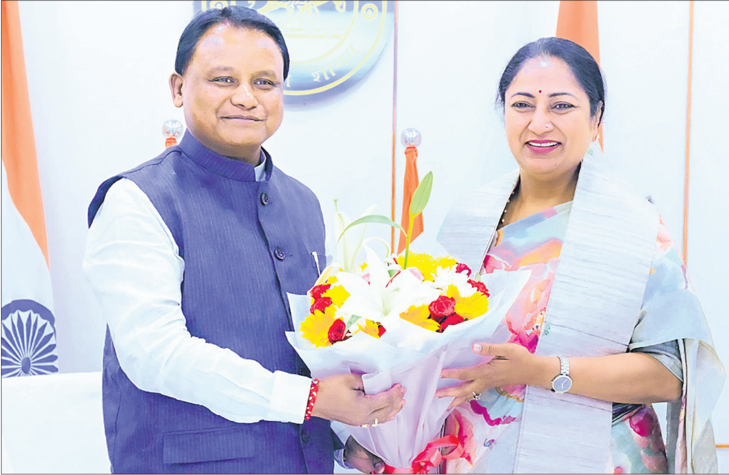
ଲୋକସେବା ଭବନରେ ଶନିବାର ମୁଖ୍ୟମନ୍ତ୍ରୀ ମୋହନ ଚରଣ ମାଝୀଙ୍କୁ ସୌଜନ୍ୟମୂଳକ ସାକ୍ଷାତ କରୁଛନ୍ତି ଦିଲ୍ଲୀ ମୁଖ୍ୟମନ୍ତ୍ରୀ ରେଖା ଗୁପ୍ତା ।