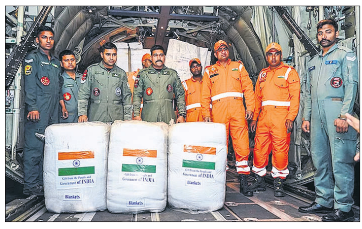
ଏନ୍ଡିଆର୍କଏଫ୍ କର୍ମଚାରୀ ମ୍ୟାନ୍ଦୀର ଭୂକମ୍ପ ପ୍ରପାଢ଼ିତକ ପାଇଁ ରିଲିଫ୍ ସାମଗ୍ରୀ ନେଇ ଗାଢ଼ିଆବାଦର ହିଣ୍ଡନ ବିମାନବନ୍ଦରୁ ବାହାରେହୁଅନ୍ତି।

■ ୫୫ ଟନ୍ ରିଲିଫ୍ ସହାୟତା ପଠାଇଲା ଭାରତ ■ ଭବ୍ବାର କାର୍ଯ୍ୟରେ ଏନ୍ଡିଆର୍କଏଫ୍ ୮୦ ଜଣିଆ ଟିମ୍