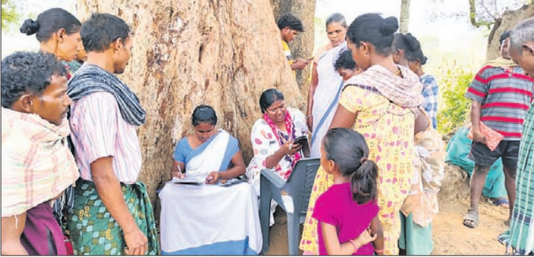
କୋଟିଆର ନେତୃତ୍ୱାଳୟ ଗ୍ରାମସ୍ଥିତ ଏକ ଗଛ ତଳେ ବସି ଲୋକଙ୍କ ଆଧାର ଅପ୍ଡେଟ୍ ଏବଂ ଇ-କେଞ୍ଚାଇଭି କରାଇଛନ୍ତି ଆନ୍ଧ୍ର ଅଧିକାରୀ।

ପଞ୍ଚାଙ୍ଗ, ୨୯୩(ଶରତ କୁମାର ଧଳ) କୋଟିଆରେ ଓଡ଼ିଶାର କ୍ଷେତ୍ରୀୟ ଅଞ୍ଚଳକୁ ପୁନର୍ବାର ଆହ୍ୱାନ ଦେବା ଭଳି କାର୍ଯ୍ୟ କରିଛନ୍ତି ଆନ୍ଧ୍ରପ୍ରଦେଶର ସରକାରୀ ଅଧିକାରୀ। ଆନ୍ଧ୍ର ପ୍ରଶାସନର ଅଧିକାରୀମାନେ ନେତୃତ୍ୱାଳୟ ଗ୍ରାମକୁ ଆସି ଲୋକଙ୍କୁ ବିଭିନ୍ନ ଯୋଜନାରେ ସାମିଲ କରିବା ପାଇଁ ପ୍ରତିଷ୍ଠିତ ଦେଇଛନ୍ତି। ଏତିକି ନୁହେଁ, ସେମାନେ ଏହି ଗ୍ରାମର ଏକ ଗଛ ମୂଳେ ବସି ଛାତ୍ରାଛାତ୍ରୀ, ବୁଢ଼ାବୁଢ଼ି, ଅଜ୍ଞାନଘାତି ପିଲାମାନଙ୍କ ଇ-କେଞ୍ଚାଇଭି କରାଇଛନ୍ତି। ଆନ୍ଧ୍ର ସରକାରଙ୍କ ବାର୍ଦ୍ଧକ୍ୟ ଭରା, ପିଲାଙ୍କୁ ମିଳୁଥିବା ଆମ୍ବାଘାତି ଯୋଜନାରେ ସେମାନଙ୍କୁ ଅନ୍ତର୍ଭୁକ୍ତ କରି ଆର୍ଥିକ ସହାୟତା ପ୍ରଦାନ ସକାଶେ ଆଶ୍ୱାସନା ଦେଇଥିବା ମଧ୍ୟ ଟ୍ରେପୁଷ୍ଟା-୮