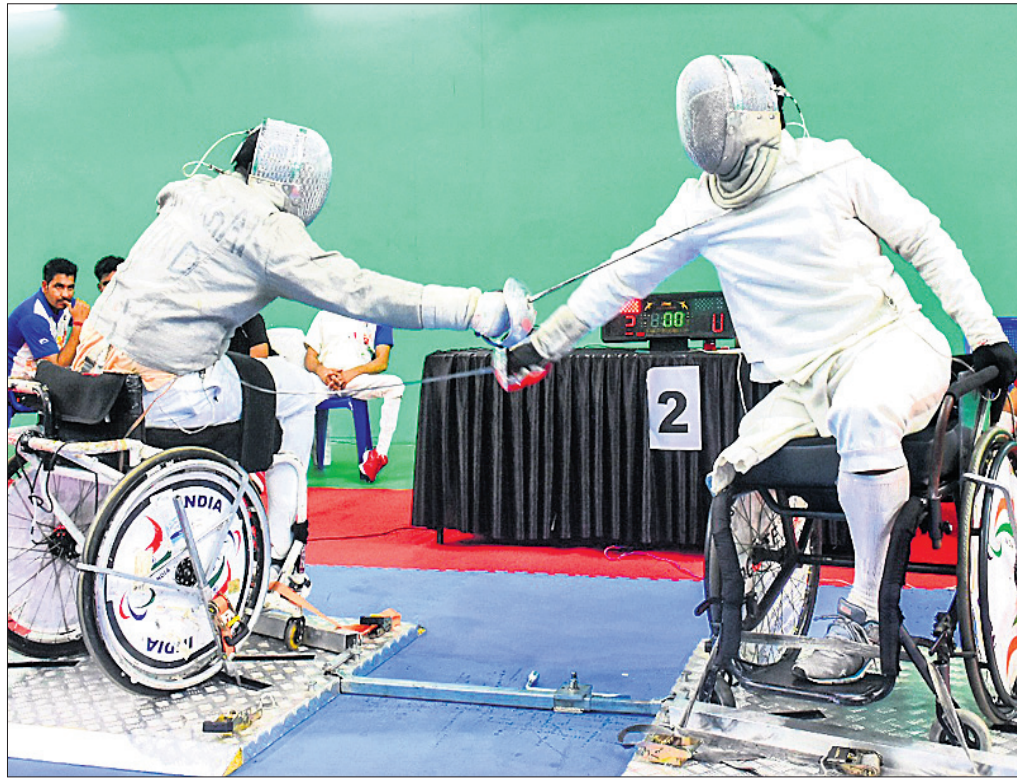
କାତୀୟ ପାରା ଫେନ୍‌ସିଂ ପ୍ରଥମ ଦିବସରେ ଦୁଇ ପ୍ରତିଯୋଗୀଙ୍କ ମଧ୍ୟରେ ମୁକାବିଲା।