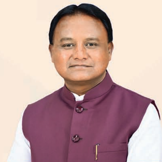
ଶ୍ରୀ ମୋହନ ଚରଣ ମାଝୀ ମୁଖ୍ୟମନ୍ତ୍ରୀ, ଓଡ଼ିଶା