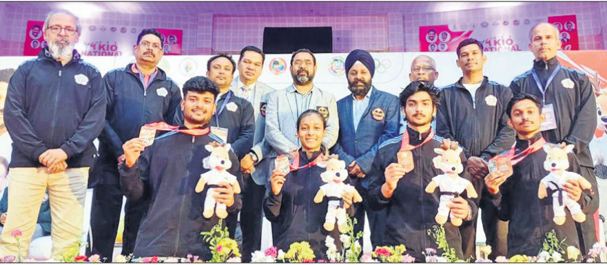
ଅତିଥିକ ଗହଣରେ ପଦକ ବିଜୟୀ କରାଟେକାରୀ।