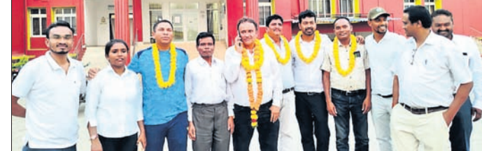
ନବନିର୍ବାଚିତ ଓଢ଼ିଳ ସଂଘ କର୍ମକର୍ତ୍ତା ।

ମାଲକାନଗିରି, ୩୦ମା (ବୃତ୍ତୋପାଧନ ପାତ୍ର) ମାଲକାନଗିରି ଜିଲ୍ଲା ଦୈନିକ ଚଳାଣୀ କାର୍ଯ୍ୟକ୍ରମ, ପରିସରରେ ଲଘୁ ଆସୋସିଏସନର ନୂତନ କର୍ମକର୍ତ୍ତା ନିର୍ବାଚନ ଶନିବାର ଅନୁଷ୍ଠିତ ହୋଇଯାଇଛି ।