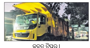
ଜବତ ଟିପ୍ପର ।

ବହୁ ଚର୍ଚ୍ଚିତ ଖଣି ମାମଲାରେ ସମ୍ପୂର୍ଣ୍ଣ ରାଜା ଚକ୍ର ମାମଲାରେ ୧୩ ଟିପ୍ପର ସେମିଲିଗୁଡ଼ା ପୋଲିସ୍ ଜବତ କରାଯାଇଛି ।