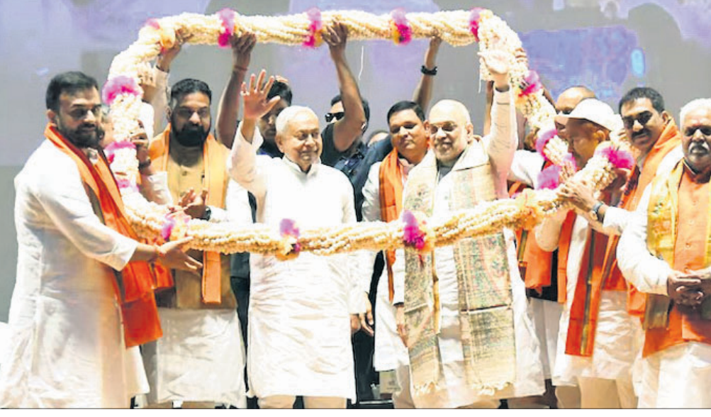
ପାଟଣାରେ ବାପୁ ଅତିଗୋପାଳନରେ ଆୟୋଜିତ ବିହାର ସମବାୟ ସମ୍ମିଳନୀରେ ପୁଖ୍ୟମନ୍ତ୍ରୀ ନୀତୀଶ କୁମାର ସହ କେନ୍ଦ୍ର ସହଯୋଗ ତଥା ସ୍ୱରାଷ୍ଟ୍ର ମନ୍ତ୍ରୀ ଅନିଲ ଶାହା ଓ ଅନ୍ୟମାନେ।