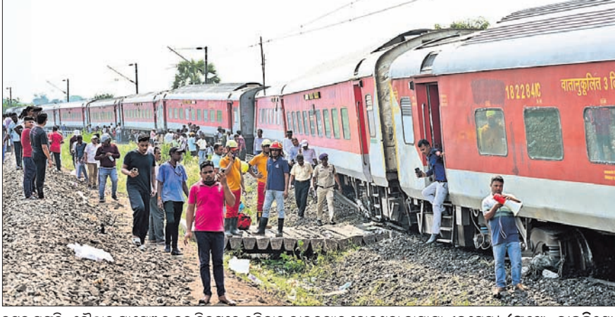
କଟକ ମଲୁକି-ଚୌଦ୍ୱାର ପାସେଞ୍ଜର ହଲୁ ନିକଟରେ ରବିବାର ଲାଇନ୍‌ରୂପେ ହୋଇଥିବା କାମାରା ଏକ୍ସପ୍ରେସ୍ ।

କଟକ/ମଲୁକି-କରମପୁର/ଚୌଦ୍ୱାର, ୩୦/୩ (କାର୍ତ୍ତିକ ସାହୁ/ଶିଶୁ ପ୍ରିୟଦର୍ଶିନୀ/ ମାନ୍ୟ ସାମଲ/ଆଶୁତୋଷ ରାୟ) ବେଙ୍ଗାଳୁରୁରୁ କାମାରା ଅଭିମୁଖେ ଯାଉଥିବା କାମାରା ଏକ୍ସପ୍ରେସ୍ କଟକ ଜିଲ୍ଲା ମଲୁକି-ଚୌଦ୍ୱାର ପାସେଞ୍ଜର ହଲୁ ନିକଟରେ