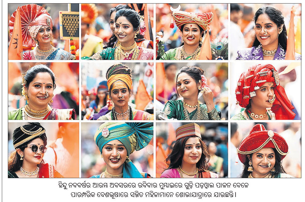
ହିନ୍ଦୁ ନବବର୍ଷର ଆରମ୍ଭ ଅବସରରେ ରବିବାର ମୁମ୍ବାଇରେ ଗୁଡ଼ି ପଡ଼଼଼ାଳ ପାଳନ ବେଳେ ପାରମ୍ପରିକ ବେଶଭୂଷାରେ ସଜିତ ମହିଳାମାନେ ଶୋଭାଯାତ୍ରାରେ ଯାଉଛନ୍ତି।

ପାକିସ୍ତାନର ଖାଇବର ପଖ୍ଟୁନ୍‌ଖ୍ଟା ପ୍ରଦେଶରେ ଆତଙ୍କବାଦୀମାନଙ୍କ ଗୁମ୍ଫା ଆକାଶରୁ ଚାର୍ଜେଜ୍ କରି ସେନା ପକ୍ଷରୁ ଡ୍ରୋନ୍ ଆକ୍ରମଣ କରାଯାଇଛି। ଏଥିରେ ୧୨ ଜଣ ଆତଙ୍କବାଦୀ ନିହତ ହୋଇଥିବାବେଳେ ୯ ସାଧାରଣ ନାଗରିକ ପ୍ରାଣ ହରାଇଛନ୍ତି। ମର୍ଦ୍ଦାନ ଜିଲ୍ଲାର କାଟଲାଙ୍ଗ ପାର୍ବତ୍ୟାଞ୍ଚଳରେ ଆତଙ୍କବାଦୀଙ୍କ ଆକାଶ ଚାର୍ଜେଜ୍ କରି ଶନିବାର ସକାଳୁ ଆକ୍ରମଣ କରା ହୋଇଥିଲା। ଜିଲ୍ଲା ଡେପୁଟି କମିଶନରଙ୍କ ନିର୍ଦ୍ଦେଶକ୍ରମେ ମର୍ଦ୍ଦାନ-ସ୍ୱାତ ମୋଟରଫ୍ରେଜ୍ ଆକ୍ରମଣ ସ୍ଥଳରୁ ୬ ଜଣ ପୁରୁଷ ଓ ୨ ମହିଳାଙ୍କୁ ମର୍ଦ୍ଦାନ ମେଡିକାଲ କମ୍ପ୍ଲେକ୍ସକୁ ସ୍ଥାନାନ୍ତର କରାଯାଇଛି। ମୃତକମାନେ ସ୍ୱାତ ଜିଲ୍ଲାର ମେସପାକ ବୋଲି ସ୍ଥାନୀୟ ଲୋକେ କହିଛନ୍ତି।