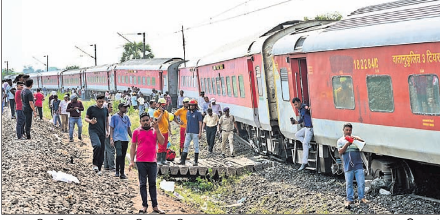
କଟକ ମଲ୍ଲି-ତୋହାର ପାସେଞ୍ଜର ହଲ୍ ନିକଟରେ ରବିବାର ଲାଇନ୍‌ରୂପେ ହୋଇଥିବା କାମାକ୍ଷା ଏକ୍ସପ୍ରେସ୍ ।

ଟ୍ରାକ୍‌ରୁ ଖସିଲା କାମାକ୍ଷା ଏକ୍ସପ୍ରେସ୍ ୧୧ ବର୍ଷ, ଜଣେ ମୃତ