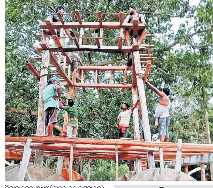
ନିର୍ବାହୀ, ୩୦/୩ (ମାନ୍ୟ ଚନ୍ଦ୍ର ପଟ୍ଟନାୟକ)

କଟଣା ପୌରାଞ୍ଚଳ ଅନ୍ତର୍ଗତ ଗଉଡ଼ ହଲ(ସ୍ତମ୍ଭ) ପରିସରରେ ଆୟୋଜିତ କାର୍ଯ୍ୟକ୍ରମରେ ବିଧାୟକ ବିଜୁକୃଷ୍ଣ ଶଙ୍କରଙ୍କରାୟ ଯୋଗ ଦେଇଥିଲେ । କଟଣା ବ୍ଲକର ୧୫ ପଞ୍ଚାୟତରାଜ ଯୋଗ୍ୟ ବିବେଚିତ ୧୮୩ ଜଣ ହିତାଧିକାରୀଙ୍କ ମଧ୍ୟରୁ ୧୨୭ହିତାଧିକାରୀଙ୍କୁ କାର୍ଯ୍ୟାଦେଶ ଦେବାକୁ ନିର୍ଦ୍ଦେଶ ଦିଆଯାଇଛି । କଟଣା ବ୍ଲକର ୧୫ ପଞ୍ଚାୟତରାଜ ଯୋଗ୍ୟ ବିବେଚିତ ୧୮୩ ଜଣ ହିତାଧିକାରୀଙ୍କ ମଧ୍ୟରୁ ୧୨୭ହିତାଧିକାରୀଙ୍କୁ କାର୍ଯ୍ୟାଦେଶ ଦେବାକୁ ନିର୍ଦ୍ଦେଶ ଦିଆଯାଇଛି । କଟଣା ବ୍ଲକର ୧୫ ପଞ୍ଚାୟତରାଜ ଯୋଗ୍ୟ ବିବେଚିତ ୧୮୩ ଜଣ ହିତାଧିକାରୀଙ୍କ ମଧ୍ୟରୁ ୧୨୭ହିତାଧିକାରୀଙ୍କୁ କାର୍ଯ୍ୟାଦେଶ ଦେବାକୁ ନିର୍ଦ୍ଦେଶ ଦିଆଯାଇଛି ।