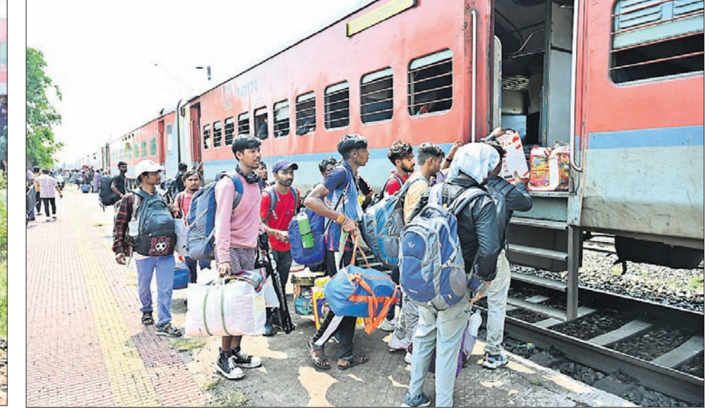
ଦୁର୍ଘଟଣା ପରେ ଅଟକ ରହିଥିବା ଯାତ୍ରୀଙ୍କୁ ସ୍ୱତନ୍ତ୍ର ଡ୍ରେନ୍‌ରେ ଗନ୍ତବ୍ୟ ସ୍ଥଳକୁ ପଠାଯାଇଛି।