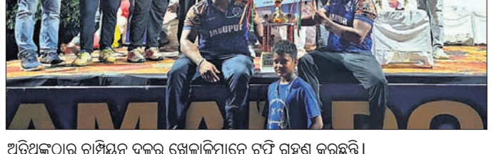
ଅତିଥିକଠାରୁ ଚାମ୍ପିୟନ ଦଳର ଖେଳାଳିମାନେ ଟ୍ରଫି ଗ୍ରହଣ କରୁଛନ୍ତି ।