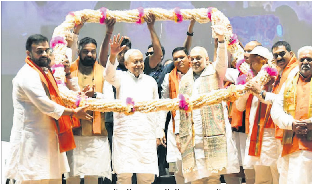
ପାଟନାର ବାପୁ ଅତିରୋଧିମ୍ବନରେ ଆୟୋଜିତ ବିହାର ସମବାୟ ସମ୍ମିଳନୀରେ ମୁଖ୍ୟମନ୍ତ୍ରୀ ନୀତୀଶ କୁମାରଙ୍କ ସହ କେନ୍ଦ୍ର ସହଯୋଗୀ ତଥା ସ୍ୱରାଷ୍ଟ୍ର ମନ୍ତ୍ରୀ ଅମିତ୍ ଶାହା ଓ ଅନ୍ୟମାନେ।