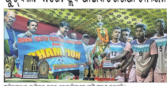
ଅତିଥିକଠାରୁ ଚାମ୍ପିୟନ ଦଳର ଖେଳାଳିମାନେ ଟ୍ରଫି ଗ୍ରହଣ କରୁଛନ୍ତି ।