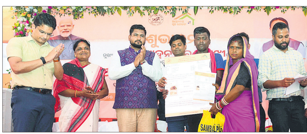
କଟକ ସଦର ବ୍ଲକ୍ କାର୍ଯ୍ୟକ୍ରମ ପରିସରରେ ଅନୁଷ୍ଠିତ କାର୍ଯ୍ୟକ୍ରମରେ ହିତାଧିକାରୀଙ୍କୁ କାର୍ଯ୍ୟକ୍ରମ ପ୍ରଦାନ କରାଯାଇଛି।

କଟକ ସଦର/ତିରିଆ/ ଆଠଗଡ଼/ ବାଙ୍କୀ, ୩୦/୩ (ପୁଣ୍ୟ ଲୁଗା ଲେନା/ କାଫର ଖାଁ/ ସତ୍ୟ ପ୍ରସାଦ ରଥ/ ଛାନେନ୍ଦ୍ର ମୋହନ ମିଶ୍ର)