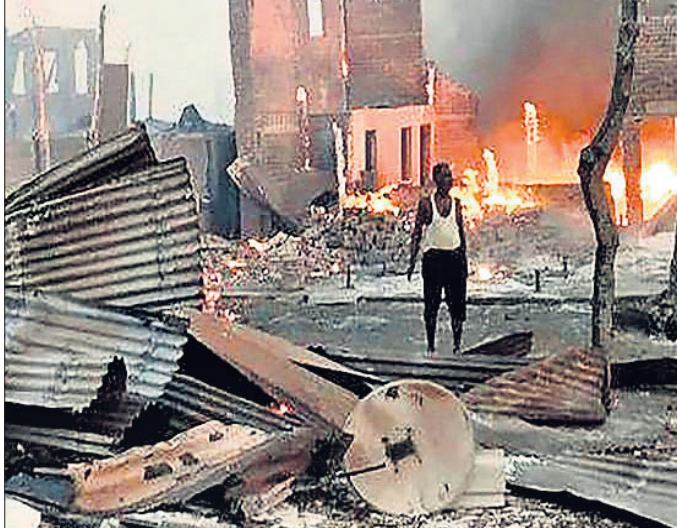
ମ୍ୟାନ୍‌ନାରେ ସେନା ପକ୍ଷରୁ ବୋମାମାଡ଼ କରାଯାଇଛି।

ପମାନ୍‌ନାରେ ପ୍ରଳୟକାଳୀ ଭୂକମ୍ପରେ ୧,୭୦୦ ଲୋକଙ୍କ ମୃତ୍ୟୁ ଘଟିବା ସହ ଅନେକ ହଜାର ଭଗ୍ନାବଶେଷ ତଳେ ରହିଯାଇଥିବା ଆଶଙ୍କା କରାଯାଇଛି। ଏକଜି ବିପର୍ଯ୍ୟୟ ସମୟରେ ମଧ୍ୟ ଦେଶର ସାମରିକ ସରକାର ବିଦ୍ରୋହୀଙ୍କ ଉପରେ ବୋମାମାଡ଼ ଜାରି ରଖିଛି। ଭୂକମ୍ପ ପରବର୍ତ୍ତୀ ଏୟାରସ୍ତ୍ରାଳକ୍ଷ୍ମରେ ବିଦ୍ରୋହୀ ଯୋଦ୍ଧାଙ୍କ ମୃତ୍ୟୁ ଘଟିଥିବା ଜଣାପଡ଼ିଛି। ମ୍ୟାନ୍‌ନାରେ ଦୀର୍ଘ ୪ ବର୍ଷ ହେଲା ଗୃହଯୁଦ୍ଧ ଲାଗି ରହିଥିବାବେଳେ ବିଦ୍ରୋହୀ ଏବଂ ଜାତିଆଣ ସଂଖ୍ୟାଳୟ ସମସ୍ତ ଗୋଷ୍ଠୀକୁ ଦମନ କରିବା ପାଇଁ ମ୍ୟାନ୍‌ନାରେ ସେନା ଏୟାରସ୍ତ୍ରାଳକ୍ଷ୍ମକୁ ଡୋଲ୍‌ଉଟ କରିଛି। ଭୂକମ୍ପରେ ଅନେକ ହଜାର ଘର ମାଟିରେ ମିଶିଥିବାବେଳେ ଦେଶର ଏହି ସକଟ ସମୟରେ କେତେକ ସଶସ୍ତ୍ର ଗୋଷ୍ଠୀ ଆକ୍ରମଣକୁ ସ୍ଥଗିତ ରଖିଛନ୍ତି। ସେନା ଏହାର ଫାଇଦା ଉଠାଇବାକୁ ଉଦ୍ୟମ କରୁଛି। ଭୂକମ୍ପ ପରେ ଆକାଶମାର୍ଗରୁ ବୋମାମାଡ଼ରେ ସେମାନେ କ୍ଷତ୍ରିଗ୍ରସ୍ତ ହୋଇଥିବା ଉତ୍ତର ଭାଗ ଶାନ୍ତ ରାଜ୍ୟରେ ସକ୍ରିୟ ଥିବା ସଂଖ୍ୟାଳୟ ସମସ୍ତ ଗୋଷ୍ଠୀ ତାରୁ ପିପୁଲ୍ ଲିବରେଶନ ଆର୍ମି ଯୋଦ୍ଧାମାନେ କହିଛନ୍ତି। ନାଉଜୁରେ ସହରରେ ଥିବା ସେମାନଙ୍କ ଘାଟି ଉପରେ ୫ଟି ସାମରିକ ବିମାନରୁ ଆକ୍ରମଣ ହେବାରୁ ୬ ଜଣ ଯୋଦ୍ଧା ପ୍ରାଣ ହରାଇଥିବା ସେମାନଙ୍କର ଜଣେ ଅଧିକାରୀ ଗଣମାଧ୍ୟମକୁ ସୂଚନା ଦେଇଛନ୍ତି। ବିମାନ ଶବ୍ଦ ଶୁଣି ଯୋଦ୍ଧାମାନେ ବଙ୍କର