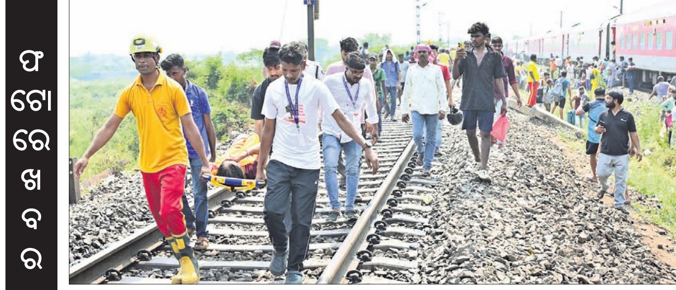
କଟକ ଜିଲ୍ଲା ମଲ୍ଲି-ଗୌରୀ ପାସେଞ୍ଜର ହଲ୍ଲୁ ନିକଟରେ ରବିବାର କାମାକ୍ଷା ସଙ୍କ୍ରମଣରେ ୧୧ ବରି ଲାଲ୍‌ରଙ୍ଗ ହୋଇଛି। ଏଥିରେ ଆହତ ହୋଇଥିବା ଯାତ୍ରୀଙ୍କୁ ଚିକିତ୍ସା ପାଇଁ ମେଡିକାଲକୁ ନିଆଯାଇଛି।