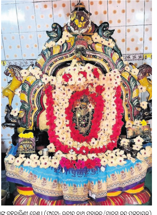
କଟଣା କୁଟିଆରୀ ଗ୍ରାମସ୍ଥିତ ମା' ଶାରଦାଙ୍କ ଏବଂ ରାମେଶ୍ୱରସ୍ଥିତ ମା' ବନବୃତ୍ତୀଙ୍କ ବ୍ରହ୍ମଚାରିଣୀ ବେଶ ।