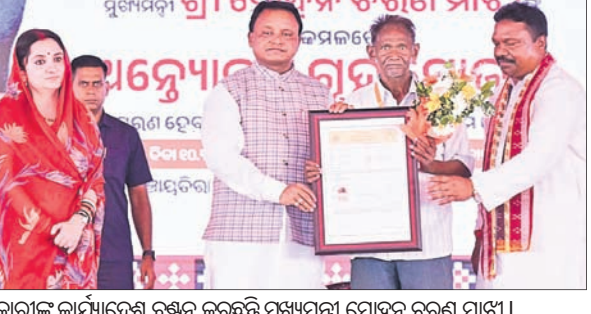
ଜଣେ ହିତାଧିକାରୀଙ୍କୁ କାର୍ଯ୍ୟଦେଶ ବନ୍ଧନ କରୁଛନ୍ତି ମୁଖ୍ୟମନ୍ତ୍ରୀ ମୋହନ ଚରଣ ମାତ୍ସ୍ୟ ।