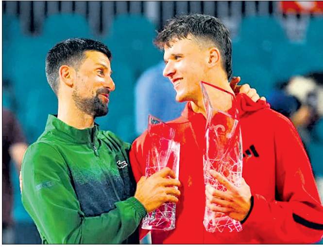
ପ୍ରିମ ସହ ଚାମ୍ପିୟନ ଜାକବ୍ ମେନସିକ୍ (ଡାହାଣ) ।

ମାୟାମି ଗାର୍ଡେନ୍ସ, ୩୧୩ (ଏସି) ସର୍ବାଧିକ ଟେନିସ ଷ୍ଟାର ନୋଭାକ ଜୋକୋଭିଚ୍‌ଙ୍କୁ ୭-୬ (୪), ୭-୬ (୪)ରେ ହରାଇ ଟେନିସ୍‌ପ୍ରିକ୍‌ର ୧୯ ବର୍ଷୀୟ ଜାକବ୍ ମେନସିକ୍ ମାୟାମି ଓପନ ପୁରୁଷ ସିଙ୍ଗଲ୍ ଚାଇନା ଜିତିଛନ୍ତି । ଏହା ଚାକର ପ୍ରଥମ ଏସିପି ଚାଇନା । ଏହି ମ୍ୟାଚ ୨ ଘଣ୍ଟା ୩ ମିନିଟ ଧରି ଚାଲିଥିଲା । ମେନସିକ୍ ବିଜୟ ହାରା ୩୭ ବର୍ଷୀୟ ଜୋକୋଭିଚ୍‌ଙ୍କୁ ୧୦୦ତମ କ୍ୟାରିୟର ଚାଇନା ଏବଂ ମାୟାମି ଓପନରେ ରେକର୍ଡ ୭ମ ଚାଇନା ରେକର୍ଡର ପୁଣି ଅପେକ୍ଷା କରିବାକୁ ପଡ଼ିବ । ଫାଇନାଲ ମ୍ୟାଚ ପୂର୍ବରୁ ଜୋକୋଭିଚ୍‌ଙ୍କୁ ବହୁ ସମସ୍ୟାର ସମ୍ମୁଖୀନ ହେବାକୁ ପଡ଼ିଥିଲା । ଆର୍ଡୁରା ଓ ପରେ ବର୍ଷା ଯୋଗୁ କୋର୍ଟରେ ଖସିବା ଦେଖାଦେଇଥିଲା । ପୁନଶ୍ଚ ଜୋକୋଭିଚ୍‌ଙ୍କ ଆଖିରେ କିଛି ସମସ୍ୟା ଦେଖା ଦେଇଥିଲା । ଏହିସବୁ ବିଭିନ୍ନ କାରଣରୁ ମ୍ୟାଚ ପ୍ରାୟ ସାଢ଼େ ୫ ଘଣ୍ଟା ବିଳମ୍ବରେ ଆରମ୍ଭ ହୋଇଥିଲା ।