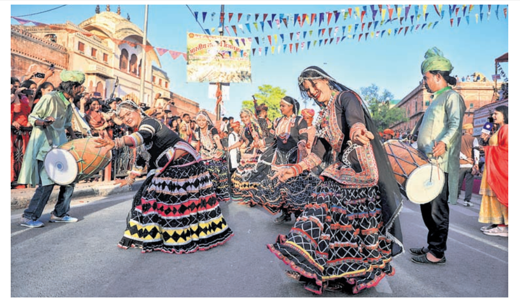
ରାଜସ୍ଥାନର ଜୟପୁରରେ ଗଣାଉର ଉତ୍ସବ ଅବସରରେ ସୋମବାର କଳାକାରମାନେ ତ୍ରିପୋଲିଆ ରେଟ୍ ନିକଟରେ ପାରମ୍ପରିକ ଶୋଭାଯାତ୍ରାରେ ନୃତ୍ୟ ପରିବେଷଣ କରୁଛନ୍ତି।

ଗାଜା, ୩୧୩୩ ଗାଜାରେ ବିଶୋଭ ପ୍ରଦର୍ଶନ କରିବାକୁ ଗାଜା ସମସ୍ତ ଶାସକ ହମାସ ସୋମବାର ୬ ଜଣ ଗ୍ଲାନାୟ ଲୋକଙ୍କୁ ଫାଶୀ ଦଣ୍ଡ ଦେଇଛି। ଗତ ସପ୍ତାହରେ ଗାଜାରେ ହମାସ ବିରୋଧୀ ବଡ଼ଧରଣର ବିଶୋଭ ପ୍ରଦର୍ଶନ ହୋଇଥିଲା। ଏହି ଆନ୍ଦୋଳନରେ ଅନେକ ହଜାର ସଂଖ୍ୟାରେ ଲୋକ ରାସ୍ତାକୁ ଅଞ୍ଚଳ ହମାସ ସମତାକୁ ହଟୁ ବୋଲି ଦାବି କରିଥିଲେ। ଉକ୍ତ ଆନ୍ଦୋଳନକୁ ଦମନ କରିବା ପାଇଁ ହମାସ ୬ ବିଶୋଭକାରୀଙ୍କୁ ଫାଶୀ ଦେଇଛି। ସେହିପରି ହମାସ ପକ୍ଷରୁ କେତେଜଣ ବିଶୋଭକାରୀଙ୍କୁ ସମସ୍ତଙ୍କ ସମ୍ମୁଖରେ ଚାକୁ ମାଡ଼ି କରାଯାଇଛି। ଆଉ କେତେଜଣ ବିଶୋଭକାରୀଙ୍କୁ ହମାସ ଅପହରଣ ମଧ୍ୟ କରିଛି।