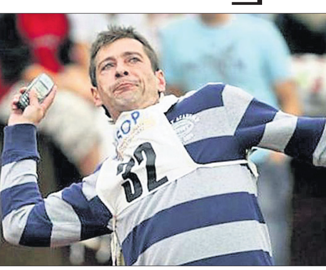
ହୋଇଥାଏ। ଏକ ଜାତୀୟ କାର୍ଯ୍ୟକ୍ରମ ଭାବରେ ପ୍ରଥମେ ଏହି ପ୍ରତିଯୋଗିତାକୁ ଆରମ୍ଭ କରାଯାଇଥିଲା। ସେବେଠାରୁ ଏହି ନିଆରା ଗାମ୍ପିୟନଶିପ୍ ସମଗ୍ର ବିଶ୍ୱରେ ତେବେ ସୁରୋପାୟ ଦେଶ ଫିନଲ୍ୟାଣ୍ଡର ଲୋକମାନେ ମୋବାଇଲ୍ ଫୋନ୍ରୁ ଏତେ ଗୁରୁତ୍ୱ ସହ ନିଅନ୍ତି ନାହିଁ। ଫିନଲ୍ୟାଣ୍ଡର ସାବୋନିନିନା ସହରରେ ମୋବାଇଲ୍ ଫୋନ୍ ଫୋପାଡ଼ିବାର ଏକ ପ୍ରତିଯୋଗିତା ପ୍ରତିବର୍ଷ ଅନୁଷ୍ଠିତ ହୋଇଥାଏ। ଉକ୍ତ ପ୍ରତିଯୋଗିତାରେ ଅଂଶଗ୍ରହଣ କରିବାକୁ ବାହାର ଦେଶର ଲୋକମାନେ ମଧ୍ୟ ଆସିଥାନ୍ତି। ଏହି ପ୍ରତିଯୋଗିତାର ନିୟମ ଅନୁଯାୟୀ, ସର୍ବାଧିକ ଦୂରତା ପର୍ଯ୍ୟନ୍ତ ମୋବାଇଲ୍ ଫୋନ୍ ଫୋପାଡ଼ିଥିବା ବ୍ୟକ୍ତିଙ୍କୁ ବିଜେତା ଘୋଷଣା କରାଯାଏ। 'ମୋବାଇଲ୍ ଫୋନ୍ ଫ୍ରୋଜ୍ଡି ଗାମ୍ପିୟନଶିପ୍' ନାମରେ ଏହି ପ୍ରତିଯୋଗିତା ସାବୋନିନିନାରେ ୨୦୦୦ ମସିହାରୁ ପ୍ରତିବର୍ଷ ଅଗସ୍ଟ ମାସରେ ଆୟୋଜିତ

ହେଲସିକ୍ ଅଧିକାଂଶ ଲୋକ ନିଜ ମୋବାଇଲ୍ ଫୋନ୍ରୁ ଅତି-ଯତ୍ନ ସହ ରଖିଥାନ୍ତି। ଯଦି ଫୋନ୍ଟି ଭୁଲ୍ ବସନ୍ତ ହାତରୁ ଖସିଯାଏ, ତେବେ ଏଥିରେ ସ୍ମାର୍ ହୋଇଛି କି ନାହିଁ ଦେଖିବାକୁ ସମସ୍ତେ ହୁରନ୍ତ ମୋବାଇଲ୍ ଟାଣି ଭାବେ ପରଖିଥାନ୍ତି। ତେବେ ସୁରୋପାୟ ଦେଶ ଫିନଲ୍ୟାଣ୍ଡର ଲୋକମାନେ ମୋବାଇଲ୍ ଫୋନ୍ରୁ ଏତେ ଗୁରୁତ୍ୱ ସହ ନିଅନ୍ତି ନାହିଁ। ଫିନଲ୍ୟାଣ୍ଡର ସାବୋନିନିନା ସହରରେ ମୋବାଇଲ୍ ଫୋନ୍ ଫୋପାଡ଼ିବାର ଏକ ପ୍ରତିଯୋଗିତା ପ୍ରତିବର୍ଷ ଅନୁଷ୍ଠିତ ହୋଇଥାଏ। ଉକ୍ତ ପ୍ରତିଯୋଗିତାରେ ଅଂଶଗ୍ରହଣ କରିବାକୁ ବାହାର ଦେଶର ଲୋକମାନେ ମଧ୍ୟ ଆସିଥାନ୍ତି। ଏହି ପ୍ରତିଯୋଗିତାର ନିୟମ ଅନୁଯାୟୀ, ସର୍ବାଧିକ ଦୂରତା ପର୍ଯ୍ୟନ୍ତ ମୋବାଇଲ୍ ଫୋନ୍ ଫୋପାଡ଼ିଥିବା ବ୍ୟକ୍ତିଙ୍କୁ ବିଜେତା ଘୋଷଣା କରାଯାଏ। 'ମୋବାଇଲ୍ ଫୋନ୍ ଫ୍ରୋଜ୍ଡି ଗାମ୍ପିୟନଶିପ୍' ନାମରେ ଏହି ପ୍ରତିଯୋଗିତା ସାବୋନିନିନାରେ ୨୦୦୦ ମସିହାରୁ ପ୍ରତିବର୍ଷ ଅଗସ୍ଟ ମାସରେ ଆୟୋଜିତ