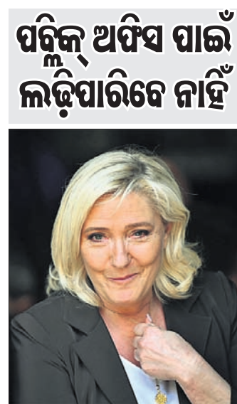
ମାରିନ୍ ଲି ପେନ୍ କରିଥିବା ବିଚାରପତି କହିବା ସହ ରାୟର ନକଲ ଟାଙ୍କ ଦଳର ୮ ଜଣ ସଦସ୍ୟଙ୍କୁ ହସ୍ତାନ୍ତର କରିଥିଲେ।

ସୁରୋପାୟ ସଂଘ ପାଣି ହେଉଥିବା ମାମଲାରେ ପ୍ରାନ୍ତର ଫାଉଁ-ରାଜର୍ ନେତ୍ରୀ ମାରିନ୍ ଲି ପେନ୍ ଦୋଷୀସାବ୍ୟସ୍ତ ହୋଇଛନ୍ତି। ସେ ଉଚ୍ଚ ପଦବୀ ପାଇଁ ଲଢ଼ିପାରିବେ ନାହିଁ ବୋଲି ଯୋଗଦାନ ପ୍ରଧାନ ବିଚାରପତି କଟକଣା ଲାଗୁକରି ପରେ ଲି ପେନ୍ ତୁରନ୍ତ କୋର୍ଟ ରୁମ୍ ରୁ ବାହାରି ଚାଲିଯାଇଥିଲେ। ଏପରିକି ସେ ରାଜ୍ୟାଧିକାରୀ କିଛି କହିବା ପାଇଁ ଅଟକି ନ ଥିଲେ। ପିକ୍ସି ଅଧିକାରୀ ନିର୍ବାଚନ ଲଢ଼ିବାକୁ ସେ କିପରି ଅଯୋଗ୍ୟ ହେବେ, ସେ ନେଇ ବିଚାରପତି କିଛି କହିନାହାନ୍ତି। କୋର୍ଟଙ୍କ ଏହି ନିଷ୍ପତ୍ତି ଆଇନଜୀବୀ ତଥା ରାଜନେତା ଲି ପେନ୍ଙ୍କ କ୍ୟାରିୟରକୁ କଷ୍ଟଭୂତ କରିପାରେ, ଯାହା ଲକ୍ଷ୍ୟାତ୍ମକ ସମର୍ଥକଙ୍କୁ କ୍ଷୁବ୍ଧ କରିଛି। ଲି ପେନ୍ଙ୍କ ପାର୍ଟି ସୁରୋପାୟ ପାର୍ଲିମେଣ୍ଟ ପାଣ୍ଡି ନିଜ ଫାଇଦା ପାଇଁ ବ୍ୟବହାର କରିଥିବା ବିଚାରପତି କହିବା ସହ ରାୟର ନକଲ ଟାଙ୍କ ଦଳର ୮ ଜଣ ସଦସ୍ୟଙ୍କୁ ହସ୍ତାନ୍ତର କରିଥିଲେ।