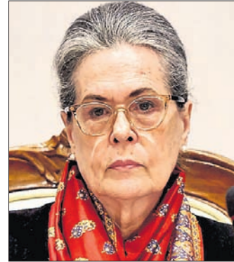
ସୋନିଆ ଗାନ୍ଧୀ କେବଳ ତିନୋଟି ମୁଖ୍ୟ ଏଜେଣ୍ଡାର ସଫଳ କାର୍ଯ୍ୟକାରୀତା ପାଇଁ ଚିତ୍ତିତ। ସେଗୁଡ଼ିକ ହେଲା କେନ୍ଦ୍ର ସରକାରଙ୍କ ସହ କ୍ଷମତା କେନ୍ଦ୍ରୀକରଣ, ବ୍ୟବସାୟକରଣ ଏବଂ ଘରୋଇ ସେକ୍ଟରରେ ଶିକ୍ଷାରେ ନିବେଶର ଆରବ୍ ସୋସିଆଲ୍, ପାଠ୍ୟପୁସ୍ତକ, ପାଠ୍ୟକ୍ରମ ଓ ଶିକ୍ଷାନୁଷ୍ଠାନର ସାମ୍ପ୍ରଦାୟିକରଣ ବୋଲି ସୋନିଆ ଲେଖିଛନ୍ତି।

ନୂଆଦିଲ୍ଲୀ, ୩୧୩୩(ପି.ଟି.) କଂଗ୍ରେସ୍ ନେତ୍ରୀ ସୋନିଆ ଗାନ୍ଧୀ କେନ୍ଦ୍ର ସରକାରଙ୍କ ଶିକ୍ଷାନୀତିକୁ ନିରା କରିଛନ୍ତି। କ୍ଷମତା କେନ୍ଦ୍ରୀକରଣ, ବ୍ୟବସାୟକରଣ, ଘରୋଇ ସେକ୍ଟରରେ ପୁଞ୍ଜିନିବେଶର ଆରବ୍ ସୋସିଆଲ୍ ଏବଂ ପାଠ୍ୟପୁସ୍ତକଗୁଡ଼ିକର ସାମ୍ପ୍ରଦାୟିକରଣ ଉକ୍ତ ଶିକ୍ଷାନୀତିର ମୁଖ୍ୟ ଏଜେଣ୍ଡା। ଉପରୋକ୍ତ ୩ 'ସି' ଏବେ ଭାରତୀୟ ଶିକ୍ଷା ଦାରିଥିବା କଂଗ୍ରେସ୍ ସଂସଦୀୟ ଦଳ ଅଧିକାରୀ ହେବେ। ଭାରତୀୟ ଶିକ୍ଷା ବ୍ୟବସ୍ଥାର 'ହତ୍ୟା' ବନ୍ଦ ହେବା ଜରୁରୀ ବୋଲି ସେ ଏକ ପ୍ରକଳ୍ପରେ ଲେଖିଛନ୍ତି। ଏଥିରେ ସୋନିଆ କହିଛନ୍ତି, ଜାତୀୟ ଶିକ୍ଷା ନୀତି (ଏନପି) ୨୦୨୦ ପ୍ରକଳ୍ପରେ ସରକାରଙ୍କ ବାସ୍ତବତା ଲୁଚି ରହିଛି, ଯାହା ଭାରତର ପିଲା ଓ ଯୁବବର୍ଗଙ୍କ ଶିକ୍ଷା ପାଇଁ ସମ୍ପୂର୍ଣ୍ଣ ଉଦାସୀନ। କେନ୍ଦ୍ର ସରକାର ଗତ ଦଶନ୍ଧିର ଗ୍ରାମିକ୍ ରେଜିଷ୍ଟ୍ରେସନ୍ ସର୍ଟିଫିକେଟ୍ ସ୍ଥଗିତ ରହିବ।