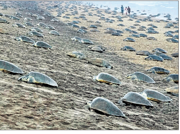
ସାମୁଦ୍ରିକ କର୍ଳକ୍ଷ୍ମକ ସାମୁଦ୍ରିକ ଅଣ୍ଡାଦାନ ।