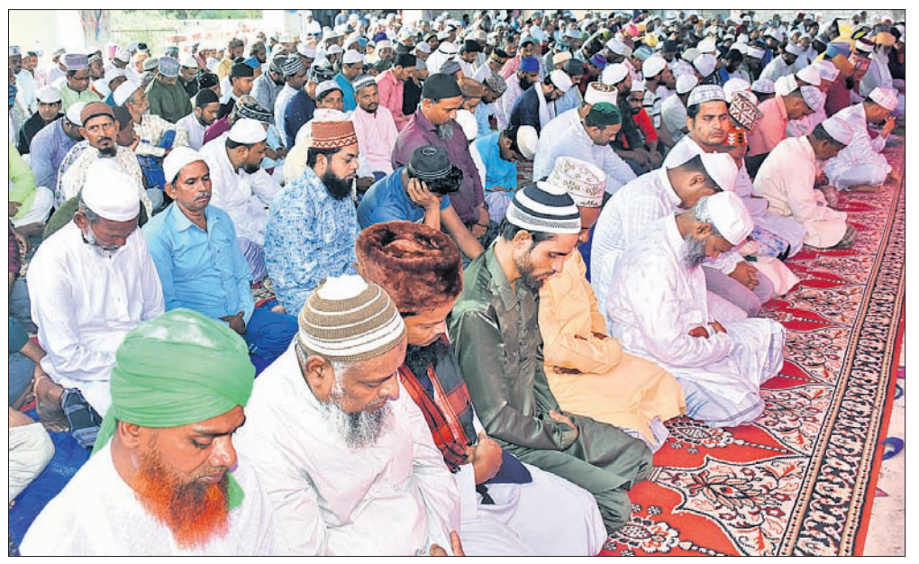
ଭଦ୍ର ଅବସରରେ ଯୋଗଦାନ କରିଥିବା ଭୁବନେଶ୍ୱର ଖାରପଡ଼ାସ୍ଥିତ ବୁଦ୍ଧାଦି କୁଳ ହରିଦ୍ୱାରେ ମୁସଲିମ୍ ଭାଇମାନେ ସମୂହ ପ୍ରାର୍ଥନା କରୁଛନ୍ତି ।