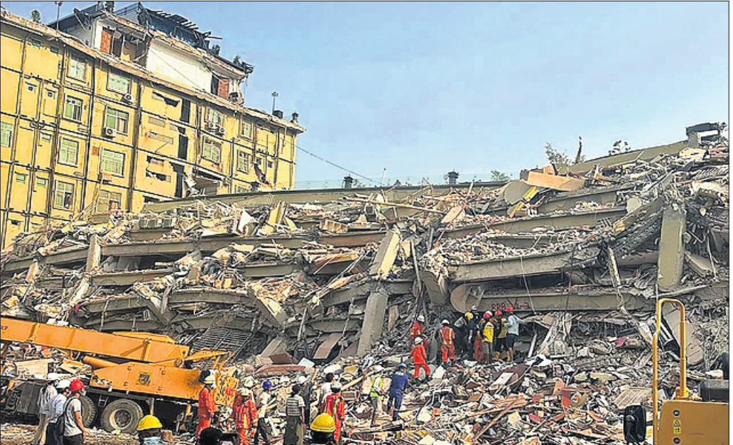
ମାଣ୍ଡଲେର ଭୂକମ୍ପ ବିଧ୍ୱସ୍ତ ଅଞ୍ଚଳରେ ଉଦ୍ଧାର କାର୍ଯ୍ୟ ଚାଲିଛି।

ମାଣ୍ଡଲେ, ୩୧୩୩ ମ୍ୟାନମାରରେ ପ୍ରକୟଙ୍କର ଭୂକମ୍ପକଳିତ ମୃତ୍ୟୁସଂଖ୍ୟା ଯୋଗୁ ୯,୦୦୦ ଅତିକ୍ରମ କରିଥିବାବେଳେ ବିକ୍ଳିତପୃଷ୍ଠା