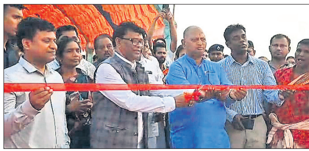
ଇକୋ ଟୁରିଜମ୍ ପାର୍କକୁ ରାଜ୍ୟ ସରକାରଙ୍କ ଜଙ୍ଗଲ ଓ ପରିବେଶ ବିଭାଗ ମନ୍ତ୍ରୀ ଉଦ୍ଘାଟନ କରୁଛନ୍ତି ।