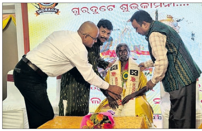
କାର୍ଯ୍ୟକ୍ରମରେ ପଦ୍ମଶ୍ରୀ ହଲଧର ନାଗଙ୍କୁ ସମର୍ଥନ କରାଯାଇଛି।