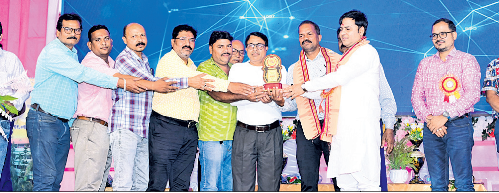
ବାର୍ଷିକ ଉତ୍ସବରେ ସମ୍ମାନିତ କରାଯାଇଛି।

କ୍ଷୀରୋତ ଗୌଡ଼ିଆ ବାଳିକା ଉଚ୍ଚ ବିଦ୍ୟାଳୟର ରୌପ୍ୟ ଜୟନ୍ତୀ ସମାରୋହ