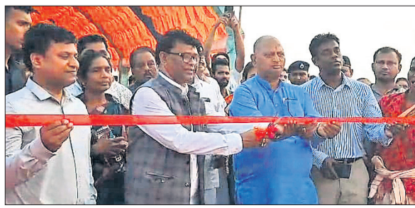
ଇକୋ ଚୁରିଙ୍ଗମ୍ ପାର୍କକୁ ରାଜ୍ୟ ସରକାରଙ୍କ ଜଙ୍ଗଲ ଓ ପରିବେଶ ବିଭାଗ ମନ୍ତ୍ରୀ ଉଦ୍ଘାଟନ କରୁଛନ୍ତି ।