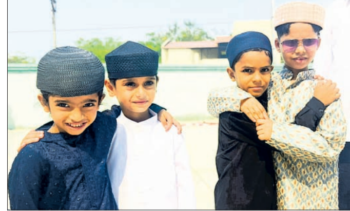
ପିଲାମାନେ ପରସ୍ପରକୁ ଇନ୍-ଉଲ୍-ଫିଟର କରି ଅଭିନନ୍ଦନ ଜଣାଉଛନ୍ତି।