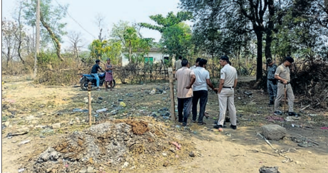
ଜମି କବରଦଖଲ ବେଳେ ଉଡ଼େଜନା ପରେ ପୋଲିସ ପହଞ୍ଚି ତଦନ୍ତ କରୁଛି।

ଝାରସୁଗୁଡ଼ା ସହରସ୍ଥିତ ବିଦ୍ୟମ୍ (ଭାସ୍କର ଚେନ୍ଦ୍ରଚାନ୍ଦଲ ମିଲ)ର ଜମିକୁ କେତେକଜଣ ଲୋକ ସୋମବାର କେସିପି ଲଗାଇ ଦଖଲ କରିବାକୁ ନେଇ ବିରୋଧ କରାଯାଇଛି। ଫଳରେ ସେଠାରେ ଦଖଲକାରୀ ଏବଂ ବିଦ୍ୟମ୍‌ବାସୀଙ୍କ ମଧ୍ୟରେ ଉଡ଼େଜନା ଦେଖାଦେଇଥିଲା। ସ୍ଥାନୀୟ ଲୋକେ ସଦର ଥାନା ପୋଲିସକୁ ଖବର ଦେଇଥିଲେ। ଘଟଣାସ୍ଥଳରେ ୨ଟି ପିସିଆର ଗଢ଼ିତ ହୋଇ ସହାୟକ ଦଖଲକାରୀଙ୍କୁ ଥାନାକୁ ନେଇଥିଲେ। ଥାନାରେ ସମସ୍ତ କାର୍ଗଜପତ୍ର ଦାଖଲ