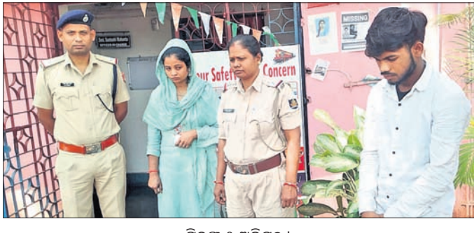
ଗିରଫ ୨ ଅଭିଯୁକ୍ତ ।

କୋରାପୁଟ ଜିଲ୍ଲାରେ ଗଞ୍ଜୋଇ ଚୋରା କାରବାର ଦିନକୁ ଦିନ ବଢ଼ିବା ସହ ଏହାକୁ ଚାଲାଇ କରିବାର ଉପାୟ ମଧ୍ୟ ବଦଳିଲାଣି । ଅଭିଯୁକ୍ତମାନେ ପାରମ୍ପରିକ ପକ୍ଷି ନ ଆପଣାଉ ପୋଲିସ୍ କିମ୍ବା ଅବକାରୀ ଭିକାର ଯେପରି କିଛି ସନ୍ଦେହ ନ କରିପାରିବ, ସେଭଳି ନୂଆ ନୀତି ଆପଣାଉଛନ୍ତି । ଏହି ଚୋରା ଚାଲାଇବାର ଏବେ ମୁଦତୀମାନଙ୍କୁ ବ୍ୟବହାର କରାଯାଉଛି । ମୁଦତୀମାନଙ୍କୁ ମୁଦତୀମାନେ ପର୍ଯ୍ୟଟକ ବେଶରେ ଆସି ନିଜର ଲଗେଜ୍ ବ୍ୟାଗ୍‌ରେ ଗଞ୍ଜୋଇ ଚାଲାଇ କରି ବାହାର ରାଜ୍ୟକୁ ନେଉଛନ୍ତି । ସୋମବାର ଏଭଳି ୨ଟି ଘଟଣା କୋରାପୁଟ ରେଳଷ୍ଟେଶନରେ ଧରାପଡ଼ିଛି । ଉଭୟ ଘଟଣାରେ ୨ଜଣ ମୁଦତୀଙ୍କ ସହ ଜଣେ ମୁଦକକୁ ଗିରଫ କରାଯାଇଛି । କୋରାପୁଟ, ୩୧୧୩ (ଅମିତାଳ ବେହେରା) କୋରାପୁଟର ପର୍ଯ୍ୟଟକ ହୋଇ ଆସୁଛନ୍ତି । ଗଲା ବେଳେ ଗଞ୍ଜୋଇ ନେଇ ଫେରୁଛନ୍ତି । ୨୦୨୪ ଜାନୁଆରୀରୁ ୨୦୨୫ ମାର୍ଚ୍ଚ ୩୧ ସୁଦ୍ଧା ୨୩ଜଣଙ୍କୁ ଏହି ମାମଲାରେ ଗିରଫ କରାଯାଇଥିବା ଜଣାପଡ଼ିଛି । ପୂର୍ବରୁ ପକ୍ଷୀ ନିଜା ସମୟରେ ମୁଦତୀମାନଙ୍କୁ ଗିରଫ କରାଗଲାଣି । ସୋମବାର ସକାଳେ କୋରାପୁଟ ଷ୍ଟେଶନରୁ ଜଣାପଡ଼ିଥିବା ଏକ ଗିରଫିତା ପକ୍ଷୀ ଯିବା ପାଇଁ କୋରାପୁଟ ଷ୍ଟେଶନରେ ଅପେକ୍ଷା କରିଥିଲେ । ସୋମବାର ପାଖରେ ଗଞ୍ଜୋଇ ଥିବା ଜଣାପଡ଼ିଥିବା ସୂଚନା ପାଇଁ ଚଢ଼ାଉ କରିଥିଲା । ସେମାନଙ୍କ