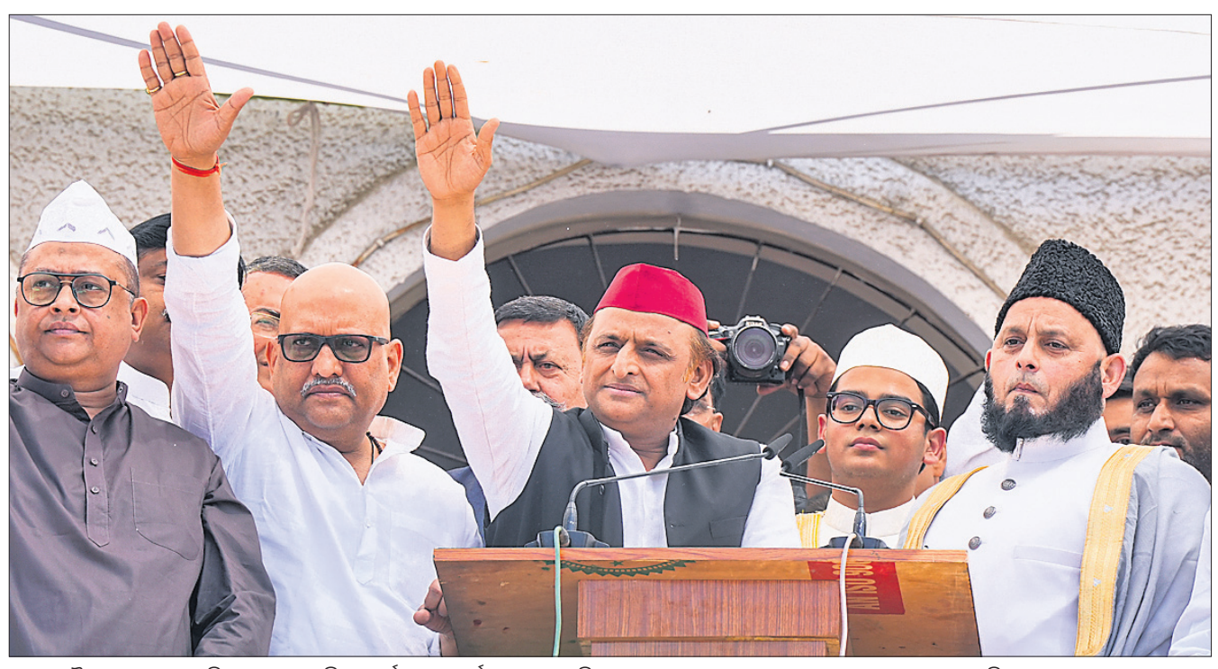
ଲକ୍ଷ୍ମୀର ଲଦ୍‌ବାରେ ଅନୁଷ୍ଠିତ ଲଦ୍-ଉଲ୍-ଫିତର ପର୍ବର ଏକ କାର୍ଯ୍ୟକ୍ରମରେ ଏସ୍‌ପି ଅଧ୍ୟକ୍ଷ ଅଖିଲେଶ୍ୱର ଯାଦବ, ଉତ୍ତରପ୍ରଦେଶ କଂଗ୍ରେସ ସଭାପତି ଅଜୟ ରାୟ ଏବଂ ଇମାମ ମୌଲାନା ଖାଲିଦ ରାଶିଦ୍ ଫିରକ୍ ମାହାଲି ସମର୍ଥକଙ୍କ ଅଭିବାଦନ ଗ୍ରହଣ କରୁଛନ୍ତି ।