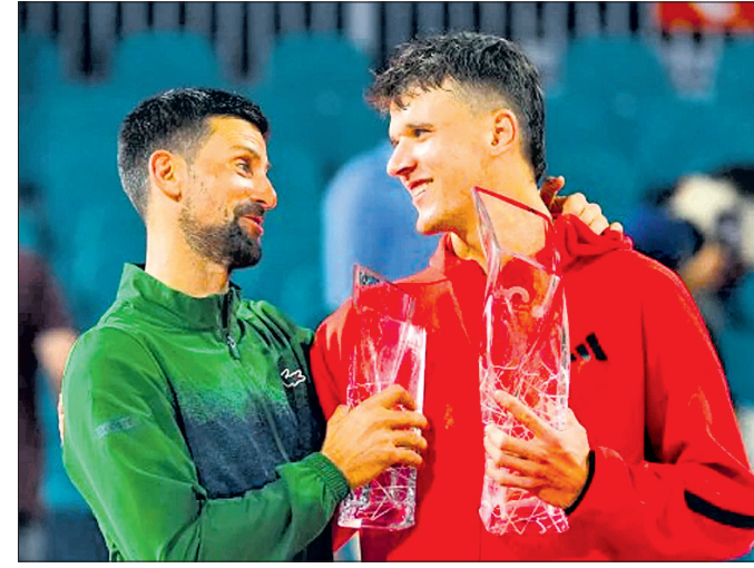
ପ୍ରତି ସହ ଗାମ୍ଭୀର୍ଯ୍ୟ ଜାକବ୍ ମେନସିକ୍ (ଡାହାଣ)।

ମାୟାମି ଗାର୍ଡେନ୍ସ, ୩୧୩ (ଏସି) ସର୍ବାଧିକ ଟେନିସ ଖୁବ୍ ନୋଭାକ୍ ଜୋକୋଭିଚ୍‌ଙ୍କୁ ୭-୬ (୪), ୭-୬ (୪)ରେ ହରାଇ ଟେନିସ୍‌ର ମେନସିକ୍ ମାୟାମି ଓପନ ପୁରୁଷ ସିଙ୍ଗଲ୍ ଟାଇଟଲ ଜିତିଛନ୍ତି। ଏହା ତାଙ୍କର ପ୍ରଥମ ଏସି ଟାଇଟଲ। ଏହି ମ୍ୟାଚ ୨ ଘଣ୍ଟା ୩ ମିନିଟ ଧରି ଚାଲିଥିଲା। ମେନସିକ୍ ବିଜୟ ହାରା ୩୭ ବର୍ଷୀୟ ଜୋକୋଭିଚ୍‌ଙ୍କୁ ୧୦୦ତମ କ୍ୟାରିୟର ଟାଇଟଲ ଏବଂ ମାୟାମି ଓପନରେ ରେକର୍ଡ ୭ମ ଟାଇଟଲ ରେକର୍ଡରୁ ପୁଣି ଆପେକ୍ଷା କରିବାକୁ ପଡ଼ିବ। ଫାଇନାଲ ମ୍ୟାଚ ପୂର୍ବରୁ ଜୋକୋଭିଚ୍‌ଙ୍କୁ ବହୁ ସମସ୍ୟାର ସମ୍ମୁଖୀନ ହେବାକୁ ପଡ଼ିଥିଲା। ଆର୍ଡ୍ରା ଓ ପରେ ବର୍ଷା ଯୋଗୁ କୋର୍ଟରେ ଶୁଖିଲା ଦେଖାଦେଇଥିଲା। ପୁନଶ୍ଚ ଜୋକୋଭିଚ୍‌ଙ୍କ ଆଖିରେ କିଛି ସମସ୍ୟା ଦେଖା ଦେଇଥିଲା। ଏହିସବୁ ବିଭିନ୍ନ କାରଣରୁ ମ୍ୟାଚ ପ୍ରାୟ ସାଢ଼େ ୫ ଘଣ୍ଟା ବିଳମ୍ବରେ ଆରମ୍ଭ ହୋଇଥିଲା।