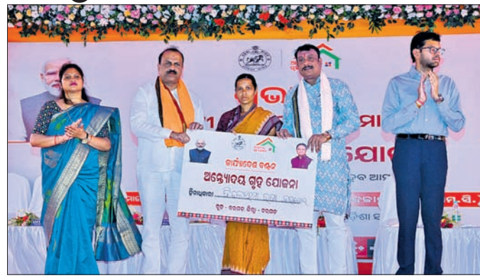
ଜଣେ ହିତାଧିକାରୀଙ୍କୁ ଅତିଥିମାନେ କାର୍ଯ୍ୟାଦେଶ ପ୍ରଦାନ କରୁଛନ୍ତି।