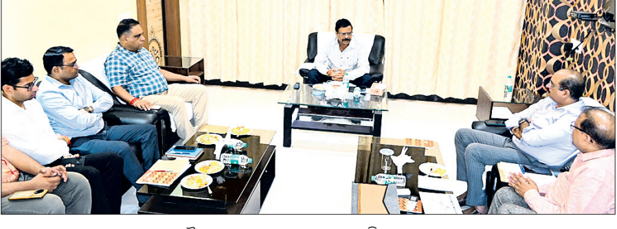
ସମାକ୍ଷା ବୈଠକରେ ରାଜ୍ୟ ମନ୍ତ୍ରୀଙ୍କ ସହ ଉପସ୍ଥିତ ଅଧିକାରୀମାନେ।