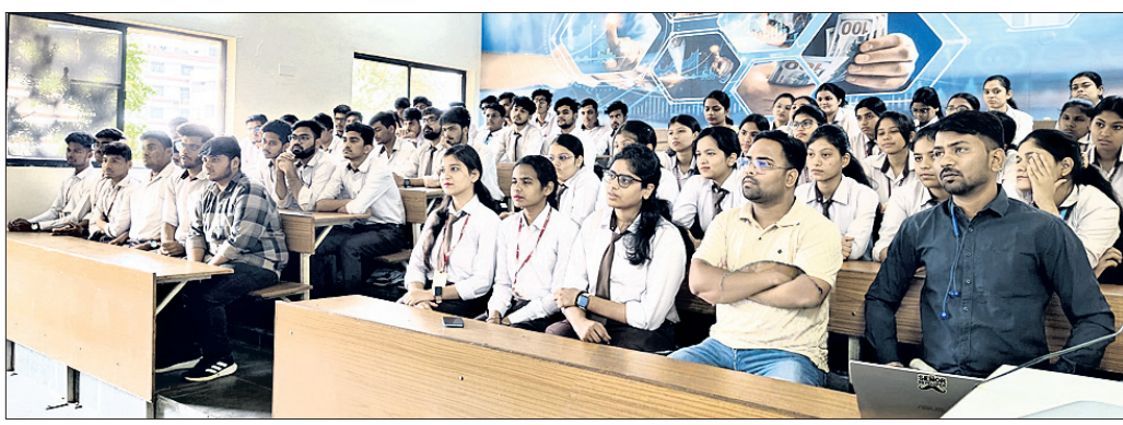
ସେମିନାରରେ ଉପସ୍ଥିତ ଛାତ୍ରାଛାତ୍ରୀ।

ମଞ୍ଚାସୀନ ଥିଲେ। ଏହି ଅବସରରେ ଜିଲ୍ଲାର ୧୫୨୧ଜଣ ବିଭିନ୍ନ ବର୍ଗର ହିତାଧିକାରୀଙ୍କୁ ଘର ତିଆରି ପାଇଁ କାର୍ଯ୍ୟାଦେଶ ପ୍ରଦାନ କରାଯାଇଥିଲା। ସେଥିମଧ୍ୟରୁ ଅୟାଜୋନା ବ୍ଲକ୍‌ର ୭୪, ଅତୀତରା ବ୍ଲକ୍‌ର ୧୦୮, ବରଗଡ଼ ବ୍ଲକ୍‌ର ୧୦୦, ବରପାଲି ବ୍ଲକ୍‌ର ୨୧୭, ଭଟ୍ଟାଳି ବ୍ଲକ୍‌ର ୮୯, ଭେଡ଼େନ ବ୍ଲକ୍‌ର ୧୫୦, ବିଜେପୁର ବ୍ଲକ୍‌ର ୧୬୪, ଗାଈସିଲେଟ ବ୍ଲକ୍‌ର ୧୮୫, ଝାରବନ୍ଧ ବ୍ଲକ୍‌ର ୧୬୫, ପାଇକମାଳ ବ୍ଲକ୍‌ର ୧୩୧, ରାଜବୋଡ଼ାସର ବ୍ଲକ୍‌ର ୪୮ ଏବଂ ସୋହେଲ ବ୍ଲକ୍‌ର ୯୦ହିତାଧିକାରୀ ରହିଛନ୍ତି। ଏହି ଯୋଜନାରେ ପ୍ରତ୍ୟେକ ହିତାଧିକାରୀଙ୍କୁ ଘର ନିର୍ମାଣ ପାଇଁ ୧ଲକ୍ଷ ୨୦ହଜାର ଟଙ୍କା ପ୍ରଦାନ କରାଯିବା ବ୍ୟବସ୍ଥା ରହିଛି।