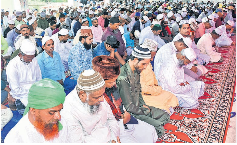
ଭଦ୍ର ଅବସରରେ ଯୋଗଦାନ କରିଥିବା ଭୁବନେଶ୍ୱର ଖାରପଡ଼ାସ୍ଥିତ ବୁଦ୍ଧାଦି କୁଳ ହରିଦ୍ୱାରେ ମୁସଲିମ୍ ଭାଇମାନେ ସମୂହ ପ୍ରାର୍ଥନା କରୁଛନ୍ତି ।