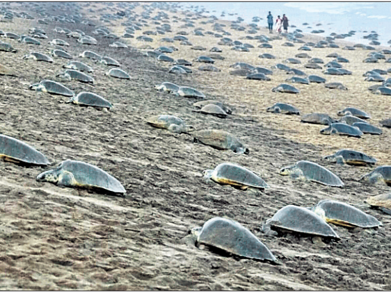
ସାମୁଦ୍ରିକ କର୍ତ୍ତୃକ କରାଯାଇଥିବା ଅଣ୍ଡାଦାନ ।