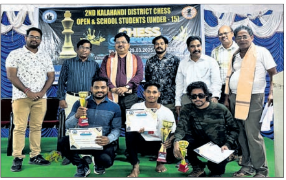
ପୁରସ୍କୃତ ହୋଇଥିବା ପ୍ରତିଯୋଗୀ