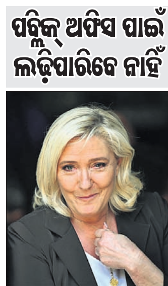
ମାରିନ୍ ଲି ପେନ୍ କରିଥିବା ବିଚାରପତି କହିବା ସହ ରାୟର ନକଲ ଚାକ୍ ଦକର ୮ ଜଣ ସଦସ୍ୟଙ୍କୁ ହସ୍ତାନ୍ତର କରିଥିଲେ।

ସୁରୋପାୟ ସଂଘ ପାଣି ହେଉଥିବା ମାମଲାରେ ପ୍ରାନ୍ତର ଫାଉଁ-ରାଜର୍ ନେତ୍ରୀ ମାରିନ୍ ଲି ପେନ୍ ଦୋଷୀସାବ୍ୟସ୍ତ ହୋଇଛନ୍ତି। ସେ ଉଚ୍ଚ ପଦ୍ମ ପାଇଁ ଲଢ଼ିପାରିବେ ନାହିଁ ବୋଲି ଯୋଗଦାନ ପ୍ରଧାନ ବିଚାରପତି କଟକଣା ଲାଗୁକରି ପରେ ଲି ପେନ୍ ତୁରନ୍ତ କୋର୍ଟ ରୁମ୍ ରୁ ବାହାରି ଚାଲିଯାଇଥିଲେ। ଏପରିକି ସେ ରାଜ୍ୟାଧିକାରୀ କିଛି କହିବା ପାଇଁ ଅଟକି ନ ଥିଲେ। ପିକ୍ସି ଅଫିସ୍ ପାଇଁ ନିର୍ବାଚନ ଲଢ଼ିବାକୁ ସେ କିପରି ଅଯୋଗ୍ୟ ହେବେ, ସେ ନେଇ ବିଚାରପତି କିଛି କହିନାହାନ୍ତି। କୋର୍ଟକି ଏହି ନିଷ୍ପତ୍ତି ଆଇନଜୀବୀ ତଥା ରାଜନେତା ଲି ପେନ୍ଙ୍କ କ୍ୟାରିୟରକୁ କଷ୍ଟଭୂତ କରିପାରେ, ଯାହା ଲକ୍ଷାଧିକ ସମର୍ଥକଙ୍କୁ କ୍ଷୁବ୍ଧ କରିଛି। ଲି ପେନ୍ଙ୍କ ପାର୍ଟି ସୁରୋପାୟ ପାଇଁ ମୋକ୍ଷ ପାଣ୍ଡୁ ନିଜ ଫାଇଦା ପାଇଁ ବ୍ୟବହାର କରିଥିବା ବିଚାରପତି କହିବା ସହ ରାୟର ନକଲ ଚାକ୍ ଦକର ୮ ଜଣ ସଦସ୍ୟଙ୍କୁ ହସ୍ତାନ୍ତର କରିଥିଲେ।