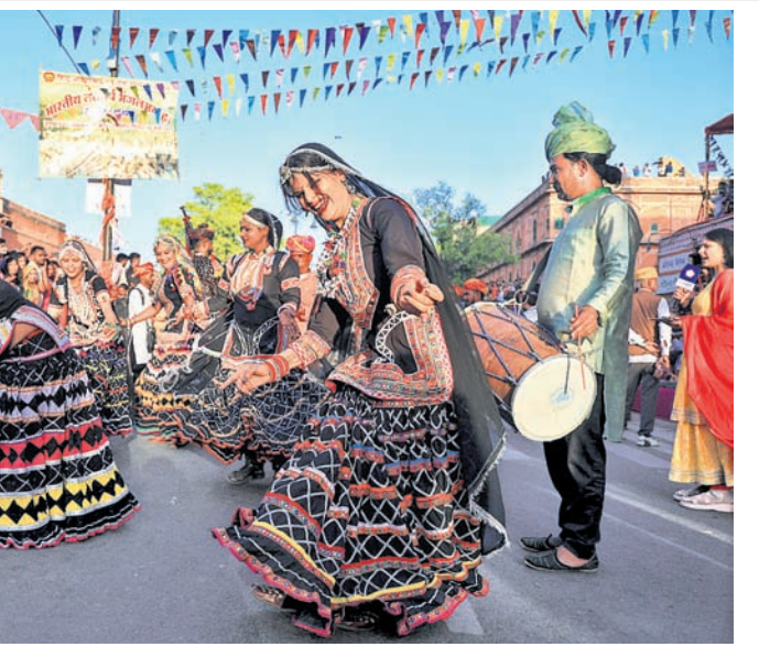
ରାଜସ୍ଥାନର ଜୟପୁରରେ ଗଙ୍ଗାଉର ଉତ୍ସବ ଅବସରରେ ସୋମବାର କଳାକାରମାନେ ତ୍ରିପୋଲିଆ ରେଟ୍ ନିକଟରେ ପାରମ୍ପରିକ ଶୋଭାଯାତ୍ରାରେ ନୃତ୍ୟ ପରିବେଷଣ କରୁଛନ୍ତି।

ଗାଜାରେ ବିକ୍ଷୋଭ ପ୍ରଦର୍ଶନ କରିବାକୁ ଗାଜାରେ ସମସ୍ତ ଶାସକ ହମାସ ସୋମବାର ୬ ଜଣ ଗୁଳାମୟ ଲୋକଙ୍କୁ ଫାଶୀ ଦଣ୍ଡ ଦେଇଛି। ଗତ ସପ୍ତାହରେ ଗାଜାରେ ହମାସ ବିରୋଧୀ ବଡ଼ଧରଣର ବିକ୍ଷୋଭ ପ୍ରଦର୍ଶନ ହୋଇଥିଲା। ଏହି ଆନ୍ଦୋଳନରେ ଅନେକ ହଜାର ସଂଖ୍ୟାରେ ଲୋକ ରାସ୍ତାକୁ ଅଞ୍ଚଳ ହମାସ ସମତାକୁ ହଟୁ ବୋଲି ଦାବି କରିଥିଲେ। ଉକ୍ତ ଆନ୍ଦୋଳନକୁ ଦମନ କରିବା ପାଇଁ ହମାସ ୬ ବିକ୍ଷୋଭକାରୀଙ୍କୁ ଫାଶୀ ଦେଇଛି। ସେହିପରି ହମାସ ପକ୍ଷରୁ କେତେଜଣ ବିକ୍ଷୋଭକାରୀଙ୍କୁ ସମସ୍ତଙ୍କ ସମ୍ମୁଖରେ ଚାକୁ ମାଡ଼ କରାଯାଇଛି। ଆଉ କେତେଜଣ ବିକ୍ଷୋଭକାରୀଙ୍କୁ ହମାସ ଅପହରଣ ମଧ୍ୟ କରିଛି।