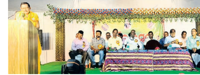
କାର୍ଯ୍ୟକ୍ରମରେ ମଞ୍ଚାସୀନ ଅତିଥିବୃନ୍ଦ।