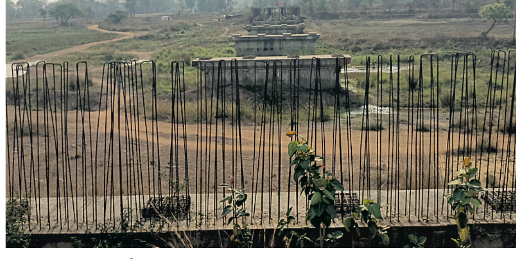
ବଡ଼ଧରା ନାଲ ଉପରେ ଅସମ୍ପୂର୍ଣ୍ଣ ସୁଉଚ ସେତୁ।

୩୧।୩।୨୦୨୩ରେ କାର୍ଯ୍ୟ ପରିସମାପ୍ତି ପାଇଁ ସରକାର ନିର୍ମାଣକାରୀ ସଂସ୍ଥାକୁ ଅନୁମତି ପ୍ରଦାନ କରିଥିଲେ। କାର୍ଯ୍ୟ ଠିକ ସମୟରେ ଆରମ୍ଭ ମଧ୍ୟ ହୋଇଥିବା ବେଳେ ବର୍ତ୍ତମାନ ଅଧାରେ ଅଟକି ରହିଛି। ଠିକା ସଂସ୍ଥାର ଏହି ପ୍ରକଳ୍ପରେ ବ୍ୟବହାର ହେଉଥିବା ଲକ୍ଷ୍ମୀପୁର ଚଳାଚଳ ସାମଗ୍ରୀ କାର୍ଯ୍ୟ ସ୍ଥଳରେ ପଡ଼ିରହି ଖଟ