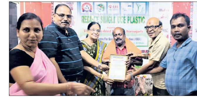
କାର୍ଯ୍ୟକ୍ରମରେ ସ୍ମୃତି ଫଳକ ଓ ପୁଲଗଛ ଦେଇ ସମ୍ବର୍ଦ୍ଧିତ କରାଯାଇଛି।