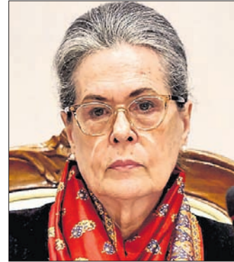
ସୋନିଆ ଗାନ୍ଧୀ କେବଳ ତିନୋଟି ମୁଖ୍ୟ ଏଜେଣ୍ଡାର ସଫଳ କାର୍ଯ୍ୟକାରୀତା ପାଇଁ ଚିତ୍ତିତ। ସେଗୁଡ଼ିକ ହେଲା କେନ୍ଦ୍ର ସରକାରଙ୍କ ସହ କ୍ଷମତା କେନ୍ଦ୍ରୀକରଣ, ବ୍ୟବସାୟୀକରଣ ଏବଂ ଘରୋଇ ସେକ୍ଟରରେ ଶିକ୍ଷାରେ ନିବେଶର ଆରତ୍ସୋର୍ସିଏ, ପାଠ୍ୟପୁସ୍ତକ, ପାଠ୍ୟକ୍ରମ ଓ ଶିକ୍ଷାନୁଷ୍ଠାନର ସାମ୍ପ୍ରଦାୟୀକରଣ ବୋଲି ସୋନିଆ ଲେଖିଛନ୍ତି।

କଂଗ୍ରେସ ନେତ୍ରୀ ସୋନିଆ ଗାନ୍ଧୀ କେନ୍ଦ୍ର ସରକାରଙ୍କ ଶିକ୍ଷାନୀତିକୁ ନିରା କରିଛନ୍ତି। କ୍ଷମତା କେନ୍ଦ୍ରୀକରଣ, ବ୍ୟବସାୟୀକରଣ, ଘରୋଇ ସେକ୍ଟରରେ ପୁଞ୍ଜିନିବେଶର ଆରତ୍ସୋର୍ସିଏ ଏବଂ ପାଠ୍ୟପୁସ୍ତକଗୁଡ଼ିକର ସାମ୍ପ୍ରଦାୟୀକରଣ ଉକ୍ତ ଶିକ୍ଷାନୀତିର ମୁଖ୍ୟ ଏଜେଣ୍ଡା। ଉପରୋକ୍ତ ୩ 'ସି' ଏବେ ଭାରତୀୟ ଶିକ୍ଷା ଦାରିଥିବା କଂଗ୍ରେସ ସଂସଦୀୟ ଦଳ ଅଧିକାରୀ କହିଛନ୍ତି। ଭାରତୀୟ ଶିକ୍ଷା ବ୍ୟବସ୍ଥାର 'ହତ୍ୟା' ବନ୍ଦ ହେବା ଜରୁରୀ ବୋଲି ସେ ଏକ ପ୍ରକ୍ଷେପରେ ଲେଖିଛନ୍ତି। ଏଥିରେ ସୋନିଆ କହିଛନ୍ତି, ଜାତୀୟ ଶିକ୍ଷା ନୀତି (ଏନ୍‌ଇପି) ୨୦୨୦ ପ୍ରତିରୋଧୀ ପଛରେ ସରକାରଙ୍କ ବାସ୍ତବତା ଲୁଚି ରହିଛି, ଯାହା ଭାରତର ପିଲା ଓ ଯୁବବର୍ଗଙ୍କ ଶିକ୍ଷା ପାଇଁ ସମ୍ପୂର୍ଣ୍ଣ ଉପାଦାନ। ଏହା ପୈଠ ହେବା ପର୍ଯ୍ୟନ୍ତ ଡିଏଲ୍ କିମ୍ବ ରେଜିଷ୍ଟ୍ରେସନ୍ ସର୍ଟିଫିକେଟ ଗ୍ରହଣ ରହିବ।