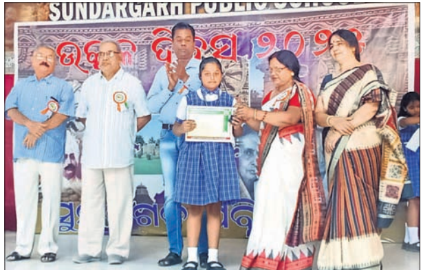
କାର୍ଯ୍ୟକ୍ରମରେ ଜଣେ କୃତୀ ପ୍ରତିଭାକୁ ସମ୍ମାନିତ କରାଯାଇଛି।