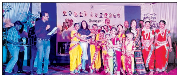
ଓଡ଼ିଶା ଦିବସରେ ଅତିଥିଙ୍କୁ ଗଣନାରେ ପୁରସ୍କୃତ ଛାତ୍ରାଛାତ୍ରୀ।