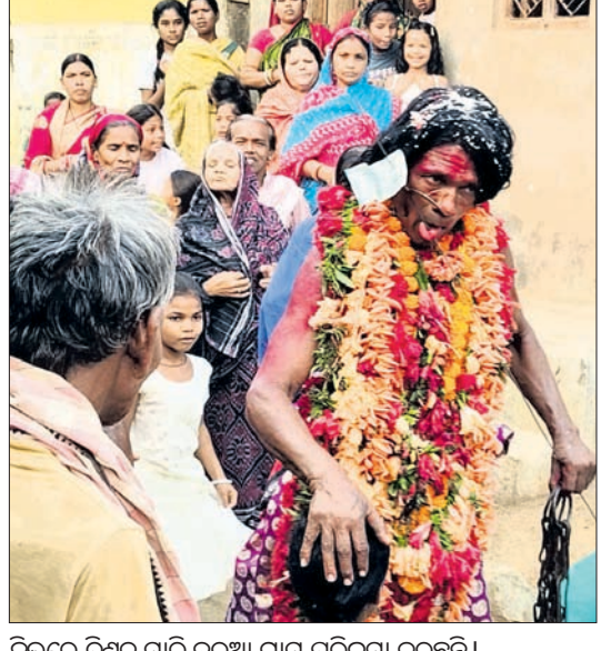
ଲାଠୋରରେ ଓଡ଼ିଶା ଦିବସ ପାଳନ ପ୍ରସଙ୍ଗରେ ଲାଠୋର ଗାଁରେ ଲାଠି ଯାତ୍ରା କରାଯାଇଛି ।