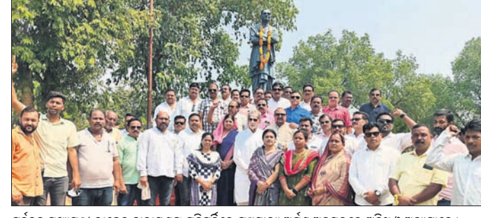
ପୂର୍ବତନ ମୁଖ୍ୟମନ୍ତ୍ରୀ ରାଜେନ୍ଦ୍ର ନାରାୟଣ ସିଂଦେଓଙ୍କ ଜୟନ୍ତୀରେ ମୁଖ୍ୟମନ୍ତ୍ରୀ ଅର୍ପଣ ଅବସରରେ ଅତିଥି ଓ ଅନ୍ୟମାନେ ।