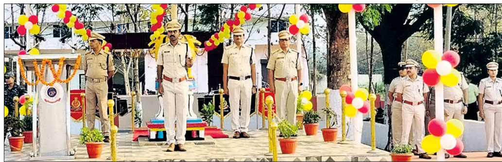
ପୋଲିସ ପ୍ରତିଷ୍ଠା ଉତ୍ସବରେ ଏସ୍ପି ଅଭିବାଦନ ଗ୍ରହଣ କରୁଛନ୍ତି ।