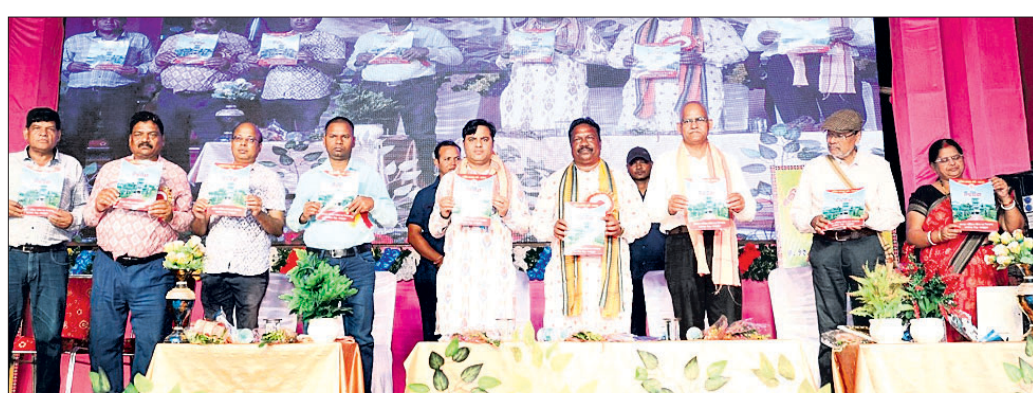
ଅତିଥିମାନଙ୍କ ଦ୍ୱାରା ରୌପ୍ୟ ଜୟନ୍ତୀ ସମ୍ମାନିତା ନିର୍ଦ୍ଦେଶିକା ଉନ୍ମୋଚନ କରାଯାଇଛି।