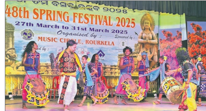
ଉଦ୍‌ଯାପନୀ ସନ୍ଧ୍ୟାରେ କଳାକାରମାନେ ନୃତ୍ୟ ପରିବେଷଣ କରୁଛନ୍ତି।