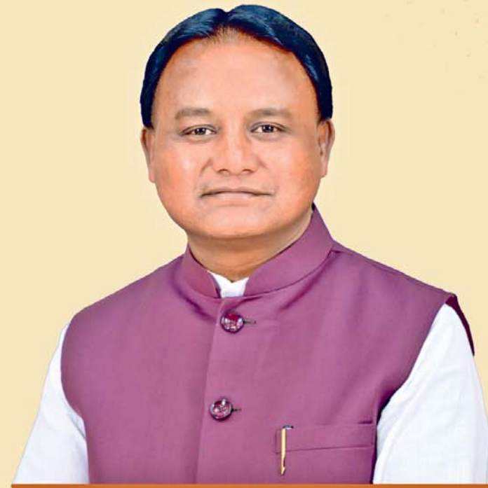
ଶ୍ରୀ ମୋହନ ଚରଣ ପ୍ରାଝୀ ମୁଖ୍ୟମନ୍ତ୍ରୀ, ଓଡ଼ିଶା