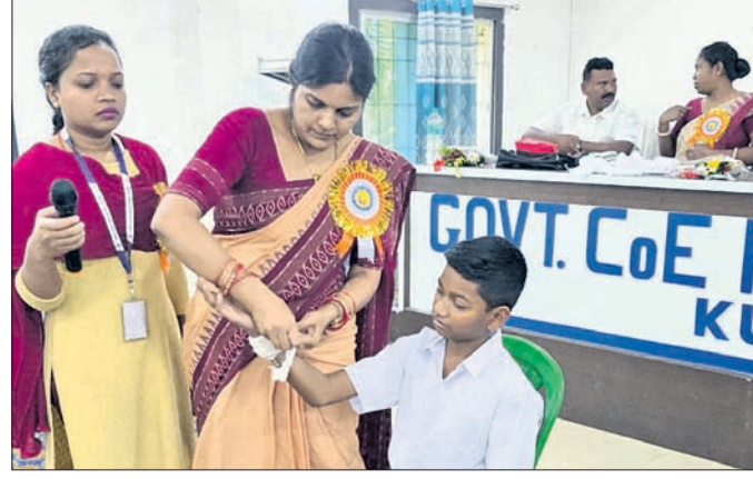
ଜଣେ ଛାତ୍ରକୁ ପ୍ରାଥମିକ ଚିକିତ୍ସା ଦିଆଯାଇଛି।