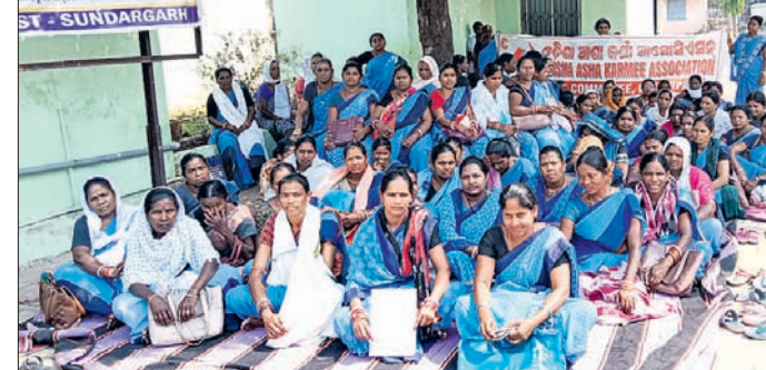
ଆଶାକର୍ମୀମାନେ ଧାରଣାରେ ବସିଛନ୍ତି।

ସୁନ୍ଦରଗଡ଼ ଜିଲ୍ଲା ଲକ୍ଷ୍ମଣାପଡ଼ା ଗୋଷ୍ଠୀ ସ୍ୱାସ୍ଥ୍ୟ କେନ୍ଦ୍ରରେ ଆଶା କର୍ମୀମାନେ ପାଞ୍ଚଶା ପାଇବା ଦାବିରେ ଧାରଣା ଦେବା ସହିତ ଏକ ଦାବିପତ୍ର ପ୍ରଦାନ କରିଥିଲେ। ପ୍ରତିଶ୍ରୁତି ପାଇବା ପରେ ଧାରଣା ପ୍ରତ୍ୟାହତ ହୋଇଥିବା ଜଣାପଡ଼ିଛି। ଲକ୍ଷ୍ମଣାପଡ଼ା ଗୋଷ୍ଠୀ ସ୍ୱାସ୍ଥ୍ୟ କେନ୍ଦ୍ର ଅଧୀନରେ ପ୍ରାୟ ୧୯୪ ଜଣ ଆଶାକର୍ମୀ କାର୍ଯ୍ୟରତ ଅଛନ୍ତି। ସେଥି ମଧ୍ୟରୁ ଅନେକ ଆଶା ବିଧବା, ସ୍ତ୍ରୀମାନେ ପରିତ୍ୟକ୍ତ, ଅସହାୟ ଓ କିଛି ସାମାଜିକ ଅସୁବିଧା ସମ୍ଭାବନା ନିୟମ ଅନୁଯାୟୀ କାର୍ଯ୍ୟ କରୁଥିବା ସତ୍ତ୍ୱେ ଲକ୍ଷ୍ମଣାପଡ଼ା ଗୋଷ୍ଠୀ ସ୍ୱାସ୍ଥ୍ୟ କେନ୍ଦ୍ର ଆଶାମାନେ ଫେବୃଆରୀ ଓ ମାର୍ଚ୍ଚ ମାସରେ ପାଞ୍ଚଶା ପାଇବାକୁ ବଞ୍ଚିତ ହୋଇଥିଲେ। ଏଥି ଯୋଗୁ ଅନେକ ଅଭାବ