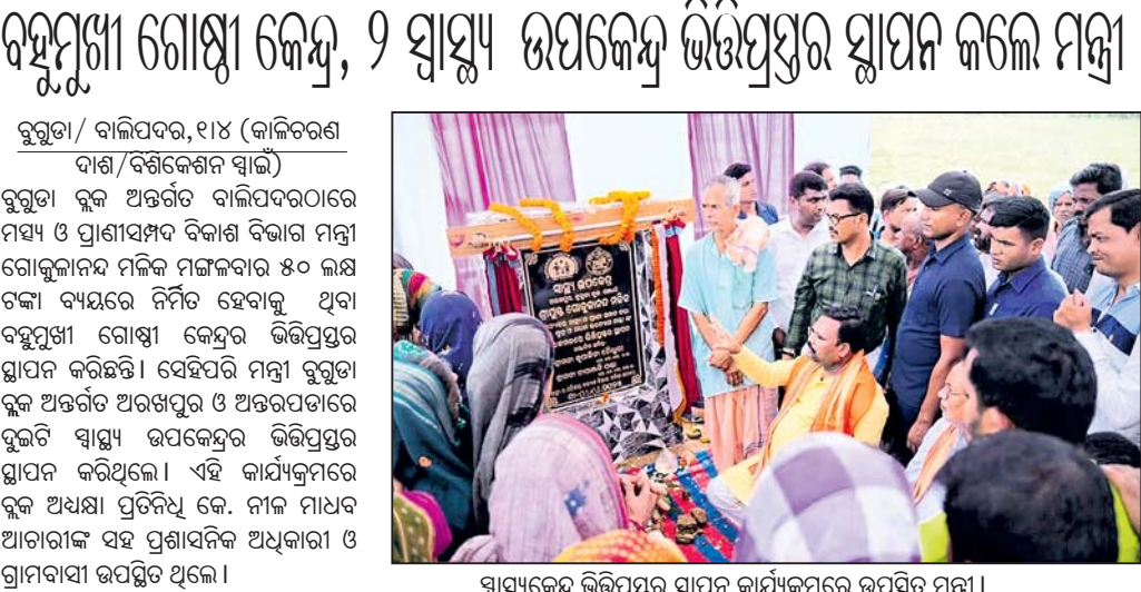
ସାମ୍ବାକେନ୍ଦ୍ର ଭିତ୍ତିପ୍ରସାର ସ୍ଥାପନ କାର୍ଯ୍ୟକ୍ରମରେ ଉପସ୍ଥିତ ମନ୍ତ୍ରୀ।