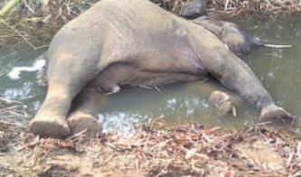
ନାକ ଭିତରେ ପଡ଼ିଥିବା ହାତୀର ମୃତଦେହ।

ପାଲଲହଡ଼ା, ୧୪ (ବିବ୍ୟକ୍ଷେପି ଦାଶ) ଅନୁଗୋଳ ଜିଲ୍ଲା ପାଲଲହଡ଼ା ରେଞ୍ଜ ସଭାପତି ଗ୍ରାମ ନିକଟ ଜଙ୍ଗଲରେ ଥିବା ଏକ ନାକକୁ ମଙ୍ଗଳକାରୀ ଦନ୍ତା ହାତୀର ମୃତଦେହ ବନ ବିଭାଗ ଜବତ କରିଛି। ସୂଚନା ଅନୁଯାୟୀ, ଭୋର ସମୟରେ ଏକ ନାକ ଭିତରେ ଦନ୍ତା ହାତୀର ମୃତଦେହ ପଡ଼ିଥିବା ସଭାପତି ଗ୍ରାମର କେତେଜଣ ଲୋକ ଦେଖି ବନ ବିଭାଗକୁ ସୂଚନା ଦେଇଥିଲେ। ପାଲଲହଡ଼ା ବନ ବିଭାଗ ଅଧିକାରୀ ଘରଣାଗୁଳରେ ପହଞ୍ଚି ୭ ଗୁ. ୮ ବର୍ଷର ଦନ୍ତାହାତୀର ମୃତଦେହ ଜବତ କରିଥିଲେ। ନାକକୁ ପାଣି ପିଇବାକୁ ଆସିଥିବା ହାତୀଟି ଖସି ପଡ଼ି ପ୍ରାଣ ହରାଇଥିବା ଅନୁମାନ କରାଯାଇଥିବା ରେଞ୍ଜ ଅଧିକାରୀ କହିଛନ୍ତି। ଦେବଗଡ଼ ଡି.ଏସ.ଏ. ଏବଂ ଖାଲିଲତ ଲାଲପ ଏକ୍ସପୋର୍ଟ ଟିମ୍ ପହଞ୍ଚି ତଦନ୍ତ କରିବା ପରେ ପାଲଲହଡ଼ା ପ୍ରାଣାଧୀନ ଡିକ୍ରେଟରୀର ତାହା ମୃତଦେହ ବ୍ୟବଚ୍ଛେଦ କରିଥିଲେ।