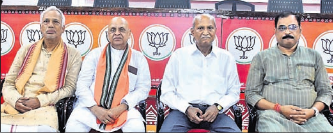
ଭାଜପା ରାଜ୍ୟ କାର୍ଯ୍ୟାଳୟରେ ଅନୁଷ୍ଠିତ ଓଡ଼ିଆ ଦିବସ କାର୍ଯ୍ୟକ୍ରମରେ ବକାୟ ଚେତୁବତ୍ତ।