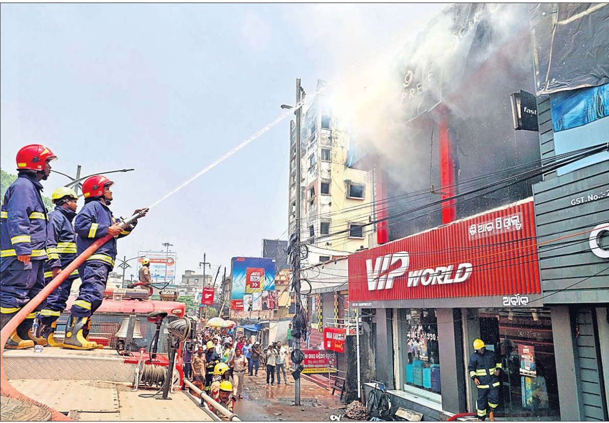
କଟକ ବୋଲପୁଣ୍ୟାଳୟରେ ଏକ ଲଗେଜ୍ ଶୋ 'ରୁମ୍'ରେ ମଙ୍ଗଳବାର ଲାଗିଥିବା ନିଆଁକୁ ଅଗ୍ନିଶମ କର୍ମଚାରୀ ଲିଭାଇଛନ୍ତି।