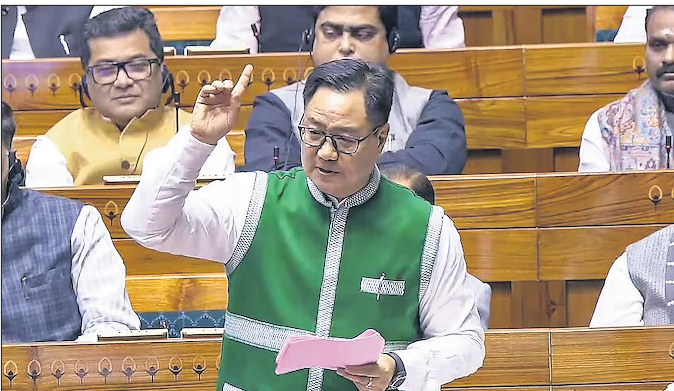
ଲୋକ ସଭାରେ ସଂସଦୀୟ ବ୍ୟାପାର ମନ୍ତ୍ରୀ କିରେନ୍ ରିଜିକୁ ଉଦ୍‌ଘୋଷଣା ଦେଉଛନ୍ତି।