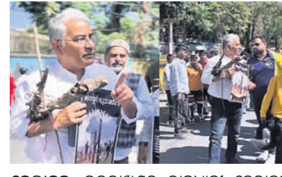
ଡେରାଡୁନ: ଉତ୍ତରାଖଣ୍ଡର ରାଜଧାନୀ ଡେରାଡୁନରେ ବିକାଶମୂଳକ ପ୍ରକଳ୍ପ ପାଇଁ ବୃକ୍ଷ କାଟିବାକୁ ବିରୋଧ କରି 'ପରିବେଶ ବଞ୍ଚାଅ' ଆନ୍ଦୋଳନ ୨.୦ ବ୍ୟାନରରେ ପରିବେଶବିତ୍ ତଥା ବୁଦ୍ଧିଜୀବୀମାନେ ଏକତ୍ର ହୋଇ ବୃକ୍ଷଗୁଡ଼ିକର ପ୍ରତୀକାତ୍ମକ ଅତିମ ସଂଖ୍ୟା ଯାତ୍ରା କରିଛନ୍ତି।

ଦ୍ୱାରା ଆୟୋଜିତ ହେଉଛି। ବିଶ୍ୱ ଅତିନିମ୍ନ ସଚେତନତା ଦିବସ ସମୟରେ ପାଇଁ ଗଛର ଅତିମ ସଂଖ୍ୟା ଯାତ୍ରା ଆୟୋଜିତ ହେଉଛି।