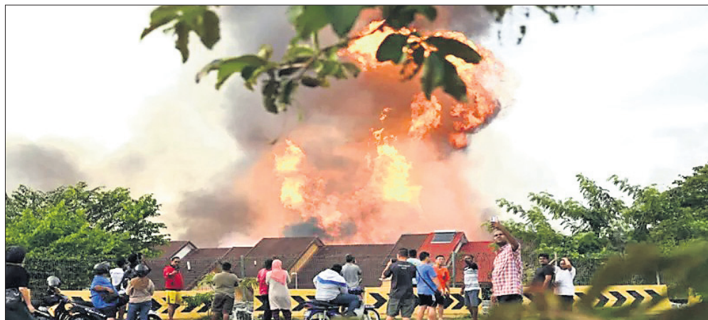
କୂଆଲାଲମ୍ପୁର ଉପକଣ୍ଠ ପୂର୍ତ୍ତ ହାଇବ୍ରିଡ୍ରେ ଏକ ଗ୍ୟାସ୍ ପାଇପଲାଇନ ଫାଟିଯିବା ଫଳରେ ଅଗ୍ନିକାଣ୍ଡ ଘଟିଛି।

ମାଲେସିଆ ରାଜଧାନୀ କୂଆଲାଲମ୍ପୁର ନିକଟ ସେଲଙ୍ଗୋର ରାଜ୍ୟ ପୂର୍ତ୍ତ ହାଇବ୍ରିଡ୍ ସହରରେ ଏକ ଗ୍ୟାସ୍ ପାଇପଲାଇନ ଫାଟିଯିବାରୁ ୪୯ ଘର ଖୁସ ହୋଇଛି।