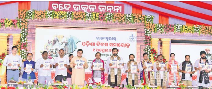
ରାଜ୍ୟସ୍ତରୀୟ ଓଡ଼ିଶା ଦିବସ ପାଇଁ କାର୍ଯ୍ୟକ୍ରମରେ ମୁଖ୍ୟମନ୍ତ୍ରୀ ମୋହନ ଚରଣ ମାଝୀ ଏବଂ ଅନ୍ୟ ଅତିଥିମାନେ ଉତ୍ତମ ପ୍ରସଙ୍ଗ ଏବଂ ଓଡ଼ିଶା ଚିତ୍ରର ସ୍ୱପ୍ନ ସଂଖ୍ୟା ଉନ୍ନୋତ୍ତର କରୁଛନ୍ତି।