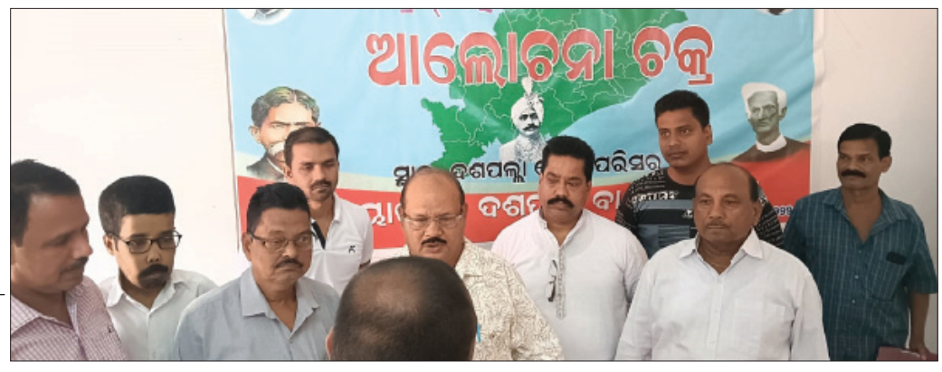
ଆଲୋଚନାଚକ୍ରରେ ଭାଗ ନେଇଥିବା ଅତିଥି ।