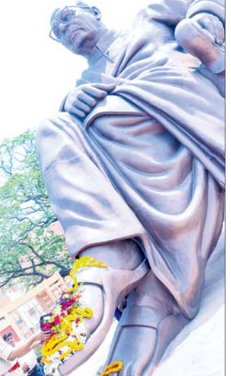
ଯାଜପୁରରେ ଥିବା ବିଜୁ ପଟ୍ଟନାୟକଙ୍କ ପ୍ରତିମୂର୍ତ୍ତିରେ ମାଲ୍ୟାପର୍ଚ୍ଚା ।