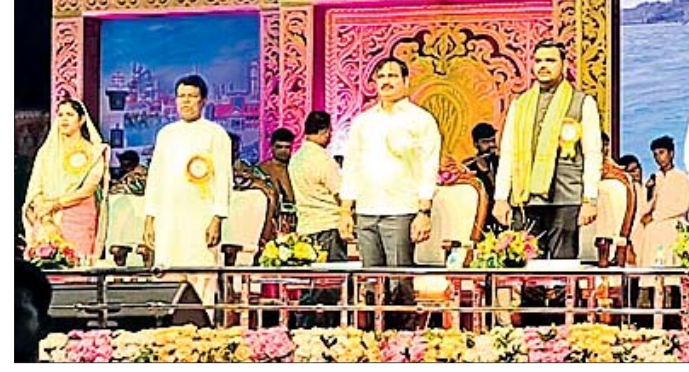
ଓଡ଼ିଶା ଦିବସ, ଜିଲ୍ଲା ମହୋତ୍ସବ 'କଲ୍ଲୋଳ' ଉଦ୍‌ଘାଟନା କାର୍ଯ୍ୟକ୍ରମରେ ଯୋଗଦେଇଥିବା ଅତିଥିମାନେ ।