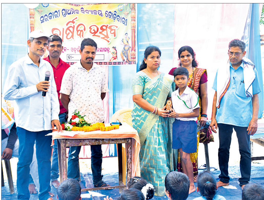
ବାର୍ଷିକ ଉତ୍ସବରେ ଜଣେ କୃତୀ ଛାତ୍ରଙ୍କୁ ପୁରସ୍କୃତ କରାଯାଇଛି ।