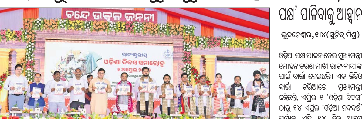
ରାଜ୍ୟସ୍ତରୀୟ ଓଡ଼ିଶା ଦିବସ ପାଇଁ କାର୍ଯ୍ୟକ୍ରମରେ ମୁଖ୍ୟମନ୍ତ୍ରୀ ମୋହନ ଚରଣ ମାଝୀ ଏବଂ ଅନ୍ୟ ଅତିଥିମାନେ ଉତ୍ତମ ପ୍ରସଙ୍ଗ ଏବଂ ଓଡ଼ିଶା ବିଭୂତ୍ୟର ସ୍ୱତନ୍ତ୍ର ସଂଖ୍ୟା ଉନ୍ନୋତ୍ତର କରୁଛନ୍ତି।