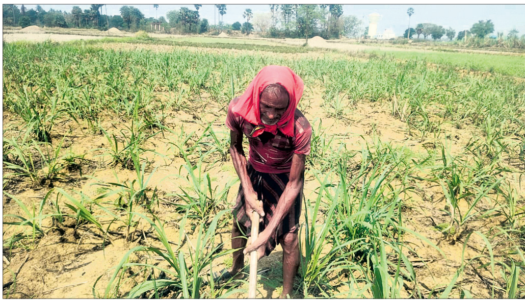
କେମାଦେଇପୁରର ଜଣେ ଚାଷୀ ଆଖୁ ଚାଷ କରୁଛନ୍ତି ।

ନୟାଗଡ଼ ଜିଲ୍ଲାରେ ଆଖୁ ଚାଷୀଙ୍କୁ ଅଣଦେଖା କରି ଅଣଚାଷୀଙ୍କୁ ରଖି ଦେବା ମହଙ୍ଗା ପଡ଼ିଛି । ଯେଉଁ ଗାଁର ୮୦ ପରିବାର ଆଖୁଚାଷୀ ଥିଲେ ସେହି ଗାଁରେ ମାତ୍ର ଜଣେ ପରିବାର ଆଖୁ ଚାଷ କରିବା ଘଟଣା ସରକାର ଓ ପ୍ରଶାସନର କାର୍ଯ୍ୟକ୍ରମରେ ପକାଇଛି । ଏପରିକି ଚାଷୀ ଓ ଚାଷ ପାଇଁ ନୟାଗଡ଼ କେନ୍ଦ୍ର ସମବାୟ ବ୍ୟାଙ୍କର ଭୂମିକାକୁ ମଧ୍ୟ ଅଲୁକି ନିର୍ଦ୍ଦେଶ କରିଛି । ସରକାର ଆଖୁଚାଷକୁ ପ୍ରୋତ୍ସାହନ ଦେଉଥିଲେ ମଧ୍ୟ ନୟାଗଡ଼ ଜିଲ୍ଲାରେ ଆଖୁ ଚାଷ ହୁଏ ପାଇବା ଘଟଣା ଚିତ୍କାର କାରଣ ପାଇଥିଲା । ତେବେ ସରକାରୀ ଯୋଜନାର ସୁଫଳ ଚାଷୀ ବଦଳରେ ଅଣଚାଷୀ ନେଉଥିବାରୁ ଆଖୁଚାଷ ନୟାଗଡ଼ ଜିଲ୍ଲାରେ ହୁଏ ପାଇବାର କାରଣ ବୋଲି ଚର୍ଚ୍ଚା ହୋଇଛି ।