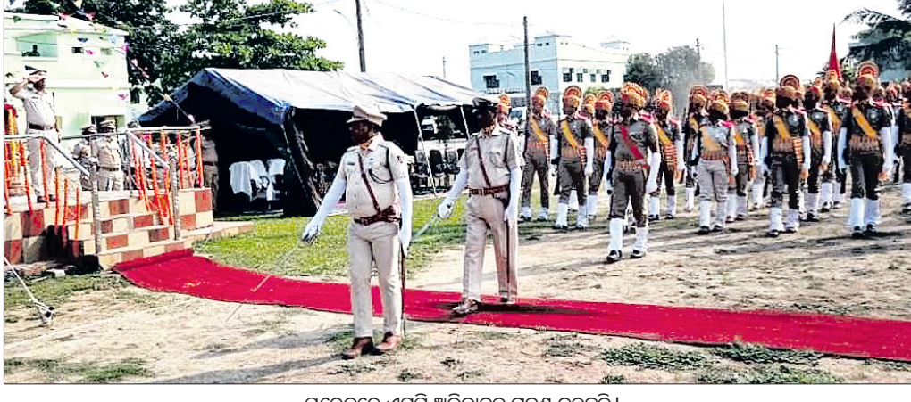
ପରେତରେ ଏସ୍ପି ଅଭିବାଦନ ଗ୍ରହଣ କରୁଛନ୍ତି।