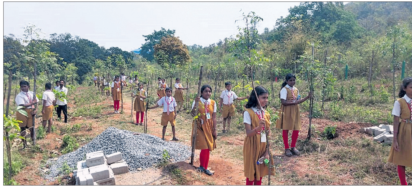
ବନୀକରଣ ସ୍ଥଳ ପିଲାମାନେ ବୁଲି ଦେଖୁଛନ୍ତି ।

ନୟାଗଡ଼ ଗଭନ ଥାନା ଆଇଆଇସିଙ୍କୁ ଶ୍ରେଷ୍ଠ ଇନ୍ସପେକ୍ଟର ସମ୍ମାନ