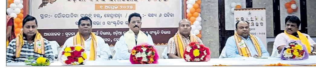
ଓଡ଼ିଶା ଦିବସ ପାଳନ ଅବସରରେ ଉପସ୍ଥିତ ଅତିଥି।