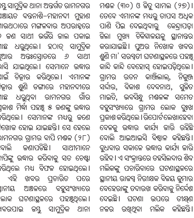
ମହାନଦୀରେ ନିଖୋଜ ସୂଚକଙ୍କୁ ଖୋଜା ଯାଉଛି ।