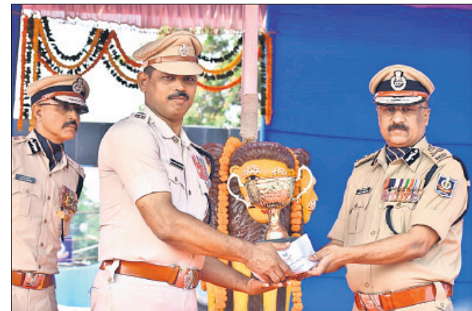
ଡିକିପି ଗଭନ ଥାନା ଆଇଆଇସିଙ୍କୁ ସମ୍ମାନିତ କରୁଛନ୍ତି ।

ଏହି ଉତ୍ସବକୁ ପିଲାମାନେ ସ୍ଥଳର ଚାରିକାନ୍ଥ ଭିତରେ ସୀମିତ ନ ରଖି ନିଆରା ଭଙ୍ଗରେ ପାଳିଛନ୍ତି ।