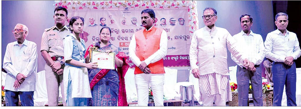
ଜିଲ୍ଲାପ୍ରଶାସନ ଓଡ଼ିଶା ଦିବସ ପାଳନ ଅବସରରେ ଯୋଗଦେଇଥିବା ଅତିଥିମାନେ ।