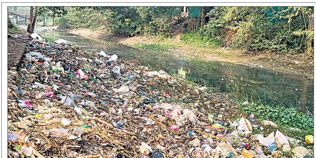
ଜଗତ୍ସିଂହପୁର ଜିଲାର ଜୀବନରେଖା କୁହାଯାଉଥିବା ଚାକଦଣ୍ଡା କୋଳରେ କୁଜଙ୍ଗ ଭୂତପୁଣ୍ଡାଳ ବଜାରରୁ ଉତ୍ପତ୍ତ ଆବର୍ଜନା ପଡ଼ିରହିଛି। ଏହି ପାଣିକୁ ପାରାଦୀପର ସମସ୍ତ ଲୋକ ପାନୀୟ ଜଳଭାବେ ବ୍ୟବହାର କରୁଛନ୍ତି।

ସାଗର ପୋଖରୀରୁ କଳ୍ପ ଶୋଭାଯାତ୍ରା କରାଯିବା ସହ ବିଦ୍ୟାଳୟ ପରିସରରେ ଗାୟତ୍ରୀ ଯଜ୍ଞ ଆୟୋଜନ କରାଯାଇଥିଲା। ଏହା ସାରିବାପରେ ନୂତନ ଶିଶୁମାନଙ୍କୁ ସେମାନଙ୍କ ଅଭିଭାବକଙ୍କ ଗହଣରେ ଖଡ଼ିଛୁଆଁ କାର୍ଯ୍ୟକ୍ରମ କରାଯାଇଥିଲା। ଏହି ଅବସରରେ ବିଦ୍ୟାଳୟ ତରଫରୁ ବିଭିନ୍ନ ପ୍ରଦର୍ଶନୀ ଯଥା କୋଣ ଓ ସଂଖ୍ୟା ଜ୍ଞାନ, ଗଣିତ ଜ୍ଞାନ ଭଳି ଅନେକ ଶିକ୍ଷା ଉପକରଣ ପ୍ରଦର୍ଶନ କରାଯାଇଥିଲା। କାର୍ଯ୍ୟକ୍ରମରେ ବିଦ୍ୟାଳୟ ପରିଚାଳନା ସମିତିର ସଦସ୍ୟ, ସମ୍ପାଦକ, ସଭାପତି ତଥା ଉପସେଷ୍ଟା ମଣ୍ଡଳୀର ସଭ୍ୟ ଓ କର୍ମଚାରୀମାନେ ଉପସ୍ଥିତ ଥିଲେ।