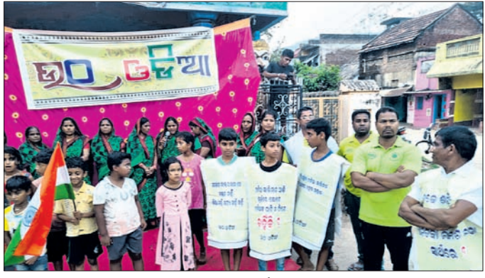
ଓଡ଼ିଶା ଦିବସ ଅବସରରେ 'ଉଠ ଓଡ଼ିଆ' କାର୍ଯ୍ୟକ୍ରମରେ ସାମିଲ ଛାତ୍ରୀଛାତ୍ର ।