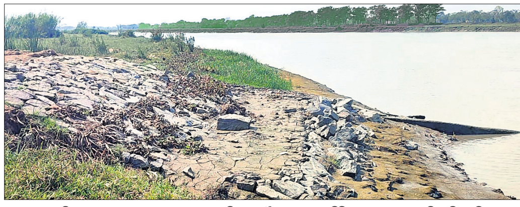
ରାଜକନିକା ବୁଦ୍ଧ ଶୁକଦେବପୁର ଓ ଗୋପାଳପୁର ନିକଟସ୍ଥ ବୈତରଣୀ ନଦୀର ତିନିତର ଘାଟ ପଥର ପ୍ୟାକିଂ ଖସିଯାଇଛି।

ରାଜକନିକା, ୧୪ (ସଞ୍ଜୟ କୁମାର ଦାଶ) ନଦୀକଳ ପ୍ରବାହିତ ଦାଉରୁ ଧନକାବନକୁ ସୁରକ୍ଷା ଦେବାକୁ ନଦୀକୂଳିଆ ଜନସମ୍ପର୍କରେ ଚଳା ବ୍ୟୟ କରାଯାଇ ପଥର ପ୍ୟାକିଂ ହେଉଛି। ହେଲେ ଏହି ପଥର ପ୍ୟାକିଂରେ କେତେଦୂର ସୁରକ୍ଷା ଅବଲମ୍ବନ କରାଯାଇଛି ଓ ଏଥିରେ କେତେ ପରିମାଣର ନିରପେକ୍ଷତା ରହିଛି ତାହାର ତଦାରଖ ଆଜି ତତ୍ତ୍ୱବହ ବିଭାଗ କରୁନାହିଁ। ଫଳରେ ବିଭାଗ ଅଧୀନ ରାଜକନିକା ବୁଦ୍ଧ ଶୁକଦେବପୁର ଓ ଗୋପାଳପୁର ନିକଟସ୍ଥ ବୈତରଣୀ ନଦୀର ତିନିତର ଘାଟ ପଥର ପ୍ୟାକିଂକୁ ଦେଖିଲେ ହିଁ ବୁଝାପଡ଼େ।