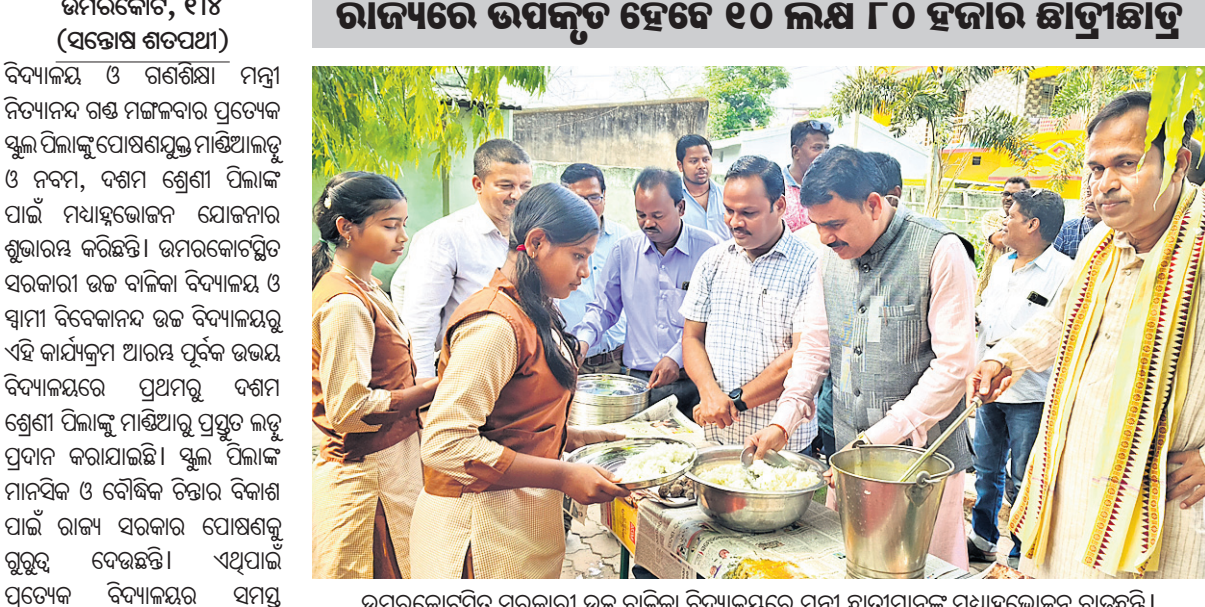
ଉତ୍କଳଦେଶର ସରକାରୀ ଉଚ୍ଚ ବାଳିକା ବିଦ୍ୟାଳୟରେ ମନ୍ତ୍ରୀ ଛାତ୍ରୀମାନଙ୍କୁ ମଧ୍ୟାହ୍ନଭୋଜନ ବାଡ଼ୁଛନ୍ତି ।