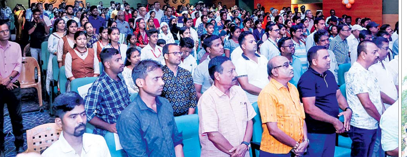
ଜିଲ୍ଲାପ୍ରଶାସନ ଓଡ଼ିଶା ଦିବସ କାର୍ଯ୍ୟକ୍ରମରେ ଯୋଗଦେଇଥିବା ଜନସାଧାରଣ ।