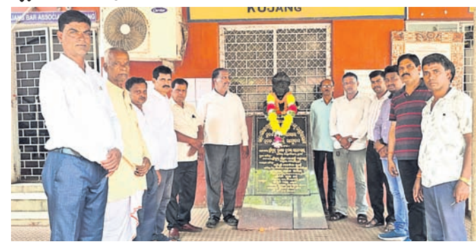
କୁଜଙ୍ଗ ବାର୍ ଆସୋସିଏଶନର ସଦସ୍ୟମାନେ ଓଡ଼ିଶା ଦିବସ ପାଳନ କରୁଛନ୍ତି।

କୁଜଙ୍ଗ ବାର୍ ଆସୋସିଏଶନ ତରଫରୁ ୧୦ଷ୍ଟମ ଓଡ଼ିଶା ଦିବସ ପାଳନ କରାଯାଇଅଛି। ଏହି ଅବସରରେ ଓଡ଼ିଆ ଭାଷାକୁ ରକ୍ଷିତ କରି ସ୍ୱତନ୍ତ୍ର ଭାଷା ପରିଚୟ ଦେଇଥିବା ମଧୁସୂଦନ ଦାସ, ରାଧାନାଥ ରାୟ, ଫକୀର ମୋହନ ସେନାପତି, ଗୋଦାବରୀଶ ମିଶ୍ର ପ୍ରମୁଖଙ୍କୁ ଶ୍ରଦ୍ଧାଞ୍ଜଳି ଦିଆଯାଇଥିଲା। ଏସବୁ ମହାପୁରୁଷଙ୍କ ଉଦ୍ୟମରେ ୧୯୩୭ ଏପ୍ରିଲ ୧ରେ ଓଡ଼ିଶା ସ୍ୱତନ୍ତ୍ର ଭାଷାଭିତ୍ତିକ ପ୍ରଦେଶର ମାନ୍ୟତା ପାଇଥିଲା ବୋଲି ଅତିଥିମାନେ କହିଥିଲେ। ଅନ୍ୟପଟେ ବାର୍ ଆସୋସିଏଶନର ସଭାପତି ଏନ୍ତୁ ଗ୍ରହଣ କରାଯିବ ବୋଲି ସେ କହିଛନ୍ତି।