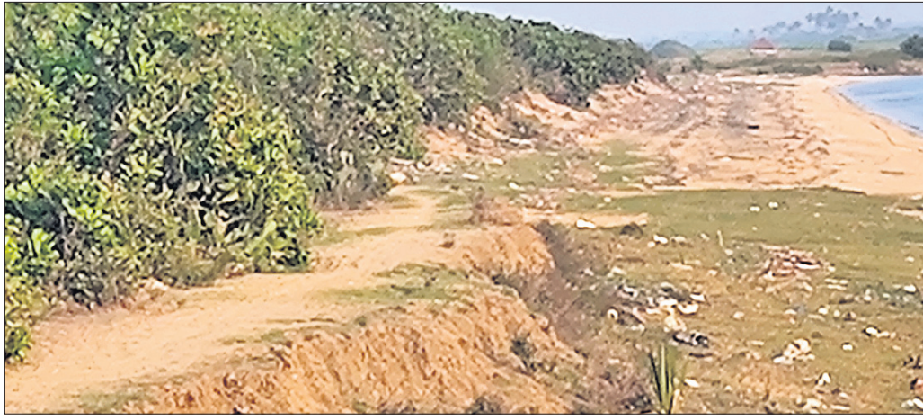
ରାମନଗର ପଞ୍ଚାୟତ ବାହାକୁଦ ମୌଜା ସଂଲଗ୍ନ ମହାନଦୀ ତେଜ ମାଡ଼ରେ କାଢୁ ଜଙ୍ଗଲ ଅବକ୍ଷୟ ହେଉଛି।

କେନ୍ଦ୍ରାପଡ଼ା ଜିଲ୍ଲା ମହାନଦୀତୀର ବାହାକୁଦ ମୌଜା କାଢୁ ଜଙ୍ଗଲ ମହାନଦୀ ଗର୍ଭରେ ଲୀନ ହେବାରେ ଲାଗିଛି। ସାମୁଦ୍ରିକ କୁଆର ତେଜ ମାଡ଼ରେ କୁଳ ଲଢ଼ୁଛି। ଫଳରେ ନଦୀ ପାର୍ଶ୍ୱରେ ଶତାଧିକ ସଂଖ୍ୟାରେ କାଢୁ ଗଛ ମହାନଦୀରେ ଧରାଶାୟୀ ହେଉଥିବା ଘ୍ନାନାୟ ଲୋକମାନେ ଅଭିଯୋଗ କରିଛନ୍ତି। ମିଳିଥିବା ସୂଚନା ଅନୁସାରେ, ୧୯୭୨ ମସିହାଠାରୁ ମୂଢ଼ିକା ସଂରକ୍ଷଣ ବିଭାଗ ପକ୍ଷରୁ କାଢୁ ଚାବା ରୋପଣ କରାଯାଇଥିଲା। ପରବର୍ତ୍ତୀ ସମୟରେ ୧୯୮୦ ମସିହାଠାରୁ ରାଜ୍ୟ କାଢୁ ଉନ୍ନୟନ ନିଗମ ଅଧିକାରୀ ଆସିଥିଲା। ରାମନଗର ମୌଜାର ୩୫୪ ଏକର ଜମିରେ ୧୦ ହକାର ଗଛ, ପିତାପାତ ମୌଜାର ୧୮୪ ଏକର ଜମିରେ ୫ ହକାର ଗଛ ଓ ବାହାକୁଦ ମୌଜାର ୨୮୨ ଏକର ଜମିରେ ୫ ହକାର କାଢୁ ଗଛ ରହିଛି। ହେଲେ ୧୯୯୯ ମହାବାତ୍ୟାରେ ବହୁସଂଖ୍ୟାରେ