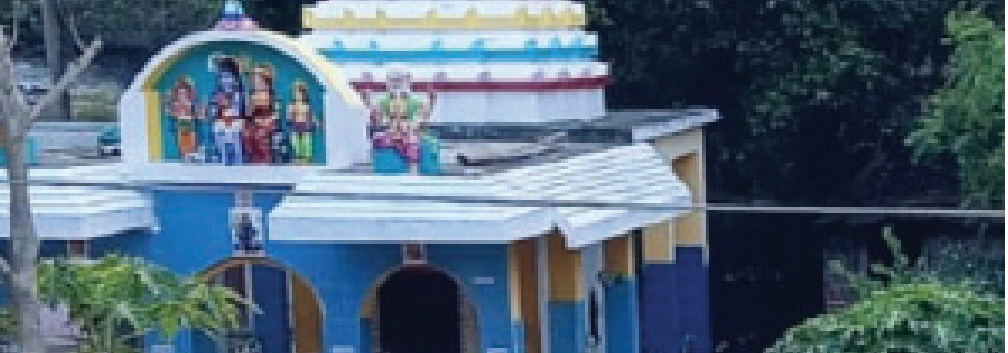
ସ୍ୱପ୍ନେଶ୍ୱର ମନ୍ଦିର ।