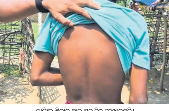
ରାଗିର ଶିକାର ଛାତ୍ର ଶତ ଚିହ୍ନ ଦେଖାଉଛନ୍ତି।

ନାବାକଳ ହୋଇ ମାନରେ ଆପରାଧକ ତିଳା। ମଦ ପିଇଥିବା ଦେଖିଦେବାକୁ ରିଭେଲ ଲୋମାଗୁରା ଘଟଣା। ରାତି କରିବାକୁ ଯାଇ ୪ଟଣ ନବମ ଶ୍ରେଣୀ ଛାତ୍ର ଜଣେ ଶ୍ରେଣୀର ଛାତ୍ରଙ୍କ ଶରୀରର ବିଭିନ୍ନ ସ୍ଥାନକୁ ଚେତୁରେ କାଟି ଶତ ସ୍ଥାନରେ ଲୁଗା ମାରିବା ସହ ବନ୍ଦ କୋଠରେ ନିର୍ଯ୍ୟତନା ଦେବା ଆଲୋଚନା ପୂର୍ଣ୍ଣ କଲେ। ମଧୁରଭଞ୍ଜ ଲୋ ଖୁଣ୍ଟା ଥାନା ଅଧୀନ ବାସିଂଦାଠାରେ ଅନୁସୂଚିତ ଜାତି ଓ ଜନଜାତି, ସଂଖ୍ୟାଲଘୁ ଏବଂ ପଞ୍ଚୁଆବର୍ଣ୍ଣ କଲ୍ୟାଣ ବିଭାଗ ଦ୍ୱାରା ପରିଚାଳିତ ଆବାସିକ ଉଚ୍ଚ ବିଦ୍ୟାଳୟ (ଏସ୍‌ଏସ୍‌ସି)ରେ ଏକଲି ଶ୍ରେଣୀରେ ଘଟଣା ଘାତୀକୁ ଆସିଛି। ରାଗିର ଶିକାର ଶ୍ରେଣୀ ଛାତ୍ରଙ୍କ ପରିବାର ଲୋକେ ସେନେଇ ଥାନାରେ ଅଭିଯୋଗ କରିବା ପରେ ପୋଲିସ୍ ଏକ ମାମଲା(ନଂ.୧୦୭/୨୫) ରୁଜୁକରି ତଦାଘନା ଚଳାଇଛି। ସୁତନାଯୋଗ୍ୟ, ବାରିପଦା ଉତ୍ତମୁର ଅଞ୍ଚଳର ଜଣେ ଛାତ୍ର ବାସିଂଦା ଏସ୍‌ଏସ୍‌ସିରେ ରହି