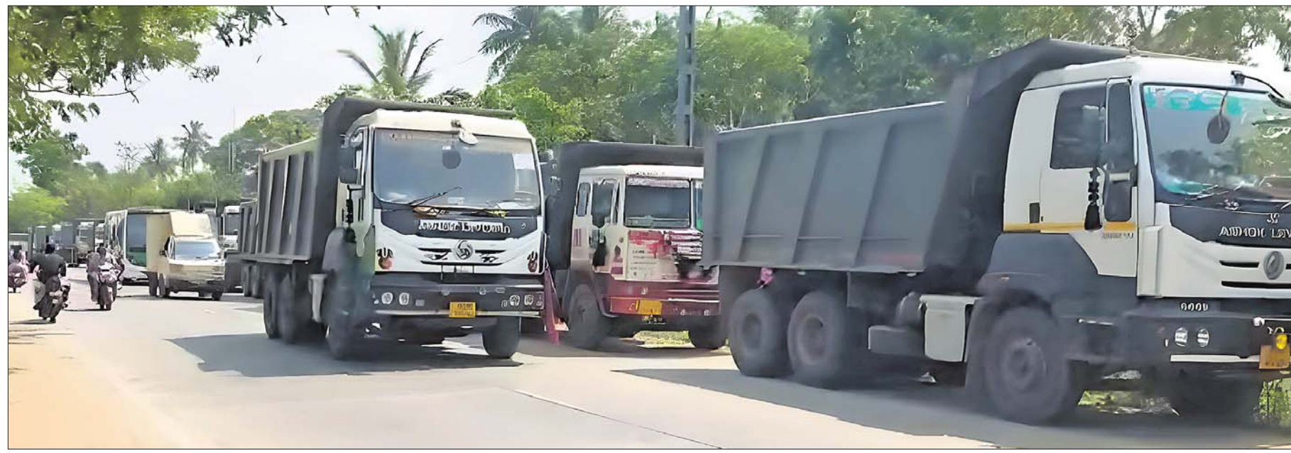
କେନ୍ଦ୍ରାପଡ଼ା ଜିଲ୍ଲା ନିକିରାଇ ଥାନା ଅନ୍ତର୍ଗତ ତ୍ରିଲୋଚନପୁରଠାରେ କଟକ-ଚାନ୍ଦବାଲି ରାଜ୍ୟ ରାଜପଥକୁ ଗୁରୁବାର ହାତଖା, ଚିପ୍ପର ସଂଘ ପକ୍ଷରୁ ୩୦୦ଟି ଦାବିରେ ଅବରୋଧ ଯୋଗୁ ଗାଡ଼ିମୋଟର ଅଟକି ରହିଛି ।