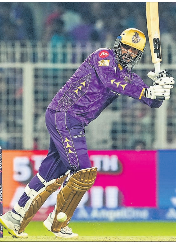
ଶର୍ ଖେଳିବା ଅବସରରେ ଭେକେଟେଣ ଆୟର ।

ଆଇପିଏଲ୍ କାର୍ଯ୍ୟସୂଚୀ (ଆଜିର ମ୍ୟାଚ) ଲକ୍ଷ୍ନୌ ବନାମ ମୁଖାର ସ୍ଥାନ: ଲକ୍ଷ୍ନୌ ସମୟ: ସନ୍ଧ୍ୟା ୭.୩୦ ପ୍ରସାରଣ: ଷ୍ଟାର ସ୍ପୋର୍ଟ୍ସ