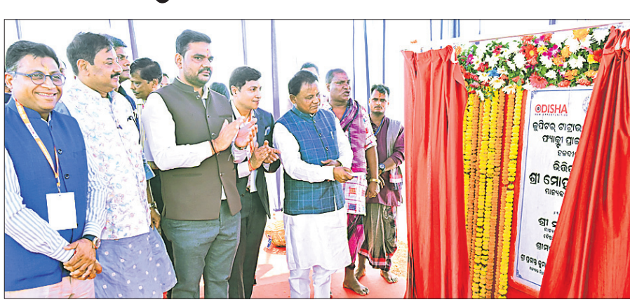
ପୁଞ୍ଜ୍ୟମନ୍ତ୍ରୀ ମୋହନ ଚରଣ ମାଝା ଖୋର୍ଦ୍ଧାର ହଳଦୀପଦାଠାରେ ଏକ ପ୍ରକଳ୍ପର ଭିତ୍ତିପ୍ରସ୍ତର ସ୍ଥାପନ କରୁଛନ୍ତି।