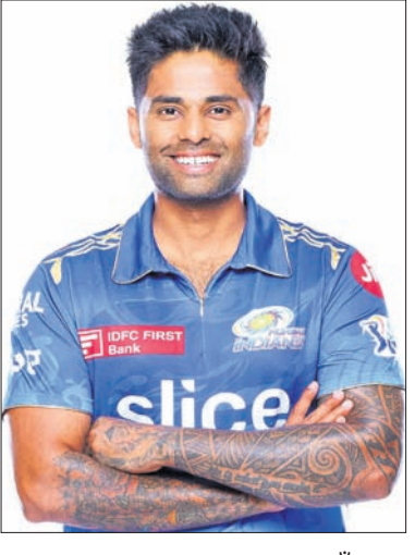
ବଦଳରେ ଗୋଆ ପାଇଁ ଅନୁରୋଧ କରୁଛନ୍ତି ବୋଲି ଏମ୍‌ସିଏ ସମ୍ପାଦକ ଅଭୟ ହତପ କହିଛନ୍ତି ।

ଭାରତୀୟ ଟି୨୦ ଦଳର ଅଧିନାୟକ ସୂର୍ଯ୍ୟକୁମାର ଯାଦବ ମୁଖାର ଛାଡ଼ି ଯାଉ ନାହାନ୍ତି । ମୁଖାର କ୍ରିକେଟ ଆସୋସିଏଶନ (ଏମ୍‌ସିଏ) ପକ୍ଷରୁ ଗୁଜରାଟ ଏହା କୁହାଯାଇଛି । ସର୍ବଶ୍ରେୟ ଲାଗି ମୁଖାର ଛାଡ଼ି ଯିବା ଦଳରେ ଯୋଗଦେବା ପରେ ସୂର୍ଯ୍ୟକୁମାର ମଧ୍ୟ ସମାନ ବାଟ ବାଛିପାରନ୍ତି ବୋଲି କିଛି ରିପୋର୍ଟ ପ୍ରକାଶ ପାଇଥିଲା । ହେଲେ ଏମ୍‌ସିଏ ପକ୍ଷରୁ ରିପୋର୍ଟକୁ ଖଣ୍ଡନ କରାଯାଇଛି । ସୂର୍ଯ୍ୟକୁମାର ମୁଖାର ଆଗାମୀ ଘରୋଇ ସିଜନରେ