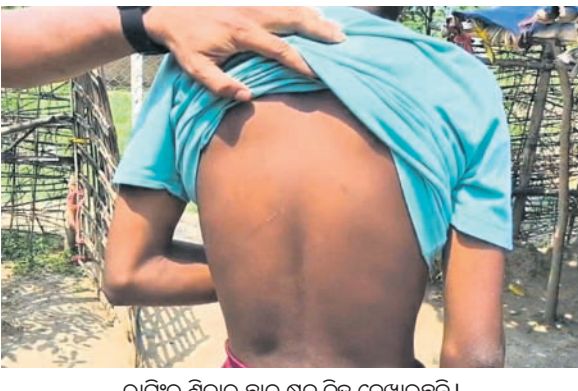
ରାଗିର ଶିକାର ଛାତ୍ର ଶତ ଚିହ୍ନ ଦେଖାଉଛନ୍ତି ।