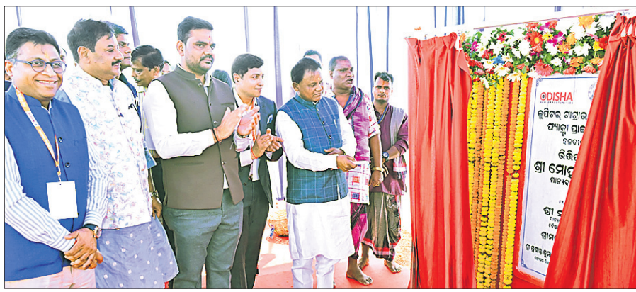
ମୁଖ୍ୟମନ୍ତ୍ରୀ ମୋହନ ଚରଣ ମାଝୀ ଖୋର୍ଦ୍ଧାର ହଳଦୀପଦାଠାରେ ଏକ ପ୍ରକଳ୍ପର ଭିତ୍ତିପ୍ରସ୍ତର ସ୍ଥାପନ କରୁଛନ୍ତି।