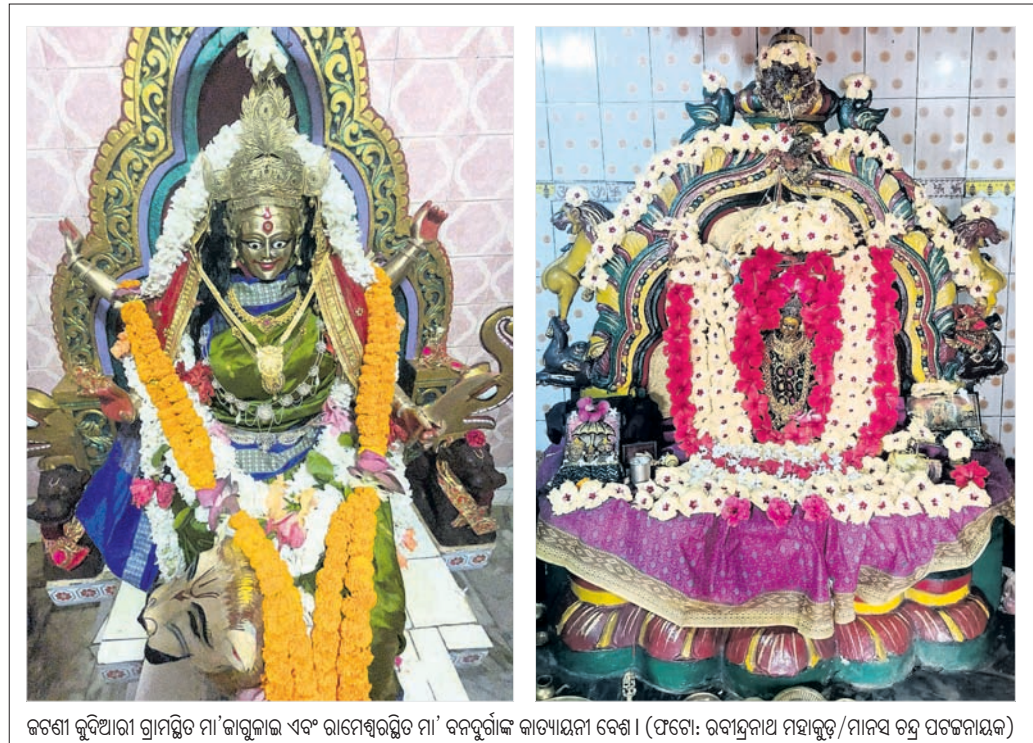
ଜଗଣ କୃତିଆରା ଗ୍ରାମସ୍ଥିତ ମା' ଭାଗୁରାଜ ଏବଂ ରାମେଶ୍ୱରସ୍ଥିତ ମା' ବନପୁରୀଙ୍କ କାର୍ତ୍ତାୟନା ବେଶ ।