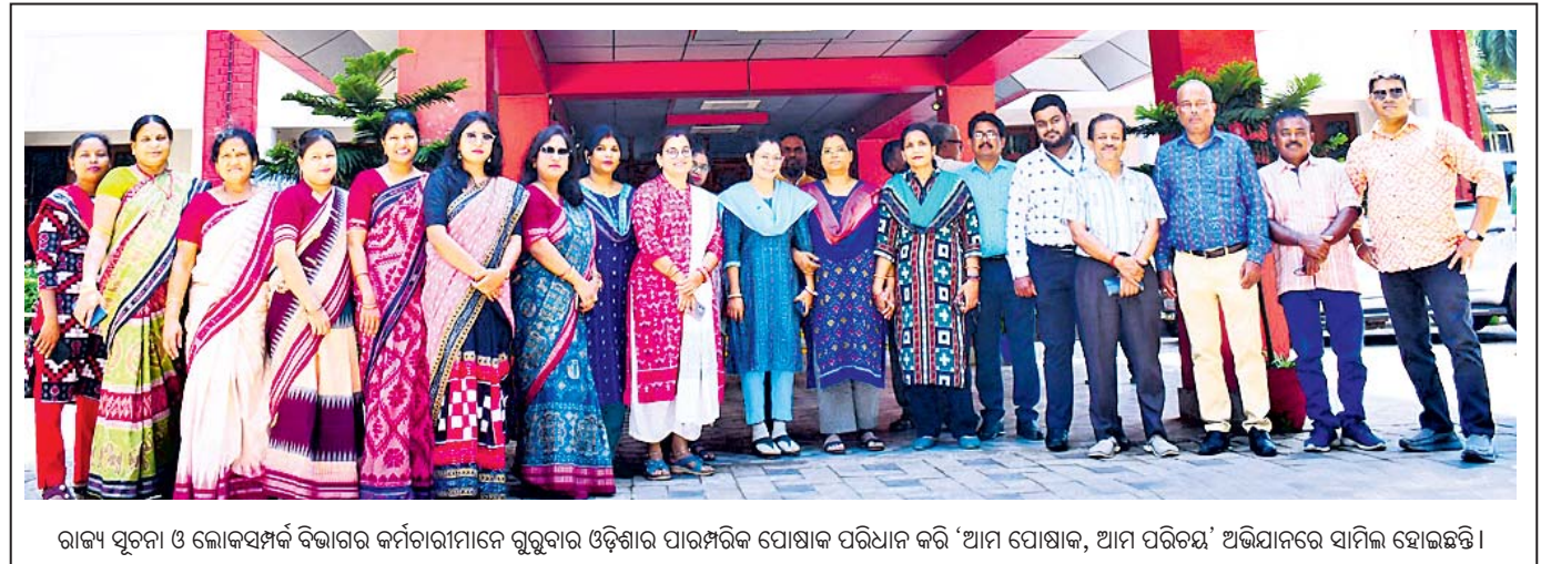
ରାଜ୍ୟ ସୂଚନା ଓ ଲୋକସମ୍ପର୍କ ବିଭାଗର କର୍ମଚାରୀମାନେ ଗୁରୁତ୍ୱପୂର୍ଣ୍ଣ ଓଡ଼ିଶାର ପାରମ୍ପରିକ ପୋଷାକ ପରିଧାନ କରି 'ଆମ ପୋଷାକ, ଆମ ପରିଚୟ' ଅଭିଯାନରେ ସାମିଲ ହୋଇଛନ୍ତି।

ବାଲିଅନ୍ତା, ୩୪ (ନାକମାଧବ ସାହୁ) ବାଲିଅନ୍ତା ବ୍ଲକ୍ ବେଣୁପୁରପ୍ଲଟ ଆଗାମୀ ହରିଦିଆ ସରକାରୀ ଉଚ୍ଚ ବିଦ୍ୟାଳୟର ୧୦ ଫୁଟ ଉଚ୍ଚତା ବିଶିଷ୍ଟ ପ୍ରାୟ ୬୦ ଫୁଟ ଲମ୍ବର ଏକ ପ୍ରାଚୀନ ବ୍ୟବସ୍ଥା ବିକଶିତ ରାଜ୍ୟରେ ଭୁବନେଶ୍ୱର ପଡ଼ିଛି। ଏହି ପ୍ରାଚୀନ ବିଦ୍ୟାଳୟ ପୂର୍ବ ପୂର୍ବେ ତିଆରି ହୋଇଥିଲା। ଏକ ପୋଖରୀ ଓ ବିଲ୍ ପାର୍ଶ୍ୱରେ ଏହି ପ୍ରାଚୀନ ଅବସ୍ଥିତ ଥିବାରୁ ବର୍ଷାଦିନେ ପାଣି ଜମିରହି ତାହା ଦୁର୍ବଳ ହୋଇପଡ଼ିଥିବା ଜଣାଯାଉଛି। ବିଦ୍ୟାଳୟର ପ୍ରଶାସନିକ ପ୍ରକଳ୍ପକୁ ଲାଗି ଏହି ପ୍ରାଚୀନ ନିର୍ମିତ ହୋଇଥିଲା। ପ୍ରାଚୀନ ପାର୍ଶ୍ୱରେ ନକଲ୍‌ସ୍ ଓ ଚ୍ୟାପ ରହିଥିଲେ ମଧ୍ୟ ଏହା କ୍ଷତିଗ୍ରସ୍ତ ହୋଇନାହିଁ। ଗୁରୁତ୍ୱପୂର୍ଣ୍ଣ ସମାଜ ଶ୍ରଦ୍ଧାରେ ବିଦ୍ୟାଳୟକୁ ଆଉଁସ ପ୍ରାଚୀନ ଭୁବନେଶ୍ୱର ପଡ଼ିଥିବା ଶିକ୍ଷକମାନଙ୍କୁ ଶିକ୍ଷକ ଦେଖିବାକୁ ପାଇଥିଲେ। ଏନେଇ ପ୍ରାଥମିକତା ସ୍ଥାନୀୟ ସରକାରଙ୍କୁ ଅବଗତ କରିଥିଲେ। ସରକାରଙ୍କୁ ସୁସାଧକ ପାତ୍ର ବିଦ୍ୟାଳୟକୁ ଆସି ଭୁବନେଶ୍ୱର ପଡ଼ିଥିବା ପ୍ରାଚୀନକୁ ବୁଲି ଦେଖିବା ସହ ବିତିଠିକୁ ଜଣାଇ ତୁରନ୍ତ ପ୍ରାଚୀନ ନିର୍ମାଣ ଦିନରେ ଦୃଷ୍ଟି ଦେବେ ବୋଲି ପ୍ରତିଷ୍ଠିତ ହୋଇଥିଲେ। ପ୍ରାଚୀନ ଭାଙ୍ଗି ପଡ଼ିବା ଯୋଗୁଁ ବିଦ୍ୟାଳୟ ପରିସର ଭିତରକୁ ଗୋଲୁକ ପଶିଯିବାର ସମ୍ଭାବନା ରହିଛି। ଛାତ୍ରଛାତ୍ରୀଙ୍କୁ ସୁରକ୍ଷା ଦୃଷ୍ଟିରେ ରଖି ପ୍ରାଚୀନର ଭଗ୍ନ ଅଂଶକୁ ତୁରନ୍ତ ମରାମତି ପାଇଁ ପ୍ରାଥମିକତା ଗଣେଶ କରଣ ଗୁରୁତ୍ୱପୂର୍ଣ୍ଣ ବାଲିଅନ୍ତା ବିତିଠିକୁ ଲିଖିତ ଭାବେ ଜଣାଇଛନ୍ତି।