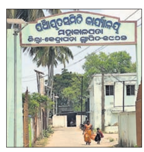
ରୁକ୍ କାର୍ଯ୍ୟାଳୟ ମୁଖ୍ୟ ପାଟକ।

ମହାକାଳପଡ଼ା, ୩୪ (ପ୍ରଗତି ଚକ୍ର ସାଲ୍) କେନ୍ଦ୍ରାପଡ଼ା ଜିଲ୍ଲା ମହାକାଳପଡ଼ା ରୁକ୍ ଅଧ୍ୟକ୍ଷା ବିଜେଡି ସମର୍ଥକ କଳ୍ପନା ରାଉତଙ୍କ ବିରୋଧରେ ଭାଇପା ପକ୍ଷରୁ ଅନାସ୍ଥା ପ୍ରସ୍ତାବ ଅଣାଯାଇଛି। ଜିଲ୍ଲା ପ୍ରଶାସନ ପକ୍ଷରୁ ଶନିବାର ନିର୍ବାଚନ ହେବ ବୋଲି ସ୍ଥିରକୃତ ହୋଇଛି। ଏହାପାଇଁ ଭାଇପା ଓ ବିଜେଡି ରାଜନୈତିକ ଗୋଟି ଚାଳନା ଆରମ୍ଭ କରିଛନ୍ତି। ରୁକ୍‌ରେ ସୁରକ୍ଷା ବ୍ୟବସ୍ଥାକୁ ମଧ୍ୟ କଡ଼ାକଡ଼ି କରାଯାଇଛି। ଅଧ୍ୟକ୍ଷାଙ୍କ ବିରୋଧରେ ଅନାସ୍ଥା ପ୍ରସ୍ତାବ ନିର୍ବାଚନରେ ୩୧ ପଞ୍ଚାୟତର ସମ୍ପର୍କରେ, ସମ୍ପର୍କରେ ଅଧ୍ୟକ୍ଷାଙ୍କୁ କରାଯିବ। ଏହି ନିର୍ବାଚନରେ ଏମ୍‌ପି ଓ ବିଧାୟକ ମଧ୍ୟ ଅଧ୍ୟକ୍ଷାଙ୍କୁ କରାଯିବ ବୋଲି କୁହାଯାଉଛି। ଅଧ୍ୟକ୍ଷା ରାଉତଙ୍କ ମନମୁଖି କାର୍ଯ୍ୟରେ ଅଧ୍ୟକ୍ଷାଙ୍କୁ ହଟାଇବାକୁ ଭାଇପା ସମର୍ଥକ ୪୫ ସଦସ୍ୟଙ୍କ ସମର୍ଥନ