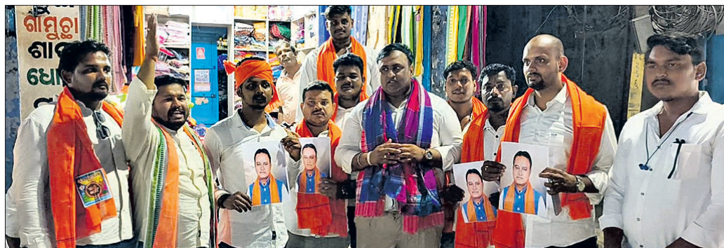
ପାରମ୍ପରିକ ପୋଷାକ ପରିଧାନ ଦିବସ ଅବସରରେ ଭାଗ୍ୟା କର୍ମକର୍ତ୍ତାମାନେ ।