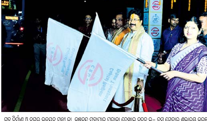
ଗୁରୁ ନିର୍ମାଣ ଓ ନଗର ଉନ୍ନୟନ ମନ୍ତ୍ରୀ ଡା. କୃଷ୍ଣଚନ୍ଦ୍ର ମହାପାତ୍ର ପତ୍ରାକା ଷ୍ଟେସନ ନୂତନ ଇ-ବସ୍ ସେବାର ଶୁଭାରମ୍ଭ କରୁଛନ୍ତି।