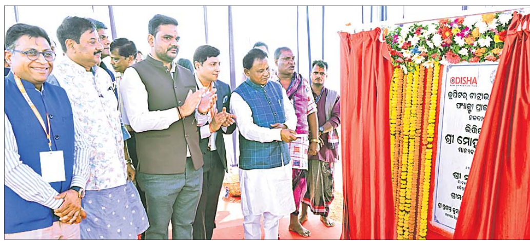
ମୁଖ୍ୟମନ୍ତ୍ରୀ ମୋହନ ଚରଣ ମାଝୀ ଖୋର୍ଦ୍ଧାରେ ହଳଦୀପଦାଠାରେ ଏକ ପ୍ରକଳ୍ପର ଭିତ୍ତିପଥର ସ୍ଥାପନ କରୁଛନ୍ତି।

ଖୋର୍ଦ୍ଧା/ ନିରାକାରପୁର, ୩୪ (ପ୍ରଭାତ ପାଣିଗ୍ରାହୀ/ ମାନ୍ୟ ଚନ୍ଦ୍ର ପଟ୍ଟନାୟକ)