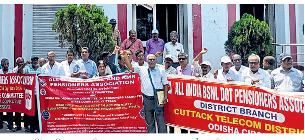
ବିକଳ ଦାବି ନେଇ ଅଲ୍‌ଇଣ୍ଡିଆ ପୋଷ୍ଟାଲ୍ ଆଣ୍ଡ୍ ଆର୍‌ଏସ୍‌ଏସ୍ ପେନ୍‌ସନର୍ସ ଆସୋସିଏସନ୍ ଷ୍ଟେଟ୍ କମିଟି ପକ୍ଷରୁ କଟକ ବକ୍ସିବଜାରସ୍ଥିତ ପ୍ରଧାନ ଡାକଘର ସମ୍ମୁଖରେ ବିରୋଧ।