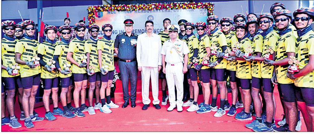
କାର୍ଯ୍ୟକ୍ରମରେ ରାଜ୍ୟପାଳ ହରି ବାବୁ କନ୍ୟାପତି ଓ ଅନ୍ୟମାନେ।

ଏନ୍‌ସିସି ଗ୍ରୁପ୍ ମୁଖ୍ୟାଳୟର ୭୬ତମ ପ୍ରତିଷ୍ଠା ଦିବସ ସହ ୨୩ ଦିନ ବ୍ୟାପୀ ଚାଲିଥିବା ସାଲକେଲ ଶୋଭାଯାତ୍ରା ଗୁରୁବାର ଉଦ୍‌ଘାଟିତ ହୋଇଯାଇଛି। କଟକ କ୍ୟାଡେଟ୍‌ନେଟ୍‌ସ ରୋଡ୍‌ସ୍ଥିତ ଏନ୍‌ସିସି ଗ୍ରୁପ୍ ମୁଖ୍ୟାଳୟରେ ଆୟୋଜିତ କାର୍ଯ୍ୟକ୍ରମରେ ପୁଣ୍ୟ ଅତିଥି ଭାବେ ରାଜ୍ୟପାଳ ହରି ବାବୁ କନ୍ୟାପତି ଯୋଗଦେଇ କହିଛନ୍ତି, ଏନ୍‌ସିସି କ୍ୟାଡେଟ୍‌ମାନଙ୍କ ଉତ୍ସର୍ଗାକୃତ ମନୋଭାବ ପ୍ରଶଂସନୀୟ। ସେମାନେ ୧୫ଟି ଜିଲ୍ଲାରେ ଦୀର୍ଘ ୨୩ ଦିନ ବ୍ୟାପୀ ସାଲକେଲ ଶୋଭାଯାତ୍ରା କରି ୮୫୦ କିମି ପଥ ଅତିକ୍ରମ କରିଛନ୍ତି। ପରିବେଶ ସଂରକ୍ଷଣ, ମହିଳା ସଶକ୍ତିକରଣ, ନିଶାସେବନ ନିରାକରଣ, ଡିଜିଟାଲ ସାକ୍ଷରତା, ସଡ଼କ ସୁରକ୍ଷା ସଚେତନତା ବାର୍ତ୍ତା ଜନସାଧାରଣଙ୍କ ପାଖରେ ପହଞ୍ଚାଇ ସେମାନେ ନିଷ୍ଠା, ଉଦ୍ୟମ, ଦେଶପ୍ରେମ ପ୍ରଦର୍ଶନ କରିଛନ୍ତି। ଓଡ଼ିଶାର ଯୁବକଙ୍କ ମଧ୍ୟରେ ନେତୃତ୍ୱ, ଏକତା ଅନୁଶୀଳନ ଏବଂ ଚରିତ୍ର ପ୍ରତିପୋଷଣର ସମୃଦ୍ଧ ପରମ୍ପରା ବଜାୟ ରଖିବା ପାଇଁ ଏନ୍‌ସିସି ଗ୍ରୁପ୍‌କୁ ରାଜ୍ୟପାଳ