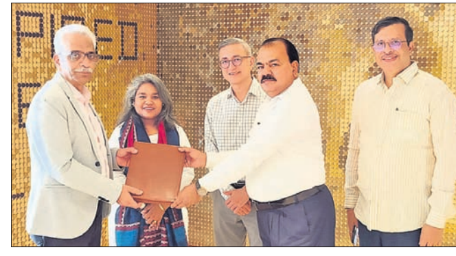
ମଣିପାଳ ପାଠଶାଳାରେ ଓ ଏସ୍‌ଏଲ୍‌ଏସ୍ ଟ୍ରଷ୍ଟ ମଧ୍ୟରେ ବୁଝାମଣାପତ୍ର ସ୍ୱାକ୍ଷରିତ ହେଉଛି।