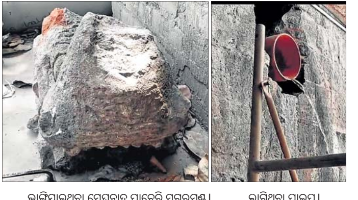
ଭାଙ୍ଗିଯାଇଥିବା ମେଘନାଦ ପାଟେରି ମଗରମୁଣ୍ଡ।

ଶ୍ରୀମନ୍ଦିରକୁ ନେଇ ଜଗନ୍ନାଥପ୍ରୋମାକ ମଧ୍ୟରେ ଏକ ଭାବବେଗ ଜଡ଼ିତ ରହିଛି। ମେଘନାଦ ପାଟେରିରେ ଥିବା ଏକ ମଗରମୁଣ୍ଡକୁ ଶ୍ରୀମନ୍ଦିର ପ୍ରଶାସନ ପକ୍ଷରୁ ଭାଙ୍ଗି ଦିଆଯାଇଛି। ଏହାକୁ ନେଇ ଭକ୍ତ ଓ ସେବାୟତ ଏପରି କି ଏସଂସାଧ ପକ୍ଷରୁ ମଧ୍ୟ କ୍ଷୋଭ ପ୍ରକାଶ କରାଯାଇଛି। ଏସଂସାଧର ବିନା ଅନୁମତିରେ ଐତିହ୍ୟ କାର୍ତ୍ତିକ ଭାଙ୍ଗିବା ଘଟଣାକୁ ସହଜରେ କେହି ଗ୍ରହଣ କରିପାରୁନାହାନ୍ତି। ଶ୍ରୀମନ୍ଦିର ଦକ୍ଷିଣପାର୍ଶ୍ୱ ମେଘନାଦ ପାଟେରିରେ ନାଳ କାର୍ଯ୍ୟ ଶ୍ରୀମନ୍ଦିର ଖାର୍ଚ୍ଚ ଡିପାର୍ଟମେଣ୍ଟ କର୍ତ୍ତୃତ୍ୱରେ କେବଳ ମଗରମୁଣ୍ଡ ଭାଙ୍ଗିଯାଇଥିବା ଜଣାପଡ଼ିଛି। ଶ୍ରୀମନ୍ଦିର ଭିତରେ ନାଳ ମରାମତି ହେଉଥିବା ବେଳେ ଏକ ବଡ଼ ପାଇପ ସାହାଯ୍ୟରେ ବର୍ଷାଜଳକୁ ନିଷ୍କାସିତ କରିବା ପାଇଁ ଦକ୍ଷିଣ ଦିଗରେ ସଂଯୋଗକରଣ କରାଯାଇଛି। ଶ୍ରୀମନ୍ଦିର ଖାର୍ଚ୍ଚ ଡିପାର୍ଟମେଣ୍ଟ ପକ୍ଷରୁ ଶ୍ରୀମନ୍ଦିର ନାଳ ମରାମତି କାରି ରହିଥିବା ବେଳେ ଐତିହ୍ୟ କାର୍ତ୍ତିକ ଭାଙ୍ଗିଯିବା ନେଇ ଅସନ୍ତୋଷ ପ୍ରକାଶ ପାଇଛି। ଭାଙ୍ଗିଯାଇଥିବା କାମ ବେଳେ