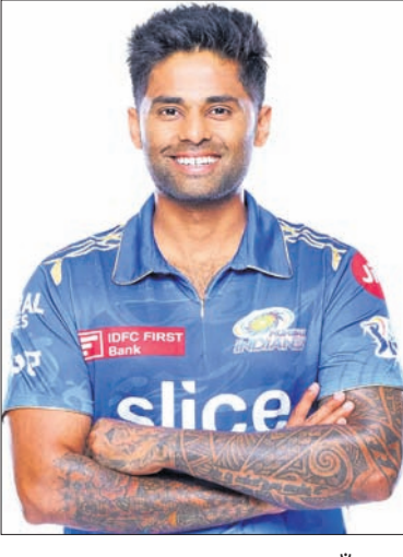
ବଦଳରେ ଗୋଆ ପାଇଁ ଅନୁରୋଧ କରୁଥିବା ବୋଲି ଏମସିଏର ସୂଚନା ଦିଆଯାଇଛି ।

ଭାରତୀୟ ଟି୨୦ ଦଳର ଅଧିନାୟକ ସୂର୍ଯ୍ୟକୁମାର ଯାଦବ ମୁମ୍ବାଇ ଛାଡ଼ି ଯାଉ ନାହାନ୍ତି । ମୁମ୍ବାଇ କ୍ରିକେଟ ଆସୋସିଏଶନ (ଏମସିଏ) ପକ୍ଷରୁ ଗୁଜୁରାଟ ଏହା କୁହାଯାଇଛି ।