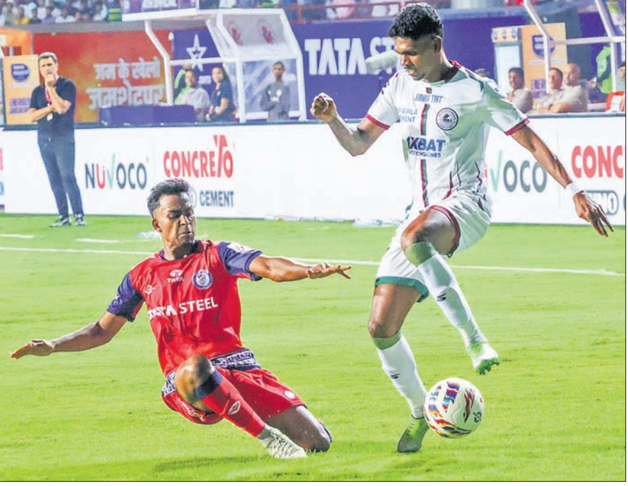
ଜାମଶେଦପୁର ଏପିସି ଓ ମୋହନ ବାଗାନ ସୁପର କ୍ୟାମ୍ପ୍ ମଧ୍ୟରେ ଅନୁଷ୍ଠିତ ମ୍ୟାଚର ଏକ ସଂଘର୍ଷପୂର୍ଣ୍ଣ ମୁହୂର୍ତ୍ତ ।