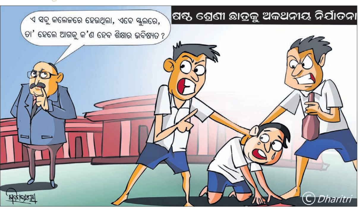
ପଞ୍ଚ ଶ୍ରେଣୀ ଛାତ୍ରକୁ ଅକଥନୀୟ ନିର୍ଯାତନା