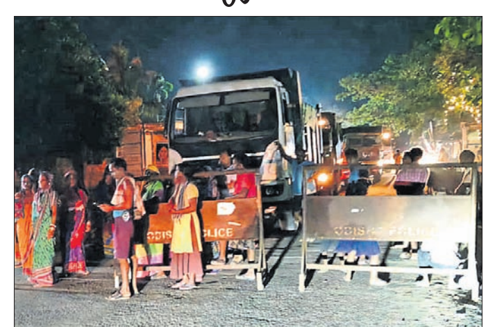
ରାସ୍ତାରେକୋ ଯୋଗୁଁ ଗ୍ରାମବାସୀଙ୍କୁ ଅସୁବିଧା ହେଉଛି।

ବାଙ୍କୀ ଥାନା କଇଁପୁଣ୍ଡି ଫାଣ୍ଡି ନିକଟ କଇଁପୁଣ୍ଡି ଗ୍ରାମରେ ଏକ ସେବୁ ନିର୍ମାଣ କରାଯାଇଛି। ମାତ୍ର ମାସେ ହେବ ଏହି କାମ ବନ୍ଦ ରହିଛି। ଅପରପକ୍ଷେ ଠିକା ସଂସ୍ଥା ସେବୁ ନିର୍ମାଣ ପାଇଁ ଆଣିଥିବା ସରଜାମ ଗାଡ଼ିରେ ମଝିରେ ମଝିରେ ଉକ୍ତ ସ୍ଥାନକୁ ନେଇଯାଉଥିଲା। ଏନେଇ ଗ୍ରାମବାସୀ ଅସନ୍ତୁଷ୍ଟ ଥିଲେବେଳେ ଗୁରୁବାର ଏସବୁ ସରଜାମ ଲୋଡ୍ ହୋଇଥିବା ଏକ ଗାଡ଼ିକୁ ଅଟକାଇ କଇଁପୁଣ୍ଡି ଫାଣ୍ଡିରେ ଜିମା ଦିଆଯାଇଥିଲା। ମାତ୍ର ପୋଲିସ୍ ଉକ୍ତ ଗାଡ଼ି ଛାଡ଼ିଦେଇଥିବା ଅଭିଯୋଗ କରି ରାତିରେ ଉତ୍ତ୍ୟକ୍ତ ଲୋକେ କଇଁପୁଣ୍ଡି ଫାଣ୍ଡି ଆଗରେ ରାସ୍ତା ଅବରୋଧ କରିଛନ୍ତି। ସେମାନଙ୍କ ଅଭିଯୋଗ ଅନୁଯାୟୀ, ସମ୍ପୂର୍ଣ୍ଣ ଠିକାଦାର ଏଠାରେ ମନସ୍ତୁଖିଭାବେ କାର୍ଯ୍ୟ କରୁଥିଲେ। ଦୀର୍ଘ ଏକ ମାସ ହେବ ସେବୁ ନିର୍ମାଣ କାର୍ଯ୍ୟ