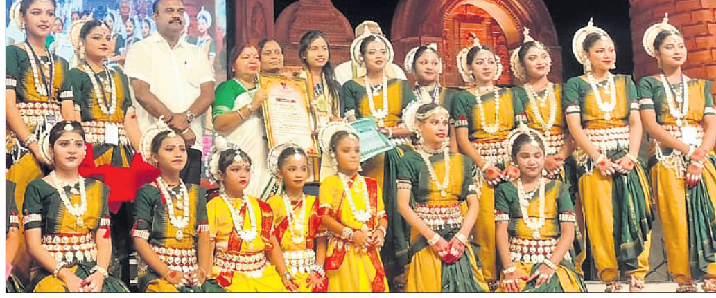
ଅତିଥିକ ଗହଣରେ କଳାକାର ଓ ଅନ୍ୟମାନେ।

ସାଲେପୁର ରୁକ୍ ଅନ୍ତର୍ଗତ ଶିଶୁଆ ବ୍ୟାଗେଇ ପଡ଼ିଆରେ ଚାଲିଥିବା ସାଲେପୁର ମହୋତ୍ସବ ଏବଂ ଓଡ଼ିଶା ଦିବସ ସମାରୋହର ବୃତ୍ତୀୟ ସମ୍ପନ୍ନା ଗୁରୁବାର ଅନୁଷ୍ଠିତ ହୋଇଯାଇଛି। ସାଲେପୁର ମଧ୍ୟସ୍ଥିତ ପରିଷଦ ପକ୍ଷରୁ ଆୟୋଜିତ ସମ୍ପନ୍ନାରେ ରାଜ୍ୟର ସୁନାମଧନ୍ୟ କଳାକାରଙ୍କ ଦ୍ୱାରା ନାଚ ଓ ଗୀତ ପରିବେଷଣ କରାଯାଇଥିଲା।