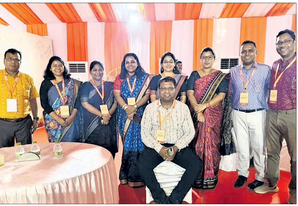
ଓଡ଼ିଆ ପଞ୍ଚ ପାଳନର ତୃତୀୟ ଦିବସରେ ପାରମ୍ପରିକ ପୋଷାକ ପରିଧାନ ଅଭିଯାନରେ ସାମିଲ ହୋଇଥିବା ଖୋର୍ଦ୍ଧା ଜିଲ୍ଲା କାର୍ଯ୍ୟକର୍ତ୍ତା ସମେତ ବିଭିନ୍ନ କାର୍ଯ୍ୟକର୍ତ୍ତାଙ୍କର ଅଧିକାରୀ ଓ କର୍ମଚାରୀ ।