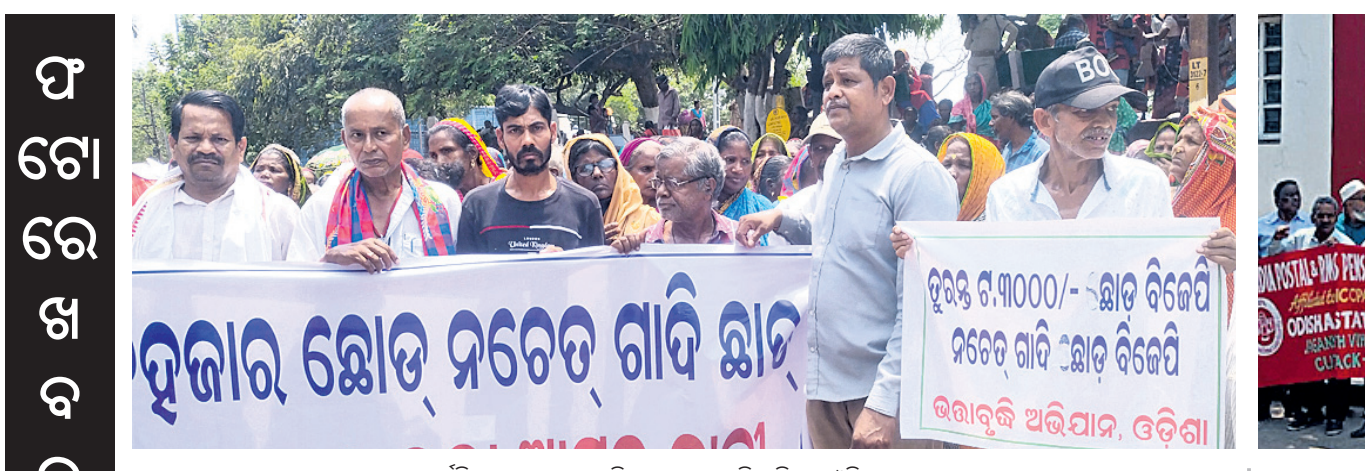
ସର୍ବନିମ୍ନ ଭରା ପ୍ରଦାନ ଦାବି ନେଇ ଭରା ବୁକି ଅଭିଯାନ ଓଡ଼ିଶା ପକ୍ଷରୁ ଗୁରୁବାର କଟକ ଜିଲ୍ଲାପାଳଙ୍କ କାର୍ଯ୍ୟାଳୟ ନିକଟରେ ବିରୋଧ ପ୍ରଦର୍ଶନ।