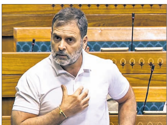
ଲୋକ ସଭା ବିରୋଧୀ ଦଳ ନେତା ରାହୁଲ ଗାନ୍ଧୀ।

ନୂଆଦିଲ୍ଲୀ, ୩୪ ଚାଇନା ଭାରତୀୟ ଭୂଖଣ୍ଡର ୪,୦୦୦ ବର୍ଗ କି.ମି. ଅଞ୍ଚଳକୁ ମାଡ଼ିଆସିଥିବା ଦର୍ଶାଇ ରୁଷ୍ଟିକାର ଲୋକ ସଭାର ବିରୋଧୀ ଦଳ ନେତା ରାହୁଲ ଗାନ୍ଧୀ କେନ୍ଦ୍ର ସରକାରକୁ ସମାଲୋଚନା କରିଛନ୍ତି। ଚାଇନାର ଅତିରୁମ ସାଙ୍ଗକୁ ଆମେରିକା ରାଷ୍ଟ୍ରପତି ଡୋନାଲ୍ଡ ଟ୍ରମ୍ପ ଭାରତ ଉପରେ ଲଗାଇଥିବା ପାଲଟା ଚାରିପ୍ର ପ୍ରସଙ୍ଗରେ ରାହୁଲ ଗାନ୍ଧୀଙ୍କୁ କହିଛନ୍ତି। ଆମେରିକାର ଚାରିପ୍ର ଭାରତୀୟ ଅର୍ଥନୀତିକୁ ସମ୍ପୂର୍ଣ୍ଣ ବିପର୍ଯ୍ୟୟ କରିଦେବ କହି ସେ ଏହି ୨ ପ୍ରସଙ୍ଗରେ ସରକାରଙ୍କଠାରୁ ବିବୃତି ଦାବି କରିଛନ୍ତି। ତାଙ୍କ ଏହି