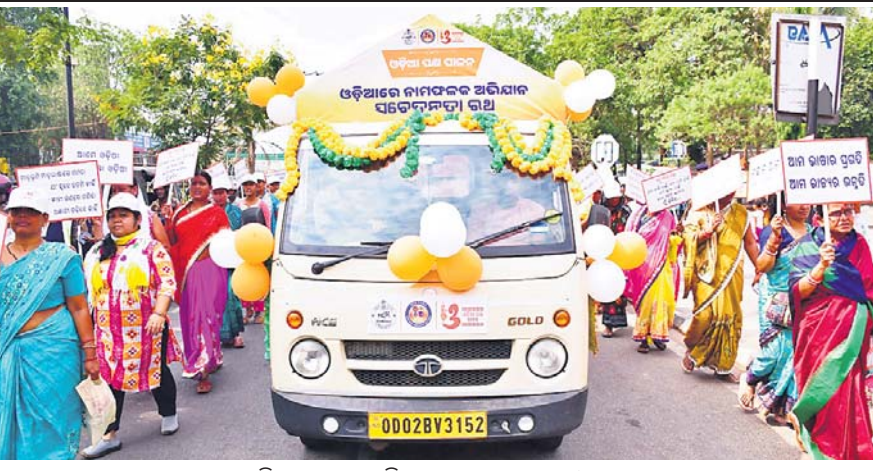
ମାଷ୍ଟରକ୍ୟାଣ୍ଟିନ ଛକକୁ ବାହାରିଥିବା ସଚେତନତା ରଥ ଓ ଶୋଭାଯାତ୍ରା।