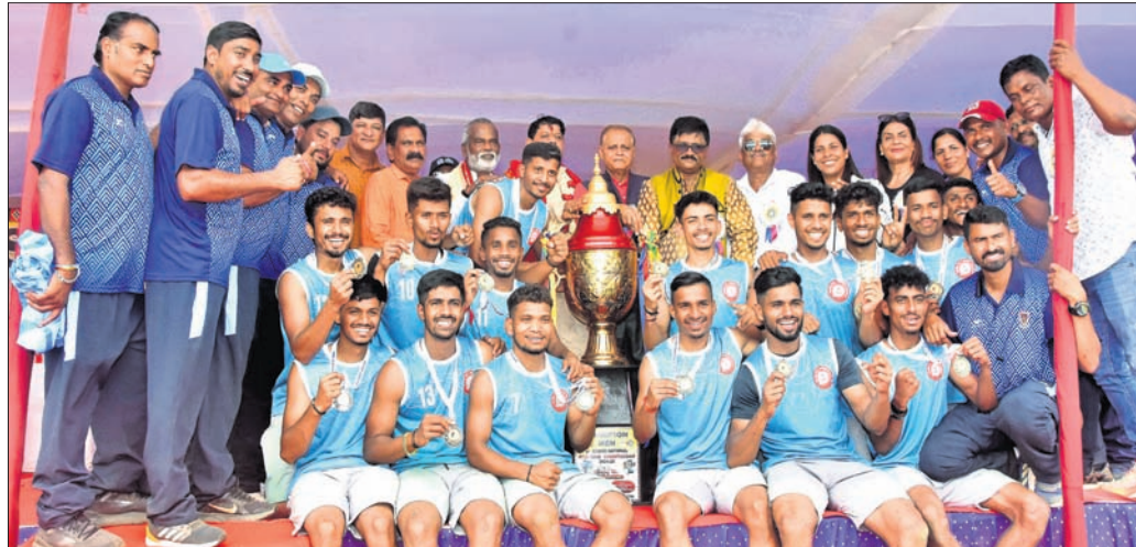
ପୁରୀରେ ଅନୁଷ୍ଠିତ ଜାତୀୟ ଖୋ ଖୋ ଚାମ୍ପିୟନ୍ସିପରେ ପୁରୁଷ ବିଭାଗ ଚାମ୍ପିୟନ ରେଲଫ୍ରେ ଦଳର ଖେଳାଳିମାନେ ଅତିଥିକ ଗହଣରେ।

ଲକ୍ଷ୍ମୀ, ୪୪ ଚଳିତ ଆଇପିଏଲରେ ଶୁକ୍ରବାର ଖେଳାଯାଇଥିବା ମ୍ୟାଚରେ ଲକ୍ଷ୍ମୀ ପ୍ରଥମ ଇଂ (ଏମ୍ଆଇ) ପରସ୍ପରକୁ ଭେଟିଛନ୍ତି। ପ୍ରଥମେ ବ୍ୟାଟିଂ କରିଥିବା ଲକ୍ଷ୍ମୀ ମିଚେଲ ମାର୍କ ଓ ଏଡେନ ମାର୍କରାମଙ୍କ ଅର୍ଦ୍ଧଶତକ ବଳରେ ପ୍ରତିପକ୍ଷ ମୁମ୍ବାଇ ଆଗରେ ୨୦୪ ରନର ଟାର୍ଗେଟ ଧାର୍ଯ୍ୟ କରିଛି। ମ୍ୟାଚରେ ମୁମ୍ବାଇ ଅଧିନାୟକ ହାର୍ଦ୍ଦିକ ପାଣ୍ଡା ୫ ଉଇକେଟ ସଫଳତା ହାସଲ କରିଛନ୍ତି। ଚମ୍ପି କିଟି ମୁମ୍ବାଇ ଅଧିନାୟକ ହାର୍ଦ୍ଦିକ ପ୍ରଥମେ ବୋଲିଂ କରିବାକୁ ନିଷ୍ପତ୍ତି ନେଇଥିଲେ। ଆମନ୍ତ୍ରଣ ପାଇ ପ୍ରଥମେ ବ୍ୟାଟିଂ କରିଥିବା ଲକ୍ଷ୍ମୀ ମିଚେଲ ମାର୍କ ଓ ମାର୍କରାମଙ୍କ ଓପନିଂ ଯୋଡ଼ି ବିଶ୍ୱୋରକ ଆରମ୍ଭ ପ୍ରଦାନ କରିଥିଲା। ଦୁହେଁ ୭ ଓଭରରେ ୬୬ ରନ ଯୋଡ଼ିଥିଲେ। ମାର୍କ ୩୧ ବଲରେ ୯ ଚୋକା ଓ ୨ ଛକା ସହିତ ୬୦ ରନ କରି ପ୍ରଥମ ବ୍ୟାଟର ଭାବେ ଆଉଟ ହୋଇଥିଲେ। ତାଙ୍କ ପରେ ନିକୋଲାସ ପୁରନ ୧୨ ରନ କରି ଆଉଟ