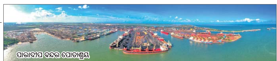
ପାରାଦୀପ ବନ୍ଦରା ପୋର୍ଟାଗ୍ରହ

ପାରାଦୀପ, ୪୫ (ଶରତ ରାଉତ) ଆଜି ହେଉଛି ବିଷ୍ଣୁ ନୌବାଣିଜ୍ୟ ଦିବସ। ନୌବାଣିଜ୍ୟ ଓଡ଼ିଶାର ପ୍ରାଚୀନ ପରମ୍ପରା ମଧ୍ୟରେ ଅନ୍ୟତମ ବୋଲି କୁହାଯାଏ। ପଣ୍ୟ କାରବାରରେ ବୃହତ୍ ବନ୍ଦର ମଧ୍ୟରେ ପାରାଦୀପ ବନ୍ଦର ଦେଶର ୧ ନଂ ବନ୍ଦର ଭାବେ ଗୁଣ ପାଇଛି। ଏହାସହ ବିଶ୍ୱ ନୌବାଣିଜ୍ୟର ବିକାଶ ପାଇଁ ରାଜ୍ୟରେ ଅନେକ କାର୍ଯ୍ୟ ଏବେ ବି ଚାଲି ରହିଛି। ନଦୀଭିତ୍ତିକ ବନ୍ଦର ଘୋଷଣାରେ ସୀମିତ ଥିଲାବେଳେ ଓଡ଼ିଶାର ଏକମାତ୍ର ନୌବାଣିଜ୍ୟ ଶିକ୍ଷାନୁଷ୍ଠାନର ପୁନରୁଦ୍ଧାର ହୋଇପାରିନାହିଁ। ସମ୍ପ୍ରତି ଦେଶର ୯୫ ପ୍ରତିଶତ ପଣ୍ୟ କାରବାର ଜଳପଥରେ ହେଉଛି। ଏହା ଦେଶର ଅର୍ଥନୀତି ମଧ୍ୟରୁ ୭୦ ଭାଗ। ଜଳପଥରେ ପଣ୍ୟ କାରବାରକୁ ନୌବାଣିଜ୍ୟ କୁହାଯାଏ। ଓଡ଼ିଶାରୁ ଆରମ୍ଭ ହୋଇଥିବା ପ୍ରାଚୀନ ପରମ୍ପରାରୁ ମନେ ପକାଇବା ପାଇଁ ପ୍ରତିବର୍ଷ କାର୍ତ୍ତିକ ପୂର୍ଣ୍ଣିମାରେ ତଳା ଭବାଇ ବୋଇତ ବନ୍ଦରା ଉତ୍ସବ ପାଳନ କରାଯାଏ। ଏହାସହ ଏପିଲ୍ ୫ରେ ସରକାରୀଭାବେ ଜାତୀୟ ନୌବାଣିଜ୍ୟ ଦିବସ ପାଳନ କରାଯାଏ। ଶନିବାର ୬୧୧୧ ନୌବାଣିଜ୍ୟ ଦିବସ ଦେଶର ସମସ୍ତ ବନ୍ଦରରେ ପାଳନ କରାଯାଉଛି।