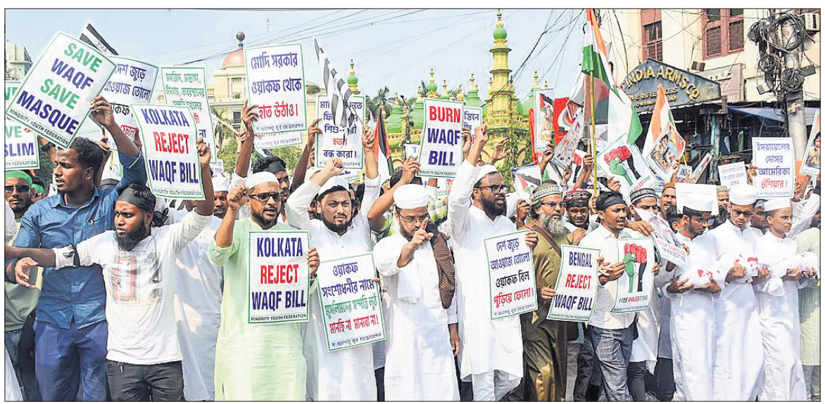
କୋଲକାତାରେ ଶୁଭକାରୀ ଓକ୍ସିଡ଼ିଂ ସଂଗୋଧନ ବିଲ୍ ବିରୋଧରେ ପୂର୍ଣ୍ଣକାଳୀନ ସମ୍ପ୍ରଦାୟ ପକ୍ଷରୁ ବିରୋଧ ପ୍ରଦର୍ଶନ କରାଯାଇଛି।