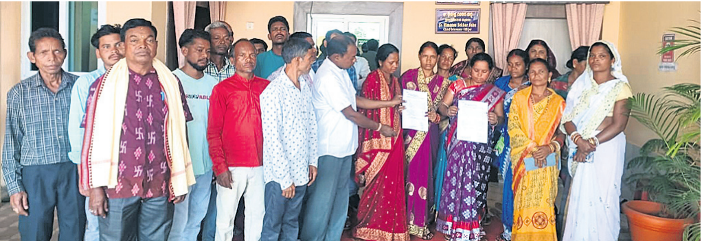
ମୁଖ୍ୟମନ୍ତ୍ରୀଙ୍କ ଅଭିଯୋଗ ପ୍ରକୋଷ୍ଠକୁ ଦାରିପତ୍ର ପ୍ରଦାନ ନିମନ୍ତେ ଆସିଥିବା ଗ୍ରାମବାସୀ।