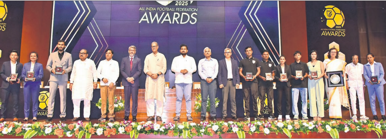
ଉପମୁଖ୍ୟମନ୍ତ୍ରୀ କନକବର୍ଦ୍ଧନ ସିଂହଦେଓ, କ୍ରୀଡ଼ାମନ୍ତ୍ରୀ ସୂର୍ଯ୍ୟକାନ୍ତ ପୁରଜି ଓ ଅନ୍ୟ ଅତିଥିଙ୍କ ସହ ଏଥାଇଏସଏଫ ପୁରସ୍କାରପ୍ରାପ୍ତ କ୍ରୀଡ଼ାବିତ୍