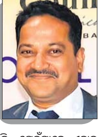
ସତ୍ୟ ଖବର ପରିବେଷଣର ସ୍ୱାଧୀନତା ମିଳିବା ଦରକାର ବ ଢ ମ । ନ ସ ମ ଯ ରେ ସ୍ୱାଧୀନତା । ଶବ୍ଦ ପରିଚାଷା ବଳି ଯାଇଛି । ସାମ୍ବାଦିକଙ୍କଠାରୁ ଆରମ୍ଭ କରି ଯେ ଢ ମ । ନେ ଖବର ଏତି କରୁଛନ୍ତି, ଯେଉଁମାନେ ଏହାକୁ ପରିବେଷଣ କରୁଛନ୍ତି ସମସ୍ତେ 'ପ୍ରେସ୍' ମଧ୍ୟରେ ଯାଉଛନ୍ତି । ତେବେ ମାଲିକମାନଙ୍କୁ ପ୍ରେସ୍ ମଧ୍ୟରେ ଅନ୍ତର୍ଭୁକ୍ତ କରାଯାଉ ନ ଥିବାବେଳେ, ବାସ୍ତବରେ ସମସ୍ତ ସ୍ୱାଧୀନତା ଚାକ ପାଖରେ ରହୁଛି । କିଛି କ୍ଷେତ୍ରରେ ଆମେ ମତାମତକୁ ବଦଳାଇ ପାରିବା ପ୍ରତ୍ୟେକ କେବେବି ବଦଳାଇ ପାରିବେ