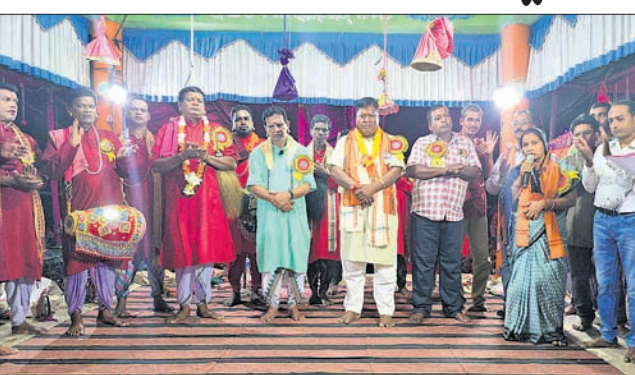
ଅତିଥି ଓ ପାଲା କଳାକାରମାନେ।