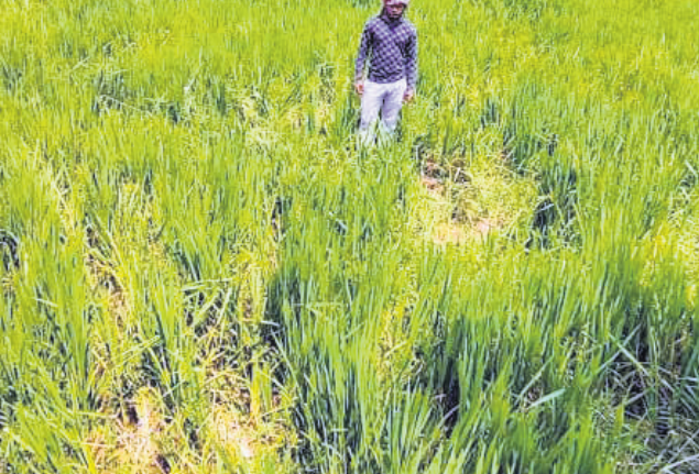
ହାତୀପଲ ନଷ୍ଟ କରିଥିବା ଧାନଫସଲ।