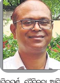
ସତ୍ୟ ଖବର ପରିବେଷଣର ସ୍ୱାଧୀନତା ମିଳିବା ଦରକାର ବ ଢ ମ । ନ ସ ମ ଯ ରେ ସ୍ୱାଧୀନତା । ଶବ୍ଦ ପରିଚାଷା ବଳି ଯାଇଛି । ସାମ୍ବାଦିକଙ୍କଠାରୁ ଆରମ୍ଭ କରି ଯେ ଢ ମ । ନେ ଖବର ଏତି କରୁଛନ୍ତି, ଯେଉଁମାନେ ଏହାକୁ ପରିବେଷଣ କରୁଛନ୍ତି ସମସ୍ତେ 'ପ୍ରେସ୍' ମଧ୍ୟରେ ଯାଉଛନ୍ତି । ତେବେ ମାଲିକମାନଙ୍କୁ ପ୍ରେସ୍ ମଧ୍ୟରେ ଅନ୍ତର୍ଭୁକ୍ତ କରାଯାଉ ନ ଥିବାବେଳେ, ବାସ୍ତବରେ ସମସ୍ତ ସ୍ୱାଧୀନତା ଚାକ ପାଖରେ ରହୁଛି । କିଛି କ୍ଷେତ୍ରରେ ଆମେ ମତାମତକୁ ବଦଳାଇ ପାରିବା ପ୍ରତ୍ୟେକ କେବେବି ବଦଳାଇ ପାରିବେ