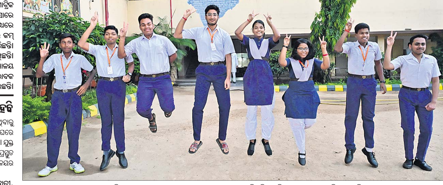
ମାଟ୍ରିକ୍ ଫଳ ପ୍ରକାଶ ପାଇବା ପରେ କଟକ ରୁକ୍ମିଣୀପୁର ସରକାରୀ ଶିଶୁ ବିଦ୍ୟାଳୟର ଛାତ୍ରୀଛାତ୍ରମାନେ ଖୁସି ମନାଇଛନ୍ତି ।

ମାଧ୍ୟମିକ ଶିକ୍ଷା ପରିଷଦ ପକ୍ଷରୁ ଶୁକ୍ରବାର ମାଟ୍ରିକ୍ ପରୀକ୍ଷାପତ୍ର ପ୍ରକାଶ ପାଇଛି । ପରିଶ୍ରମ ଅନୁସାରେ ଫଳ ମିଳିଥିବାରୁ ଅଧିକାଂଶ ଛାତ୍ରୀଛାତ୍ରଙ୍କ ମଧ୍ୟରେ ଖୁସି ଦେଖିବାକୁ ମିଳିଛି । ଏଥିପାଇଁ ଆଶା ଅନୁସାରେ କମ୍ ମାର୍କ ପାଇଥିବା ଛାତ୍ରୀଛାତ୍ର ଗୁଡ଼ିକ ପ୍ରକାଶ କରିଛନ୍ତି । ପୁଅଙ୍କ ଅପେକ୍ଷା ଝିଅମାନେ ଅଧିକ ମାର୍କ ରଖିଛନ୍ତି । ତେବେ ମାଟ୍ରିକ୍ ପରୀକ୍ଷାପତ୍ରକୁ ନେଇ ବିଦ୍ୟାଳୟ ଓ ପରିବାରରେ ଶିକ୍ଷୟିତ୍ରୀଶିକ୍ଷକ, ଅଭିଭାବକ ଓ ପିଲାମାନେ ମିଠା ଖୁଆଇ ଖୁସି ମନାଇଛନ୍ତି ।