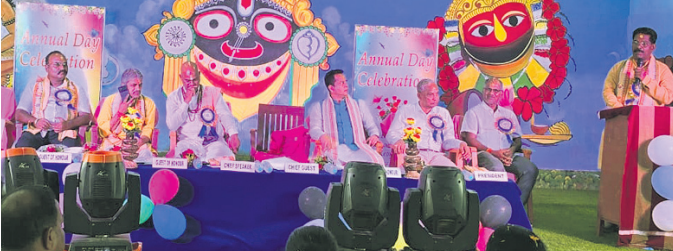
ମଞ୍ଚରେ ଉପସ୍ଥିତ ଏମ୍ପି ଅନନ୍ତ ନାୟକ ଓ ଅନ୍ୟ ଅତିଥିମାନେ।