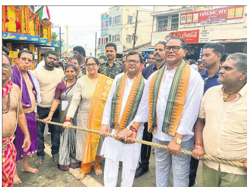
ରାୟଗଡ଼ା ଜିଲାପାଳ, ଏନପି, ବିଧାୟକ ଓ ଅନ୍ୟମାନେ ରଥ ଚାଳୁଛନ୍ତି ।