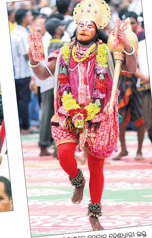
▲ ବଡ଼ଦାଣ୍ଡରେ ହନୁମାନ ଦେଖାଯାଉଛନ୍ତି