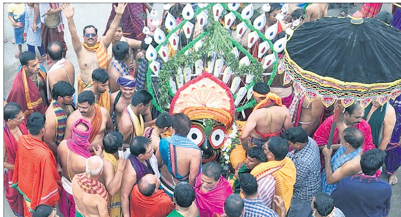
ଚିକିରିରେ ମହାପ୍ରଭୁ ବଳଭଦ୍ର, ରାୟଗଡ଼ା ଶ୍ରୀକାଶୀକ୍ଷେତ୍ରରେ ଦେବୀ ସୁଭଦ୍ରା ଓ ପ୍ରଭୁ ଜଗନ୍ନାଥଙ୍କୁ ପହଞ୍ଚିରେ ରଥକୁ ନିଆଯାଉଛି ।