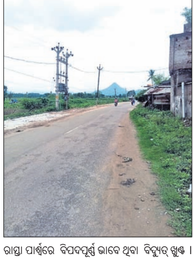
ରାସ୍ତା ପାର୍ଶ୍ୱରେ ବିପଦପୂର୍ଣ୍ଣ ଭାବେ ଥିବା ବିଦ୍ୟୁତ୍ ଖୁଣ୍ଟ ।

ପଦ୍ମପୁରରୁ କୁଣ୍ଡଳା ମନ୍ଦିର ଛକଠାରୁ ଶହେ ମିଟର ରାସ୍ତା ପାର୍ଶ୍ୱରେ ବିନା ସୁରକ୍ଷା ବାଡ଼ରେ ମୁକୁଳା ଭାବେ ବିପଜନକ ଭଳ ଧରଣର ବିଦ୍ୟୁତ୍ ଖୁଣ୍ଟ ରହିଛି। ପଦ୍ମପୁରରୁ ସୁନାରିଆଳ ଛକଠାରୁ କୁଣ୍ଡଳା ପର୍ଯ୍ୟନ୍ତ ଲମ୍ବିଥିବା ପିଟ୍‌ରୁଡ଼ି ରାସ୍ତାରେ ପ୍ରତିଦିନ ଶହ ଶହ ଲୋକେ ଯାତାୟାତ କରୁଛନ୍ତି। ଏଥିସହ ପଦ୍ମପୁର ମାର୍ଗସାହିର ପ୍ରବେଶ ପଥ ସହ ଏହା ନିକଟରେ ଏକ ପ୍ରାଥମିକ ସ୍କୁଲ ମଧ୍ୟ ରହିଛି। ତେଣୁ ସାମାନ୍ୟ ଆବାସନିକା ହେଲେ କାହାର କିଛି ଅଘଟଣା ମଧ୍ୟ ଘଟିପାରେ ବୋଲି ଆଖିକା ପ୍ରକାଶ ପାଇଛି। କନଗହଳରେ କିଛି ଅଘଟଣା ଘଟିଲେ କିଏ ଦାୟୀ ରହିବେ