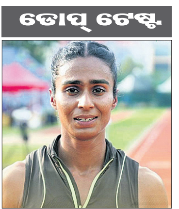
କରି ଏକ ନୂଆ ମିର୍ ରେକର୍ଡ ପ୍ରତିଷ୍ଠା କରିଥିଲେ। ପୂର୍ବରୁ ଚଳିତ ମାସ ପ୍ରାରମ୍ଭରେ

ରୁଆଦିଲ୍ଲା, ୨୭୬ (ପି.ଟି.): ଭାରତର ମିଡଲ ଟିଷ୍ଟୁରୁ ଧାବିକା ବିଜ୍ଞାନ ଚାଲିଯାଇଛି।