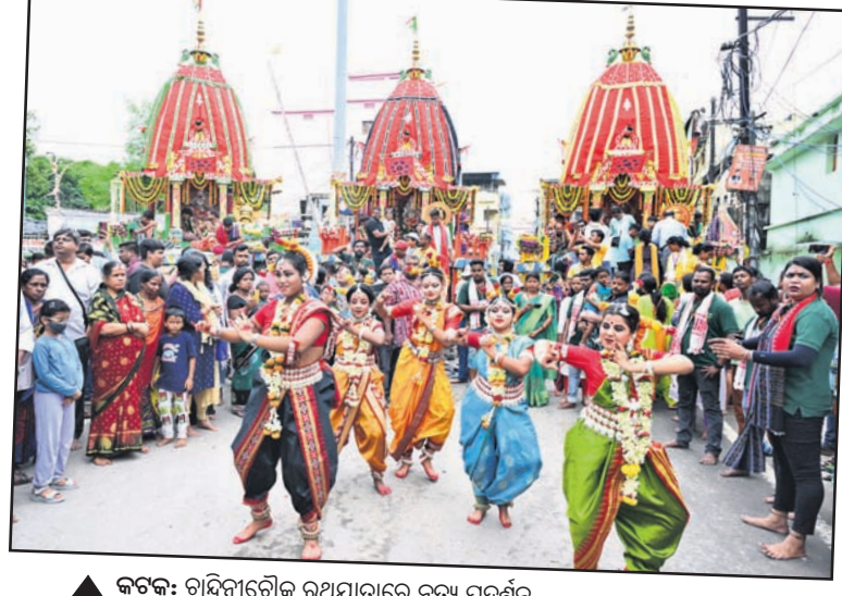
▲ କଟକ: ତାନ୍ଦିନୀଚୌକ ରଥଯାତ୍ରାରେ ନୃତ୍ୟ ପ୍ରଦର୍ଶନ