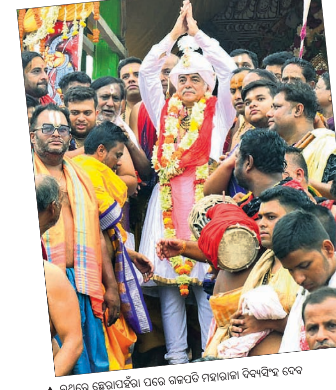
▲ ରଥରେ ଛୋଟାପର୍ଯ୍ୟାୟ ପରେ ଗଜପତି ମହାରାଜା ବିଦ୍ୟାଦିତ୍ୟ ଦେବ