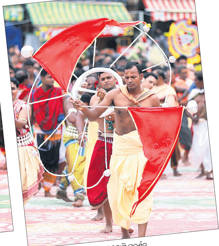
▲ ଚନ୍ଦ୍ରବାଣି ପ୍ରଦର୍ଶନ