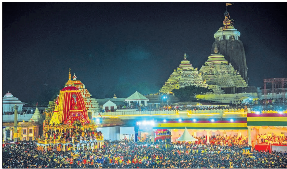
ପୁରୀ ଶ୍ରୀମନ୍ଦିର ସମ୍ମୁଖ ବଡ଼ଦାଣ୍ଡରେ ଶୁକ୍ରବାର କିଛିବାର ଗଲା ପରେ ଅଟକି ରହିଥିବା ନନ୍ଦିଘୋଷ ।