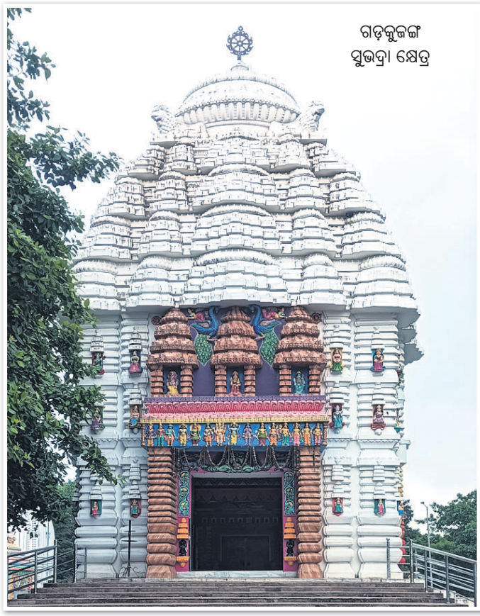
ଗଡ଼କୁଳଙ୍ଗ ସୁଭଦ୍ରା କ୍ଷେତ୍ର

ଭାଙ୍ଗାଳୀ କୁଳଙ୍କ ରାଜ୍ୟର କୁଳଙ୍ଗଗଡ଼ ବର୍ତ୍ତମାନ ଜଗଦୀଶ୍ୱରଙ୍କୁ ଜିଲ୍ଲା ଏବଂ ସମାଜ ରୁକ୍ ଅନ୍ତର୍ଗତ ଗଡ଼କୁଳଙ୍ଗ, ସୁଭଦ୍ରା କ୍ଷେତ୍ର ନାମରେ ପରିଚିତ। ଏଠାରେ ଶ୍ରୀଗୁଣ୍ଡିଚା ପରଦିନ ରଥଯାତ୍ରା ଅନୁଷ୍ଠିତ ହୋଇଥାଏ। ଏହାକୁ ବାସି ରଥ କୁହାଯାଏ, ଯାହାକି ଏକ ନିଆରା ପରମ୍ପରା। ଶ୍ରୀକ୍ଷେତ୍ର ସହିତ ଏହି କ୍ଷେତ୍ରର ଆବେଗିକ ସମ୍ପର୍କ ରହିଛି। କିମ୍ବଦନ୍ତୀ କୁହେ, ୧୫୨୮ ମସିହାରେ କଳାପାହାଡ଼ ଶ୍ରୀମନ୍ଦିର ଉପରେ ଆକ୍ରମଣ କରି କିଛି ଅଂଶ ଭାଙ୍ଗି ଭୁବନାର କରିବା ପାଇଁ ମନ୍ଦିର ମଧ୍ୟକୁ ଜଗନ୍ନାଥ, ବଳଭଦ୍ର ଓ ସୁଭଦ୍ରାଙ୍କୁ ବିଗ୍ରହକୁ ଆଣି ବଡ଼ଦାଣ୍ଡରେ କରାଯାଇଥିଲା। ଡାକ୍ତରୀ ଦ୍ୱାରା ଉଦ୍ଧାର ହେବା ପରେ କଳାପାହାଡ଼ ଅସୁସ୍ଥ ହୋଇ ପଡ଼ିଲେ। ଲୋକ କଥା ଅନୁସାରେ ସେଠାରେ କଳାପାହାଡ଼ର ପୁଅ ତାଙ୍କୁ କହିଥିଲେ, ତୁମେ ହିନ୍ଦୁଙ୍କ ଆଲୋଚନା ଆଣି ପୋଡ଼ିବ। ତୁମକୁ ରକ୍ଷା ନାହିଁ। ଫଳରେ ତିନି ଅର୍ଦ୍ଧସପ୍ତ ବିଗ୍ରହକୁ କଳାପାହାଡ଼ ଗଙ୍ଗାନାମାରେ ପିନ୍ଧି ଦେଇଥିଲେ। ସେଠାରେ ବିଶ୍ୱାସ ମନାକରି କେହି ବ୍ୟକ୍ତି ଯାହାକି ପ୍ରକୃତ ପରିଚୟ ଅବାସ୍ୟ ସ୍ୱସ୍ତ ହୋଇନାହିଁ (କେହି କେହି ତାଙ୍କୁ ଦେଖିବେ, କବିରାଜ ବ୍ରାହ୍ମଣ ଓ କେହି କେହି ତାଙ୍କୁ ଯାଦୁପୁର ବା ବାଲେଶ୍ୱର ଲୋକ ବା କେହି କ୍ଷୁଦ୍ରପୁର ବନ୍ଦର ଡକ ଶ୍ରୀମନ୍ଦିର କୁହନ୍ତି), ସେ ଅର୍ଦ୍ଧସପ୍ତ