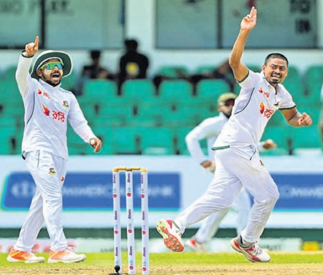
ଧନଞ୍ଜୟ ତି' ସିଲ୍ଭୁଙ୍କ ଉଇକେଟ ହାସଲ ପରେ ଖୁସି ପୂର୍ବରୁ ଚାଲକୁ ଲସ୍କାମ।

କଲ୍ୟାଣ (ଶ୍ରୀଲଙ୍କା), ୨୭: (ଏପି) ଲିଟନ ଦାସ ୧୩ ରନ କରି ଅପରାଜିତ ରହିଛନ୍ତି। ଶ୍ରୀଲଙ୍କା ଅଧିନାୟକ ଧନଞ୍ଜୟ ତି' ସିଲ୍ଭୁ (୨/୧୩) ଓ ହାମହାତି ସିନର ପ୍ରବାସ ଜୟପୁରିୟା (୨/୪୭) ଦୁଇଟି ଲେଖାଏଁ ଉଇକେଟ ନେଇଥିଲେ। ସକାଳେ ଶ୍ରୀଲଙ୍କା ତୃତୀୟ ଦିବସ ଖେଳ ୨୯/୨ରେ ଏହାର ଖେଳ ଆରମ୍ଭ କରିଥିଲା। ୧୪୭ ରନ କରି ଅପରାଜିତ ରହିଥିବା ନିଶାଙ୍କା ନାଜର୍ ଉପମ୍ୟାନ ଜୟପୁରିୟାଙ୍କ ସହ ବ୍ୟାଟି ଆରମ୍ଭ କରିଥିଲେ। ଉଭୟେ ମଧ୍ୟାହ୍ନଭୋଜନ ସୁଦ୍ଧା ଦଳର ବ୍ୟୋରକୁ ୪୦୧/୬ରେ ପହଞ୍ଚାଇଥିଲେ। ଗାଳେଠାରେ ଅନୁଷ୍ଠିତ ପ୍ରଥମ ଦେସ୍‌ରେ ୧୮୭ ରନ କରି ଥିବା ନିଶାଙ୍କା ଦ୍ୱିତୀୟ ଲିଟନ ସେନା ଆଉଟ ହେବା ପୂର୍ବରୁ ୨୫୪ ବଲ୍‌ରୁ ୧୯ ଚୋକା ସହ ଚମକାର ୧୫୮ରନ କରିଥିଲେ। ସେ କ୍ରିକେଟର ଯତ୍ନରେ ଉର୍ଦ୍ଧ୍ୱ ସମୟ ଧରି ଅବସ୍ଥାନ କରିଥିଲେ। ସଂକ୍ଷିପ୍ତ ବ୍ୟୋର ବାଲ୍ୟଦେଶ ପ୍ରଥମ ଲିଟନ: ୨୪୭ ଶ୍ରୀଲଙ୍କା ପ୍ରଥମ ଲିଟନ: ୪୫୮ (ପାଥୁନ