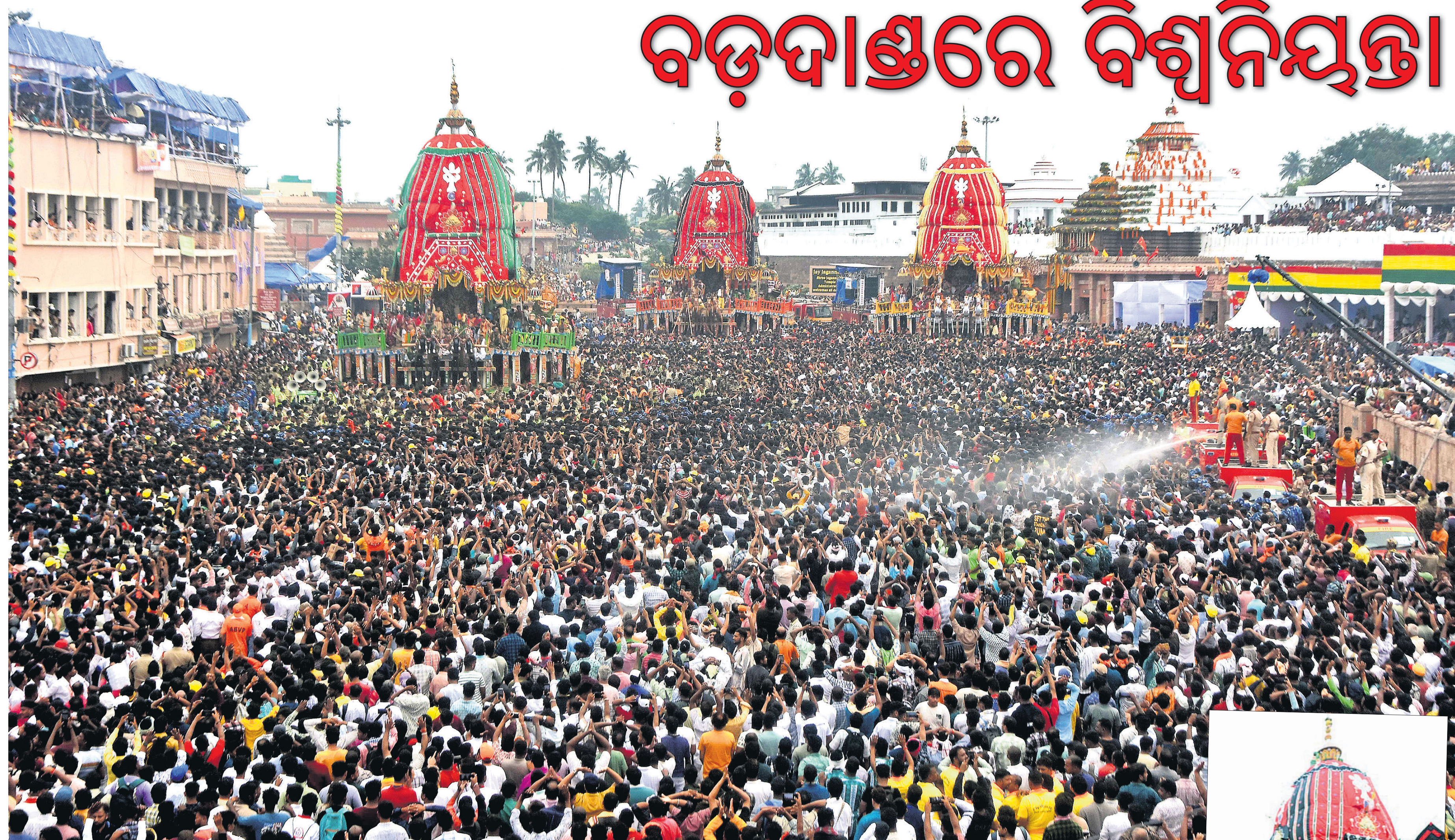
▲ ପୁରୀ ଶ୍ରୀମନ୍ଦିର ସମ୍ମୁଖରୁ ବାହୁଡ଼ିଆଙ୍କ ରଥରୁ ଶ୍ରୀକରନାଥଙ୍କ ଚାରିକୋଇଟି ।