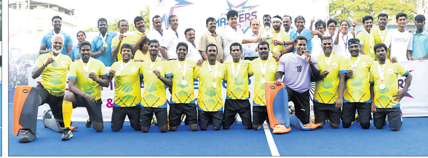
ଚେନ୍ନାଇରେ ଶୁକ୍ରବାର ଉଦ୍‌ଯାପିତ ହକି ଇଣ୍ଡିଆ ମାଷ୍ଟର୍ସ କପ୍ ହକି ଟୁର୍ନାମେଣ୍ଟରେ ମହିଳା ବିଭାଗ ଚାମ୍ପିୟନ ଓଡ଼ିଶା ଏବଂ ପୁରୁଷ ବର୍ଗ ଚାମ୍ପିୟନ ତାମିଲନାଡୁ ଦଳର ଖେଳାଳିମାନେ ଅଭିଯୁକ୍ତ ରହିଛନ୍ତି।