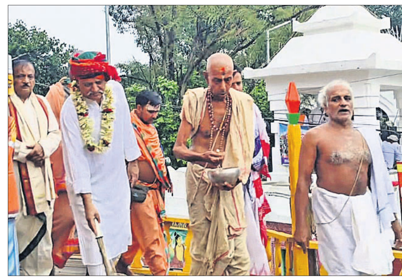
ମୟୂରଭଞ୍ଜ ମହାରାଜା ପ୍ରବାଣ ଚନ୍ଦ୍ର ଭଞ୍ଜଦେଓ ରୁପା ଖଡ଼ିକାରେ ଛେରା ପହଞ୍ଚା କରୁଛନ୍ତି।