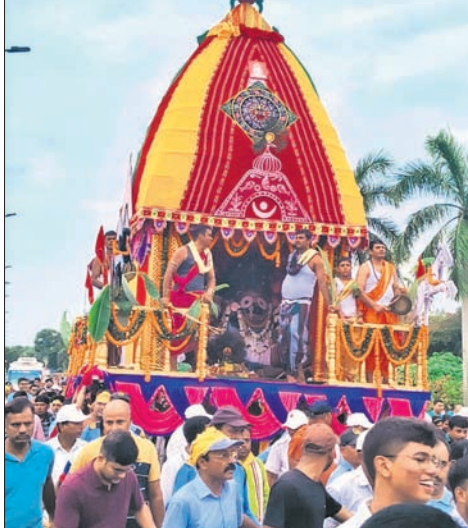
ପାରାବାପ ଟେକ ବିଶୋଧନାଗର ପରିଷଦରେ ଯୋଗ୍ୟାତ୍ରା।