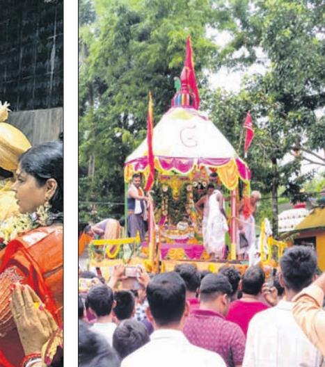
ଏରସମା ସଦର ମହକୁମାର ରଥଯାତ୍ରା।