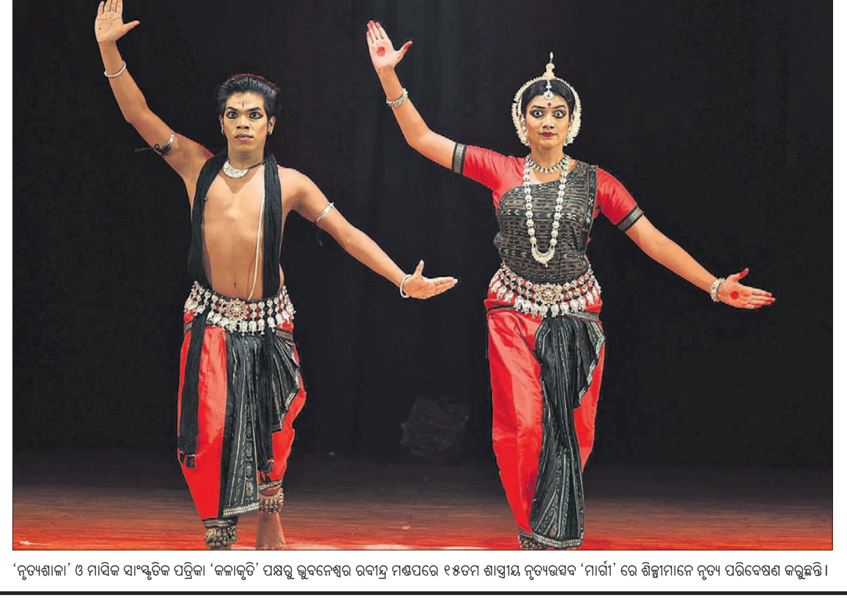
'ନୃତ୍ୟଶାଳା' ଓ ମାସିକ ସାଂସ୍କୃତିକ ପତ୍ରିକା 'କଳାକୃତି' ପକ୍ଷରୁ ଭୁବନେଶ୍ୱର ରବୀନ୍ଦ୍ର ମଣ୍ଡଳରେ ୧୫ତମ ଶାସ୍ତ୍ରୀୟ ନୃତ୍ୟଉତ୍ସବ 'ମାର୍ଗୀ' ରେ ଶିଳ୍ପୀମାନେ ନୃତ୍ୟ ପରିବେଷଣ କରୁଛନ୍ତି।