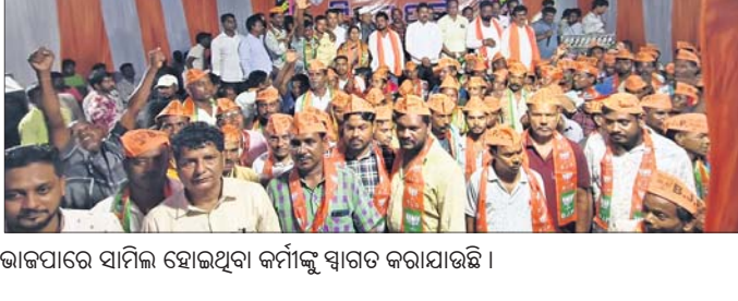
ଭାଜପାରେ ସାମିଲ ହୋଇଥିବା କର୍ମୀଙ୍କୁ ସ୍ୱାଗତ କରାଯାଉଛି ।