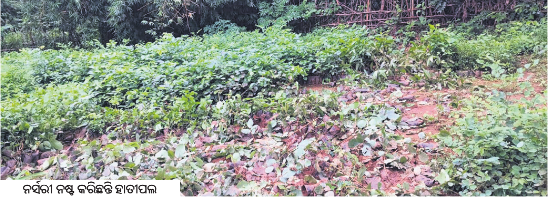
ନର୍ସରୀ ନଷ୍ଟ କରିଛନ୍ତି ହାତୀପଲ

ଭଞ୍ଜନଗର, ୨୭/୬ (ବାବୁଲା ପ୍ରଧାନ) ଗଞ୍ଜାମ ଜିଲ୍ଲା ଭଞ୍ଜନଗର ଗୁମୁସର ଉତ୍ତର ବନଖଣ୍ଡରେ ଶୁକ୍ରବାର ସୁଖା ୨୭ଟି ହାତୀ ଥିବା ବେଳେ ଗୁମୁସର ଦକ୍ଷିଣ ବନଖଣ୍ଡରେ ୯ଟି ହାତୀ ରହିଛନ୍ତି। ଏହି ହାତୀପଲ ସନ୍ଧ୍ୟା ହେଲେ କଳା ନିକଟବର୍ତ୍ତୀ ଗ୍ରାମଗୁଡ଼ିକରେ ପଶି ଫସଲ ସମେତ ଅନ୍ୟାନ୍ୟ କ୍ଷତି ଘଟାଇଛନ୍ତି। ପରେ କଳାକୁ ଫେରି ଯାଇଛନ୍ତି। ଶୁକ୍ରବାର ସକାଳେ ଏକ ୨୫ ଟିକିଆ ହାତୀପଲ କଳାକୁ ଫେରିଯିବା ପୂର୍ବରୁ