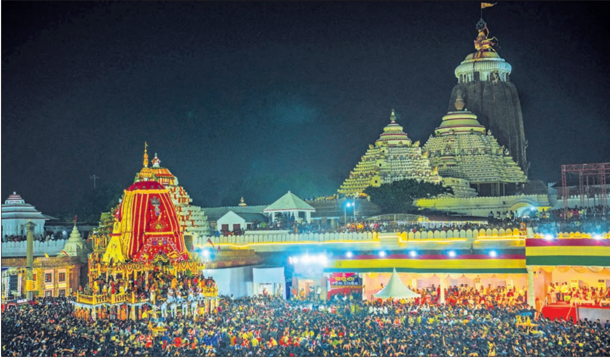
ପୁରୀ ଶ୍ରୀମନ୍ଦିର ସମ୍ମୁଖ ବଡ଼ଦାଣ୍ଡରେ ଶୁକ୍ରବାର କିଛିବାର ଗଲା ପରେ ଅଟକି ରହିଥିବା ନନ୍ଦିଘୋଷ ।