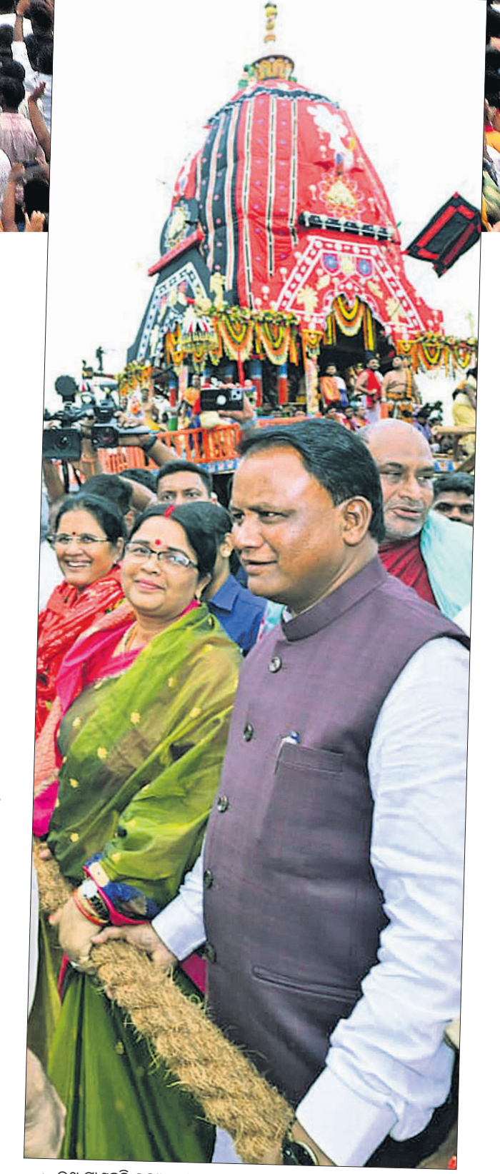
▲ ରଥ ଚାଣ୍ଡିଆ ପୂଜ୍ୟମଣ୍ଡା ମୋହନ ଚରଣ ମାତା, ଗଜ ସହଧର୍ମିଣୀ ପ୍ରିୟଙ୍କା ମାତାଙ୍କ ଓ ଉପପୂଜ୍ୟମଣ୍ଡା ପ୍ରଭାତୀ ପତିଙ୍କୁ ।