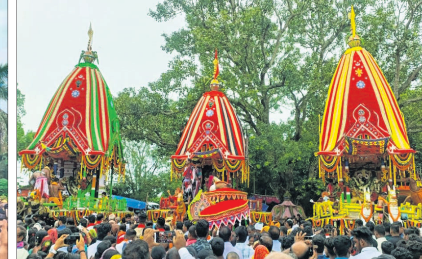
ନାଉରୀସ୍ଥିତ ଗାରୋଇ ଗୋବର୍ଦ୍ଧନ ପୀଠ।