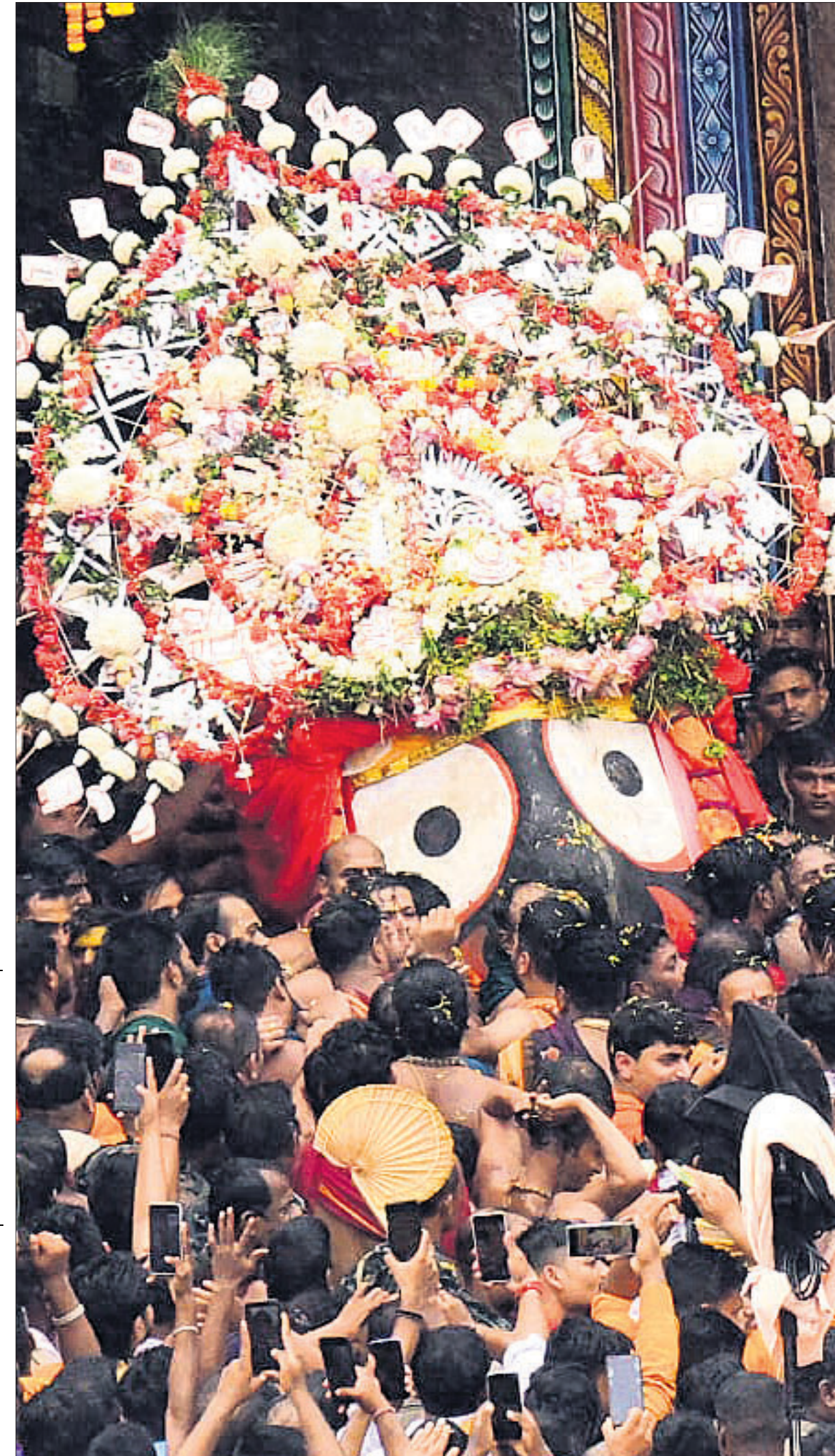
▲ ଶୁକ୍ରବାର ରଥଯାତ୍ରା ଅବସରରେ ପୁରୀରେ ମହାପ୍ରଭୁ ଶ୍ରୀକରନାଥଙ୍କ ପହଣି ବିଜା ।