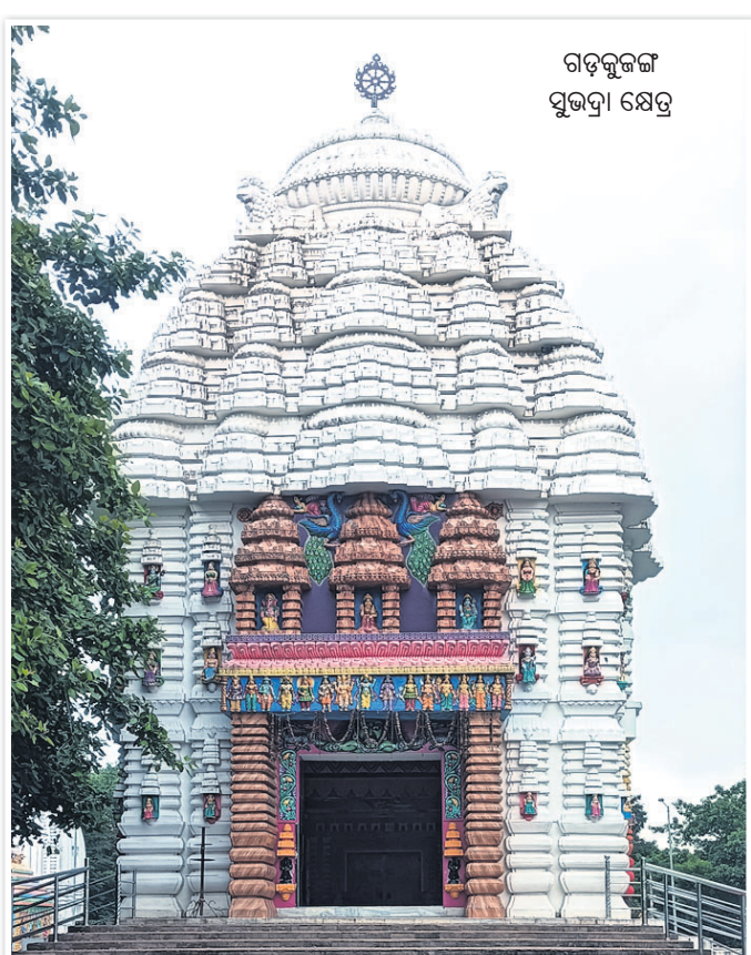
ଗଡ଼କୁଳଙ୍ଗ ସୁଭଦ୍ରା କ୍ଷେତ୍ର

ଭୀଳାନ କୁଳଙ୍କ ରାଜ୍ୟର କୁଳଙ୍ଗଗଡ଼ ବର୍ତ୍ତମାନ ଜଗଦ୍‌ସିଂହପୁର ଜିଲ୍ଲା ଏରସମା ବ୍ଲକ ଅନ୍ତର୍ଗତ ଗଡ଼କୁଳଙ୍ଗ, ସୁଭଦ୍ରା କ୍ଷେତ୍ର ନାମରେ ପରିଚିତ। ଏଠାରେ ଶ୍ରୀଗୁଣ୍ଡିଚା ପରଦିନ ରଥଯାତ୍ରା ଅନୁଷ୍ଠିତ ହୋଇଥାଏ। ଏହାକୁ ବାସି ରଥ କୁହାଯାଏ, ଯାହାକି ଏକ ନିଆରା ପରମ୍ପରା। ଶ୍ରୀକ୍ଷେତ୍ର ସହିତ ଏହି କ୍ଷେତ୍ରର ଆବେଗିକ ସମ୍ପର୍କ ରହିଛି। କିମ୍ବଦନ୍ତୀ କୁହେ, ୧୫୬୮ ମସିହାରେ କଳାପାହାଡ଼ ଶ୍ରୀମନ୍ଦିର ଉପରେ ଆକ୍ରମଣ କରି କିଛି ଅଂଶ ଭାଙ୍ଗି ଚୁରମାର କରିବା ସାଙ୍ଗକୁ ମନ୍ଦିର ମଧ୍ୟରୁ ଜଗନ୍ନାଥ, ବଳଭଦ୍ର ଓ ସୁଭଦ୍ରାଙ୍କ ବିଗ୍ରହକୁ ଆଣି ବଡ଼ଦାଣ୍ଡରେ କଢ଼ାଡ଼ିଥିଲେ। ତା'ପରେ ଚର୍ଚ୍ଚା ଦଉଡ଼ିରେ ବାହି ହାତୀପିଠିରେ ନେଇ କଳିକା ଗଙ୍ଗାନଦୀ କୂଳରେ ତାଙ୍କ ଦେହରେ ଅଗ୍ନି ସଂସେଦା କରିଦେଇଥିଲେ। ବିଗ୍ରହମାନେ ସୁଦୂର ହୋଇ କଳିକା ପରେ କଳାପାହାଡ଼ ଅସୁସ୍ଥ ହୋଇ ପଡ଼ିଲେ। ଲୋକ କଥା ଅନୁସାରେ ସେଠାରେ କଳାପାହାଡ଼ର ପୁଅ ତାଙ୍କୁ କହିଥିଲେ, ତୁମେ ହିନ୍ଦୁଙ୍କ ଆଲ୍ଲାକୁ ଆଣି ପୋଡ଼ିବ। ତୁମକୁ ରକ୍ଷା ନାହିଁ। ଫଳରେ ତିନି ଅର୍ଦ୍ଧବସ୍ତ୍ର ବିଗ୍ରହକୁ କଳାପାହାଡ଼ ଗଙ୍ଗାନଦୀରେ ପକେଇ ଦେଇଥିଲେ। ସେଠାରେ ବିଶ୍ୱାସୀ ନାମକ ଜଣେ ନିକ ବ୍ୟକ୍ତି ଯାହାକି ପ୍ରକୃତ ପରିଚୟ ଅଦ୍ୱାରା ସ୍ୱୟଂ ହୋଇନାହିଁ (କେହି କେହି ତାଙ୍କୁ ବୈଷ୍ଣବ, କବିରାଜ ବୁଝାନ୍ତି ତ କେହି କେହି ତାଙ୍କୁ ଯାଜପୁର ବା ବାଲେଶ୍ୱର ଲୋକ ବା କେହି କେହି ପୁରୀ ବନ୍ଦର ତଳ ଶ୍ରୀମତୀ କୁହନ୍ତି), ସେ ଅର୍ଦ୍ଧବସ୍ତ୍ର