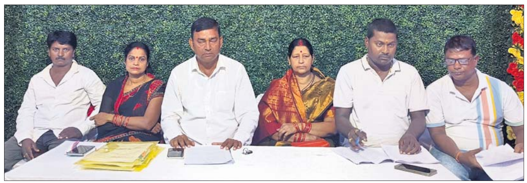
ୱାଟରସାଥୀ ସମ୍ମିଳନୀରେ ଯୋଗଦେଇଥିବା କାଉନସିଲରମାନେ ।