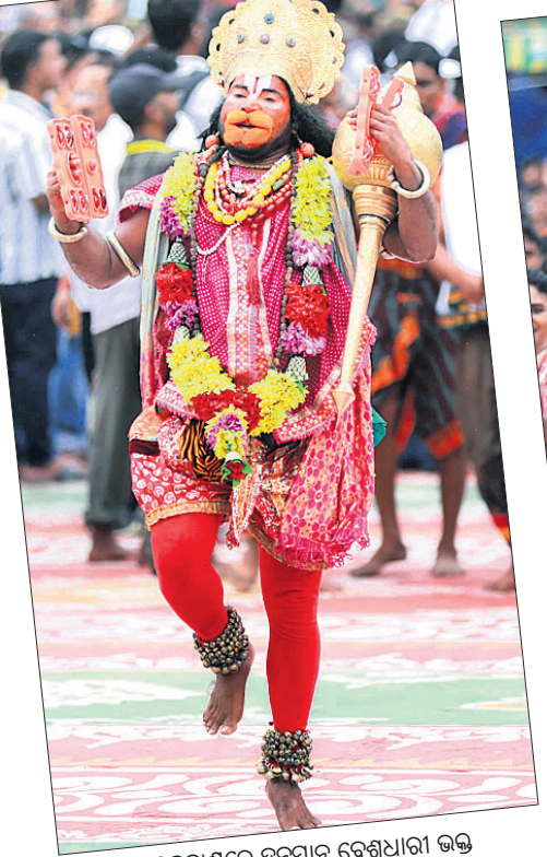
▲ ବଡ଼ଦାଣ୍ଡରେ ହନୁମାନ ଦେଖାଯାଉଛନ୍ତି