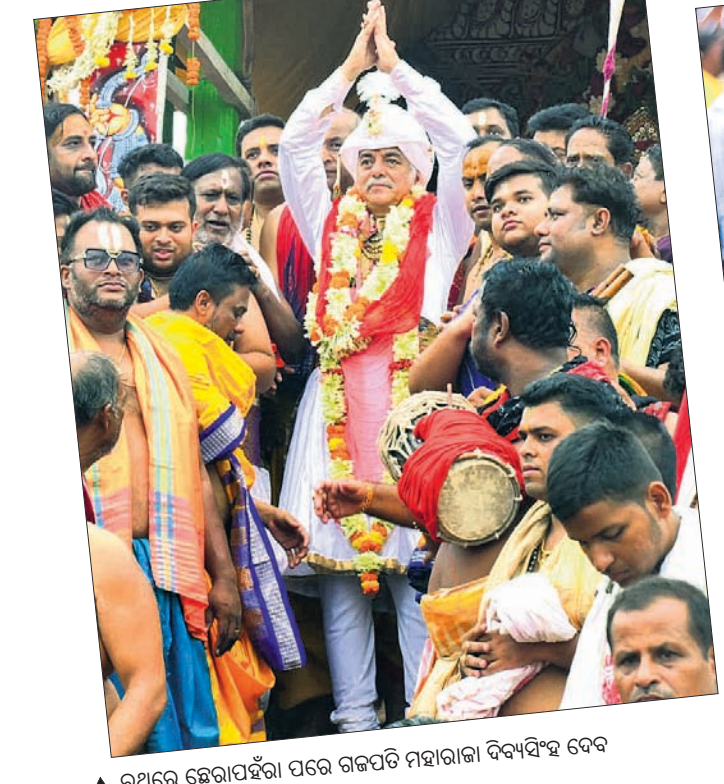
▲ ରଥରେ ଛୋଟାପର୍ଯ୍ୟାୟ ପରେ ଗଜପତି ମହାରାଜା ବିଦ୍ୟାଦିତ୍ୟ ଦେବ