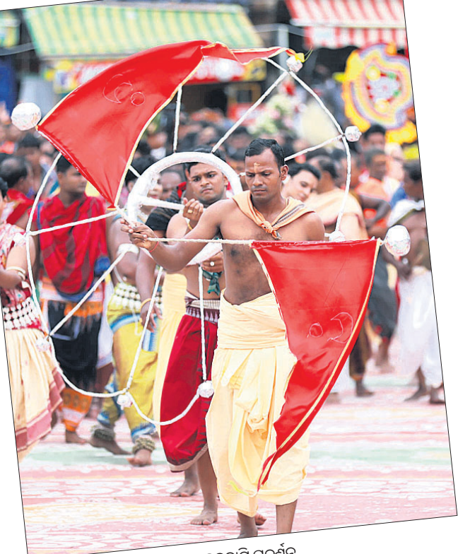
▲ ଚନ୍ଦ୍ରବୀରି ପ୍ରଦର୍ଶନ