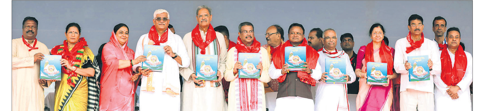
▲ ପୁରୀରେ ରଥଯାତ୍ରା ଅବସରରେ ଶ୍ରୀକରନାଥ ମନ୍ଦିର ସ୍ୱତନ୍ତ୍ର ଭଣ୍ଡାଫଳନ କରାଯାଇଛି ।