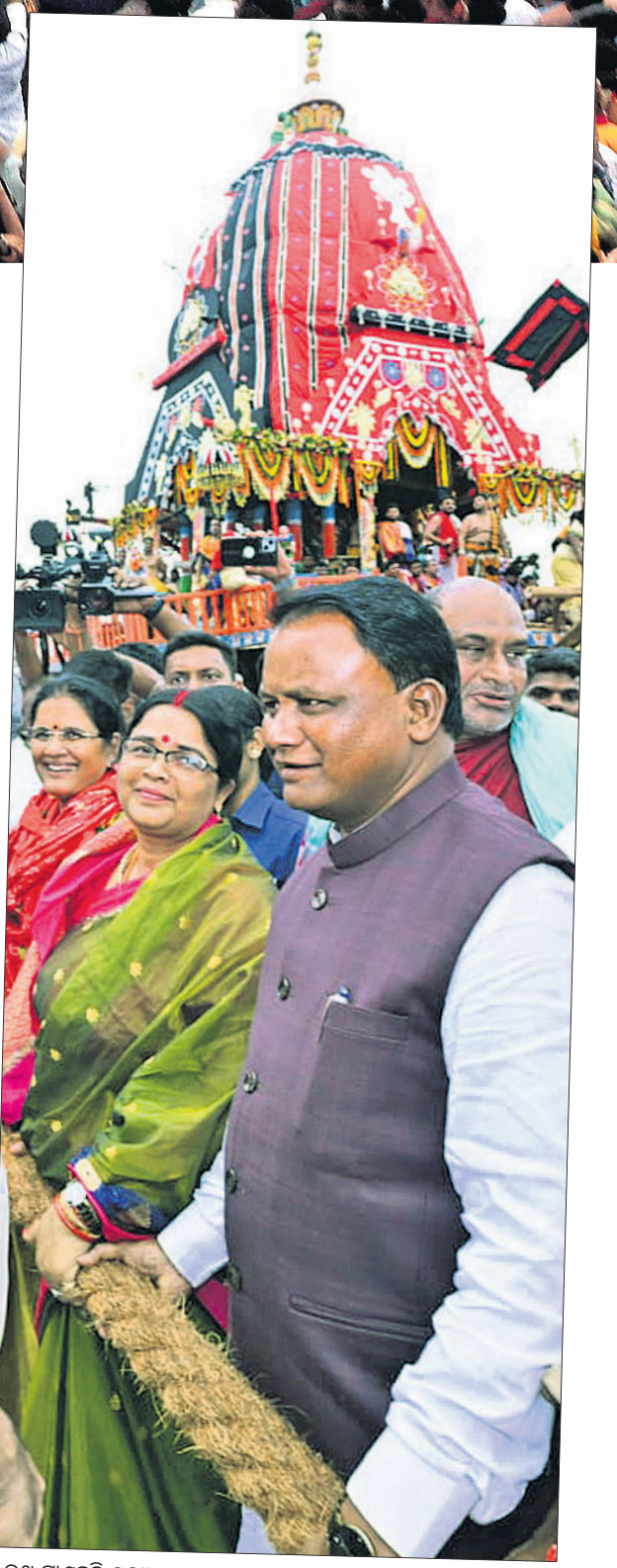
▲ ରଥ ଚାଣୁଡ଼ି ପୂଜ୍ୟମଣ୍ଡା ମୋକ୍ଷ ଚରଣ ମାତା, ଚାନ୍ଦିଧର ସହଧର୍ମିଣୀ ପ୍ରିୟଙ୍କା ମାତାଙ୍କ ଓ ଉପପୂଜ୍ୟମଣ୍ଡା ପ୍ରଭାତୀ ପତ୍ନୀ।