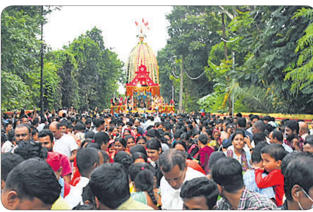
ଝୁରି-୮ ଜଗନ୍ନାଥ ମନ୍ଦିର ପକ୍ଷରୁ ଅନୁଷ୍ଠିତ ରଥଯାତ୍ରା।