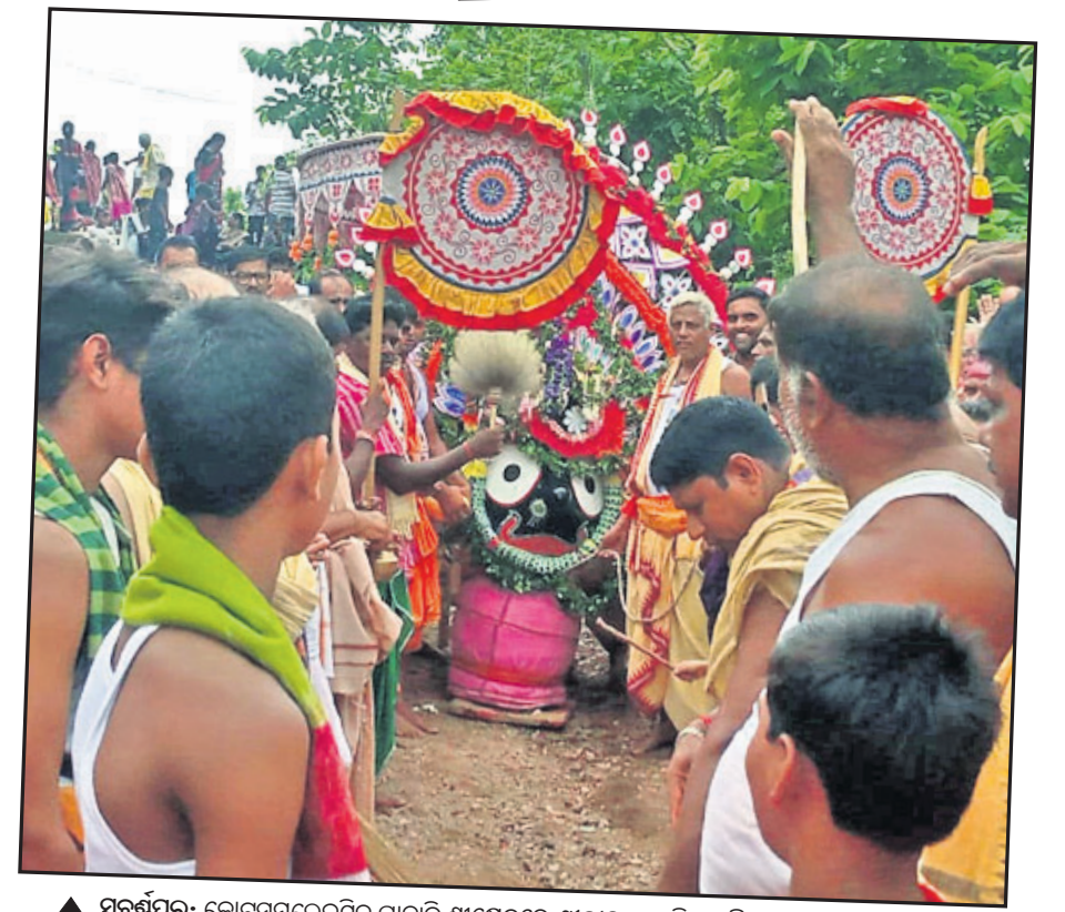
▲ ସୁବର୍ଣ୍ଣପୁର: କୋଟସମଲେଇଘିଡ଼ି ପାଟାଳି ଶ୍ରୀକ୍ଷେତ୍ରରେ ଶ୍ରୀଜୀଉଙ୍କ ଧାଡ଼ି ପହଣ୍ଡି