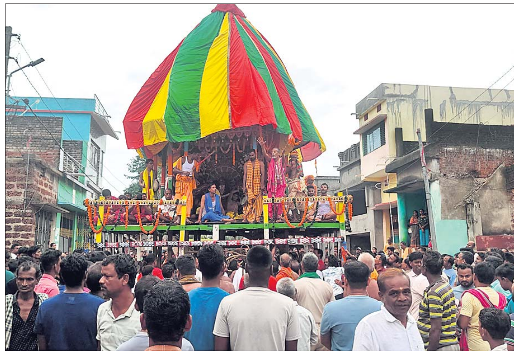
ବାଙ୍କୀ ସରଶାଗଡ଼ ସୁବର୍ଣ୍ଣପୁରସ୍ଥିତ ରଥଯାତ୍ରା ।