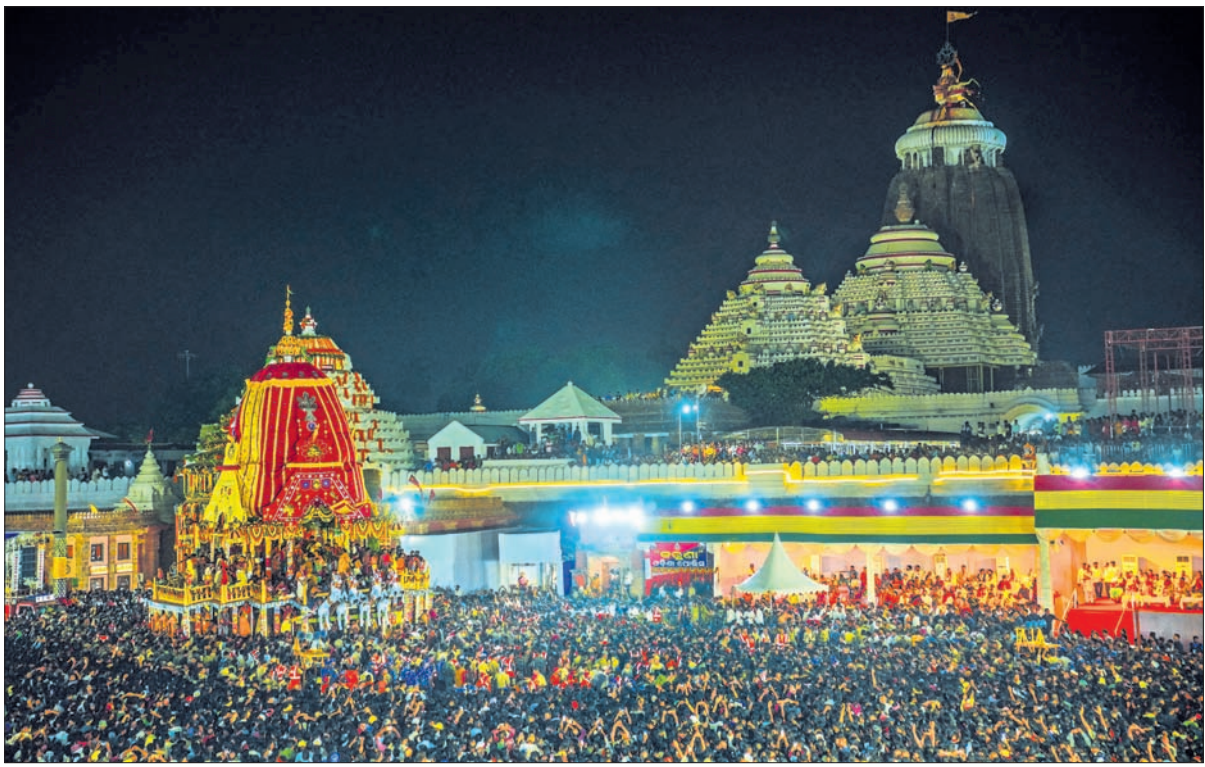
ପୁରୀ ଶ୍ରୀମନ୍ଦିର ସମ୍ମୁଖ ବଡ଼ଦାଣ୍ଡରେ ଶୁକ୍ରବାର କିଛିବାର ଗଲା ପରେ ଅଟକି ରହିଥିବା ନନ୍ଦିଘୋଷ ।