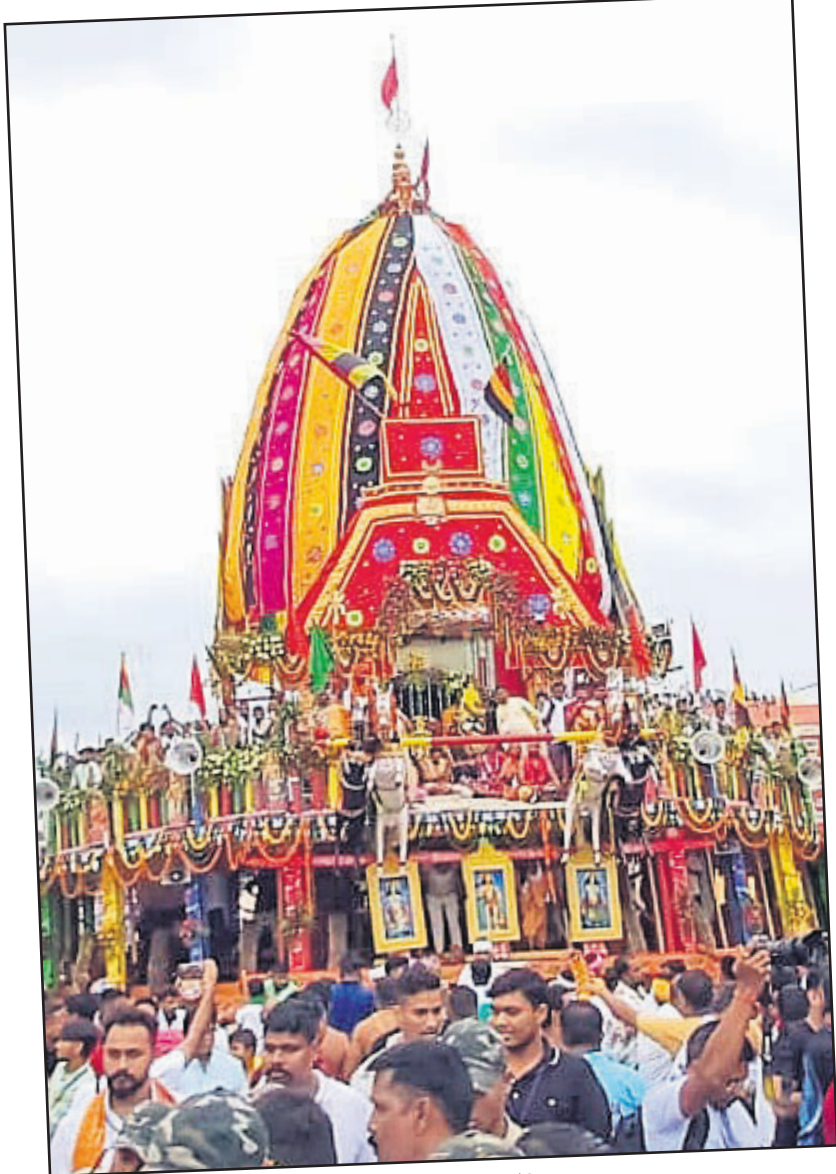
▲ କେନ୍ଦୁଝର: ସର୍ବୋଚ୍ଚ ରଥରେ ଶ୍ରୀବଳଦେବଜୀଉ