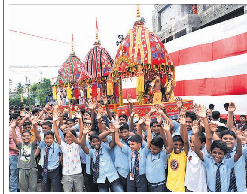
କୋଳଥୁଆ ରଥଯାତ୍ରା: ରଥ ଚାଣିବାକୁ ଅପେକ୍ଷା କରିଥିବା ଛାତ୍ରାଛାତ୍ରୀ ।

ସେଲ୍ଫି ପଠାଇବା ସମୟରେ ନିଜର ନାମ ଏବଂ ମୋବାଇଲ ନମ୍ବର ଦେବାକୁ ଭୁଲନ୍ତୁ ନାହିଁ । ଯୋଗ୍ୟବିବେଚିତ ଫଟୋ ପ୍ରକାଶ ପାଇବ ।