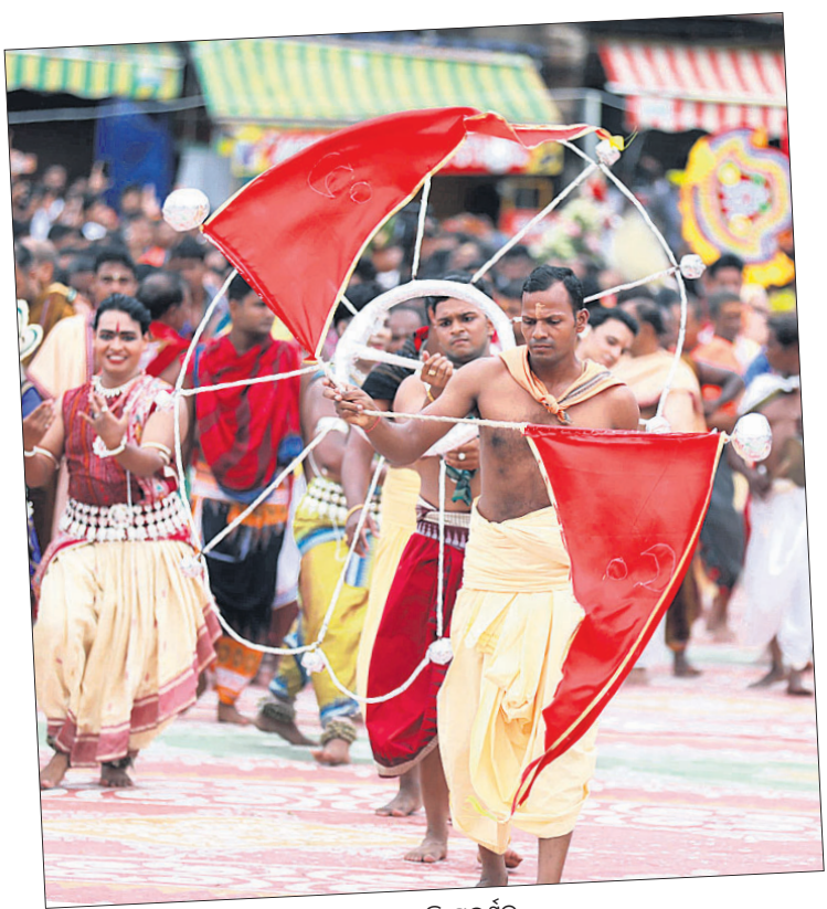
▲ ଚନ୍ଦ୍ରବାଳା ପ୍ରଦର୍ଶନ