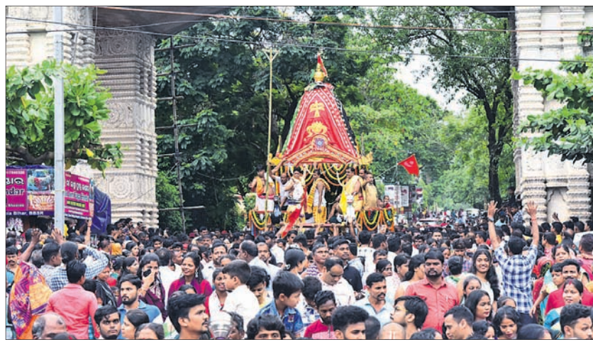
ଆରସିଏମ୍ ପକ୍ଷରୁ ଅନୁଷ୍ଠିତ ରଥଯାତ୍ରା ।