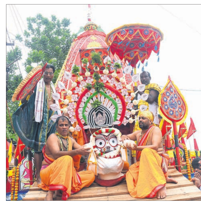
ଯୁନିଟ୍-୫ ଜଗନ୍ନାଥ ମନ୍ଦିର: ରଥ ଉପରକୁ ଠାକୁରଙ୍କୁ ପହଞ୍ଚିରେ ନିଆଯାଇଛି ।