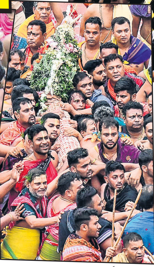
▲ ଶୁକ୍ରବାର ରଥଯାତ୍ରା ଅବସରରେ ଶ୍ରୀମନ୍ଦିରରୁ ଦିବ୍ୟଦ୍ୱାର ସମ୍ମୁଖରେ ଥିବା ଚିନି ଉପରୁ ପହଣି ବିଜେ ହେଉଛି ମହାପ୍ରଭୁ ଶ୍ରୀଜୀଉଙ୍କର, ବଡ଼ଠାକୁର ଶ୍ରୀନକର, ଦେବୀ ଭୁବନୀ, ଚନ୍ଦ୍ରବାଳା ଶ୍ରୀମୁଖର