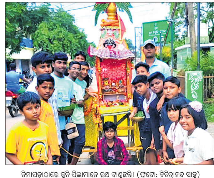
ନିମାପଡ଼ାଠାରେ କୁନି ପିଲାମାନେ ରଥ ଚାଖୁଛନ୍ତି।