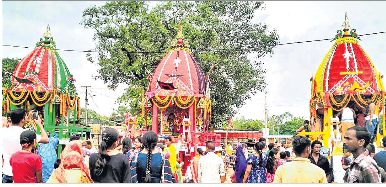
ଚୌଦ୍ୱାର ତିନିକୋଣିଆସ୍ଥିତ ଜଗନ୍ନାଥ ମନ୍ଦିରରେ ଅନୁଷ୍ଠିତ ରଥଯାତ୍ରା ।