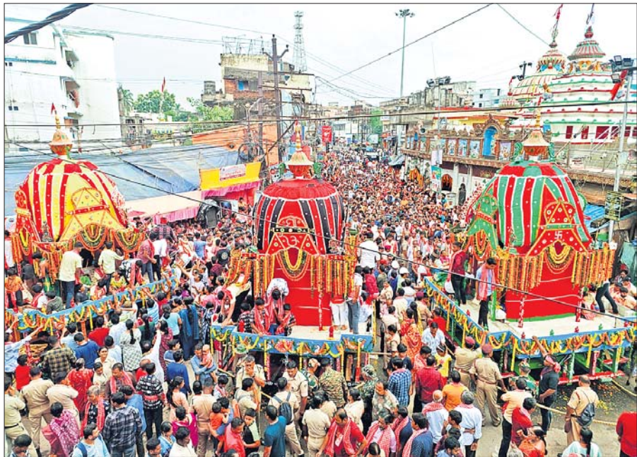
କଟକ ବୋଳପୁଣ୍ୟାଳ ଶ୍ରୀଶ୍ରୀ ପତିତପାବନଜୀଉ ମନ୍ଦିର ପ୍ରାଙ୍ଗଣ ସମ୍ମୁଖରେ ଥିବା ତିନିରଥ ସମ୍ମୁଖରେ ଲୋକାରାଣ୍ୟ ।