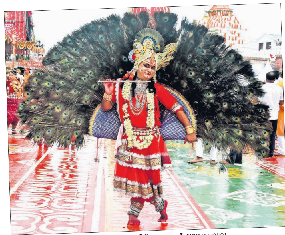
▲ ଉପାକୁର ଠାକୁର ସମ୍ମୁଖରେ ନୂଆ ମାଧ୍ୟମରେ ଭଦ୍ର ନିବେଦନ କରୁଥିବା ଶ୍ରୀମୁଖ ବେଶଧାରୀ