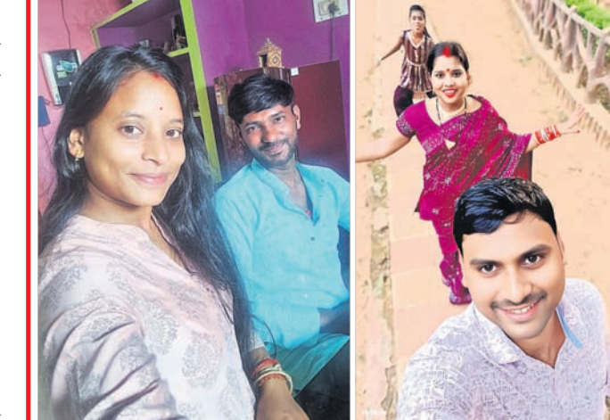
@ ଦୁର୍ଯ୍ୟୋଧନ @ ପ୍ରଣତି