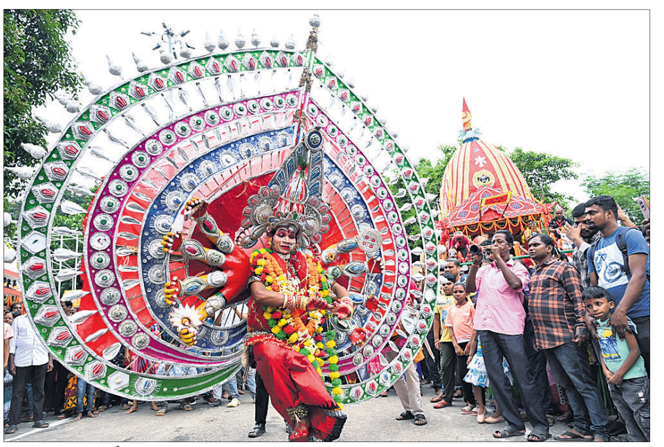
କାଗମରା ଧର୍ମବିହାରରେ ରଥ ସମ୍ମୁଖରେ ଜଣେ ଭକ୍ତ ନୃତ୍ୟ ପରିବେଷଣ କରୁଛନ୍ତି ।