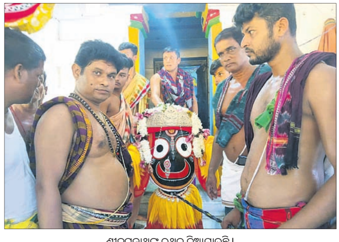
ଶ୍ରୀକରନାଥଙ୍କୁ ରଥକୁ ନିଆଯାଇଛି।