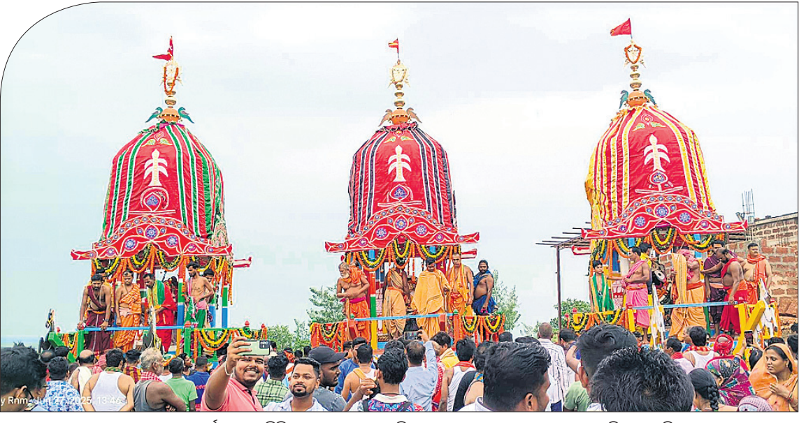
ଜଟଣୀ ବୁଦ୍ଧ ଅନ୍ତର୍ଗତ ଲବଣଗିରିଠାରେ ଶୁକ୍ରବାର ଅନୁଷ୍ଠିତ ରଥଯାତ୍ରାରେ ଶ୍ରୀକାଳୀମାନେ ରଥ ଚାଣି ନେଉଛନ୍ତି।