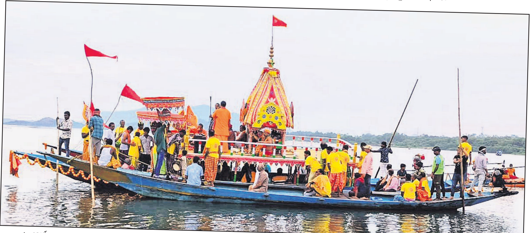
▲ ଖୋର୍ଦ୍ଧା: ମହାପ୍ରଭୁଙ୍କ ଅନ୍ୟତମ ଲୀଳାକ୍ଷେତ୍ର କାଙ୍କଶଶିଖରାଘିଡ଼ି ଜଗନ୍ନାଥ ମନ୍ଦିର ପ୍ରଷ୍ଠ ପକ୍ଷରୁ ଶୁକ୍ରବାର ତିଲିକାରେ ତଙ୍ଗାରେ ଅନୁଷ୍ଠିତ ରଥଯାତ୍ରା