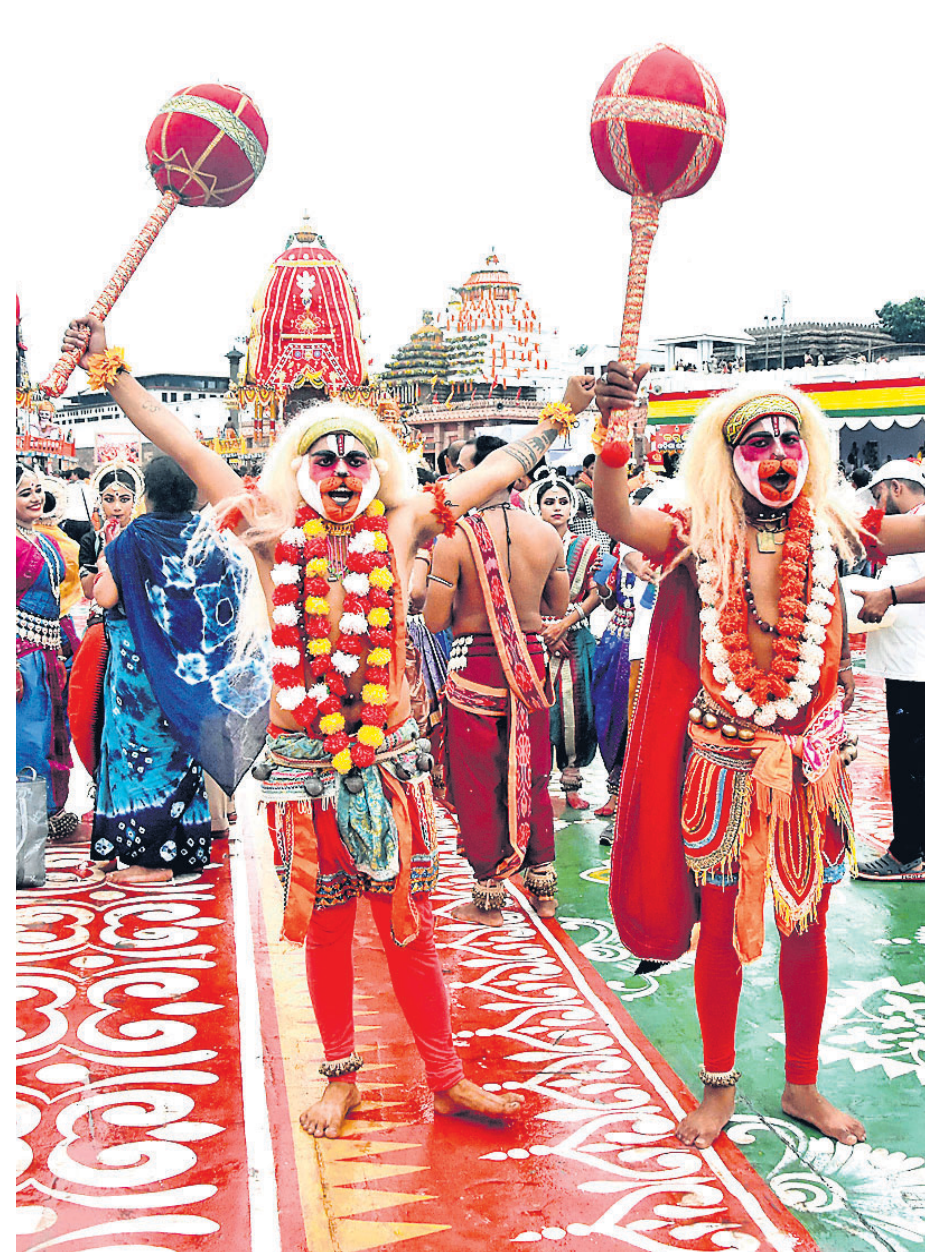
▲ ବଡ଼ଦାଣ୍ଡରେ ହନୁମାନ ବେଶଧାରୀ ଭଣ୍ଡ