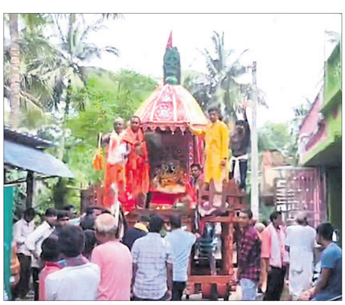
ଭକ୍ତମାନେ ରଥ ଚାଖୁଛନ୍ତି।