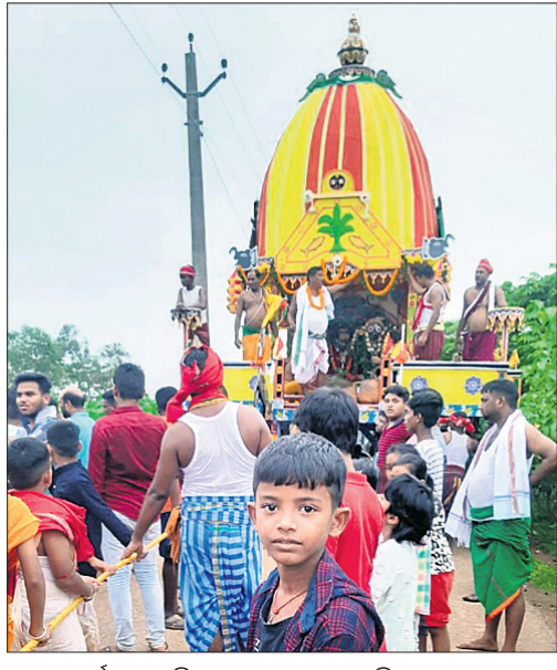
ଖୋର୍ଦ୍ଧା ଉତ୍ତଳକିଶନ ନଗରଠାରେ ଅନୁଷ୍ଠିତ ରଥଯାତ୍ରା।