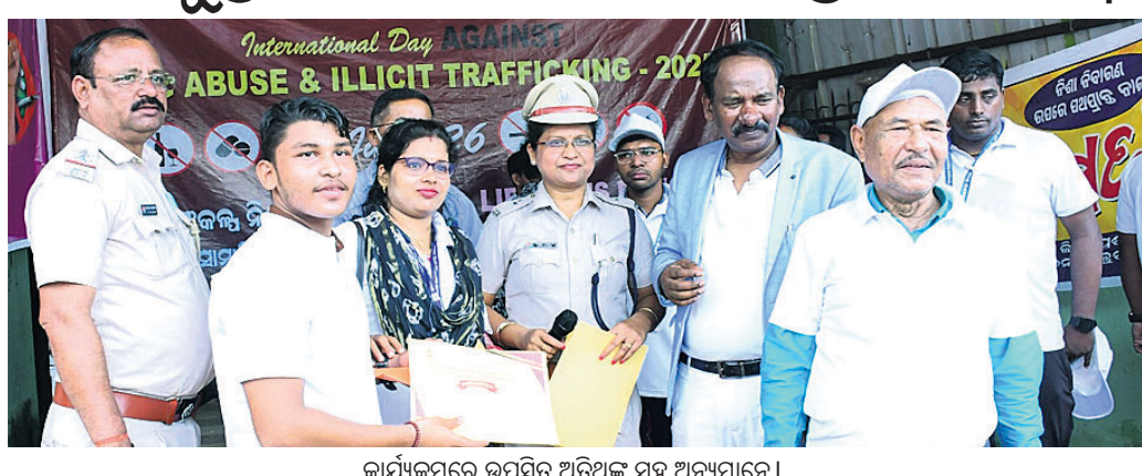
କାର୍ଯ୍ୟକ୍ରମରେ ଉପସ୍ଥିତ ଅତିଥିଙ୍କ ସହ ଅନ୍ୟମାନେ।

ଖୋର୍ଦ୍ଧା, ୨୭୬୭ (ପ୍ରଭାତ ପାଣିଗ୍ରାହୀ) ନିଶା ଅଭ୍ୟାସ ଏକ ମାରାତ୍ମକ ବ୍ୟାଧି। ଏଥିରେ ଥରେ ଅଭ୍ୟାସ ହୋଇଗଲେ ପୁନର୍ଥୁ ଫେରିବା ସହଜ ନ ଥାଏ। ଏପରିକି ନିଶା ପାରିବାରିକ ହିଂସା ଏବଂ ସମାଜରେ ଅଶାନ୍ତି ସୃଷ୍ଟି ହୋଇଥାଏ। ଏଥିରେ ଥରେ ଅଭ୍ୟାସ ହୋଇଗଲେ ପୁନର୍ଥୁ ଫେରିବା ସହଜ ନ ଥାଏ। ଏପରିକି ନିଶା ପାରିବାରିକ ହିଂସା ଏବଂ ସମାଜରେ ଅଶାନ୍ତି ସୃଷ୍ଟି ହୋଇଥାଏ।