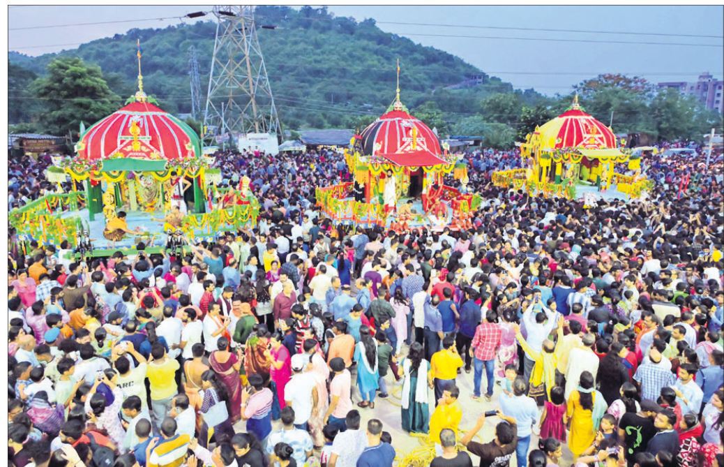
କିମ୍ ଶ୍ରୀବତ୍ସା କ୍ଷେତ୍ର ରଥଯାତ୍ରା: ଭକ୍ତଙ୍କ ମେଳରେ ରଥାରୁଡ଼ ଶ୍ରୀଜୀଉ ।