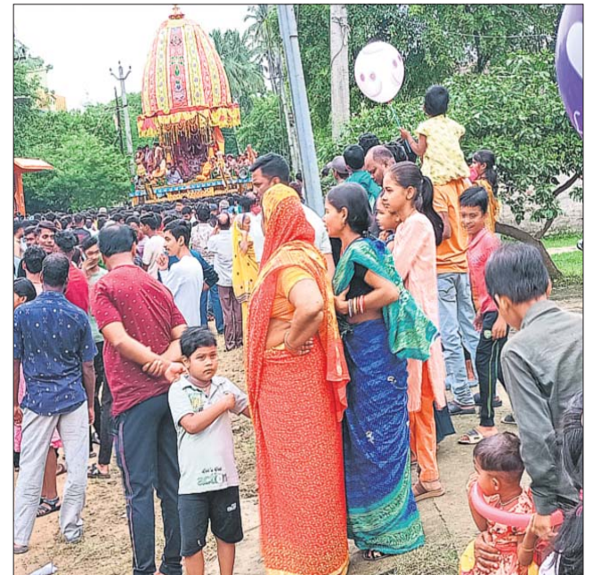
ବନ୍ଦ୍ୟା ସଦର ମହକୁମାରେ ଅନୁଷ୍ଠିତ ରଥଯାତ୍ରା ।