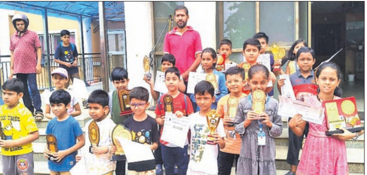
ପୁରସ୍କାର ସହ କୁଟା ପ୍ରତିଯୋଗୀମାନେ।