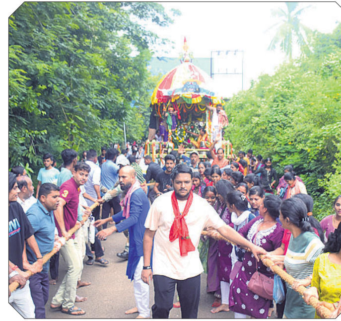
ବାଣାବିହାର ଜଗନ୍ନାଥ ମନ୍ଦିର ପକ୍ଷରୁ ଅନୁଷ୍ଠିତ ରଥଯାତ୍ରା।

ସୁବର୍ଣ୍ଣନକ୍ଷ୍ତ୍ର ବିଜେ କରାଯାଇଥିଲା। ପରେ ଘଣ୍ଟଘଣ୍ଟା, ମୁଦଙ୍ଗ ଓ ବାଦ୍ୟ ସହ ଶତାଧିକ ଶ୍ରୀକାନ୍ତଙ୍କୁ ଛୁଇଁଛୁରି, ହରିବୋଲ ଧ୍ୱନିରେ ଶ୍ରୀପତିତପାବନ ଦେବଙ୍କ ବିଗ୍ରହକୁ ରଥାରୁତ୍ କରାଯାଇଥିଲା। ଅପରାହ୍ନ ୪ଟାରେ ରଥଗଣା ଆରମ୍ଭ ହୋଇଥିଲା। ଭକ୍ତମାନେ ପତିତପାବନ ଦେବଙ୍କ ରଥକୁ ନେଇ ସନ୍ଧ୍ୟା ୬ଟା ସମୟରେ ମାଉସୀ ମା' ମନ୍ଦିର ନିକଟରେ ପହଞ୍ଚାଇଥିଲେ। ରଥଯାତ୍ରାରେ ଶ୍ରୀକାନ୍ତଙ୍କ ପାଇଁ ମନ୍ଦିର ପରିଚାଳନା କର୍ମି ପକ୍ଷରୁ ପ୍ରସାଦ ପହଞ୍ଚି କରାଯାଇ ରଥରେ ପ୍ରଥମେ