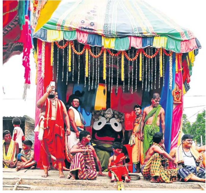
ବାଙ୍କୀ ରଗଡ଼ିତ ରଥାରୁଟ ଶ୍ରୀଜଗନ୍ନାଥ