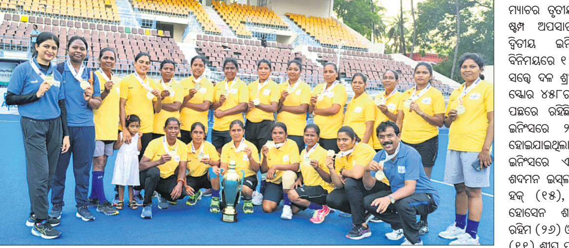
ଚେନ୍ନାଇରେ ଶୁକ୍ରବାର ଉଦ୍‌ଘାଟିତ ହକି ଇଣ୍ଡିଆ ମାଷ୍ଟର୍ସ୍ କପ୍ ହକି ଚୁନାମେଣ୍ଟରେ ମହିଳା ବିଭାଗ ଚାମ୍ପିୟନ ଓଡ଼ିଶା ଦଳ।

ହୋଇଥିଲା। ପର୍ଯ୍ୟାପ୍ତ ସମୟ ପାଇଥିଲେ ମଧ୍ୟ ପଞ୍ଜାବ ଦଳ ଗୋଲଟି ପରିଶୋଧ କରିପାରି ନ ଥିଲା। ତୃତୀୟ ଗ୍ରାମ୍ ପାଇଁ ଅନୁଷ୍ଠିତ ମ୍ୟାଚ୍‌ରେ ତାମିଲନାଡୁକୁ ୪-୩ ଗୋଲରେ ହରାଇ ହରିୟାଣା ଦ୍ରୋଞ୍ଜି ପଦକ ହାସଲ କରିଛି। ଓଡ଼ିଶା ପୁରୁଷ ହକି ଦଳ କିନ୍ତୁ ୪ର୍ଥ ଗ୍ରାମ୍‌ରେ ସହସ୍ତ ହୋଇଛି। ଦ୍ରୋଞ୍ଜି ପଦକ ମ୍ୟାଚ୍‌ରେ ଓଡ଼ିଶା ୧-୨ ଗୋଲରେ ଚଣ୍ଡିଗଡ଼ଠାରୁ ହାରି ଯାଇଛି।