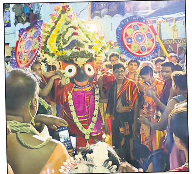
▲ ବାରିପଦା: ଶ୍ରୀଜଗନ୍ନାଥଙ୍କ ପହଣ୍ଡି