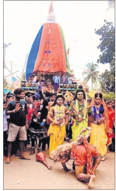
ନିଶ୍ଚିତକୋଇଲି ଉପରକୁଟ ରଥ ।