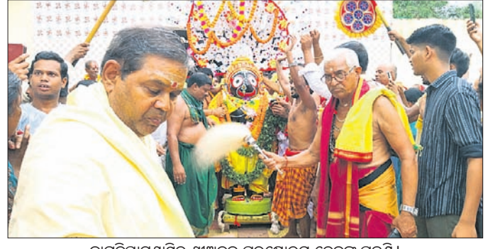
କାରୁକିପାଟଣାସ୍ଥିତ ଶ୍ରୀଅନନ୍ତ ପୁରୁଷୋତ୍ତମ ଦେବଙ୍କ ପହଣ୍ଡି।

ଖୋର୍ଦ୍ଧା କାରୁକିପାଟଣା ସ୍ଥିତ ଶ୍ରୀଅନନ୍ତ ପୁରୁଷୋତ୍ତମ (ପୂର୍ଣ୍ଣବିଗ୍ରହ)ଙ୍କ ଯୋଷାଯାତ୍ରା ଶୁକ୍ରବାର ଅନୁଷ୍ଠିତ ହୋଇଯାଇଛି। ଶ୍ରୀଅନନ୍ତ ପୁରୁଷୋତ୍ତମ (ଶ୍ରୀଜଗନ୍ନାଥ), ବଡ଼ଭାଇ ବଳଭଦ୍ର ଓ ଦେବୀ ସୁଭଦ୍ରାଙ୍କୁ ସାଙ୍ଗରେ ଧରି ଗୋଟିଏ ରଥରେ ବିରାଜମାନକରି ଭକ୍ତଙ୍କୁ ଦର୍ଶନ ଦେଇଥିଲେ। ଠାକୁରଙ୍କ ଏହି ଦର୍ଶନ ଲାଗି ପ୍ରାୟ ୫୦୦ରୁ ଅଧିକ ଯାତ୍ରୀ ସମାଗମ ହୋଇଥିଲା। ଘଣ୍ଟ, କାହା, ମୁଦକ, ହୁଳହୁଳି, କନ୍ଦକନ୍ଦକାରରେ କମ୍ପିଥିଲା ପରିବେଶ। ସଞ୍ଜ ନାତି, ପହଣ୍ଡି ଠିକ୍ ସମୟରେ ସରିଥିଲା। ତେବେ ଛେରାପହରା ନିର୍ଦ୍ଧାରିତ ସମୟର ଏକ ଘଣ୍ଟା ବିଳମ୍ବରେ ହୋଇଥିଲା। ଫଳରେ ରଥରେ ଅନାମ୍ୟ ନାତି ବିଳମ୍ବ ହୋଇଥିଲା। ସନ୍ଧ୍ୟା ସାଢ଼େ ୬ଟା ସୁଦ୍ଧା ରଥ ଗୁଡ଼ିଚା ମନ୍ଦିର ନିକଟରେ ପହଞ୍ଚିଥିଲା। ଶୁକ୍ରବାର ଭୋର ୪ଟାରେ ବୁରାପିଟା, ୫ଟାରେ ମଙ୍ଗଳ ଆଳତି ପରେ ଅନାମ୍ୟ ନାତି ହୋଇ ଠାକୁରଙ୍କ ବେଶଲାଗି ହୋଇଥିଲା। ପୂର୍ବାହ୍ନ ୧୦ଟାରେ ବୈଦିକ