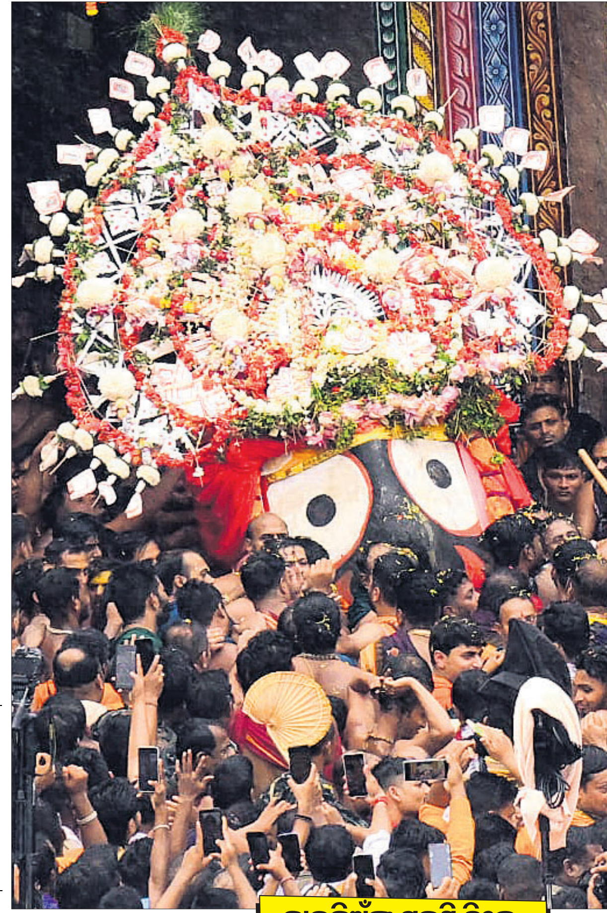
ଦାରୁଡ଼ିଆଁଙ୍କ ପହଣି ଚିଜେ