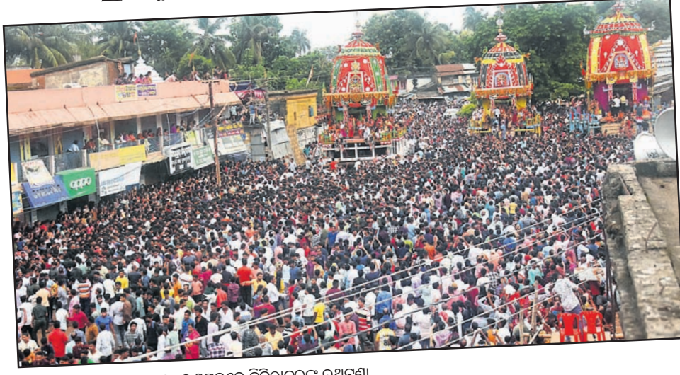
▲ ନୟାଗଡ଼: ରଣପୁରରେ ତିନିଠାକୁରଙ୍କ ରଥଟଣା