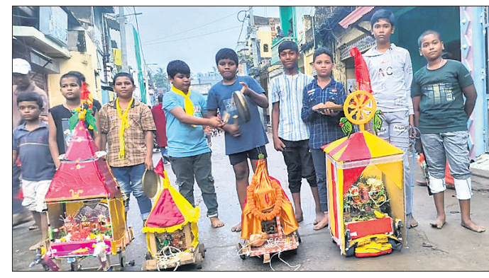
ବାସପୁର ଚଳସାହିରେ କୁନି ପିଲାମାନଙ୍କ ଦ୍ୱାରା ଅନୁଷ୍ଠିତ ରଥଯାତ୍ରା।