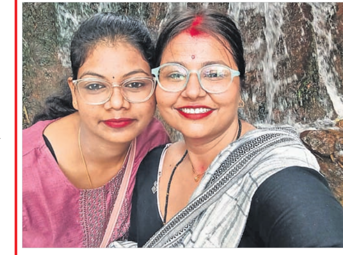
@ ବନ୍ଦନା ସେଲ୍ଫି ପଠାଇବା ସମୟରେ ନିଜର ନାମ ଏବଂ ମୋବାଇଲ ନମ୍ବର ଦେବାକୁ ଭୁଲନ୍ତୁ ନାହିଁ । ଯୋଗ୍ୟବିବେଚିତ ପଠେଇ ପ୍ରକାଶ ପାଇବ ।