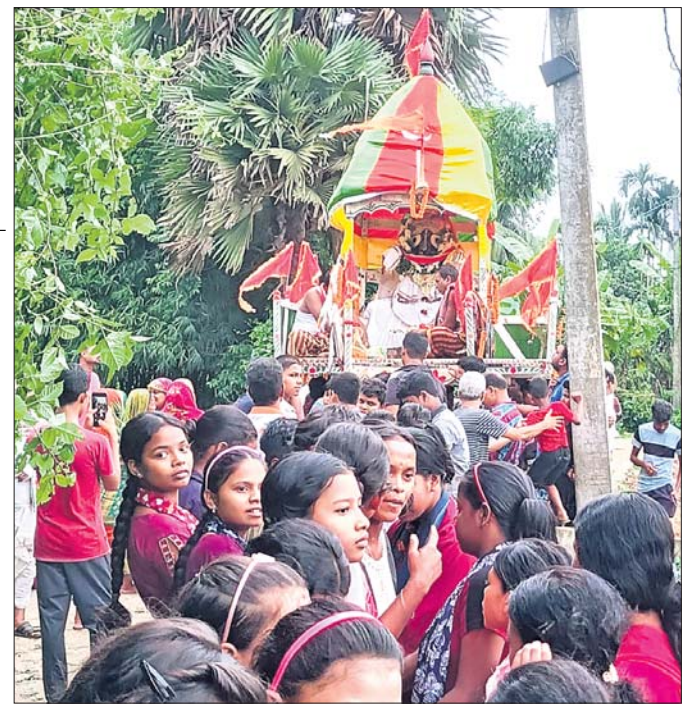
ବନ୍ଦୁରୀ ବଧୂ ବାମନ ଜୀଉ ମନ୍ଦିର ରଥଟଣା ।