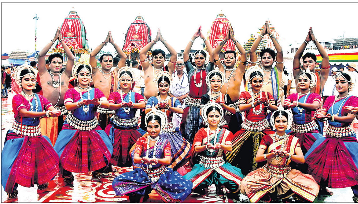
ରଥ ସମ୍ମୁଖରେ ନୃତ୍ୟଶିଳ୍ପୀମାନେ ନୃତ୍ୟ ମାଧ୍ୟମରେ ଭକ୍ତି ନୈବେଦ୍ୟ କରୁଛନ୍ତି।

ପ୍ରଥମରୁ ଅତି ଧୀରେ ଧୀରେ ଠାକୁର ଆଗକୁ ଗଢ଼ିଥିଲା। ଗୋଟିଏ ସମୟରେ ମାତ୍ର ୫୦ ମିନିଟ୍ ଗଢ଼ି, ବାଗେଡ଼ିଆ ଧର୍ମଶାଳା ସମ୍ମୁଖରେ ପ୍ରାୟ ୨୦ ମିନିଟ୍ ପର୍ଯ୍ୟନ୍ତ ଅଟକି ଯାଇଥିଲା। ୧୬ ଥର ରଥକୁ ଚାଣିବାକୁ ପ୍ରୟାସ ସତ୍ତ୍ୱେ ଆଗକୁ ଇଚ୍ଛେମାତ୍ର ଗଢ଼ି ନ ଥିଲା। ପରେ ଅତି ଧୀରେ ଧୀରେ ଆଗକୁ ବଢ଼ିଥିଲା ପ୍ରଥମ ରଥ। ଯେଉଁସବୁଠାରେ ଅନ୍ୟ ବୁଲି ରଥ ଚଣା ବିଳମ୍ବିତ ହୋଇଥିଲା।