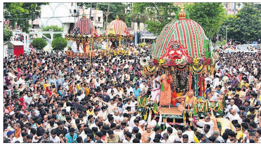
ଇନ୍ଦ୍ର ମନ୍ଦିର ସମ୍ମୁଖରୁ ଭକ୍ତମାନେ ରଥ ଚାଣି ନେଉଛନ୍ତି ।

ସର୍ବପୁରାତନ ଓୟୁଏଟି କଲୋନି ଜଗନ୍ନାଥ ମନ୍ଦିରରେ ଆରମ୍ଭ ହୋଇଥିଲା ରାଜଧାନୀର ପ୍ରଥମ ରଥଯାତ୍ରା ମହୋତ୍ସବ । ଶ୍ରୀମନ୍ଦିର ରାତିନାତି ଅନୁଯାୟୀ ଏଠାରେ ମହାପ୍ରଭୁଙ୍କ ସେବା ଓ ସମସ୍ତ ନାତି କରାଯାଉଥିବା ବେଳେ ଗୋଟିଏ ରଥରେ ତିନି ଠାକୁର ଏକାଠି ବସି ଖଡ଼େଶ୍ୱରୀ ମନ୍ଦିରରୁ ମାଉସୀପାଲ ମନ୍ଦିରକୁ ଯାତ୍ରା କରିଥିଲେ । ଏହି ରଥ ଓୟୁଏଟି କଲୋନିରୁ ଜଗନ୍ନାଥ ମନ୍ଦିରକୁ ବାହାରି ସିରିପୁର ଛକଦେଇ ମାଉସୀପାଲ ମନ୍ଦିରକୁ ଯାଇଥିଲା । ରାତିରେ ଶ୍ରୀଜୀଉମାନଙ୍କ ପହଞ୍ଚି ବିଜେ କରାଯାଇଥିଲା ।