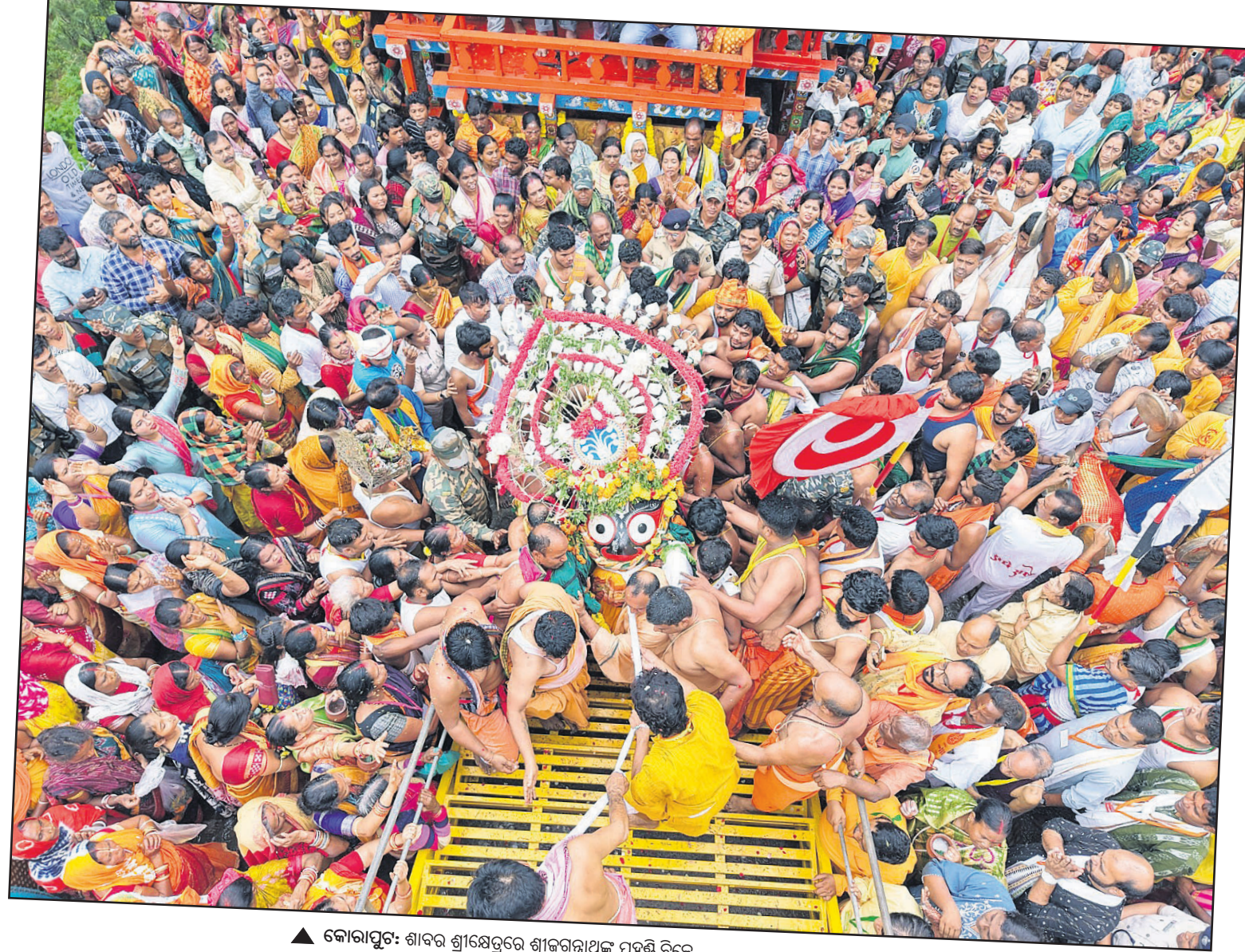
▲ କୋରାପୁଟ: ଶାବର ଶ୍ରୀକ୍ଷେତ୍ରରେ ଶ୍ରୀଜଗନ୍ନାଥଙ୍କ ପହଣ୍ଡି ବିଜେ