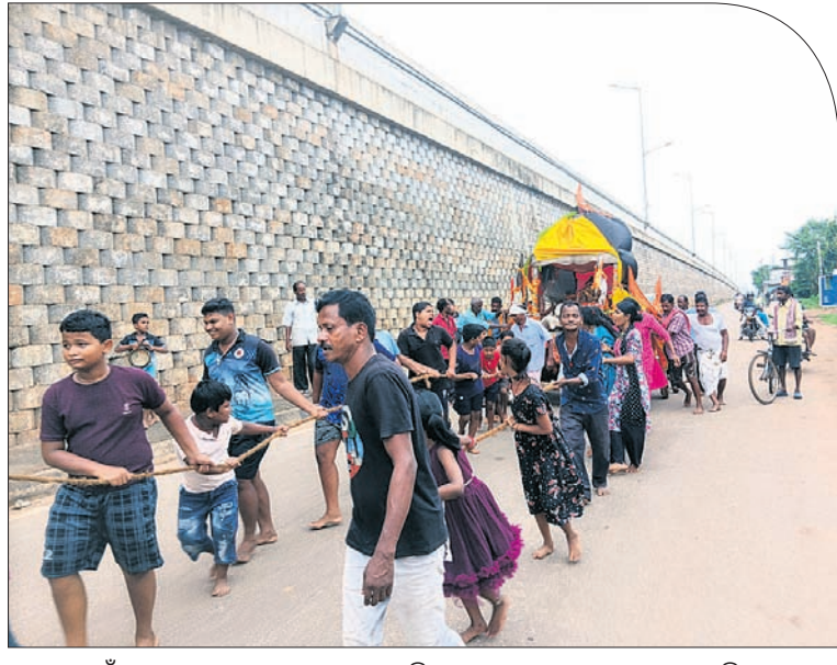
ସୌଳ ପଞ୍ଚାୟତ ମୁଖ୍ୟମହାଶାଳାଠାରେ ଅନୁଷ୍ଠିତ ରଥଯାତ୍ରାରେ ଶ୍ରୀକାଳୀ ରଥ ଚାଣୁଛନ୍ତି।