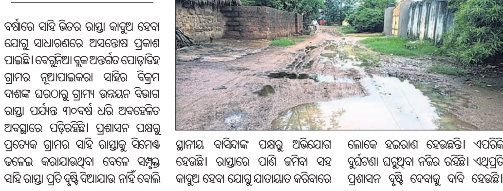
ସାହିରାସ୍ତା କାଦୁଅ ହେତୁ ଲୋକେ ହଇରାଣ ହେଉଛନ୍ତି।