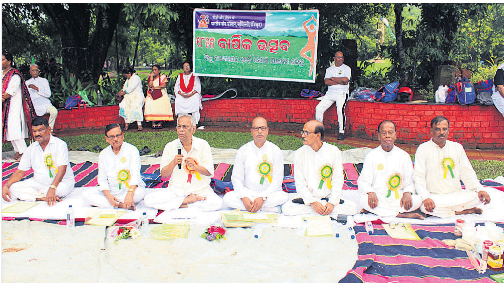
ବାର୍ଷିକ ଉତ୍ସବ ଅବସରରେ ଆୟୋଜିତ ଯୋଗ କାର୍ଯ୍ୟକ୍ରମ।