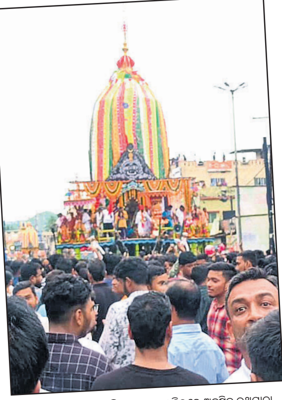
▲ କେଙ୍କାନାଳ: ସହରଘିଡ଼ି ବଳରାମ ମନ୍ଦିରରେ ଅନୁଷ୍ଠିତ ରଥଯାତ୍ରା