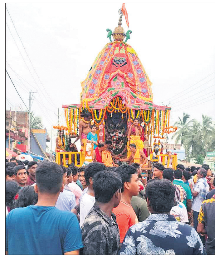
ଜଟଣୀ ପୌରାଞ୍ଚଳ କୁନିଆରୀ ଗ୍ରାମର ବଧୂବାମନ ଦେବଙ୍କ ରଥଯାତ୍ରାରେ ଶ୍ରୀକାଳୀଙ୍କୁ ଗହଳି।