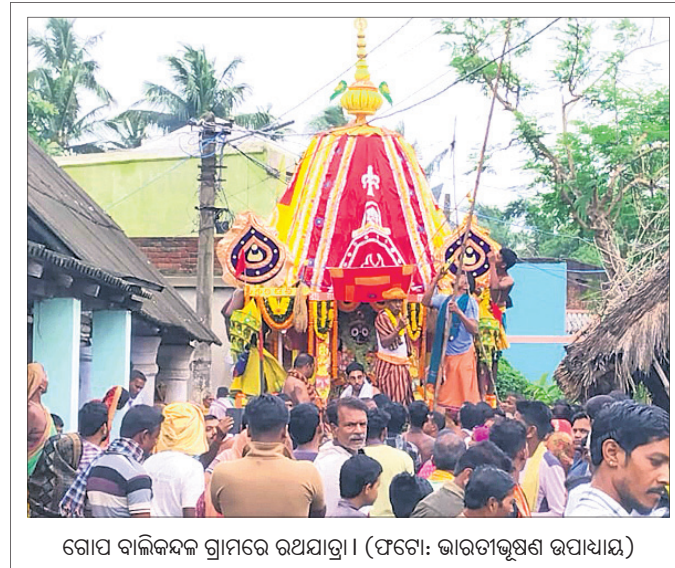
ଗୋପ ବାଳିକଙ୍କ ଗ୍ରାମରେ ରଥଯାତ୍ରା।

ଏପରିକି ରଥଚଣା ସମୟରେ ଅତ୍ୟଧିକ ଗହଳି କାରଣରୁ ଅନେକ ଲୋକ ଆହତ ହୋଇଥିଲେ। ସୁରକ୍ଷାକର୍ମୀ, ସ୍ୱେଚ୍ଛାସେବୀମାନେ ସେମାନଙ୍କୁ ଉଦ୍ଧାର କରି ଜିଲା ପୁଷ୍ପ ଚିକିତ୍ସାଳୟକୁ ନେଇଥିଲେ। ଅନେକ ବ୍ୟକ୍ତି ପ୍ରାଥମିକ ଚିକିତ୍ସା ପରେ ସୁସ୍ଥ ହୋଇ ଫେରିଥିବା ଜଣାପଡ଼ିଛି।