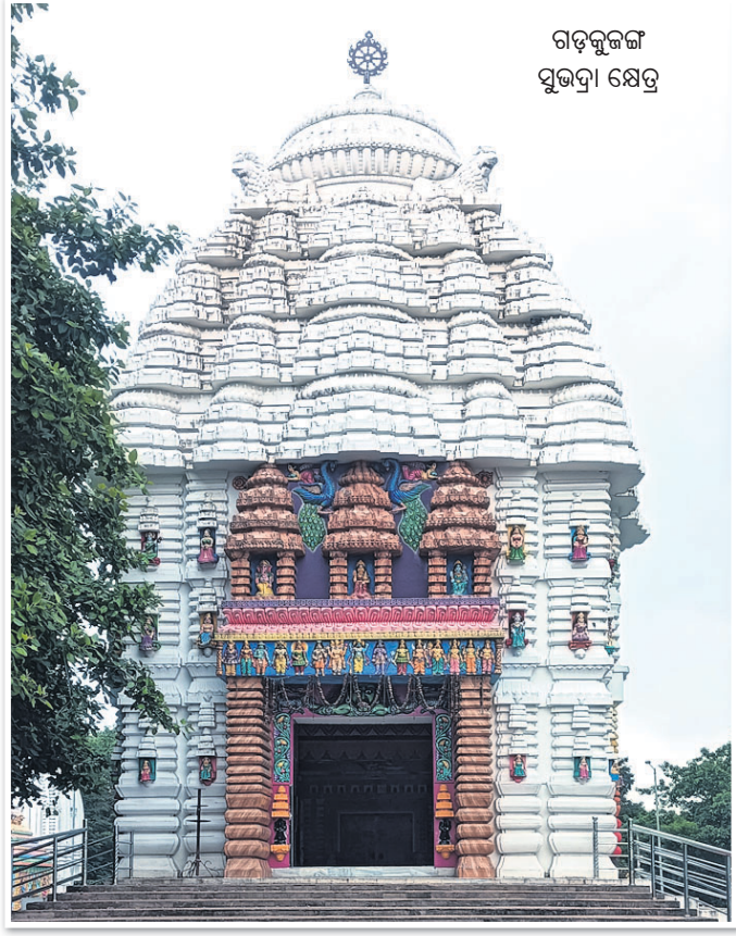
ଗଡ଼କୁଳଙ୍କ ସୁଭଦ୍ରା କ୍ଷେତ୍ର