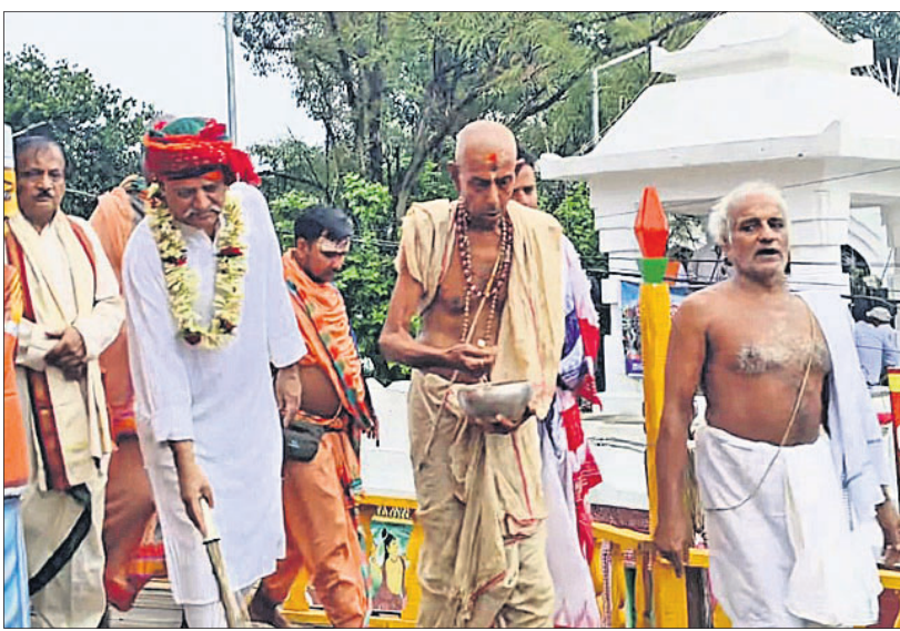
ମୟୂରଭଞ୍ଜ ମହାରାଜା ପ୍ରବାଶ ଚନ୍ଦ୍ର ଭଞ୍ଜଦେଓ ରୁପା ଖଡ଼ିକାରେ ଛେରା ପହଁରା କରୁଛନ୍ତି।