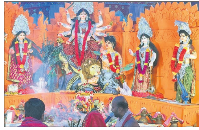
ପଲ୍ଲୀ ସଂସଦ ଯୁବକ ସଂଘର ପୂଜା ମଣ୍ଡପରେ ମା' ।

■ ବ୍ୟକ୍ତିଗତ ସ୍ଥାନରେ ଉନ୍ନତ କାର୍ଯ୍ୟ ହେଉଥିବା ଅଭିଯୋଗ ■ ବିତିଓଙ୍କୁ ଗ୍ରାମବାସୀଙ୍କ ଦାବିପତ୍ର