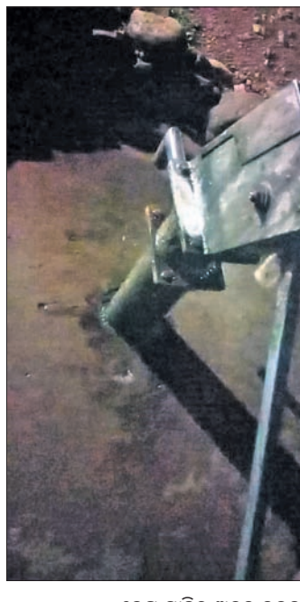
ବେଦ ସାହିର ଅଟଳ ନଳକୂପ।

ରାୟଗଡ଼ା ଜିଲା ବିଷମକଟକ ବ୍ଲକ୍ ଜଳ ଯୋଗାଣ ବିଭାଗୀୟ ଯନ୍ତ୍ରୀ ଠିକ୍ତାରେ ନିଜର କାର୍ଯ୍ୟ କରୁ ନ ଥିବା ଅଭିଯୋଗ ଆଣି ଗ୍ରାମୀଣ ଲୋକେ ଅସନ୍ତୋଷ ବ୍ୟକ୍ତ କରିଛନ୍ତି। ବିଭାଗ ପକ୍ଷରୁ ଠିକ୍ ଭାବେ କାମ କରାଯାଇ ନାହିଁ। ବ୍ଲକ୍ରେ ୧୧୫ ନଳକୂପ ଅଟଳ ହୋଇ ରହିଛି। ଯଦି ବିଭାଗ ପକ୍ଷରୁ ନଳକୂପଗୁଡ଼ିକର ନିୟମିତ ଯାଞ୍ଚ ଓ ରିପୋର୍ଟ ଦିଆଯାଉଛି, ତେବେ ଏବେ ପରିମାଣରେ ନଳକୂପ କିଭଳି ଅଟଳ ଓ ଖରାପ ରହିଛି ତାହା ତଦନ୍ତ ସାପେକ୍ଷ ବୋଲି ଅଞ୍ଚଳବାସୀ କହିଛନ୍ତି। ଏଥିସହ ବ୍ଲକ୍ରେ ୨୦ ବର୍ଷ ରହି କାମ କରୁଥିବା ଯନ୍ତ୍ରୀଙ୍କ ବଦଳି ଦାବି କରିଛନ୍ତି।