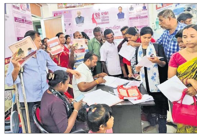
ଆୟୋଜିତ ଏକ ସ୍ୱାସ୍ଥ୍ୟ ଶିବିରରେ ମହିଳାଙ୍କ ସ୍ୱାସ୍ଥ୍ୟ ପରୀକ୍ଷା କରାଯାଇଛି।

'ସୁସ୍ଥ ନାରୀ, ସଶକ୍ତ ପରିବାର' ଅଭିଯାନରେ ଜାତୀୟସ୍ତରରେ ଓଡ଼ିଶା ଅଗ୍ରଣୀ ରହିବା ସହ ବହୁବିଧି ସ୍ୱାସ୍ଥ୍ୟ କ୍ଷେତ୍ରରେ ପ୍ରଶଂସା ହାସଲ କରିଛି। ମହିଳାଙ୍କ ସ୍ୱାସ୍ଥ୍ୟ ମାଧ୍ୟମରେ ପରିବାରକୁ ସଶକ୍ତ କରିବା ଲକ୍ଷ୍ୟରେ ସେପ୍ଟେମ୍ବର ୧୭ରୁ ଅକ୍ଟୋବର ୨ ଯାଏ ଚାଲିଥିବା ଏହି ଅଭିଯାନ ଅନ୍ତର୍ଗ୍ରହଣ, ଟ୍ରେନିଂ ଏବଂ ରୋଷ୍ଟା ସମ୍ପର୍କରେ ମାନବଶକ୍ତ ସ୍ଥାପନ କରିଛି। ସମସ୍ତ ଗ୍ରାମୀଣ ଓ ସହରାଞ୍ଚଳରେ ଆରୋଗ୍ୟ ମନ୍ଦିର, ପ୍ରାଥମିକ ଏବଂ ରୋଷ୍ଟା ସ୍ୱାସ୍ଥ୍ୟ କେନ୍ଦ୍ରରେ ୮୫ ହଜାରରୁ ଅଧିକ ସ୍ୱାସ୍ଥ୍ୟ ଶିବିର ଆୟୋଜନ କରାଯାଇଥିଲା। ଏ କ୍ଷେତ୍ରରେ ଓଡ଼ିଶା ଚତୁର୍ଥ ସ୍ଥାନରେ ରହିଛି। ଏହି ସମୟ ମଧ୍ୟରେ ପ୍ରାୟ ୧ କୋଟିରୁ ଊର୍ଦ୍ଧ୍ୱ ମହିଳାଙ୍କ ମାଗଣା ସ୍ୱାସ୍ଥ୍ୟ ପରୀକ୍ଷା କରାଯାଇଛି, ଯାହା ଦେଶରେ ତୃତୀୟ ସର୍ବାଧିକ ବୋଲି ସ୍ୱାସ୍ଥ୍ୟ ବିଭାଗ ପକ୍ଷରୁ ସୂଚନା ଦିଆଯାଇଛି।