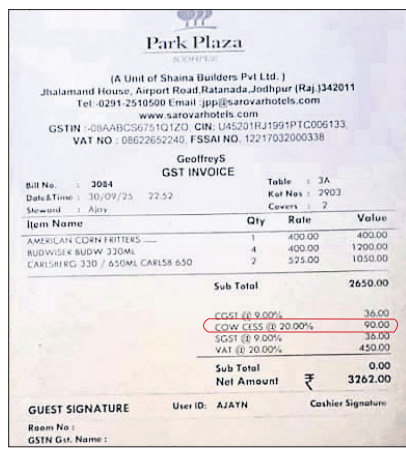
ବିଲ୍ରେ ଉଲ୍ଲେଖ ଥିବା ଗୋ ଶୁଳ୍କ

ମଦ ଉପରେ ୨୦% ଗୋ ଶୁଳ୍କ ଭୁବନେଶ୍ୱର, ୪।୧୦ ରାଜସ୍ଥାନର ଯୋଧପୁରସ୍ଥିତ ପାର୍କ ପ୍ଲାଜା ହୋଟେଲ ଲିଓପ୍ରେ ବାରର ଏକ ବିଲ୍ ସୋସିଆଲ ନିତିଆରେ ଭାଇରାଲ ହେବାରେ ଲାଗିଛି। ଏହି ବିଲ୍ରେ ମଦ ପାଇଁ ଗୁରୁ ଆଣ୍ଡ୍ ସର୍ଭିସେସ୍ ଟାକ୍ସ (ଜିଏସ୍ଟି) ଏବଂ ଭାଲ୍ୟୁ ଆଡଡେଡ୍ ଟାକ୍ସ (ଭାଟ) ବ୍ୟତୀତ ୨୦% ଅତିରିକ୍ତ କାଠି ସେସ୍ ବା ଗୋ ଶୁଳ୍କ ଆଦାୟ କରାଯାଇଛି। ଗୋ ସୁରକ୍ଷା ଏବଂ ଗୋ ଆଶ୍ରୟଗୁଣ୍ଡକୁ ନିରକ୍ଷର ରକ୍ଷଣାବେକ୍ଷଣ ପାଇଁ ଏହି କାଠି ସେସ୍ ଆଦାୟ କରାଯାଇଛି। ଗତ ସେପ୍ଟେମ୍ବର ୩୦ରେ ଲିଓପ୍ରେ ବାରରେ ଜଣେ ଗ୍ରାହକ କିଛି ଆମେରିକାନ୍ କର୍ନ ଫ୍ରିଟ୍ସ ଏବଂ ୬ଟି ବିଅର ଅର୍ଡର କରିଥିଲେ। ଗ୍ରାହକଙ୍କୁ ୨,୬୫୦ ଟଙ୍କାର ବିଲ୍ ଆସିଥିବାବେଳେ ଜିଏସ୍ଟି, ଭାଟ ଏବଂ କାଠି ସେସ୍