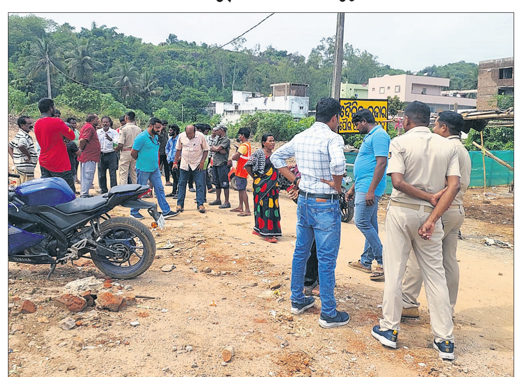
ପୋଲିସ୍ ଓ ପୌର ପରିଷଦ କର୍ମଚାରୀ ଗୁଣୀ ପରିବା ବଜାରରେ ସ୍ଥିତ ଅନୁଧ୍ୟାନ କରୁଛନ୍ତି।