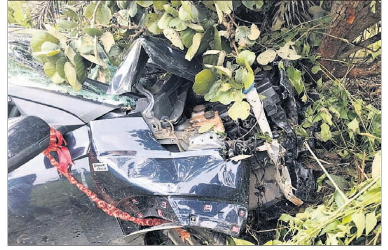
ଗୁରୁତର ଗୁରୁତର କାର।

କାଲିମେଳା, ୪୧୦ (କାବନ କୃଷ୍ଣ ଦାସ) ମାଲକାନଗିରି ଜିଲ୍ଲା ମୋଡୁ ୩୨୬ ନଂ ଜାତୀୟ ରାଜପଥ କାଲିମେଳା ଥାନା ଅଧୀନ ଏମ୍ପି ୩୧ ଗ୍ରାମ ନିକଟରେ ଏକ କାର ଓ ବାଇକ୍ ମୁହାଁମୁହାଁ ଧକ୍କା ହୋଇ ୪ ଶନିବାର ଆହତ ହୋଇଛନ୍ତି। ବାଇକ୍ ଆରୋହୀଙ୍କ ଅସ୍ଥା ସଙ୍କଟାପନ୍ନ ଥିବା ବେଳେ ତାଙ୍କୁ ବିଶାଖାପାଟଣା ସ୍ଥାନାନ୍ତର କରାଯାଇଥିବା ସୂଚନା ରହିଛି। କାରରେ ଥିବା ୩ ଜଣ ମଧ୍ୟରୁ ଜଣେ ଗୁରୁତର ରହିଛନ୍ତି। ଅନ୍ୟ ୨ ଜଣ ସାମାନ୍ୟ ଆହତ ହୋଇଛନ୍ତି।