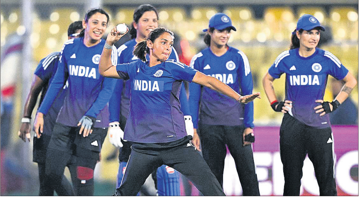
ଭାରତୀୟ ମହିଳା କ୍ରିକେଟ ଦଳର ଅଭ୍ୟାସ।

କଲମ୍ବୋ, ୪।୧୦ ଚଳିତ ମହିଳା ଦିନିକିଆ କ୍ରିକେଟ ବିଶ୍ୱକପ୍ରେ ଉଦ୍ଦେଶ୍ୟରେ ଖେଳାୟିତ୍ରୀଙ୍କୁ ଥିବା ମ୍ୟାଚ୍ରେ ଫୁଲ ପାରମ୍ପରିକ ପ୍ରତିବନ୍ଧା ଭାରତ ଓ ପାକିସ୍ତାନ ପରସ୍ପରକୁ ଭେଟିବେ। ନିକଟରେ ଶେଷ ହୋଇଥିବା ଏସିଆ କପ୍ରେ ପାକିସ୍ତାନ ବିପକ୍ଷରେ ଖେଳାଯାଇଥିବା ୩ ମ୍ୟାଚ୍ରେ ଭାରତୀୟ ପୁରୁଷ ଖେଳାଳିମାନେ ହାତ ନ ମିଳାଇବାକୁ ନେଇ ବିବାଦ ହୋଇଥିବାବେଳେ ଏହି ମ୍ୟାଚ୍ରେ ନେଇ ପ୍ରଶ୍ନାତ୍ମକ ମଧ୍ୟରେ ଉଭୟ ଦଳ ପାଇଛି। ଭାରତୀୟ ପୁରୁଷ ଖେଳାଳିଙ୍କ ଭଳି ମହିଳା ଖେଳାଳିମାନେ ମଧ୍ୟ ପ୍ରତିପକ୍ଷ ଖେଳାଳିଙ୍କ ସହ ହାତ ମିଳାଇବେ ନାହିଁ ବୋଲି ଆଶା କରାଯାଉଛି। ତେବେ ଦୁଇ ପାକିସ୍ତାନ ବିପକ୍ଷରେ ଭାରତକୁ ଫୋର୍ମାଲ୍ ଭାବେ ବିବେଚନା କରାଯାଉଛି। କାରଣ ମହିଳା କ୍ରିକେଟରେ ଫୁଲ ଦଳ ମଧ୍ୟରେ ଏପର୍ଯ୍ୟନ୍ତ ୨୦ଟି ଅନ୍ତର୍ଜାତୀୟ ମ୍ୟାଚ୍ ଖେଳାଯାଇଥିବା ବେଳେ ଭାରତ ୨୪-୩୧ ବ୍ୟବଧାନରେ ଆଗରେ ରହିଛି। ପାକିସ୍ତାନ ତିନି ଫର୍ମାଟରେ ୩ ମ୍ୟାଚ୍ ଜିତିଥିବା ବେଳେ ଦିନିକିଆ ଫର୍ମାଟରେ କବାପି ଭାରତକୁ ହରାଇ ପାରି ନାହିଁ। ପାକିସ୍ତାନ ବିପକ୍ଷରେ ଏପର୍ଯ୍ୟନ୍ତ ଖେଳାଯାଇଥିବା ୧୧