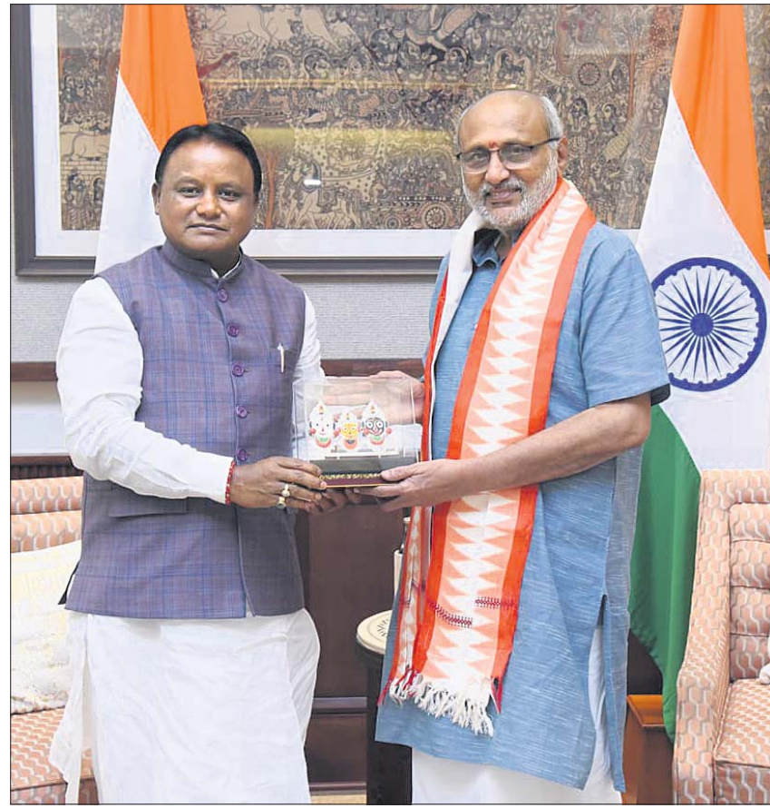
ନୂଆଦିଲ୍ଲୀରେ ପୁଖ୍ୟମନ୍ତ୍ରୀ ମୋହନ ଚରଣ ମାଝୀ ଶନିବାର ଉପରାଷ୍ଟ୍ରପତି ସି.ପି. ରାଧାକ୍ରିଷ୍ଣନ୍ ଓ ଭାଜପା ରାଷ୍ଟ୍ରୀୟ ଅଧ୍ୟକ୍ଷ ତଥା କେନ୍ଦ୍ର ସ୍ୱାସ୍ଥ୍ୟମନ୍ତ୍ରୀ ଜେ.ପି. ନଟ୍ଟାଙ୍କ ସହ ସୌଜନ୍ୟପୂର୍ଣ୍ଣ ସାକ୍ଷାତ କରିଛନ୍ତି।