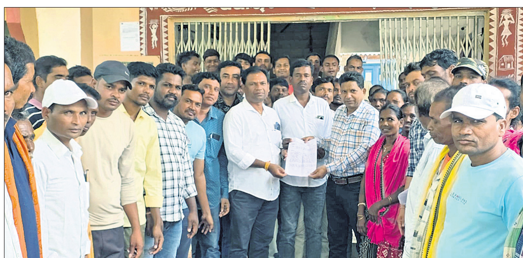
ବିତିଓ ଚଳନ୍ତୁ ଗଣ ଦାବିପତ୍ର ଗ୍ରହଣ କରୁଛନ୍ତି ।

ରାଜ୍ୟ ସରକାରଙ୍କ ଦ୍ୱାରା ଗ୍ରାମାଞ୍ଚଳ ନୈମିତ୍ତିକ ଭିତ୍ତିଭୂମିର ବିକାଶ, ଗ୍ରାମାଞ୍ଚଳରେ ଆବଶ୍ୟକ ଅନୁଯାୟୀ ପ୍ରକଳ୍ପର ଉନ୍ନତକରଣ ଉଦ୍ଦେଶ୍ୟ ନେଇ ବିକଶିତ ଗାଁ ବିକଶିତ ଓଡ଼ିଶା ଭଳି ବିକାଶମୂଳକ ଯୋଜନା ମାଧ୍ୟମରେ ବହୁ କୋଟି ଟଙ୍କା ବ୍ୟୟ କରାଯାଇଛି । ତେବେ ଏହି ଯୋଜନାର ନିର୍ମାଣ କାର୍ଯ୍ୟ ସାମୁହିକ ସ୍ଥାନରେ ନ ହୋଇ ବ୍ୟକ୍ତିଗତ ସ୍ଥାନରେ କରାଯାଉଥିବା ଅଭିଯୋଗ ହୋଇଛି । ଏନେଇ ଚନ୍ଦ୍ରହାଣ୍ଡି ବ୍ଲକ୍ ଧୋଡ଼ିପାଣି ପଞ୍ଚାୟତ ଅଧୀନ ଦଣ୍ଡାପୁଣ୍ଡା ଗ୍ରାମବାସୀ ଶନିବାର ବିତିଓ ଚଳନ୍ତୁ