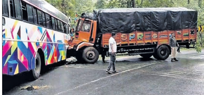
ଦୁର୍ଘଟଣାଗ୍ରସ୍ତ ବସ୍ ଓ ବ୍ରଜ୍ ।

ନବରଙ୍ଗପୁର ଜିଲ୍ଲାରେ ଶୁକ୍ରବାରରୁ ଶନିବାର ମଧ୍ୟରେ ବିଭିନ୍ନ ସ୍ଥାନରେ ଦୁର୍ଘଟଣା ଘଟି ୫ଜଣଙ୍କ ମୃତ୍ୟୁ ହୋଇଛି । ମୃତକଙ୍କ ମଧ୍ୟରେ ଜଣେ ଦମ୍ପତି ମଧ୍ୟ ରହିଥିବା ଜଣାପଡ଼ିଛି । ଶନିବାର ଘଟିଥିବା ବ୍ରଜ୍-ବସ୍ ଦୁର୍ଘଟଣାରେ ବସ୍ ଡ୍ରାଇଭରଙ୍କ ମୃତ୍ୟୁ ହୋଇଥିବାବେଳେ ୨୦ରୁ ଉର୍ଦ୍ଧ୍ୱ ବସ୍ ଯାତ୍ରୀ ଆହତ ହୋଇଛନ୍ତି । ସେହିଭଳି ବାଇଲ୍ ଦୁର୍ଘଟଣାରେ ୨ ଜଣଙ୍କ ମୃତ୍ୟୁ ହୋଇଛି ।