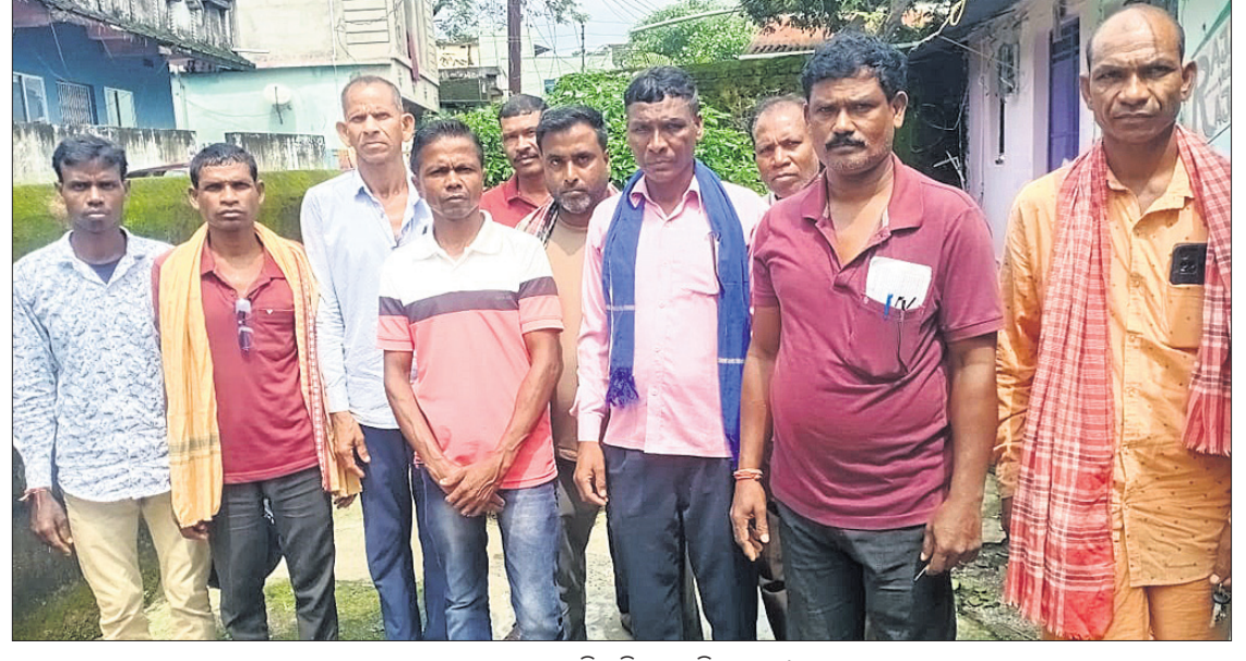
ନଳକୂପ ମରାମତି କରିଥିବା ଶ୍ରମିକମାନେ।