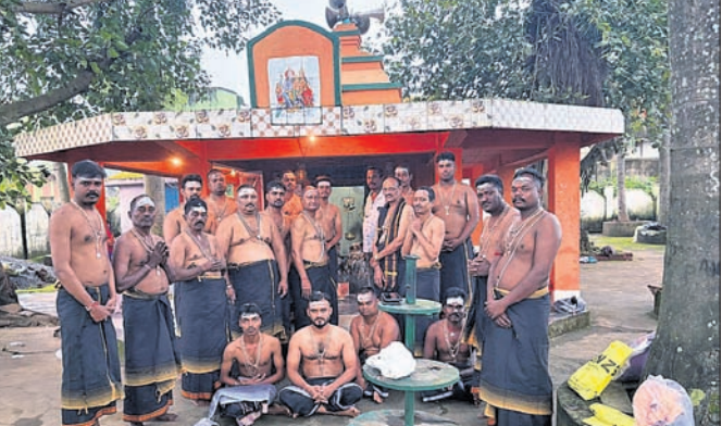
ଦୀକ୍ଷା ଗ୍ରହଣ କରିଥିବା ଆୟାସ୍ତ୍ର ସ୍ୱାମୀମାନେ ।