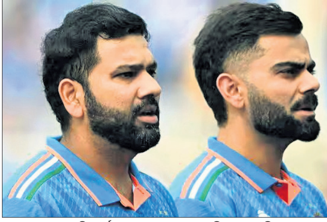
ରୋହିତ ଶର୍ମା ବିରାଟ କୋହଲି