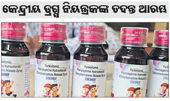
କେନ୍ଦ୍ରୀୟ ଡ୍ରଗ୍ସ ନିୟନ୍ତ୍ରକଙ୍କ ତଦନ୍ତ ଆରମ୍ଭ

ଜୀବନ ନେଉଛି କର୍ମ ସିରପ୍ ନୂଆଦିଲ୍ଲୀ/ଭୋପାଳ/ଭୁବନେଶ୍ୱର, ୪।୧୦(ପି.ଟି./ରବିବାର/ସୁନିତ୍ ମିଶ୍ର) ମଧ୍ୟପ୍ରଦେଶ ଓ ରାଜସ୍ଥାନରେ ନକଲି କର୍ମ ସିରପ୍ ଖାଲ ଅନୁଧ୍ୟନ ୧୦ ଶିଶୁଙ୍କ ମୃତ୍ୟୁ ଘଟିବା ପରେ କେନ୍ଦ୍ରୀୟ ଡ୍ରଗ୍ସ ନିୟନ୍ତ୍ରକ କଟକ ପଶିଛି। ସ୍ୱାସ୍ଥ୍ୟ ମନ୍ତ୍ରାଳୟ ଆଡ଼ଭାଇକରି ଘାଟି କରିବା ପରେ ୬ ରାଜ୍ୟର ୧୯ଟି କର୍ମ ସିରପ୍ ମାନ୍ୟତାକୁ ନିରାକରଣ କରି ଉପରେ ତଦାଉକରି ତଦନ୍ତ ଆରମ୍ଭ କରିଥିବା ଶନିବାର ସେକ୍ସନାଲ ଡ୍ରଗ୍ସ ସ୍ୱାଖର୍ତ୍ତ କର୍ତ୍ତୃକ ଆଗାମୀକେଶ୍ୱର (ସିଏସ୍ଏସ୍) ପକ୍ଷରୁ ସୂଚନା ଦିଆଯାଇଛି। କର୍ମ ସିରପ୍ ନମୁନା ପରୀକ୍ଷାକୁ ସେଥିରେ ବିପଜନକ ମାତ୍ରାରେ ଡାକ୍ତରୀଆଇଲିଂ ଗୁଲକୋଲ (ଡିଜି) ଥିବା ଜଣାପଡ଼ିଛି। ଏହି ରାସାୟନିକ