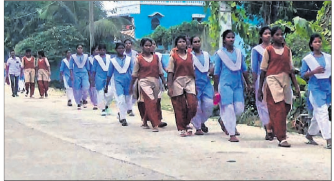
ଛାତ୍ରୀମାନେ ଚାଲି ଚାଲି ଜିଲାପାଳଙ୍କ ଜନଶୁଣାଣି ଶିବିରକୁ ଯାଉଛନ୍ତି।

ହଷ୍ଟେଲ ଏବଂ ବିଦ୍ୟାଳୟରେ ଥିବା ଅବ୍ୟବସ୍ଥାକୁ ନେଇ ଅସନ୍ତୁଷ୍ଟ ଛାତ୍ରୀ ୩ କି.ମି. ଡହ ଡହ ଖରାରେ ଚାଲି ଚାଲି ଜନଶୁଣାଣି ଶିବିରରେ ଜିଲାପାଳଙ୍କୁ ଭେଟି ଗୁହାରି ଜଣାଇବା ଚର୍ଚ୍ଚାର ବିଷୟ ହୋଇଛି। ଏଭଳି ଘଟଣା ଦେଖିବାକୁ ମିଳିଛି ମୟୂରଭଞ୍ଜ ଜିଲା କପିପଦା ବ୍ଲକ ଶରତ ପୂଜାମଣି ହେମ୍ବମ୍ବ ବାଲିକା ଉଚ୍ଚ ବିଦ୍ୟାଳୟରେ। ଏହି ବିଦ୍ୟାଳୟର ନବମ ଏବଂ ଦଶମ ଶ୍ରେଣୀରେ ମୋଟ ୧୨୯ ଜଣ ଛାତ୍ରୀ ପଢୁଥିବା ବେଳେ ୧୦୦ ଛାତ୍ରୀ ହଷ୍ଟେଲରେ ରୁହନ୍ତି। ହେଲେ ଦୀର୍ଘ ଦିନ ହେବ ହଷ୍ଟେଲରେ ଅବ୍ୟବସ୍ଥା ଲାଗି ରହିଛି। ହଷ୍ଟେଲରେ ପାନୀୟ ଜଳର ଅଭାବ, ବିଲମ୍ବରେ ଅନ୍ତେବାସିନୀମାନଙ୍କୁ ଖାଦ୍ୟ ମିଳିବା, ବିଦ୍ୟୁତ୍ ସରବରାହ ନ ରହିବା ସହିତ ବିଦ୍ୟାଳୟରେ ହିନ୍ଦୀ ଶିକ୍ଷକ ଅଭାବ, ସାଇକ୍ଲ ଲାବରେଗୋରି ଖୋଲା ନ ଯିବା, ଲାଇବ୍ରେରି ବନ୍ଦ ରହିବା ଏବଂ ଇଂଲିଶ ବିଷୟ ଭଲ ଭାବରେ ଶିକ୍ଷୟିତ୍ରୀ ପଢ଼ାଇ ନ ଥିବା ଛାତ୍ରୀମାନେ ଅଭିଯୋଗ କରିଛନ୍ତି। ଏନେଇ ପୂର୍ବରୁ ଛାତ୍ରୀମାନେ ପ୍ରଧାନ ଶିକ୍ଷୟିତ୍ରୀଙ୍କୁ ଅବଗତ କରାଇଥିଲେ ହୁଏତ ସେ କିଛି ପଦକ୍ଷେପ ଗ୍ରହଣ କରି