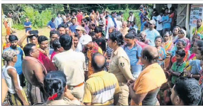
ଗ୍ରାମବାସୀଙ୍କ ସହ ପୋଲିସର ଆଲୋଚନା।

ଛୋଟ ତାଳ ଭାଙ୍ଗି ଘରକୁ ଆଣୁଥିଲେ। ଗୋପାଳପୁର ବିଟ୍ ହାଉସ୍ ଫରେଷ୍ଟଗାର୍ଡ୍ କଟିବା ମହାକୁଟ ଏହାଦେଖି କାହିଁକି ତାଳ ଭାଙ୍ଗିଲ କହି ଦୁର୍ଭିକ୍ଷର କରିବା ସହ ତାଙ୍କୁ ମାଡ଼ ମାରିଥିଲେ। ଫରେଷ୍ଟଗାର୍ଡ୍ ଦୁର୍ଭିକ୍ଷର ଓ ମାଡ଼ ମାରିଥିବା ଘଟଣା ବିଷୟରେ କଟିମଣି ପରିବାର, ପଡ଼ୋଶୀ