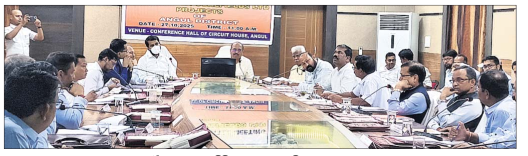
ବୈଠକରେ ଜନପ୍ରତିନିଧିଙ୍କ ସହ ପ୍ରଶାସନିକ ଅଧିକାରୀମାନେ।

ଅନୁଗୋଳ ପ୍ରଦେଶର ଗୃହ ସମ୍ପର୍କରେ ବିପ୍ଳାବିତଙ୍କ ସମସ୍ୟା ସମ୍ପର୍କରେ ଆଲୋଚନା କରାଯାଇଛି।