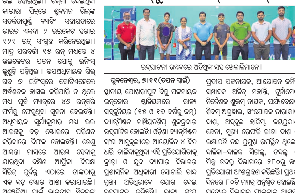
ଭଦ୍ରାପାଟଣା ଉପସ୍ଥିତରେ ଅତିଥିଙ୍କୁ ସହ ଖେଳାଳିମାନେ।

ଭାରତୀୟ ହକିର ଆରମ୍ଭ ୧୯୨୫ରୁ ହୋଇଛି। ଶୁକ୍ରବାର ଏହାର ୧୦୦ତମ ଶତବାର୍ଷିକା ପାଳନ କରାଯାଇଥିଲା। ଏହି ଅବସରରେ ପ୍ରମୁଖ ଗୁରୁଙ୍କ ସମ୍ମାନ କରାଯାଇଥିଲା ଏବଂ ଭାରତୀୟ ହକିର ଇତିହାସ ପ୍ରତି ଉଲ୍ଲେଖମୂଳକ ସମୀକ୍ଷା କରାଯାଇଥିଲା। ଭାରତୀୟ ହକିର ଆରମ୍ଭ ୧୯୨୫ରୁ ହୋଇଛି। ଶୁକ୍ରବାର ଏହାର ୧୦୦ତମ ଶତବାର୍ଷିକା ପାଳନ କରାଯାଇଥିଲା। ଏହି ଅବସରରେ ପ୍ରମୁଖ ଗୁରୁଙ୍କ ସମ୍ମାନ କରାଯାଇଥିଲା ଏବଂ ଭାରତୀୟ ହକିର ଇତିହାସ ପ୍ରତି ଉଲ୍ଲେଖମୂଳକ ସମୀକ୍ଷା କରାଯାଇଥିଲା।