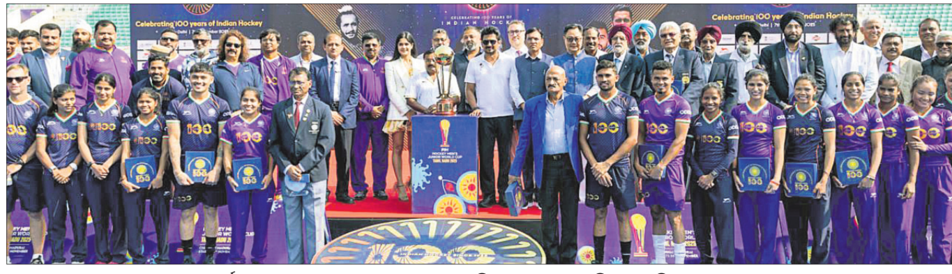
ପ୍ରଦର୍ଶନୀ ମ୍ୟାଚରେ ଭାଗ ନେଇଥିବା ଭାରତୀୟ ମହିଳା ଓ ପୁରୁଷ ଖେଳାଳିମାନେ ଅତିଥିଙ୍କୁ ଗୃହଣରେ।