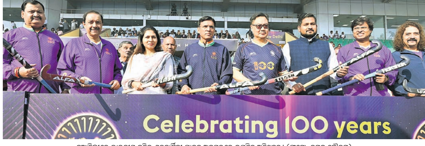
ନୂଆଦିଲ୍ଲୀରେ ଭାରତୀୟ ହକିର ଶତବାର୍ଷିକା ପାଳନ ଅବସରରେ ଉପସ୍ଥିତ ଅତିଥିବୃନ୍ଦ।

ଭାରତୀୟ ହକିର ଆରମ୍ଭ ୧୯୨୫ରୁ ହୋଇଛି। ଶୁକ୍ରବାର ଏହାର ୧୦୦ତମ ଶତବାର୍ଷିକା ପାଳନ କରାଯାଇଥିଲା। ଏହି ଅବସରରେ ପ୍ରମୁଖ ଗୁରୁଙ୍କ ସମ୍ମାନ କରାଯାଇଥିଲା ଏବଂ ଭାରତୀୟ ହକିର ଇତିହାସ ପ୍ରତି ଉଲ୍ଲେଖମୂଳକ ସମୀକ୍ଷା କରାଯାଇଥିଲା।