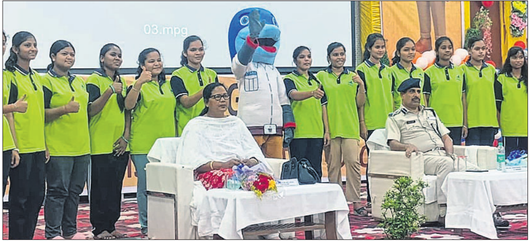
କାର୍ଯ୍ୟକ୍ରମରେ ଉପସ୍ଥିତ ଅତିଥିଙ୍କ ସମେତ ସାମାଜିକ କର୍ମୀମାନେ।