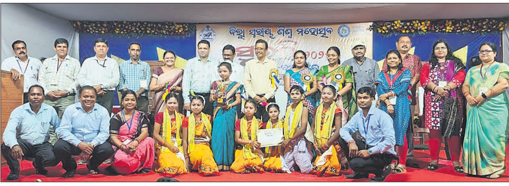
ଜିଲାପ୍ରଧାନ ସୂଚକ କାର୍ଯ୍ୟକ୍ରମରେ ପ୍ରଥମ ସ୍ଥାନ ଅଧିକାର କରିଥିବା କୃତୀ ପ୍ରତିଯୋଗୀଙ୍କ ସହ ଅତିଥି