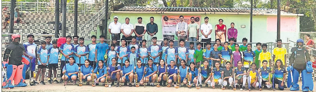
ହକି ପ୍ରଦର୍ଶନୀ ମ୍ୟାଚରେ ଖେଳାଳିଙ୍କ ସହ ଅତିଥି

ବଲାଙ୍ଗୀର, ୭.୧୧ (ଭୁବନେଶ୍ୱର ଖବର) ବଲାଙ୍ଗୀର ସରକାରୀ ଚାଉଳ ହାଇସ୍କୁଲ ପଢ଼ୁଆଠାରେ ଜିଲା ପ୍ରଶାସନ ଏବଂ ଜିଲା ହକି ପରିଷଦ ପକ୍ଷରୁ ଭାରତୀୟ ହକିର ୧୦୦ ତମ ଗୌରବମୟ ବର୍ଷ ପୂର୍ତ୍ତି ପାଳନ କରାଯାଇଥିଲା।