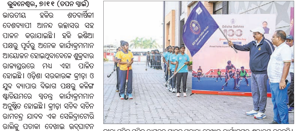
କ୍ରୀଡ଼ା ସବିବ ସତ୍ତା ପଞ୍ଚମ ସଭା ପଞ୍ଚମ ପଞ୍ଚମ ଦେଶୀୟ କାର୍ଯ୍ୟକ୍ରମ ଶୁଭାରମ୍ଭ କରୁଛନ୍ତି।

୨୦୧୮ରୁ ଓଡ଼ିଶା ପ୍ରାୟୋଗକ ଭାରତୀୟ ହକିର ଶତବାର୍ଷିକା ପାଳନ ଅବସରରେ ଉପସ୍ଥିତ ଅତିଥିବୃନ୍ଦ। ଏହି ଅବସରରେ ପ୍ରମୁଖ ଗୁରୁଙ୍କ ସମ୍ମାନ କରାଯାଇଥିଲା ଏବଂ ଭାରତୀୟ ହକିର ଇତିହାସ ପ୍ରତି ଉଲ୍ଲେଖମୂଳକ ସମୀକ୍ଷା କରାଯାଇଥିଲା। ଭାରତୀୟ ହକିର ଆରମ୍ଭ ୧୯୨୫ରୁ ହୋଇଛି। ଶୁକ୍ରବାର ଏହାର ୧୦୦ତମ ଶତବାର୍ଷିକା ପାଳନ କରାଯାଇଥିଲା। ଏହି ଅବସରରେ ପ୍ରମୁଖ ଗୁରୁଙ୍କ ସମ୍ମାନ କରାଯାଇଥିଲା ଏବଂ ଭାରତୀୟ ହକିର ଇତିହାସ ପ୍ରତି ଉଲ୍ଲେଖମୂଳକ ସମୀକ୍ଷା କରାଯାଇଥିଲା।