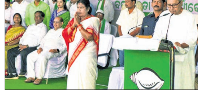
ନୂଆପଡ଼ା ପରକୋଟ ପଡ଼ିଆଠାରେ ଶୁକ୍ରବାର ଆୟୋଜିତ ସମାବେଶକୁ ଉଦ୍ଘାଟନ କେଉଁ ବିଜେଡି ସଭାପତି ନବୀନ ପଟ୍ଟନାୟକ।

ସମୃଦ୍ଧ ଓଡ଼ିଶା ପାଇଁ ହେଉଛି ମାଷ୍ଟର ପ୍ଲାନ: ମୁଖ୍ୟମନ୍ତ୍ରୀ ଭୁବନେଶ୍ୱର, ୭୧୧ (ଉଦ୍ଘାଟନ କେନା) ଆଗାମୀ ୨୦୩୬ ବୁଦ୍ଧି ସମୃଦ୍ଧ ଓଡ଼ିଶା ୧୦୦ ପାଇଁ ଓଡ଼ିଶାର ଅର୍ଥନୀତିକୁ ମଜବୁତ କରୁଛି। ଏଥିପାଇଁ ଆମ ସରକାର ବନ୍ଦର, ସଡ଼କ, ରେଳ ଏବଂ ବିମାନ ଚଳାଚଳ କ୍ଷେତ୍ରର ବିକାଶ ଦିଗରେ ଉଦ୍ୟମ ଅବ୍ୟାହତ ରଖୁଛନ୍ତି। ଓଡ଼ିଶା ଷ୍ଟେଟ୍ ରୋଡ୍ ପଲିସି-୨୦୨୫ ଏବଂ ଓଡ଼ିଶା ଷ୍ଟେଟ୍ ହାଇଡ୍ରୋ ଅଥୋରିଟି ଆକ୍ଟ-୨୦୨୫ ପ୍ରଣୟନ କରାଯାଇଛି। ସମୃଦ୍ଧ ଓଡ଼ିଶା ୧୦୦ ପାଇଁ ବିସ୍ତୃତ ଭିଡିଓଫିର ମାଷ୍ଟର ପ୍ଲାନ ପ୍ରସ୍ତୁତ କରାଯାଇଛି ବୋଲି ମୁଖ୍ୟମନ୍ତ୍ରୀ ମୋହନ ଚରଣ ମାଝୀ କହିଛନ୍ତି। ଶୁକ୍ରବାର ୮୪ତମ ଭାରତୀୟ ସଡ଼କ କଂଗ୍ରେସ ସମାବେଶରେ ଉଦ୍ଘାଟନ କେଉଁ ମୁଖ୍ୟମନ୍ତ୍ରୀ କହିଛନ୍ତି, ୨୦୨୫-୨୬ ଟ୍ରାଫିକ୍-୪