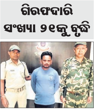
ଗିରଫଦାରୀ ସଂଖ୍ୟା ୨୧କୁ ଚୁକ୍ତି

ଏସ୍‌ଏମ୍‌ସିରେ ନକଲି ନିୟୁକ୍ତି କେଳେଙ୍କାରୀ ଘଟଣା: ଗିରଫ ହେଲେ ଆଉ ଜଣେ