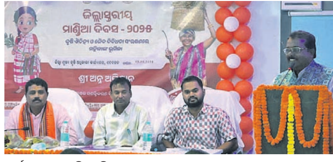
କାର୍ଯ୍ୟକ୍ରମରେ ଉପସ୍ଥିତ ଅତିଥିମାନେ।

ଦେବଗଡ଼ ଜିଲ୍ଲା ମୁଖ୍ୟ କୃଷି ଅଧିକାରୀଙ୍କ ସମ୍ମିଳନୀ କକ୍ଷରେ ଜିଲ୍ଲା କୃଷି ବିଭାଗ ପକ୍ଷରୁ ଜିଲ୍ଲାସ୍ତରୀୟ ମାଣିଆ ଦିବସ, ଖାଦ୍ୟ ନେତା ଶୁକ୍ରବାର ଅନୁଷ୍ଠିତ ହୋଇଯାଇଛି।