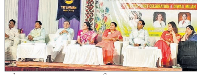
କାର୍ଯ୍ୟକ୍ରମ ଅବସରରେ ଯୋଗଦେଇଥିବା ଅତିଥି

ଟିଚିଲାଗଡ଼, ୭.୧୧ (ଶରତ ମିଶ୍ର) ଟିଚିଲାଗଡ଼ ଲାୟନ୍ କ୍ଲବ ତରଫରୁ ଚାର୍ଚ୍ଚର ନାଉଟି ଓ ଦିୱାଲି ମିଳନ କାର୍ଯ୍ୟକ୍ରମ ସଭାପତି ସଞ୍ଜୟ ଯୋଗିଙ୍କ ସଭାପତିତ୍ୱରେ ଘୋଷଣା କରାଯାଇଛି।