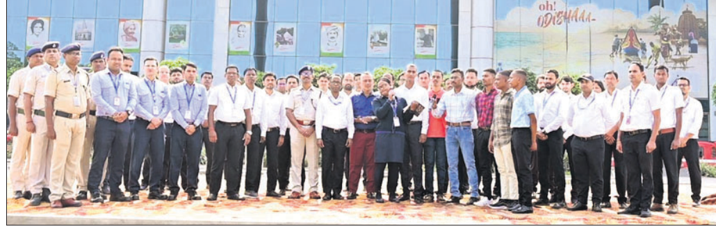
କାର୍ଯ୍ୟକ୍ରମରେ ବିନାବନ୍ଦର ଅଧିକାରୀ ଓ କର୍ମଚାରୀ।