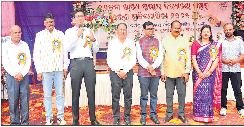
ଓଡ଼ିଶା ସରକାରଙ୍କ ବିଦ୍ୟାଳୟ ଓ ଗଣଶିକ୍ଷା ବିଭାଗ ଆୟୋଜିତ ୨୯ତମ ରାଜ୍ୟ ସ୍ତରୀୟ ବିଦ୍ୟାଳୟ ସମୂହ ସଙ୍ଗରଣ ପ୍ରତିଯୋଗିତାର ଉଦ୍‌ଘାଟନ ଉତ୍ସବରେ ଅତିଥିମାନେ ।