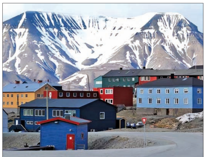
ସବୁଠାରୁ ଅଜବ ଗାଁ ବୋଲି କୁହାଯାଏ। ସ୍ଥାନୀୟ ଲୋକଙ୍କ ବିଶ୍ୱାସରେ କୌଣସି ଶିଶୁର ଜନ୍ମ ନାହିଁ ଏବଂ ଏହା ଅତ୍ୟନ୍ତ ଅଧିକ। ଏଠାରେ ଜନ୍ମ ପର୍ଯ୍ୟନ୍ତେ, ଅର୍ଥାତ୍ ଏହା ବର୍ଷଦିନ ଧରି ଚାଲି ରହିଥାଏ। ଏହା ସେଠାରେ

ବିଶ୍ୱରେ ୧୯୫ଟି ଦେଶ ଅଛି। ପ୍ରତ୍ୟେକ ଗ୍ରାମର ନିଜସ୍ୱ ସ୍ୱତନ୍ତ୍ର ପରିଚୟ ଅଛି। ଏଗୁଡ଼ିକ ମଧ୍ୟରେ ଏପରି ଏକ ଗ୍ରାମ ଅଛି ଯେଉଁଠାରେ ନା କୌଣସି ଶିଶୁକୁ ଜନ୍ମ ନେବାକୁ କିମ୍ବା କୌଣସି ବ୍ୟକ୍ତିକୁ ମରବାକୁ ଅନୁମତି ଦିଆଯାଇଛି। ଏହା ଶୁଣି ଆଶ୍ଚର୍ଯ୍ୟ ହେବା ସ୍ୱାଭାବିକ, କିନ୍ତୁ ଏହା ସତ। ଲୋକଙ୍କ ବିଶ୍ୱାସରେ ଗାଁରୁ ଏହି ଗାଁ ସମ୍ପୂର୍ଣ୍ଣ ଭିନ୍ନ ନିୟମ ଅନୁଯାୟୀ ଚାଲେ। ଏହାର ବ୍ୟବସ୍ଥା ଏବଂ ଜୀବନଶୈଳୀକୁ ବିଶ୍ୱର ଅନ୍ୟ ଦେଶଠାରୁ ସମ୍ପୂର୍ଣ୍ଣ ଭିନ୍ନ ବୋଲି ବିବେଚନା କରାଯାଏ। ଏହି କାରଣରୁ ଉକ୍ତ ଗ୍ରାମଟି ପ୍ରାୟତଃ ଚର୍ଚ୍ଚାରେ ରହିଥାଏ। ଉତ୍ତର ମେକ୍ସିକୋ ପ୍ରାୟ ୧୩୦୦ କିଲୋମିଟର ଦୂରରେ ସ୍ଥାନୀୟ ନାମକ ଏକ ନରଥେକ୍ସିଆନ ଦ୍ୱୀପପୁଞ୍ଜ ଅବସ୍ଥିତ। ଏହି ଗ୍ରାମଟି ନରଥେକ୍ସିଆନ ଆଖି, କିନ୍ତୁ ଭିନ୍ନ ବିନା ଯାତ୍ରା ସମ୍ଭବ। ସେଠାରେ ପହଞ୍ଚିବା ସହଜ ହେଲେ, ସେଠାରେ ଜନ୍ମଦେବା ଏବଂ ମରିବା ପ୍ରାୟ ଅସମ୍ଭବ। ଏହି ଗ୍ରାମକୁ ବିଶ୍ୱର