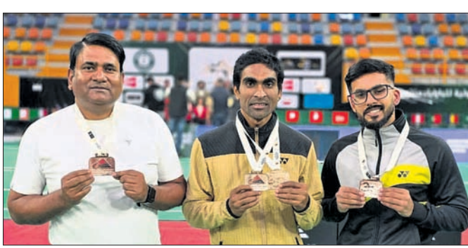
ପଦକ ସହ ଓଡ଼ିଶା ପାଇଁ ବ୍ୟାଡ୍‌ମିଣ୍ଟନ ଖେଳାଳି।

ଭୁବନେଶ୍ୱର, ୧୯୮୧ (ତପନ ସ୍ୱାଇଁ) କାସ୍‌ବୋରେ ଅନୁଷ୍ଠିତ ଲିଗ୍ ପାଇଁ ବ୍ୟାଡ୍‌ମିଣ୍ଟନ ଟୁର୍ନାମେଣ୍ଟରେ ଭାରତ ପକ୍ଷରୁ ପ୍ରତିନିଧିତ୍ୱ କରିଥିବା ଓଡ଼ିଶା ଖେଳାଳିମାନେ ପ୍ରଭାବା ପ୍ରଦର୍ଶନ କରିଛନ୍ତି। ଗତ ୧୩ରୁ ୧୮ ପର୍ଯ୍ୟନ୍ତ ଅନୁଷ୍ଠିତ ପ୍ରତିଯୋଗିତାରେ