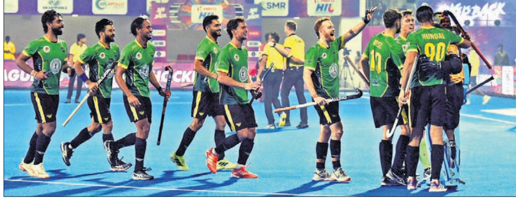
ଏସ୍‌ଆଇଏଲ୍ ଲିଗ୍ ବିପକ୍ଷରେ ବିଜୟ ପରେ ଉଲ୍ଲାସରେ ରାଷ୍ଟ୍ର ରୟାଲ୍ସ ଦଳର ଖେଳାଳିମାନେ।

ଗାଇଟଲ ଏବଂ ଏକ କ୍ୟାରିୟର ଗ୍ରାଣ୍ଡସ୍ଲାମ ଜିତବାକୁ ହେଲେ ତାଙ୍କୁ ଅନେକ କିଛି କରିବାକୁ ପଡ଼ିବ। ଯୋଗଦାନ ଅନୁଷ୍ଠିତ ଏକ ମହିଳା ବିଜେତା ପ୍ରଥମ ରାଉଣ୍ଡରେ ମ୍ୟାଚରେ ବିଜୟ ରାଫାଏଲ୍ ପ୍ରାୟ ସ୍ୱିଟେକ୍ ୬-୨(୫), ୬-୩ ସେଟ୍‌ରେ ୧୩୦ ର୍ୟାଙ୍କିଙ୍ଗ୍ ପ୍ରାୟ ଗାଇଟଲ କ୍ୱାଲିଫାୟର ଯୁଆନ ଯୁଇଙ୍କୁ ହରାଇ ଦେଇଛନ୍ତି।