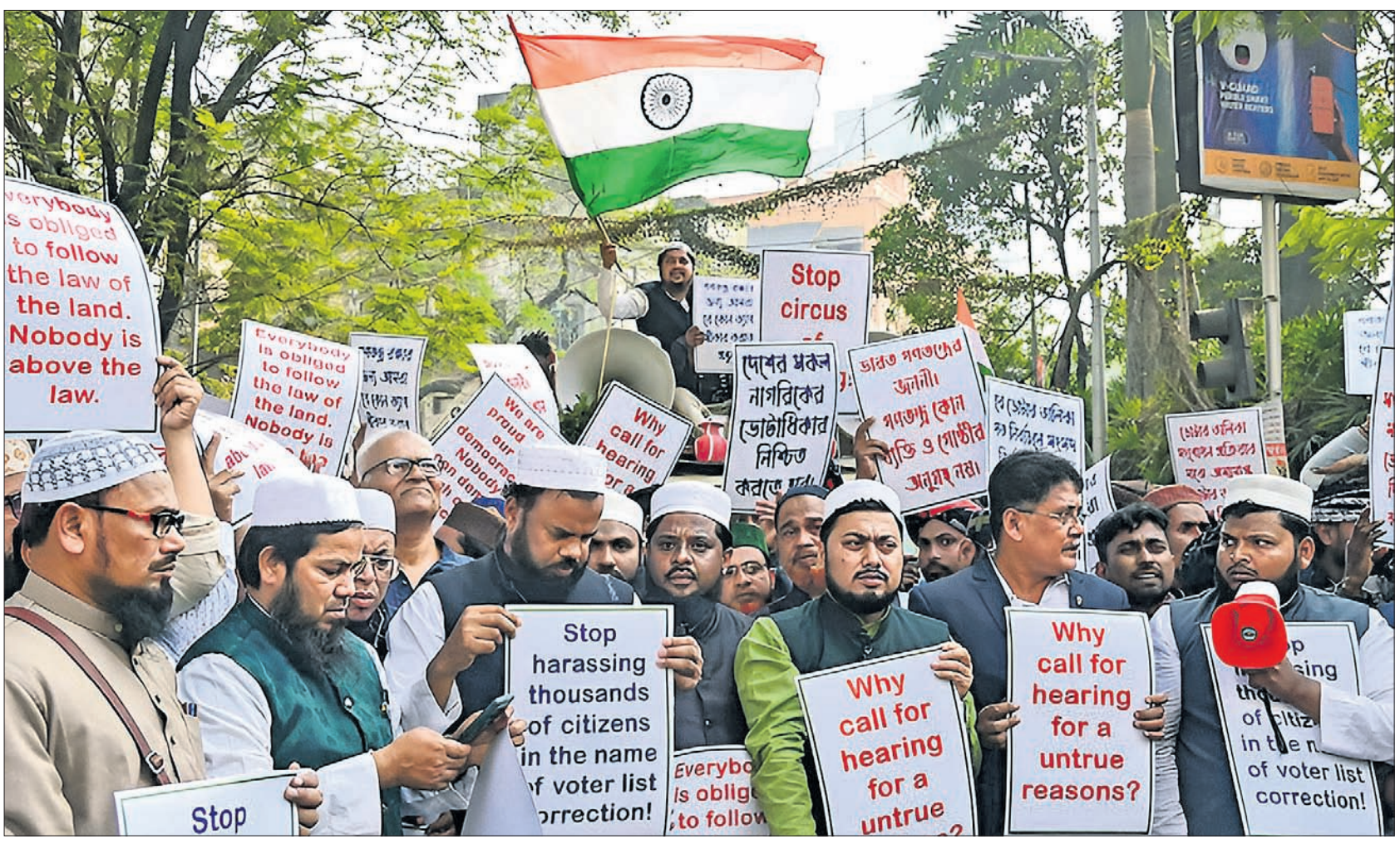
ପଶ୍ଚିମବଙ୍ଗରେ ଭୋଟର ତାଲିକାର ସ୍ୱତନ୍ତ୍ର ସଂଗୋଧନ (ଏସ୍.ଆଇ.ଆର୍.)କୁ ବିରୋଧ କରି ଯୋମାତାର କୋଲକାତାରେ ମୁସଲମାନ ସମ୍ପ୍ରଦାୟର ସଦସ୍ୟମାନେ ବିରୋଧରେ ସାମିଲ ହୋଇଛନ୍ତି।