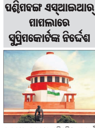
ସୁପ୍ରିମକୋର୍ଟଙ୍କ ନିର୍ଦ୍ଦେଶ ପ୍ରତି ପଞ୍ଚାୟତ କିମ୍ବା ବ୍ଲକ ଅଫିସରେ ପତ୍ନୀଙ୍କ ଓ ଆପଣ ଦାଖଲ ପାଇଁ ଅଫିସ ଖୋଲିବାକୁ ସର୍ବୋଚ୍ଚ ଅଦାଲତ କହିଛନ୍ତି। ଏଥିପାଇଁ ପଞ୍ଚାୟତ ଭବନ ଓ ବ୍ଲକ ଅଫିସ ପାଇଁ ରାଜ୍ୟ ସରକାର ପର୍ଯ୍ୟାୟ ଲୋକ ନିୟୋଜିତ କରିବେ। ରାଜ୍ୟରେ ଯେପରି ଆଇନ ଶୁଖିଲା ସମସ୍ୟା ସୃଷ୍ଟି ନ ହୁଏ ଏବଂ ସବୁ କାର୍ଯ୍ୟ ସୁଚ୍ଚରୂପେ ସମ୍ପନ୍ନ ହୁଏ, ତାହା ସୁନିଶ୍ଚିତ କରିବାକୁ ଅଦାଲତ ପଶ୍ଚିମବଙ୍ଗ ପୋଲିସ ମହାନିର୍ଦ୍ଦେଶକଙ୍କୁ ନିର୍ଦ୍ଦେଶ ଦେଇଛନ୍ତି।