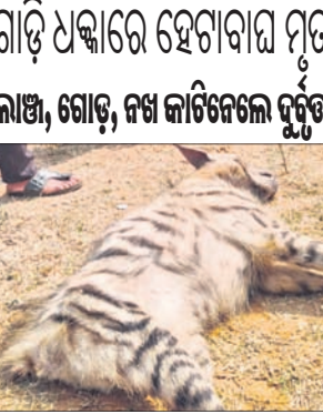
ଗାଡ଼ି ଧକ୍କାରେ ହେବାପାଇଁ ମୃତ ଲାଖି, ଗୋଡ଼, ନଖ କାଟିନେଲେ ଦୁର୍ଘଟ

କାଳିମେଳା, ୧୯।୧(କାବନ କୃଷ୍ଣ ଦାସ) ମାଳକାନଦିର କିଛି କାଳିମେଳା ରୋଷି ଅଧୀନ ଥିବା କାଳିମେଳା-ମୋଡୁ ୩୨୬ ନମ୍ବର ଜାତୀୟ ରାଜପଥର ଏଫ୍‌ଇ ୭୨ ନିକଟସ୍ଥ ଶାନ୍ତିନଗରଠାରେ ଯୋଗାଯୋଗ ଭେଦ ସମୟରେ ଗୋଟିଏ ହେଡ଼ିଂବାୟର ମୃତଦେହ ଜବତ କରାଯାଇଛି। ଏକ ବଡ଼ ଗାଡ଼ି ଧକ୍କାରେ ହେବାପାଇଁ ମୃତ୍ୟୁ ହୋଇଥିବା ଜଣାପଡ଼ିଛି।