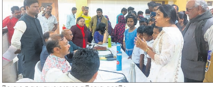
ଜିଲ୍ଲାପାଳ ଓ ଅନ୍ୟ ଅଧିକାରୀମାନେ ଅଭିଯୋଗ ଶୁଣୁଛନ୍ତି।

ରାଜକନିକା ବ୍ଲକ୍ ସମ୍ପର୍କରେ କକ୍ଷରେ ଯୋଗଦାନ କେନ୍ଦ୍ରାପଡ଼ା ଜିଲ୍ଲାପାଳ ଓ ଆରକ୍ଷା ଅଧିକାରୀଙ୍କ ମିଳିତ ଜନଶୁଣାଣି ଚଳିତ ଅନୁଷ୍ଠିତ ହୋଇଯାଇଛି। ଏଥିରେ ୧୮୪ ଅଭିଯୋଗ ଗ୍ରହଣ କରାଯାଇଥିଲା।