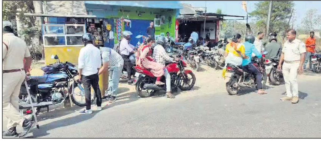
ପୋଲିସ୍ ଉପସ୍ଥିତିରେ ଦୁଇଚକିଆ ଗାଡ଼ିରେ ରିମ୍ପୋଟ୍ଟର ଷ୍ଟିକର ଲଗାଯାଉଛି ।