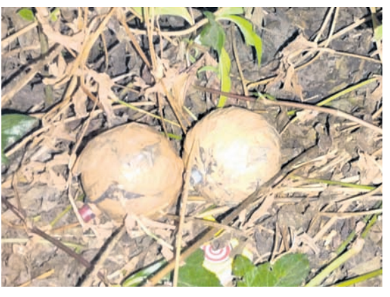
ବାଳକିରୁ ବାହାର କରି ରଖାଯାଇଥିବା ବୋମା।

ଦିଗପହଣ୍ଡି, ୨୦୧୧ (ଅଶୋକ ନାଥ ମିଶ୍ର) ଗଞ୍ଜାମ ଜିଲ୍ଲା ଦିଗପହଣ୍ଡି ବ୍ଲକ୍ ବୋମକେଇ ପଞ୍ଚାୟତ କୁମାରତା ଗ୍ରାମ ବଡ଼ବନ୍ଧ ପୋଖରୀ ନିକଟସ୍ଥ ରଘୁ ପ୍ରଧାନଙ୍କ ଘର ବାରିପତ ଚାଷଜମିରୁ ମଙ୍ଗଳବାର ସକାଳେ କେତୋଟି ହାତବୋମା ମିଳିଛି। ଖବର ପ୍ରଚାର ହେବା ପରେ ଗ୍ରାମରେ ଭୟର ବାତାବରଣ ଖେଳିଯାଇଛି। ପୋଲିସ୍ ପହଞ୍ଚି ସବୁ ବୋମା ଜବତ କରି ତଦନ୍ତ କାରି ରଖିଛି। ସକାଳେ ଗ୍ରାମରେ କେତେ ଜଣ ବ୍ୟକ୍ତି ସେହିଚାଷଜମି ଦେଇ ଯାଉଥିବା ବେଳେ ଏକ ଦୁର୍ଘଟ ବାଳକିରେ ଚାଷଜମିରେ କିଛି ରଖାଯାଇଥିବା ଦେଖିଥିଲେ। ପାଖକୁ ଯାଇ ଦେଖିବାକୁ ବାଳକି ଭିତରେ ବୋମା ଥିଲା। ବୋମା ଥିବା ଦେଖି ସେମାନେ କେ. ନୂଆଗାଁ ଥାନାକୁ ଜଣାଇଥିଲେ। ପୋଲିସ୍ ଟିମ୍ ଘଟଣାସ୍ଥଳରେ ପହଞ୍ଚି ତଦନ୍ତ କରିବା ସହ ବୋମାଗୁଡ଼ିକୁ ଜବତ କରିଥିଲା। ଚାଷଜମିରେ ବୋମା କିଏ ରଖିଥିଲେ ତାଙ୍କ ଉଦ୍ଦେଶ୍ୟ କ'ଣ ହୋଇପାରେ ସେ ନେଇ ପୋଲିସ୍ ତଦନ୍ତ କାରି ରଖିଛି। ଆଇଆଇସି କିଶୋର ସାମଲଙ୍କ ଏତଲାକ୍ରମେ ନଂ.୨୪/୨୬ରେ ଏକ ମାମଲା ରୁଜୁ ହୋଇଛି। କିଛିଦିନ ହେଲା ଗ୍ରାମ