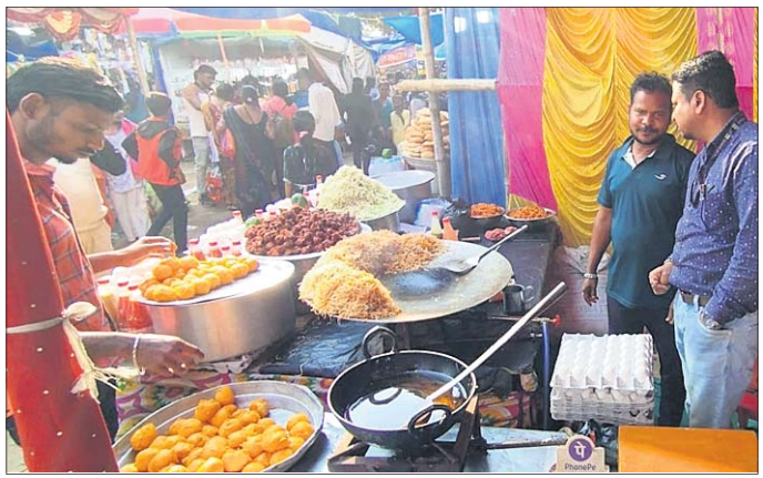
ଜିଲ୍ଲା ଖାଦ୍ୟ ସୁରକ୍ଷା ଅଧିକାରୀ ଖାଦ୍ୟର ମାନ ଯାଞ୍ଚ କରୁଛନ୍ତି ।

ଯାଜପୁର ଜିଲ୍ଲାରେ ବେଶ ଧୂମଧାମରେ ଚାଲିଛି ବରୁଣେଶ୍ୱର ମେଳା ଏବଂ ଓଳାଶୁଣୀ ମେଳା । ଏହି ମେଳାରେ ବହୁ ଶ୍ରଦ୍ଧାଳୁଙ୍କ ଆଗମନ ହେଉଛି । ଖାଦ୍ୟ ଖୁଲଗୁଡ଼ିକରେ ଭିତ୍ତି ଜମୁଛି । ତେଣୁ ଯାଜପୁର ଜିଲ୍ଲା ପ୍ରଶାସନ ପକ୍ଷରୁ ମେଳାରେ ବିକ୍ରି ହେଉଥିବା ଖାଦ୍ୟର ଗୁଣବତ୍ତା ଓ ସ୍ୱଚ୍ଛତା ଯାଞ୍ଚ କରାଯାଇଛି । ଯାଜପୁର ଖାଦ୍ୟ ସୁରକ୍ଷା ଅଧିକାରୀଙ୍କ ପକ୍ଷରୁ ତିନି ଦିନ ୧୭, ୧୮ ଓ ୨୦ ତାରିଖରେ ବରୁଣେଶ୍ୱର ମେଳାର ବିଭିନ୍ନ ଖାଦ୍ୟ, ପାଖୁପୁଡ଼ ଖୁଲଗୁଡ଼ିକରେ ଯାଞ୍ଚ କରାଯାଇଛି । ମେଳାରେ ବିକ୍ରି ହେଉଥିବା ପ୍ରାୟ ୧୭ କିଲୋ ବାସାଖାଦ୍ୟକୁ ନଷ୍ଟ କରାଯାଇଛି । ସେହିପରି ଓଳାଶୁଣୀ ମେଳାରେ ମଧ୍ୟ ସାମଗ୍ରୀର ଖାଦ୍ୟର