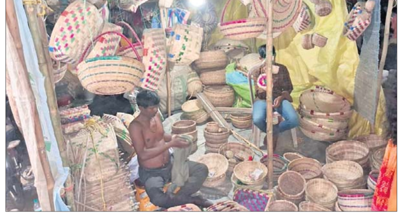
ମେଳାରେ ବିକ୍ରି ହେଉଥିବା ହାତଟିଆର ଘର କରଣା ସାମଗ୍ରୀ ।