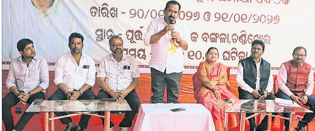
ସମୀକ୍ଷା ବୈଠକରେ ବିଧାୟକ ଓ ଅନ୍ୟମାନେ ।