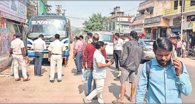
ରାସ୍ତାରେ ଥିବା ଯାନବାହନ ହଟାଯାଇଛି ।