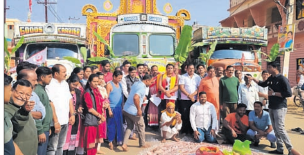
ରଥକାଠ ପୂଜାର୍ଚ୍ଚନା କରାଯାଇଛି।