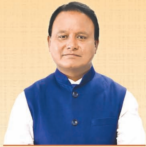
ଶ୍ରୀ ମୋହନ ଚରଣ ମାଝୀ ମୁଖ୍ୟମନ୍ତ୍ରୀ, ଓଡ଼ିଶା