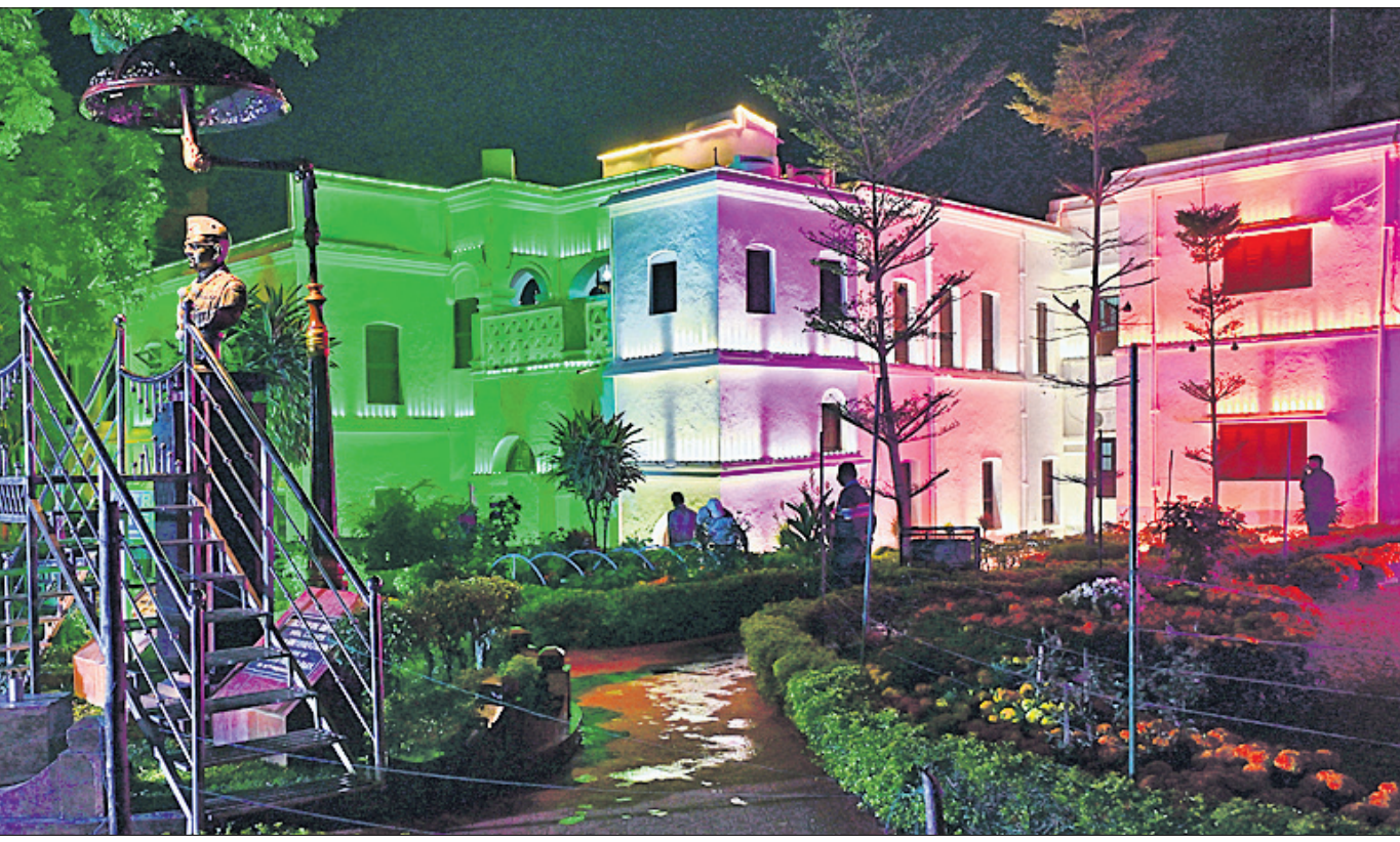
ନେତାଜୀ ଜୟନ୍ତୀ ପୂର୍ବରୁ ମଙ୍ଗଳବାର କଟକ ଓଡ଼ିଆ ବଜାରସ୍ଥିତ ନେତାଜୀ ଜନ୍ମସ୍ଥାନ ସଂଗ୍ରହାଳୟକୁ ଆଲୋକମାଳାରେ ସଜ୍ଜିତ କରାଯାଇଛି।

ବିକଶିତ ଗ୍ରାମସଞ୍ଚାଳିତରୁ ବିକଶିତ ଭାରତ ଅଭିପ୍ରାଣେ