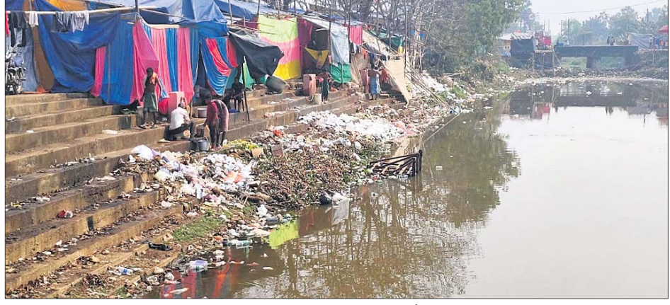
କୁଶଭଦ୍ରା ନଦୀରେ ପଡ଼ିଥିବା ଅଳିଆ ଆବର୍ଜନା ।