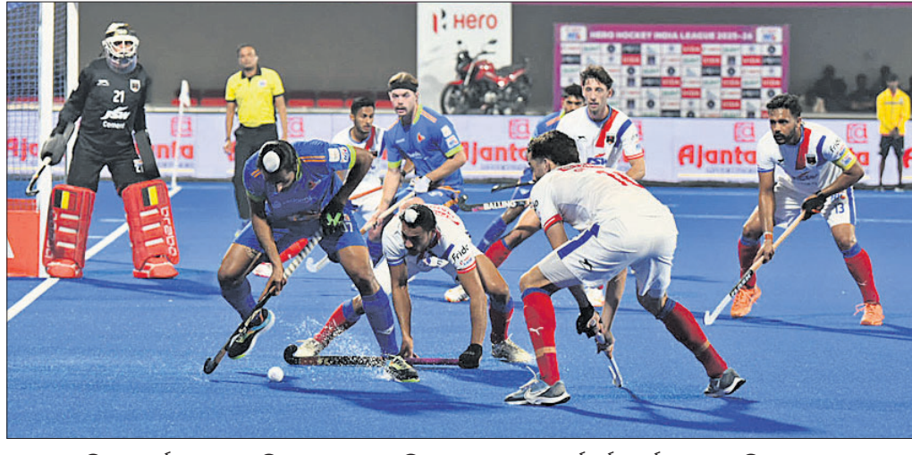
କଳିଙ୍ଗ ଲାନ୍ସ୍ ଓ ପୁରୁମା ହକି କ୍ଲବ୍ ମଧ୍ୟରେ ଅନୁଷ୍ଠିତ ମ୍ୟାଚର ଏକ ସଂଘର୍ଷପୂର୍ଣ୍ଣ ପୂର୍ଣ୍ଣ।

ଭୁବନେଶ୍ୱର, ୨୦୧୧ (ତପନ ସ୍ୱାଇଁ) ଚଳିତ ହକି ଇଣ୍ଡିଆ ଲିଗ୍ (ଏରଥାଇଏଲ୍)ରେ ବେଦାନ୍ତ କଳିଙ୍ଗ ଲାନ୍ସ୍ ମଙ୍ଗଳବାର ପ୍ରଥମ ପରାଜୟ ବରଣ କରିଛି। କ୍ରମାଗତ ୬ ମ୍ୟାଚରେ ବିଜୟଲାଭ କରିବାପରେ ଲାନ୍ସ୍ କଳିଙ୍ଗ ଷ୍ଟାଡ଼ିୟମରେ ଅନୁଷ୍ଠିତ ମ୍ୟାଚରେ ଲେଏସ୍‌ସ୍‌ସ୍ ପୁରୁମା ହକି କ୍ଲବ୍ ନିକଟରୁ ୧-୨ ଗୋଲରେ ପରାଜିତ ହୋଇଛି। ତେବେ ଏହି ପରାଜୟ ସତ୍ତ୍ୱେ ଲାନ୍ସ୍ କ୍ୱାଲିଫାୟର୍ସ-୧ ଖେଳିବା ନିଶ୍ଚିତ ହୋଇଛି। ୬ ମ୍ୟାଚରୁ ୪ ବିଜୟ, ୨ ଶୁଭ୍ ଆଉଟ ବିଜୟ ଓ ୧ ପରାଜୟ ସହ ଏହି ଦଳ ଲିଗ୍ ପର୍ଯ୍ୟାୟ ଶେଷ କରିଛି। ୧୬ ପଏଣ୍ଟ ସହିତ ଚେରୁଲର ଶୀର୍ଷସ୍ଥାନରେ ରହିଥିବାକୁ ବିତୀୟ ସ୍ଥାନ ହାସଲ କରିବା ଦଳକୁ କ୍ୱାଲିଫାୟର୍ସ-୧ରେ ଭେଟିବା ଅନ୍ୟପକ୍ଷରେ ପୁରୁମା ଦଳ ୬ ମ୍ୟାଚରୁ ୨ୟ ବିଜୟ ସହ ନକ୍ୱାଆଉଟ ପ୍ରବେଶ ଆଶା ରଖାଯିବ ବୋଲି। ଏହି ଦଳ ୮ ପଏଣ୍ଟ ସହିତ ୬ଷ୍ଠ ସ୍ଥାନକୁ ଉନ୍ନତ ହୋଇଛି। ତେବେ ଗୋଲ ବ୍ୟବଧାନ -୩ ଥିବାରୁ ଦଳକୁ ନକ୍ୱାଆଉଟ ପ୍ରବେଶ