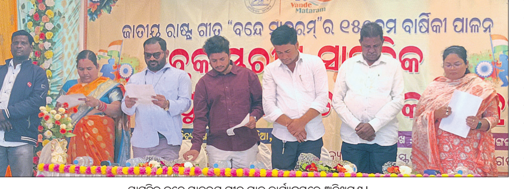
ସାମୂହିକ ବନ୍ଦେ ମାତରମ୍ ଗୀତ ଗାନ କାର୍ଯ୍ୟକ୍ରମରେ ଅତିଥିଗଣ।