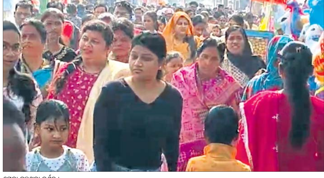
ମେଳା ସୁଲୁଥିବା ଦର୍ଶକ ।

ବରୁଣେଶ୍ୱର ମେଳା ମଙ୍ଗଳବାର ସପ୍ତମ ଦିବସରେ ପହଞ୍ଚିଛି । ମେଳା ସରିବାକୁ ଆଉ ୨ଦିନ ଥିବାବେଳେ ଦର୍ଶକଙ୍କ ଉତ୍ସାହ କମିବା ପରିବର୍ତ୍ତେ ବଢ଼ିବାରେ ଲାଗିଛି । ଦର୍ଶକଙ୍କ ସମାଗମରେ ଦୁଇକୋଟି ମେଳା ପଡ଼ିଆ, ଆଶାନ୍ୱରପଲ୍ଲୀ ଭିତ୍ତି ଯୋଗୁଁ ବ୍ୟବସାୟ ଜମୁଛି । ଲୋକନୈମିତ୍ତ ପସରଣ ଘରକରଣା ଉପକରଣ କିଣୁଥିବା ଦେଖାଯାଇଛି । ଘର କରଣା ସାମଗ୍ରୀ ପାଇଁ ବୁଝିଣାକ ଭିତ୍ତି ମେଳାରେ ମହିଳାଙ୍କ ସଂଖ୍ୟା ଅଧିକ । ବିଶେଷକରି ଘରକରଣା ସାମଗ୍ରୀ ବିକ୍ରି ଖୁଲଗୁଡ଼ିକରେ ଗୁଣିଣାକ ଭିତ୍ତି ଦେଖିବାକୁ ମିଳୁଛି । ଖରୁଳି, ପିଢ଼ା, ବେଲଣା ଚକି, କାଠି, ଚୁଟି ସେକା, ପନକି, କଟା, ବାଆ ଆଦି ମହିଳାମାନେ କିଣି ନେଉଛନ୍ତି । ସୁବତୀମାନେ ପ୍ରସାଧନ ସାମଗ୍ରୀ ଖୁଲରେ ଭିତ୍ତି ଲଗାଇବା ସହ ଗୁପହୁପ, ଚାଟ, ଆଇସ୍‌କ୍ରିମ ମଜା ନେଉଛନ୍ତି । ବର୍ଷବସ୍ତୁ ପାଇଁ ପ୍ରସ୍ତୁତ ହେଲା କୁଶଭଦ୍ରା