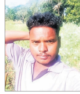
ନନ୍ଦପୁର ରୁକ୍ମିଣୀ ପ୍ରସାନ୍ନପୁର ଥାନା ଅଧୀନ ବାଡ଼େଲ ପଞ୍ଚାୟତର ଖରଳାପୁଟ ଗ୍ରାମରେ ଶନିବାର ଦେଶୀ ବନ୍ଧୁକରୁ ଗୁଳିଫୁଟି ଜଣେ ଯୁବକ ଗୁରୁତର ହୋଇଛନ୍ତି।

ନନ୍ଦପୁର ରୁକ୍ମିଣୀ ପ୍ରସାନ୍ନପୁର ଥାନା ଅଧୀନ ବାଡ଼େଲ ପଞ୍ଚାୟତର ଖରଳାପୁଟ ଗ୍ରାମରେ ଶନିବାର ଦେଶୀ ବନ୍ଧୁକରୁ ଗୁଳିଫୁଟି ଜଣେ ଯୁବକ ଗୁରୁତର ହୋଇଛନ୍ତି। ସେ ହେଲେ ଲାଲବାନ ଖରା