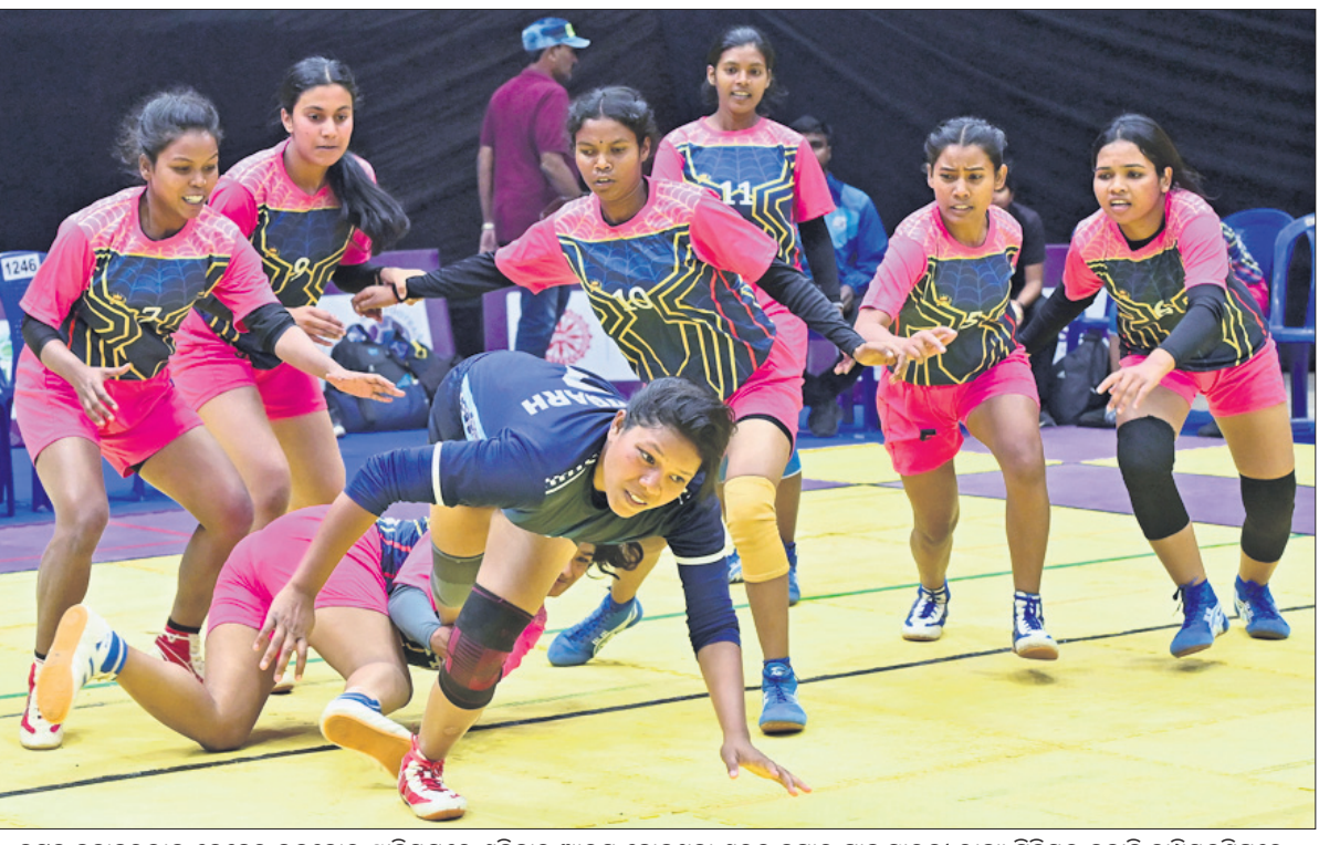
କଟକ ଜବାହରଲାଲ ନେହେରୁ ଇନ୍‌ଡୋର ଷ୍ଟାଡ଼ିୟମରେ ଶନିବାର ଆରମ୍ଭ ହୋଇଥିବା ଶରତ କ୍ରମାର ସାହୁ ସ୍ମାରକୀ ରାଜ୍ୟ ସିନିୟର କବାଡ଼ି ଚାମ୍ପିୟନଶିପରେ ବରଗଡ଼ ଓ ବଲାଙ୍ଗୀର ମଧ୍ୟରେ ଅନୁଷ୍ଠିତ ମହତ୍ତ୍ୱ ବିଭାଗ ମ୍ୟାଚ୍ ।