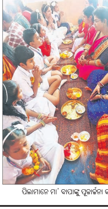
ପିଲାମାନେ ମା' ବାପାଙ୍କୁ ପୂଜାର୍ଚ୍ଚନା କରୁଛନ୍ତି।

ନଗରରେ ମାତୃ ପିତୃ ପୂଜନ ଦିବସ ଶନିବାର ପାଳିତ ହୋଇଯାଇଛି। ଯୋଗ