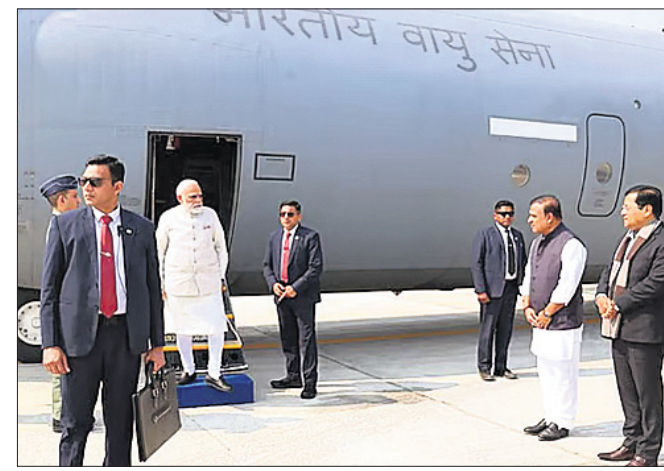
ମୋରାନସ୍ଥିତ ଜରୁରୀ ଅବତରଣ ସ୍ଥଳରେ ପ୍ରଧାନମନ୍ତ୍ରୀ ନରେନ୍ଦ୍ର ମୋଦି ବାୟୁସେନା ବିମାନରୁ ଓହ୍ଲାଇଛନ୍ତି।