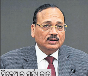
ସିଜେଆଇ ପୂର୍ଣ୍ଣ କାନ୍ତ

ନ୍ୟାୟପ୍ରାପ୍ତି କେବଳ ଆଇନଗତ ଭାବେ ସଶକ୍ତ ଲୋକଙ୍କ ପାଇଁ ସୀମିତ ଥିବା ଏକ ଅବ୍ୟବହାରୀୟ ଆବଶ୍ୟକ ହୋଇ ରହିପାରିବ ନାହିଁ। ଏହା ଅବହେଳିତ ନାଗରିକମାନଙ୍କ ପାଇଁ ବାସ୍ତବ ପରିଣତରେ ପରିବର୍ତ୍ତନ ହେବା ଜରୁରୀ ବୋଲି ଭାରତର ପ୍ରଧାନ ବିଚାରପତି (ସିଜେଆଇ) ପୂର୍ଣ୍ଣ କାନ୍ତ ଶନିବାର କହିଛନ୍ତି। ରାଜ୍ୟଗୋଷ୍ଠୀ ନ୍ୟାୟିକ ପ୍ରଶିକ୍ଷକ(ସିଜେଆଇ)ମାନଙ୍କ ୧୧୧ତମ ଦ୍ୱିବାର୍ଷିକ ବୈଠକରେ ସିଜେଆଇ କହିଛନ୍ତି, ନ୍ୟାୟିକ ନେତୃତ୍ୱ କଦାପି ପ୍ରଶାସନିକ କର୍ତ୍ତୃପକ୍ଷ କିମ୍ବା ଆନୁଷ୍ଠାନିକ ପଦାବୁଜ୍ଜ୍ୱଳ ସୂତ୍ରରେ ପରିବର୍ତ୍ତନ କରିବ ନାହିଁ ବୋଲି ଇଚ୍ଛା କରିବା ପରେ ଆମେରିକା ମୁକ୍ତ ପାଇଁ ନିଷ୍ଠିର ନେଇଥିବା କୁହାଯାଇଛି।