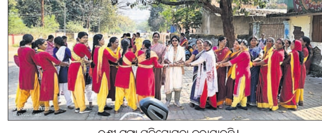
ରଣା ଟଙ୍କା ପ୍ରତିଯୋଗିତା କରାଯାଇଛି।