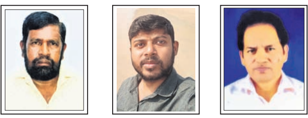
ଶେଖ୍ ଯାହୁର୍ ଗୋପ, ନିର୍ବକଳ୍ପ ନାଥ ଘଣ୍ଟେଶ୍ୱର, ସଚ୍ଚିଦାନନ୍ଦ ପରିଡ଼ା ଭୁବନେଶ୍ୱର

ସୂଚନା: ଆଗାମୀ ଆଶା ପୃଷ୍ଠାରେ ଦିଆଯାଉଥିବା ପ୍ରଶ୍ନର ଉତ୍ତର ସହ ନିଜ ନାମ, ଠିକଣା, ଫଟୋ ଏବଂ ମତାମତ ଲେଖି ପଠାନ୍ତୁ। ଇ-ମେଲ୍ ଠିକଣା: dharitriagamiasha@gmail.com