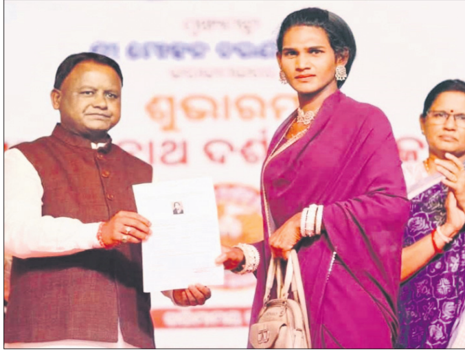
ମୁଖ୍ୟମନ୍ତ୍ରୀ ଜଣଙ୍କୁ କିନ୍ନର ପ୍ରମାଣପତ୍ର ଦେଉଛନ୍ତି।