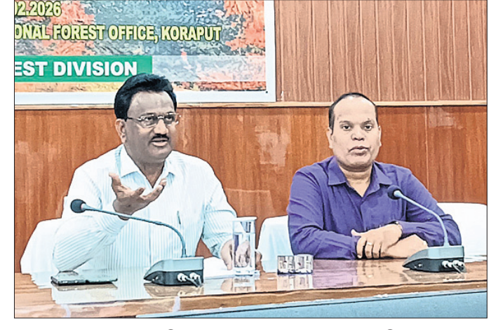
ଖବରଦାତା ସମ୍ମିଳନୀରେ ବନ ଅଧିକାରୀ ସୂଚନା ଦେଉଛନ୍ତି।

ବନାଗ୍ନିକୁ ସଫଳତାର ସହ ମୁକାବିଲା କରିବା ପାଇଁ କୋରାପୁଟ ବନଖଣ୍ଡ ପକ୍ଷରୁ ପ୍ରସ୍ତୁତ କୁହାନ୍ତ ପର୍ଯ୍ୟାୟରେ ପହଞ୍ଚିଛି। ଏଥି ନେଇ ଶନିବାର କୋରାପୁଟ ବନଖଣ୍ଡ ସଭାଗୃହଠାରେ ଏକ ଖବରଦାତା ସମ୍ମିଳନୀ ଅନୁଷ୍ଠିତ ହୋଇଯାଇଛି। ଗତ ୨ ବର୍ଷରେ କୋରାପୁଟ ବନଖଣ୍ଡ ଅଞ୍ଚଳରେ ୪୮୨୨ଟି ବନାଗ୍ନି ଘଟଣା ଘଟିଛି। ସେଥିମଧ୍ୟରୁ ୨୦୨୦-୨୧ ବର୍ଷରେ ୨୫୬୮ଟି ବନାଗ୍ନି ଘଟଣା ହୋଇଥିବାବେଳେ ଗତ ୨୦୨୧-୨୨ ରେ ୫୮୩ଟି, ୨୦୨୨-୨୩ ରେ ୫୩୩ଟି, ୨୦୨୩-୨୪ ରେ ୧୨୦୭ଟି, ୨୦୨୪-୨୫ ରେ ୧୨୩୭ଟି, ୨୦୨୫-୨୬ରେ ୧୦୦୭ଟି ବନାଗ୍ନି ଘଟଣା ଘଟିଥିବା କୋରାପୁଟ ବନଖଣ୍ଡ