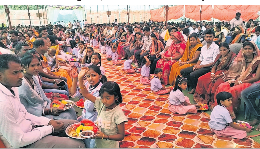
ସ୍କୁଲରେ ପିଲାମାନେ ନିଜ ନିଜ ମା' ବାପାଙ୍କୁ ପୂଜା କରୁଛନ୍ତି।