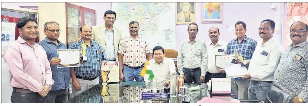
ବୈଠକରେ ଅତିଥି ଓ ସମ୍ମାନିତ ହୋଇଥିବା କର୍ମଚାରୀ।