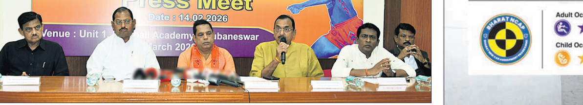
ଖବରଦାତା ସମ୍ମିଳନୀରେ ଆୟୋଜକଙ୍କ ପକ୍ଷରୁ ଚୂର୍ଣ୍ଣାମେଷ୍ଟ ସମ୍ପର୍କରେ ସୂଚନା ଦିଆଯାଇଛି ।