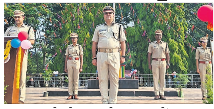
ଡିଆଇଜି ପରେତରେ ଅଭିବାଦନ ଗ୍ରହଣ କରୁଛନ୍ତି।