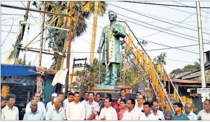
ବ୍ୟାସକବିଙ୍କ ପ୍ରତିମୂର୍ତ୍ତିରେ ମାଲ୍ୟାପର୍ଯ୍ୟଟନ ଅବସରରେ ଉପସ୍ଥିତ ଅତିଥି।

■ବରପୁତ୍ରଙ୍କ ପ୍ରତିମୂର୍ତ୍ତିରେ ମାଲ୍ୟାପର୍ଯ୍ୟଟନ ■ସୀମାନ୍ତରେ ହେବ ୫୦ଲକ୍ଷରୁ ଉର୍ଦ୍ଧ୍ୱ ଟଙ୍କାର ସ୍ୱାଗତତୋରଣ