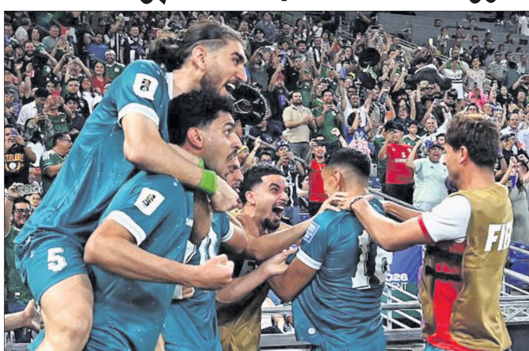
ବିଶ୍ୱକପ୍ ଯୋଗ୍ୟତାରେ ଉତ୍ତମ ଲାଭକାରୀ ଖେଳାଳି।

ମହେରି(ମେକ୍ସିକୋ), ୧୪(ଏପି) ଆସକା କ୍ଲବ୍-କ୍ଲୋଇରେ ହେବାକୁ ଥିବା ସର୍ବଶ୍ରେଷ୍ଠ ଫିଫା ବିଶ୍ୱକପ୍ ଲାଗି ଚାଲିଥିବା ଯୋଗ୍ୟତା ପର୍ଯ୍ୟାୟ ବୁଧବାର ଶେଷ ହୋଇଛି। ଅତ୍ୟଧିକ ବର୍ଷରୁ ଉର୍ଦ୍ଧ୍ୱ ସମୟ ଧରି ଚାଲିଥିବା ଯୋଗ୍ୟତା ପର୍ଯ୍ୟାୟରେ ଅତିମ ତଥା ୪୮ତମ ଦେଶ ଭାବେ ଇରାକ ଗ୍ଲାନ ପଦ୍ଧତି କରିଛି। ବୋସନିଆ, ଆଣ୍ଡ ହରଜେଗୋଜିନା ଯୁରୋପିଆନ୍ ଯୁଏୟୁରେ ୪ ଥର