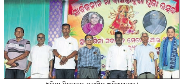
ଓଡ଼ିଶା ଦିବସରେ ଉପସ୍ଥାପନ କରାଯାଇଥିଲା।

ଧୁସୁରୀ, ୧୪ (ବାସ୍ତବିଧି ନାୟକ) ଉତ୍କଳ ଜିଲ୍ଲା ଧାମନଗର ଉପଖଣ୍ଡର ଧୁସୁରୀରେ ଓଡ଼ିଶା ଦିବସ ପାଳିତ ହୋଇଛି। ଅବସରରେ ଉପସ୍ଥାପନ କରାଯାଇଥିଲା।