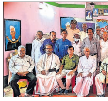
ଓଡ଼ିଶା ଦିବସ ପାଳନ ଅବସରରେ ମଞ୍ଚାଧୀନ ଅତିଥି ଓ ସଭ୍ୟଗଣ।