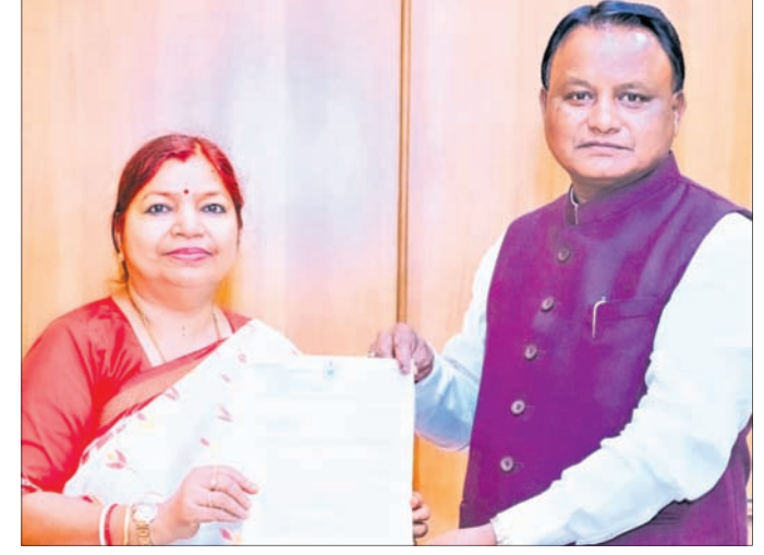
ମୁଖ୍ୟମନ୍ତ୍ରୀଙ୍କୁ ଦାବିପତ୍ର ଦେଉଛନ୍ତି ବିଧାୟିକା।

ବାଲେଶ୍ୱର, ୧୪(ବାସ୍ତାନିଧି ଦେ) ରୁକ୍ମିଣୀରେ ମହିଳାମାନଙ୍କ ଅଂଶଗ୍ରହଣ ଏବେ ବି ପଛରେ ରହିଛି। ବିଶେଷ କରି ଗ୍ରାମାଞ୍ଚଳ ଏବଂ ଅର୍ଥ ସହରାଞ୍ଚଳରେ ଏହା ସ୍ପଷ୍ଟ ଭାବି ହୋଇପଡ଼େ। ବର୍ତ୍ତମାନ ଚରଣ ମାଂସକୁ ସାକ୍ଷାତ୍ କରିଥିଲେ। ବସ୍ତା ନିର୍ବାଚନମଣ୍ଡଳୀରେ ଏକ ସରକାରୀ ମହିଳା ପଲିଟେକନିକ୍ ପ୍ରତିଷ୍ଠା କରିବା ପାଇଁ ସେ ମୁଖ୍ୟମନ୍ତ୍ରୀଙ୍କୁ ଦାବି କରାଯାଇଛନ୍ତି। ବସ୍ତା ନିର୍ବାଚନମଣ୍ଡଳୀରେ ବସ୍ତା ଓ ବାଲିଆପାଳ ବ୍ଲକ୍ ସମେତ ଉତ୍ତର ଅଧିକାଂଶ ପରିବାର କୃଷି, କ୍ଷୁଦ୍ର ବ୍ୟବସାୟ ଏବଂ ଅଣସଂଗଠିତ କ୍ଷେତ୍ରର ନିଯୁକ୍ତି ଉପରେ ନିର୍ଭର କରିଥାନ୍ତି। ରାଜ୍ୟ ସରକାରଙ୍କ ବିଭିନ୍ନ ଯୋଜନା ଯୋଗୁଁ ବିଦ୍ୟାଳୟଗୁଡ଼ିକର ନାମଲେଖା କ୍ଷେତ୍ରରେ ଉଲ୍ଲେଖନୀୟ ପ୍ରଗତି ହୋଇଥିଲେ ମଧ୍ୟ ଉକ୍ତ ଏବଂ ନିଯୁକ୍ତି ଶିକ୍ଷାକ୍ଷେତ୍ରରେ ଉତ୍ତର ଅଧିକାଂଶ ପ୍ରଗତି ହୋଇନାହିଁ ଏବଂ ବି ଯଥେଷ୍ଟ କର୍ମ ଯୋଗଦାନ ଏବେ ବି ଯଥେଷ୍ଟ କର୍ମ ରହିଛି। ରାଜ୍ୟଶିକ୍ଷା ଉପାଦାନ ଅନୁଯାୟୀ, ଓଡ଼ିଶାରେ ମହିଳା ସାକ୍ଷରତା ହାରରେ ସୁଧାର ଆସିଥିଲେ ହେଁ ତିସ୍ତାପୁରାୟ ବିଶେଷତା ମହିଳା କ୍ଷେତ୍ରରେ ପୁରୁଷଙ୍କ ତଳେ ଦାବିପତ୍ର ପ୍ରଦାନ କରିଛନ୍ତି।