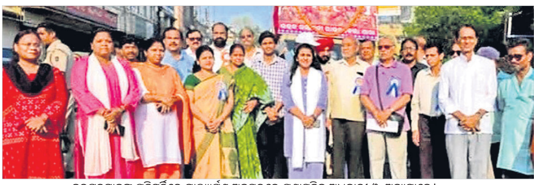
ବରପୁତ୍ରମାନଙ୍କ ପ୍ରତିମୂର୍ତ୍ତିରେ ମାଲ୍ୟାପର୍ଣା ଅବସରରେ ପ୍ରଶାସନିକ ଅଧିକାରୀ ଓ ଅନ୍ୟମାନେ।

ରାଉରକେଲା, ୧୪ (ବିପ୍ଳବ ରଞ୍ଜନ ଦାଶ) ସ୍ୱତନ୍ତ୍ର ଉତ୍କଳ ପ୍ରଦେଶ ଗଠନ ହେବାର ଆଜକୁ ୯୦ ବର୍ଷ ପୂରଣ ହେବା ସହିତ ପ୍ରଦେଶର ନାମ ପରିବର୍ତ୍ତନ ହୋଇ ଓଡ଼ିଶା ହୋଇଛି। ୧୯୩୬ ମସିହାରେ ସ୍ୱତନ୍ତ୍ର ଉତ୍କଳ ପ୍ରଦେଶ ଗଠିତ ହୋଇଥିଲା। ଓଡ଼ିଶା ୧୯୫୬ ମସିହାରେ ପୁନଃ ଗଠିତ ହୋଇଥିଲା। ଓଡ଼ିଶା ଦିବସ ପାଳନ କରୁଛି। ରୁଧିର ରାଉରକେଲା ପ୍ରଶାସନ ପକ୍ଷରୁ ଓଡ଼ିଶା ଦିବସ ପାଳିତ ହୋଇଯାଇଛି। ଏହି ଅବସରରେ ରାଉରକେଲା ଅତିରିକ୍ତ ଜିଲ୍ଲାପାଳ ତଥା ମହାନଗର ନିଗମ ଆୟୁକ୍ତ