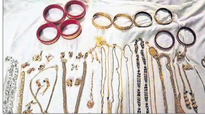
ଠାବ ହୋଇଥିବା ସୁନା ଅଳଙ୍କାର।