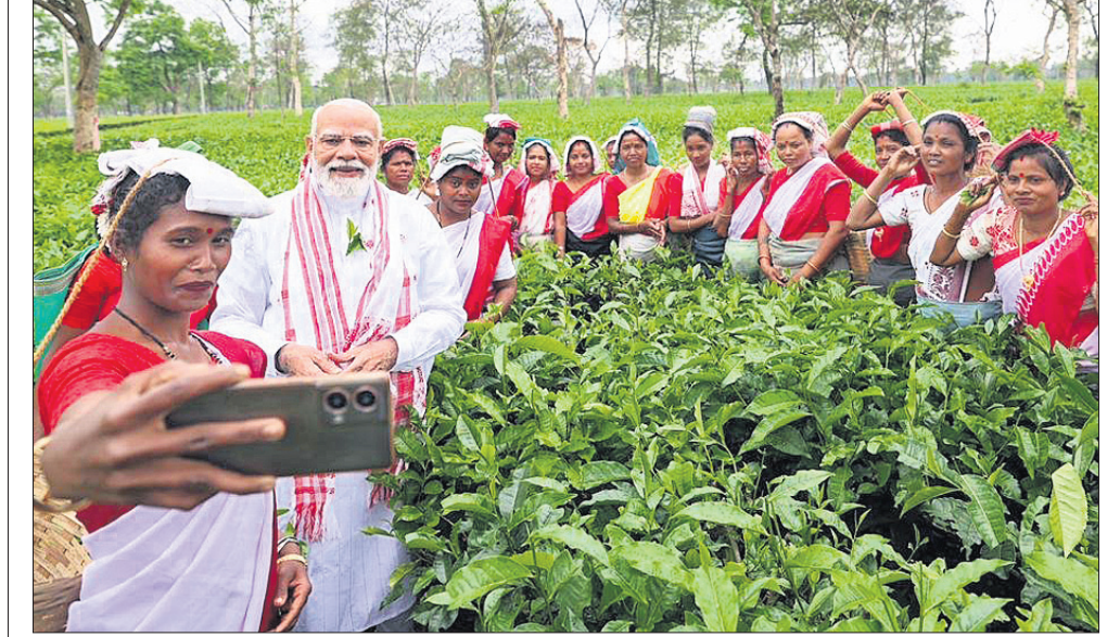
ଆସାମ ନିର୍ବାଚନ ପ୍ରଚାର ଗସ୍ତରେ ଯାଇଥିବା ପ୍ରଧାନମନ୍ତ୍ରୀ ନରେନ୍ଦ୍ର ମୋଦିଙ୍କ ସହ ବିହାରୀ ଉପାଧିକାରୀ ମହିଳା ଶ୍ରମିକମାନେ ସେଲ୍ଫି ନେଉଛନ୍ତି।

କ୍ଲିନିକ୍‌ରେ ସେକ୍ସିମେଣ୍ଟ ଅତି ସହଜରେ ବଜାରରେ ଉପଲବ୍ଧ ହେଉଛି, ଯାହାକି ଅତ୍ୟନ୍ତ ଚିକିତ୍ସାକରକ। ତାହାକି ବିନା ପରାମର୍ଶରେ ଲୋକେ ଏଭଳି ଡ୍ରଗ୍ସ୍