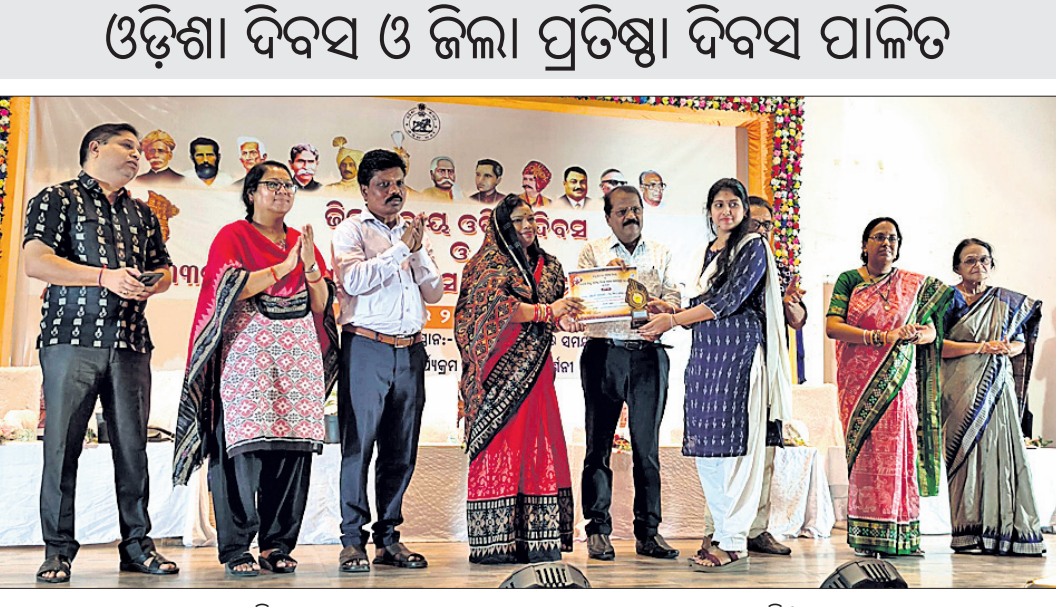
ଜିଲାପାଳ ଡ. ନୃପରାଜ ସାହୁ ଜଣେ କୃତୀ ଛାତ୍ରୀଙ୍କୁ ପୁରସ୍କୃତ କରୁଛନ୍ତି।