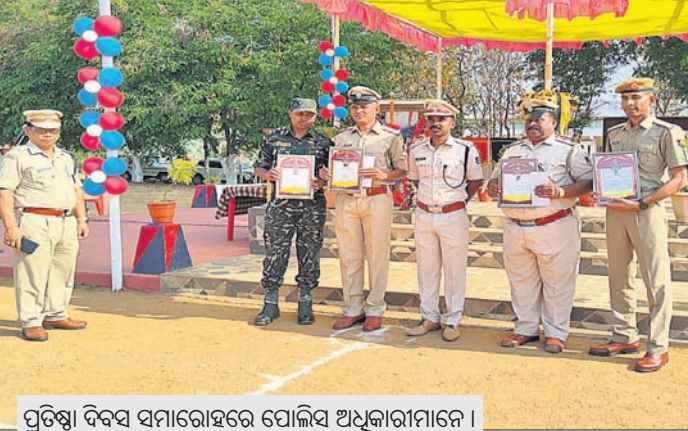
ପ୍ରତିଷ୍ଠା ଦିବସ ସମାରୋହରେ ପୋଲିସ୍ ଅଧିକାରୀମାନେ ।