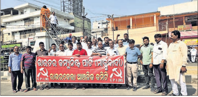
ସିପିଆଇଏମ୍ ପକ୍ଷରୁ ମଧୁବାବୁଙ୍କ ପ୍ରତିମୂର୍ତ୍ତିରେ ମାଲ୍ୟାପର୍ଣା କରାଯାଇଛି।