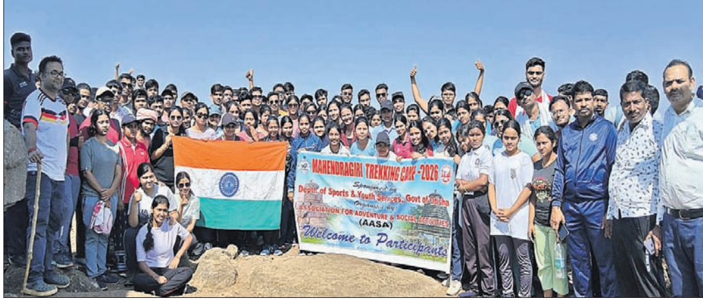
ଶିବିରରେ ସାମିଲ ଏନ୍‌ଏସ୍‌ଏସ୍ ସ୍ପେକ୍ଟାସେବା।