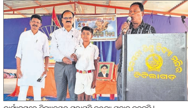
କାର୍ଯ୍ୟକ୍ରମରେ ବିଦ୍ୟାଳୟର ସଭାପତି ବକ୍ତବ୍ୟ ପ୍ରଦାନ କରୁଛନ୍ତି ।