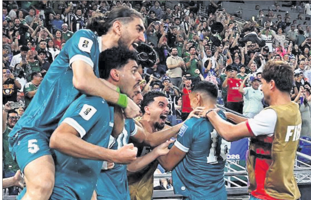
ବିଶ୍ୱକପ୍ ଯୋଗ୍ୟତାରେ ଉତ୍ସାହୀତ ଇରାକ ଖେଳାଳି ।

ଚାମ୍ପିୟନ ଇଟାଲୀକୁ ପେନାଲ୍ଟିରେ ପରାସ୍ତ କରିବା ପରେ ମହେରୀଠାରେ ଇଣ୍ଡୋନେସିଆକୁ ଦ୍ୱେଷ୍ଟରେ ଭାରତ ୨-୧ ଗୋଲରେ ବଳିଆକୁ ହରାଇ ୪୮ତମ ଗ୍ଲାନ ହାସଲ କରିଛି । ଯୋଗ୍ୟତା ପର୍ଯ୍ୟାୟର ଅତିନି ଦିନରେ ଯୁରୋପର ୮ ଦଳ ମଧ୍ୟରେ ପ୍ରକାଶ ହୋଇଥିଲା । କୋଚା ୧-୦ ଗୋଲରେ ଜାମାଇକାକୁ, ସ୍ୱିଡେନ୍ ୩-୨ ଗୋଲରେ ପୋଲାଣ୍ଡକୁ, ଚୁଚି ୧-୦ ଗୋଲରେ କୋସୋଭୋକୁ ଓ ଚେକ୍ ରିପବ୍ଲିକ୍ ପେନାଲ୍ଟି ଶୁଭାଭାବରେ ଡେନମାର୍କକୁ ପରାସ୍ତ କରି ବିଶ୍ୱକପ୍ ଗ୍ଲାନ ପକ୍ଷ କରିଛନ୍ତି । ମିଳିତ ଭାବେ ଆମେରିକା,