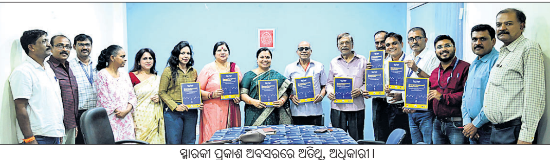
ସ୍ମାରକୀ ପ୍ରକାଶ ଅବସରରେ ଅତିଥି ଅଧିକାରୀ।