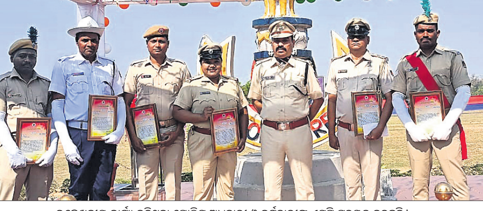
ଭଲଖେନାୟ କାର୍ଯ୍ୟ କରିଥିବା ପୋଲିସ ଅଧିକାରୀ ଓ କର୍ମଚାରୀଙ୍କୁ ଏଥିରେ ପୁରସ୍କୃତ କରୁଛନ୍ତି।