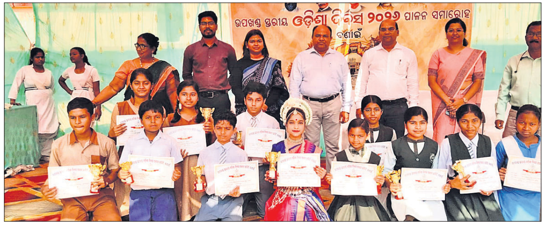
ବଣାଲରେ ଓଡ଼ିଶା ଦିବସ ପାଳନ ଅବସରରେ ଉପସ୍ଥିତ ଶିକ୍ଷୟିତ୍ରୀ ଶିକ୍ଷକ ଏବଂ ଛାତ୍ରାଛାତ୍ରୀ ।