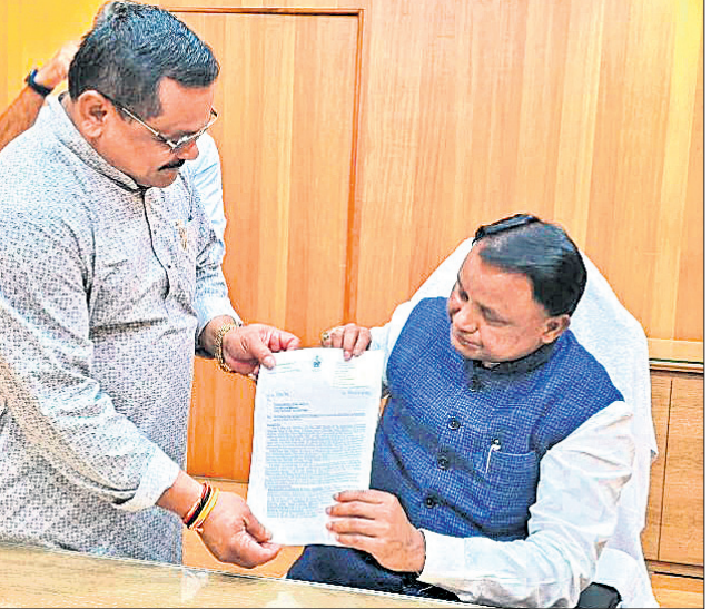
ପୁଖ୍ୟମନ୍ତ୍ରୀଙ୍କୁ କଣ୍ଠାବାଜି ବିଧାୟକ ଦାବିପତ୍ର ପ୍ରଦାନ କରୁଛନ୍ତି ।