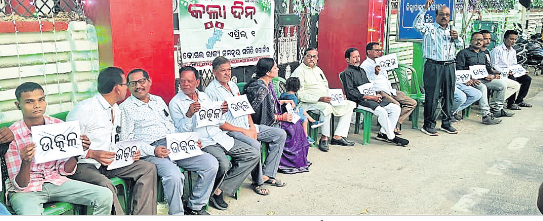
କୋଶଳପ୍ରେମୀମାନେ ବିକ୍ଷୋଭ ପ୍ରଦର୍ଶନ କରୁଛନ୍ତି ।