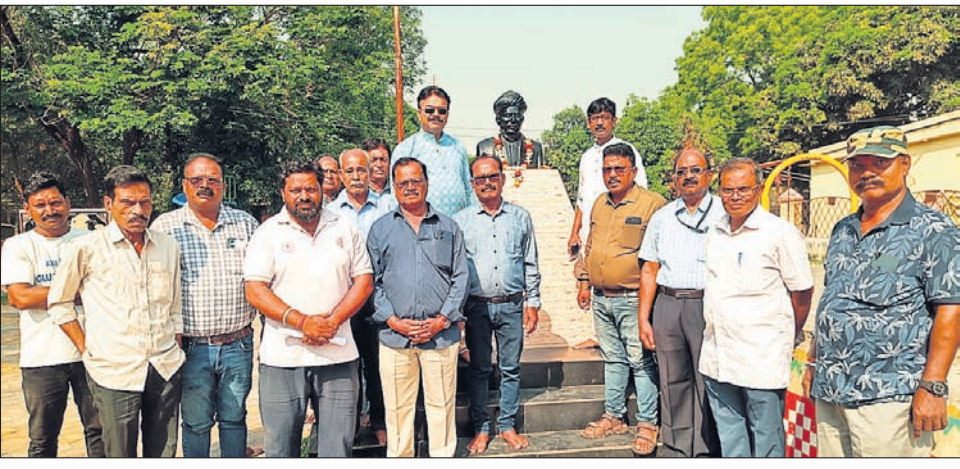
ବନ୍ଧୁପୁଣ୍ଡାରେ ଓଡ଼ିଶା ଦିବସ ପାଳନ ଅବସରରେ ଉପସ୍ଥିତ ଅଧିକାରୀ ।