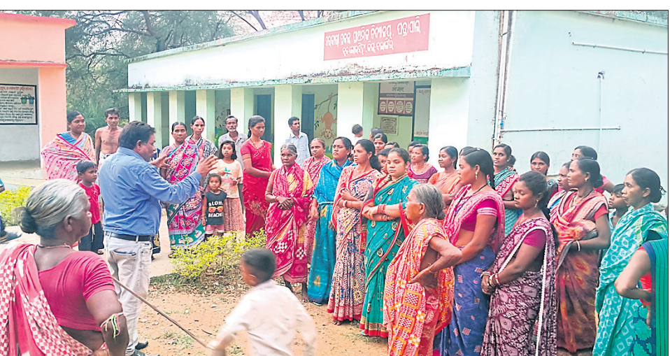
ଆଦିବାସୀ ନେତା ଗାଁ ସ୍କୁଲ ପରିଦର୍ଶନ କରିବା ସମୟରେ ମହିଳାମାନେ ।