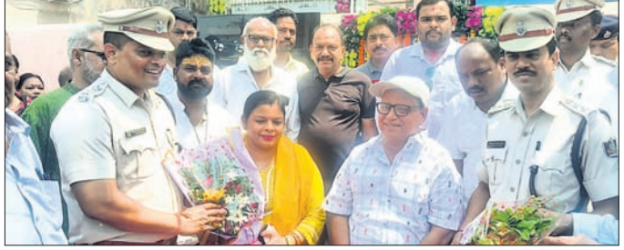
ଉଦ୍‌ଘାଟନା କାର୍ଯ୍ୟକ୍ରମରେ ଉପସ୍ଥିତ ଅତିଥି।

ଝାରସୁଗୁଡ଼ା ଜିଲ୍ଲା ବ୍ରଜରାଜନଗର ଥାନା ସମ୍ମୁଖରେ ରୁଧିରୀ ସ୍ଥାନୀୟ ପୋଲିସ୍ ପକ୍ଷରୁ ଶୀତଳ ଜଳ ଯୋଗାଣ କେନ୍ଦ୍ର ଉଦ୍‌ଘାଟିତ ହୋଇଯାଇଛି।