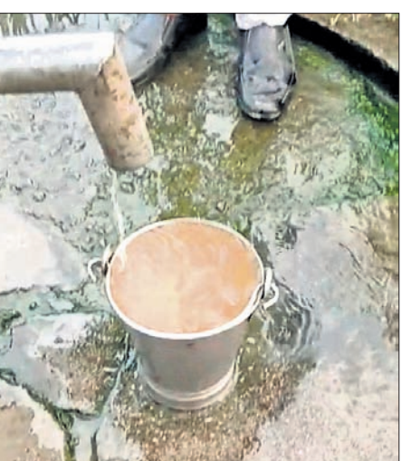
ନଳକୂପରୁ ବାହାରୁଥିବା କଳକି ଲଗା ଗୋଳିଆ ପାଣି ।

ଆକ୍ରାନ୍ତ ୪ ଜଣଙ୍କ ମୃତ୍ୟୁ ହୋଇଥିଲା । ଏତିକିରେ ଗ୍ରାମବାସୀଙ୍କ ରୁହଣ ସରିନାହିଁ । ଗ୍ରାମବାସୀ ବ୍ୟବହାର କରୁଥିବା ପୋଖରୀ ପାଣି ମଧ୍ୟ ଦୂଷିତ ହୋଇପଡ଼ିଛି । ବିକଳ ନ ଥିବାରୁ ବାଧ୍ୟ ହୋଇ ଗାଧୋଉଥିବା ଗ୍ରାମବାସୀ ଅଭିଯୋଗ କରିଛନ୍ତି । ଗାଁରେ ଏକ ପ୍ରାଥମିକ ବିଦ୍ୟାଳୟ ରହିଛି । ସ୍କୁଲ ପରିସରରେ ଥିବା ନଳକୂପରେ ଏକ ସଂସ୍ଥା ପକ୍ଷରୁ ପିଲଟର ଲଗାଯାଇଥିଲା । ସେହି ନଳକୂପ ଏବେ ଅଚଳ ହୋଇ ପଡ଼ିଛି । ସ୍କୁଲ ପଛପଟେ ପାଟେରି ନାହିଁ । ସ୍କୁଲକୁ ଲାଗି ପଡ଼ିବା