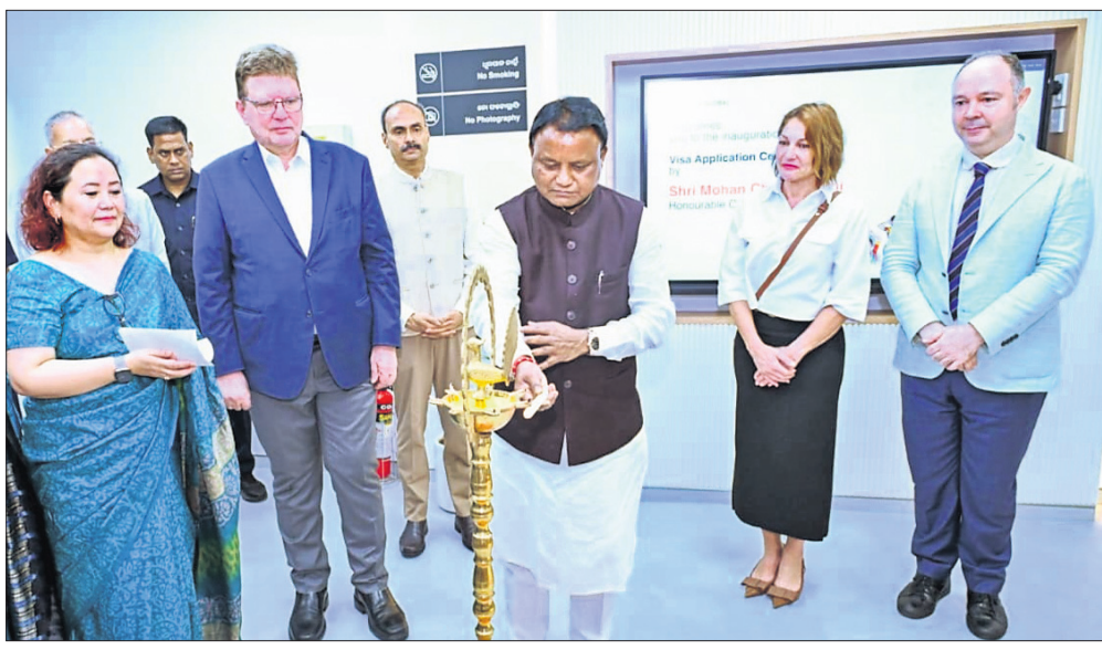
ଭୁବନେଶ୍ୱର ବରମୁଣ୍ଡା ବସଷ୍ଟାଣ୍ଡ (ବିଏସ୍‌ଏସ୍‌ଟି)ରେ ଭିଜା ଆବେଦନ କେନ୍ଦ୍ରକୁ ଉଦଘାଟନ କରୁଥିବା ମୁଖ୍ୟମନ୍ତ୍ରୀ ମୋହନ ଚରଣ ମାଝୀ।