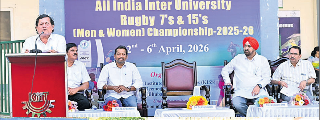
ଉଦ୍‌ଘାଟନା ଉତ୍ସବରେ ଉପସ୍ଥିତ ଅତିଥିବୃନ୍ଦ।