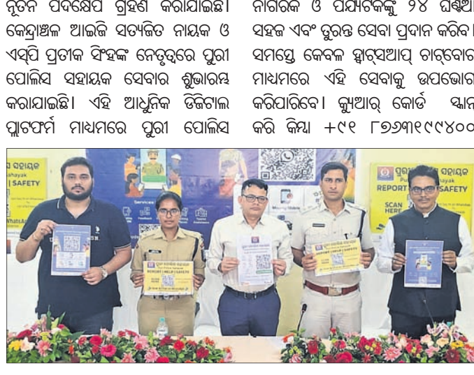
ପୋଲିସ ପକ୍ଷରୁ ସ୍ୱାସ୍ଥ୍ୟଆତ୍ମକ ଚାଟ୍‌ବୋଟ ଉଦ୍ଘାଟନ କରାଯାଇଛି ।

ନମ୍ବରକୁ ମେସେଜ ପଠାଇ ଏହି ସେବାରେ ସଂଯୁକ୍ତ ହୋଇପାରିବେ। ଏହି ସ୍ୱାସ୍ଥ୍ୟଆତ୍ମକ ଚାଟ୍‌ବୋଟ ମାଧ୍ୟମରେ ନିମ୍ନଲିଖିତ ସେବାଗୁଡ଼ିକ ଉପଲବ୍ଧ ହେବ ଯେପରିକି କ-ଜେନେରା ଦାଖଲ, ହରାଇଥିବା ମୋବାଇଲ ଫୋନ ସମ୍ପର୍କ ଅଭିଯୋଗ ପ୍ରତିକ୍ରିୟା ଦେବା, ନିକଟସ୍ଥ ପୋଲିସ ଷ୍ଟେସନ ଖୋଜିବା, ପାର୍କିଂ ସ୍ଥାନ ସମ୍ପର୍କ ସୂଚନା, ପର୍ଯ୍ୟଟକ ସହାୟତା ଏହି ପଦକ୍ଷେପ ଦ୍ୱାରା ପୁରୀ ପୋଲିସ ନାଗରିକଙ୍କ ସମସ୍ୟାର ସମାଧାନକୁ ଆହୁରି ଦ୍ରୁତ, ପ୍ରଭାବଶାଳୀ ଏବଂ ପାରଦର୍ଶୀ କରିବାକୁ ସମର୍ଥ ହେବ। ଏହି ପ୍ରକଳ୍ପ ସିଏଚ୍‌ଇ, ପୁରୀ ପୋଲିସ ସହାୟତା ଲୋକଙ୍କ ସେବା ଓ ସୁରକ୍ଷା ପାଇଁ ପ୍ରତିବଦ୍ଧ। ଏହି ସ୍ୱାସ୍ଥ୍ୟଆତ୍ମକ ଚାଟ୍‌ବୋଟ ସେବା ଆମ ସେବାକୁ ଆହୁରି ନିକଟରେ ନେଇଯିବ ଏବଂ ନାଗରିକମାନେ ଦ୍ରୁତ ସହାୟତା ପାଇପାରିବେ। ଏହି ପ୍ରକଳ୍ପଟି ପିଏନଟି ଓ ସମର୍ଥନ ଏବଂ ରେକର୍ଡିଂ ବିଷୟ ଦ୍ୱାରା ପ୍ରସ୍ତୁତିକରଣ ସହଯୋଗରେ ରୂପାୟନ କରାଯାଇଛି।