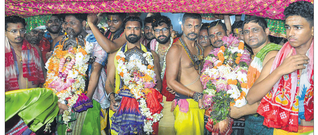
ପ୍ରଭୁ ଶ୍ରୀଲିଙ୍ଗରାଜଙ୍କ ସହ ତିନି ଠାକୁରଙ୍କୁ ମନ୍ଦିର ବିଜେ କରାଯାଇଛି।

ପୁରୁଣା ଭୁବନେଶ୍ୱର, ୧୪ (ସୁବାସ ଚନ୍ଦ୍ର ପ୍ରଧାନ) ଏକାମ୍ର କ୍ଷେତ୍ରର ଆରାଧ୍ୟ ଦେବ ପ୍ରଭୁ ଶ୍ରୀଲିଙ୍ଗରାଜଙ୍କ ରୁକ୍ମଣୀ ରଥଯାତ୍ରା ଶେଷ ହୋଇଛି। ରୁଧିର ଆରକ୍ଷା ମହାନିର୍ଦ୍ଦେଶକ ଯୋଗେଶ ବାହାଦୁର ଖୁରାନିଆ ପଦକ ପ୍ରଦାନ କରିଥିଲେ।