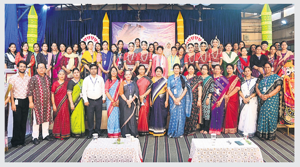
ଭୁବନେଶ୍ୱର ବିଜେକର୍ମ ସ୍ଥଳରେ ଓଡ଼ିଶା ଦିବସ ପାଳନ ଅବସରରେ ଅତିଥିକ ଗହଣରେ ସ୍ୱାଗତାପ୍ତ, ଶିକ୍ଷଣପ୍ରତି ଶିକ୍ଷକ ଓ ଅନ୍ୟମାନେ ।