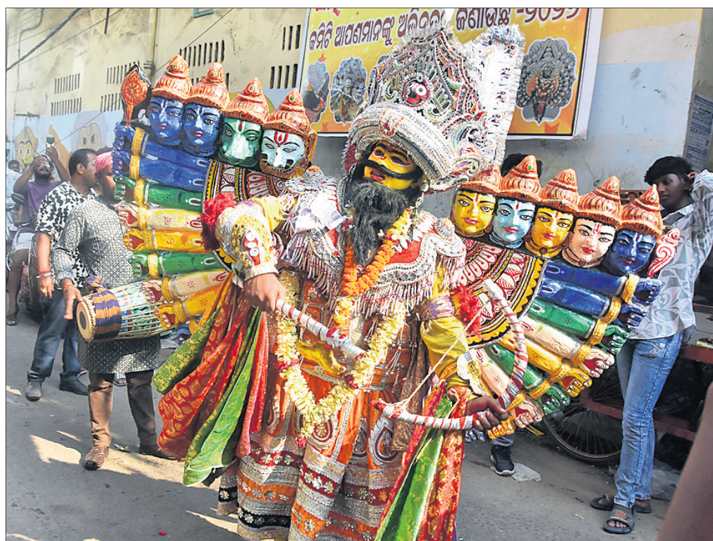
ପୁରୀ କୁଣ୍ଡେଇବେଣ୍ଟ ସାହି ପକ୍ଷରୁ ବାହାରିଥିବା ଦକ୍ଷିଣର ରାବଣ ନୃତ୍ୟ କରାଯାଇଛି ।

ସାହିଯାତ ନୀତି ନିମନ୍ତେ ଠାକୁର ପାଲିକିରେ ଶ୍ରୀଜଗନ୍ନାଥବଲଭକୁ ବିଜେ କରିଥିଲେ। ଠାକୁରମାନେ ଜଗନ୍ନାଥବଲଭ ପରିସରରେ ପହଞ୍ଚିବା ପରେ ଠାକୁରଙ୍କୁ ମଠର ଖଟଶେକ ଉପରକୁ ବିଜେ କରାଯାଇଥିଲା। ଅପରପକ୍ଷରେ ସାହିଯାତର ପଞ୍ଚମ ଦିବସରେ କୁଣ୍ଡେଇବେଣ୍ଟ ସାହି ପଥର ଆଖଡ଼ା ପକ୍ଷରୁ ମାୟା ମୃଗ, ସୀତା ଚୋରି ନୀତି ପ୍ରସ୍ତୁତ ଆଗତ କରାଯାଇଥିଲା। କୁଣ୍ଡେଇବେଣ୍ଟ ସାହି ପଥର ଆଖଡ଼ା ପକ୍ଷରୁ ଜଣେ ବ୍ୟକ୍ତି ମାୟା ରାବଣ ଚରିତ୍ରରେ ପରିଚିତ ହୋଇ ସାହି ଏବଂ ବାଦିସାହି ପରିକ୍ରମା କରି ଜଗନ୍ନାଥବଲଭ ପରିସରରେ ପହଞ୍ଚି ବିଭିନ୍ନ କଳାକୌଶଳ ଏବଂ ନୃତ୍ୟ ପ୍ରଦର୍ଶନ କରିଥିଲେ। ପରେ ସୀତାଚୋରି ନୀତି ସମ୍ପନ୍ନ ହୋଇଥିଲା। ସେହିପରି ସାହିଯାତର ୫ମ ଦିବସରେ କୁଣ୍ଡେଇବେଣ୍ଟ ସାହି ପକ୍ଷରୁ ଯାତ ବାହାରି ବାଦା ସାହିକୁ ଯାଇଥିଲା। କୁଣ୍ଡେଇବେଣ୍ଟ ସାହି ପକ୍ଷରୁ କାଳା ମେଡ଼, ଦୁର୍ଗା ମେଡ଼, ଖୋଲା ପୁଝା ମେଡ଼, ପୁଲ ମେଡ଼, ନବଶିରା, ସପ୍ତଶିରା ସହ ବିଭିନ୍ନ ମେଡ଼ ବାହାରିଥିଲା। ଏଥିସହ ସମରକଳା ଆଦି ପ୍ରଦର୍ଶନ ହୋଇଥିଲା। ବିଳମ୍ବିତ ରାତିପର୍ଯ୍ୟନ୍ତ ପୁରୀବାସୀ ସାହିଯାତ ଦେଖିଥିଲେ।