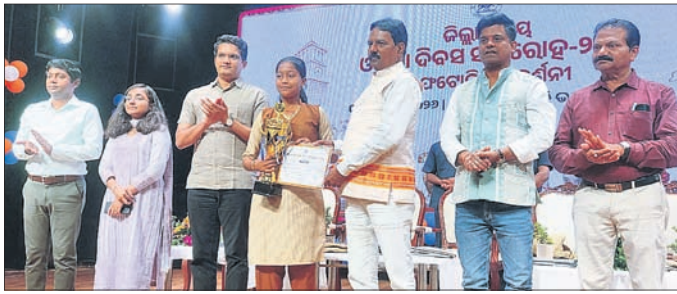
ଜିଲାସ୍ତରାୟ ଓଡ଼ିଶା ଦିବସରେ ଜଣେ କୃତୀ ଛାତ୍ରୀଙ୍କୁ ମନୀ ପୁରସ୍କୃତ କରୁଛନ୍ତି।

କଟକ ଜିଲା ପ୍ରଶାସନ ପକ୍ଷରୁ ଜିଲା ସୂଚନା ଓ ଲୋକ ସମ୍ପର୍କ କାର୍ଯ୍ୟାଳୟ ଓ ଜିଲା ସଂସ୍କୃତି ପରିଷଦର ମିଳିତ ଆବୃତ୍ତକାରୀ ଉପାଦାନ ଓଡ଼ିଶା ଦିବସ ପାଳିତ ହୋଇଯାଇଛି।