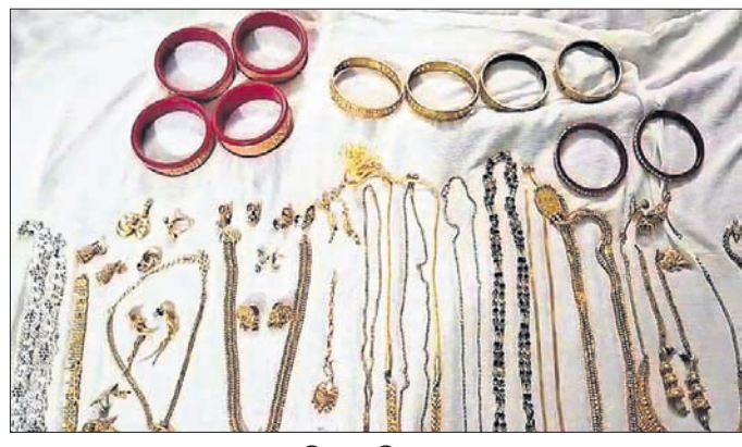
ଠାବ ହୋଇଥିବା ବିପୁଳ ପରିମାଣର ସୁନା ଅଳଙ୍କାର ।