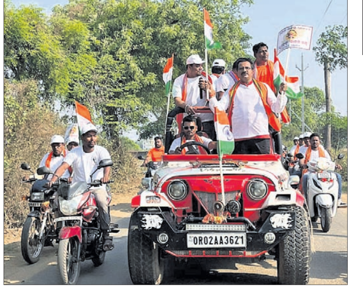
ଗାଙ୍ଗା ମଧୁସୂଦନଙ୍କୁ ଅନୁଷ୍ଠାନକୁ ବାହାରିଥିବା ବାଇକ ଶୋଭାଯାତ୍ରା।

ଓଡ଼ିଶା ଦିବସ ପାଳନ ଅବସରରେ ସ୍ୱତନ୍ତ୍ର ଓଡ଼ିଶା ଗଠନର ପୁଣ୍ୟ ବିକାଶ ଉଦ୍ଦେଶ୍ୟରେ ମଧୁସୂଦନ ଦାସଙ୍କୁ ଭାରତରତ୍ନ ପ୍ରଦାନ କରାଯିବା ଦାବି ଜୋର ଧରିଲା।