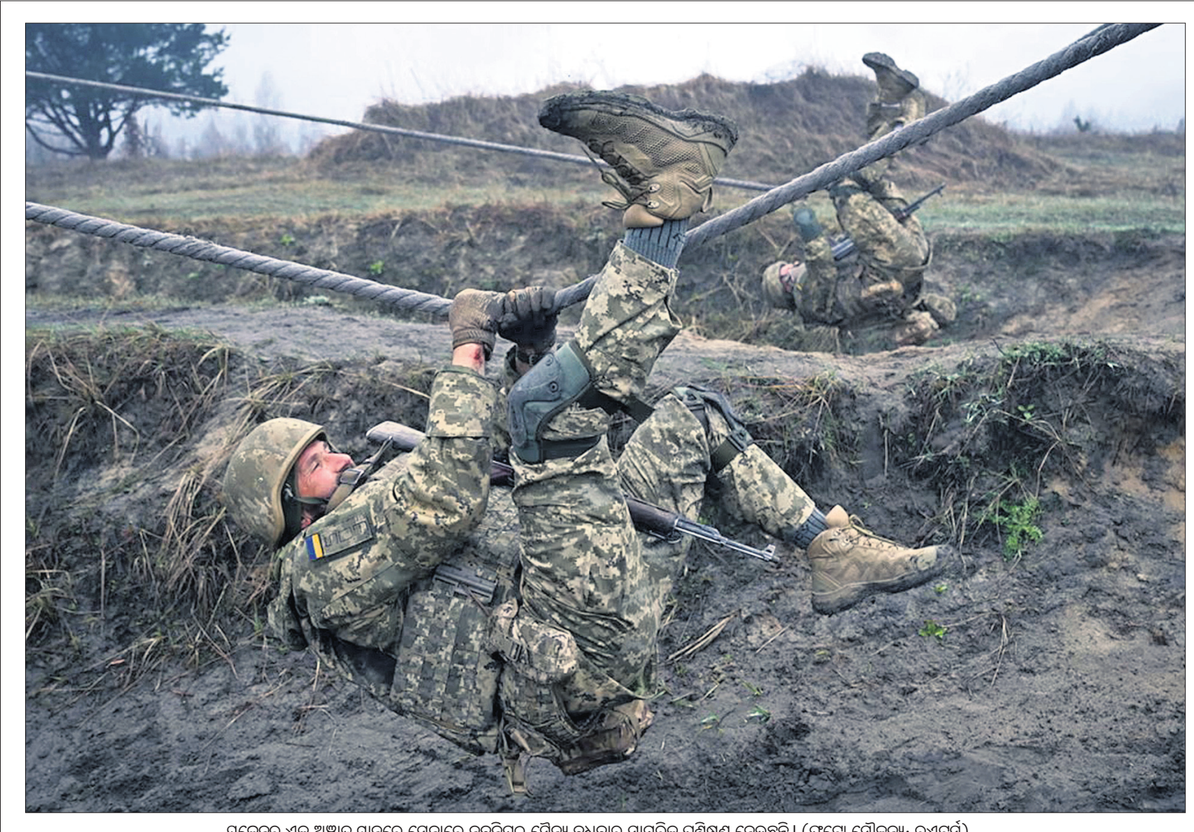
ୟୁକ୍ରେନ୍ ଏକ ଅଞ୍ଚଳ ଗ୍ରାହଣରେ ସେନାରେ ନବନିଯୁକ୍ତ ସୈନ୍ୟ ରୁଧିରା ସାମରିକ ପ୍ରଶିକ୍ଷଣ ନେଉଛନ୍ତି।

ଆସାମ ପୁଣ୍ୟାଳୟ ହିମତ ବିଶ୍ୱଶର୍ମାଙ୍କ ପରିବାର ରାଜ୍ୟକୁ ଲୁଚୁଛି ବୋଲି ରୁଧିରା କଂଗ୍ରେସ ନେତ୍ରୀ ପ୍ରିୟଙ୍କା ଗାନ୍ଧୀ ଭଦ୍ରା ପରୋକ୍ଷରେ ଚାର୍ଜ୍ କରିଛନ୍ତି। କଂଗ୍ରେସ ସାଧାରଣ ସମାଜିକା ପ୍ରିୟଙ୍କା ବିଧାନସଭା ନିର୍ବାଚନ ପ୍ରଚାରରେ ଆସାମର ଏକାଧିକ ସ୍ଥାନରେ ପ୍ରଚାର କରି ଉତ୍ତର କେନ୍ଦ୍ର ଓ ରାଜ୍ୟର ଭାଗ୍ୟ ସରକାରକୁ ସମାଲୋଚନା କରିଛନ୍ତି। ସେ କହିଛନ୍ତି, ଲୋକଙ୍କ ପାଖରେ କିଛି ନ ଥିବାବେଳେ ରାଜ୍ୟର ସବୁ ସମ୍ପଦକୁ କେବଳ ଗୋଟିଏ ପରିବାର ଲୁଚିଚାଲିଛି। ଭାଗ୍ୟ ନେତୃତ୍ୱାଧୀନ ଏକତ୍ୟକ ସରକାର ଲୋକଙ୍କୁ ଭୟଭୀତ କରି ଶାସନ କରୁଛି। ସେମାନେ ଯଦି ଖର୍ଚ୍ଚ, କମି ଓ ଅନ୍ୟ ସମ୍ପର୍କଗୁଡ଼ିକୁ ଲୁଚୁନାହାନ୍ତି ତେବେ ବଡ଼ ବଡ଼ ଶିଳ୍ପପତିଙ୍କ ହାତକୁ ତାହା କିପରି ଯାଉଛି ବୋଲି ସେ ପ୍ରଶ୍ନ କରିଛନ୍ତି। ଏହି ଅବସରରେ ପ୍ରିୟଙ୍କା ସାରଦା, ସ୍ମାର୍ଟ ସିଟି ଏବଂ ଏନ୍‌ସି ହିଲ୍ ଡୁର୍ଗା ପ୍ରସଙ୍ଗ ଉଦ୍‌ଘୋଷଣା କରିଛନ୍ତି।