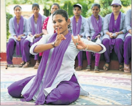
ଭୁବନେଶ୍ୱର, ୧୪ (ସୌମ୍ୟରଞ୍ଜନ ରାଉତ)

ଓଡ଼ିଶାର ସମୃଦ୍ଧ କଳା ଓ ପରମ୍ପରାକୁ ଅତି ସୁନ୍ଦର ଭାବେ ପ୍ରଦର୍ଶନ କରିଥିଲେ। ପାରମ୍ପରିକ ନୃତ୍ୟ, ସଙ୍ଗୀତ ଏବଂ ଚିତ୍ରକଳା ରଙ୍ଗୋଲି ମାଧ୍ୟମରେ ଓଡ଼ିଶାର ସାହିତ୍ୟ ପ୍ରତି ସେମାନଙ୍କର ଗଭୀର ମମତା ଓ ଗର୍ବ ପ୍ରକାଶ ପାଇଥିଲା। ଏହି ଆୟୋଜନ ସମଗ୍ର କାର୍ଯ୍ୟକ୍ରମ ପରିସରକୁ ଉତ୍ସବମୁଖର କରିବା ସହ