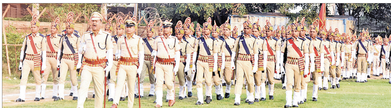
ପୁରୀ, ୧୫