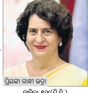
ପ୍ରିୟଙ୍କା ଗାନ୍ଧୀ ଭଦ୍ରା

ଆସାମକୁ ଲୁଚୁଛି ବିଶ୍ୱଶର୍ମାଙ୍କ ପରିବାର: ପ୍ରିୟଙ୍କା