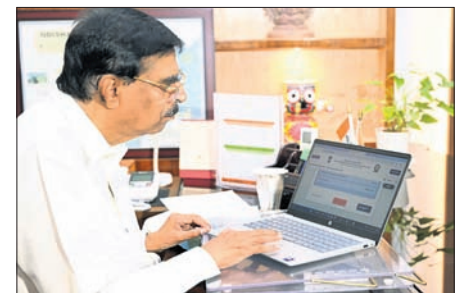
ରାଜ୍ୟପାଳ ଡ. ହରିବାବୁ କମ୍ପନପତି ସ୍ୱ-ଗଣନାରେ ନିଜ ତଥ୍ୟ ପ୍ରଦାନ କରୁଛନ୍ତି।