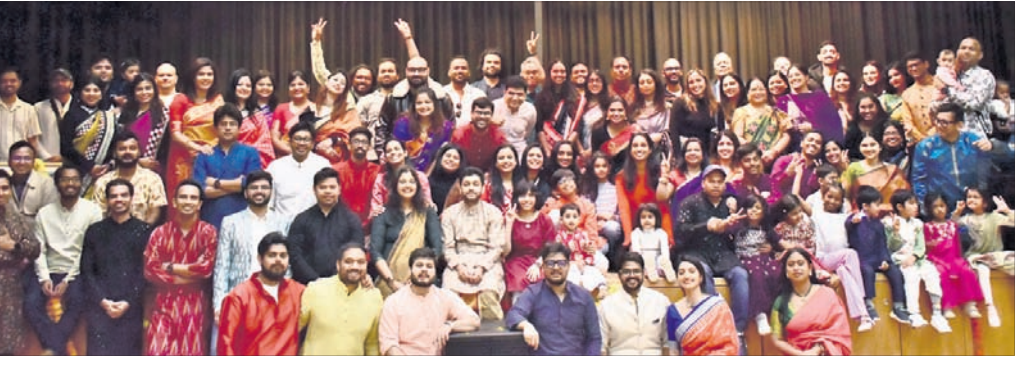
ବର୍ଲିନରେ ଅନୁଷ୍ଠିତ ଓଡ଼ିଶା ଦିବସରେ ଯୋଗଦେଇଥିବା ପ୍ରବାସୀ ଓଡ଼ିଆମାନେ ।