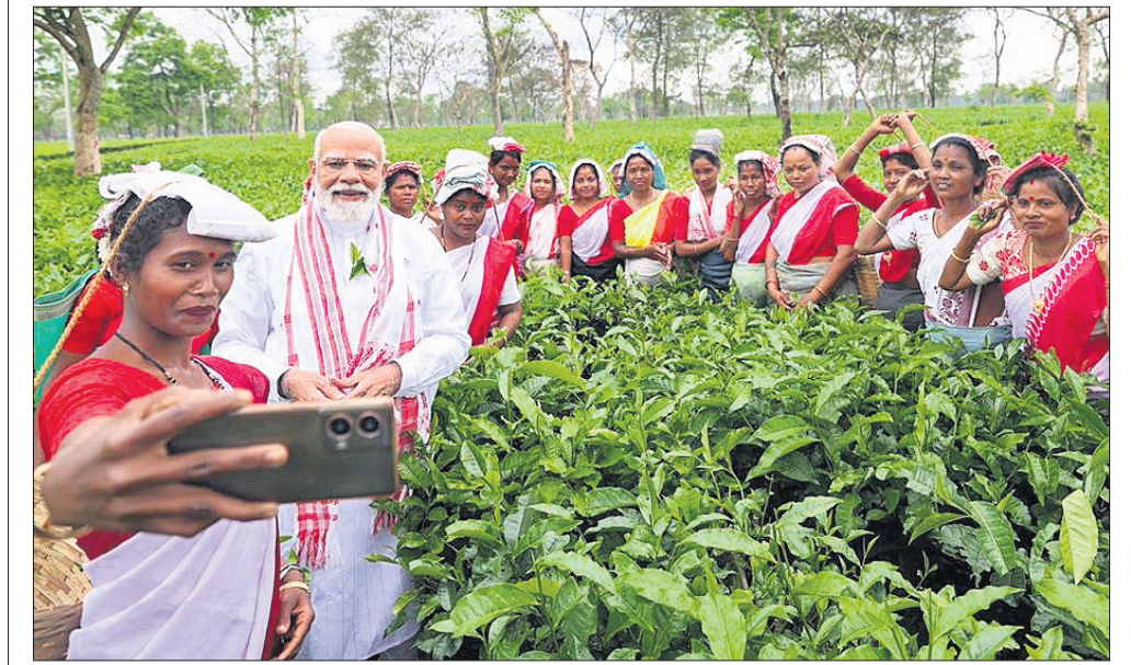
ଆସାମ ନିର୍ବାଚନ ପ୍ରଚାର ଗସ୍ତରେ ଯାଇଥିବା ପ୍ରଧାନମନ୍ତ୍ରୀ ନରେନ୍ଦ୍ର ମୋଦିଙ୍କ ସହ ବିହାରୀ ଗ୍ରାମ୍ୟ ଶ୍ରମିକମାନେ ସେଲ୍ଫି ନେଉଛନ୍ତି।

ବ୍ୟବହାର କରୁଥିବାରୁ ସେମାନଙ୍କ ସାମ୍ମୁଖି ଉପରେ ନିକାରାତ୍ମକ ପ୍ରଭାବ ପଡ଼ୁଛି। ମଧୁମେହ ରିକ୍ଷା ପାଇଁ କିଏଲି ୧ ଡ୍ରଗ୍ ବ୍ୟବହାର କରାଗଲେ ଗନ୍ଧାର ପାର୍ଶ୍ୱପ୍ରତିକ୍ରିୟା ଦେଖାଦେଇପାରେ। ତେଣୁ ଡ୍ରଗ୍ କଣ୍ଟ୍ରୋଲ୍ କେମିନିଷ୍ଟ୍ର ଅଫ୍ ଇଣ୍ଡିଆ ଏ ସମ୍ପର୍କିତ ନିୟମକ ସର୍ତ୍ତାବଳୀକୁ କଡ଼ାକଡ଼ି କରିଛନ୍ତି। ଦେଶରେ କେବଳ ଏଣ୍ଡୋକ୍ରେନୋଲୋଜିଷ୍ଟ, ଇଣ୍ଡିଆନ୍ ମେଡିସିନ୍ କୋଲେଜିଷ୍ଟ ଓ କାର୍ଡିଓଲୋଜିଷ୍ଟଙ୍କ ପରାମର୍ଶରେ ହିଁ ଏହାର ବିକ୍ରିକୁ ଅନୁମତି ଦିଆଯାଇଥିବା ଏଥିରେ ସ୍ପଷ୍ଟ କରାଯାଇଛି। ପ୍ରକାଶ ଯେ, ନିକଟରେ ଏଭଳି ୪୯ ବର୍ଷ ଉପରେ ଚଳାଉ କରାଯାଇଥିଲା। ସେମାନଙ୍କ ବିରୋଧରେ କାର୍ଯ୍ୟାନୁଷ୍ଠାନ ନିଆଯାଇଥିବା ଜଣାପଡ଼ିଛି।