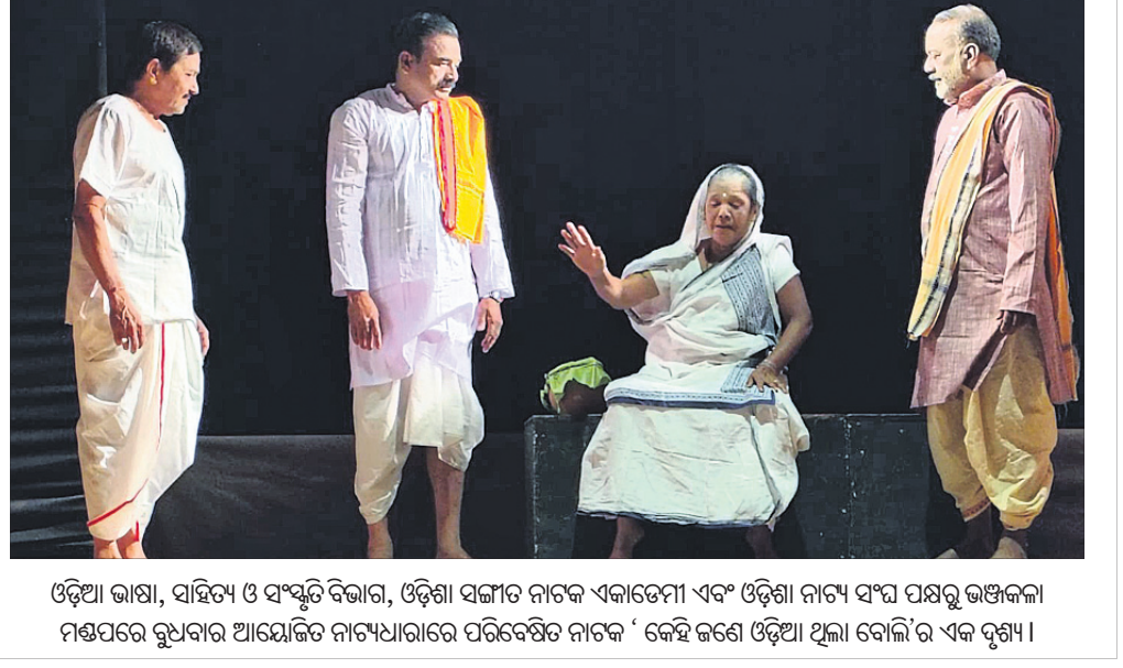
ଓଡ଼ିଆ ଭାଷା, ସାହିତ୍ୟ ଓ ସଂସ୍କୃତି ବିଭାଗ, ଓଡ଼ିଶା ସଙ୍ଗୀତ ନାଟକ ଏକାଡେମୀ ଏବଂ ଓଡ଼ିଶା ନାଟ୍ୟ ସଂଘ ପକ୍ଷରୁ ଭିକ୍ଷାକଳା ମଣ୍ଡପରେ ରୁଧିରୀ ଖାରବେଳ ନାଟ୍ୟାଳୟରେ ପରିବେଷିତ ନାଟକ ‘କେହି ଜଣେ ଓଡ଼ିଆ’ ଥିଲା ବୋଲି ଏକ ଦୃଶ୍ୟ ।