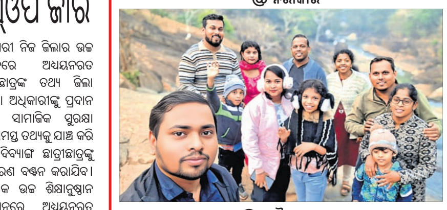
ଭୁବନେଶ୍ୱର, ୧୪୪ (ପୁରୁଷୋତ୍ତମ ସାହୁ)

ଉଚ୍ଚ ଶିକ୍ଷାନୁଷ୍ଠାନରେ ଅଧ୍ୟୟନରତ ଦିବ୍ୟାଙ୍ଗ ଛାତ୍ରାଛାତ୍ରୀଙ୍କୁ ସହାୟକ ଉପକରଣ ପ୍ରଦାନ କରାଯିବ । ଏଥିସହ ପ୍ରତ୍ୟେକ ଉଚ୍ଚ ଶିକ୍ଷାନୁଷ୍ଠାନକୁ ୩ଟି ହିଲ୍ ବେୟାର ଦିଆଯିବ ବୋଲି ଏସ୍.ଓ.ପି ଜାରି କରାଯାଇଛି । ଏଥିପାଇଁ ଉଚ୍ଚଶିକ୍ଷା ବିଭାଗ ପକ୍ଷରୁ ଆଞ୍ଚଳିକ ଶିକ୍ଷା ନିର୍ଦ୍ଦେଶକ ଏବଂ ଆଞ୍ଚଳିକ ଶିକ୍ଷା ଉପ-ନିର୍ଦ୍ଦେଶକମାନଙ୍କୁ ଜିଲା ନୋଡାଲ ଅଧିକାରୀ ଭାବେ ଦାୟିତ୍ୱ ପ୍ରଦାନ କରାଯାଇଛି । ଏମାନେ ନିଜ ଜିଲ୍ଲାରେ ଥିବା ଉଚ୍ଚ ଶିକ୍ଷାନୁଷ୍ଠାନ ଏବଂ ଜିଲା ସାମାଜିକ ସୁରକ୍ଷା ଅଧିକାରୀଙ୍କ ମଧ୍ୟରେ ସମନ୍ୱୟ ରକ୍ଷା କରି ଉଚ୍ଚ ଶିକ୍ଷାନୁଷ୍ଠାନଗୁଡ଼ିକରେ ଅଧ୍ୟୟନରତ ଦିବ୍ୟାଙ୍ଗ ଛାତ୍ରାଛାତ୍ରୀଙ୍କୁ ସହାୟକ ଉପକରଣ ବଣ୍ଟନ କରିବେ । ଏଥିସହ ଏହାର ରିପୋର୍ଟ ଉଚ୍ଚଶିକ୍ଷା ବିଭାଗକୁ ପ୍ରଦାନ କରିବେ । ଏସ୍.ଓ.ପି ଅନୁଯାୟୀ, ଜିଲା