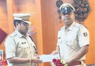
ଖୁଣ୍ଟୁଣା, ୧୪ (ସଚିକାନ୍ଦ ମଞ୍ଜରି)

ସିଂଙ୍କୁ ଦାୟିତ୍ୱ ଦିଆଯାଇଥିବାବେଳେ ସେ ମହିଳା ସଂଗଠନକୁ କୌଣସି କାର୍ଯ୍ୟ ଦେଇ ନାହାନ୍ତି। କର୍ମୀ ବହୁ ଅବହେଳିତ ହୋଇ ରହିଛନ୍ତି।