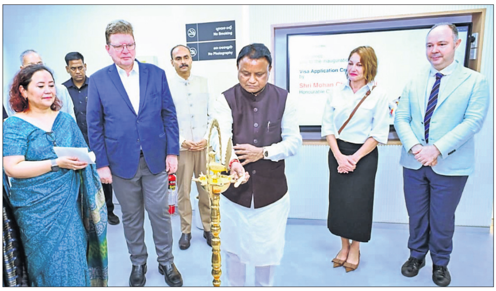
ଭୁବନେଶ୍ୱର ବରମୁଣ୍ଡା ବସଷ୍ଟାଣ୍ଡ (ବିଏସ୍‌ଏଚ୍‌ଏସ୍)ରେ ଭିଜା ଆବେଦନ କେନ୍ଦ୍ରକୁ ଉଦଘାଟନ କରୁଥିବା ମୁଖ୍ୟମନ୍ତ୍ରୀ ମୋହନ ଚରଣ ମାଝୀ