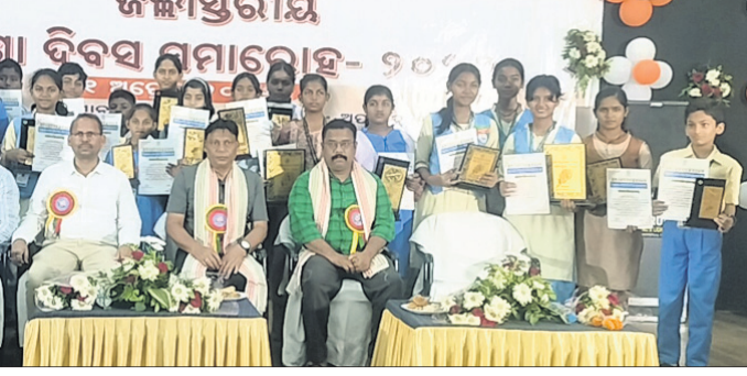
ଜିଲ୍ଲାସ୍ତରୀୟ ଓଡ଼ିଶା ଦିବସ ସମାରୋହରେ ଅତିଥିଙ୍କ ଗହଣରେ କୃତୀ ପ୍ରତିଯୋଗୀ ।