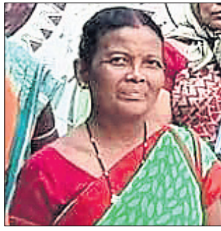
ମୃତା ଏବଂ ଏମ୍ ସମ୍ପର୍କୀତା ବାରିକ ।

ବଲାଙ୍ଗୀର ଜିଲ୍ଲା ଦେଓଗାଁ ଥାନା ବନ୍ଧପଡ଼ା ଫାଟି ଅନ୍ତର୍ଗତ ରାମଚନ୍ଦ୍ରପୁର ଉପସ୍ତାୟକେନ୍ଦ୍ର ଷ୍ଟାଫ୍ କ୍ୱାର୍ଟରରେ ବୁଧବାର ଭୋର ସମୟରେ ଏକ ଅଭାବନୀୟ ଘଟଣା ଘଟିଛି। ଏବଂ ଏମ୍ ସ୍ତ୍ରୀଙ୍କୁ ହତ୍ୟା କରିବା ପରେ ମୃତଦେହକୁ ଜାଳିଦେବାକୁ ଯାଇ ସ୍ୱାମୀ ନିଜେ ପୋଡ଼ିଯାଇ ମୃତ୍ୟୁବରଣ କରିବା ଘଟଣା ଆଲୋଚନା ପୂର୍ଣ୍ଣ କରିଛି।