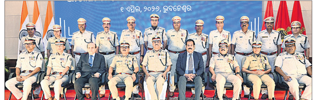
ରାଜ୍ୟ ଆରକ୍ଷା ମହାନିର୍ଦ୍ଦେଶକ ଯୋଗେଶ ବାହାଦୁର ଖୁରାନିଆ ଓ ଅନ୍ୟ ଉଚ୍ଚପଦସ୍ଥ ପୋଲିସ୍ ଅଧିକାରୀଙ୍କ ସହ ପଦକ ପାଇଥିବା ପୋଲିସ୍ ଅଧିକାରୀ ଓ କର୍ମଚାରୀ।

ଭୁବନେଶ୍ୱର, ୧୪ (ତ୍ରିନାଥ ମହାନ୍ତି) ଭୁବନେଶ୍ୱରସ୍ଥିତ ପୋଲିସ୍ ଭବନରେ ରୁଧିର ଆରକ୍ଷା ମହାନିର୍ଦ୍ଦେଶକ ପଦକ ପ୍ରଦାନ ସମାରୋହ ଅନୁଷ୍ଠିତ ହୋଇଯାଇଛି। ଏହି ଅବସରରେ ଆୟୋଜିତ ଏକ ସ୍ୱତନ୍ତ୍ର କାର୍ଯ୍ୟକ୍ରମରେ