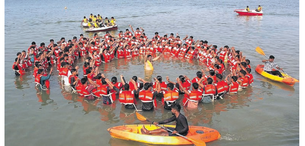
ଓଡ଼ିଶା ଦିବସ ଅବସରରେ ଓଡ଼ିଶା ଯାତ୍ରୀ ଆସିବାବିଏଗଣ ପକ୍ଷରୁ ତିବାନନ୍ଦ ଘାଟ ସମ୍ମୁଖୀୟ ସୁରକ୍ଷା ପ୍ରଦାନ ପାଇଁ ଗଣନା ଅଭିଯାନ ଆରମ୍ଭ କରାଯାଇଛି।

କଟକ, ୧୪ (ପୁରୀରାୟଣ ସାହୁ) କଟକପଡ଼ା ଡେଇଁ ଗଣନା ଅଭିଯାନ କୁଳ୍ୟାରେ ଆରମ୍ଭ ହୋଇଛି।