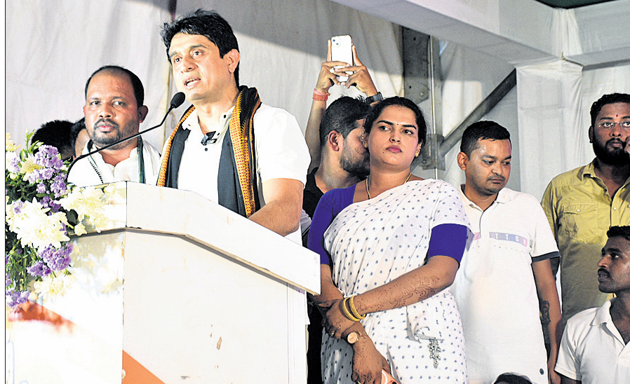
ମାଷ୍ଟରକ୍ୟାଣ୍ଟିନ ଛକଠାରେ ଗୁରୁବାର ଅନୁଷ୍ଠିତ ଯୁବକ୍ରାନ୍ତି ସମାବେଶରେ ଯୁବ କଂଗ୍ରେସର ରାଷ୍ଟ୍ରୀୟ ସଭାପତି ଉପସଭାପତି ଉପସଭାପତି ଉପସଭାପତି ଦେଉଛନ୍ତି।