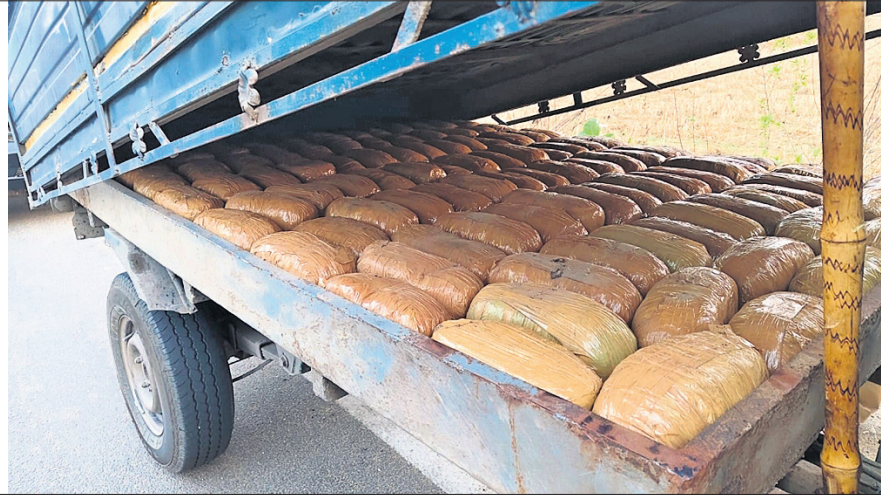
ପୋଲିସ୍ ଟିମ୍ ବୁଢ଼ାରଜା ଛକରୁ ଜବତ କରିଥିବା ଗଞ୍ଜେଇ ସହ ଅଭିଯୁକ୍ତମାନେ।