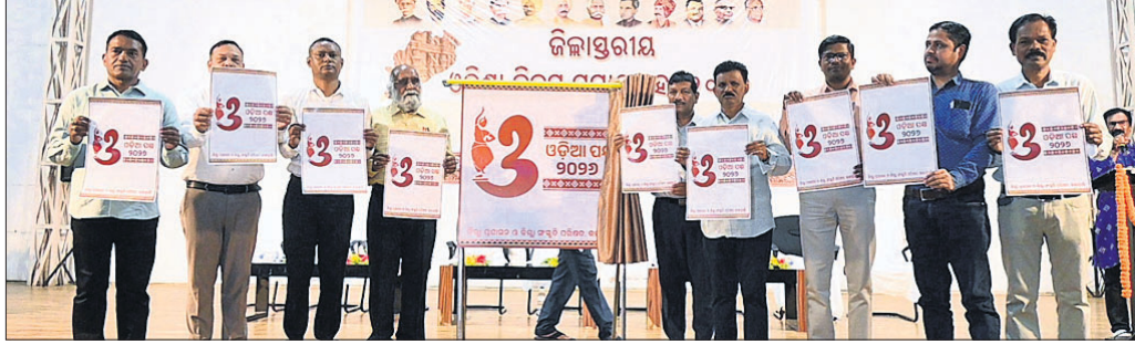
ଅତିଥିଙ୍କ ଦ୍ୱାରା ଓଡ଼ିଆ ପକ୍ଷ ପାଳନ ଲୋଗୋ ଉନ୍ମୋଚନ କରାଯାଇଛି।