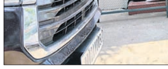
ଗିରଫ ଅଭିଯୁକ୍ତ ଓ କବଚ ସାମଗ୍ରୀ।