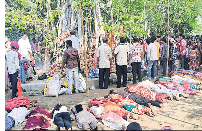
ମା'ଙ୍କ ପାଠରେ ମାନସିକ ପୂରଣ ପାଇଁ ଅଧିକାଂଶ ପଢ଼ିଲେ ।

ସମଲପୁର ଜିଲ୍ଲା କୃତ୍ତିକା ନିକଟ ସଲତାଠାରେ ଗୁରୁବାର ଚୈତ୍ର ପୂର୍ଣ୍ଣିମା ଅବସରରେ ମା' ଚୈତ୍ରାଦେବୀଙ୍କ ପାଠରେ ଚୈତ୍ରାଦେବୀଙ୍କ ଅନୁଷ୍ଠିତ ହୋଇଯାଇଛି । ଏହି ଚୈତ୍ର ପୂର୍ଣ୍ଣିମା ଯାତ୍ରା ଚୈତ୍ରା ପାହାଡ଼ର ପାଦଦେଶରେ ଥିବା ଭେତେନ ନଦୀ ପାର୍ଶ୍ୱବର୍ତ୍ତୀ ଏକ ବୃକ୍ଷ ମୂଳରେ ପୂଜା ହୋଇଥାଏ । ମା' ଚୈତ୍ରାଦେବୀଙ୍କ ଏକ ବିଶେଷତ୍ୱ ସହ କିମ୍ବଦନ୍ତୀ ରହିଛି । ମା' ଚୈତ୍ରାଦେବୀଙ୍କଠାରେ ମାନସିକ ରଖି ଅଧିକାଂଶ ପଢ଼ିଲେ ମା' ଚାଳ ମନବାଣୀ ପୂରଣ ପୁଷ୍ପେଠି, କ୍ଷୀରୋଦ ତିଳ, ରାଜେଶ ପୁଷ୍ପେଠି ପିନ୍ଧି ମାନସିକ ରଖିଥିବା ଭକ୍ତମାନେ ମା'ଙ୍କଠାରେ ପୂଜାର୍ଚ୍ଚନା କରି ବୋଧାବଳି ଅର୍ପଣ କରିଥାନ୍ତି ।