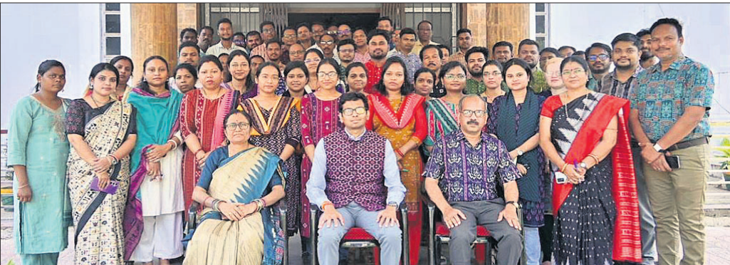
କଲୀପାଳକ କାର୍ଯ୍ୟାଳୟରେ ପାରମ୍ପରିକ ପୋଷାକରେ କଲୀପାଳ ଓ ଅନ୍ୟମାନେ।