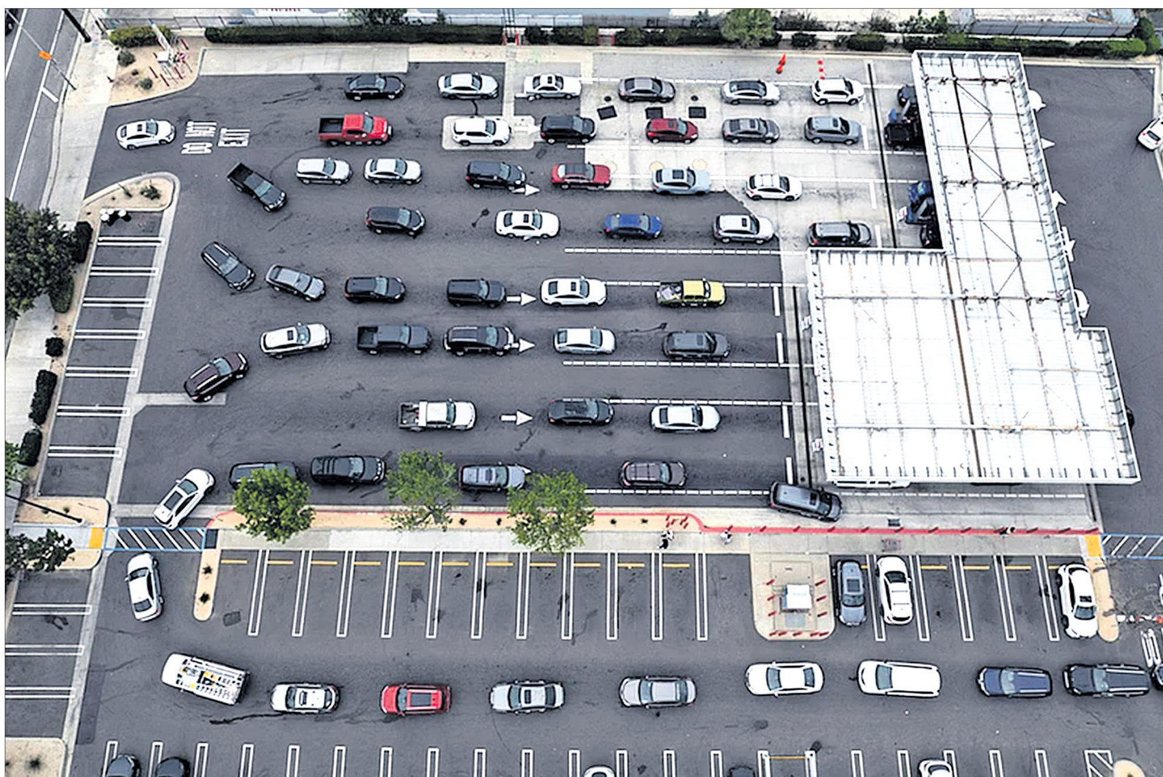
କାର୍ଗୁଡ଼ିକ ଟାଙ୍କିରେ ଗ୍ୟାସ୍ ଭରିବା ପାଇଁ ଲମ୍ବ ଶ୍ରେଣୀରେ ଲୋକମାନେ ଆଗରେ ଧାଡ଼ିରେ ଛିଡ଼ା ହୋଇଛନ୍ତି ।