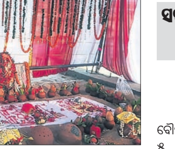
ମନ୍ଦିରରେ ପୂଜାକାର୍ଯ୍ୟ ଚାଲିଛି ।