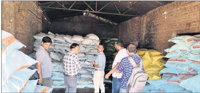
କୃଷି ବିଭାଗ ପକ୍ଷରୁ ତଦାର କରିଯାଇଛି।

ତ୍ରେଡିଙ୍ଗ, ଭେକ୍ଟେଷ୍ଟର କ୍ରମ କେୟାର, ଖମାରି ଫର୍ଟିଲାଇଜର ଷ୍ଟୋର, ପୁନା କୁମାର ଅଗ୍ରାଧୀନ ଫର୍ଟିଲାଇଜର ଟିଲର, ମା' ଦୁର୍ଗା ଏଗ୍ରେ ଫାର୍ମ, ବିକାଶ ଫର୍ଟିଲାଇଜର୍, ଭେଡେନ ଟିଲର, ବରଗଡ଼ ବ୍ଲକର ଭେକ୍ଟେଷ୍ଟର ଏକ୍ସିଜେକ୍ଟିଭ, ଶିବଶଙ୍କର ତ୍ରେଡର୍ସ, ଶିବା କମ୍ପାନୀ, ବିକେପୁର ବ୍ଲକର ସମଲେଖରୀ ଏକ୍ସପ୍ରେସ୍‌ଜେକ୍ଟିଭ, ସୋହେଲା ବ୍ଲକର ସମାପ କୁମାର ଗୁପ୍ତା ଫର୍ଟିଲାଇଜର୍ ଟିଲର, ବୁଦା ମେହେର ଫର୍ଟିଲାଇଜର ଟିଲର୍, ଅତୀତା ବ୍ଲକର ନିଉ ବଂଶଲ ମେହେର ଏକ୍ସିଜେକ୍ଟିଭ, ବରପାଲ ବ୍ଲକର ଡ୍ରେଡର୍ସ ଏବଂ ସାହୁ ଡ୍ରେଡର୍ସ ଏଠାରେ