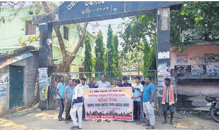
ଲୋକମାନେ ପିକେଟିଂ କରି ବନ୍ଦ କରୁଛନ୍ତି ।

ବୌଦ୍ଧ ଜିଲ୍ଲା କଣ୍ଠାମାଳ ବ୍ଲକ ସଦର ମହକୁମାର ୫ କିଲୋମିଟର ପରିଧି ମଧ୍ୟରେ ରାଜ୍ୟ ସରକାରଙ୍କ ପ୍ରସ୍ତାବିତ କୁଳସ୍ତରୀୟ ସ୍ୱାଭିଯମ ନିର୍ମାଣ ଦାବିରେ ଗୁରୁବାର କଣ୍ଠାମାଳ ଜନସାଧାରଣ ଓ ବିଭିନ୍ନ ସଙ୍ଗଠନ ପକ୍ଷରୁ ଦିଆଯାଇଥିବା ୧୨ ଘଣ୍ଟିଆ କଣ୍ଠାମାଳ ବନ୍ଦ ଡାକରା ସମ୍ପୂର୍ଣ୍ଣ ସଫଳ ହୋଇଛି ।