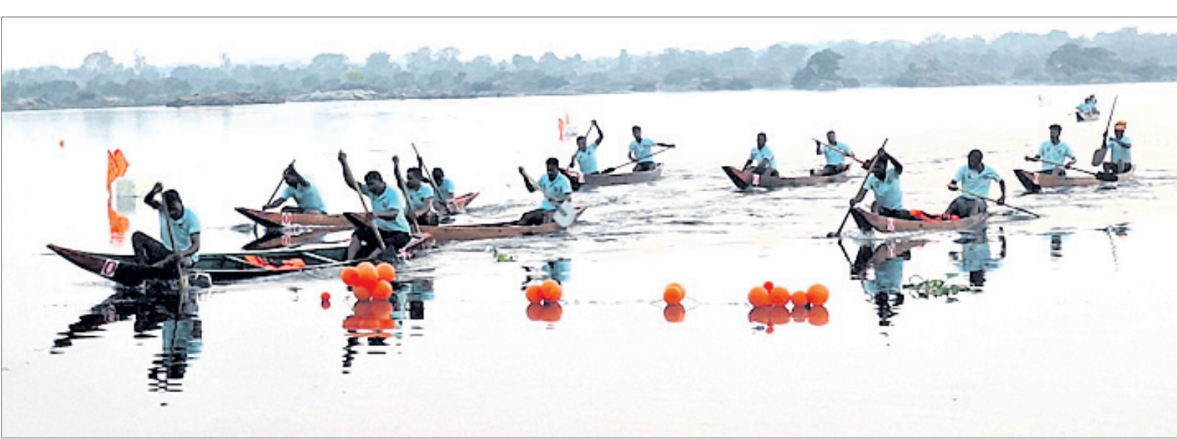
ଗୁରୁବାର ସମଲପୁର ହାଟପଡ଼ା ବୀର ବଜରଙ୍ଗ ସଂଘ ଏବଂ କୈବର୍ତ୍ତ ସମାଜର ମିଳିତ ଆୟୋଜିତ ରାଜ୍ୟସ୍ତରୀୟ ନୌକା ଚାଳନା ପ୍ରତିଯୋଗିତାର ଦୃଶ୍ୟ ।