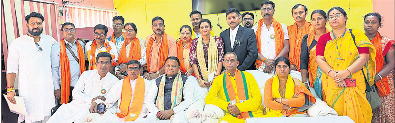
ପଶ୍ଚିମବଙ୍ଗ ବାରଭ୍ରମ ଜିଲ୍ଲାର ୪ ଜଣ ପ୍ରାର୍ଥୀଙ୍କ ପ୍ରାର୍ଥପତ୍ର ଦାଖଲ ଅବସରରେ ଦଳୀୟ ନେତା ଓ ପ୍ରାର୍ଥୀଙ୍କ ଗହଣରେ ମୁଖ୍ୟମନ୍ତ୍ରୀ ମୋହନ ଚରଣ ମାଝୀ।