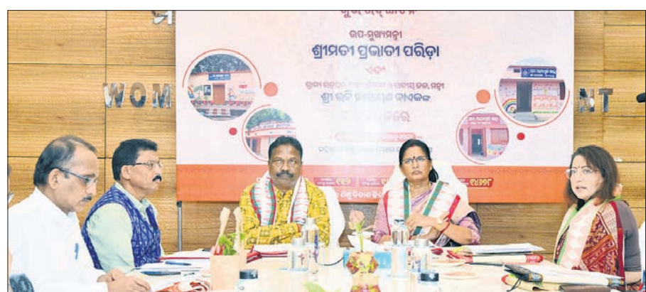
ଅଙ୍ଗନୱାଡ଼ି କେନ୍ଦ୍ର ଲୋକାର୍ପଣ ଅବସରରେ ଉପମୁଖ୍ୟମନ୍ତ୍ରୀ ପ୍ରଭାତା ପରିଡ଼ା, ମନ୍ତ୍ରୀ ରବି ନାରାୟଣ ନାଏକଙ୍କ ସହ ଅଧିକାରୀମାନେ।

ଭୁବନେଶ୍ୱର, ୨୮୪ (ସ୍ପେସ୍ ଡାକ୍ତରୀ) ମହିଳା ଓ ଶିଶୁ ବିକାଶ ବିଭାଗ ଏବଂ ପ୍ରଶାସନିକ ବିଭାଗର ମିଳିତ ସହଯୋଗରେ ରାଜ୍ୟର ୩୦ ଜିଲ୍ଲାରେ ୧,୮୮୯ଟି ନୂଆ ଅଙ୍ଗନୱାଡ଼ି କେନ୍ଦ୍ର ଖୋଲିଛି।