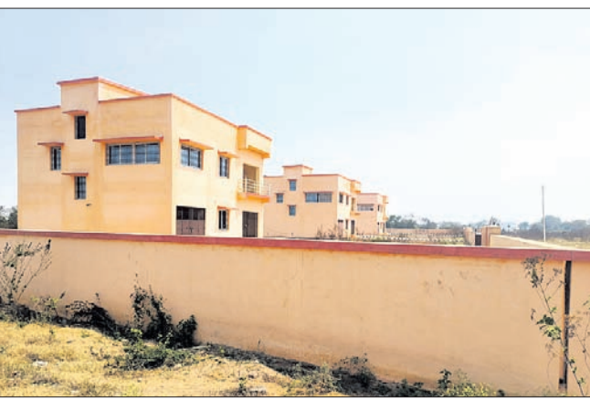
ପାଣିସିଆଳି ଠାରେ ନବନିର୍ମିତ କାର୍ଯ୍ୟ।

ସୁବର୍ଣ୍ଣପୁର ଜିଲ୍ଲା ପ୍ରଶାସନର ଦାୟିତ୍ୱହୀନତା ପାଇଁ ସୋନପୁର ବ୍ଲକ୍ ପାଣିସିଆଳିସ୍ଥିତ କେନ୍ଦ୍ରୀୟ ବିଦ୍ୟାଳୟ ସମ୍ମୁଖରେ ନବ ନିର୍ମିତ ୩ଟି ବି ଗାଜପ୍ କାର୍ଯ୍ୟ ନଷ୍ଟ ହେଉଛି। ରାଜ୍ୟ ବିଭାଗ ପକ୍ଷରୁ ମିଳିଥିବା ପ୍ରାୟ ୨କୋଟି ୨୦ଲକ୍ଷ ଟଙ୍କା ଅନୁଦାନରେ ସୁବର୍ଣ୍ଣପୁର ପୂର୍ବ ବିଭାଗ ପକ୍ଷରୁ ୨ ଅତିରିକ୍ତ ଜିଲ୍ଲାପାଳ(ଏଡିଏମ୍) ଓ ସୋନପୁର ଉପଜିଲ୍ଲାପାଳଙ୍କ ବାସଭବନ ନିର୍ମାଣ ହୋଇଛି। ୧ ବର୍ଷ ପୂର୍ବରୁ ୩ଟି ବୃତ୍ତକ ବିଶିଷ୍ଟ କୋଠା ନିର୍ମାଣ ସରିଛି। କେବଳ ପଛ ପଛ ପ୍ରାଣୀ ଓ ପରିସରରେ ମାଟି ପୋତା କାମ ବାକି ଅଛି। ପୂର୍ବ ବିଭାଗ ପକ୍ଷରୁ ଏହି ପ୍ରକଳ୍ପ କାମ ପୂର୍ଣ୍ଣାଙ୍ଗ କରି ଅଧିକାରୀଙ୍କ ବାସ ଉପଯୋଗୀ କରାଯାଇଛି। ଟଙ୍କା ସଂରକ୍ଷିତ ବୋଲି କହି ପୂର୍ବ ବିଭାଗ ହାତ ଟେକି ବସିଛି। ଅନ୍ୟପକ୍ଷେ ପୂର୍ବ ବିଭାଗର ଅଧ୍ୟକ୍ଷ ଯନ୍ତ୍ରାଳ ଭଳି ଅତିରିକ୍ତ ଜିଲ୍ଲାପାଳ ଓ ଉପଜିଲ୍ଲାପାଳ ମଧ୍ୟ ଏ ଦିଗରେ ଆସିବେ ତଦ୍ୱାରା ପ୍ରକାଶ କରୁନାହାନ୍ତି। ସରକାରଙ୍କ ୨କୋଟିରୁ ଊର୍ଦ୍ଧ୍ୱ ହେବାକୁ ନିର୍ମାଣ କୋଠା ଦିନକୁ ଦିନ ନଷ୍ଟ ହେବାରେ ଲାଗିଛି। ପୂର୍ବ ବିଭାଗ