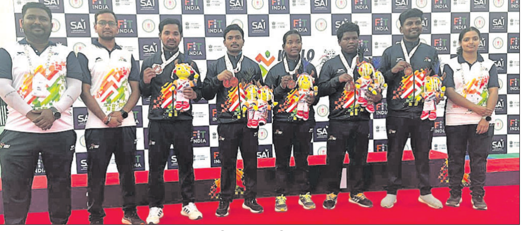
କୋଚ୍ ସହ ଓଡ଼ିଶାର ପଦକ ବିଜେତା ତୀରନ୍ଦାଜ।

କଟକ, ୨୫ (କୁମାରଗ୍ରୀ) ରାଜ୍ୟପୁର ଠାରେ ଚାଲିଥିବା ପ୍ରଥମ ଖେଳୋ ଇଣ୍ଡିଆ ଟ୍ରାଇବାଲ ଗେମ୍ସରେ ଓଡ଼ିଶା ତୀରନ୍ଦାଜକୁ ଦୁଷ୍ଟାନ୍ତମୂଳକ ସମ୍ପର୍କଟା ମିଳିଛି। ପ୍ରତିଯୋଗିତାରେ ଓଡ଼ିଆ ପ୍ରତିଯୋଗୀମାନେ ମୋଟ ୪ଟି ପଦକ ଜିତିଥିବା ବେଳେ ଏଥିରେ ୨ଟି ରୌପ୍ୟ ଏବଂ ୨ଟି ବ୍ରୋଞ୍ଜ ପଦକ