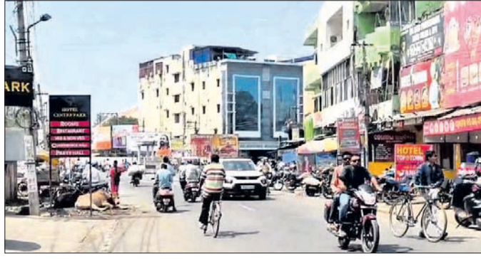
ସହରରେ ସୃଷ୍ଟି ହୋଇଥିବା ଗ୍ରାମିକ ସମସ୍ୟା।

ବିଭିନ୍ନ ସ୍ଥାନରେ ଗହଳି ଯୋଗୁଁ ସହରବାସୀ ନାକେଦମ