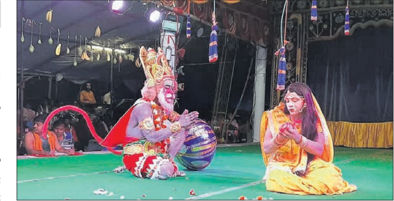
ପରିବେଷିତ ରାମଲୀଳା ନାଟକର ଦୃଶ୍ୟ ।

ବୌଦ୍ଧ ଗଣପର୍ବରାମଲୀଳା ଯାତ୍ରାର ଗୁରୁବାର ଥୁଳା ସପ୍ତମ ଦିବସ ।