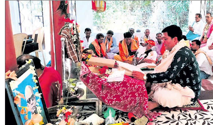
ମାନେଶ୍ୱର ବ୍ଲକ୍ ବର୍ତ୍ତମାନ ଗାଁ କଲ୍ୟାଣ ଆଶ୍ରମରେ ଗୁରୁବାର ପାରାୟଣ ଚାଲିଛି ।