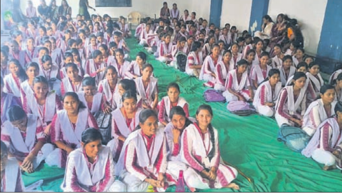
କାର୍ଯ୍ୟକ୍ରମରେ ଉପସ୍ଥିତ ଛାତ୍ରୀମାନେ।