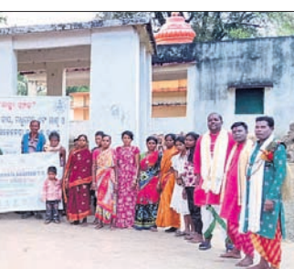
କାର୍ଯ୍ୟକ୍ରମରେ ପାଳା ଗାୟକ ଓ ସହଯୋଗୀଙ୍କ ସହ ସ୍ୱେଚ୍ଛାସେବୀ।

ପାଳା ମାଧ୍ୟମରେ ସ୍ୱାସ୍ଥ୍ୟ ସଚେତନତା ବୋଲେ, ୨୪ (ବିକେଶ୍ୱର ନାଗ)