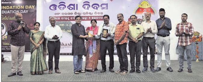
ଲକ୍ଷ୍ମୀ ବିକାଶ ଗ୍ରୁପରେ ଅତିଥିକୁ ସମ୍ବର୍ଦ୍ଧିତ କରାଯାଇଛି।