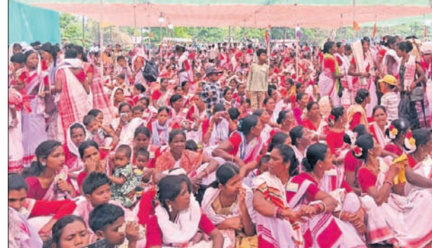
କାର୍ଯ୍ୟକ୍ରମରେ ଉପସ୍ଥିତ ଶ୍ରଦ୍ଧାଳୁ।

ବୀରମିତ୍ରପୁର ମେଳା ପଡିଆରେ ଗୁରୁବାର ସାରହୁଲ ପୂଜା ମହୋତ୍ସବ ପାଳିତ ହୋଇଯାଇଛି। ଏହି ମହୋତ୍ସବ ପାଳନର ମୂଳମନ୍ତ୍ର ହେଉଛି ଆଦିବାସୀ ସମ୍ପ୍ରଦାୟର ପାରମ୍ପରିକ, ସାଂସ୍କୃତିକ ପରମ୍ପରାର ସୁରକ୍ଷା ଓ ସାମୂହିକ ଏକତା ରକ୍ଷା କରିବା ବୋଲି ଉପସ୍ଥିତ ଅତିଥିମାନେ ମତପୋଷଣ କରିଛନ୍ତି। ଏହି କାର୍ଯ୍ୟକ୍ରମ କୁଆଁରପୁର ପୂଜା ଦ୍ୱାଡ଼ା ପଡ଼ା ପକ୍ଷରୁ ଆୟୋଜିତ ହୋଇଥିଲା। ସକାଳ ୮ଟାରେ ଆଦି ଧରଣ ଧର୍ମାବଲମ୍ବୀମାନେ ମେଳା ପଡିଆରେ ଥିବା ପୂଜାସ୍ଥଳୀରେ ଏକତ୍ରିତ ହୋଇଥିଲେ। ଏହାପରେ ୯ଟାରେ ପୂଜା ଆରମ୍ଭ ହୋଇଥିଲା। ଅତିଥିମାନେ ସଂସ୍କୃତି ଓ ପରମ୍ପରାକୁ ମଜବୁତ କରିବା ପାଇଁ ନିଜ ନିଜର ବକ୍ତବ୍ୟ ରଖିଥିଲେ। ଏଥିରେ ରାଜି ପାତ୍ର, ଭାରତ ଉପ ଦେଶର, ଗାମନୟ ଓରାମ ପୁଖ୍ୟ ଅତିଥି