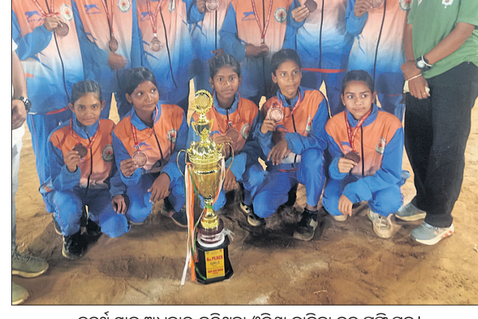
ଚତୁର୍ଥ ସ୍ଥାନ ଅଧିକାର କରିଥିବା ଓଡ଼ିଶା ବାଳିକା ଦଳ ଚତୁର୍ଥ ସହ।

ଆରମ୍ଭ, ୨୫ (ସତ୍ୟ ପ୍ରସାଦ ରଥ) ଖୋ-ଖୋ ଇଣ୍ଡିଆ ଆନୁକୂଲ୍ୟରେ ଓଡ଼ିଶା ଖୋ-ଖୋ ଆସୋସିଏସନ ପକ୍ଷରୁ ୩ ଦିନ ଧରି ଆରମ୍ଭ ମହୋତ୍ସବ ପଡ଼ିଆରେ ଚାଲିଥିବା ଜାତୀୟ ଭୁବନେଶ୍ୱର ଖୋ ଖୋ ଚାମ୍ପିୟନଶିପର ବାଳକ ବିଭାଗରେ ମହାରାଷ୍ଟ୍ର ଏବଂ ବାଳିକା ବିଭାଗରେ ତାମିଲନାଡୁ ଚାମ୍ପିୟନ ହୋଇଛି। ବାଳକ ବିଭାଗର ସଂଘର୍ଷପୂର୍ଣ୍ଣ ଫାଇନାଲରେ ମହାରାଷ୍ଟ୍ର ପ୍ରତିଦ୍ୱନ୍ଦ୍ୱୀ ଜର୍ନାଟକକୁ ୨୮-୨୭ ପଏଣ୍ଟରେ ପରାସ୍ତ