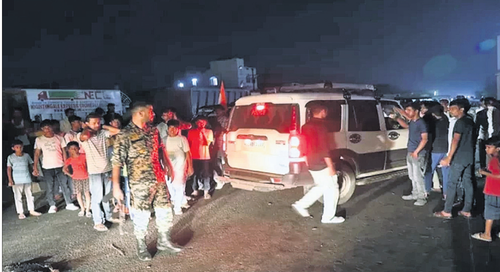
ମାଲିକାରେ ଲୋକେ ପର୍ଯ୍ୟନ୍ତ ରଖିଥିବା ନ୍ୟାୟିକ ଅଧିକାରୀମାନଙ୍କୁ ଅଧିକାରୀଙ୍କ ବଳ ଉଦ୍ଧାର କରି ନେଇଛି ।

କୋଲକାତା, ୨୫ (ପି.ଟି.) ପଶ୍ଚିମବଙ୍ଗରେ ସ୍ୱତନ୍ତ୍ର ସମ୍ପଦ ସଂଶୋଧନ (ଏସଂଆଇଆର୍) ପ୍ରକ୍ରିୟା ଜାରି ରହିଥିବାବେଳେ ଭୋଟର ତାଲିକାରୁ ମତଦାତାଙ୍କ ନାମ ହଟାଯିବା ନେଇ ବଡ଼ ବିବାଦ ସୃଷ୍ଟି ହୋଇଛି । ଏସଂଆଇଆର୍ ଯୋଗୁ ମାଲିକା ଜିଲ୍ଲାରେ ଯେଉଁମାନଙ୍କ ନାମ କଟିଯାଇଛି, ସେମାନଙ୍କ ମଧ୍ୟରୁ କେତେଜଣ ବ୍ୟକ୍ତି କୁଧିଆର ଅପରାଧରେ ଜଣାପଡ଼ିଥିବା ବ୍ୟକ୍ତି । ନିର୍ବାଚନ କମିଶନ କାଳିଆଚକରେ ୭ ନ୍ୟାୟିକ ଅଧିକାରୀଙ୍କୁ ଦୀର୍ଘ ୯ ଘଣ୍ଟା ଧରି ପର୍ଯ୍ୟନ୍ତ ରଖିଥିଲେ । ପର୍ଯ୍ୟନ୍ତ ଥିବା ଅଧିକାରୀଙ୍କ ମଧ୍ୟରେ ୩ ମହିଳା ରହିଛନ୍ତି । ଗୁରୁବାର ରାତି ପ୍ରାୟ ୧୨ଟାରେ ପୋଲିସ୍ ଓ ଅଧିକାରୀଙ୍କ ବଳର ଏକ ବଡ଼ ଟିମ୍ ଘଟଣାସ୍ଥଳରେ ପହଞ୍ଚି ବିଶୋଧନାଦି ହଟାଇବା ସହ କୁଟିଆଲ ଅଧିକାରୀଙ୍କୁ ଉଦ୍ଧାର କରିଥିଲେ । ଏଥିସହ ସେମାନଙ୍କୁ ଏକ ସୁରକ୍ଷିତ ଗ୍ଲାନକୁ ନେଇଯାଇଥିଲେ । ପଶ୍ଚିମବଙ୍ଗ ବିଧାନସଭାରେ ୨୯୪ ଆସନ ପାଇଁ ଏପ୍ରିଲ ୨୩ ଓ ୨୯ରେ ନିର୍ବାଚନ ହେବାକୁ ଥିବାରୁ କୁଟିଆଲ ଅଧିକାରୀଙ୍କୁ ବର୍ତ୍ତମାନ ବିବାଦୀୟ ପ୍ରସଙ୍ଗର ସମାଧାନ କାର୍ଯ୍ୟ ଶେଷ ପାଇଁ ଚରତର ଦେଖାଉଛନ୍ତି । ମାଲିକାରେ ଅନେକ ଭୋଟରଙ୍କ ନାମ କଟିଯାଇଥିବାରୁ କୁଧିଆର ଏକ ବଡ଼ ବିଶୋଧନ କରାଯାଇଥିଲା । ଭୋଟରଙ୍କ ଏକ ଗୋଷ୍ଠୀ ବିଶୋଧନ ପ୍ରଦର୍ଶନ କରିବା ସହ ବିଚାରବିଭାଗର ଅଧିକାରୀମାନଙ୍କୁ ବିକଶିତ ଭାବରେ ଲକ୍ଷ୍ୟ ହାସଲ ପାଇଁ ଜନସେବାର ଅପ୍ରେତ ଆବଶ୍ୟକ: ମୋଦି