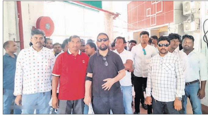
ଜିଲ୍ଲାପାଳଙ୍କୁ ଭେଟିବାକୁ ଆସିଥିବା ଶ୍ରମିକ ଓ କର୍ମଚାରୀ।

ଖଣି ଠିକା ସଂସ୍ଥା ବିରୋଧରେ ଠିକା ଶ୍ରମିକ, କର୍ମଚାରୀଙ୍କ ଧାରଣା