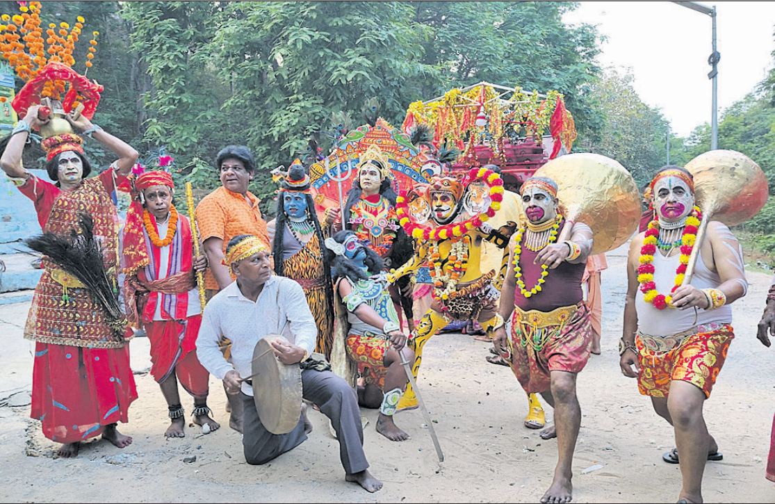
ସେକ୍ଟର-୨ ସ୍ଥିତ ମା' ଡାକା ତାରିଣୀଙ୍କ ନଗର ଭ୍ରମଣ ସମୟରେ କଳାକାରମାନେ ବିଭିନ୍ନ ବେଶରେ ନୃତ୍ୟ କରୁଛନ୍ତି।