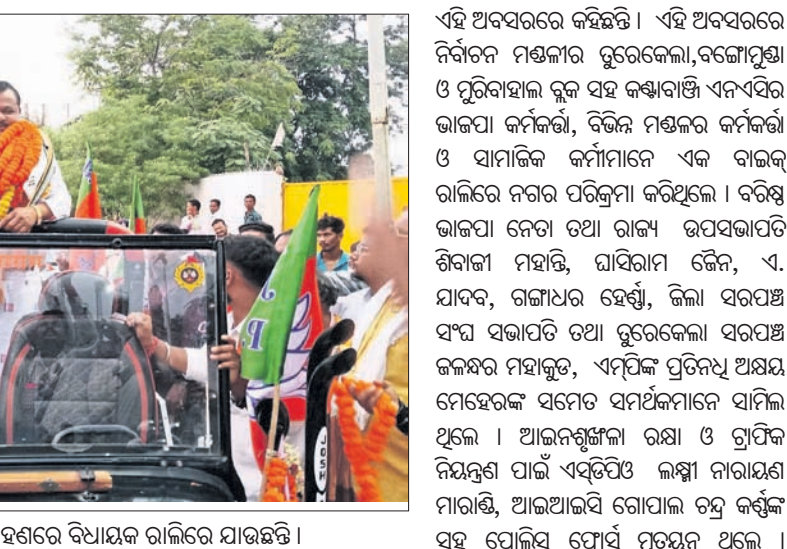
କଣ୍ଠାବାଞ୍ଜିରେ ସମର୍ଥକଙ୍କ ଗହଣରେ ବିଧାୟକ ରାଲିରେ ଯାଉଛନ୍ତି ।

ରାଜ୍ୟର ୩୦ ଜିଲ୍ଲା ଯୋଜନା କମିଟି ଅଧ୍ୟକ୍ଷମାନଙ୍କ ନିଁ ଯୋଗଦାନ କରାଯାଇଛି । ଏହି ପରିପ୍ରେକ୍ଷାରେ କଣ୍ଠାବାଞ୍ଜି ବିଧାୟକ କଣ୍ଠାବାଞ୍ଜି ବାଗକୁ ବଳାଙ୍ଗୀର ଜିଲ୍ଲାର ଅଧ୍ୟକ୍ଷ ଭାବେ ନିଯୁକ୍ତି ମିଳିଛି ।