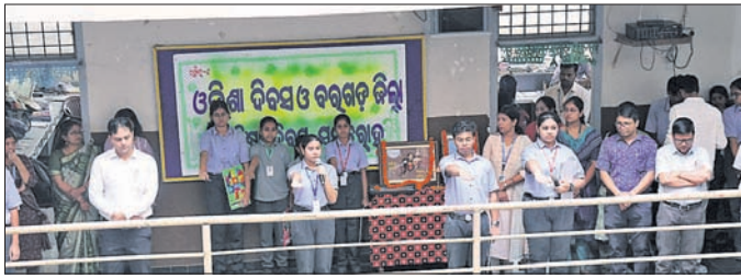
କୃଷି ବିକାଶ ଆବାସିକ ବିଦ୍ୟାଳୟରେ ଓଡ଼ିଶା ଦିବସ, ଜିଲା ପ୍ରତିଷ୍ଠା ଦିବସ ପାଳନ।