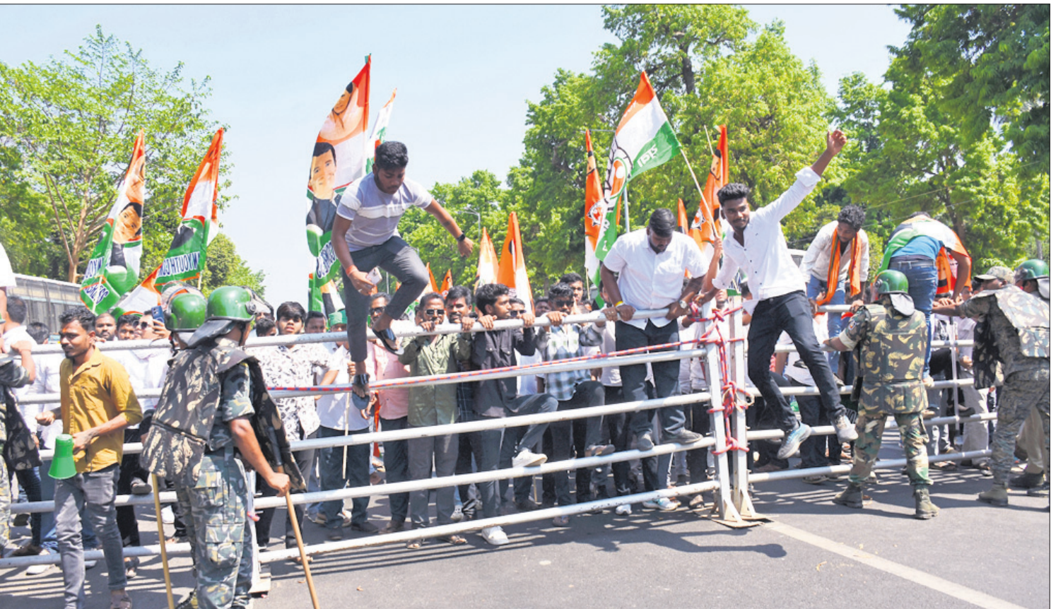
ଯୁବ କଂଗ୍ରେସ ପକ୍ଷରୁ ଗୁରୁବାର ଆୟୋଜିତ ଯୁବକ୍ରାନ୍ତି ସମାବେଶ ଅବସରରେ ଲୋକସେବା ଭବନ ଘେରାଉବେଳେ ଲୋୟର ପିଏମ୍‌ଜି ନିକଟରେ କର୍ମୀମାନେ ବ୍ୟାରିକେଡ୍ ତେଜିବା ସମୟରେ ଯୋଲିସ ସହ ଧସାଧସୁ। (ରିପୋର୍ଟ ପୃଷ୍ଠା: ୩)