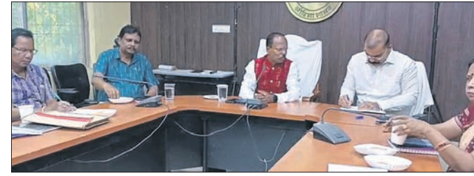
ବୈଠକରେ ଯୋଗଦେଇଥିବା ଅଧିକାରୀ ଓ ଗ୍ୟାସ୍ ବିତରକ।