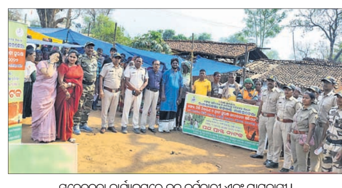
ସଚେତନତା କାର୍ଯ୍ୟକ୍ରମରେ ବନ କର୍ମଚାରୀ ଏବଂ ଗ୍ରାମବାସୀ।

ଅଧିକାର ଉପରେ ଦମନ ଓ ନେତାମାନଙ୍କୁ ଚାର୍ଜେଟ୍ କରିବା, ଖଣି ସୁରକ୍ଷା ନିୟମ ଉଲ୍ଲଙ୍ଘନ, ସ୍ୱାସ୍ଥ୍ୟପ୍ରଦ ଖାଦ୍ୟ ଓ କଲ୍ୟାଣ ସୁବିଧା ଅଭାବ, ଇପିଏଫ, ଇଏସଆଇ ଲାଗୁ ଠିକ ଭାବରେ ନ ହେବା, କୋଭିଡ ପରେ ସରକାରଙ୍କ ଦ୍ୱାରା ଦିଆଯାଇଥିବା ନିର୍ଦ୍ଦେଶାବଳୀରୁ ସୁବିଧାର ଅବମାନନା, ଶ୍ରମ ପ୍ରଚଳନ ନ୍ୟାୟକୁ ଲାଗୁ କରିବାକୁ ନେଇ ରୁଚିତ ଚପଟ କରାଯାଇ ତ୍ରିପାକ୍ଷିକ ଆଲୋଚନା ସହିତ ସମସ୍ତଙ୍କୁ ନିୟୁତ୍ତି ପତ୍ର ପ୍ରଦାନ, ସୁରକ୍ଷା କମିଟି ଗଠନ, ସ୍ୱଳ୍ପ ଖାଦ୍ୟ ଓ ସୁବିଧା, ଇଏସଆଇ ଇପିଏଫ ନିୟମ ଲାଗୁ, ଶ୍ରମିକ ଅଧିକାର ସୁରକ୍ଷା, ଉତ୍ପାଦନ ପାଇଁ ଗ୍ରାମୀଣ, ଅନ୍ୟାୟ କାର୍ଯ୍ୟ ବନ୍ଦ ଓ ଜିଲ୍ଲା ପ୍ରଶାସନ ମାଧ୍ୟମରେ ସମସ୍ତଙ୍କୁ ଓ ମଧ୍ୟସ୍ଥତା କରାଯାଉ। ୧୫ ଦିନ ମଧ୍ୟରେ ସମାଧାନ ନ ହେଲେ ଶାନ୍ତିପୂର୍ଣ୍ଣ ଭାବେ ଖଣି ବନ୍ଦ କରିବାକୁ ବାଧ୍ୟ ହେବୁ ବୋଲି ଚେତାବନା ଦେଇଥିଲେ।