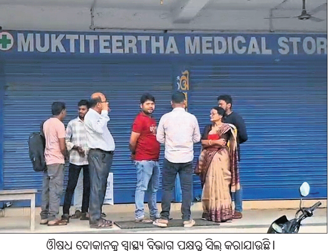
ଔଷଧ ଦୋକାନକୁ ସ୍ୱାସ୍ଥ୍ୟ ବିଭାଗ ପକ୍ଷରୁ ସିଲ୍ କରାଯାଇଛି।