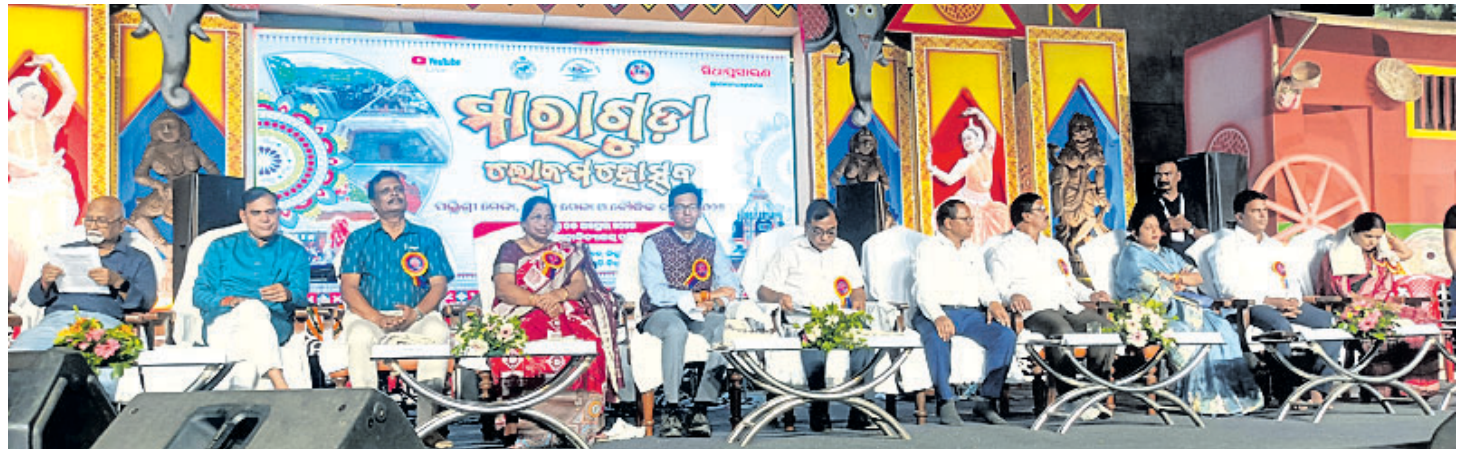
ମହୋତ୍ସବର ବିଭିନ୍ନ ସମ୍ପାଦନାରେ ମଞ୍ଚାୟାନ ଅତିଥିବୃନ୍ଦ ।