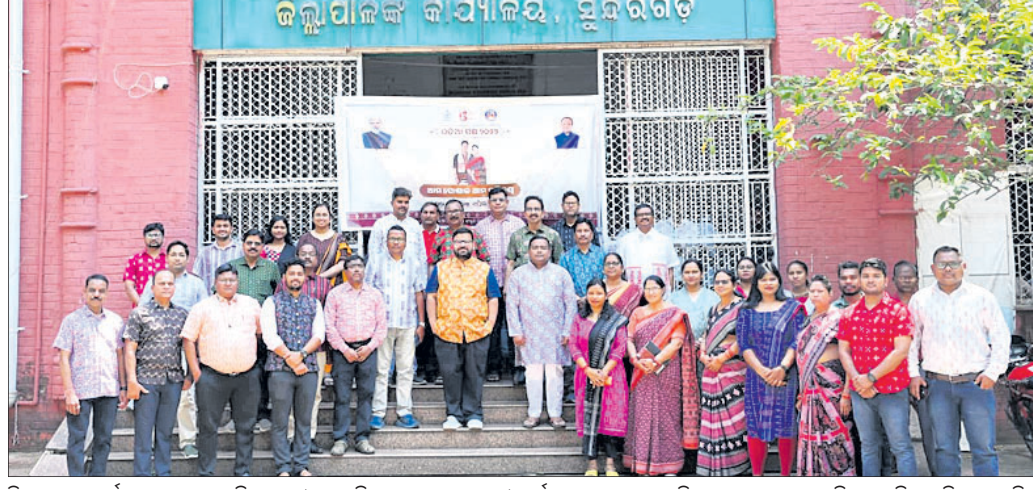
ଜିଲ୍ଲାପାଳଙ୍କ କାର୍ଯ୍ୟାଳୟ ସମ୍ମୁଖରେ ଜିଲ୍ଲାପାଳ ଓ ଅନ୍ୟ ଜିଲ୍ଲାସ୍ତରୀୟ ଅଧିକାରୀ ଓ କର୍ମଚାରୀ ମାନେ ପାରମ୍ପରିକ ସମ୍ବଲପୁରୀ ବସ୍ତ୍ର ପରିଧାନ କରି ଏକାଠି ହୋଇଛନ୍ତି ।