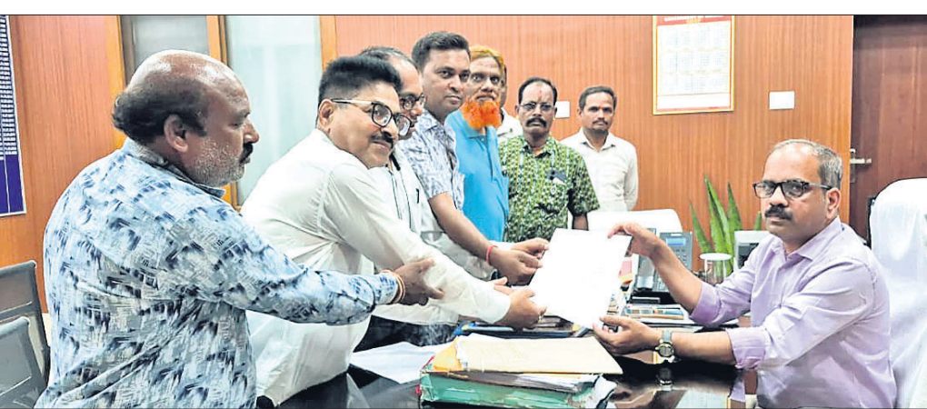
ଅତିରିକ୍ତ ଜିଲ୍ଲାପାଳ ଦାବିପତ୍ର ଗ୍ରହଣ କରୁଛନ୍ତି ।

ବରଗଡ଼, ୪୪ (ପ୍ରେମାନନ୍ଦ ଖମାରୀ) ବରଗଡ଼ ପୌରାଞ୍ଚଳରେ ପରିମଳ ବ୍ୟବସ୍ଥା ବିପର୍ଯ୍ୟୟ ହୋଇ ପଡ଼ିଛି । କିଛିଦିନ ହେଲା ଆଗଭଳି ସପ୍ଲାଇ ଗାଡ଼ି ସହର ଚଳିକନ୍ଦିରେ ଚଳୁ ନାହିଁ । ଅନ୍ୟପକ୍ଷରେ ସହରବାସୀ ରାସ୍ତାପାର୍ଶ୍ୱରେ କୁଟକୂଟ ମଇଳା ଆବର୍ଜନା ପଡ଼ିରହିଛି । ପୌରାଞ୍ଚଳରେ ଛୁଟୁଡ଼ି ପଡ଼ିଥିବା ଏଭଳି ପରିମଳ ବ୍ୟବସ୍ଥାକୁ ନେଇ ସହରରେ ଅସନ୍ତୋଷ ବେଶୀ ଯାଇଛି । ଏହି