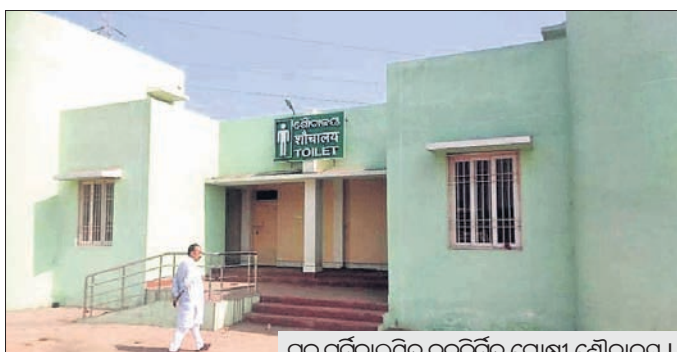
ଟ୍ରକ୍ ଚଳାଳକମାନଙ୍କ ନବନିର୍ମିତ ଗୋଷ୍ଠୀ ଶୈତାଳୟ।

ରାଉରକେଲା ବାଲୁଆପଲ୍ଲୀ ବୁହର ଟ୍ରକ୍ ଚଳାଳକମାନେ ଥିବା ଗୋଷ୍ଠୀ ଶୈତାଳୟ ଓ ପ୍ରତାକ୍ଷାଳୟ ନିର୍ମାଣ ହେବାର ୨ ବର୍ଷ ପରେ ମଧ୍ୟ କାର୍ଯ୍ୟକ୍ରମ ହୋଇନାହିଁ। ଫଳରେ ଶହ ଶହ ଟ୍ରକ୍ ଚାଳକ ସ୍ଥାନଶୈତ, ବିଶ୍ରାମ ନେବାରେ ଅସୁବିଧା ଭୋଗୁଛନ୍ତି।