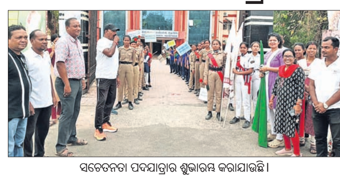
ସଚେତନତା ପଦଯାତ୍ରାର ଶୁଭାରମ୍ଭ କରାଯାଇଛି ।

ଶିଶୁଙ୍କୁ ମରଣ ମୁହଁକୁ ଠେଲି ଦେଉଛି । ଏବେ ବି ସମସ୍ତ ରୁଚୁକ୍ତ ପୁଣି ବିଭାଗ ଜିଲ୍ଲା ମୁଖ୍ୟ ଚିକିତ୍ସାଳୟ ପରିସରରେ ଗଠିଛି । ଏଠାକୁ ଦୈନିକ ୩,୦୦୦ରୁ ଅଧିକ ରୋଗୀ ଆସୁଥିବାବେଳେ ସମସ୍ତଙ୍କୁ ରୁଣାମୂଳକ ସେବା ପ୍ରଦାନ କରିବା କଷ୍ଟକର ହେଉଛି । ବଡ଼ ଅପରେଶନ ଏବଂ ଆଇସିୟୁ ସେବା ପାଇଁ ରୋଗୀଙ୍କୁ ବାହାରକୁ ଯିବାକୁ ପଡ଼ୁଛି । ଯାହାକୁ ନେଇ ସାଧାରଣରେ ଅସନ୍ତୋଷ ବଢ଼ିବାରେ ଲାଗିଛି । ପ୍ରକାଶ ଯେ, ଶହାଦ ରେଣୋ ମାଝି ମେଡିକାଲ କଲେଜ ଓ ହସ୍ପିଟାଲ ଛାତ୍ରଛାତ୍ରଣୀ ପାଇଁ ଦୁଇଟି ଭବିଷ୍ୟତ ଗଢ଼ୁଛି । ୪୩ ଏକର ପରିମିତ କ୍ୟାମ୍ପସରେ ସ୍ମାର୍ଟ କ୍ଲସ୍‌ରୁମ୍ ଏବଂ ହାଇଡେକ ଲ୍ୟାବ୍ ରହିଛି । ଏଠାରେ ପ୍ରତିବର୍ଷ ୧୦୦ ଜଣ ଏମ୍‌ବିଏସ୍ ଛାତ୍ରଛାତ୍ରଣୀ ନାମ ଲେଖାଉଛନ୍ତି । ଏହା କେବଳ ଏକ ପାଠପଢ଼ା କେନ୍ଦ୍ର ଭାବେ ସୀମିତ ନ ରହି ସମ୍ପୂର୍ଣ୍ଣ କେନ୍ଦ୍ର ହେବା କରୁଛି । ଏଠାରେ ବେଶି ବିଶେଷଜ୍ଞ ଡାକ୍ତର ନିଯୁକ୍ତି ସହ ଅତ୍ୟାଧୁନିକ ଚିକିତ୍ସା ସୁବିଧା ଉପଲବ୍ଧ କରାଇ ରୁଚି ମେଡିକାଲ କଲେଜ କାର୍ଯ୍ୟକ୍ରମ କରାଇବାକୁ ସାଧାରଣରେ ଦାବି ହେଉଛି ।