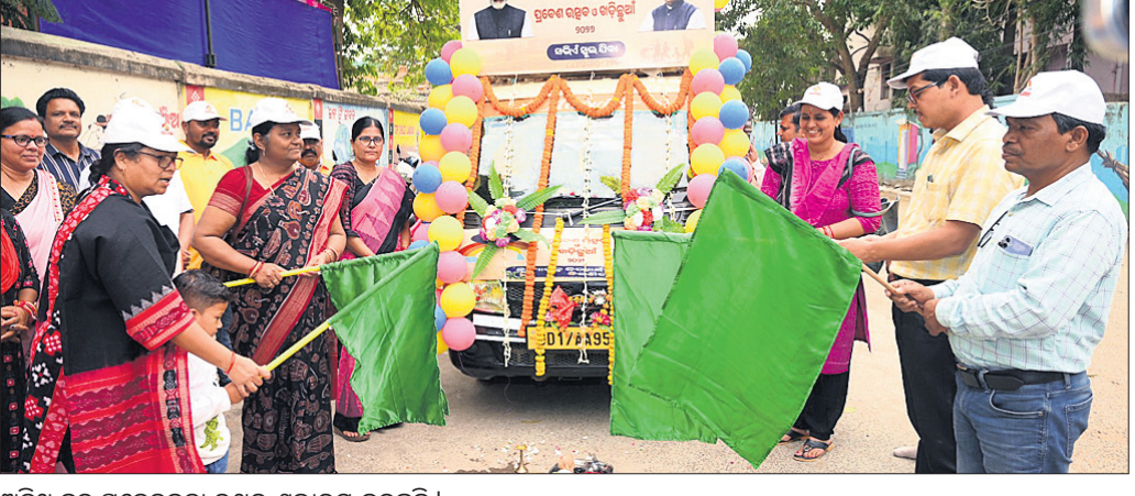
ଅତିଥି ବୃନ୍ଦ ସଚେତନତା ରଥର ଶୁଭାରମ୍ଭ କରୁଛନ୍ତି।

ଜିଲ୍ଲାସ୍ତରୀୟ ପ୍ରବେଶ ଉତ୍ସବ, ଖଡ଼ିଛୁଆଁ କାର୍ଯ୍ୟକ୍ରମରେ ଅବ୍ୟବସ୍ଥା