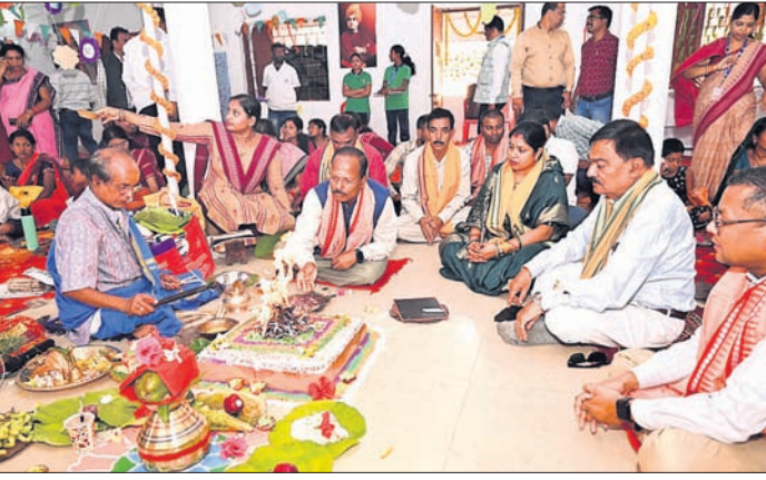
ନୂଆପଡ଼ାରେ ପୂର୍ବକର୍ମା କରି ଖଡ଼ିଆଳ ଆରମ୍ଭ କରାଯାଇଛି ।