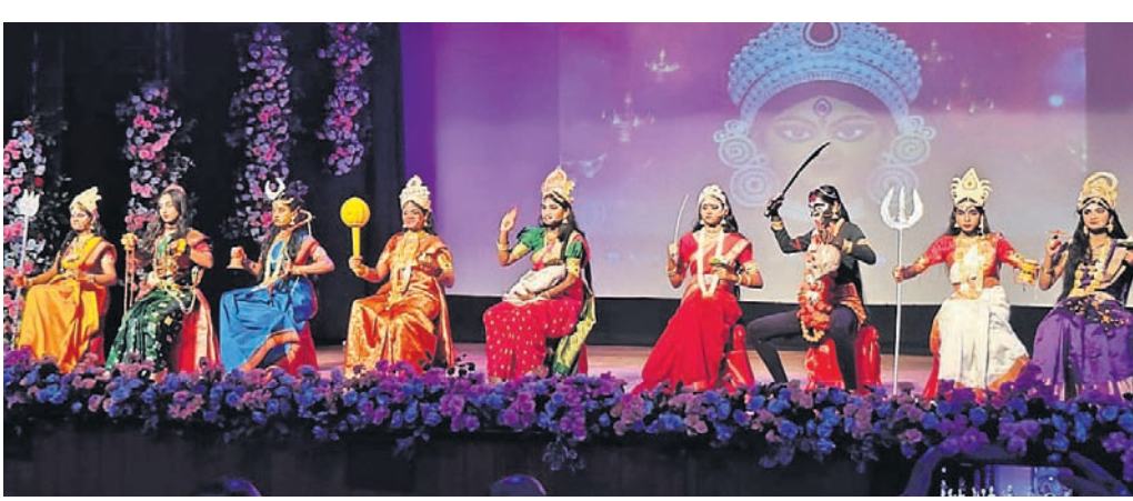
କଳାକାରମାନେ ନୃତ୍ୟ ପରିବେଷଣ କରୁଛନ୍ତି।

ରାଉରକେଲା, ୪୧୪ (ବିପ୍ଳବ ରଞ୍ଜନ ଦାଶ) ସୁନ୍ଦରଗଡ଼ ଜିଲ୍ଲା ନୂଆଆଁ ବ୍ଲକ୍ ଅନ୍ତର୍ଗତ ଖୁଞ୍ଚିଗାଁସ୍ଥିତ ପିଏମଶ୍ରୀ ସରକାରୀ ଉଚ୍ଚ ମାଧ୍ୟମିକ ବିଦ୍ୟାଳୟରେ ଶନିବାର ପ୍ରବେଶ ଉତ୍ସବ ଓ ଖଡ଼ି ଛୁଆଁ ଅନୁଷ୍ଠିତ ହୋଇଯାଇଛି।