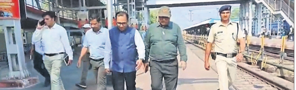
ରେଲ୍ୱେ ମହାପ୍ରବନ୍ଧକ ବିକାଶ କାର୍ଯ୍ୟ ସମୀକ୍ଷା କରୁଛନ୍ତି।

ରାଉରକେଲା, ୪୧୪ (ବିପ୍ଳବ ରଞ୍ଜନ ଦାଶ) ଏପ୍ରିଲ ୧ ତାରିଖ ଓଡ଼ିଶା ଦିବସ ଉପଲକ୍ଷେ ହୋଇଛି 'ଓଡ଼ିଆ ପକ୍ଷ-୨୦୨୬'। ଏହି କ୍ରମରେ ଶୁକ୍ରବାର ପାଳନ କରାଯାଇଥିଲା ଓଡ଼ିଆରେ ନାମଫଳକ ଲେଖା ଅଭିଯାନ। ଏହି ପରିଚ୍ଛେପରେ ସୁନ୍ଦରଗଡ଼ ଜିଲ୍ଲା ପ୍ରଶାସନ ଓ ଜିଲ୍ଲା ଶ୍ରମ ବିଭାଗ ପକ୍ଷରୁ ରାଉରକେଲାରେ ଆୟୋଜନ କରାଯାଇଥିଲା ଓଡ଼ିଆ ନାମଫଳକ ସଚେତନତା ପଦଯାତ୍ରା ଅଭିଯାନ।