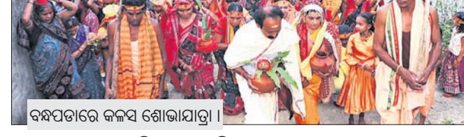
ବନ୍ଧପଡ଼ାରେ କଳସ ଶୋଭାଯାତ୍ରା।