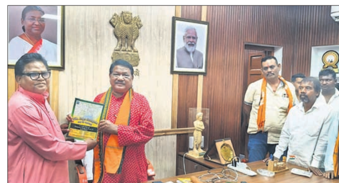
କେନ୍ଦ୍ରମନ୍ତ୍ରାଳୟ ଓରାମଳ ପୁସ୍ତକ ଉପହାର ଦିଆଯାଇଛି।