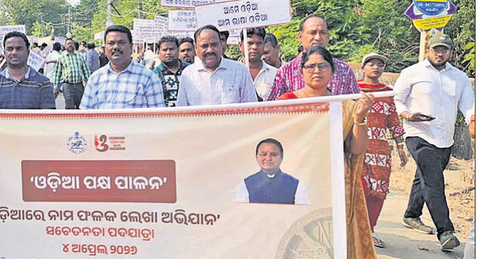
ସଚେତନତା ପଦଯାତ୍ରା ବଲାଙ୍ଗୀର ସହର ପରିକ୍ରମା କରୁଛି।