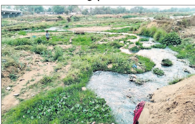
ବରଗଡ଼, ୪୪ (ପ୍ରେମାନନ୍ଦ ଖମାରୀ)

■ ନଦୀରେ ମିଶୁଛି ସହରରୁ ନିଷ୍କାସିତ ନର୍ଦ୍ଦମା ପାଣି ■ ରୋଗରେ ଆକ୍ରାନ୍ତ ହେଉଛନ୍ତି ଲୋକେ