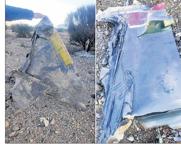
ଭରାନ୍ ପକ୍ଷରୁ ଜାରି କରାଯାଇଥିବା ଆମେରିକୀୟ ମୁକ୍ତ ବିମାନର ଭଗ୍ନାବଶେଷ ।

ମଧ୍ୟପ୍ରାନ୍ୟରେ ଚାଲିଥିବା ମୁକ୍ତ ବିମାନ ଚାଷ ମୋଡ଼ ନେଇଛି । ୨୪ ଘଣ୍ଟା ମଧ୍ୟରେ ଭରାନ୍‌ର ପ୍ରତିରକ୍ଷା ବାହିନୀ ଆମେରିକୀୟ ୨ଟି ଅତ୍ୟାଧୁନିକ ମୁକ୍ତବିମାନ 'ଏଫ୍-୧୫'କୁ ଖସାଇ ଚଳାଇ ଏବଂ 'ଏ-୧୦' ପ୍ରାୟୋଗକୁ ଖସାଇ ଦେଇଛି । ଏହି ୨ ମୁକ୍ତବିମାନର କ୍ରମ ସମ୍ପର୍କରେ ଉଦ୍ଧାର କାର୍ଯ୍ୟରେ ନିଯୋଜିତ ଆମେରିକୀୟ ୨ଟି 'ଲୁନ୍ ହକ୍' ହେଲିକପ୍ଟର ମଧ୍ୟ ଭରାନ୍ ଆକ୍ରମଣର ଶିକାର ହୋଇଛି । ଏଫ୍-୧୫ ବିମାନରେ ଥିବା ୨ ପାଇଲଟଙ୍କ ମଧ୍ୟରୁ ଜଣେ ଉଦ୍ଧାର ହୋଇଥିବାବେଳେ ଅନ୍ୟ ଜଣେ ନିଖୋଜ ଅଛନ୍ତି । ସେହିପରି ଏ-୧୦ ବିମାନ ଆକ୍ରମଣ ଶିକାର ହେବା ପରେ କୁଏଟ୍ ଅଞ୍ଚଳରେ ଖସିପଡ଼ିଛି । କିନ୍ତୁ ଏହାର ପାଇଲଟ୍ ପାରାଚ୍ୟୁଟରେ ଓହ୍ଲାଇ ଜୀବନ ବଞ୍ଚାଇଥିବା ଜଣାପଡ଼ିଛି । ଏହି ଘଟଣାରୁ ଭରାନ୍ ଆକାଶମାନରେ ଆମେରିକୀୟ ସମ୍ପୂର୍ଣ୍ଣ ଆଧିପତ୍ୟ ଥିବା ନେଇ ରାଷ୍ଟ୍ରପତି ଡୋନାଲ୍ଡ ଟ୍ରମ୍ପ୍ କହିଥିବା ଦାବିକୁ ଶକ୍ତ ଧକ୍କା ଲାଗିଛି । ୨୦୨୬ ଫେବୃଆରୀ ୨୮ରେ ଆମେରିକା ଏବଂ ଇସ୍ରାଏଲ୍ ପକ୍ଷରୁ ଭରାନ୍ ଉପରେ ଅତର୍କିତ ଏୟାର ଷ୍ଟ୍ରାଇକ୍ କରାଯାଇଥିଲା । ସେତେବେଳେ ସାମରିକ ଓ ଅତ୍ୟାଧୁନିକ ଜ୍ଞାନକୌଶଳରେ ନିପୁଣ ଏହି ଦୁଇ ସହଯୋଗୀ ଭାବି ନ ଥିଲେ ମୁକ୍ତ ଏଡେ଼ନ୍ ଲୟର ଓ ନିଜକୁ ଶ୍ୱତିଗ୍ରସ୍ତ ହେବାକୁ ପଡ଼ିବ । ୫ ସପ୍ତାହର ମୁକ୍ତ ଭିତରେ ଭରାନ୍ ନିଜ ସୁପ୍ରିମ ଲିଡରଙ୍କୁ ହରାଇବା ସହ ତେହରାନକୁ ପ୍ରକୃତ ଶ୍ୱତି ସହିବାକୁ ପଡ଼ିଛି । କିନ୍ତୁ ସାମ୍ପ୍ରତିକ ଘଟଣାବଳୀକୁ ଦେଖିଲେ ମନେହେଉଛି, ସତେଯେପରି ଆମେରିକା ରାଷ୍ଟ୍ରପତି ଟ୍ରମ୍ପ୍ ଓ ଇସ୍ରାଏଲ୍ ପ୍ରଧାନମନ୍ତ୍ରୀ ବେନଜାମିନ୍ ନେତାନ୍ୟାହୁ ମୁକ୍ତର ଜାଲରେ ଫସିଯାଇଛନ୍ତି । ଟ୍ରମ୍ପ୍ ଏବେ ବାହିଲେ ବି ମୁକ୍ତ ବନ୍ଦ କରିପାରୁ ନାହାନ୍ତି । ତାଙ୍କ ଦେଶର ମୁକ୍ତବିମାନଗୁଡ଼ିକୁ ଭରାନ୍‌ର ଅର୍ଦ୍ଧସାମରିକ ବଳ 'ଇସ୍ରାଏଲିକ୍ ରିଭୋଲ୍ୟୁସନାରୀ ଗାର୍ଡ୍ କର୍' (ଆଇଆର୍ଜିସି) ଯେପରି ଖସାଇବାଲିଛି, ସେଥିରୁ ଗୋଟିଏ କଥା ପ୍ରମାଣିତ ହୋଇଛି ଯେ, ଭରାନ୍‌ର ସାମରିକ ମେନୁବେଣ୍ଡ ମଜଲୁକ୍ ରହିଛି । ଭରାନ୍‌ର ଚୈତ୍ତ ଲୋକରେ ମାଡ଼ିଆସିଥିବା ଆମେରିକା ଏବେ ନିଜ ତେହରାନର ଶିକାର ପାଇଯାଇଥିବା କୁହାଯାଉଛି ।