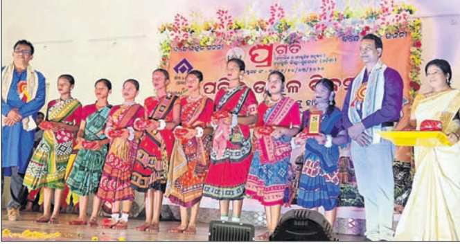
ଶ୍ରଦ୍ଧାଞ୍ଜଳି ସଭାରେ ଉପସ୍ଥିତ ଅତିଥି।

ରାଉରକେଲା, ୪୧୪ (ବିପ୍ଳବ ରଞ୍ଜନ ଦାଶ) ସାମାଜିକ ଓ ସାଂସ୍କୃତିକ ଅନୁଷ୍ଠାନ ପ୍ରଗତିର ଅଷ୍ଟମ ବାର୍ଷିକୋତ୍ସବ ଓ ଓଡ଼ିଶା ଦିବସ ଶୁକ୍ରବାର ପାଳିତ ହୋଇଯାଇଛି।