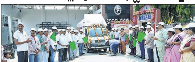
ସଚେତନତା ରଥର ଶୁଭାରମ୍ଭ କରାଯାଇଛି ।