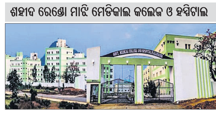
ଶହାଦ ରେଣୋ ମାଝି ମେଡିକାଲ କଲେଜ ଓ ହସ୍ପିଟାଲ

କଳାହାଣ୍ଡି ଜିଲ୍ଲାରେ ସ୍ୱାସ୍ଥ୍ୟସେବା କ୍ଷେତ୍ରରେ ନୂଆ ଫର୍ଦ୍ଦ ଯୋଡ଼ିଥିଲା ଶହାଦ ରେଣୋ ମାଝି ମେଡିକାଲ କଲେଜ ଓ ହସ୍ପିଟାଲ । ଭବାନୀପାଟଣାସ୍ଥିତ ଭଙ୍ଗାବୀରିରେ ପ୍ରାୟ ୪୮୧ କୋଟି ଟଙ୍କା ବ୍ୟୟରେ ୨୦୨୨ରେ ପ୍ରତିଷ୍ଠିତ ଏହି ଅନୁଷ୍ଠାନ ରୁଣାମୂଳକ ସେବା ଯୋଗାଇବ ବୋଲି ଜିଲ୍ଲାବାସୀ ଭାବିଥିଲେ । ହେଲେ ଏହା ଏବେ ଆଶାରେ ରହିଯାଇଛି । ଏଠାରେ ରୋଗୀସେବା ଅବ୍ୟାପ୍ୟ କାର୍ଯ୍ୟକ୍ରମ ହୋଇ ନ ଥିବାରୁ କେବଳ ଶିକ୍ଷାଦାନରେ ସମ୍ବୃଦ୍ଧି ସୀମିତ ରହିଛି । କେବଳ କଳାହାଣ୍ଡି ନୁହେଁ, ପଡ଼ୋଶୀ ନବରଙ୍ଗପୁର ଓ ଛତିଶଗଡ଼ ରାଜ୍ୟ ପାଇଁ ଆଶା ଭରସାରେ କେନ୍ଦ୍ର ପାଲଟିବ ଏତି କଲେଜ ଓ ହସ୍ପିଟାଲ । ଏଭଳି ଆଶା ସେବାକ୍ଷେତ୍ରରେ ରାଜ୍ୟ ସରକାର । କିନ୍ତୁ ଏହା ଅଧୁନା ରହିଛି । କାରଣ ଅବ୍ୟାପ୍ୟ ମେଡିକାଲ କଲେଜ ଓ ହସ୍ପିଟାଲ କୋଠା କାମ ସମ୍ପୂର୍ଣ୍ଣ ହୋଇନାହିଁ । ଅଧିକାଂଶ କୋଠା କେବଳ ମେଡିକାଲ ଛାତ୍ରଛାତ୍ରଣୀ ଶିକ୍ଷାଦାନ ବିଧାୟାଇଛି ।