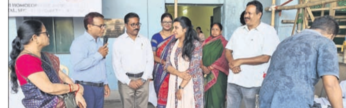
ଶିବିରରେ ଉପସ୍ଥିତ ଅତିଥିଙ୍କୁ ଜିଲ୍ଲାପାଳ।

ରାଉରକେଲା, ୪୧୪ (ବିପ୍ଳବ ରଞ୍ଜନ ଦାଶ) ରାଉରକେଲା ସେକ୍ଟର-୨୧ ଉଚ୍ଚମାନସି ଉଚ୍ଚମାନସି ହୋମିଓପାଥୀ ଉଷଧି ବିକାଶ ଓ ଚିକିତ୍ସା ପକ୍ଷରୁ ହୋମିଓପାଥୀ ଚିକିତ୍ସା କର୍ମକ୍ରମ ସାମ୍ବନ୍ଧରେ ହୋମିଓପାଥୀ ଏବଂ ଜାତୀୟ ହୋମିଓପାଥୀ ସମୁଦାୟ ଶୁକ୍ରବାର ପାଳିତ ହୋଇଯାଇଛି।