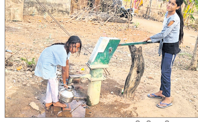
ମାଲପଡ଼ା ଗ୍ରାମରେ ଖରାପ ହୋଇଥିବା ନଳକୂପ ମରାମତି କରି ସ୍ୱାଭାବିକ କରାଯାଇଛି।

ମାଲପଡ଼ା ଗ୍ରାମରେ ଖରାପ ହୋଇଥିବା ନଳକୂପ ମରାମତି କରି ସ୍ୱାଭାବିକ କରାଯାଇଛି। ଲାଠୋର, ୪୪ (ଭୁବନେଶ୍ୱର ବାରିକ) କରୁଥିଲେ। ଏ ସମ୍ପର୍କରେ ପଞ୍ଚାୟତରାଜ କ୍ଷମାଧିକାରୀ କର୍ମଚାରୀଙ୍କ ଦୃଷ୍ଟି ଆକର୍ଷଣ କରାଯାଇଥିଲେ ମଧ୍ୟ କୌଣସି ସୁଫଳ ମିଳି ନ ଥିଲା। ତେବେ ଗ୍ରାମବାସୀଙ୍କ ଅଭିଯୋଗ ଅନୁଯାୟୀ ଶୁକ୍ରବାର ଦୈନିକ ଧରିତ୍ରୀରେ 'ଜଳ ଯୋଗାଣ ସ୍ୱାଭାବିକ କରିବାକୁ ଦାବି' ଶୀର୍ଷକ ଖବର ପ୍ରକାଶ ପାଇଥିଲା। ଏହାପରେ କ୍ଷମାଧିକାରୀ ଗ୍ରାମ୍ୟ ଜଳଯୋଗାଣ ଓ ପରିମଳ ବିଭାଗ ପକ୍ଷରୁ ଉକ୍ତ ପରିସର ନିର୍ଦ୍ଧାରଣ କରୁଥିବା ବେଳେ ଏହା ଫଳରେ ଗ୍ରାମବାସୀ ସୁବିଧାରେ ଉକ୍ତ ନଳକୂପ ପାନୀୟ ଜଳ ସଂଗ୍ରହ କରୁଥିବା ଦେଖିବାକୁ ମିଳିଥିଲା।