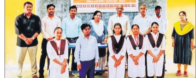
କାର୍ଯ୍ୟକ୍ରମରେ ଯୋଗଦେଇଥିବା ଅଧ୍ୟାପିକା ଅଧ୍ୟାପକ ଓ ଛାତ୍ରଛାତ୍ରଣୀ ।