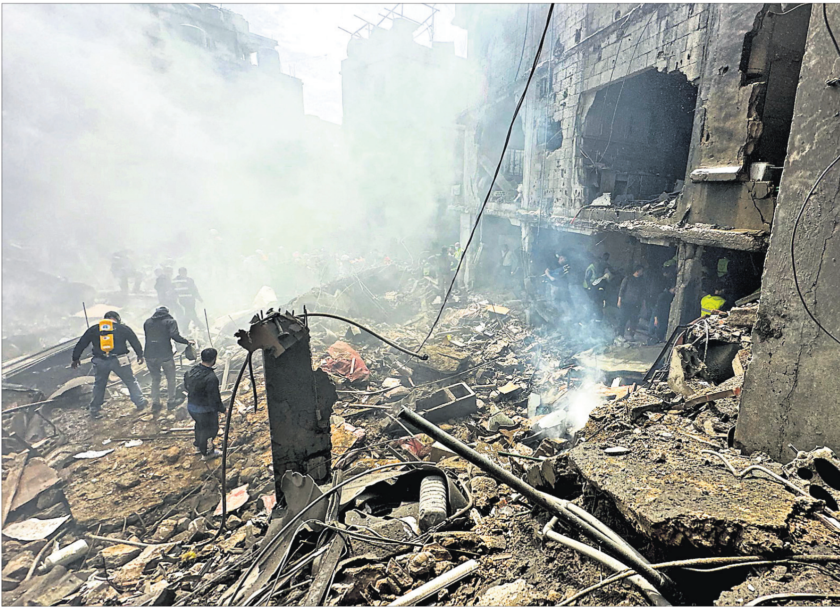
ଇସ୍ପାଏଲ୍ ପକ୍ଷରୁ ରବିବାର ଲେବାନନ୍‌ର ବିରୁଦ୍ଧରେ କନାହ ଅଞ୍ଚଳରେ କରାଯାଇଥିବା ଏୟାର ଷ୍ଟ୍ରାଇକ୍‌ରେ ବିଧ୍ୱସ୍ତ କୋଠାରୁ ଉଦ୍ଧାର କାର୍ଯ୍ୟ କରାଯାଇଛି ।