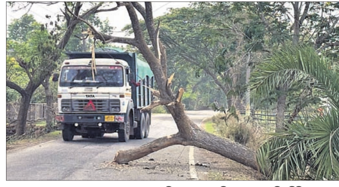
ଏନ୍‌ଏଚ୍-୨୦ କୁଳେଇପଦା ଛକ ନିକଟରେ ଉପରୁ ପଡ଼ିରହିଛି ଗଛ ।

ଗନ୍ଧବଳି ବୁକର କୁଳେଇପଦା ଛକ ନିକଟରେ ୨୦ ନଂ. କାଟାୟ ରାଜପଥରେ ଶନିବାର ଅପରାହ୍ନରେ ହୋଇଥିବା କାଳବୈଶାଖୀ ପ୍ରଭାତରେ ଗୋଟିଏ ଗଛ ଉପରୁ ପଡ଼ି ରାସ୍ତା ଅବରୋଧ ହୋଇଥିଲା । ରାସ୍ତାରେ ଗଛ ପଡ଼ି ରହିଥିବାରୁ ୨ ପାଖରେ ବହୁ ଯାନ ଅଟକି ରହିଥିଲା । ସ୍ଥାନୀୟ ଲୋକେ ତାଳ କାଟି ଅଧାରାସ୍ତ୍ର ସଫା କରିବାକୁ ଗମନାଗମନ ସ୍ଥିତିରେ ସୁଧାର ଆସିଥିଲା । ଏହାମଧ୍ୟରେ ୩ଦିନ ବିତିଯାଇଥିଲେ ମଧ୍ୟ ସେହି ଗଛ ସେମିତି ରାସ୍ତାରେ ପଡ଼ିରହିଛି । ଧାମନଗର ବନ ବିଭାଗ କର୍ମଚାରୀଙ୍କ ଦ୍ୱାରା ଆରମ୍ଭ କରି ନନ୍ଦ ଦାସିନ୍ଦ୍ର କୁଲାଇଥିଲେ । ଅଗ୍ନିଶମ ବାହିନୀ କେହି ସେଠାରେ ପହଞ୍ଚି ନାହାନ୍ତି । ଫଳରେ ରାତି ବେଳା ଏହି ସ୍ଥାନ ଦୁର୍ଘଟଣା ଜୋର୍ ପାଳିଛି । ସୋମବାର ଏହି ରାସ୍ତା ଦେଇ ଶତାଧିକ ଯାନ