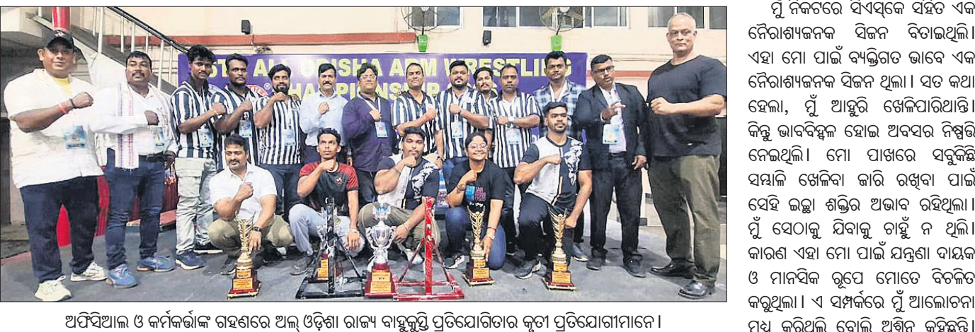
ଅପିସିଆଇ ଓ କର୍ମକର୍ତ୍ତାଙ୍କ ଗହଣରେ ଅଲ୍ ଓଡ଼ିଶା ରାଜ୍ୟ ବାହୁକୃଷ୍ଣ ପ୍ରତିଯୋଗିତା କୃତୀ ପ୍ରତିଯୋଗୀମାନେ ।

ଅଧିକାରୀଙ୍କୁ ସେହିପରି ମହିଳା ବର୍ଗରେ କିଚ୍ ଚାମ୍ପିୟନ, କୋଲ୍ଲୁପୁର ଶିବାଜୀ ବିଶ୍ୱବିଦ୍ୟାଳୟ ରନରାଜ୍ୟ, ଚଣ୍ଡିଗଡ଼ ବିଶ୍ୱବିଦ୍ୟାଳୟ ତୃତୀୟ ଓ କିଚ୍ ବିଶ୍ୱବିଦ୍ୟାଳୟ ଚତୁର୍ଥ ହୋଇଛି ।