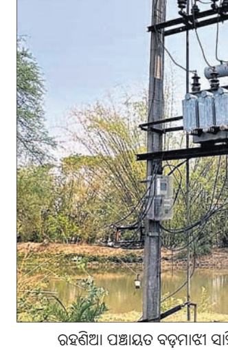
ରହଣିଆ ପଞ୍ଚାୟତର ବଡ଼ମାଟୀ ସାହି ନିକଟରେ ମୁକୁଳା ପଡ଼ିଥିବା ଗ୍ରାହ୍ୟତା ।

ରହଣିଆ ପଞ୍ଚାୟତର ବଡ଼ମାଟୀ ସାହି ନିକଟରେ ମୁକୁଳା ପଡ଼ିଥିବା ଗ୍ରାହ୍ୟତା