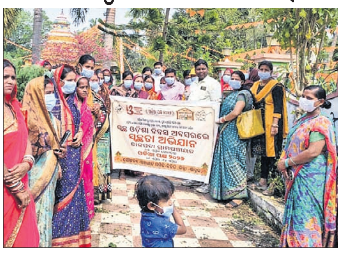
କାନ୍ତକବିଙ୍କ ପୀଠରେ ସ୍ମୃତୀ ଅଭିଯାନ ।