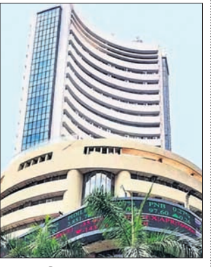
ବିସ୍ତାରିତ ସେକ୍ଟର ୭୪, ୧୦୭.୮୫ (+୭୮୭.୩୦)

ଅଧୀନରେ ତିନିଜନ, କର୍ମଶାଳା ଏବଂ ଲୋକେ ସେତୁଗୁଡ଼ିକରେ ନିରନ୍ତର ଓ କେନ୍ଦ୍ରିତ ଭାବେ ଚାଲିଥିବା ସ୍ୱଚ୍ଛତା ଅଭିଯାନର ଫଳସ୍ୱରୂପ ଏହି ସଫଳତା ହାସଲ ହୋଇଛି। ଏହି ପଦକ୍ଷେପଗୁଡ଼ିକ କେବଳ ରାଜସ୍ୱ ବୃଦ୍ଧିକୁ ଦରାଦିତ କରିନାହିଁ, ବରଂ ସ୍ୱଚ୍ଛ ପରିବେଶ, ଉନ୍ନତ ସୁରକ୍ଷା ମାନବତା ଏବଂ ପରିଚାଳନାଗତ କାର୍ଯ୍ୟକ୍ରମଗୁଡ଼ିକ ବୃଦ୍ଧିରେ ମଧ୍ୟ ଉଲ୍ଲେଖନୀୟ ଭାବେ ସହାୟକ ହୋଇଛି। ୪୦,୩୪୨ ମେଟ୍ରିକ ଟନ୍ରୁ ଅଧିକ ପରିଷ୍କୃତ ରେଳ ଏବଂ ରେଳପଥ ସାମଗ୍ରୀ, ୫ ଲକ୍ଷରୁ ଅଧିକ ଟିଏସ୍‌ସି ଡ୍ରିପର ଏବଂ ବହୁ ପରିମାଣର ଲୋହି ସ୍ଥାପ୍ ବିନିଯୋଗ ସାମଗ୍ରୀ ଏଥିରେ ରହିଛି। ଏହାବ୍ୟତୀତ ବୈଦ୍ୟୁତିକ ଏବଂ ଡିଜେଲ ଇଞ୍ଜିନ, କୋଚ ଏବଂ ଖାଗନକୁ ନେଇ ଗଠିତ ବୋଲିଙ୍ଗ ଷ୍ଟକ୍ସ ଦକ୍ଷତାର ସହ ନିର୍ମାଣ କରାଯାଇଥିଲା।