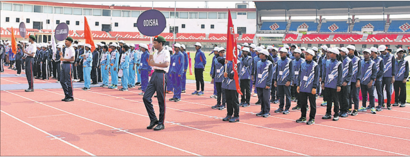
କଳିଙ୍ଗ ଷ୍ଟାଡ଼ିୟମରେ ଯୋମବାର ଆରମ୍ଭ ହୋଇଥିବା ଜାତୀୟ ବିଦ୍ୟାଳୟ ସମୂହ ରଙ୍ଗୀ ଚାମ୍ପିୟନଶିପ୍ରେ ଅଂଶଗ୍ରହଣ କରିଥିବା ଓଡ଼ିଶା ସମେତ ବିଭିନ୍ନ ଦଳର ଖେଳାଳି ।