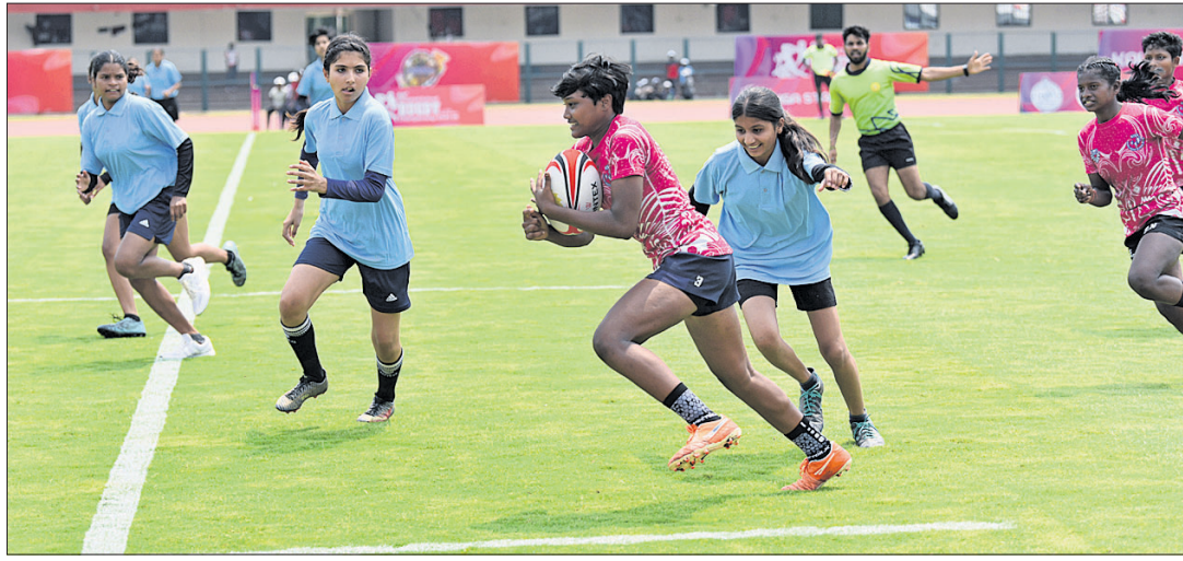
ବାଳିକା ବିଭାଗରେ ଅନୁଷ୍ଠିତ ଏକ ମ୍ୟାଚ ।