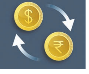
୧ ଡଲାର = ୧୨.୯୯ ଟଙ୍କା