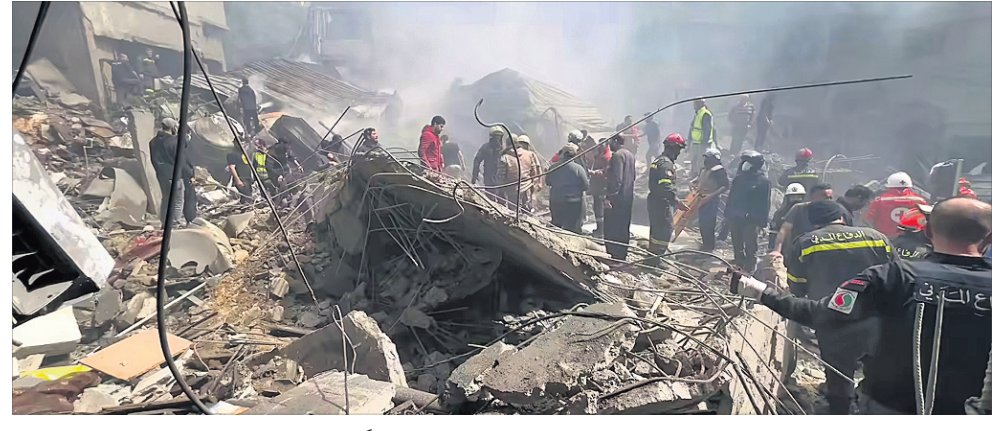
ତେହରାନର ଶରିଫ୍ ମୁନିକର୍ପିଟ୍ ଅର୍ଡ୍ଡ୍ ଟେକ୍ନୋଲୋଜି ପରିସରରେ ଇସ୍ରାଏଲ୍ ଏୟାରଷ୍ଟ୍ରାଇକ୍।

ସାଉଥ୍ ପାର୍ସ ପେଟ୍ରୋକେମିକାଲ ପ୍ଲାଣ୍ଟ ଉପରେ ଆକ୍ରମଣ