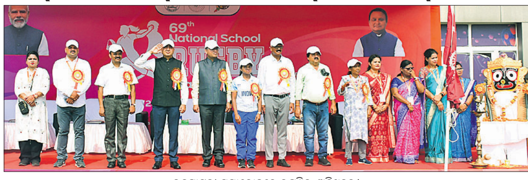
ଉଦ୍‌ଘାଟନୀ ସମାରୋହରେ ଉପସ୍ଥିତ ଅତିଥିବୃନ୍ଦ ।

କଳିଙ୍ଗ ଷ୍ଟାଡ଼ିୟମରେ ୬୯ତମ ଜାତୀୟ ବିଦ୍ୟାଳୟ ସମୂହ (ଏସ୍‌କେଏଫ୍‌ଆଇ) ୧୪ ଓ ୧୭ ବର୍ଷରୁ କମ୍ ବାଳିକା ଓ ବାଳକ ରଙ୍ଗୀ ଚାମ୍ପିୟନଶିପ୍ ଯୋମବାର ଆରମ୍ଭ ହୋଇଛି । ଏହି ଜାତୀୟ ପ୍ରତିଯୋଗିତାରେ ବିଭିନ୍ନ ରାଜ୍ୟର ରଙ୍ଗୀ ଖେଳାଳି ଅଂଶଗ୍ରହଣ କରିଛନ୍ତି ।