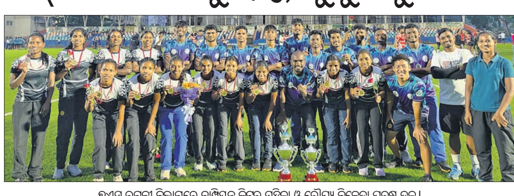
୬ଏସ୍ ରଙ୍ଗୀ ବିଭାଗରେ ଚାମ୍ପିୟନ କିଚ୍ ମହିଳା ଓ ରୌପ୍ୟ ବିଜେତା ପୁରୁଷ ଦଳ ।