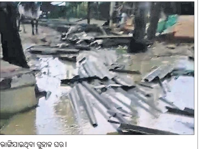
ଭାଙ୍ଗିଯାଇଥିବା ଗୃହାଳୟ ଘର।

ଐପଦା ଅଞ୍ଚଳର କାଳବୈଶାଖୀ ପ୍ରଭାବରେ ଜୋର ପବନ ବହିବା ସହ ବର୍ଷା ଓ କୁଆପଥର ମାଡ଼ ହେବାରୁ ବିଭିନ୍ନ ସ୍ଥାନରେ କ୍ଷତି ଘଟିଛି। ଅପରାହ୍ନ ପ୍ରାୟ ୪ଟାରେ ହଠାତ୍ ଆକାଶରେ କଳା ବାଦଲ ଘୋଟି ଆସି ଜୋରରେ ପବନ ବହିବା ସଙ୍ଗେ ବର୍ଷା ସହିତ କୁଆପଥର ମାଡ଼ ହୋଇଥିଲା। ଜୋର ପବନ ବହିବାରୁ ବିଭିନ୍ନ ସ୍ଥାନରେ