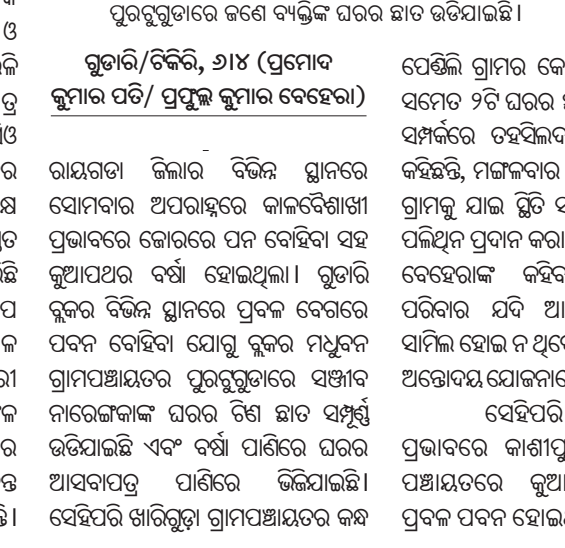
ପୂରସ୍ତୁତାରେ ଜଣେ ବ୍ୟକ୍ତିଙ୍କ ଘର ଛାତ ଉଡ଼ିଯାଇଛି ।