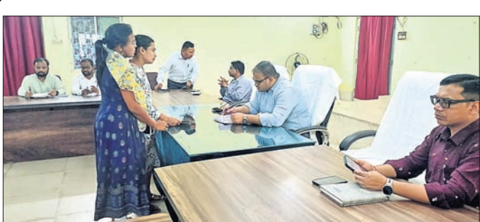
ଶିବିରରେ ଅଧିକାରୀମାନେ ଅଭିଯୋଗର ଶୁଣାଣି କରୁଛନ୍ତି।

ମାଲକାନଗିରି ଜିଲ୍ଲା ପ୍ରଶାସନ ପକ୍ଷରୁ ଜନସାଧାରଣଙ୍କ ସମସ୍ୟାର ଦୂରନ୍ତ ସମାଧାନ ପାଇଁ ବାଲିମେଳା ଗଠନ ହଲ୍‌ଠାରେ ଏକ ମୁକ୍ତ ଜନ ଶୁଣାଣି ଓ ଅଭିଯୋଗ ଶୁଣାଣି ଶିବିର ଯୋଗଦାନ ଅନୁଷ୍ଠିତ ହୋଇଛି।