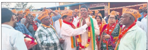
ପ୍ରତିଷ୍ଠା ଉତ୍ସବରେ ଭାଜପା କର୍ମକର୍ତ୍ତା।