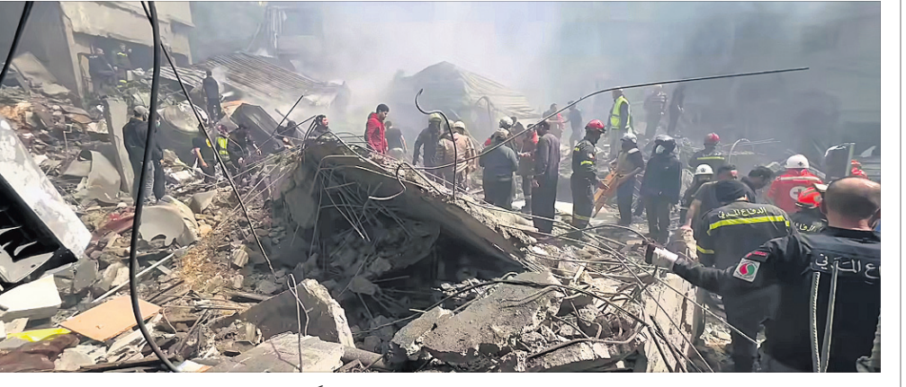
ଚେନ୍ନାଇର ଶରିଫ୍ ଯୁନିଭର୍ସିଟି ଅର୍ଥ ଚେନ୍ନାଇକୁ ପରିସରରେ ଇସ୍ତାସ୍କର ଏୟାରଷ୍ଟ୍ରାଇକ୍।

ଈସ୍ତାସ୍କ ଏବଂ ଆମେରିକା ଯୋଗଦାନ ଭାରତ ବିଜିଏ ଅଞ୍ଚଳରେ ଜୁମାଗତ ଆକ୍ରମଣ କରି ରଖିବାରୁ ୨୫ରୁ ଉର୍ଦ୍ଧ୍ୱ ଲୋକଙ୍କ ମୃତ୍ୟୁ ଘଟିଛି। ଈରାନର ସାଉଥ୍ ପାର୍ସ ପ୍ରାକୃତିକ ଗ୍ୟାସ୍ ଫିଲ୍ଡ୍ ଏବଂ ପେଟ୍ରୋକେମିକାଲ ପ୍ଲାଣ୍ଟ ଉପରେ ଇସ୍ତାସ୍କ ଆକ୍ରମଣ କରିଥିବାବେଳେ ଚେନ୍ନାଇ ମିଶାଲରେ ଏହାର ଜବାବ ଦେଇଛି। ଇସ୍ତାସ୍କ ଏବଂ ଏହାର ସହଯୋଗୀ ଉପସାଗରୀୟ ଆରବ କେଶରୁଡ଼ିକ ଉପରେ ଈରାନ ଆକ୍ରମଣ କରିଛି। ସ୍ୱେଚ୍ଛା ଅର୍ଥ ହର୍ମୁଜ୍ ଖୋଲିବା ପାଇଁ ଆମେରିକା ରାଷ୍ଟ୍ରପତି ଡୋନାଲ୍ଡ୍ ଟ୍ରମ୍ପ୍ ଦେଇଥିବା ମହଲତ ସମୟଯାମା ଶେଷ ହେବାକୁ ଯାଉଥିବାବେଳେ ମଧ୍ୟସ୍ତରରେ ଉଭୟ ପକ୍ଷକୁ ନୂଆ