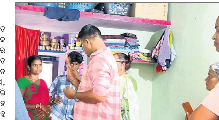
ପ୍ରଶାସନିକ ଅଧିକାରୀ ପରିବାର ଲୋକଙ୍କୁ ବୁଝାଉଛନ୍ତି ।