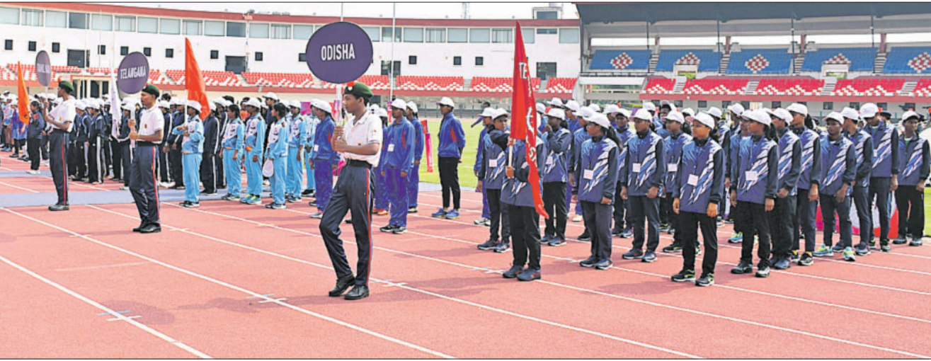
କଳିଙ୍ଗ ଷ୍ଟାଡ଼ିୟମରେ ଯୋଗବାର ଆରମ୍ଭ ହୋଇଥିବା ଜାତୀୟ ବିଦ୍ୟାଳୟ ସମୂହ ରଙ୍ଗୀ ଚାମ୍ପିୟନଶିପ୍ରେ ଅଂଶଗ୍ରହଣ କରିଥିବା ଓଡ଼ିଶା ସମେତ ବିଭିନ୍ନ ଦଳର ଖେଳାଳି ।