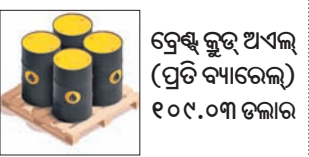
ଟ୍ରେଣ୍ଡ କ୍ରମ ଅଧିକ (ପ୍ରତି ବ୍ୟାରେଲ) ୧୦୦.୦୩ ଡଲାର