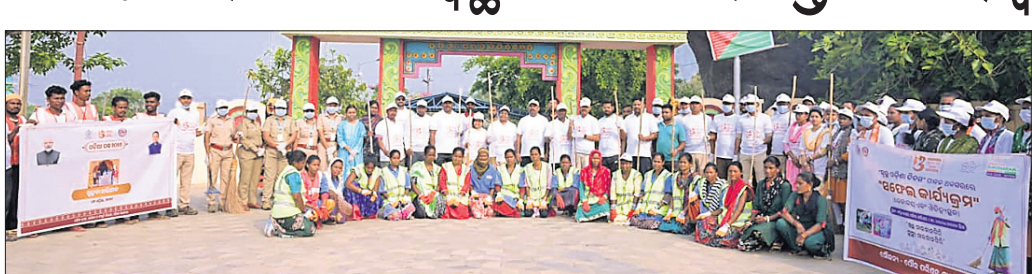
ସ୍ୱଚ୍ଛତା ଅଭିଯାନରେ ସାମିଲ ହୋଇଥିବା ଜିଲ୍ଲାପ୍ରଧାନ ଅଧିକାରୀ ଓ ସଫେଇ କର୍ମଚାରୀମାନେ।