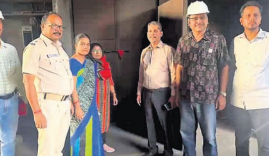
ପ୍ରତ୍ୟୁଷ ବୋର୍ଡ୍, ଜିଲ୍ଲା ପ୍ରଶାସନ ଓ ପୋଲିସ୍ ଅଧିକାରୀଙ୍କ ଉପସ୍ଥିତିରେ ରେଙ୍ଗାଳିସ୍ଥିତ ଶ୍ୟାମ ମୋଟାଲିଟ୍ସ୍ ଏନର୍ଜି ଲିମିଟେଡ୍‌କୁ ସିଲ୍ କରାଯାଇଛି।

ସମଲପୁର/ରେଙ୍ଗାଳି, ୬/୪ (ପ୍ରମୋଦ ବହିସାର/ବେବ୍ରତ ପଣ୍ଡା) ପରିବେଶ ସୁରକ୍ଷା ନିୟମ ଉଲ୍ଲଙ୍ଘନ ପାଇଁ ସମଲପୁର ଜିଲ୍ଲା ରେଙ୍ଗାଳି ବ୍ଲକ୍ ପଞ୍ଚୋଲୋକସ୍ଥିତ ଶ୍ୟାମ ମୋଟାଲିଟ୍ସ୍ ଆଣ୍ଡ୍ ଏନର୍ଜି ଲିମିଟେଡ୍ ବିରୋଧରେ କେନ୍ଦ୍ରୀୟ ପ୍ରତ୍ୟୁଷ ନିୟନ୍ତ୍ରଣ ବୋର୍ଡ୍ (ସିପିସିବି) କଠୋର ଆଭିମୁଖ୍ୟ ଗ୍ରହଣ କରିଛି। ସୋମବାର ସକାଳୁ କମ୍ପାନୀର ଏକାଧିକ ଗୁରୁତ୍ୱପୂର୍ଣ୍ଣ ସ୍ଥିତିକୁ ସିଲ୍ କରି ଦିଆଯାଇଛି। ପିସିସିବି ପକ୍ଷରୁ ଗତ ମାର୍ଚ୍ଚ ୩୦ ତାରିଖରେ କାରି ଏକ ନିର୍ଦ୍ଦେଶନାମା ଅନୁସାରେ ପରିବେଶ(ସୁରକ୍ଷା) ଆଇନ ୧୯୮୬ର ଧାରା ୫ ଅନୁଯାୟୀ ଜିଲ୍ଲା ମାଜିଷ୍ଟ୍ରେଟ୍ ଆଦେଶ ଅନୁଯାୟୀ ଏହି କାର୍ଯ୍ୟାନୁଷ୍ଠାନ