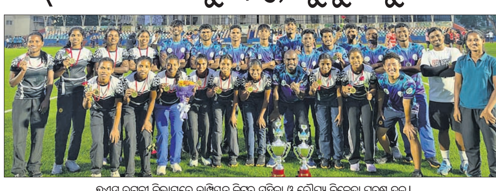
୬ଏସ୍ ରଙ୍ଗୀ ବିଭାଗରେ ଚାମ୍ପିୟନ କିଟ୍ ମହିଳା ଓ ରୌପ୍ୟ ବିଜେତା ପୁରୁଷ ଦଳ ।