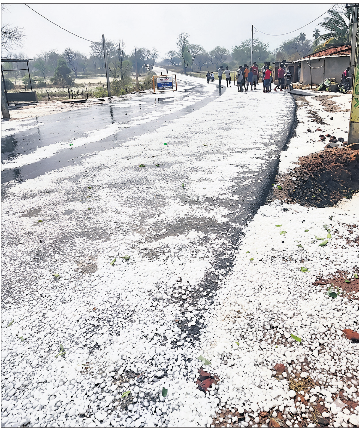
ସୋମବାର ମଧ୍ୟାହ୍ନରେ କାଳବେଶାଖୀ ବର୍ଷାରେ ବଳାଙ୍ଗୀର ଜିଲ୍ଲା ପାଟଣାଗଡ଼ ବ୍ଲକର ମୁଖ୍ୟ ରାସ୍ତା ଉପରେ କୁଆପଥର ବିଛାଡ଼ି ହୋଇପଡ଼ିଛି।

ପୁରୁଣା। ତେବେ କୋରକବରପଦ୍ମ କାହା ଉପରେ ଭାଷା ଲଦି ଦିଆଯିବା ଗ୍ରହଣୀୟ ନୁହେଁ। ହିନ୍ଦୀକୁ ଦେଶର ରାଷ୍ଟ୍ରୀୟ ଭାଷା କରିବା ଲାଗି ଥୋକେ ବାହାରି ପଡ଼ିଥିବା ବେଳେ ତାହା ଦକ୍ଷିଣ ଭାରତ ସମେତ ଆହୁରି ଅନେକ ରାଜ୍ୟରେ ଗ୍ରହଣଯୋଗ୍ୟ ହେଉନାହିଁ।