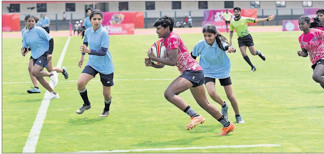
ବାଳିକା ବିଭାଗରେ ଅନୁଷ୍ଠିତ ଏକ ମ୍ୟାଚ ।