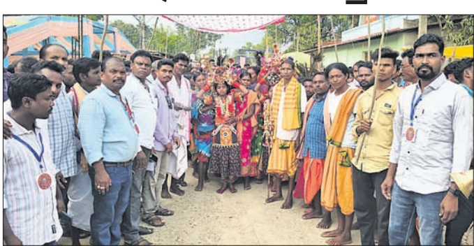
କଳସ ଯାତ୍ରାରେ ମା'ଙ୍କୁ ବିଦାୟ ଦିଆଯାଉଛି।

ନବରଙ୍ଗପୁର ଜିଲ୍ଲା ଠାକୁରାଣୀଙ୍କ ନବଦିନାମ୍ବକ ପଞ୍ଚାୟତ ସଦର ମହକୁମାରେ ଅଧିକାରୀ ଦେବା ମା' ଠାକୁରାଣୀଙ୍କ ନବଦିନାମ୍ବକ କଳସ ଯାତ୍ରା ଯୋଗଦାନ ଶେଷ ହୋଇଛି।