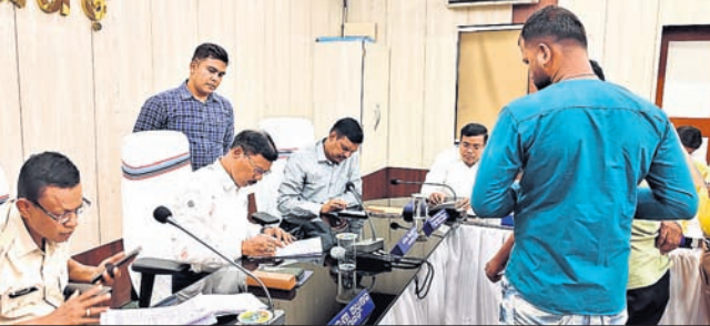
ଜିଲ୍ଲାପ୍ରଧାନ ଅଧିକାରୀମାନେ ଅଭିଯୋଗ ଶୁଣାଣି କରୁଛନ୍ତି ।