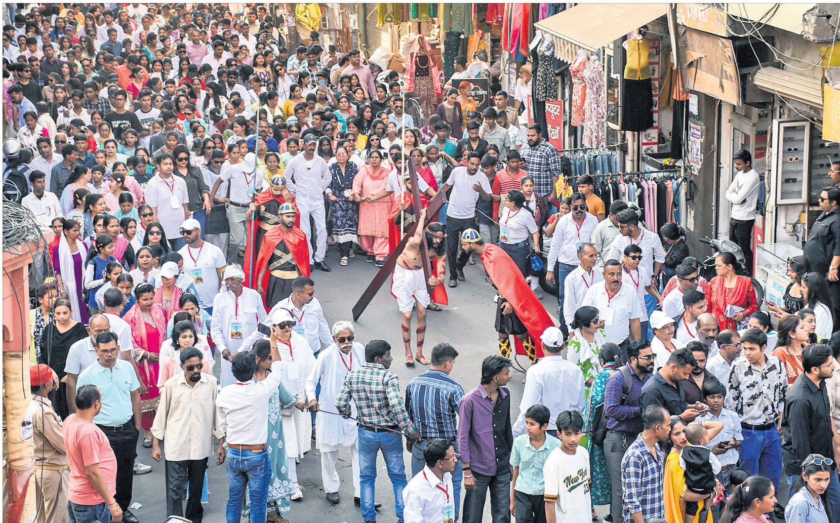
ଇଷ୍ଟର ମଣ୍ଡେ ଉତ୍ସବ ପାଳନ ଅବସରରେ ଉତ୍ତରପ୍ରଦେଶର ମୋରାଦାବାଦରେ ଯୋଗଦାନ ଲୋକେ ଏକ ଶୋଭାଯାତ୍ରାରେ ଭାଗ ନେଇଛନ୍ତି।