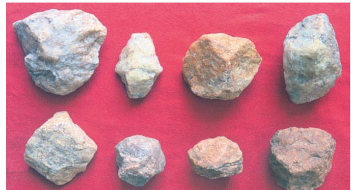
ସମ୍ପର୍କ ହୋଇଥିବା ପୁରାତନ ମଧ୍ୟ ପ୍ରସ୍ତର ମୁଗାୟ ମାନବ ସଭ୍ୟତାର ପଥର ଉପକରଣ।

ଓଡ଼ିଶାର ଦେବଗଡ଼ ଜିଲ୍ଲାରୁ ପ୍ରଥମ ପୁରାତନ ମଧ୍ୟ ପ୍ରସ୍ତର ମୁଗାୟ ମାନବ ସଭ୍ୟତାର (ପାଲୋଥେଲିଥ୍) ସମ୍ପର୍କ ମିଳିଛି। ପୁରାତନତତ୍ତ୍ୱ ବିଭାଗର ସମ୍ପର୍କୀୟ ଡାକ୍ତର ଡାକ୍ତରୀଙ୍କ ଦ୍ୱାରା ପ୍ରଦତ୍ତ ସର୍ବୋତ୍ତମ ମିଳିତ ତିନି ଏହି ବିଭିନ୍ନ ପ୍ରଥମ ପୁରାତନ ମଧ୍ୟ ପ୍ରସ୍ତର ମୁଗାୟ ସଭ୍ୟତାର ସମ୍ପର୍କ ମିଳିଛି। ପୁରା ପ୍ରତ୍ନତତ୍ତ୍ୱ ସର୍ବୋତ୍ତମ ଅଧ୍ୟାୟକ ଡାକ୍ତର ଦିବ୍ୟାକାନ୍ତ ସିଂହଙ୍କ ଦ୍ୱାରା ପ୍ରଦତ୍ତ ସର୍ବୋତ୍ତମ ସମ୍ପର୍କ ମିଳିଛି।