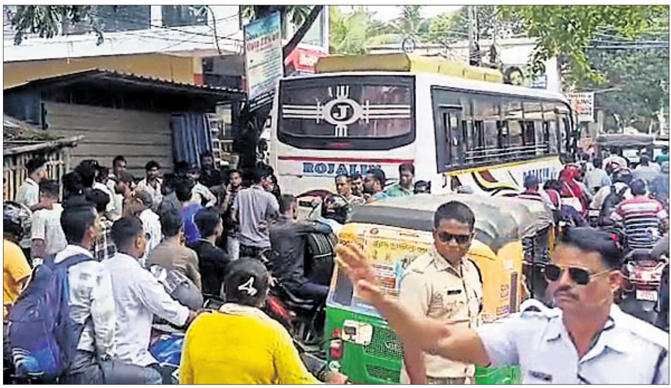
ଭଦ୍ରକ ସହର ଆରଡ଼ି ଛକ ନିକଟରେ ଯୋଗବାର ବସ୍ ଡ୍ରାଇଭର ଓ ଫଳ ବୋକାଳୀଙ୍କ ମଧ୍ୟରେ ବିବାଦ ଯୋଗୁଁ ବସ୍ ଅଟକି ରହିଥିବାରୁ ସର୍ଭିସ୍ ରୋଡ୍ କାମ୍ ହୋଇଛି।