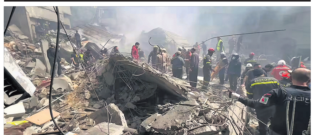
ତେହରାନର ଶରିଫ୍ ଯୁନିଭର୍ସିଟି ଅଫ୍ ଟେକ୍ନୋଲୋଜି ପରିସରରେ ଇସ୍ତାଫ୍‌ସ୍କର ଏୟାରଷ୍ଟ୍ରାଇକ୍।