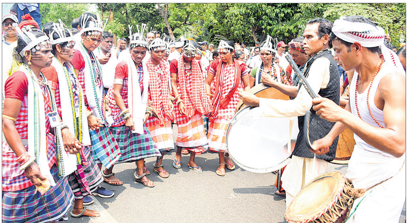
ଆଦିବାସୀଙ୍କ ଧର୍ମର ସମ୍ମାନ ରକ୍ଷା, ଜନଗଣନାରେ ପୂର୍ଣ୍ଣ କୋଡ୍, ବଡ଼ ଚାଲିଥିବା ଅତ୍ୟାଚାର ରୋକିବା ସହ ସ୍ୱତନ୍ତ୍ର କୋର୍ଟ ସ୍ଥାପନ ଆଦି ୨୦ ଦମ୍ପା ଦାବି ନେଇ ଆଦିବାସୀ ମହାସଂଘ ଓଡ଼ିଶା ପକ୍ଷରୁ ସୋମବାର ଭୁବନେଶ୍ୱର ଲୋକସଭା ପରିସରରେ ଅନୁଷ୍ଠିତ ସମାବେଶରେ ଆଦିବାସୀ ସମ୍ପ୍ରଦାୟର ଲୋକେ ବାବା ବଜାଇ ନାଚଗୀତ ମାଧ୍ୟମରେ ସରକାରଙ୍କ ଦୃଷ୍ଟି ଆକର୍ଷଣ କରୁଛନ୍ତି।