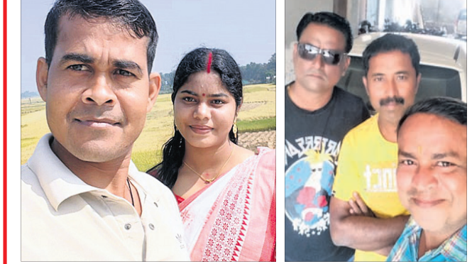
@ ବିଷୁ @ ବାସୁ