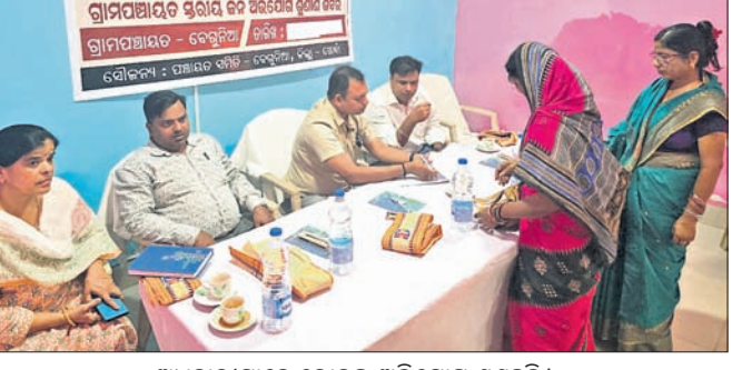
ଅଧିକାରୀମାନେ ଲୋକଙ୍କ ଅଭିଯୋଗ ଶୁଣୁଛନ୍ତି ।