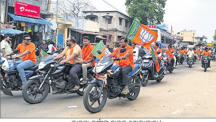
ଭାଜପା କର୍ମୀଙ୍କ ବାଇକ୍ ଶୋଭାଯାତ୍ରା।

ରାୟଗଡ଼ା କଲ୍ୟାଣସିଂହପୁର ବ୍ଲକରେ ଭାଜପାର ୪୭ତମ ପ୍ରତିଷ୍ଠା ଦିବସ