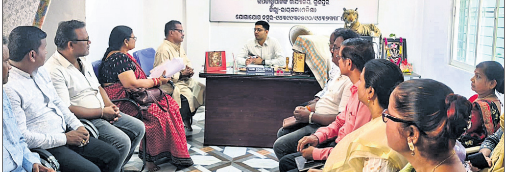
ବୈଠକରେ ଗୁଣପୁର ଉପଜିଲ୍ଲାପାଳ ଅଧିକାରୀଙ୍କ ସହ ଆଲୋଚନା କରୁଛନ୍ତି।