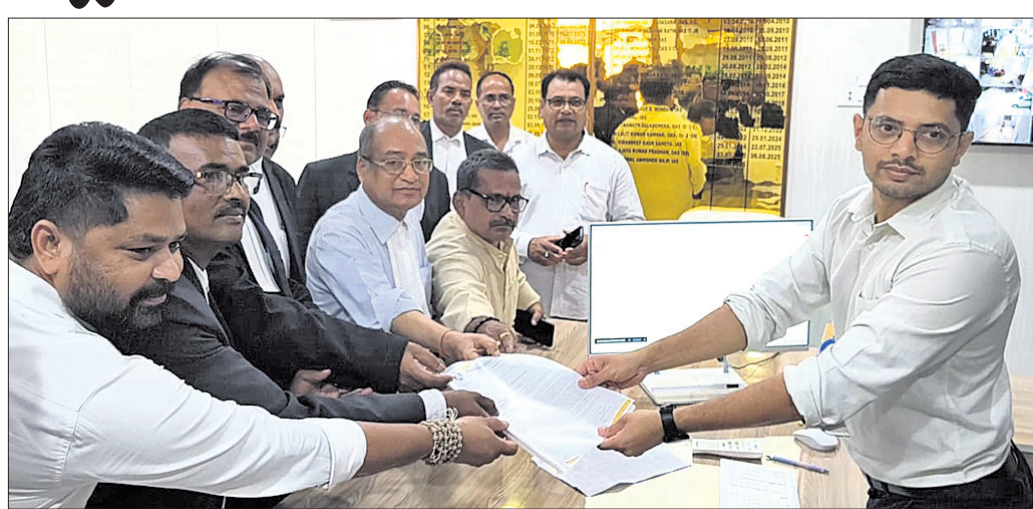
ଉପଜିଲ୍ଲାପାଳଙ୍କୁ ବାବଦପତ୍ର ପ୍ରଦାନ କରାଯାଇଛି।

ଆଶ୍ର-ଓଡ଼ିଶା ବଂଶଧାରୀ ନଦୀ ଜଳ ବିବାଦ ■ଓଡ଼ିଶା ସଂସଦ ପକ୍ଷରୁ ପ୍ରଧାନମନ୍ତ୍ରୀଙ୍କ ଉଦ୍ଦେଶ୍ୟରେ ଦାବିପତ୍ର