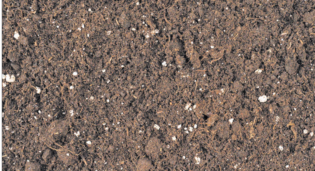
ଲାଲ ନିର୍ଗତ ହୁଏ । ଉକ୍ତ ଲାଲ ଦ୍ୱାରା ମାଟିର ସାଜସଜ୍ଜାରେ ଉନ୍ନତ ଘଟି ମାଟି ଉର୍ବରତା ବଢ଼େ । ମାଟିରେ ନିମାଗୋଡ଼, ପ୍ରୋଟୋଜୋଫା, ରୋଡିଫେରସ୍ ଆଦି ହାଇଡ୍ରୋଜନ୍ ସଲଫାଇଡ୍ ଏବଂ ଖାଲି ଆଖୁକୁ ଦିଶୁ ନ ଥିବା ପରଜୀବୀ, ଆମୋନିଆ ବାଷ୍ପ ଯୋଗୁ ହୋଇଥାଏ ବାଜାଣୁକ ଶରୀରରୁ ନିର୍ଗତ ବାସ୍ନା । ଓଡ଼ା ଏବଂ ସରସଜିଆ ମାଟିରେ କିଛି

ଏବଂ ଲାଲ ଦ୍ୱାରା କେତେକ ଫସଲର ଚେରରେ ଗଣ୍ଠି ସୃଷ୍ଟି ହୁଏ । କଦଳୀ ଏବଂ ଅନେକ ପନିପରିବା ଫସଲ, ଏହାଦ୍ୱାରା ମାଟିରୁ ଖାଦ୍ୟ ସଂଗ୍ରହକରି ନ ପାରି ରୋଗାକ୍ରାନ୍ତ ହୁଅନ୍ତି । ଏହାଦ୍ୱାରା ଫସଲ ଉତ୍ପାଦନରେ ବାଧା ସୃଷ୍ଟି ହୁଏ । ମାଟିରେ ଅନେକ ବଡ଼, କ୍ଷୁଦ୍ର ଏବଂ ଖାଲି ଆଖୁକୁ ଚୈବିକ ଅମ୍ଳ ନିର୍ଗତ ହୋଇ ମାଟିକୁ ଅମ୍ଳ ବାସ୍ନା ଦିଏ । ଉକ୍ତ ବାସ୍ନା ଦ୍ୱାରା ମାଟିରେ ଥିବା ଅନେକ ଉପକାରୀ ବାଜାଣୁର ବଂଶ ବୃଦ୍ଧି ଘଟି ମାଟିକୁ ଉର୍ବର କରନ୍ତି । ଅନେକ ଗଛର ସୂକ୍ଷ୍ମ ଚେର ମାଟିର କେତେକ ରୋଗ ବାଜାଣୁ ଦ୍ୱାରା ଆକ୍ରାନ୍ତ ହୋଇ ମାଟିକୁ ଦୁର୍ବଳ ବାସ୍ନା ଦିଅନ୍ତି । ଉକ୍ତ ବାସ୍ନା ସଲଫେର ଡାକଅଣ୍ଟାଇଡ୍,