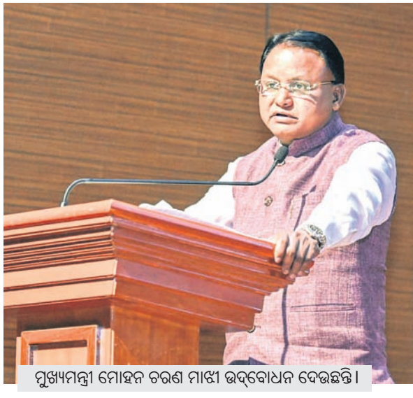
ମୁଖ୍ୟମନ୍ତ୍ରୀ ମୋହନ ଚରଣ ମାଝୀ ଉଦ୍‌ବୋଧନ ଦେଉଛନ୍ତି ।

ଭୁବନେଶ୍ୱର, ୭।୪ (ଉଦ୍ଦିଷ୍ଟ ନିଉଜ୍) ଭୁବନେଶ୍ୱରର ୨୦୨୬-୨୭ ବୃଦ୍ଧି ଉଦ୍ଦେଶ୍ୟକ ବଜେଟ ଘୋଷଣା କରାଯାଇଛି। ଏହା ୨୦୨୫-୨୬ ବୃଦ୍ଧି ଉଦ୍ଦେଶ୍ୟକ ବଜେଟରୁ ୨୦ ହଜାର କୋଟି ଟଙ୍କା ଅଧିକ ଖର୍ଚ୍ଚକୁ ଆଣିଛି।