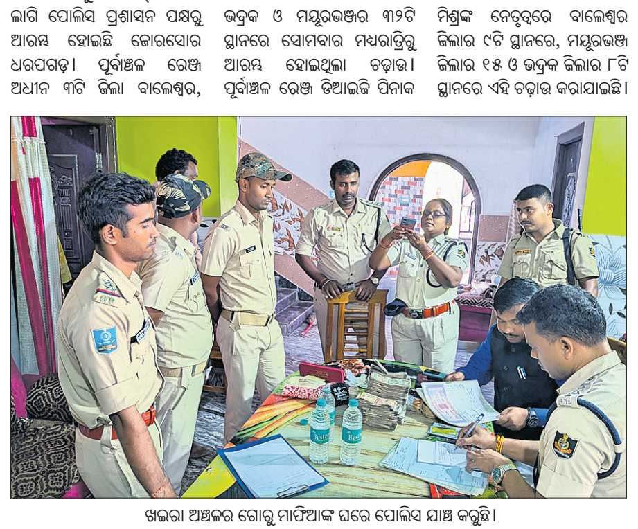
ଖଜରା ଅଞ୍ଚଳର ଗୋଟିଏ ମାପିଆକ୍ ଘରେ ପୋଲିସ୍‌ମାନଙ୍କ ଯାଞ୍ଚ କରୁଛି।

ମାପିଆକ୍ ଘରୁ ଜବତ ହୋଇଛି ବିପୁଳ ପରିମାଣର ଟଙ୍କା, ସୁନା ଓ ରୂପା ଅଳଙ୍କାର। ଗୋଟାଲୀରେ ବ୍ୟବହୃତ ବହୁ ରାଉନ୍ ଓ ଭ୍ୟାନ୍ ମଧ୍ୟ ଜବତ କରାଯାଇଛି। ଏପରିକି ଗୋ ମାପିଆକ୍ ଘରୁ ବହୁକ୍ରମେ ମାରଣାସ୍ତ୍ର ମିଳିଥିବା ତଥ୍ୟ ମିଳିଛି। ଉପରୋକ୍ତ ୩ଟି ଜିଲ୍ଲାର ମୋଟ ୩୨ଟି ସ୍ଥାନରେ ଏକକାଳୀନ ଚଢ଼ାଉ କରାଯାଇଥିଲା। ଏହି ଅପରେଶନରେ ୧୮ ପ୍ଲୁଗ୍‌ସ୍ ଫୋର୍ସ, ୮ ଅତିରିକ୍ତ ଏସ୍‌ପି, ୧୭ ଡିଏସ୍‌ପି, ୨୫ ଇନ୍‌ସପେକ୍ଟର, ୬୭ ସର୍ବ ଇନ୍‌ସପେକ୍ଟରଙ୍କ ସମେତ ଶହେରୁ ଊର୍ଦ୍ଧ୍ୱ ପୋଲିସ ସାମିଲ ହୋଇଥିଲେ। ଚଢ଼ାଉ ସମୟରେ ଭଦ୍ରକରୁ ୬, ମୟୂରଭଞ୍ଜରୁ ୬୫ଟି ଅଧିକମୂଲ୍ୟ ଅଟକ ରଖି ପୋଲିସ ପତରାଉତୁରା କରୁଛି। ବାଲେଶ୍ୱର ଗଞ୍ଜ ଥାନାର ୩ ଅଞ୍ଚଳ, ସର ଥାନାର ୩ ଅଞ୍ଚଳ, ଟିପ୍ପଣୀ-୧୧