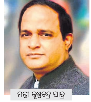
ମନ୍ତ୍ରୀ କୃଷ୍ଣଚନ୍ଦ୍ର ପାତ୍ର

ଭୁବନେଶ୍ୱର, ୭।୪ (ଉଦ୍ଦିଷ୍ଟ ନିଉଜ୍) ରାଜ୍ୟରେ ଅତ୍ୟାବଶ୍ୟକ ସାମଗ୍ରୀ ମହଜୁଦ କରିବା ପାଇଁ ନିର୍ଦ୍ଦେଶ ଦିଆଯାଇଛି। ଏହାଛଡ଼ା ଅତ୍ୟାବଶ୍ୟକ ସାମଗ୍ରୀର ଦରମାକୁ ନିୟନ୍ତ୍ରଣ କରିବା ପାଇଁ ମଧ୍ୟ ନିର୍ଦ୍ଦେଶ ଦିଆଯାଇଛି।