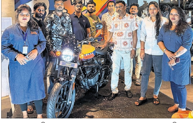
ରୟାଲ ଏୟର୍‌ଲାଇନ୍ସ ନୂଆ ବାଇକ୍ ହେଉଛି ୩୫୦ ଡାକ୍ତର ପ୍ରବେଶ କରାଯାଇଛି। କରାଯାଉଥିବାବେଳେ ସେଲ୍ ମୋମାବାରଠାରୁ ଏହାର ଶୁଭାରମ୍ଭ ହୋଇଛି।