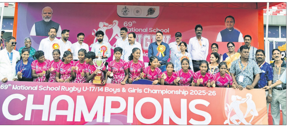
69th National School Rugby U-17/14 Boys & Girls Championship 2025-26 CHAMPIONS