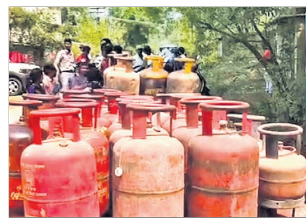
ରାଉରକେଲାରେ ଜବତ ହୋଇଥିବା ଗ୍ୟାସ୍ ସିଲିଣ୍ଡର।

ରାଉରକେଲା, ୭/୪ (ବିପ୍ଳବ ରଞ୍ଜନ ଦାଶ) ମଧ୍ୟପ୍ରାନ୍ତରେ ମୂଲ୍ୟ ଯୋଗୁ ଭାରତରେ ରକ୍ଷଣ ଗ୍ୟାସ୍ ସଫଟ ବେଶାଦେଇଛି। ଏକମିଶ୍ରଣ ପରିସ୍ଥିତିରେ ଗ୍ୟାସ୍ କଳାବଜାର ବଜାରରେ ଲାଗିଛି। ମଙ୍ଗଳବାର ରାଉରକେଲା ସେକ୍ଟର-୭ ଥାନା ଅଧୀନ ସେକ୍ଟର-୯ ଅଞ୍ଚଳର ଇ-ବ୍ଲକ୍‌ରେ ଥିବା ଏକ ଗ୍ୟାସ୍‌ସେକ୍ଟର ଯୋଗାଣ ବିଭାଗ ଏବଂ ପୋଲିସ ପକ୍ଷରୁ ମିଳିତ ଭାବେ ଚଢ଼ାଉ କରି ୧୨୧ଟି ଗ୍ୟାସ୍ ସିଲିଣ୍ଡର ଜବତ କରିଛି।