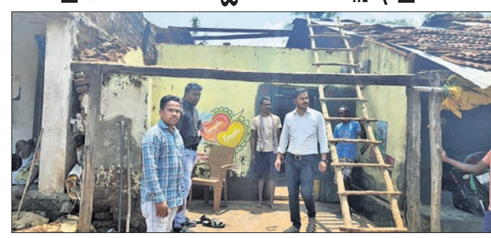
ଅତିରିକ୍ତ ବିଡିଓ କ୍ଷତିଗ୍ରସ୍ତ ପରିବାର ସହିତ ଆଲୋଚନା କରୁଛନ୍ତି।

ଆଶ୍ର-ଓଡ଼ିଶା ବଂଶଧାରୀ ନଦୀ ଜଳ ବିବାଦ ■ଓଡ଼ିଶା ସଂସଦ ପକ୍ଷରୁ ପ୍ରଧାନମନ୍ତ୍ରୀଙ୍କ ଉଦ୍ଦେଶ୍ୟରେ ଦାବିପତ୍ର