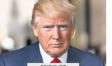
ଡୋନାଲ୍ଡ ଟ୍ରମ୍ପ ଓଡ଼ିଶା, ୭/୪

ଭରାଣ ମୁକ୍ତିଚିତ୍ତ ଭିଲ୍ ନ କରିବା ଏବଂ ସ୍ତେର୍ ଅଫ୍ ହର୍ମ୍ସକୁ ନ ଖୋଲିବାର ଭୟାନକ ପରିଣାମ ହେବାକୁ ଯାଉଛି। ଦିବସ ଶେଷ ସୁଦ୍ଧା ଭରାଣ ସଭ୍ୟତା ସମ୍ପୂର୍ଣ୍ଣ ଲୋପ ପାଇଯାଇପାରେ ବୋଲି ଆମରିକା ରାଷ୍ଟ୍ରପତି ଡୋନାଲ୍ଡ ଟ୍ରମ୍ପ ରୁପେ ସୋସିଆଲ୍ରେ ଲେଖିଛନ୍ତି। ସେ ଲେଖିଛନ୍ତି, ମଜଲକବାର ରାତିରେ ସମ୍ପୂର୍ଣ୍ଣ ସଭ୍ୟତା ମରିଯିବ ଓ ଆଉ କେବେ ଫେରିବ ନାହିଁ। ତେବେ ସେ ତାହା ହେବାକୁ ଚାହୁଁ ନାହାନ୍ତି, କିନ୍ତୁ ସମ୍ଭବତଃ ଘଟିବାକୁ ଯାଉଛି ବୋଲି କହିଛନ୍ତି। ସ୍ଥିତିକୁ ଦେଖି ଶେଷ ମୁହୂର୍ତ୍ତରେ ଆକ୍ରମଣକୁ ସ୍ଥଗିତ ରଖାଯାଇପାରେ। ବିଶ୍ୱର ଦୀର୍ଘ ତଥା ଛତିଳ ଇତିହାସରେ ମଜଲକବାର ରାତି ଅତ୍ୟନ୍ତ ଗୁରୁତ୍ୱପୂର୍ଣ୍ଣ ମୁହୂର୍ତ୍ତ ବୋଲି ଟ୍ରମ୍ପ କହିଛନ୍ତି। ଇତିମଧ୍ୟରେ ଆମେରିକା ସେନା ଭରାଣ ଉପରେ ଆକ୍ରମଣକୁ କୋରବାର କରିଛି। ମଜଲକବାର ଆମେରିକାର ଏୟାରଷ୍ଟ୍ରାଇକ୍ରେ ଭରାଣର ୨ଟି ବ୍ରିକ୍ ଓ ଗୋଟିଏ ରେକ୍ଟେଣ୍ଡେର ଷ୍ଟିଲ୍ ଗ୍ରହ ହୋଇଛି। ଭରାଣର ଟିକ ହବ୍ ଖାର୍ଗ ବାପରେ ଥିବା ସାମରିକ ଚାର୍ଜିଓସ୍ ଉପରେ ଆମେରିକା ଆକ୍ରମଣ କରିଛି। ଏହି ବାପ ଉପରେ ଆମେରିକା ସେନାର ଏହା ଦ୍ୱିତୀୟ ଆକ୍ରମଣ। ପୂର୍ବରୁ ଭରାଣକୁ ଦିଆଯାଇଥିବା ପୁଷ୍ପା-୪