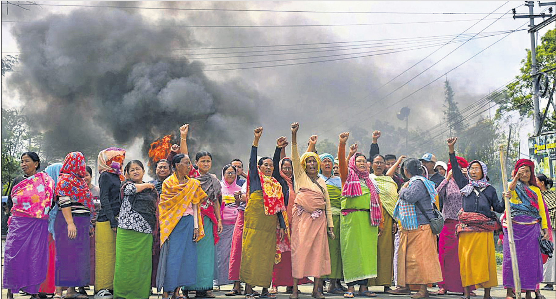
ମଣିପୁର ବିଷୁପୁରରେ ବୋମାମାଡ଼ରେ ୨ ଶିଶୁଙ୍କ ମୃତ୍ୟୁ ଘଟିବା ପରେ ଲୋକେ ରାସ୍ତା ଅବରୋଧ କରି ବିକ୍ଷୋଭ ପ୍ରଦର୍ଶନ କରୁଛନ୍ତି।

ଆର୍ଥିକ ପରିଚାଳନା କ୍ଷେତ୍ରରେ ମଧ୍ୟ ଓଡ଼ିଶା ଉନ୍ନତ ପ୍ରଦର୍ଶନ ସହ ଅନୁବାନ ଅର୍ଥ ଠିକ୍ ଭାବେ ବିନିଯୋଗ କରିବାରେ ସଫଳ ହୋଇଛି। ଅମୃତ ୨.୦ କ୍ରିଆରେ ରାଜ୍ୟର ଜଳ ଭିତ୍ତିଭୂମିକୁ ସୁଦୃଢ଼ କରାଯାଇଛି। ୭ଟି ଜଳ ବିଶୋଧନ ପ୍ଲାଣ୍ଟ ମାଧ୍ୟମରେ ବୈଦିକ ଧରଣର ପାନୀୟ ଜଳ ବିଶୋଧନ କ୍ଷମତା ସୃଷ୍ଟି କରାଯାଇଛି। ଏହାଦ୍ୱାରା ପ୍ରାୟ ୨.୮୩ ଲକ୍ଷ ନାଗରିକ ଉପକୃତ ହୋଇଛନ୍ତି। ପ୍ରମୁଖ ସହରଗୁଡ଼ିକରେ ୨୪x୭ ଜଳଯୋଗ୍ୟ ବ୍ୟବସ୍ଥା ସୁନିଶ୍ଚିତ ହେବା ସହ ୨.୬ ଲକ୍ଷରୁ ଅଧିକ ପରିବାରକୁ ପାଇପ୍ ଯୋଗେ ଜଳ ସଂଯୋଗ କରାଯାଇଛି। ୫ ଲକ୍ଷରୁ ଅଧିକ ସହରବାସୀ ଏହି ସେବା ଦ୍ୱାରା ସିଧାସଳଖ ଉପକୃତ ହୋଇଛନ୍ତି। ଏନେଇ ଗୃହ ନିର୍ମାଣ ଓ ନଗର ଉନ୍ନୟନ ମନ୍ତ୍ରୀ ଡା. କୃଷ୍ଣଚନ୍ଦ୍ର ପ୍ରକାଶ ସମ୍ପୂର୍ଣ୍ଣ ହୋଇଥିବାବେଳେ ଅନ୍ୟଗୁଡ଼ିକର କାର୍ଯ୍ୟ ଜାରି ରହିଛି।