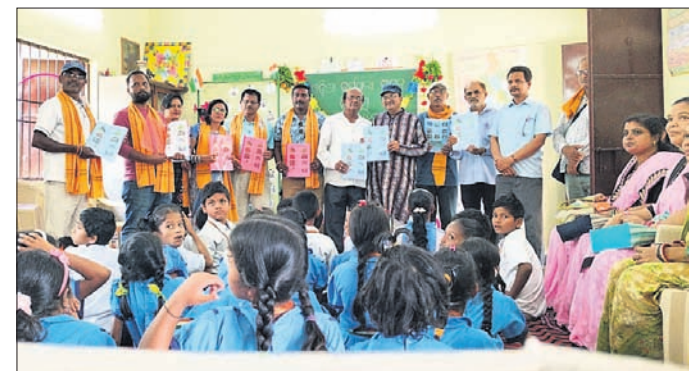
ଅତିଥିକ ସହ ଉପସ୍ଥିତ ସାମାଜିକ।