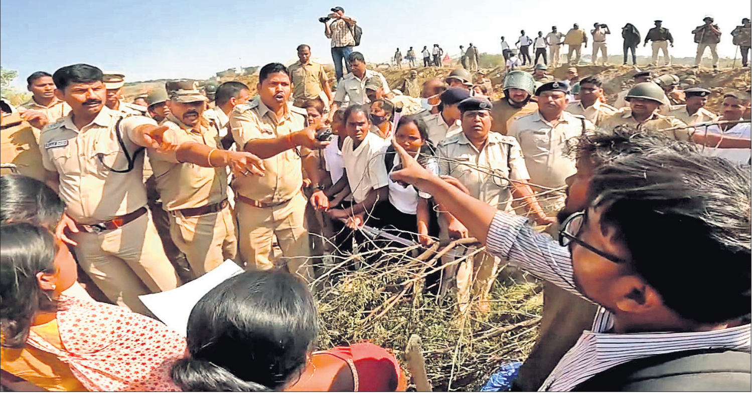
ରାୟଗଡ଼ା ଜିଲ୍ଲା ଶାଗବାରି ଗ୍ରାମରେ ମଜଲକବାର ପୋଲିସ୍ ଓ ଗ୍ରାମବାସୀ ମୁହାଁମୁହିଁ ହୋଇଛନ୍ତି।

ଅନୁମୋଦିତ କରାଯାଇଛି। ବର୍ଷା ସମୟରେ ୫୦୦-୬୦୦ କି.ମି. ବେଗରେ ପବନ ବୋହିବା ସମ୍ଭାବନା ଥିବାରୁ ଏହି ସମୟରେ ଆବଶ୍ୟକ ନ ପଡ଼ିଲେ ଘରୁ ନ ବାହାରିବାକୁ ପରାମର୍ଶ ଦିଆଯାଇଛି। ସେହିପରି ବାଲେଶ୍ୱର, ଭଦ୍ରକ, କେନ୍ଦ୍ରାପଡ଼ା, କଟକ, ଜଗତସିଂହପୁର, ପୁରୀ, ଖୋର୍ଦ୍ଧା, ନୟାଗଡ଼, ଗଞ୍ଜାମ, ଗଜପତି, ପୁଷ୍ପା-୪