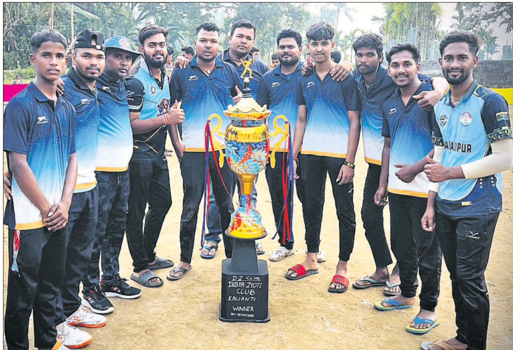
ଚୁମ୍ପି ସହ ଚାମ୍ପିୟନ ପଲାଇ ଦଳର ଖେଳାଳିମାନେ ।

ମାହାଙ୍ଗାର କାଳିଅଣ୍ଡିଠାରେ ଆୟୋଜିତ ବିଦ୍ୟାଳୟ କ୍ରିକେଟ୍ ପ୍ରତିଯୋଗିତାରେ ପଲାଇର ମା' ମଞ୍ଚକା କ୍ରିକେଟ୍ କ୍ଲବ୍ ଚାମ୍ପିୟନ ହୋଇଛି । ଫାଇନାଲରେ ପଲାଇ ଦଳ ମାହାଙ୍ଗାର ଧରଣିଆ କ୍ରିକେଟ୍ କ୍ଲବ୍‌କୁ ୮ ଉଇକେଟ୍‌ରେ ପରାସ୍ତ କରିଛି ।