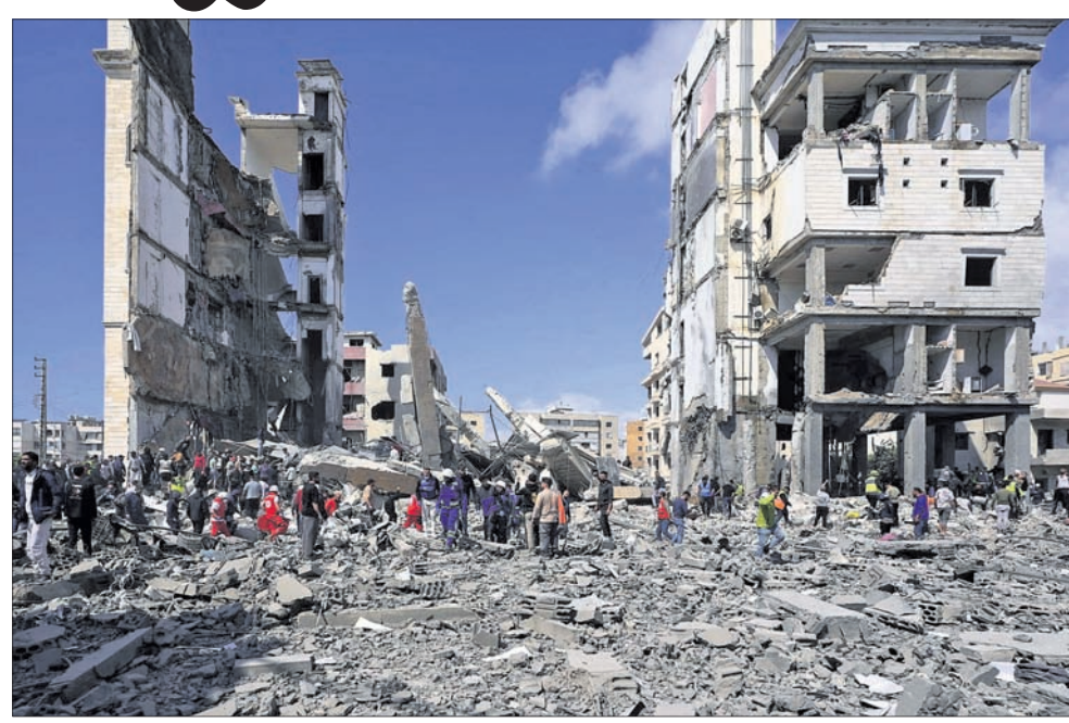
ଇରାନର ସାଇଦାରେ ଇସ୍ତ୍ରାଏଲ୍ ପକ୍ଷରୁ ବୁଧବାର ଏହାର ସ୍ତ୍ରାୟକ ପରେ ଭଗ୍ନାବଶେଷକୁ ଉଦ୍ଧାର କାର୍ଯ୍ୟ ଜାରି ରହିଛି ।

ପାକିସ୍ତାନ ମଧ୍ୟସ୍ତରରେ ଆମେରିକା ଓ ଇରାନ ମଧ୍ୟରେ ୨ ସପ୍ତାହର ଅସ୍ତ୍ରବିରତ ପାଇଁ ସହମତି ହୋଇଛି । ଆମେରିକା ରାଷ୍ଟ୍ରପତି ତୋନାଲ୍ଡ ଟ୍ରାଫ୍ଟ୍ ଇରାନକୁ 'ଷ୍ଟେଟ୍ ଅଫ୍ ହର୍ମ୍‌ଫୁଲ୍' ଖୋଲିବା ପାଇଁ ଶେଷ ସମୟ ସାମା ଦେଇଥିଲେ । ଏହି ସମୟ ସାମା ଶେଷ ହେବାର ୨ ଘଣ୍ଟା ପୂର୍ବରୁ ଏହି ଚୁକ୍ତି ହୋଇଛି । କିନ୍ତୁ ଏହି ଚୁକ୍ତିକୁ ନେଇ ଅନିଶ୍ଚିତତା ଦେଖାଦେଇଛି । ମୁଖ୍ୟ ବିବାଦଗୁଡ଼ିକର ସମାଧାନ ଏପର୍ଯ୍ୟନ୍ତ ହୋଇନାହିଁ । ଇରାନ ଏବଂ ଆମେରିକା ପରସ୍ପରର ସର୍ତ୍ତକୁ ନେଇ ଅଟକ ଅଛନ୍ତି । ଅସ୍ତ୍ରବିରତ ଘୋଷଣାର ମାତ୍ର କିଛି ଘଣ୍ଟା ପରେ ସଂଯୁକ୍ତ ଆରବ ଏମିରେଟ୍ସ (ୟୁଏଇ) ଉପରକୁ ଇରାନ ପକ୍ଷରୁ ମିସାଇଲ ମାଡ଼ ହୋଇଥିବା ଖବର ମିଳିଛି । ସେହିପରି କୁସର୍ ମଧ୍ୟ ଛୋଟ ଆକ୍ରମଣର ଜବାବ ଦେଉଥିବା କୁହାଯାଇଛି । ଇରାନ ଦାବି କରିଛି ଯେ, ଏହି ଚୁକ୍ତି ଅନୁସାରେ ସେ ଜଳପଥ 'ଷ୍ଟେଟ୍ ଅଫ୍ ହର୍ମ୍‌ଫୁଲ୍' ଦେଇ ଯାଉଥିବା କାହାଜଗୁଡ଼ିକ ଉପରେ ଶୁଳ୍କ ଲଗାଇବ । ଇରାନର ସରକାରୀ ଗଣମାଧ୍ୟମ ଏହାକୁ ନିଜର ବିକୟ ବୋଲି କହୁଛି । ସେମାନଙ୍କ କହିବା ଅନୁସାରେ, ଆମେରିକା ସମସ୍ତ କଟକଣା ହଟାଇବାକୁ ରାଜି ହୋଇଛି । ଅନୁସଂପରରେ ଲେବାନନ ଉପରେ ଆକ୍ରମଣ ବନ୍ଦ କରିବ ନାହିଁ ବୋଲି ଇସ୍ତ୍ରାଏଲ୍ ସିଧାସଳଖ ମନା କରିଦେଇଛି । ଚେହରାନର ରାଜପଥରେ ଇରାନ ଶାସକ ସମର୍ଥକମାନେ ଆମେରିକା ଏବଂ ଇସ୍ତ୍ରାଏଲ୍ ବିରୋଧରେ ନାରାବାଦି କରୁଛନ୍ତି । ସେଠାରେ ଲୋକମାନେ ଏହି ଚୁକ୍ତିକୁ ନେଇ ଅସନ୍ତୋଷ ପ୍ରକାଶ କରୁଛନ୍ତି, ଯାହା ଶାନ୍ତି ପ୍ରକ୍ରିୟା ପାଇଁ ଏକ ବଡ଼ ବ୍ୟାଧିକ ହୋଇଛି । କାଗଜପତ୍ରରେ ଯୁଦ୍ଧ ବନ୍ଦ ହେବାର ଘୋଷଣା ହୋଇଥିଲେ ମଧ୍ୟ ଏହାର ସ୍ତାୟିତ୍ୱ ନେଇ ପ୍ରଶ୍ନବାଚୀ ସୃଷ୍ଟି ହୋଇଛି ।