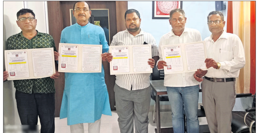
ପ୍ରତିଯୋଗିତାର କାର୍ଯ୍ୟସୂଚୀ ଉନ୍ମୋଚନ ଅବସରରେ ଉପସ୍ଥିତ ଅତିଥିବୃନ୍ଦ।