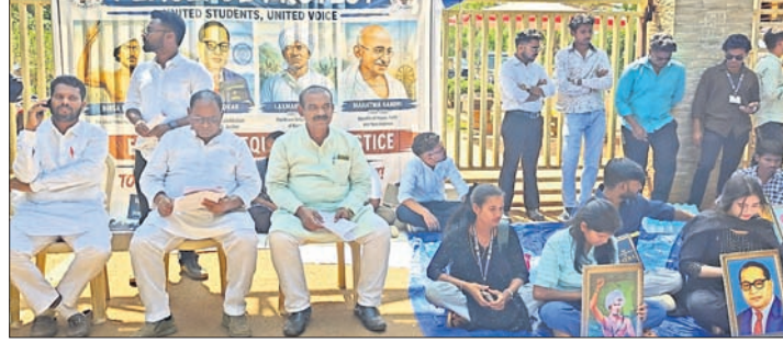
ବିଶ୍ୱବିଦ୍ୟାଳୟ ଛାତ୍ରାଛାତ୍ରୀ ଓ କଂଗ୍ରେସ ପକ୍ଷରୁ ଶାନ୍ତିପୂର୍ଣ୍ଣ ପ୍ରତିବାଦ କରାଯାଇଛି।

ରେଜିଷ୍ଟ୍ରେଟର ମନମୁଖୀ କାର୍ଯ୍ୟକଳାପ ବନ୍ଦ କରିବାକୁ ସେମାନେ ଅତି ବସିଥିଲେ। ହଷ୍ଟେଲରେ ପାଣି ସମସ୍ୟା, ଖାଇବା, ଲାଲ୍‌ବେଟା, ଷ୍ଟାଇପେଣ୍ଡ, ଅଧ୍ୟାପକ