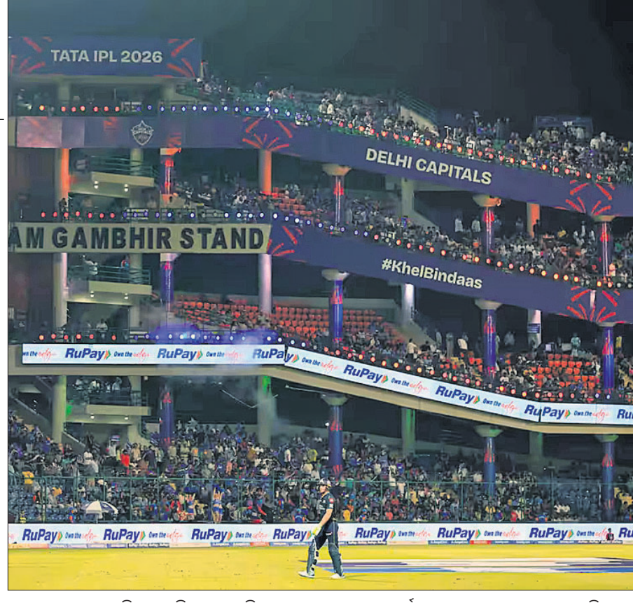
ଗୁଜରାଟ ଟାଇଟନ୍ସ-ଦିଲ୍ଲୀ କ୍ୟାପିଟାଲ୍ସ ଆଇପିଏଲ୍ ମ୍ୟାଚ୍ ଅବସରରେ ଦର୍ଶକରେ ଭରା ଅଟୁଣା ଜେଟ୍‌କା। ସ୍ୱାତିୟମ୍।