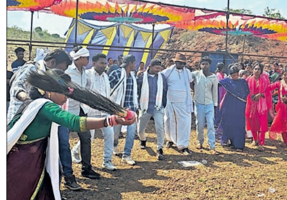
ଚଇତ ପରବରେ ଗ୍ଳାନାୟ ବାସିନ୍ଦା ନୃତ୍ୟ ପରିବେଷଣ କରୁଛନ୍ତି।

ସୁନାବେଟା/ସେମିଲିଗୁଡ଼ା, ୮୪ (କୃଷିବାସ ପ୍ରଧାନ/ବାସୁଦେବ ବରାଡ଼)