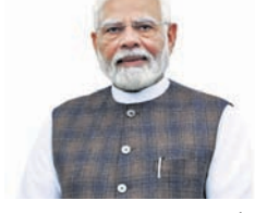
ନରେନ୍ଦ୍ର ମୋଦୀ ପ୍ରଧାନମନ୍ତ୍ରୀ