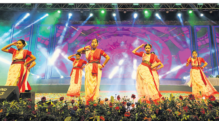
ଲୋକ ମହୋତ୍ସବର ଉଦ୍‌ଯାପନା ସମ୍ପାଦନା ଅତିଥିମାନେ ଉଦ୍‌ଯାପନ କରୁଛନ୍ତି।