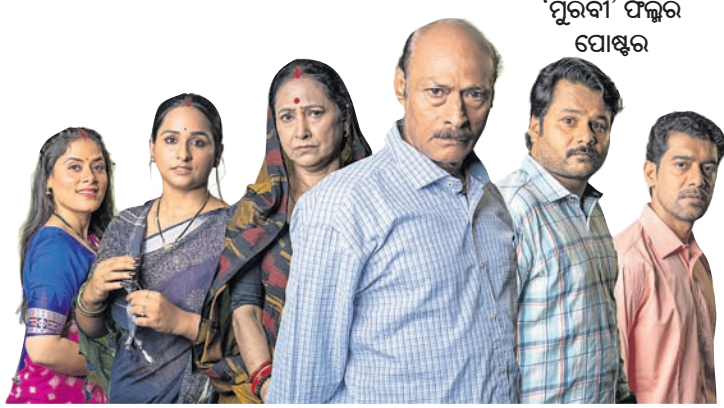
‘ପୁରବା’ ଫିଲ୍ମର ପୋଷ୍ଟର