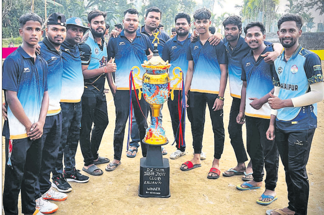
ଚୁପ୍ ସହ ଚାମ୍ପିୟନ ପଲାଇ ଦଳର ଖେଳାଳିମାନେ।