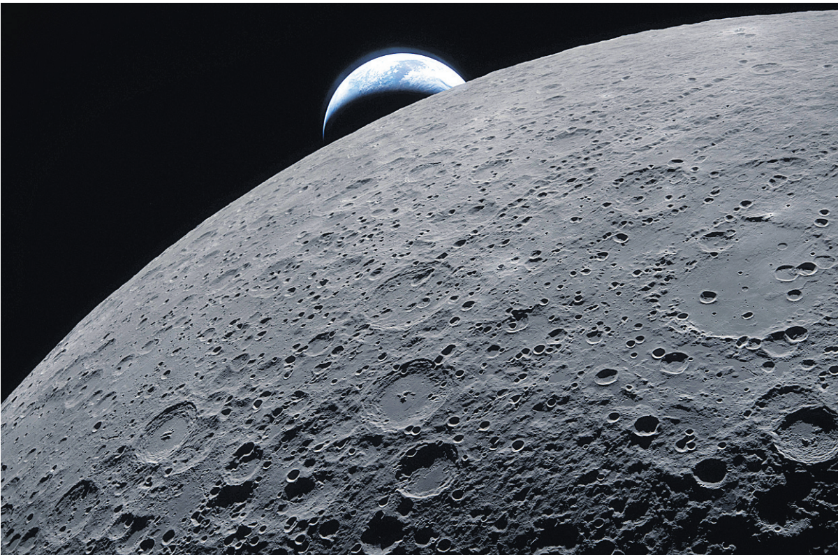
ଆର୍ଟେମିସ୍-୨ ମିଶନର ମହାକାଶଚାରୀମାନେ ଚନ୍ଦ୍ର ପରିକ୍ରମା କରୁଥିବା ସମୟରେ ଚନ୍ଦ୍ର ପଛରେ ପୃଥିବୀ ଅପ୍ତ ହେବା ଦୃଶ୍ୟକୁ ଉଦ୍ଭାସନ କରୁଛନ୍ତି । ଆମେରିକାର ମହାକାଶ ଗବେଷଣା ସଂସ୍ଥା 'ନାସା' ଦ୍ୱାରା ଏହି ଚିତ୍ର ଜାରି କରାଯାଇଛି ।