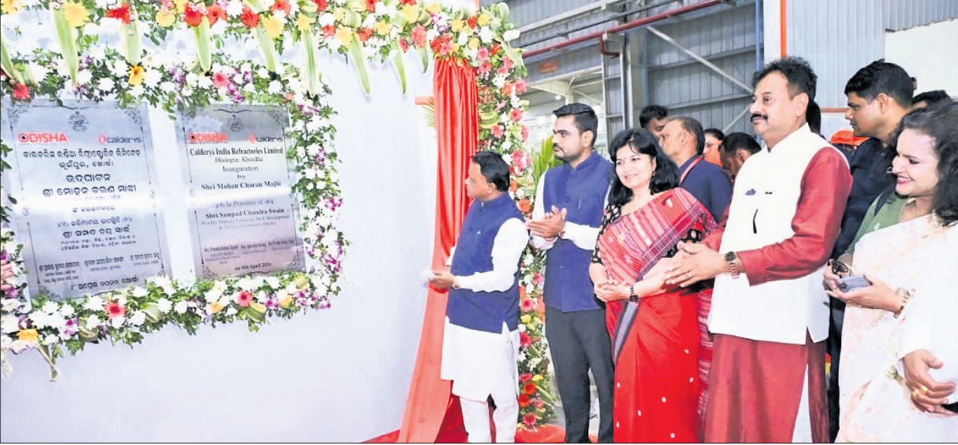
ଖୋର୍ଦ୍ଧା ଜିଲ୍ଲା ବେଗୁନିଆ ନିକଟ ଭୂଇଁପୁରଠାରେ ଏକ ପ୍ରକଳ୍ପକୁ ମୁଖ୍ୟମନ୍ତ୍ରୀ ମୋହନ ଚରଣ ମାଝୀ ଉଦ୍ଘାଟନ କରୁଛନ୍ତି। ନିକଟରେ ଅଛନ୍ତି ଶିଳ୍ପମନ୍ତ୍ରୀ ସମ୍ପଦ ଚନ୍ଦ୍ର ସାହି, ଭୁବନେଶ୍ୱର ଏମ୍ପି ଅପରାଜିତା ଷଡ଼ଙ୍ଗୀ, ଖୋର୍ଦ୍ଧା ବିଧାୟକ ପ୍ରଶାନ୍ତ ଜଗଦେବ, ମୁଖ୍ୟ ଶାସନ ସଚିବ ଅନୁ ଗର୍ଗ ପ୍ରମୁଖ।

ଶିଳ୍ପ ଅଭିବୃଦ୍ଧି ଓ ସମାଜିକ କାର୍ଯ୍ୟକ୍ରମର ପ୍ରତି ରାଜ୍ୟର ଦୃଢ଼ ପ୍ରତିବଦ୍ଧତାକୁ ଗୁରୁତ୍ୱ ଦେଇ ଓଡ଼ିଶା ସରକାର ଆଉ ଏକ ମାଇଲଖୁଣ୍ଟି ସ୍ଥାପନ କରିଛନ୍ତି। ମୁଖ୍ୟମନ୍ତ୍ରୀ ମୋହନ ଚରଣ ମାଝୀ କୁସୁବାର ଖୋର୍ଦ୍ଧା ଜିଲ୍ଲା ବେଗୁନିଆ ରୁକ୍ ଅନ୍ତର୍ଗତ ଭୂଇଁପୁରଠାରେ ୬ଟି ଜିଲ୍ଲା ପାଇଁ ୪୦,୮୧୧ କୋଟି ଟଙ୍କା ନିବେଶରେ ୩୬ଟି ଶିଳ୍ପ ପ୍ରକଳ୍ପର ଶିଳାନ୍ୟାସ ଓ ଶୁଭାରମ୍ଭ କରିଛନ୍ତି। ଏଥିମଧ୍ୟରୁ ୨୫ଟି ପ୍ରକଳ୍ପର ଭିତ୍ତିପ୍ରସ୍ତର ସ୍ଥାପନ କରାଯାଇଥିବାବେଳେ ୧୧ଟି ପ୍ରକଳ୍ପର ଉଦ୍ଘାଟନ କରାଯାଇଛି। ଏହି ଅବସରରେ ମୁଖ୍ୟମନ୍ତ୍ରୀ କହିଛନ୍ତି, ଓଡ଼ିଶା ଏବେ ସମୃଦ୍ଧିର ସ୍ୱର୍ଣ୍ଣ ଅନୁଭବ କରୁଛି। ୩୬ଟି ପ୍ରକଳ୍ପର ଶିଳାନ୍ୟାସ ଓ ଶୁଭାରମ୍ଭ ଦ୍ୱାରା ୫୯,୦୦୦ରୁ ଅଧିକ ନିଯୁକ୍ତି ସୃଷ୍ଟି ହେବ। ଏହି ପ୍ରକଳ୍ପଗୁଡ଼ିକ ମଧ୍ୟରେ ଗ୍ରାମ୍ ଏନିଫ୍ ଉପକରଣ, ଧାତୁ ଓ ଡାଉନଷ୍ଟ୍ରି,