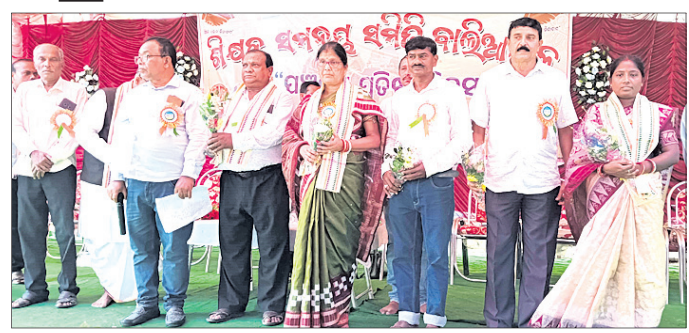
ପ୍ରତିଷ୍ଠା ଦିବସରେ ସମ୍ମାନିତ ଅବସରପ୍ରାପ୍ତ ଶିକ୍ଷକ।