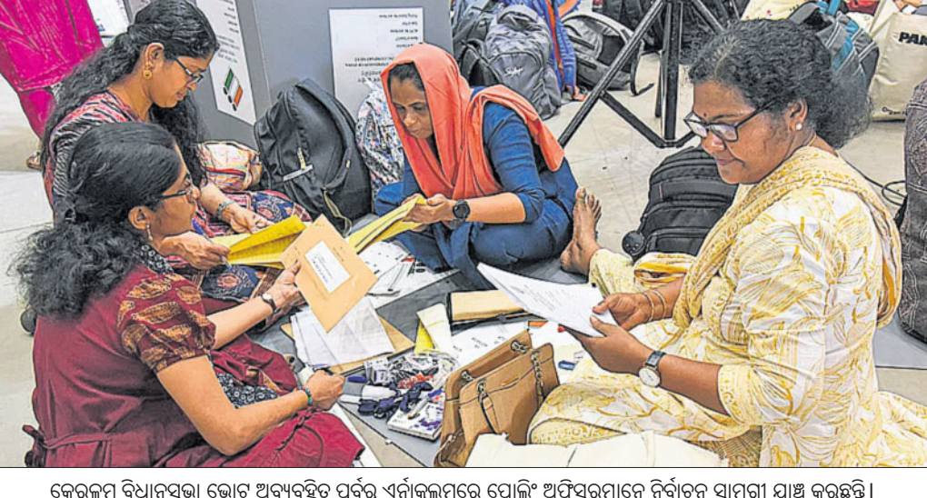
କେରଳ ବିଧାନସଭା ଭୋଟ ଅଧିକାରୀଙ୍କ ପୂର୍ବରୁ ନିର୍ବାଚନ ପ୍ରସ୍ତୁତି ପାଇଁ ଅଧିକାରୀଙ୍କ ନିର୍ବାଚନ ସାମଗ୍ରୀ ଯାଞ୍ଚ କରୁଛନ୍ତି।

କେରଳ, ଆସାମ ଓ ପଞ୍ଜାବର ମୋଟ ୨୯୭ ଆସନରେ ଗୁରୁବାର ଗୋଟିଏ ପର୍ଯ୍ୟାୟରେ ବିଧାନସଭା ନିର୍ବାଚନ ଅନୁଷ୍ଠିତ ହେବ। ସେଥିରୁ କେରଳର ୧୪୦, ଆସାମ ୧୨୭ ଓ ପଞ୍ଜାବର ୩୦ ଆସନରେ ଭୋଟ ଗ୍ରହଣ ପାଇଁ ପୋଲିସ ପ୍ରଶାସନ ଓ ନିର୍ବାଚନ କମିଶନ (ଇସିଏସ୍)ଙ୍କ ପକ୍ଷରୁ ପ୍ରସ୍ତୁତି ଶେଷ ହୋଇଛି। ଏହା ପୂର୍ବରୁ କେରଳ, ଆସାମ ଓ ପଞ୍ଜାବରେ ମଜଲିସ୍ ନିର୍ବାଚନ ପ୍ରଚାର ଶେଷ ହୋଇଥିଲା। କେରଳରେ ମୁଖ୍ୟମନ୍ତ୍ରୀ ପିନାରୟୀ ବିଜୟନଙ୍କ ନେତୃତ୍ୱାଧୀନ ବାମ ଗଣତାନ୍ତ୍ରିକ ସାମୁଦ୍ରିକ (ଏଲଡିଏସ୍) ଚୁଡ଼ା ଥର ପାଇଁ କ୍ଷମତା ଦଖଲ ଉଦ୍ୟମ ଚଳାଇଛି। ଏକାଧିକ ସମ୍ପର୍କୀତ ପୂର୍ବରୁ କୌଣସି ମେଣ୍ଟକୁ ମିଳି ନ ଥିବାରୁ ଏଲଡିଏସ୍ ଏଥର ପୁନଃ ବିଜୟ ସୁନିଶ୍ଚିତ କରିବା ପାଇଁ ଧୂଆଁଧାର ପ୍ରଚାର କରିଥିଲା। ଏହାର ଘୋରାନ ରହିଥିଲା, ଏଲଡିଏସ୍ କୌଣସି ବିକଳ୍ପ ନାହିଁ। ଅନ୍ୟପକ୍ଷେ ଭାଜପା ଅଭ୍ୟୁଦୟ ଉଭୟ ଏଲଡିଏସ୍ ଏବଂ କଂଗ୍ରେସ ନେତୃତ୍ୱାଧୀନ ଏମ୍‌ଏଲ୍ ଗଣତାନ୍ତ୍ରିକ ସାମୁଦ୍ରିକ (ଏମ୍‌ଏଲ୍) ଗୁଡ଼ିକ ଯୁଦ୍ଧ କରିପାରେ ବୋଲି କୁହାଯାଉଛି। କାରଣ ୨୦୨୪