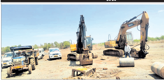
ମାର୍ଚ୍ଚ ୨୦ ଓ ୨୧ ତାରିଖରେ ହୋଇଥିବା ଯାଞ୍ଚ।

ଏସ୍ପିପିଓଙ୍କ ନେତୃତ୍ୱରେ କରାଯାଇଥିବା ଏହି ଯାଞ୍ଚ ଚମ୍ପର ନୀରବତା ସାଧାରଣରେ ସନ୍ତୋଷ ସୃଷ୍ଟି କରିଛି। କିଛି ମାସର ବ୍ୟବଧାନରେ କରାଯାଉଥିବା ଏହି ଚରାଉ ନେଇ ବହୁତ କିଛି ଆଶା କରିଥିଲେ। ହେଲେ ପାହାଡ଼ ସଂଲଗ୍ନ ବିଭିନ୍ନ ଗ୍ରାମର ଅଧିବାସୀମାନେ କହିଛନ୍ତି। ଏସ୍ପିପିଓଙ୍କ ନେତୃତ୍ୱରେ କରାଯାଇଥିବା ୨୯ଦିନୀ ବ୍ୟବଧାନରେ କରାଯାଉଥିବା ଏହି ଚରାଉ ନେଇ ବହୁତ କିଛି ଆଶା କରିଥିଲେ। ହେଲେ