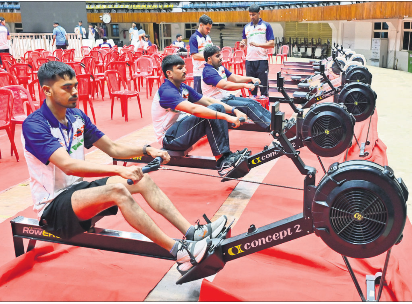
କଟକର ଜବାହରଲାଲ ନେହେରୁ ଇନ୍‌ଡୋର ସ୍ପୋର୍ଟସ୍ ମେଡିୟମରେ ଆରମ୍ଭ ହେବାକୁ ଯାଉଥିବା ଭିନ୍ନ ଧରଣର ସର୍ବଭାରତୀୟ ଗୋଲ୍ଡ ଚାମ୍ପିୟନଶିପ୍ ପୂର୍ବରୁ ପ୍ରତିଯୋଗୀଙ୍କ ଅଭ୍ୟାସ ।