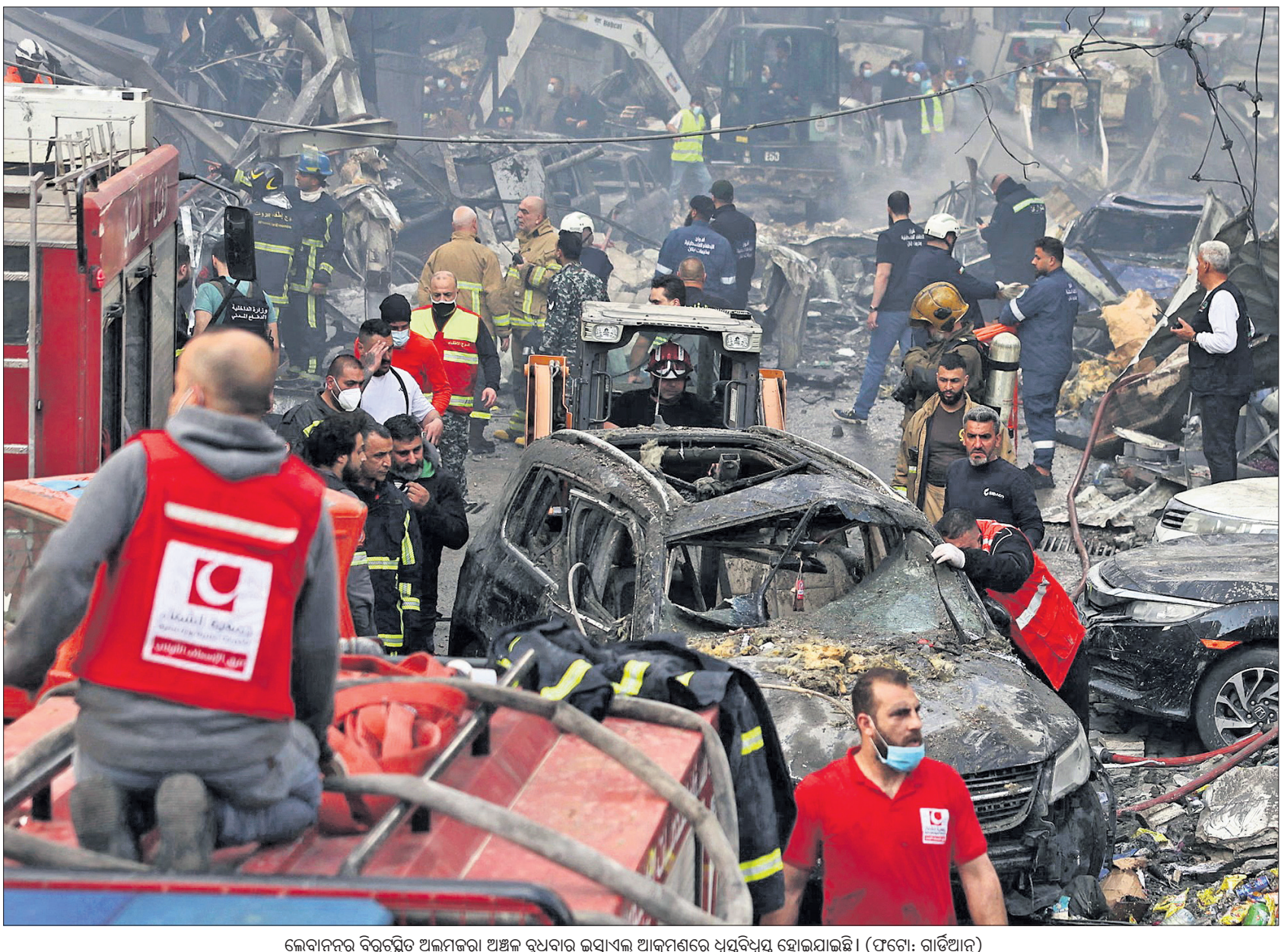
ଲେବାନନ୍‌ର ବିରୁଦ୍ଧେ ଅଲମ୍ପିକରା ଅଞ୍ଚଳ ରୁଧିରା ଲସ୍ତାଏଲ୍ ଆକ୍ରମଣରେ ଧସିଯାଇଥିବା ଯାନାଓଟୋ