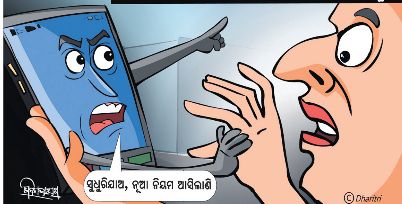
ସୁଧୁରିଯାଅ, ନୂଆ ନିୟମ ଆସିଲାଣି