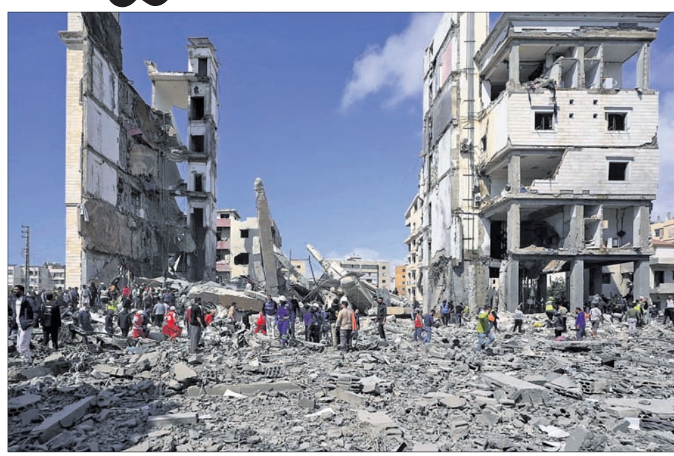
ଇରାନର ସାଇବାରେ ଇସ୍ରାଏଲ୍ ପକ୍ଷରୁ ବୁଧବାର ଏହାର ସ୍ତୂଳକ ପରେ ଉଗ୍ରାବଶେଷକୁ ଉଦ୍ଧାର କାର୍ଯ୍ୟ ଜାରି ରହିଛି ।

ପାକିସ୍ତାନ ମଧ୍ୟସ୍ତରରେ ଆମେରିକା ଓ ଇରାନ ମଧ୍ୟରେ ୨ ସପ୍ତାହର ଅସ୍ତ୍ରବିରତି ପାଇଁ ସହମତି ହୋଇଛି । ଆମେରିକା ରାଷ୍ଟ୍ରପତି ତୋନାଲ୍ଡ ଟ୍ରାମ୍ ଇରାନକୁ 'ଷ୍ଟେଟ୍ ଅଫ୍ ହର୍ମ୍‌ଲେସ୍' ଖୋଲିବା ପାଇଁ ଶେଷ ସମୟ ସାମା ଦେଇଥିଲେ । ଏହି ସମୟ ସାମା ଶେଷ ହେବାର ୨ ଘଣ୍ଟା ପୂର୍ବରୁ ଏହି ଚୁକ୍ତି ହୋଇଛି । କିନ୍ତୁ ଏହି ଚୁକ୍ତିକୁ ନେଇ ଅନିଶ୍ଚିତତା ଦେଖାଦେଇଛି । ମୁଖ୍ୟ ବିବାଦଗୁଡ଼ିକର ସମାଧାନ ଏପର୍ଯ୍ୟନ୍ତ ହୋଇନାହିଁ । ଇରାନ ଏବଂ ଆମେରିକା ପରସ୍ପର ସର୍ତ୍ତକୁ ନେଇ ଅଟକ ଅଛନ୍ତି । ଅସ୍ତ୍ରବିରତି ଘୋଷଣା ମାତ୍ର କିଛି ଘଣ୍ଟା ପରେ ସଂଯୁକ୍ତ ଆରବ ଏମିରେଟ୍ସ (ୟୁଏଇ) ଉପରକୁ ଇରାନ ପକ୍ଷରୁ ମିସାଲ ମାଡ଼ ହୋଇଥିବା ଖବର ମିଳିଛି । ସେହିପରି କୁସର୍ ମଧ୍ୟ ଛୋଟ ଆକ୍ରମଣର ଜବାବ ଦେଉଥିବା କୁହାଯାଇଛି । ଇରାନ ଦାବି କରିଛି ଯେ, ଏହି ଚୁକ୍ତି ଅନୁସାରେ ସେ ଜଳପଥ 'ଷ୍ଟେଟ୍ ଅଫ୍ ହର୍ମ୍‌ଲେସ୍' ଦେଇ ଯାଉଥିବା କାହାଜଗୁଡ଼ିକ ଉପରେ ଶୁଳ୍କ ଲଗାଇବ । ଇରାନର ସରକାରୀ ଗଣମାଧ୍ୟମ ଏହାକୁ ନିଜର ବିକୟ ବୋଲି କହୁଛି । ସେମାନଙ୍କ କହିବା ଅନୁସାରେ, ଆମେରିକା ସମସ୍ତ କଟକଣା ହଟାଇବାକୁ ରାଜି ହୋଇଛି । ଅନୁପକ୍ଷରେ ଲେବାନନ ଉପରେ ଆକ୍ରମଣ ବନ୍ଦ କରିବ ନାହିଁ ବୋଲି ଇସ୍ରାଏଲ୍ ସିଧାସଳଖ ମନା କରିଦେଇଛି । ଚେହରାନର ରାଜପଥରେ ଇରାନ ଶାସକ ସମର୍ଥକମାନେ ଆମେରିକା ଏବଂ ଇସ୍ରାଏଲ୍ ବିରୋଧରେ ନାରାବାଦି କରୁଛନ୍ତି । ସେଠାରେ ଲୋକମାନେ ଏହି ଚୁକ୍ତିକୁ ନେଇ ଅସନ୍ତୋଷ ପ୍ରକାଶ କରୁଛନ୍ତି, ଯାହା ଶାନ୍ତି ପ୍ରକ୍ରିୟା ପାଇଁ ଏକ ବଡ଼ ବ୍ୟାଧିକ ହୋଇଛି । କାଗଜପତ୍ରରେ ଯୁଦ୍ଧ ବନ୍ଦ ହେବାର ଘୋଷଣା ହୋଇଥିଲେ ମଧ୍ୟ ଏହାର ସ୍ଥାୟିତ୍ୱ ନେଇ ପ୍ରଶ୍ନବାଚୀ ସୃଷ୍ଟି ହୋଇଛି ।