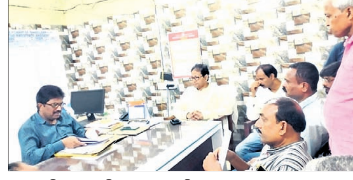
ତହସିଲଦାରଙ୍କୁ ଦାବିପତ୍ର ପ୍ରଦାନ କରୁଛନ୍ତି ବୁଲ୍ ଦଳର ନେତା ଓ ଗ୍ରାମବାସୀ।