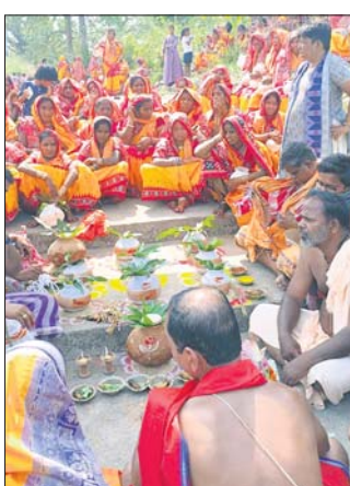
ତିକିଟି, ୮୪(ପ୍ରକାଶ ଚନ୍ଦ୍ର ସାହୁ)

ତିକିଟି ରୁକ୍ମ ଅନ୍ତର୍ଗତ ନୂଆପଡା ଗ୍ରାମସ୍ଥିତ ବି. ନୂଆପଡାଠାରେ ପୂଜା ପାଇ ଆୟୁର୍ବୀ ମା' ଅନୁପୂର୍ଣ୍ଣା ଓ