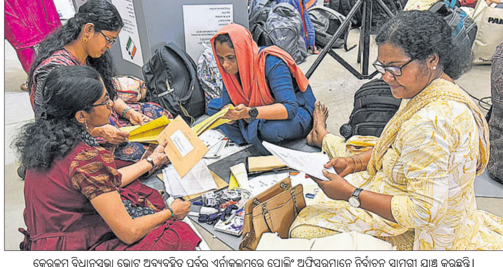
କେରଳ ବିଧାନସଭା ଭୋଟ ଅଧିକାରୀଙ୍କ ପୂର୍ବରୁ ସର୍ବାନୁକୂଳରେ ପୋଲିଂ ଅଧିକାରୀଙ୍କ ନିର୍ବାଚନ ସାମଗ୍ରୀ ଯାଞ୍ଚ କରୁଛନ୍ତି।

କେରଳ, ଆସାମ ଓ ପଶ୍ଚିମବଙ୍ଗ ମୋଟ ୨୯୭ ଆସନରେ ଗୁରୁବାର ଗୋଟିଏ ପର୍ଯ୍ୟାୟରେ ବିଧାନସଭା ନିର୍ବାଚନ ଅନୁଷ୍ଠିତ ହେବ। ସେଥିରୁ କେରଳର ୧୪୦, ଆସାମ ୧୨୭ ଓ ପଶ୍ଚିମବଙ୍ଗର ୩୦ ଆସନରେ ଭୋଟ ଗ୍ରହଣ ପାଇଁ ପୋଲିସ ପ୍ରଶାସନ ଓ ନିର୍ବାଚନ କମିଶନ (ଇସି)ଙ୍କ ପକ୍ଷରୁ ସବୁ ପ୍ରସ୍ତୁତି ଶେଷ ହୋଇଛି। ଏହା ପୂର୍ବରୁ କେରଳ, ଆସାମ ଓ ପଶ୍ଚିମବଙ୍ଗରେ ମଙ୍ଗଳବାର ନିର୍ବାଚନ ପ୍ରଚାର ଶେଷ ହୋଇଥିଲା। କେରଳରେ ପୁଷ୍ପମନ୍ତ୍ରୀ ପିନାରୟୀ ବିଜୟନଙ୍କ ନେତୃତ୍ୱାଧୀନ ବାମ ଗଣତାନ୍ତ୍ରିକ ସାମୁଦ୍ରିକ (ଏଲଡିଏସ୍) ଚୁଡ଼ା ଥର ପାଇଁ କ୍ଷମତା ଦଖଲ ଉଦ୍ୟମ ଚଳାଇଛି। ଏକାଧିକ ସମ୍ପର୍କୀତ ପୂର୍ବରୁ କୌଣସି ମେଣ୍ଟକୁ ମିଳି ନ ଥିବାରୁ ଏଲଡିଏସ୍ ଏଥର ପୁନଃ ବିଜୟ ସୁନିଶ୍ଚିତ କରିବା ପାଇଁ ଧୂଆଁଧାର ପ୍ରଚାର କରିଥିଲା। ଏହାର ଘୋରାନ ରହିଥିଲା, ଏଲଡିଏସ୍‌ର କୌଣସି ବିକଳ୍ପ ନାହିଁ। ଅନ୍ୟପକ୍ଷେ ଭାଜପା ଅଭ୍ୟୁଦୟ ଉଭୟ ଏଲଡିଏସ୍ ଏବଂ କଂଗ୍ରେସ ନେତୃତ୍ୱାଧୀନ ଏମ୍‌ଏଲ୍ ଗଣତାନ୍ତ୍ରିକ ସାମୁଦ୍ରିକ (ଏମ୍‌ଏଲ୍ ଡିଏମ୍) ଗୁଡ଼ିକ ଯୁଦ୍ଧ କରିପାରେ ବୋଲି କୁହାଯାଉଛି। କାରଣ ୨୦୨୪