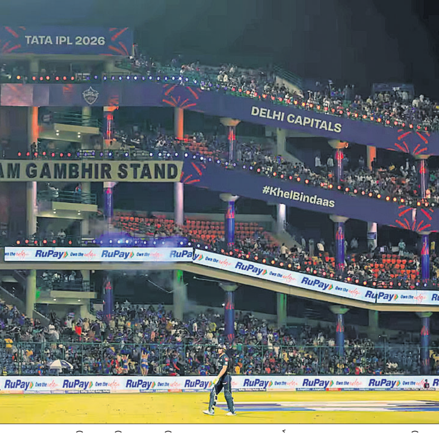
ଗୁଜରାଟ ଚାର୍ଜ୍-ଦିଲ୍ଲୀ କ୍ୟାପିଟାଲ୍ସ ଆଇପିଏଲ୍ ମ୍ୟାଚ୍ ଅବସରରେ ଦର୍ଶକରେ ଭରା ଅଭୁଣ୍ଡା ଜେଟ୍‌କା ଷ୍ଟାଡ଼ିୟମ୍

ପ୍ରତିପକ୍ଷ ଦିଲ୍ଲୀ ଆଗରେ ୨୧୧ ରନର ଚାର୍ଜ୍ ଛିଡ଼ା କରିଛି। ଦିଲ୍ଲୀ ଅଧିନାୟକ ଅକ୍ଷୟ ପଟେଲ ମେଗୁଆ ପାଗକୁ ଦୁଷ୍ଟିରେ ରଖି ଟେ ଛିଟି ପ୍ରଥମେ ବୋଲିଂ କରିବାକୁ ନିଷ୍ପତ୍ତି ନେଇଥିଲେ। ପ୍ରଥମେ ବ୍ୟାଟିଂ କରିଥିବା ଗୁଜରାଟ ଖୁବ୍ ଶୀଘ୍ରରେ ସାଇ ସୁଦର୍ଶନ (୧୨ ରନ, ୨ ଚୌକା)ଙ୍କ