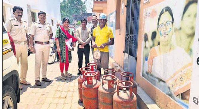
ଆସିକା, ୮୪(ପୁରୁଷୋତ୍ତମ ନାଥ ସାହୁ):

ରଞ୍ଜନ ଗ୍ୟାସ୍ କଳାବଜାର ରୋକିବା ପାଇଁ ବୁଧବାର ଆସିକା ପୌର ପରିଷଦର ବଜାର ସାହିରେ ପ୍ରଶାସନ ପକ୍ଷରୁ ଧରାପତ୍ର କରାଯାଇଥିଲା।