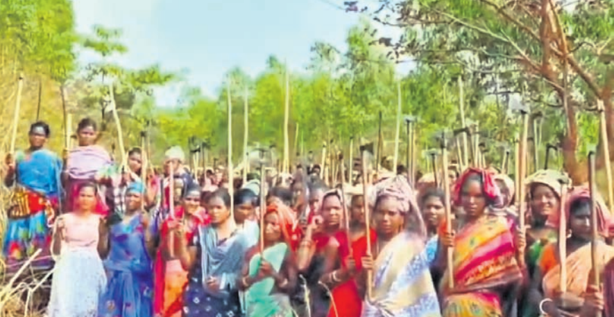
ରାୟଗଡ଼ା ଜିଲ୍ଲା କାଶୀପୁର ବ୍ଲକ୍ ସିଦ୍ଧିପାଳି ପାହାଡ଼ର ସୁରକ୍ଷା ପାଇଁ ରୁଧିବାର ଆଦିବାସୀ ମହିଳାମାନେ ପାରମ୍ପରିକ ଅସ୍ତ୍ରଶସ୍ତ୍ର ସହିତ ଏକାଠି ହୋଇଛନ୍ତି ।

ଦେବାଡ଼ ପାଇଁ ଲୋକଙ୍କୁ ଦମନ ଘଟଣା ମରିଚୁ ପଛେ ଦେବାଡ଼କୁ ସିଦ୍ଧିପାଳି ପାହାଡ଼ ଦେଖୁନାହିଁ : ଗ୍ରାମବାସୀ