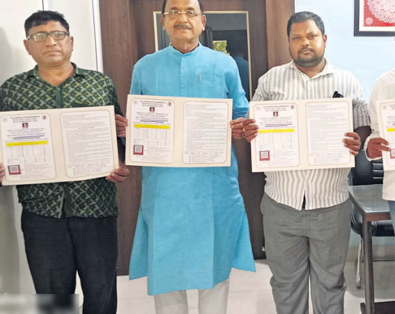
ପ୍ରତିଯୋଗିତାର କାର୍ଯ୍ୟସୂଚୀ ଉନ୍ମୋଚନ ଅବସରରେ ଉପସ୍ଥିତ ଅତିଥିବୃନ୍ଦ