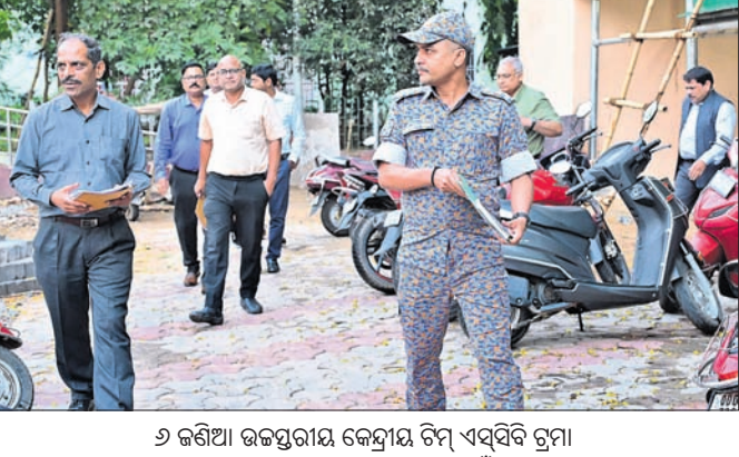
୬ ଜଣିଆ ଉଚ୍ଚସ୍ତରୀୟ କେନ୍ଦ୍ରୀୟ ଟିମ୍ ଏସ୍‌ସିବି ଟ୍ରମ୍ପ ଆଇସିଡିଏ ଅଗ୍ନିକାଣ୍ଡ ଘଟଣାର ତଦନ୍ତ ପାଇଁ ଯାଉଛନ୍ତି।

କଟକ, ୮/୪ (ଶିଳ୍ପ ପ୍ରସାରକ) କରିବା ପରେ ଟିମ୍ ଜଳି ଯାଇଥିବା ଟ୍ରମ୍ପ ଆଇସିଡିଏରେ ପ୍ରାୟ ଅଧାଘଣ୍ଟା ଯାଞ୍ଚ କରିଥିଲା। ଯାଞ୍ଚ ପରେ ଟିମ୍ ଫେରି ଯାଇଥିବା ବେଳେ କେନ୍ଦ୍ର ସରକାରଙ୍କୁ ସମ୍ବନ୍ଧରେ ସୂଚନା ଦିଆଯାଇଥିଲା। ଟିମ୍ ମେଡିକାଲ କଲେଜ ଅଧ୍ୟକ୍ଷଙ୍କ କାର୍ଯ୍ୟାଳୟରେ ଟିମ୍ ପ୍ରାୟ ୨ ଘଣ୍ଟା ଘଟଣା ସମୟରେ ଥିବା ଅଧିକାରୀଙ୍କୁ ପଚାରିବାରୁ କେରଳ ପରେ ଟିମ୍ ଜଳି ଯାଇଥିବା ଟ୍ରମ୍ପ ଆଇସିଡିଏରେ ପ୍ରାୟ ଅଧାଘଣ୍ଟା ଯାଞ୍ଚ କରିଥିଲା। ଯାଞ୍ଚ ପରେ ଟିମ୍ ଫେରି ଯାଇଥିବା ବେଳେ କେନ୍ଦ୍ର ସରକାରଙ୍କୁ ସମ୍ବନ୍ଧରେ ସୂଚନା ଦିଆଯାଇଥିଲା। ଟିମ୍ ମେଡିକାଲ କଲେଜ ଅଧ୍ୟକ୍ଷଙ୍କ କାର୍ଯ୍ୟାଳୟରେ ଟିମ୍ ପ୍ରାୟ ୨ ଘଣ୍ଟା ଘଟଣା ସମୟରେ ଥିବା ଅଧିକାରୀଙ୍କୁ ପଚାରିବାରୁ