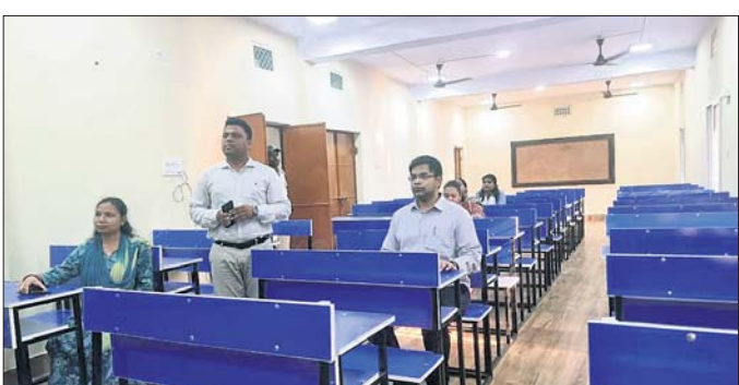
ଜିଲ୍ଲାପାଳ ଓ ଅନ୍ୟ ଅଧିକାରୀମାନେ ଲକ୍ଷ୍ୟ ନିକେତନ ପ୍ରଶିକ୍ଷଣ କେନ୍ଦ୍ର ପରିଦର୍ଶନ କରୁଛନ୍ତି।

ଗଞ୍ଜାମ ଜିଲ୍ଲା ପ୍ରଶାସନ ଜିଲ୍ଲାରେ ଆଇଏସଏ ଓ ଓଏଏସ, ଆଇପିଏସ ଭଳି ପ୍ରଶାସନିକ ଅଧିକାରୀଙ୍କୁ ପ୍ରଶିକ୍ଷଣ ଦିଆଯାଇଛି।