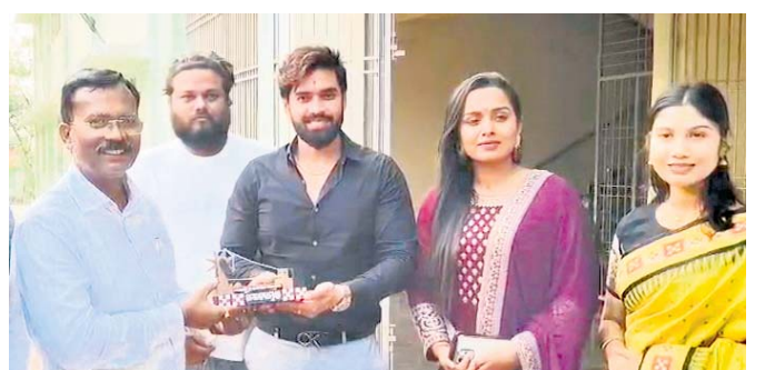
ପ୍ରଯୁକ୍ତ ହୋଇଛି। କୋଭିଡ ଲକଡାଉନ ସମୟରେ ଲୁଚା ବୁକାକାର ପରିବାରଙ୍କ ଜୀବନର ସଂସ୍କାର କାହାଣୀକୁ ନେଇ ସିନେମା ଗଠିତ ହୋଇଛି।